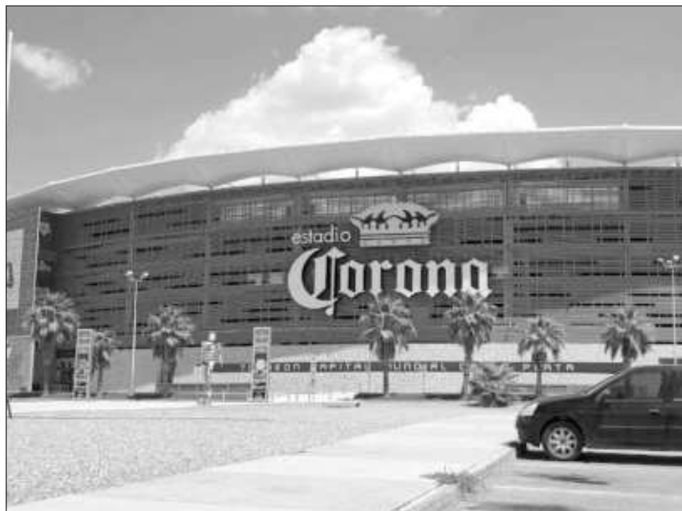
▲ El estadio TSM de Torreón, casa de Santos Laguna.

“Lamentamos profundamente que una aficionada nuestra haya fallecido y varios aficionados hayan