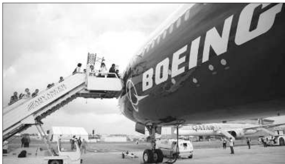
▲ La FAA dijo que los aviones modelo 737-900ER han registrado 3,9 millones de vuelos sin ningún problema conocido relacionado con los tapones de las puertas.

La FAA emitió una alerta de seguridad el domingo por la noche. Tan pronto como sea posible, las aerolíneas deben inspeccionar visualmente cuatro lugares donde un perno, una tuerca y un pasador su-