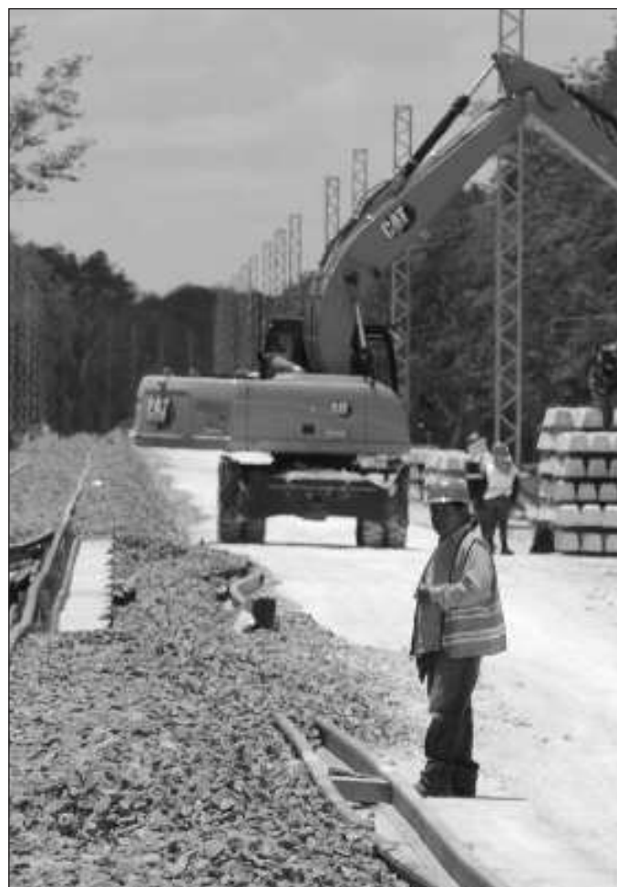
▲ Las obras de construcción tienen fecha de entrega y entrada en funcionamiento, por lo que es previsible que la aportación de la península al valor de esta producción disminuirá en los próximos meses.

Ahora, el valor de la construcción en la península también está aumentando por las proyecciones del Tren Maya en cuanto a movimiento de pasajeros y de carga. Quintana Roo prevé la llegada de más turistas por el nuevo aeropuerto en Tulum, y la comunicación con la zona hotelera de Cancún se