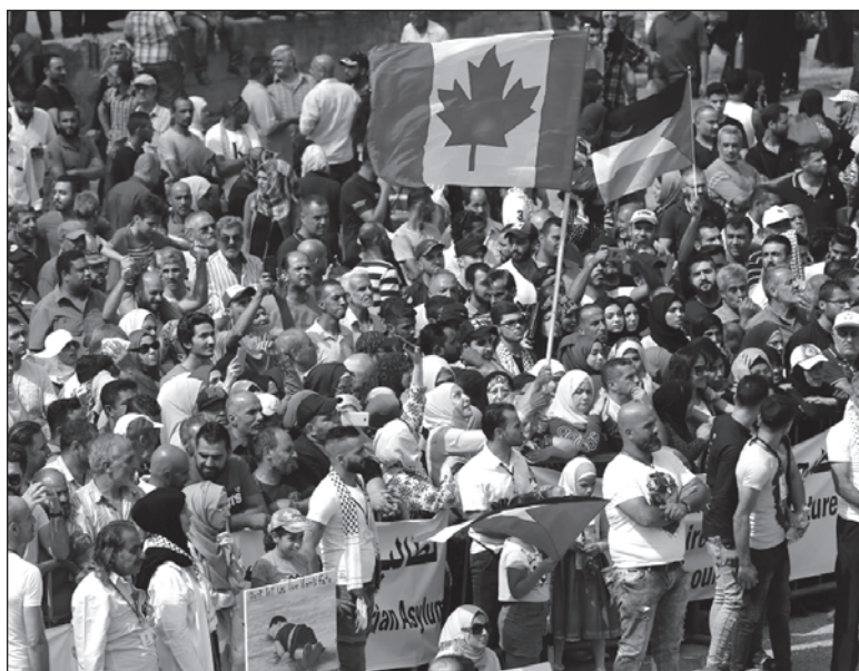
▲ "The dream of many of multicultural societies living in harmony appears to have died and is being replaced by the 'Clash of Civilizations'".

SAUDI ARABIA FUELED this transition by funding the construction of thousands of mosques