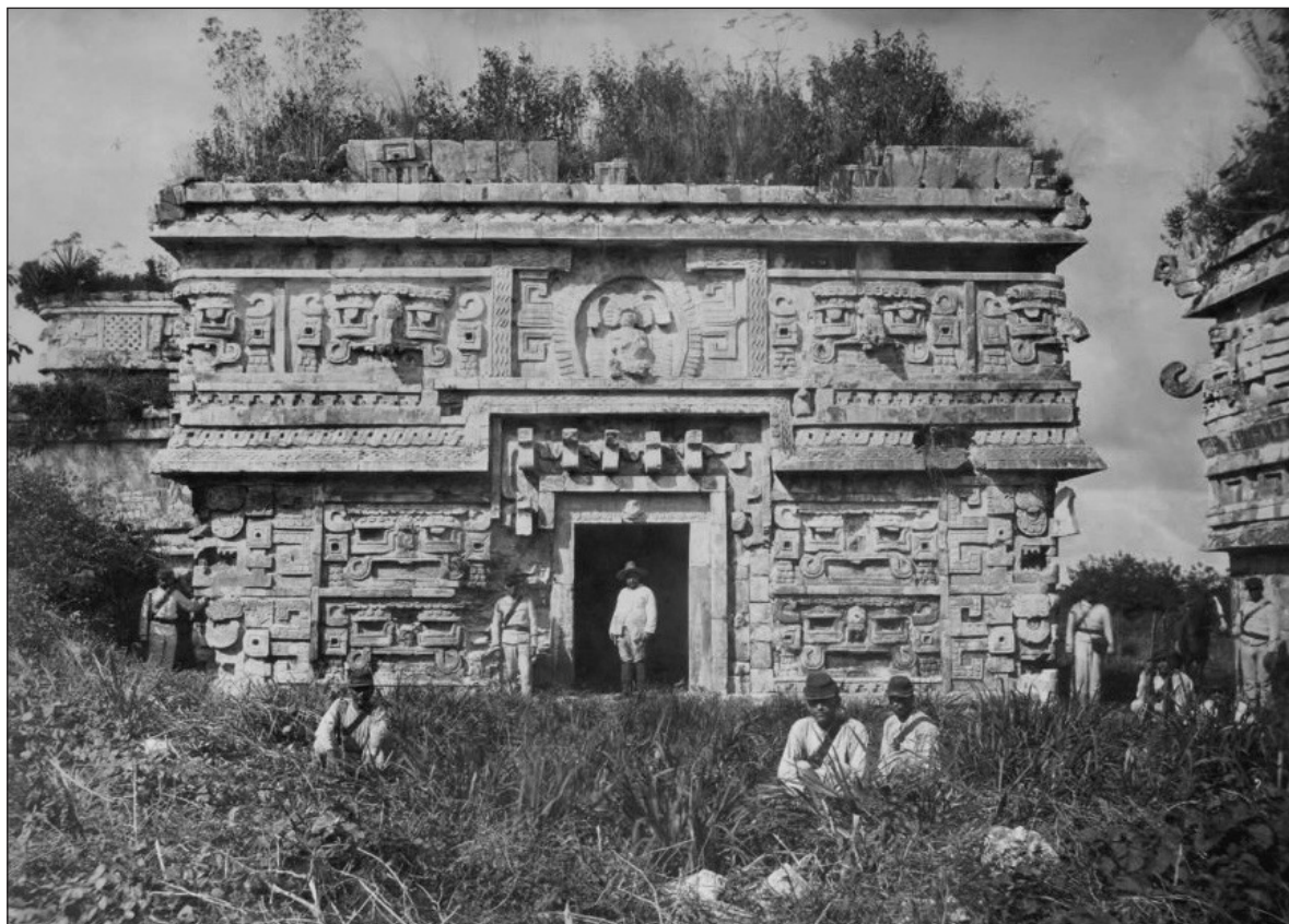
▲ "En la actualidad, la fotografía sigue siendo indispensable para la investigación arqueológica, utilizando drones para la prospección y técnicas como la fotografía estereoscópica para recrear la tercera dimensión".