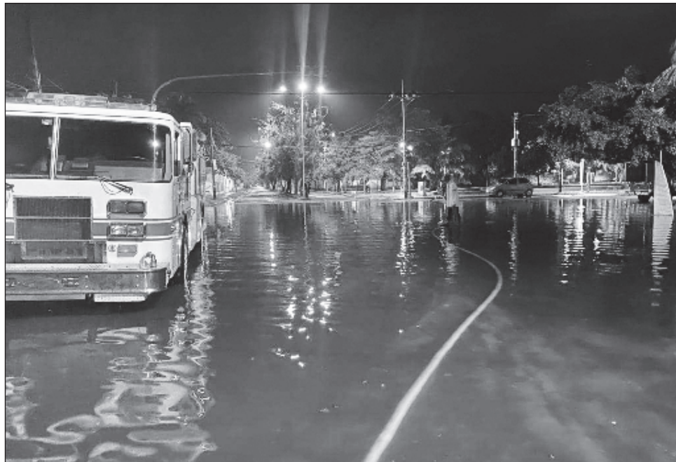
▲ Las direcciones que integran el Operativo Tormenta atendieron la noche del domingo y mañana del lunes los puntos más álgidos de Chetumal con motobombas de succión y bombas de achique para liberar algunas calles y avenidas.

Hasta la isla de Holbox llegó personal de la Comisión Nacional del Agua (Conagua), la Coordinación Estatal de Protección Civil (Coeproc) y la Secretaría de Obras Públicas (SEOP) para atender los encharcamientos ocasionados por las recientes lluvias registradas en la entidad.