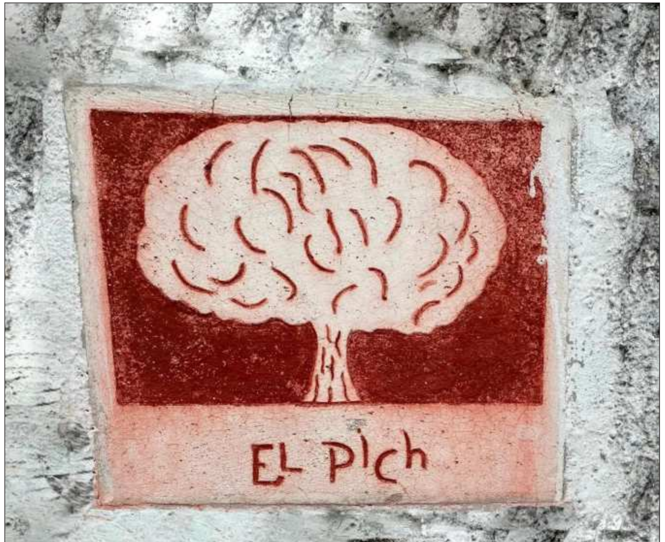
▲ Ti' xaak'al u beetmaj Gabriele', ojéelta'ab yaan kex 500 u p'éeel plaakáas ka'achij, ba'ale' ts'o'ok u sa'atal maanal ti' chúumuki' tumen yaan naj ku yúutskíinsa'al le beetik ku luk'sa'alo'obi'.

Beey túuno', gáaleria Casa Bonitae' tu páayt'antaj ti'al u táakpajal Noche Blanca, ts'o'oke' jach ma'alob úuchik u k'amal, le beetik Gabriel Albertoe'