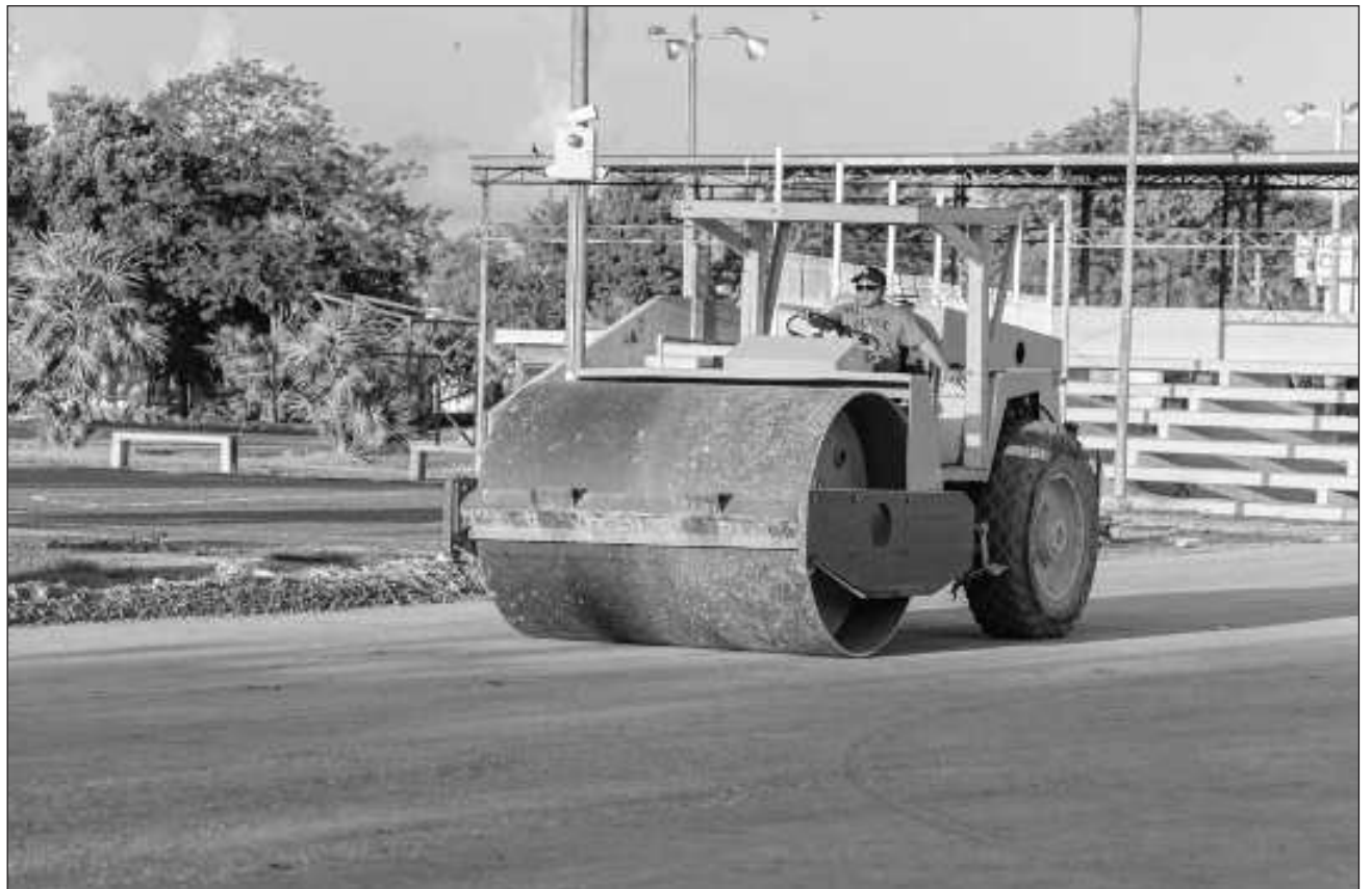
▲ La obra tendrá un impacto directo de beneficio social para 33 mil 374 habitantes.

Se trata del proyecto histórico de desarrollo deportivo en el municipio, con una inversión de 14 millones 596 mil 868 pesos