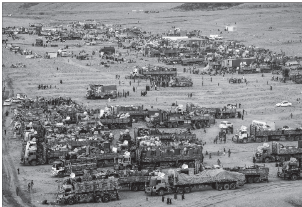
▲ Las autoridades pakistaníes habían dado plazo hasta el 1º de noviembre del año pasado para que los 1,7 millones de afganos en situación irregular se marchasen.

La ONU teme que "algunos afganos obligados a volver a su país se expongan a persecuciones, detenciones arbitrarias y/o tortura o malos tratos".