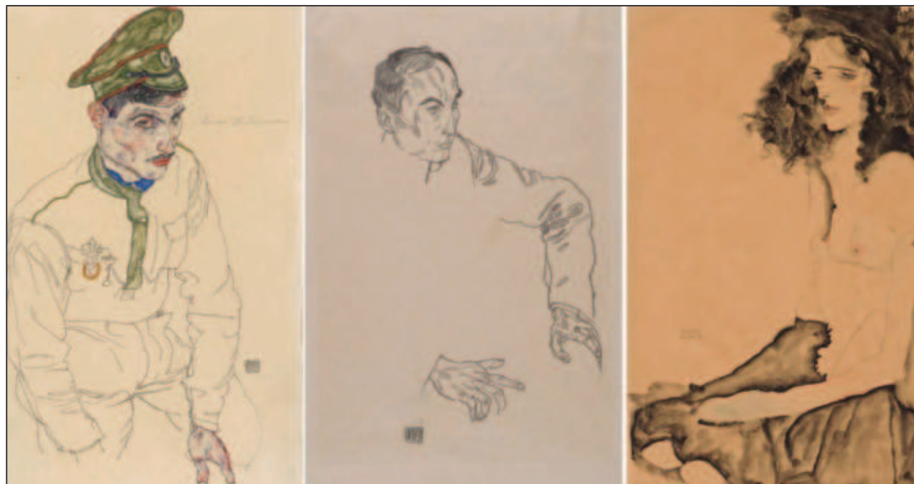
▲ Los dibujos Mujer con cabello negro y Retrato de un hombre fueron robadas a Fritz Grunbaum, judío austriaco artista de cabaret que murió en el Holocausto.

Esta es una victoria para la justicia y para la memoria de un artista valiente,