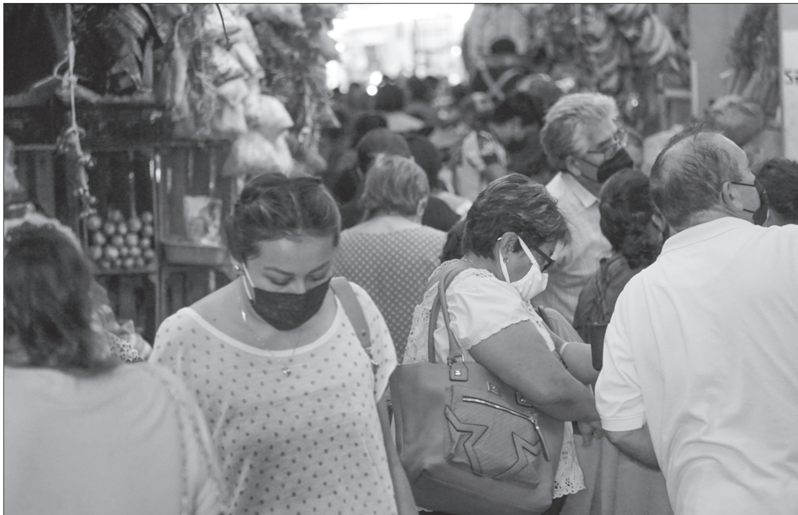
▲ “No podemos negar que hay una altísima población con sobrepeso entre los indígenas, pero la causa no es genética, es la mala alimentación, el exceso de calorías (...) puede jugar un papel importante el bombardeo publicitario de líquidos y sólidos chatarra”.