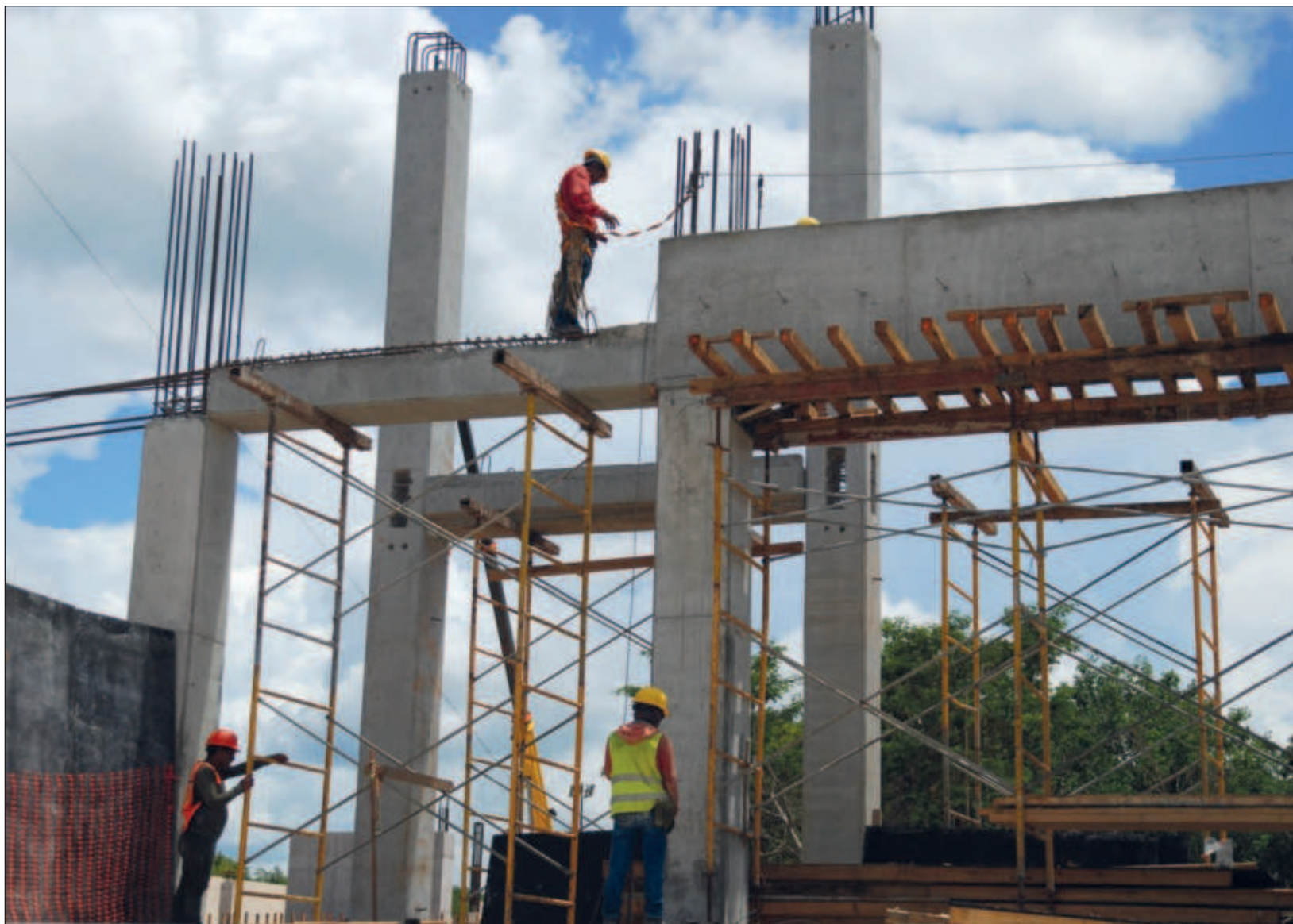
▲ Quintana Roo es la única entidad de la república mexicana que reporta dos dígitos en su participación nacional con 12.9 por ciento.

En cuanto a Yucatán, respecto a Electricidad y Telecomunicaciones, a principios de este año el gobernador de Yucatán, Mauricio Vila Dosal, informó que había un avance de 74 por ciento en la planta de ciclo combinado Mérida IV y de 72 por ciento en la central Valladolid, mismas que estarán en funcionamiento en los próximos meses.