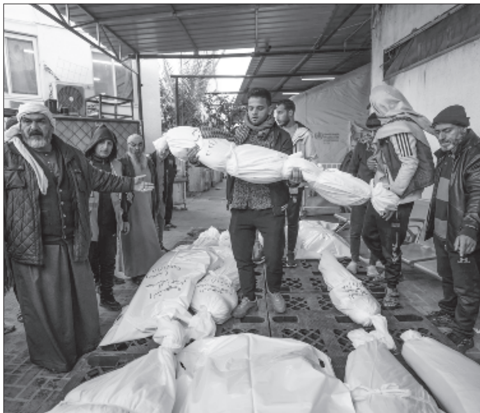
▲ De acuerdo con Hamas, 178 personas perecieron en las últimas 24 horas.

De acuerdo con Hamas, 178 personas perecieron en las últimas 24 horas.