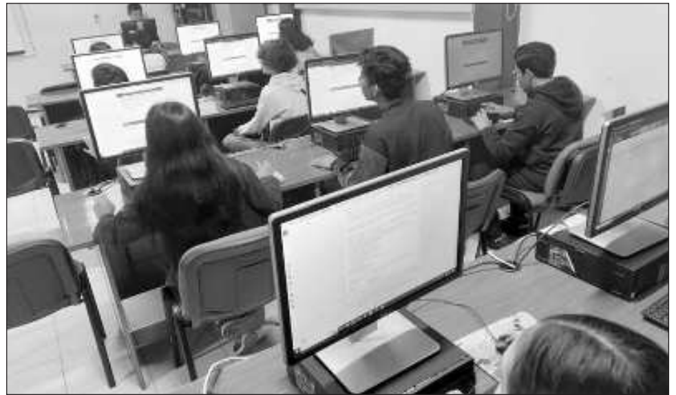
▲ Los 22 centros educativos del Colegio de Bachilleres que ahora cuentan con una conexión a Internet del Jaguar , permiten a los estudiantes y educadores acceder a recursos educativos en línea, colaborar en proyectos digitales y participar en programas de aprendizaje.

Los 22 centros educativos del Cobacam que ahora cuentan con una conexión a Internet del Jaguar , permiten a los estudiantes y educadores acceder a recursos educativos en línea, colaborar en proyectos digitales y