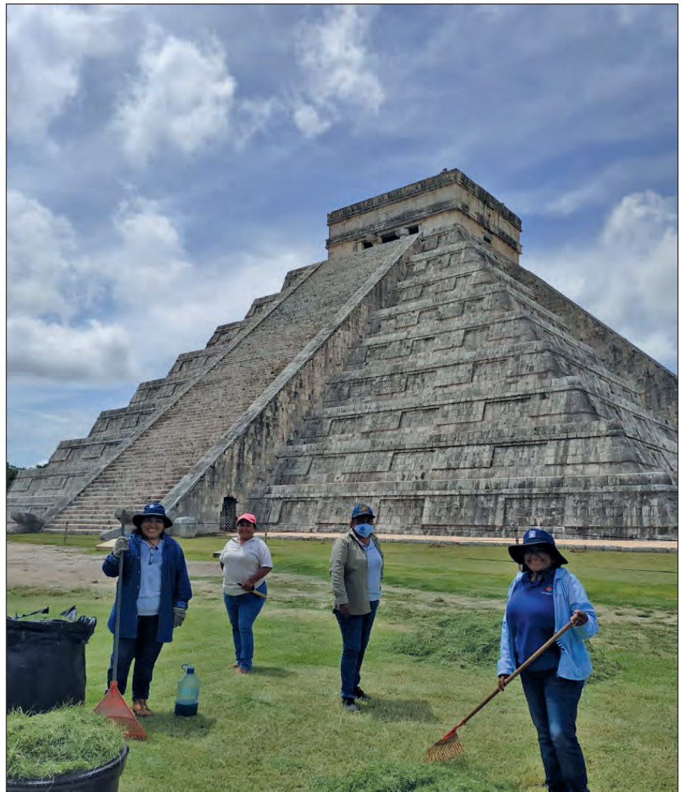
Los agentes de Cancún y la Riviera Maya generan el 70 por ciento de los turistas que recibe Chichén Itzá.

“Afortunadamente en medio de la crisis económica generada por la pandemia Cancún está saliendo bien librado porque es un destino exitoso, muy demandado por turistas y rápidamente se está recuperando”, destacó.