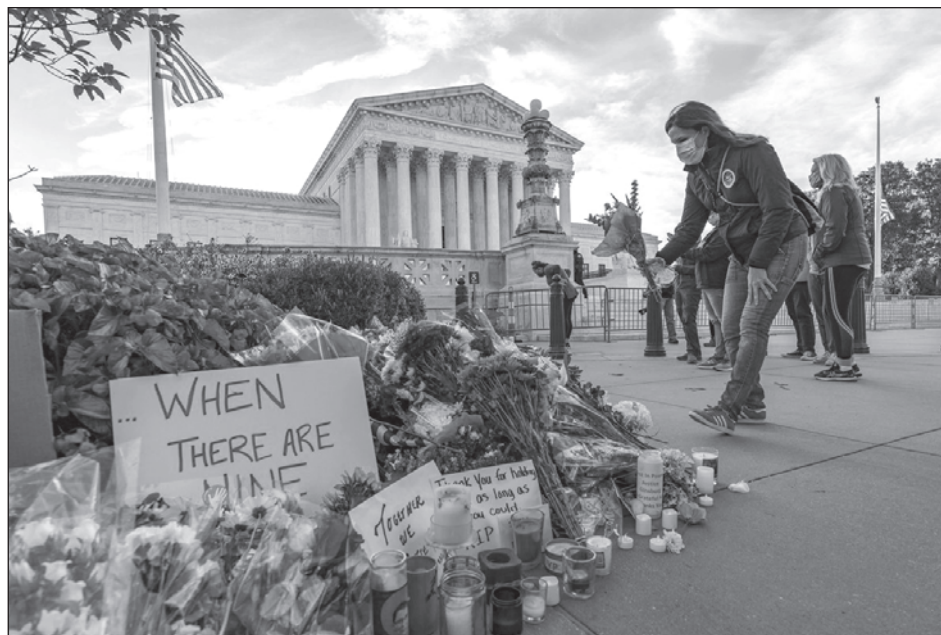
▲ Varias personas dejaron arreglos florales frente a la Corte Suprema en Washington, en honor a la fallecida juez Ruth Bader Ginsburg.

El mandatario agregó que quería esperar a que terminaran los servicios fúnebres en honor a Ginsburg, que falleció el viernes a los