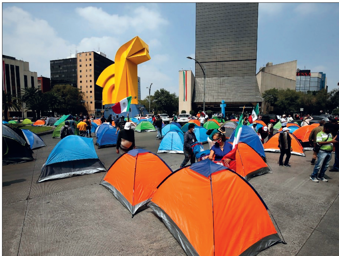
▲ Los frenados constituyen un complemento de faena en calle, de la movilización en desplegado que han organizado antiobradoristas como Enrique Krauze y Héctor Aguilar Camín.

PLANTEADO LO ANTERIOR , ha de decirse también que carecen el grupo llamado Frena (Frente Nacional Anti-AMLO), y en espe-