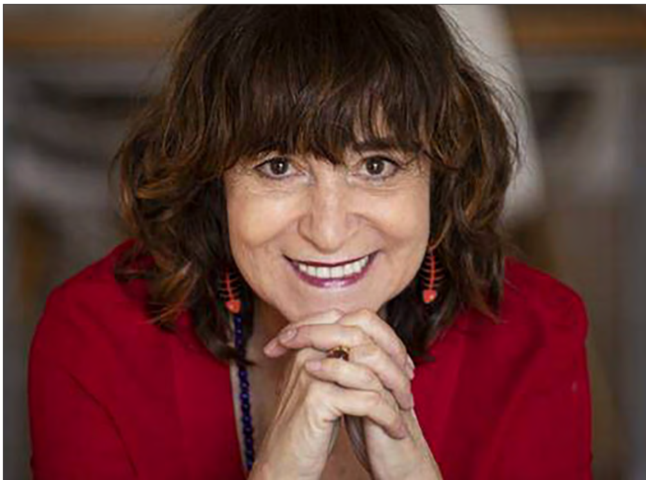
▲ Volver a la literatura y a la creación me hizo aterrizar más o menos en este mundo y salir adelante durante la pandemia.

Así, La buena suerte es una novela de esperanza en nuestra capacidad de aprendizaje, de reinención, de esperanza en perder el miedo a vivir. Vivir da mucho miedo, nuestros propios sentimientos nos hacen muy vulnerables. Hay personas que por miedo, como Pablo (el personaje principal), se amurallan; me parece que eso es elegir la muerte en lugar de la vida.