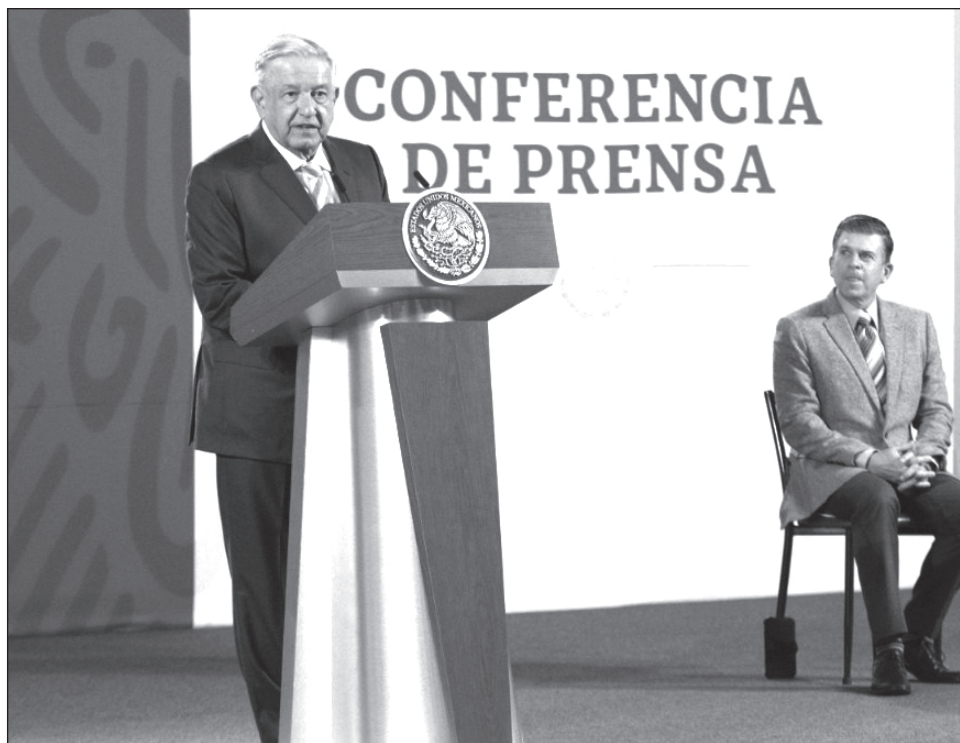
▲ El presidente, Andrés Manuel López Obrador, señaló que algunos "intelectuales orgánicos" acomodaban a sus cercanos en universidades y centros de investigación.

Señaló que ellos no solamente tenían sus empresas editoriales, sino que tenían mucha influencia en el gobierno y acomodaban a sus cercanos en universidades, en centros de investigación, o sea, "eran padrinos en el mundo intelectual".