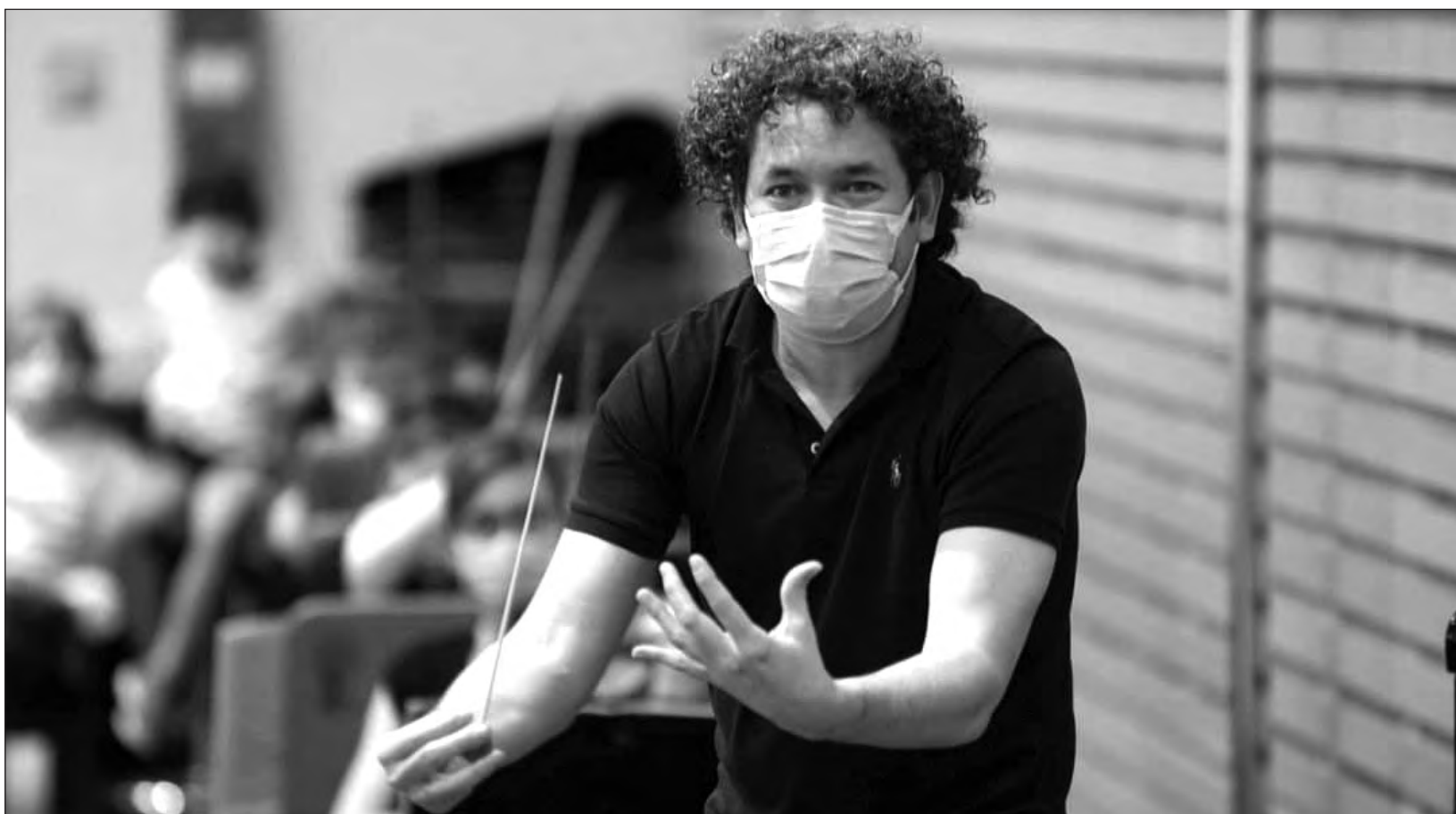
▲ El Teatro Real de Madrid celebra el 250 aniversario del nacimiento de Beethoven interpretando algunas de sus más reconocidas obras, como la Novena Sinfonía .