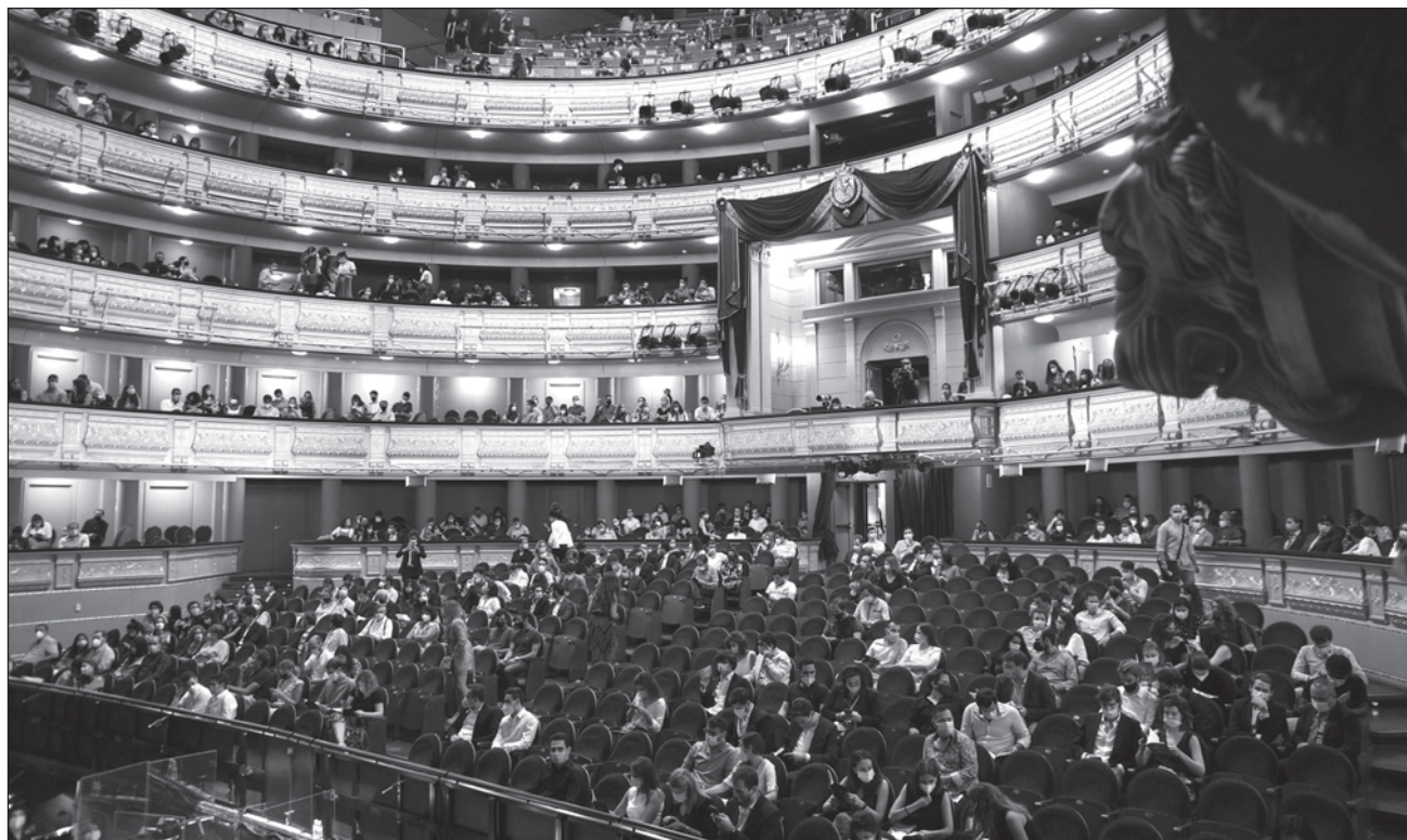
▲ Para la función, se habían vendido 905 entradas; menos del 50% del aforo del Teatro Real, respetando a rajatabla las medidas sanitarias para evitar contagios de COVID-19.