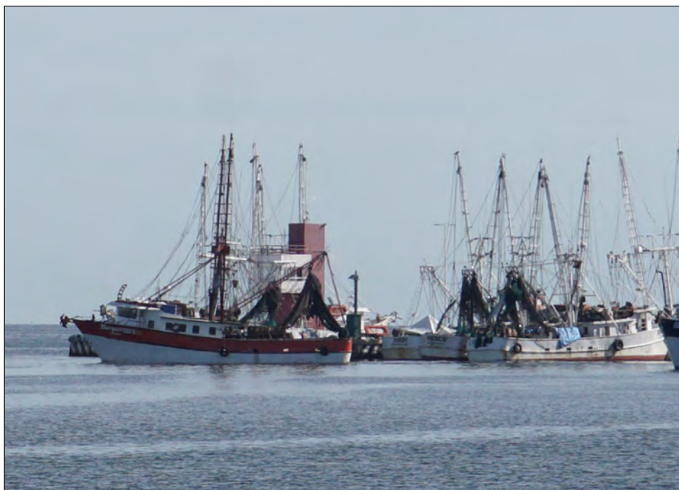
▲ Un precio del diésel más competitivo beneficia a varios sectores económicos, no sólo al pesquero, señaló el presidente del CCEC.