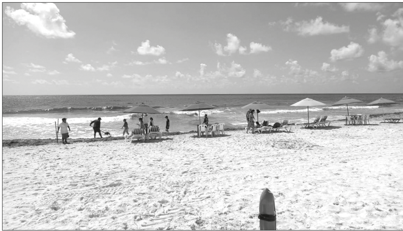
▲ En las próximas semanas se espera una presencia de mercados principalmente estadounidense y sudamericano; los canadienses llegarán hasta noviembre, reveló la Asociación de Hoteles de Cancún, Puerto Morelos e Isla Mujeres.

Incluso dio a conocer que se tienen ya proyectos importantes de promoción para seguir manteniendo el interés en el destino, y para el mes de octubre se realizará -como cada año- el Travel Mart Cancún, que reúne a un importante número de tour operadores y agentes mayoristas.