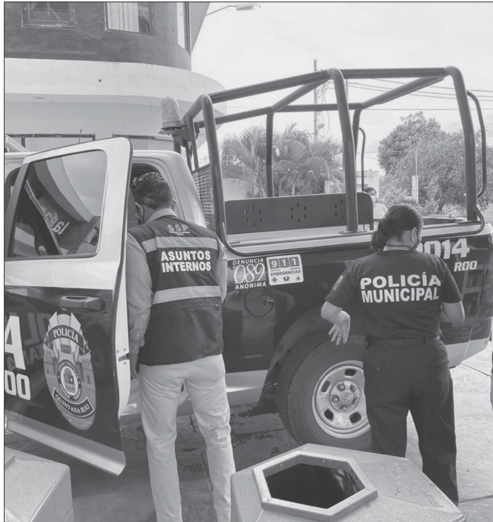
▲ La Dirección de Asuntos Internos de la SSP aplica justicia pronta y expedita a las quejas, las cuales son canalizadas al Consejo de Honor y Justicia.

Durante el periodo de enero a julio del 2022 se han realizado 173 supervisiones, de las cuales 23 han sido intervenciones en la