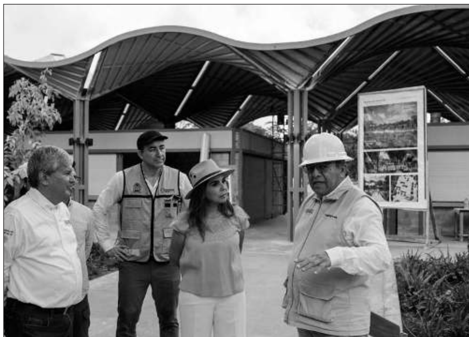
▲ La gobernadora señaló que el Mercado del Bienestar Maya es un proyecto fundamental para impulsar la economía local y mejorar las condiciones de vida en la zona.

“Este proyecto, en línea con el Nuevo Acuerdo por el Bienestar y Desarrollo de Quintana Roo, tiene como objetivo dinamizar la economía local y fomentar el turismo. La creación del Mercado del Bienestar