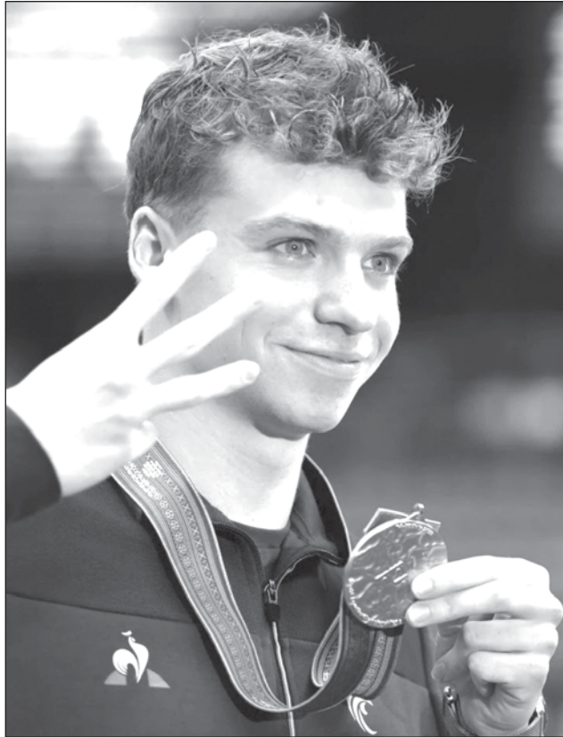
▲ El francés Léon Marchand se perfila para ser uno de los protagonistas de la natación en los Juegos de París.

—Summer McIntosh, Canadá. La nadadora de 17 años aspira al oro en múltiples pruebas, incluyendo los 800 libres, carrera dominada por Ledecky durante más de una década.