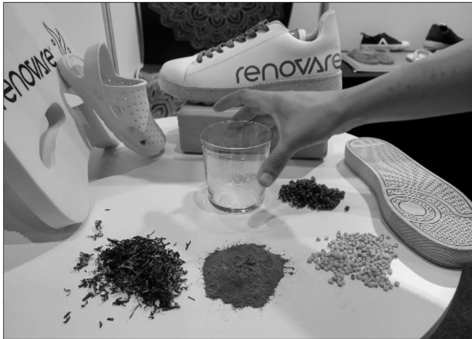
▲ Las empresas presentaron productos como suelas de zapatos hasta materiales de construcción y biocombustible, todos hechos a partir del sargazo.

El laboratorio está ubicado en España, pero no fabrican,