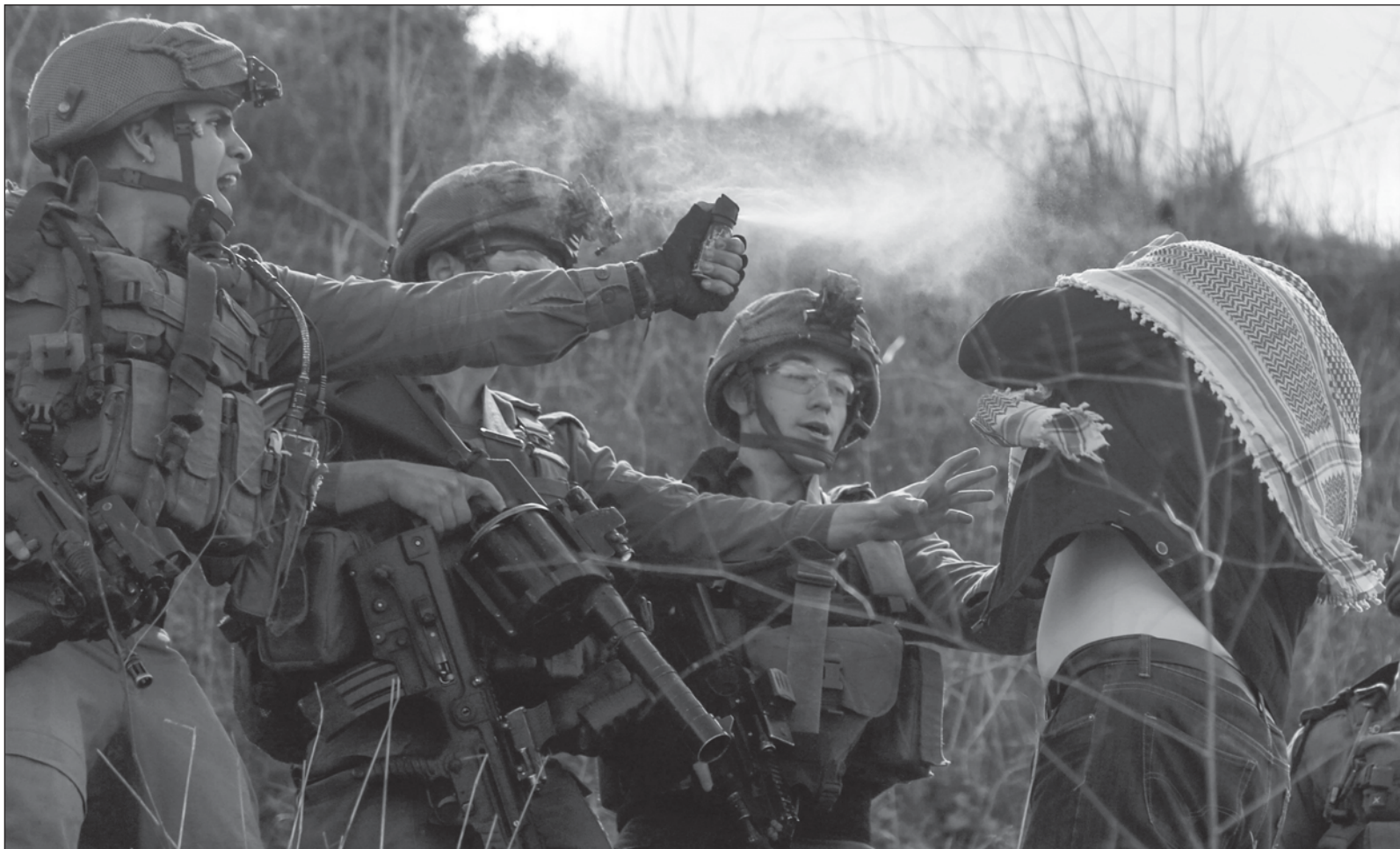
▲ "¿Qué más tiene que hacer Israel y que más debe acontecer en este genocidio inhumano para que por fin se intervenga por parte de la ONU".