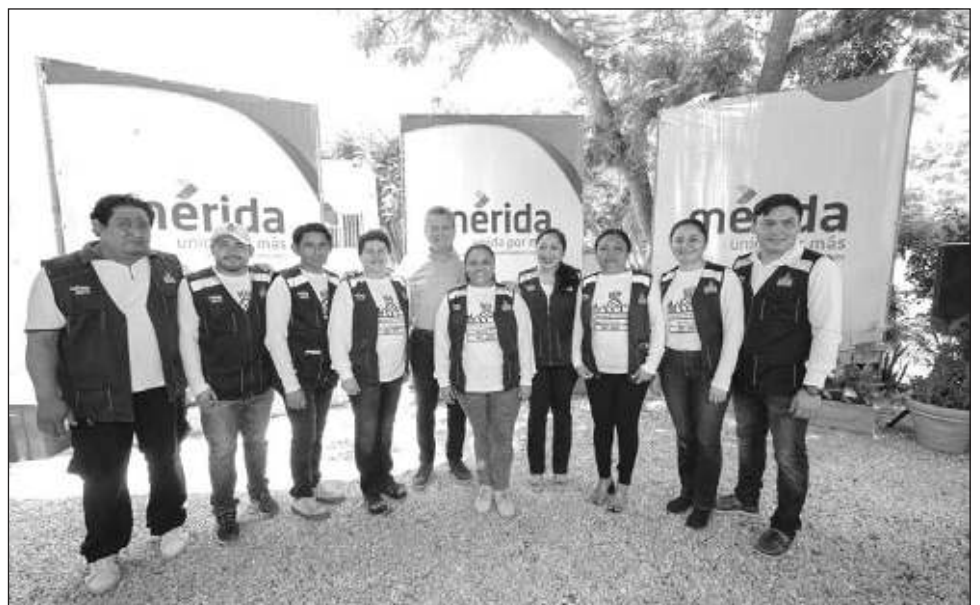
▲ El nuevo espacio se une al complejo de esta central, con una inversión de 600 mil pesos en beneficio de 28 trabajadoras, 28 trabajadores y más de 60 locatarios.

También, en el marco del 42 aniversario de la Central