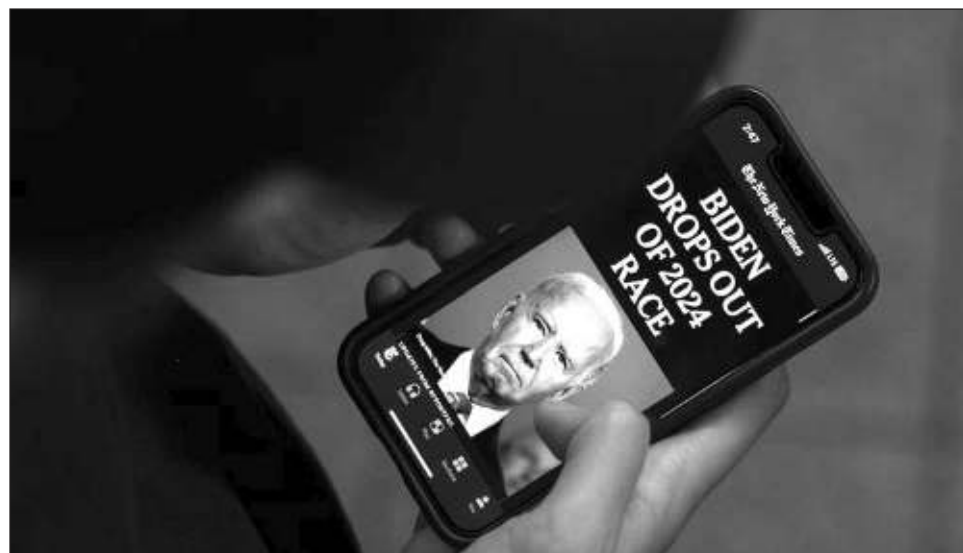
▲ El anuncio de Joe Biden es el golpe más reciente a una campaña para la Casa Blanca y se produce pocos días después del intento de asesinato de Trump en un mitin en Pensilvania.

El anuncio es el golpe más reciente a una campaña para la Casa Blanca y se