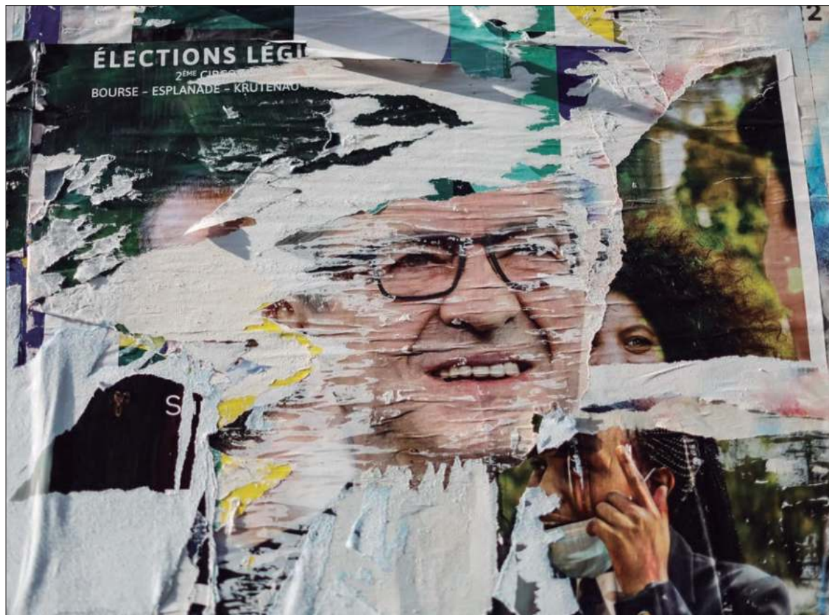
▲ “¿Pero realmente existen dos extremos? En la cultura occidental deberíamos ceñirnos a la única posible: capitalismo de rostro humano o capitalismo salvaje. Por esta razón se unen contra Francia Insumisa”.

La propuesta lanzada por el líder de la Francia Insumisa, Jean-Luc Mélenchon, anunciando la renuncia de sus candidatos en favor de quienes tuvieran más opciones de ser electos, evitando dividir el voto y con ello el triunfo de la extrema derecha, consolidó el Frente Popular. La estrategia dio sus frutos. En la segunda vuelta se logró desplazar a los candidatos de Reagrupamiento Nacional a un tercer lugar. Conseguido el objetivo, el partido socialista, los verdes-ecologistas, el partido comunista y restantes fuerzas que integran el Frente Popular han lanzado un órdago, Jean-Luc Mélenchon, líder de Francia Insumisa, no puede ser candidato a primer ministro. Se amparan en su radicalidad e ideológicamente de extrema izquierda. En los hechos, esta postura es una demostración de la verdadera línea roja. Para los articuladores de esta propuesta, Marine Le Pen y Jean-Luc Mélenchon son lo mismo. Por consiguiente, es necesario imponer moderación y responsabilidad. No de otra manera se deben interpretar las palabras del capitán de la selección francesa Kylian Mbappé de fútbol, pronunciadas durante