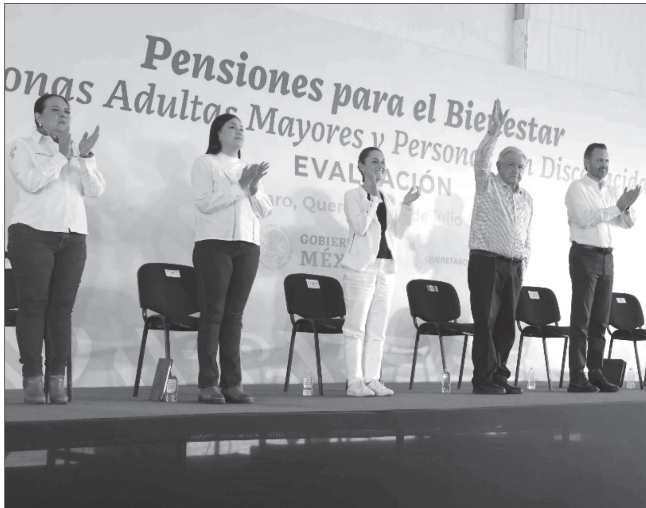
▲ “Es algo que he venido platicando en estas giras con el presidente. Tenía yo la idea desde hace tiempo, pero también es del presidente. Es un programa especial”, puntualizó la virtual presidenta electa respecto al programa.

Señaló que acordó con el mandatario federal ponerle Hoy por ustedes, mañana por nosotros .