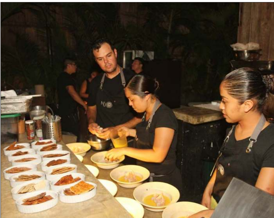
▲ Tulum fue designado por tener una oferta turística ligada al bienestar integral, el intercambio cultural, el empoderamiento de la mujer y la gastronomía sustentable para ser sede.

Además de la pena carcelaria de 43 años y nueve meses, el juez determinó que Alexis N. deberá pagar una multa de 228 mil 600 pesos, así como la reparación del daño material por la cantidad de 623 mil 499 pesos.