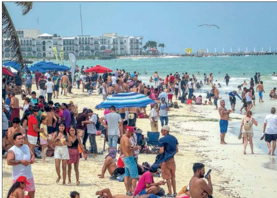
▲ Las estimaciones de la Red de Monitoreo de Sargazo de Quintana Roo, encabezada por el hidrobiólogo Esteban Amaro, aseguran un verano sin la talofita.

Esto, dijo, ayuda mucho porque como destino turístico prácticamente se está asegurando un verano sin sargazo. Generalmente lo que