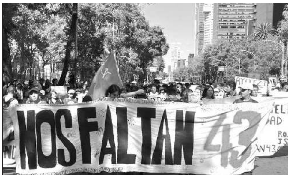
▲ En el documento, el jefe del Ejecutivo sostiene que hasta el momento no se ha encontrado nada sobre la participación directa de integrantes del Ejército en el crimen de Iguala.

Además, advierte que es el momento de revisar el comportamiento de quienes han conducido las exigencias de supuesta justicia, sobre todo sus vínculos con el gobierno de Estados Unidos y sus agencias.