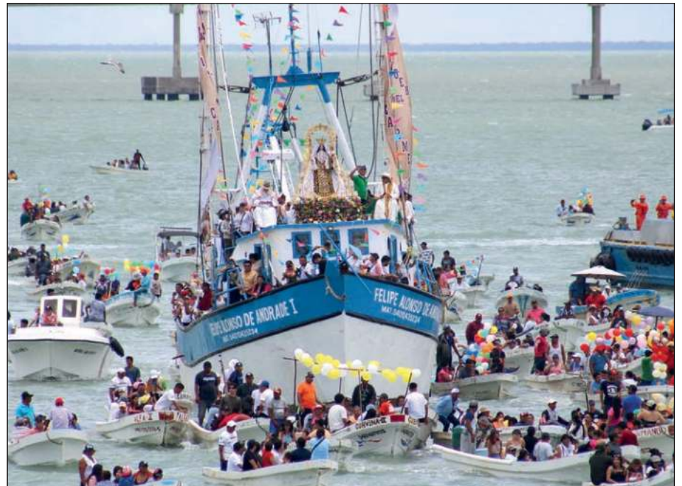
▲ La imagen de la Virgen del Carmen fue cargada en hombros por los fieles y llevada en procesi3n hasta el Malec3n de la ciudad, donde se llev3 a cabo la ceremonia eucar3stica.

Pese a la amenaza de lluvia, familias completas, llegadas de estados cercanos como Yucat3n, Quintana Roo, Tabasco, Veracruz, Tamaulipas, Puebla, Chiapas y Puebla, entre otros, se desplegaron a lo largo del recorrido de la imagen que parti3 del Santuario Mariano Diocesano de la Virgen del