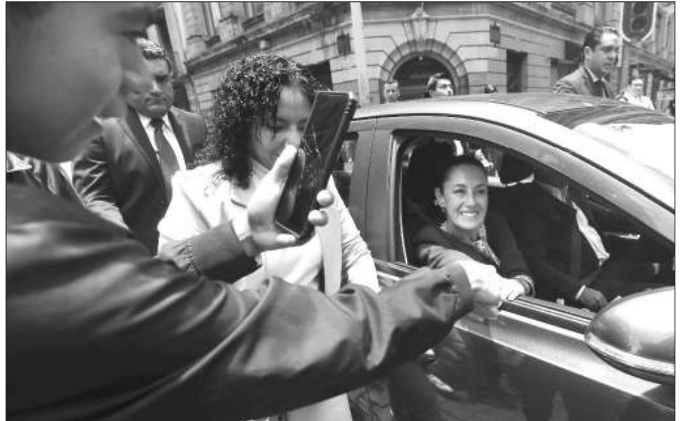
▲ “Vamos a respetar siempre la decisión del pueblo de Estados Unidos, quien ellos decidan que va a ser su presidente, nos vamos a llevar bien”, destacó la virtual presidenta electa.

Nosotros, reiteró, “tenemos que defender siempre a nuestro equipo, y a defender a México, siempre”.