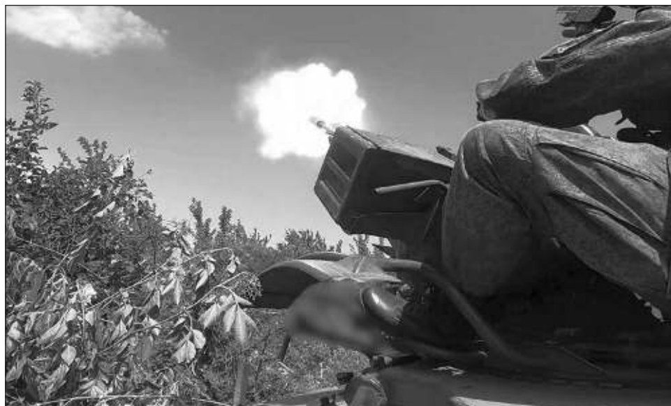
▲ El presidente ruso, Vladimir Putin, aseguró en varias ocasiones en los últimos meses que a Rusia le convenía más la victoria de Biden que la del ex presidente y candidato republicano, Donald Trump.

El presidente ruso, Vladimir Putin, aseguró en varias ocasiones en los últimos me-