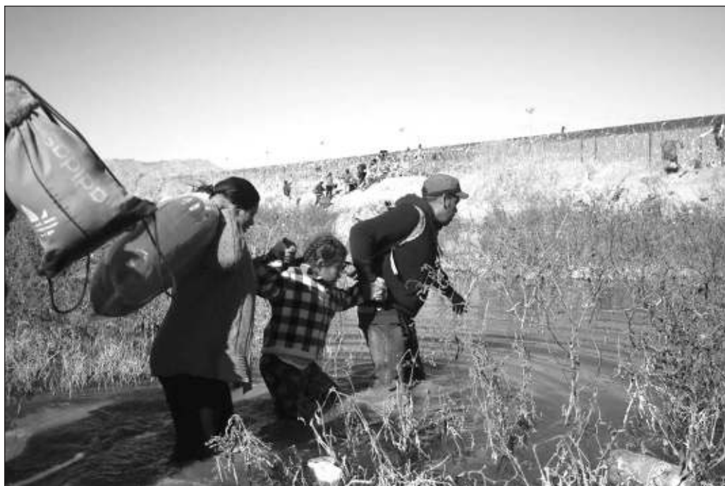
▲ El escándalo muestra las atrocidades a las que conduce la lógica de privatizar y subrogar funciones irrenunciables del Estado, que por su naturaleza requieren un enfoque absoluto de derechos humanos.

Para los menores de edad migrantes que se encuentran a merced de los agresores en las instalaciones de Southwest Key, el sueño americano en pos del cual dejaron atrás sus lugares de origen se ha convertido en una auténtica pesadilla, una paradoja particularmente brutal si se considera que quienes ingresan a Estados Unidos se sienten a salvo de los peligros que los amenazaban en sus regiones de partida y de los que enfrentan en el camino hacia el norte. Con independencia de las sanciones penales y administrativas que deben fincarse a quienes han perpetrado o facilitado la violencia sexual contra niños, niñas y adolescentes en los centros de reclusión, es evidente que este horror no parará mientras persista el fallido enfoque securitista y racista en el manejo de la crisis migratoria.