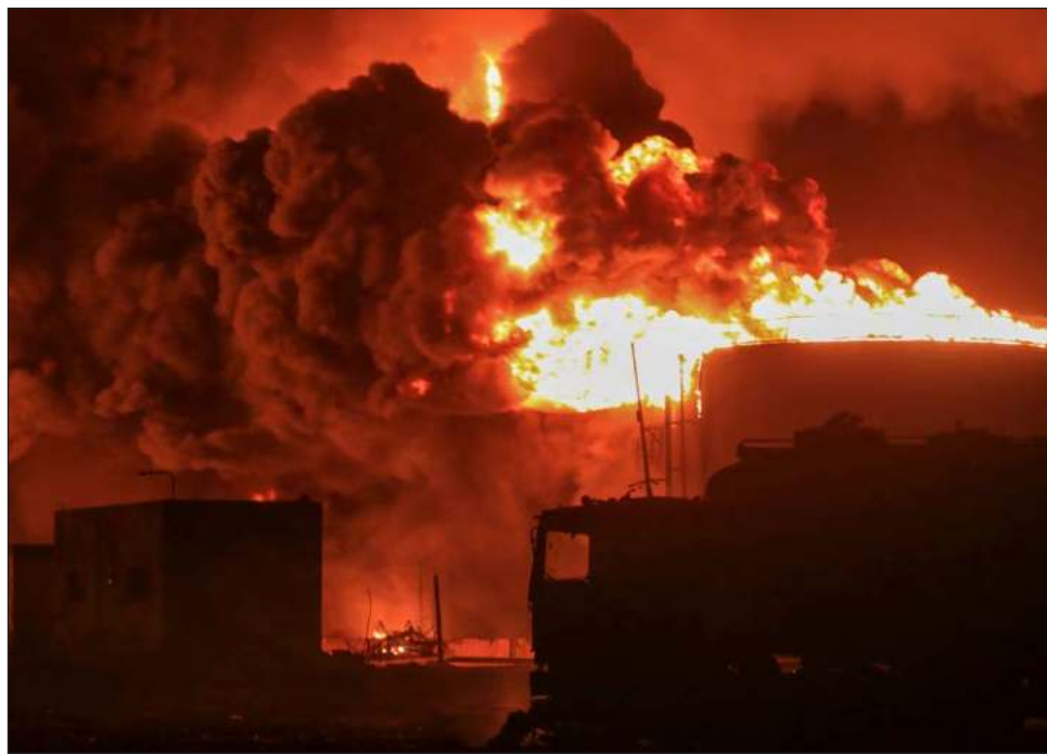
▲ Este domingo, los bomberos continuaban tratando de apagar el enorme incendio provocado por los ataques israelíes en el puerto, por donde llega el combustible.

Este domingo, los bomberos continuaban tratando de apagar el enorme incendio provocado por los ataques israelíes en el puerto, por donde llega el combustible y la ayuda humanitaria para el país, en guerra desde 2014.