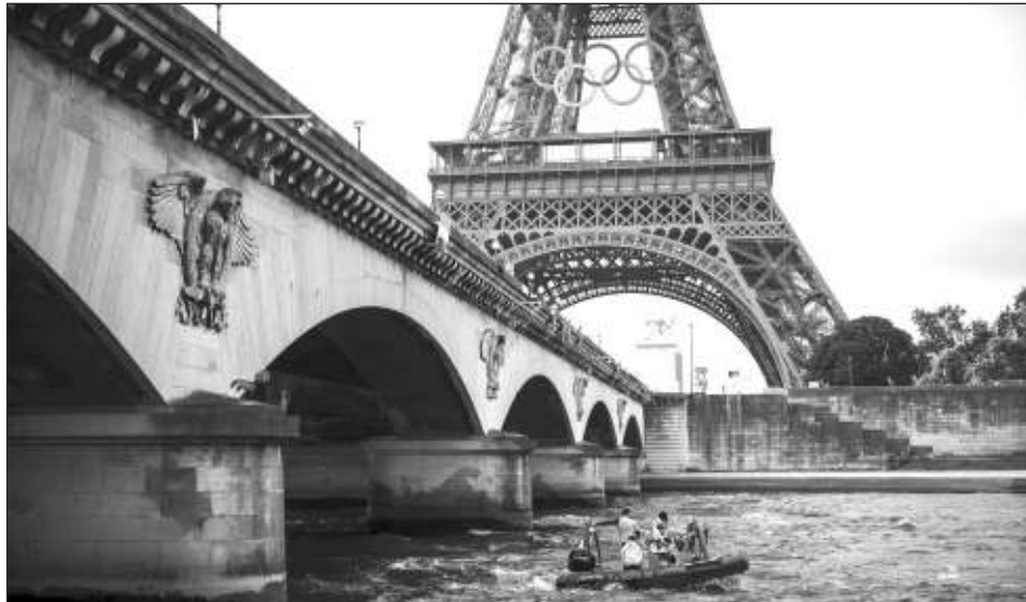
▲ Un bote de rescate navega en el río Sena cerca de la Torre Eiffel durante un simulacro para la ceremonia inaugural de los Juegos de Olímpicos de París 2024.

A menos de una semana de esa esperada ceremonia de casi cuatro horas, que por primera vez tendrá lugar fuera de un estadio, la flota de barcos que debe transportar a las delegaciones tuvo un ensayo general el sábado y todo transcurrió “muy bien”, destacó el comité de organización. La ceremonia de aper-