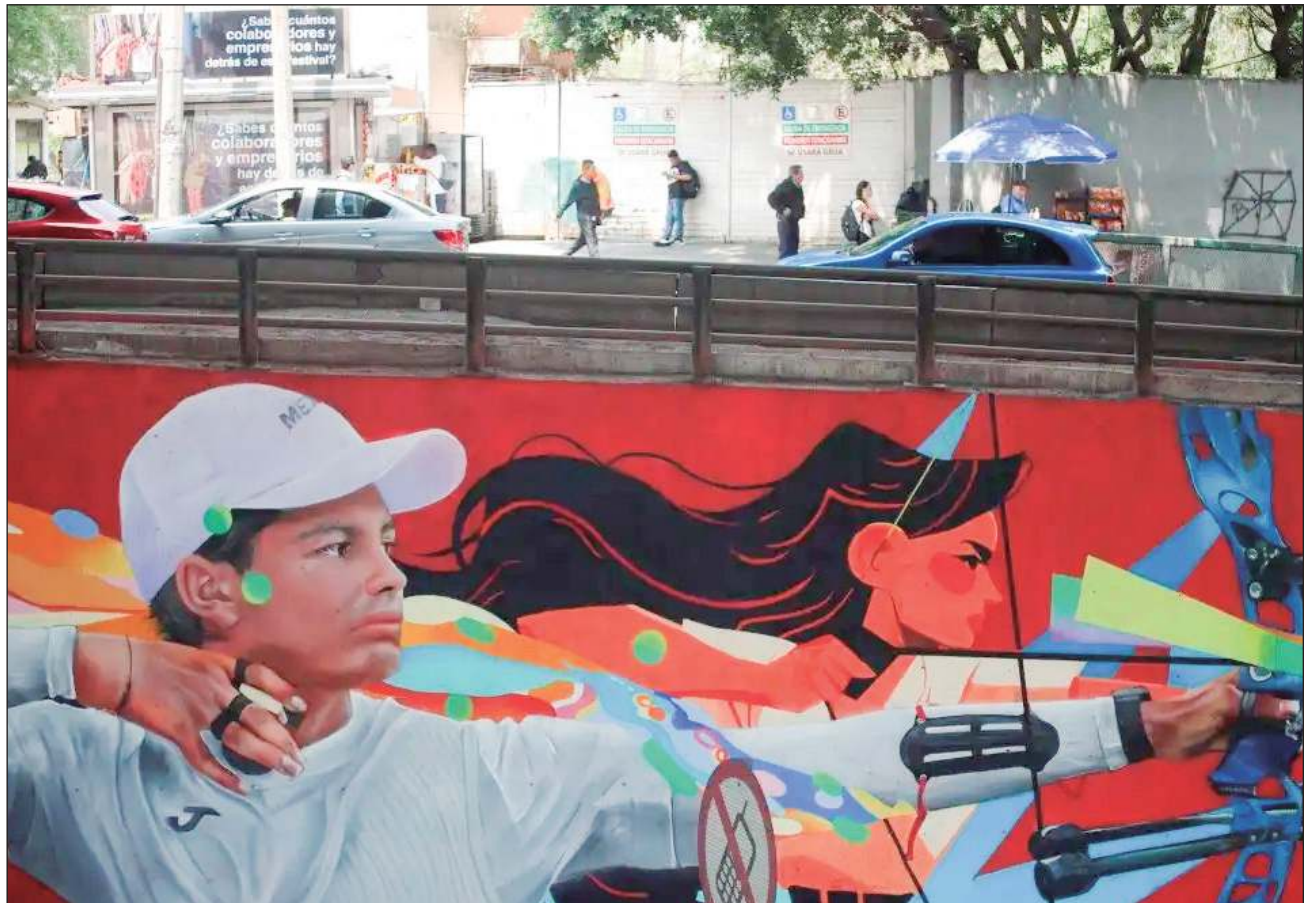
▲ Los nuevos 35 murales dedicados a los atletas olímpicos mexicanos fueron elaborados en las dos primeras semanas de julio y se ubican en Periférico Norte, en los cruces con calzada Legaria y las avenidas Ejército Nacional y Conscripto.

Los nuevos 35 murales dedicados a los atletas olímpicos mexicanos fueron elaborados en las dos primeras semanas de julio y se ubican