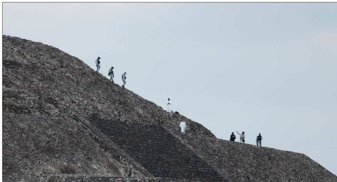
▲ De acuerdo con el fiscal, el agresor tenía un padecimiento, pues presentaba un perfil sicopático con una tendencia a imitar hechos que han ocurrido en otros lugares, lo cual se deduce por las hojas que se encontraron en su mochila.

Por su parte, el fiscal mexiquense dijo que el agresor traía un arma muy antigua (anterior a 1968, según las consultas que se hicieron con autoridades de Tabaco y Fuego de Estados Unidos), además, lle-