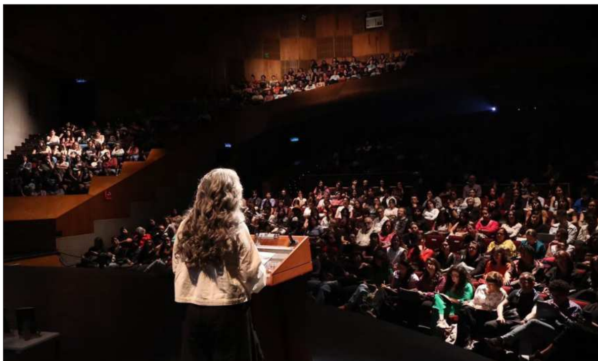
▲ "No voy a repetir aquí lo que dije entonces en la conferencia magistral sobre la relación entre la impunidad, el cuerpo y el Estado (...) lo que yo espero es que la familia de Edith Guadalupe no tenga que vivir 30 años con la impunidad, ni doblegarse ante ella. Otro mundo es posible. En eso estamos de acuerdo".

UN DÍA MÁS tarde, el 14 de abril, justo cuando el Senado aprobó por unanimidad la reforma del artículo 73 de la Constitución mexicana, de manera tal que la Cámara de Diputados podrá, llegado su momento, expedir una ley que homologue la tipificación del feminicidio en toda la nación, varios periodistas buscaron la opinión de la presidenta Claudia Sheinbaum sobre lo expresado por mí el día anterior. Las interrogantes fueron varias y las respuestas abundantes, pero la prensa se concentró en la pregunta de uno de ellos, y aquí cito de la versión estenográfica: "En el caso de los feminicidios y de acuerdo con lo que comentó ayer la escritora, la impunidad sigue muy elevada. La frustración, el dolor. Ella hablaba de que eso significa un desprecio del Estado para las víctimas". Revisé la grabación horas más tarde y leí también la transcripción de la sesión completa. Y esto es lo que tengo que decir al respecto.