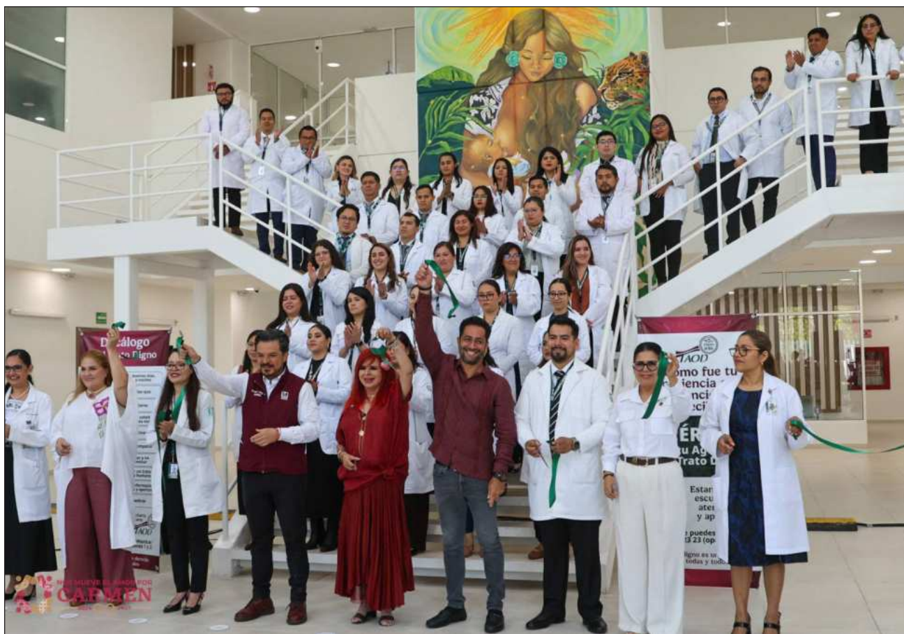
▲ Zoé Robledo, director general del IMSS, indicó que el hospital permite tener capacidad resolutiva local, así como justicia social territorial que implicó una reinversión por completo, principalmente para la contratación de médicas y médicos especialistas.

La primera fase de operación incluyó la recepción de pacientes en las especialidades de Ginecología, Obstetricia, Pediatría y Cirugía Pediátrica, con ello se refleja la capacidad del IMSS para responder con eficiencia a las necesidades de la población.