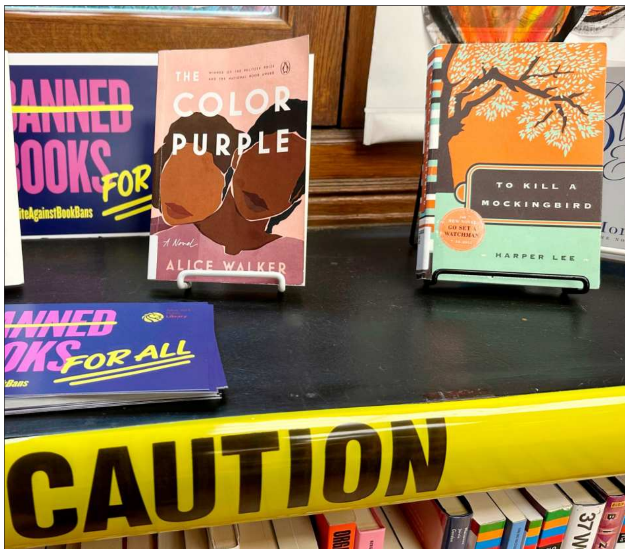
▲ Los intentos de censura se mantienen en niveles récord, según la Asociación Estadunidense de Bibliotecas, la cual publicó este lunes su lista anual de los libros más impugnados en las bibliotecas del país, como parte del informe State of America's Libraries Report .

Los boletos ya se encuentran a la venta a través del número de WhatsApp 9902287462 y cuestan 280 pesos la entrada general, pero hay descuentos para quienes presenten su credencial de estudiantes y para quienes tengan credencial del Inapam.