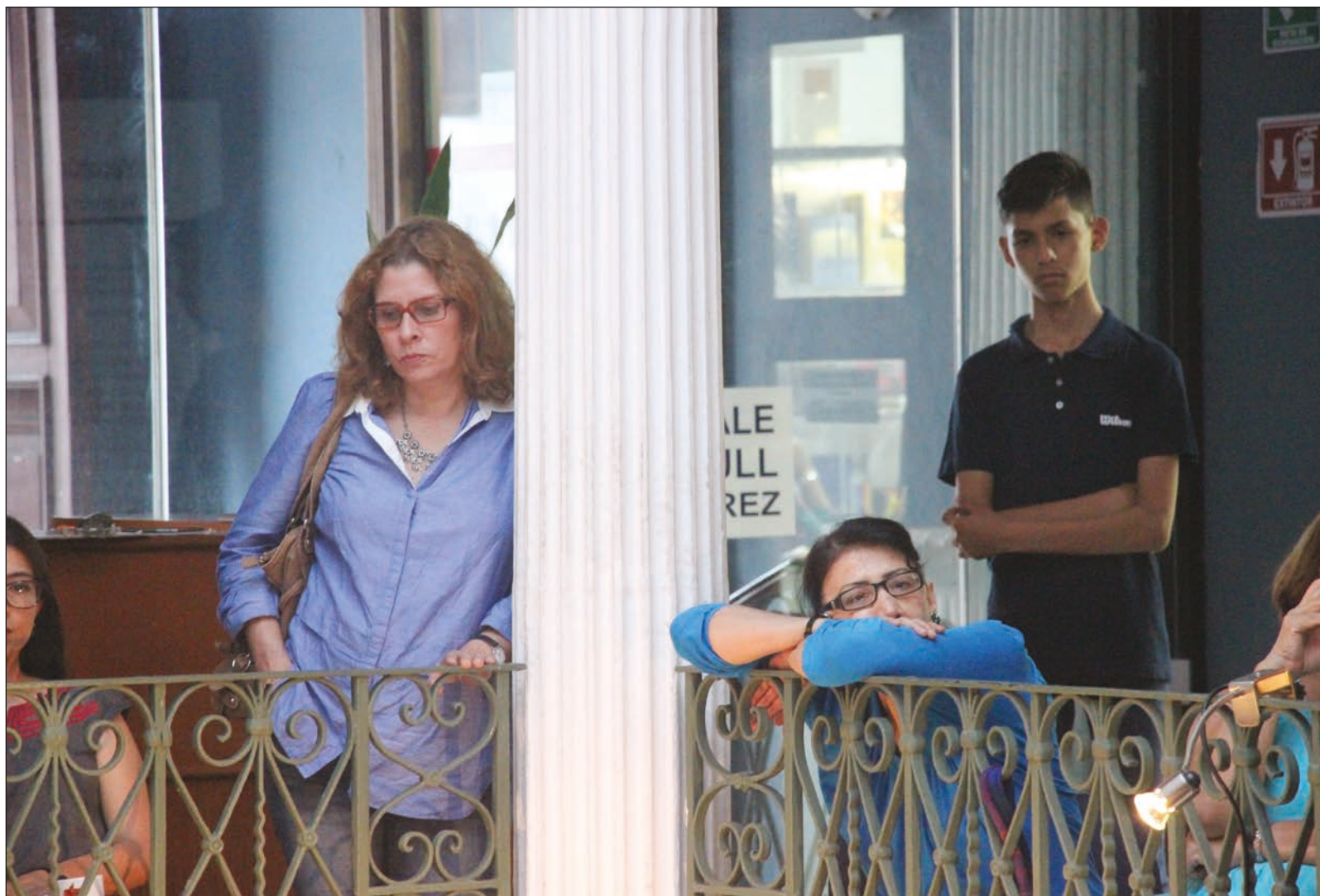
▲ Repensar el papel de los intelectuales en las sociedades actuales es una necesidad imperante.