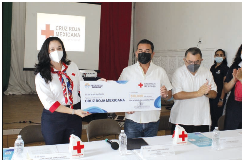
La colecta 2021 lleva por lema “Ayúdanos a tener una batalla justa”.

Asimismo, detalló que tan solo en el puerto se han realizado más de 160 servicios por Covid-19