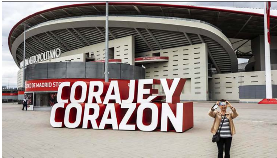
▲ El Wanda Metropolitano, casa del Atlético de Madrid.

El Madrid y el Barcelona no formularon comentarios sobre la decisión de los otros fundadores de abandonar la