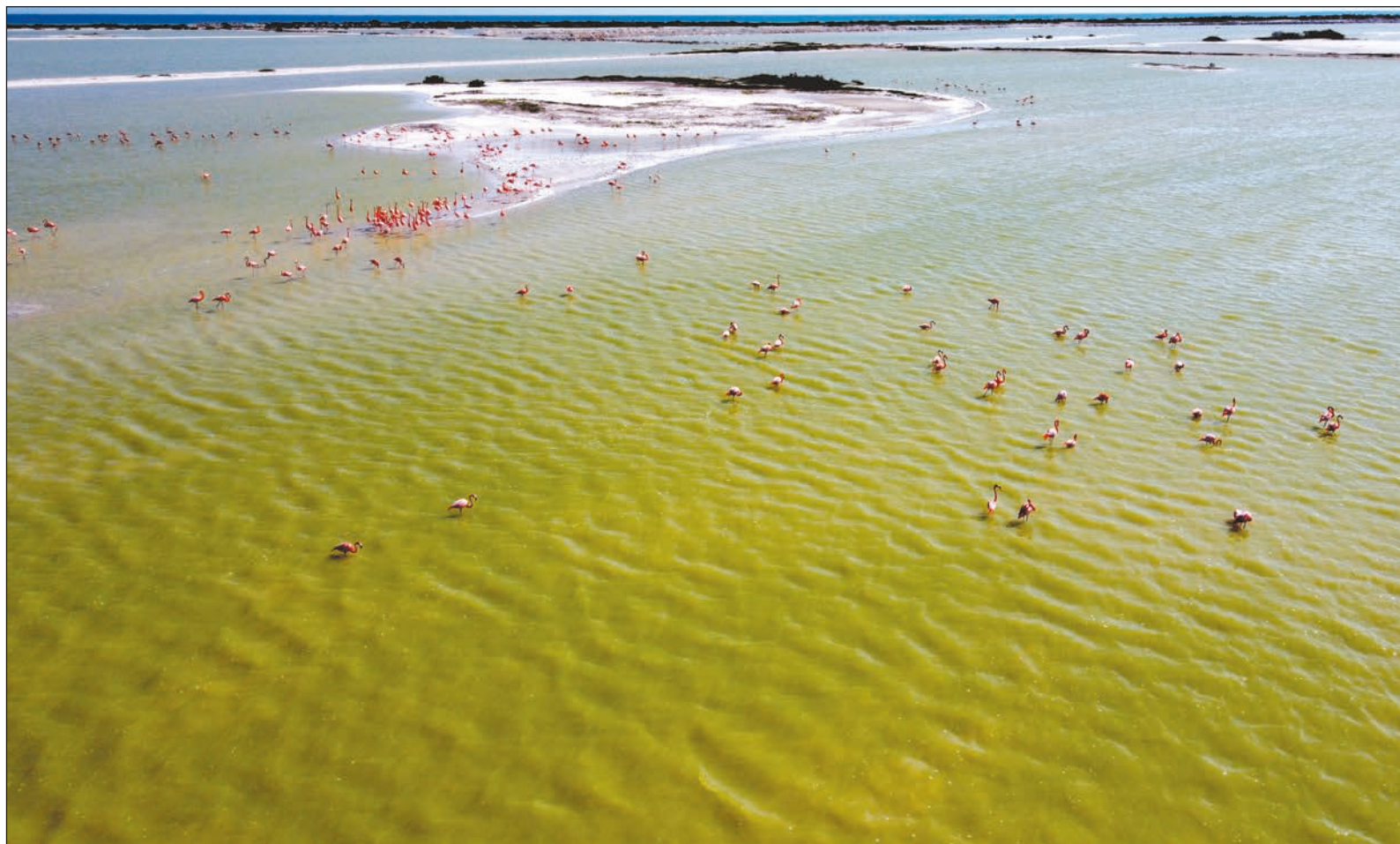
▲ Los sistemas de producción y consumo de Occidente han sobrepasado la capacidad de la Tierra de autorregeneración: los mares están muriendo, sólo extraemos todo lo que en ellos resguarda y sin ninguna responsabilidad.