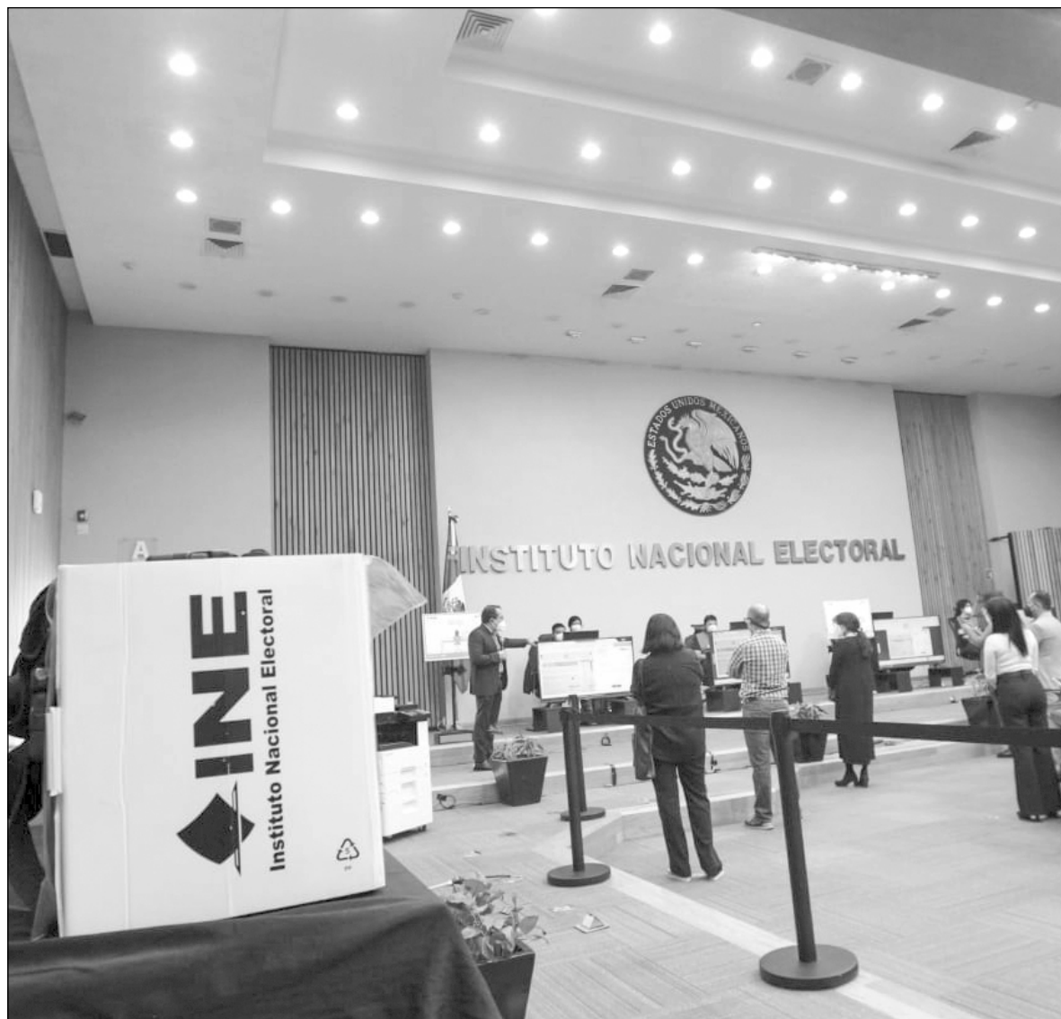
▲ La cuna del INE es neoliberal, y tristemente, sus consejeros han actuado como tal.

SU CUNA ES neoliberal y tristemente han actuado como tales. Así se explica que las violaciones a la legislación sobre financiamiento de los "Amigos de Fox" por muchos millones de pesos, opacos y superiores a lo permitido, recibieron una sanción exigua. Los escándalos de millones de pesos de compra de votos con tarjetas Monex, los sobornos de Odebrecht para la campaña de Peña Nieto, bien gracias.