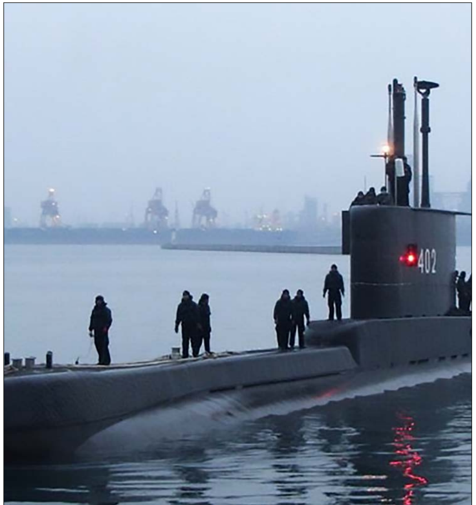
▲ El submarino KRI Nanggala 402 participaba en un ejercicio de entrenamiento.

El país ha enfrentado numerosos desafíos recientes a sus reclamos marítimos, incluidos varios incidentes con naves chinas cerca de las islas Natuna.