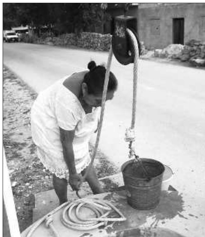
▲ El agua, en la península de Yucatán, es un recurso paradójico: suponemos una buena cantidad disponible, pero se encuentra debajo de las piedras.

Se trata de una reducción importante y de ahí en cuanto a la