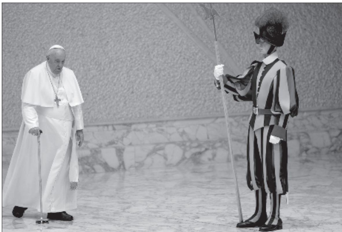
▲ “Of the 132 cardinals eligible to vote in the next conclave, Francis has named 83 – most of them from the South. That is almost 2/3 of the College of Cardinals, nearly enough to vote for a new Pope”.