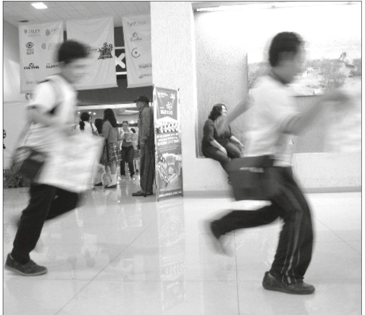
▲ “La jauría seguirá ahí, creando pequeños fuegos con el pedernal del insulto, con la paja de la burla y la exclusión, para convertirlos después en incendios de violencia”.

La directora de la escuela minimiza el hecho: así son los niños , taja, y da por concluido el asunto. No sólo