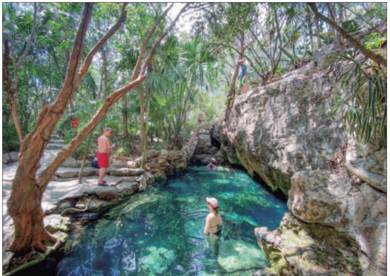
Tulum tiene una de las zonas más importantes en cuanto a extensión del sistema de cuevas inundadas.

“De ahí se tiene un gran reto: dotar y llevar el crecimiento de la infraestructura de drenaje al mismo tiempo que crece la zona urbana, por ello la importancia de que no se permitan más autorizaciones para desarrollo urbano en la zona si no se cuenta con los servicios básicos de infraestructura tanto de drenaje, agua potable y recolección de residuos sólidos”, sentenció López Tamayo.