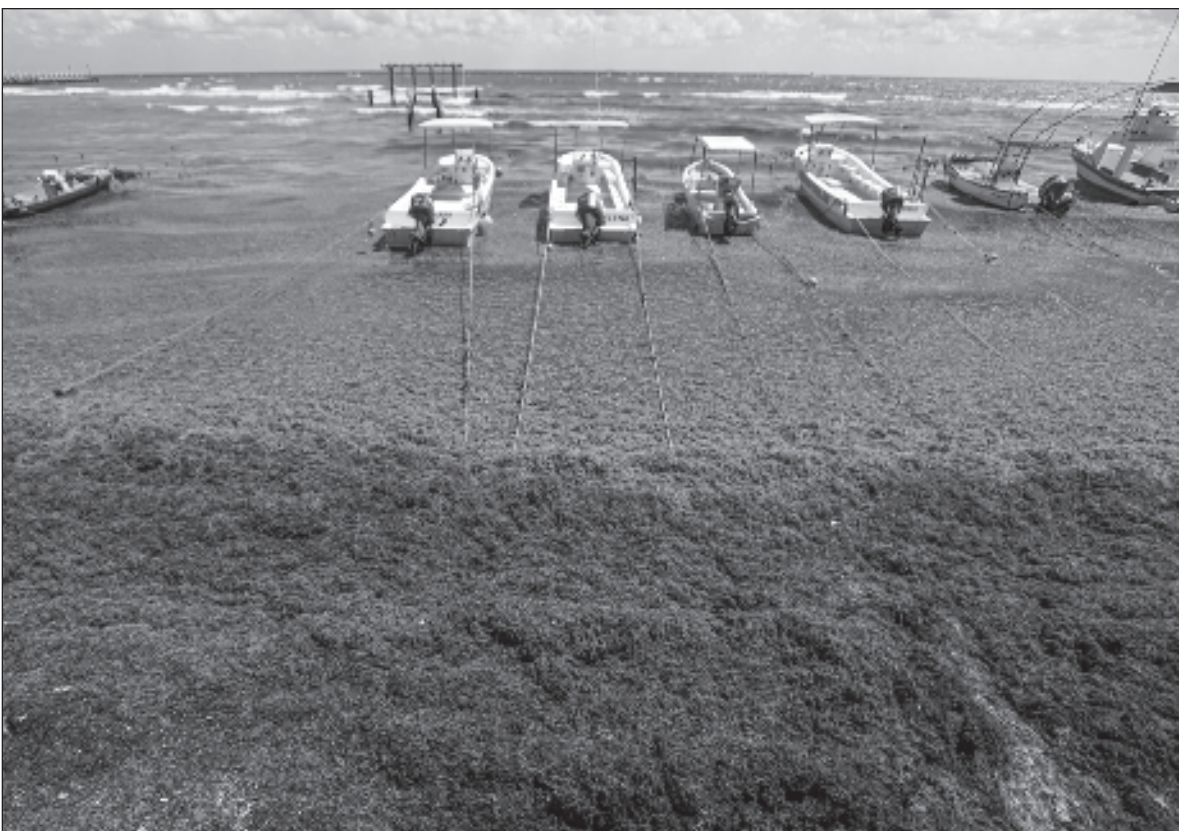
▲ “Por donde se le quiera ver, el tema involucra varios estados nación, sus planes y programas”.

Este espacio no me permitirá en una sola entrega tratar el otro tema mencionado, el de la contaminación por plásticos. Dejo entonces ese tema, que obliga además a hablar de lo que se ha dado en llamar economía circular, para una futura colaboración.