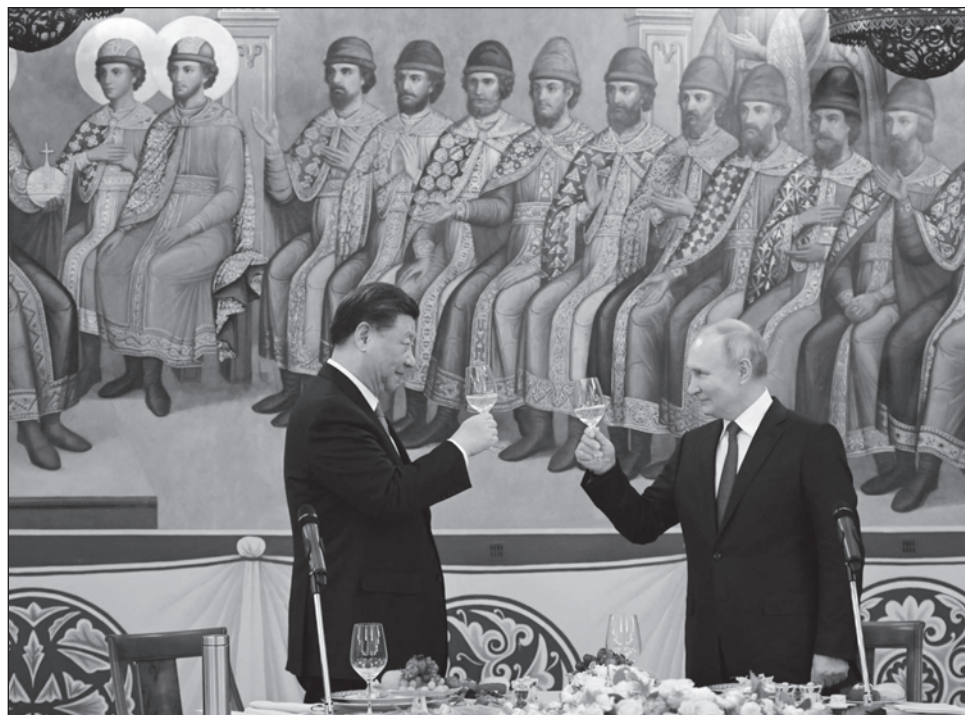
▲ Xi Jinping y Vladimir Putin, presidentes de China y Rusia, respectivamente, sostuvieron una reunión a puerta cerrada para dialogar sobre la situación internacional.

Al dar la bienvenida a Xi, Putin destacó que Rusia y China “tienen muchos objetivos y tareas conjuntas”, mientras el presidente chino subrayó que “la relación bilateral tiene una lógica histórica” cual corresponde a “los vecinos más grandes y socios estratégicos” que son.