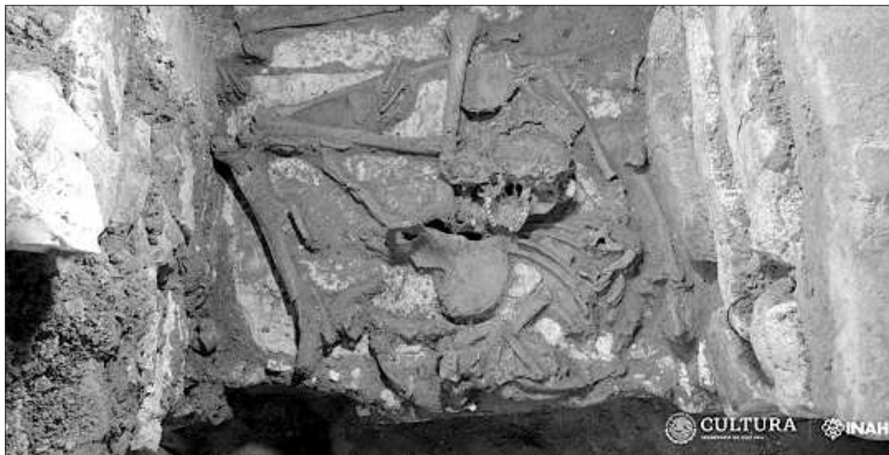
▲ Diego Prieto informó que en la estructura se encontró una cámara funeraria, "donde pudimos ubicar un entierro primario".

"En el entierro primario, el esqueleto fue hallado en