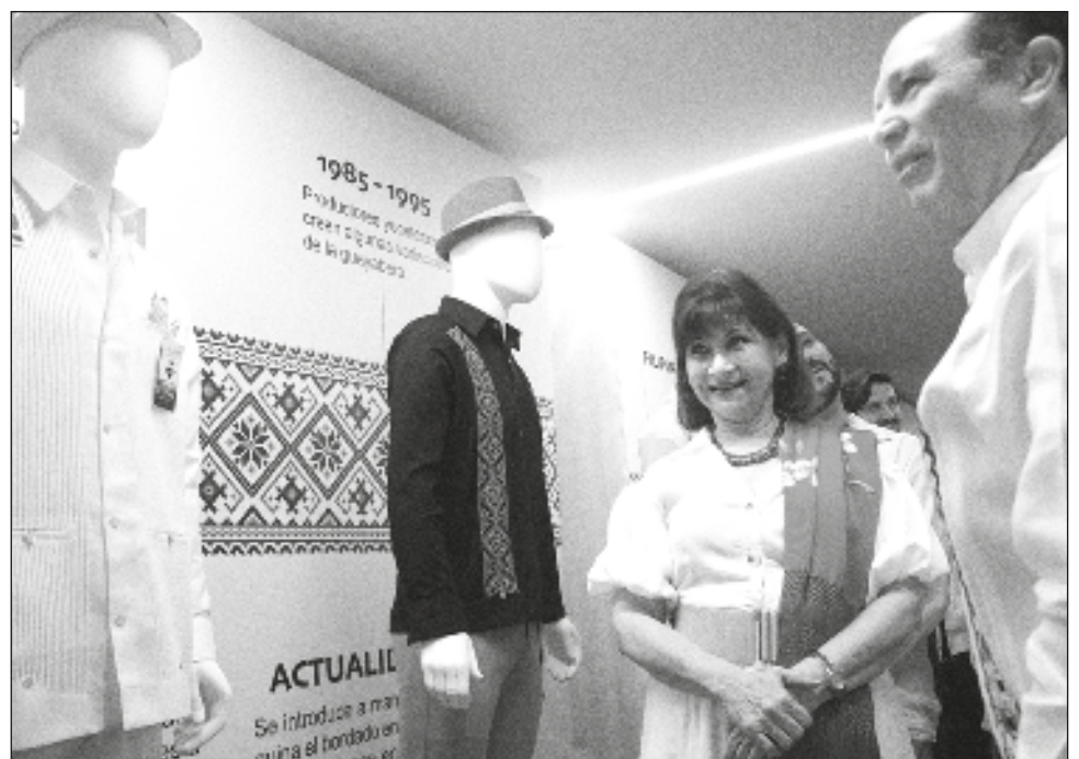
▲ Con un recorrido histórico por la prenda de vestir representativa del estado, la Cámara Nacional de la Industria del Vestido (Canaive) festejó este 21 de marzo el Día de la