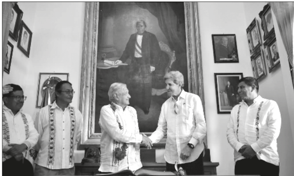
▲ El responsable para el cambio climático de Estados Unidos, John Kerry, señaló que el presidente Andrés Manuel López Obrador es un líder con “sabiduría”.

López Obrador aseveró que fue la dignidad de Juárez y los mexicanos por defender la soberanía nacional lo que alentó a enfrentar la invasión. En su momento,