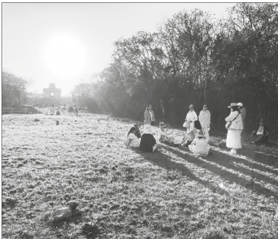
▲ Desde las 5 de la mañana comenzó el acceso de visitantes locales, nacionales y extranjeros, quienes esperaron pacientemente la salida del Sol para llenarse de energía.

Minutos después de las seis de la mañana, al salir el sol, los asistentes observaron su ingreso a cada una de las ventanas del templo y aplaudieron agradecidos por haber podido apreciar este movimiento. Algunos grupos de turistas realizaron rituales como limpiezas, meditación y oración para comenzar con este nuevo ciclo.