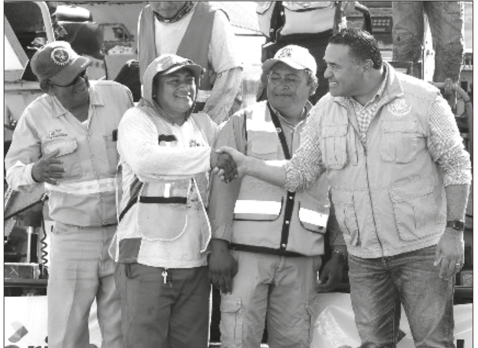
▲ El programa de rehabilitación de vialidades se efectúa de manera paulatina para disminuir afectaciones a los habitantes del municipio.

Las labores se estarán realizando en horario diurno, es decir, de 07:00 a 18:00 horas, por ello se recomienda a la ciudadanía tomar sus precauciones.