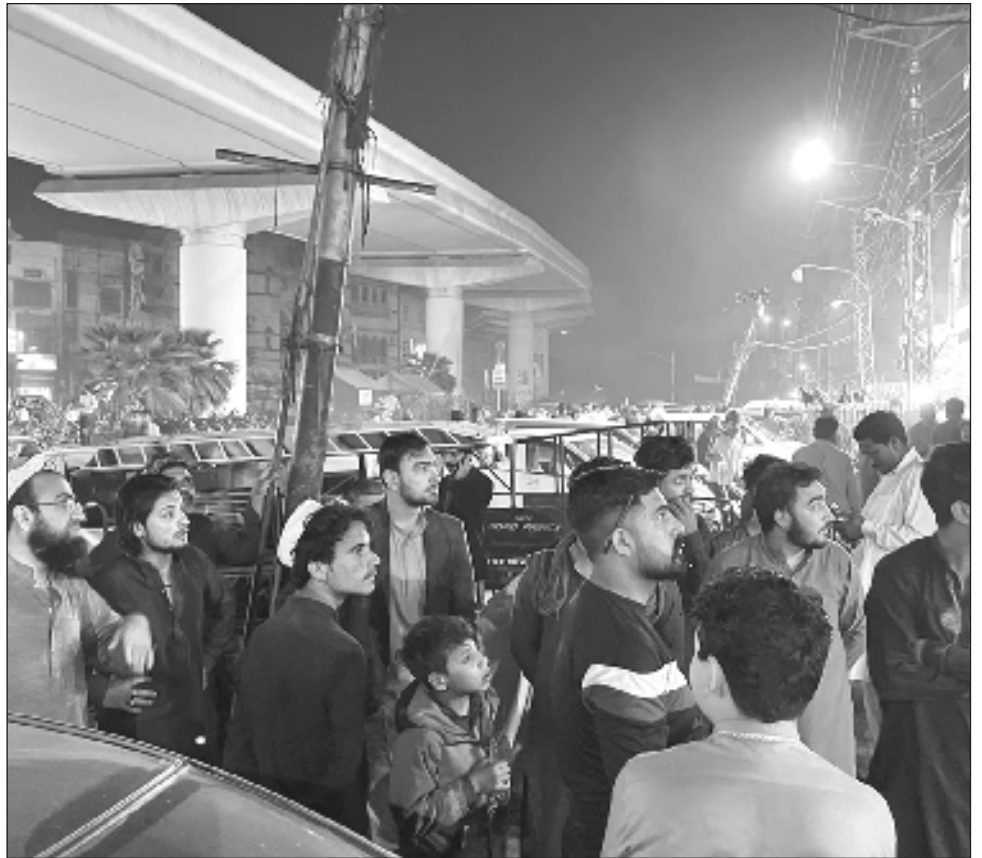
▲ El primer ministro paquistaní, Shahbaz Sharif, pidió a los funcionarios de gestión de desastres que se mantuvieran alerta para hacer frente a cualquier situación.

El país sufrió una de las mayores catástrofes provocadas desde terremotos en 1998 en el norte del país, cuando en febrero dos sismos de magnitud 5.9 y 6 causaron la muerte de unas cuatro mil personas. Pocos meses después otro sismo de magnitud 7 volvió a sacudir la zona.