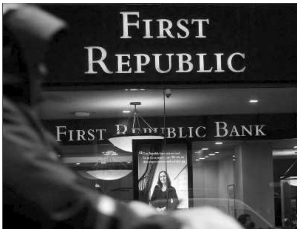
▲ La semana pasada el First Republic Bank, con sede en San Francisco, fue reforzado con 30 mil millones de dólares en fondos captados por 11 de los mayores bancos estadounidenses en un intento de evitar su colapso.

Y la semana pasada un tercer banco, el First Republic Bank, con sede en