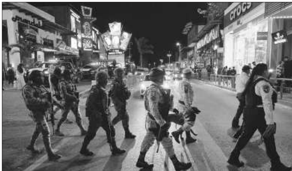
▲ El Círculo Rojo es un operativo de seguridad que se llevará a cabo todos los días a partir de las 22 horas en los diferentes destinos del Caribe Mexicano.

Destacó que a partir de las 22 horas se inicia todos los días el operativo Círculo Rojo.