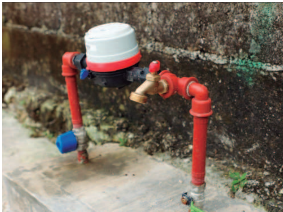
Quintana Roo tiene un avance muy importante en la dotación de servicio de drenaje en sus principales ciudades, reveló el Consejo de Cuenca de la Península de Yucatán.

Existe el problema, por ejemplo, en Tulum, donde hay una planta de tratamiento bastante grande, pero debido a la dinámica