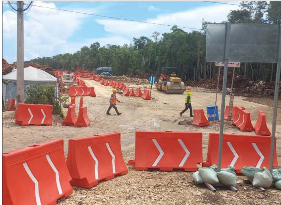
▲ Los trabajadores de la obra ferroviaria federal tienen miedo de laborar por las noches, lo que disminuye la velocidad con la que realizan la construcción.

Yo quiero reconocer que la autoridad está haciendo el mejor de sus esfuerzos para evitar todo ese tipo de situaciones negativas, sin embargo según va creciendo Tulum va creciendo también la delincuencia, va llegando cada día gente no con el interés de venir a trabajar