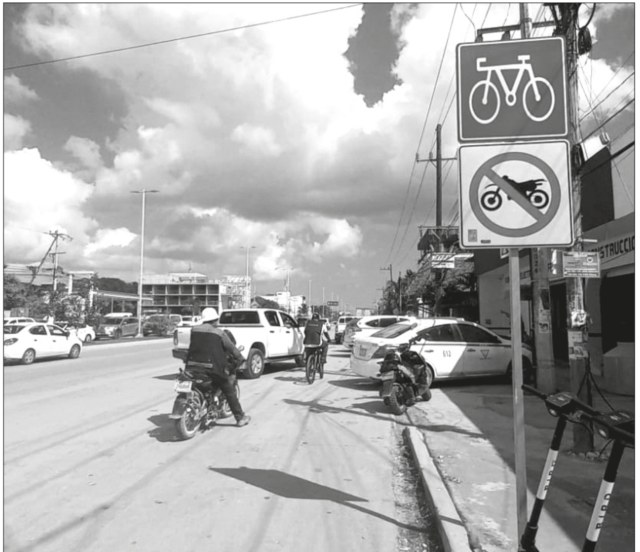
▲ El Plan de Movilidad Activa de Tulum (Pactum), promovido por la Secretaría de Desarrollo Agrario, Territorial y Urbano, consiste en un conjunto de obras con el objetivo de dar espacios más seguros para la circulación.

Mencionó que este plan de movilidad también se podría componer con reglamentos viales a favor de los ciclistas y también con responsabilidades a la hora de circular.