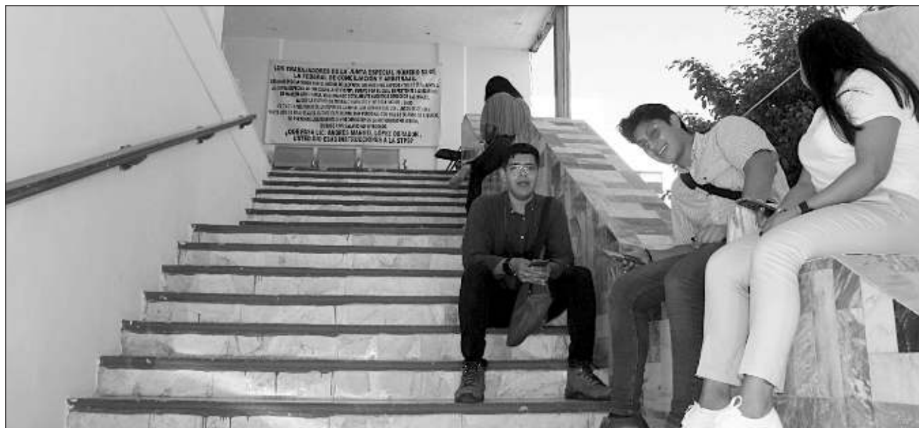
▲ Los abogados laboralistas mantienen guardias a las puertas de las oficinas de la Junta 52, evitando que los expedientes resguardados en este sitio sean movilizados a la ciudad capital, y en espera de una respuesta de las autoridades.

La pretensión de la STPS, recordó Mendoza Reyes, es cerrar la Junta Especial de la Federal de Conciliación y Arbitraje 52, llevándose los expedientes a la ciudad de Campeche, a la Junta 48, "al parecer bajo el argumento que es la capital del estado,