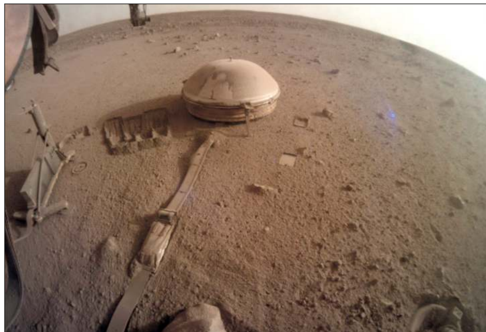
▲ El InSight captó un remolino de polvo marciano y también detectó más de 300 marsismos; es decir, un terremoto en el planeta rojo, incluso provocados por meteoroides.

InSight aterrizó en Marte en 2018 y fue la primera nave espacial en documentar un marsismo, es decir un sismo