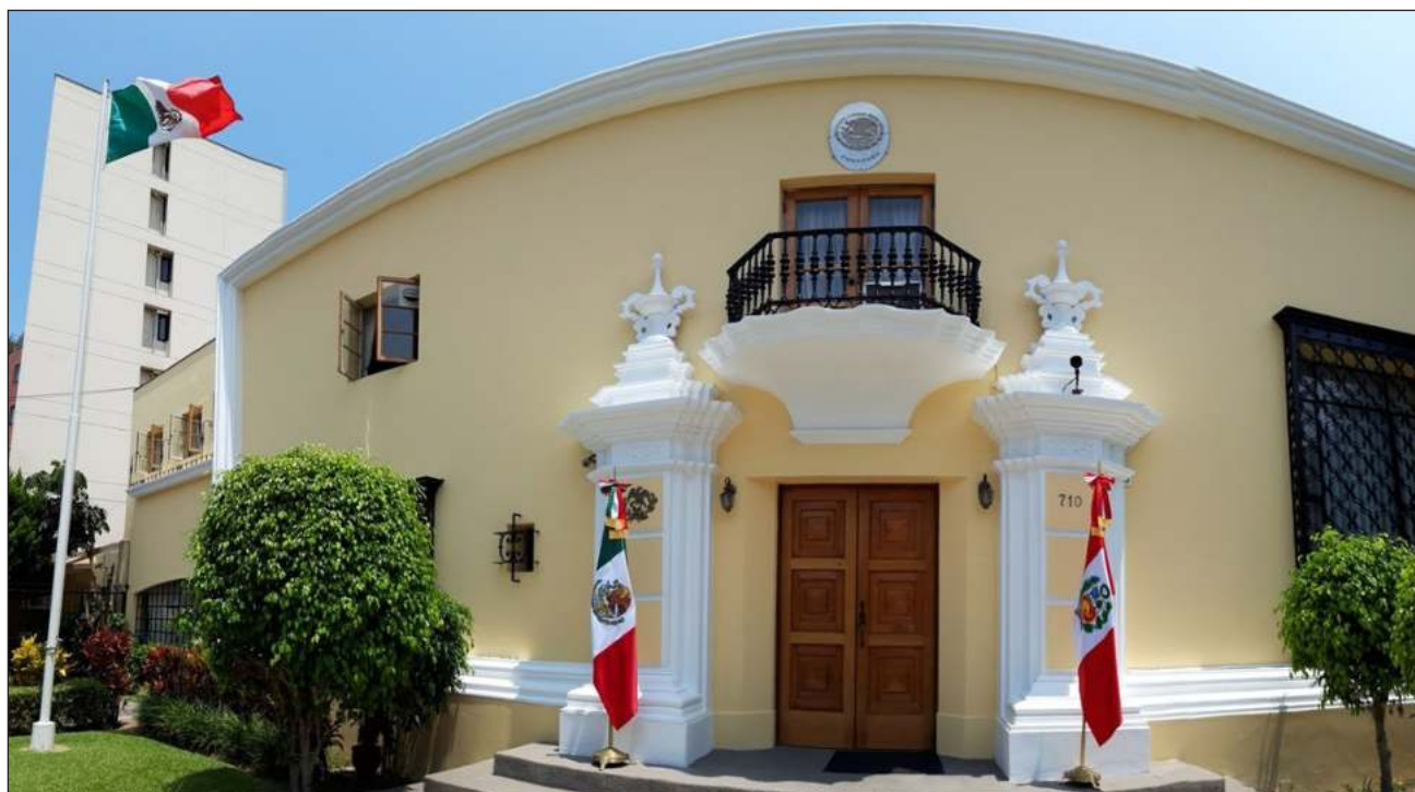
▲ La decisión del gobierno peruano responde a "las reiteradas expresiones" de México "sobre la situación política".

La decisión del gobierno peruano responde a "las reiteradas expresiones" del gobierno mexicano "sobre la situación política del Perú que constituyen injerencia en nuestros asuntos internos", dijo el martes la canciller peruana, Ana Cecilia Gervasi, en un pronunciamiento. La familia de Castillo ingresó este martes a la embajada.