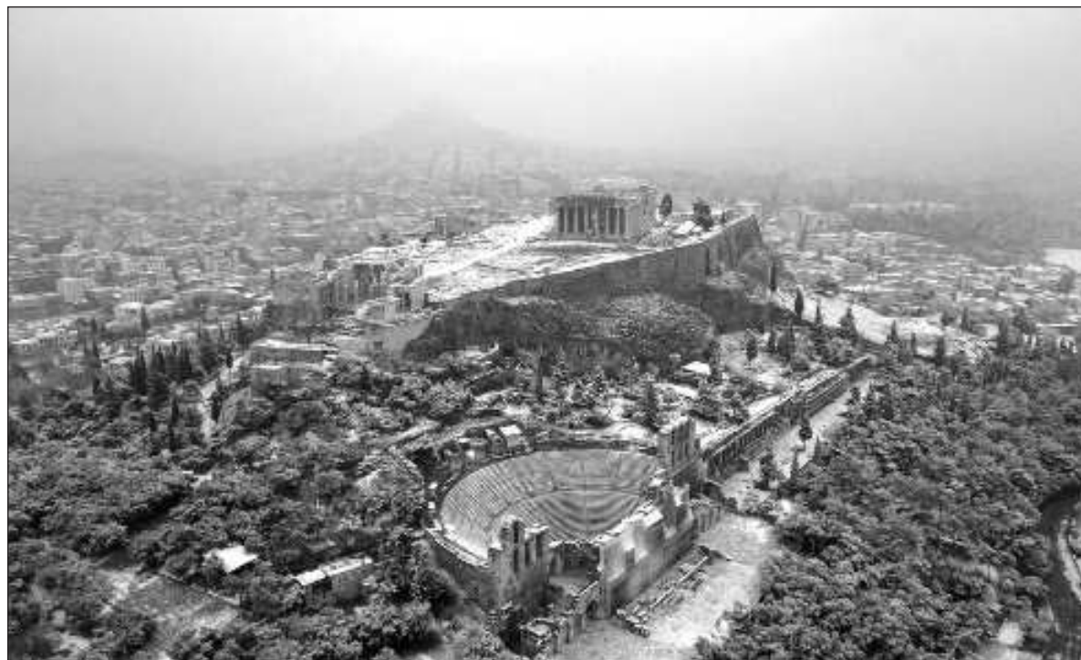
▲ “La paradoja de la democracia moderna estriba en que una elección que se gana por mayoría abrumadora reduce la calidad de la propia democracia en la medida en que la oposición minoritaria entra en un estado crítico que le impide diagnosticarse”.

Y es que la democracia moderna tuvo un origen sectario pues el derecho al voto estaba lleno de restricciones. Los primeros ejercicios democráticos en los Estados Unidos estaban acotados solamente para quienes pagaban impuestos; en Francia se instrumentó el sufragio censitario al que sólo tenían derecho algunos sectores de la sociedad como, por ejemplo, los varones propietarios de bienes inmuebles y/o aquellos que tenían altos niveles de rentas, así como los franceses blancos alfabetizados. Además, algunos sufragios tenían más valor que otros y ello implicaba en muchas ocasiones que unos pocos decidieran por