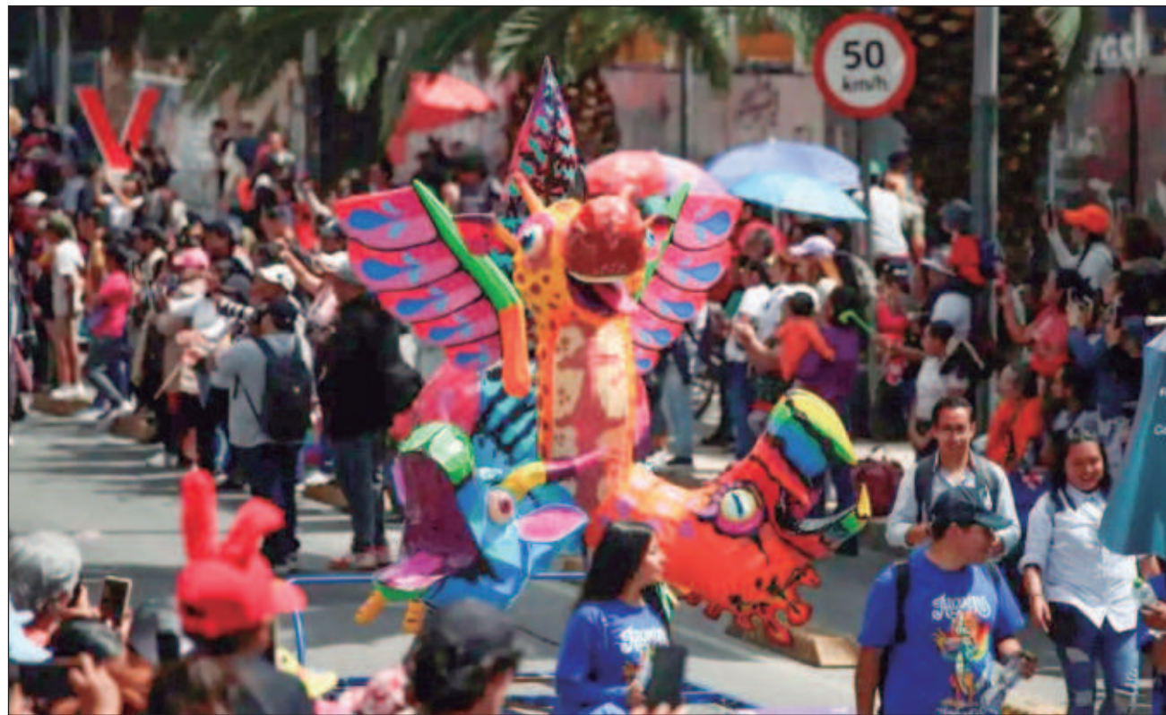
▲ Los ganadores recibirán estímulos económicos de 70 mil, 50 mil y 40 mil pesos, respectivamente.

La Secretaría de Seguridad Ciudadana de la Ciudad de México informó que se desplegaron 745 elementos, entre policías de proximidad, Metropolitanos y personal de la Subsecretaría de Control de Tránsito, que contaron con el apoyo de 68