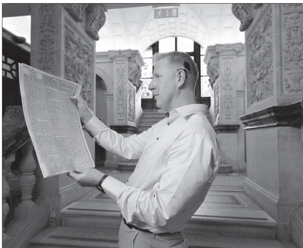
▲ Titulada Gibbet Hill , se publicó en un suplemento navideño del periódico The Daily Mail en 1890, y narra la historia de un marinero asesinado por tres delincuentes.

Este macabro cuento narra la historia de un marinero asesinado por tres delincuentes, cuyos cuerpos fueron colgados como una advertencia fantasmal a los viajeros que pasan.