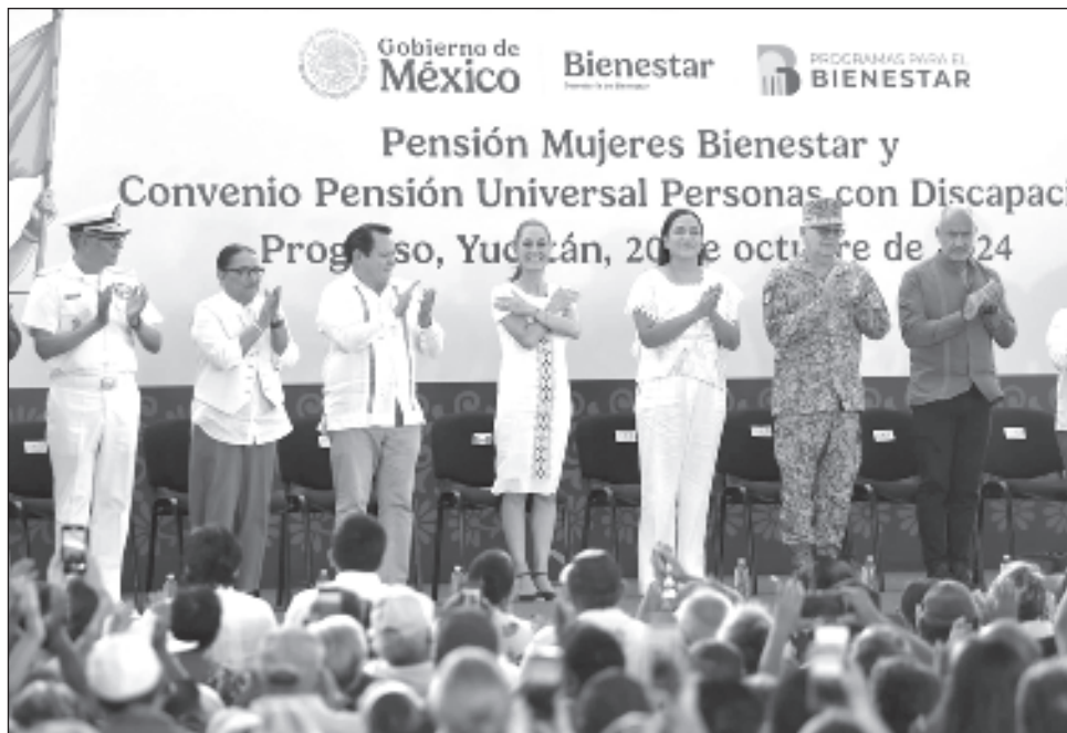
▲ Desde puerto Progreso, la Presidenta firmó el convenio de universalidad de la pensión para las personas con discapacidad, con lo que Yucatán se convirtió en la entidad número 23 en comprometerse a brindar apoyos económicos a este sector.

"Por fin vamos a hacer realidad el Puerto de Altura de puerto Progreso, iniciamos este año el trabajo porque el suelo de esta zona es muy duro y se requieren máquinas especiales para poderlo hacer, pero ya vamos a iniciar. Es un proyecto conjunto entre el gobierno del estado y el gobierno de México; además, el Tren Maya lo vamos a hacer tren de carga, no solamente de pasajeros y va a tener una línea que llegue aquí hasta