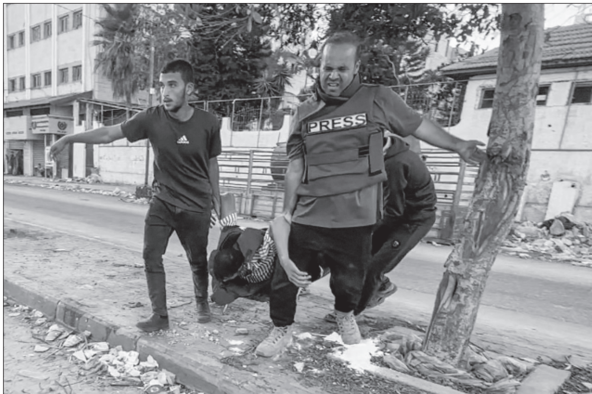
▲ “La eliminación de periodistas de forma sistemática (...) tiene el objetivo evidente de silenciar la carnicería de civiles por parte de las fuerzas de ocupación. Silenciar la sistemática destrucción de hospitales”.

Por otro lado, la censura en redes sociales a niveles propios de una dictadura se multiplican