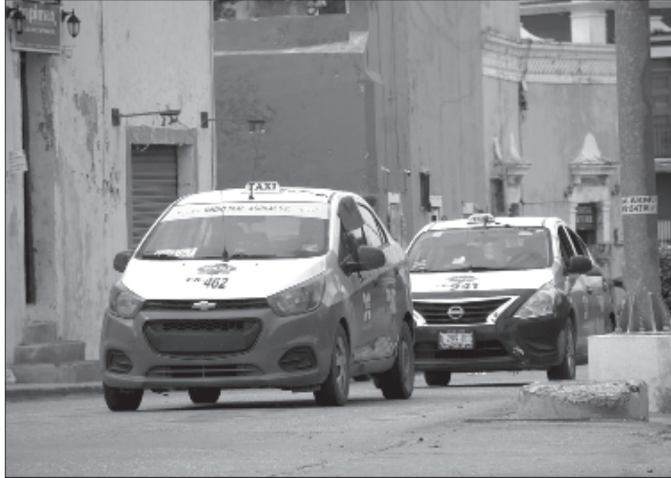
▲ También se ajusta la tarifa de acuerdo a la hora, dando las 23 horas todas las zonas tendrán un ajuste de 10 pesos, es decir, de 50 hasta 70 pesos, según el sitio.

En ese entonces también, los costos de la zona centro,