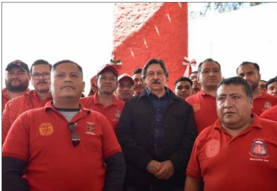
▲ El dirigente de mineros y diputado federal, Napoleón Gómez, aseguró que su “objetivo no es confrontar, sino trabajar en conjunto, desde la razón y la justicia, para construir un mejor futuro para la clase trabajadores de México”.

El diputado de Morena resaltó que el camino por delante no es fácil, cuando existen “pseudo organizaciones sindicales que lo único que buscan es poder político sin beneficio a las bases de trabajadores, pero estamos convencidos de que con constancia y la firmeza de nuestras convicciones, podemos lograr lo que nos proponemos”.