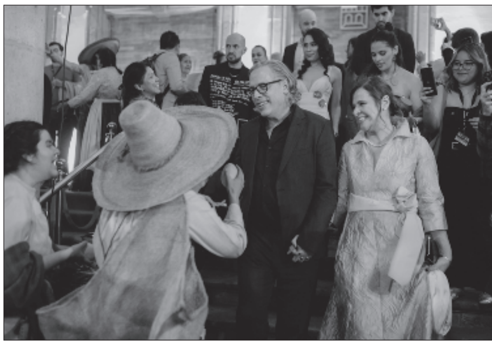
▲ En su debut en la silla de dirección, Rodrigo Prieto confiesa que “existía una especie de presión al querer hacer la película de Pedro Páramo, pero cuando comencé a prepararla y me adentré en el universo rulfiano desapareció y supe que iba en serio”.

Durante mucho tiempo la historia de Pedro Páramo estuvo en la mente de Rodrigo Prieto, desde la juventud que leyó hasta ahora que presenta en el 22 Festival Internacional de Cine de Morelia, la versión cinematográfica de la germinal y seminal obra de Juan Rulfo devenido a un espectral poema visual donde el miedo se convierte en pavor y la búsqueda en redención: “Lo que me llamó la atención en mi primer acercamiento fue la historia misteriosa y fantasmal de Juan Preciado, toda mi vida me ha obsesionado este tipo de historias, desde mis comienzos en el cine”.