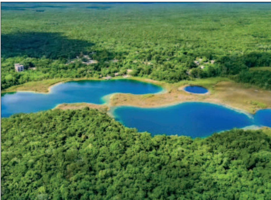
▲ Algunos puntos considerados para designar estas áreas como zonas protegidas, son elementos de biodiversidad que existen y el ecosistema.