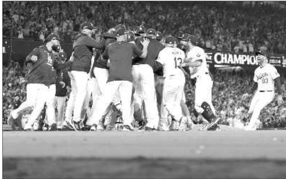
▲ Los Dodgers celebran su victoria contra los Mets en el sexto juego de la final de la Liga Nacional.

Los Dodgers aseguraron su 25o banderín de la Liga Nacional y el primero en casa desde 1988, cuando doblegaron a los Mets en siete