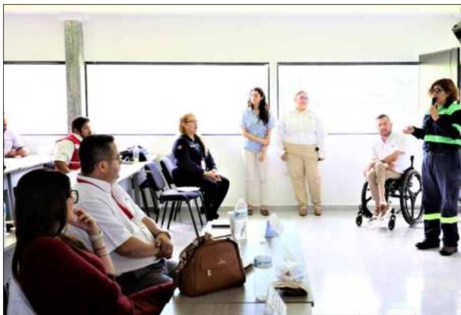
▲ Kekén recibió el reconocimiento por parte del IMSS debido a sus múltiples esquemas alineados a normativas que garantizan instalaciones funcionales para laborar en óptimas condiciones y prácticas favorables para la salud.

Este reconocimiento de validez nacional es entregado por el organismo paraestatal a todas aquellas compañías que cumplan con cinco líneas de acción principales como la prevención de accidentes de trabajo en mano y tobillo; trastornos musculoesqueléticos; enfermedades laborales relacionadas con factores de