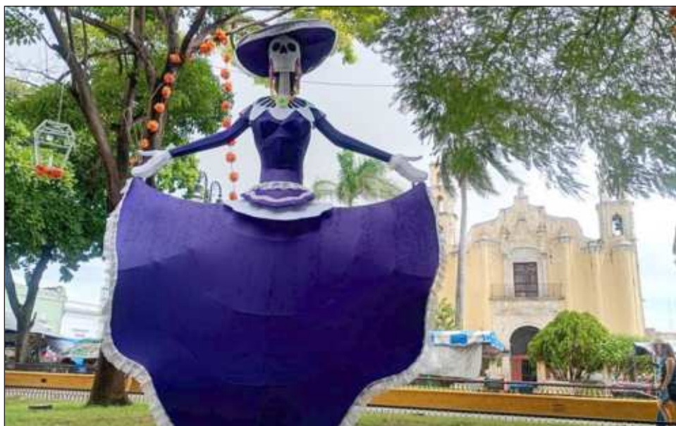
▲ Estas figuras forman parte de los adornos del Día de Muertos, instalados por el ayuntamiento de Mérida y que estarán disponibles hasta el 8 de noviembre.

La cartelera completa está disponible en merida.gob.mx/animas/ .