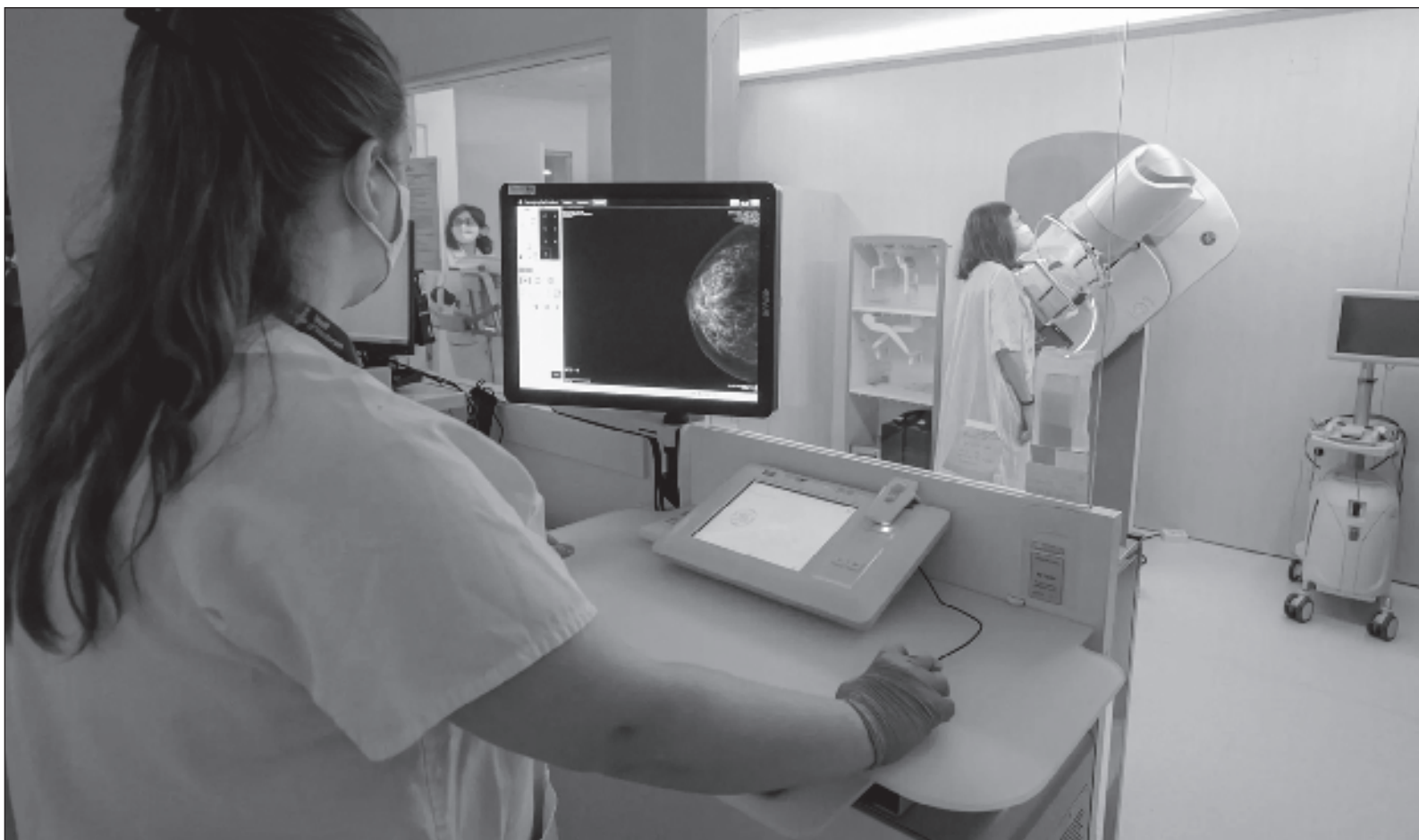
▲ "Con el paso del tiempo y el avance de la ciencia médica, la forma en la que vemos las enfermedades ha ido cambiando, tanto en severidad, riesgo de incapacidad y en muchos casos letalidad, un claro ejemplo de esto está ocurriendo con el cáncer (...) que hoy es posible tratarlo".

*Doctor, educador en diabetes Ingenio Colectivo