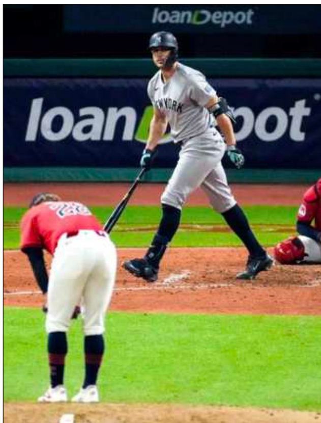
▲ Giancarlo Stanton empató el quinto choque del sábado con un cuadrangular ante Tanner Bibee.

El tercer desafío apretado en el mismo número de noches en el Progressive Field se fue al décimo acto. Austin Wells recibió base por bolas con un aut y Alex Verdugo siguió con un rodado al ca-