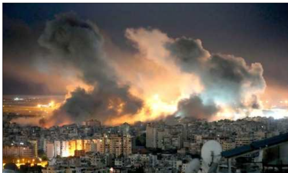
▲ Ataques israelíes en el norte de la Franja la madrugada del domingo dejaron al menos 87 muertos o desaparecidos, bajo el argumento de que Hamas se reagrupó ahí.

Otras 40 personas resultaron heridas en los ataques contra la ciudad de Beit Lahiya, que fue uno de los primeros objetivos de la invasión terrestre israelí hace casi un año. El ejército israelí dijo que había lanzado un ataque preciso contra un blanco de Hamas.