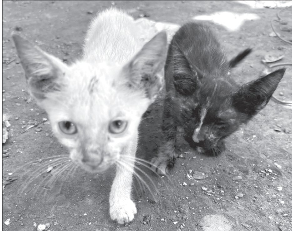
▲ La campaña de esterilización está destinada para animales domésticos en situación de calle, así como a familias con recursos limitados.

La iniciativa ofrece 100 lugares gratuitos para que la población pueda llevarlos sin inconveniente