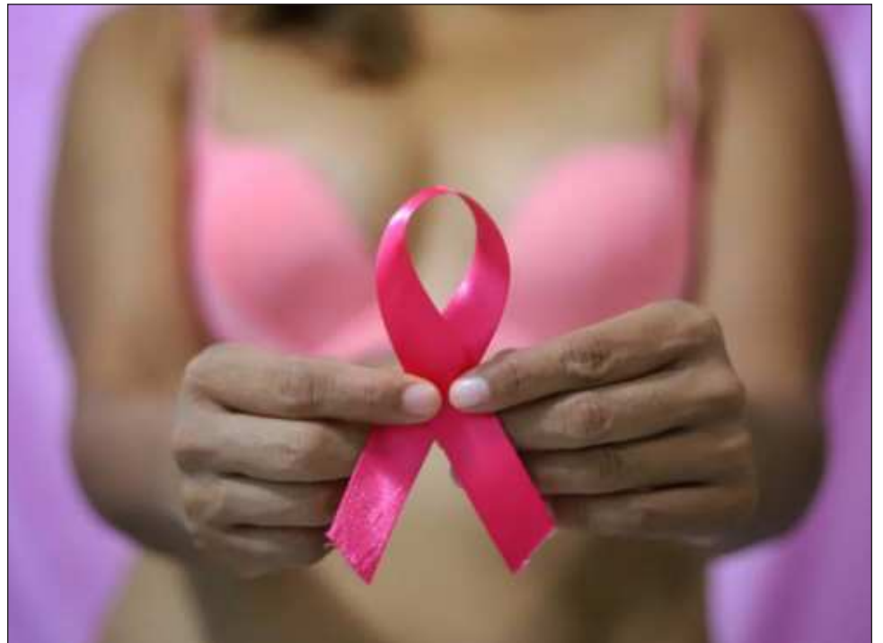
▲ A nivel nacional el año pasado, según las cifras preliminares de las Estadísticas de Defunciones Registradas, fueron contabilizados 89 mil 633 fallecimientos debidos a tumores malignos en personas de 20 años y más.

A medida que aumentó la edad, también lo hizo la tasa de mortalidad. Por cada 100 mil mujeres de 85 años y más, se produjeron 85.7 defunciones.