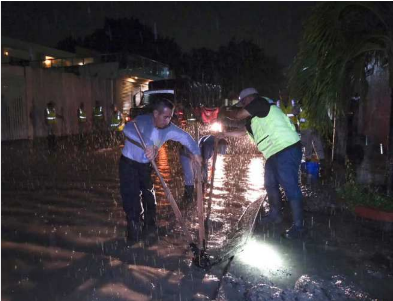
▲ Cuadrillas de trabajadores laboran para mantener las calles secas y transitables.

La alcaldesa anunció la puesta en marcha de proyectos como Quinta Sostenible, que contempla el mejoramiento de esta importante vialidad turística, los comités de vigilancia, a instalarse en la misma Quinta Avenida; y Mercado de la 10, para revitalizar este inmueble; la plataforma Capaces, para la capacitación integral, y la app Let's Playa, para la difusión de experiencias y promoción turística.