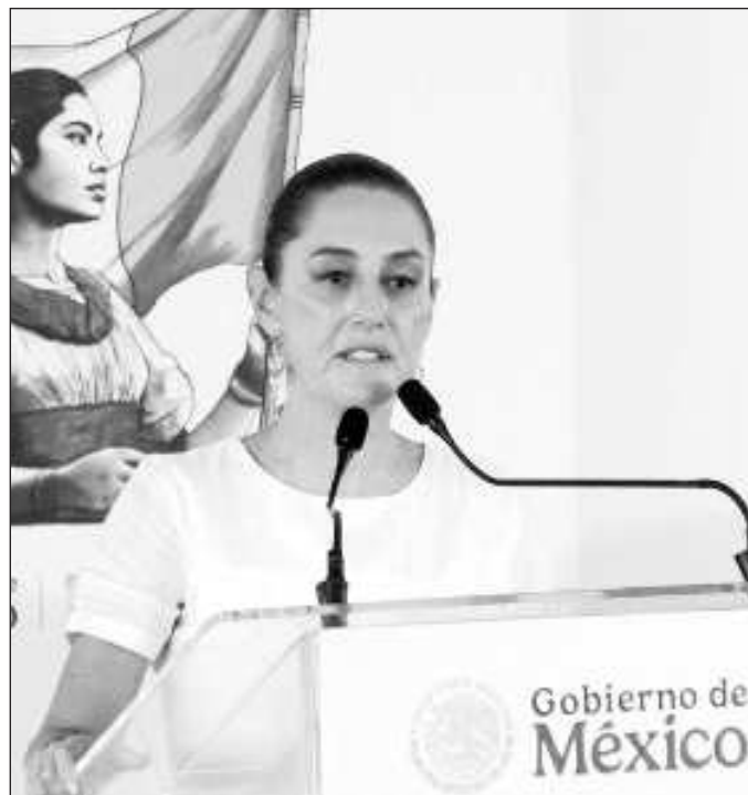
▲ En su primera visita a la península ya como titular del Ejecutivo federal, Sheinbaum Pardo delineó en Yucatán y Campeche los respectivos planes a realizar.

Otra novedad es la ampliación de la oferta educativa, con las universidades Rosario Castellanos y de la Salud; una medida que fomentará el arraigo de los jóvenes en Campeche. A mediano plazo, la creación de estas opciones de educación superior deben frenar la migración del talento juvenil de la entidad hacia otros estados, siempre y cuando las nuevas instituciones posean un nivel de exigencia y calidad de los egresados semejante al de las opciones a las cuales recurren los campechanos hoy en día.