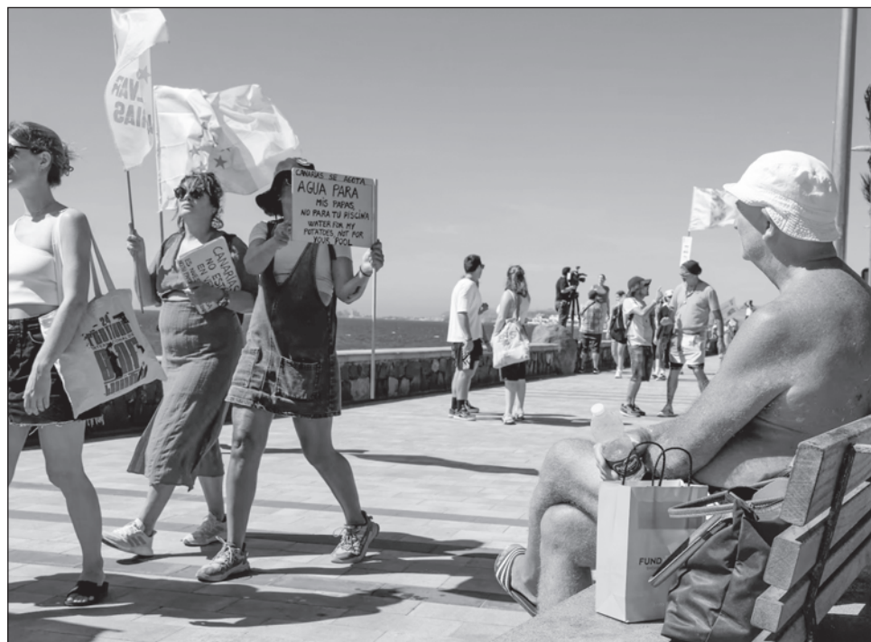
▲ Los manifestantes denuncian un modelo de turismo de masas que favorece a los inversores, priva a los residentes locales de vivienda y les obliga a realizar trabajos mal pagados.

Los manifestantes denuncian un modelo de turismo de masas que, según ellos, favorece a los inversores a expensas del medioambiente,