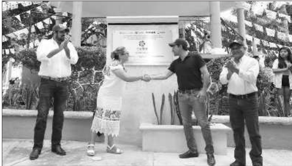
▲ Ante la alcaldesa anfitriona, Martha Eugenia Mena Alcocer, el gobernador Mauricio Vila anticipó que con esta designación aumentará la afluencia de visitantes, generando una derrama económica que se distribuirá entre toda la población del municipio.

"Cuando vengan los turistas, van a comer, van a comprar artesanías. Quienes hacen hipiles, van a vender más; seguramente los hote-