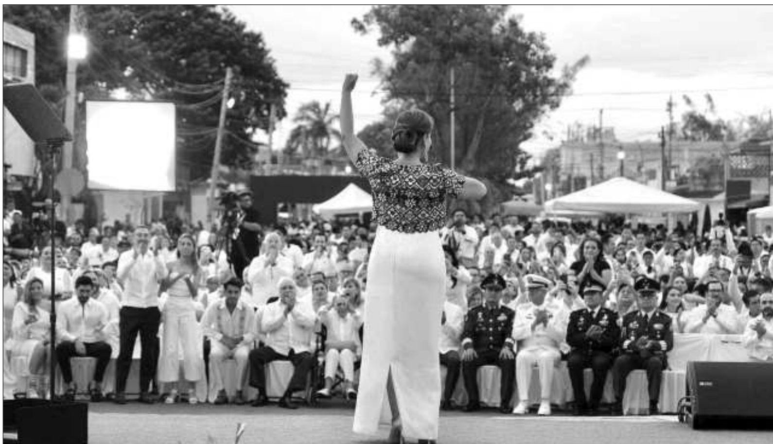
▲ "Los informes de la gobernadora y presidentes municipales dieron cuenta de bonanzas y tranquilidad que no se sienten entre las mayorías".