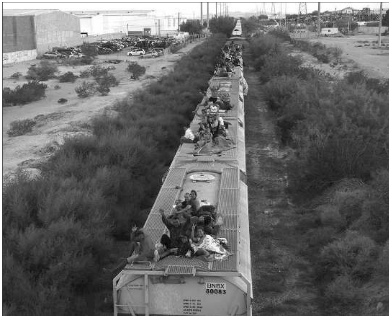
▲ Cuestionado sobre la decisión de Grupo México, el presidente Andrés Manuel López Obrador consideró que era positivo que se detuvieran los trenes para proteger a los migrantes, refiriendo que también su gobierno está trabajando en el tema.

Sin embargo, consideró que era positivo que se detuvieran los trenes para proteger a los migrantes, refiriendo que también su gobierno está trabajando en el tema migratorio.