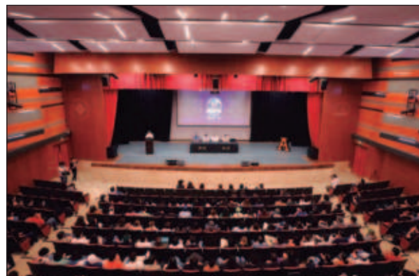
▲ Este congreso es único en su tipo en todo el sureste mexicano, organizado por alumnos de la Anáhuac.