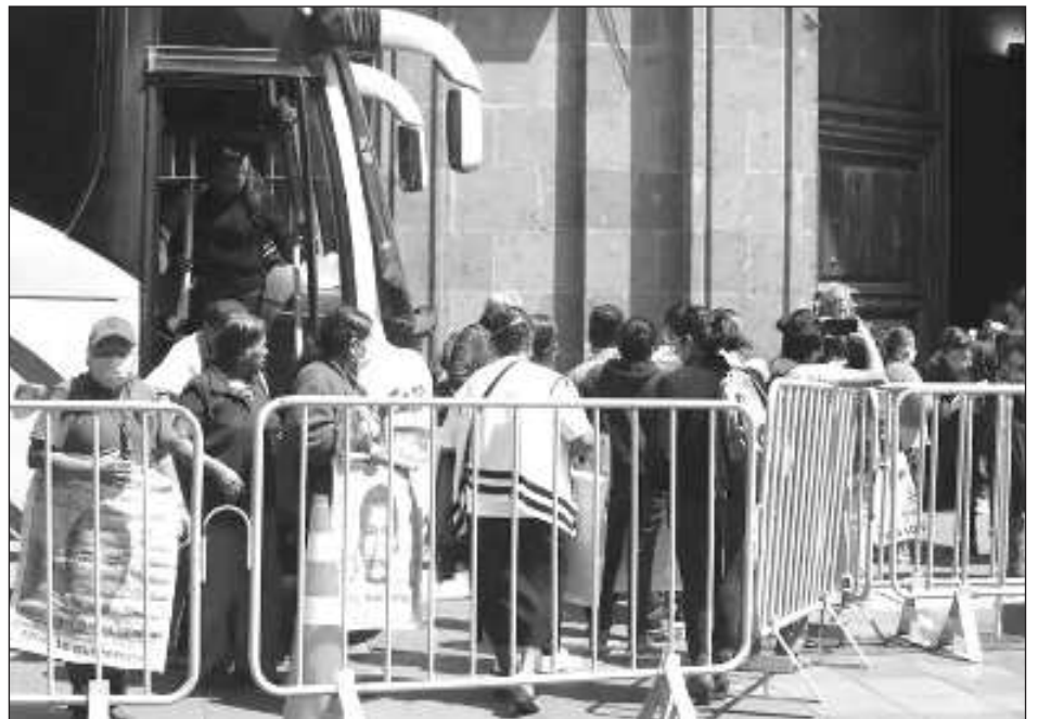
▲ Los familiares insistieron en que su prioridad es acceder a los documentos que el Ejército no ha proporcionado sobre la desaparición de los jóvenes, ocurrida hace casi nueve años.

Vidulfo Rosales ejemplificó que entre la información faltante está la interceptación telefónica que se hizo a un jefe policiaco y a un jefe del grupo delictivo Guerreros Unidos, que hizo del Ejército a las 10 de la no-