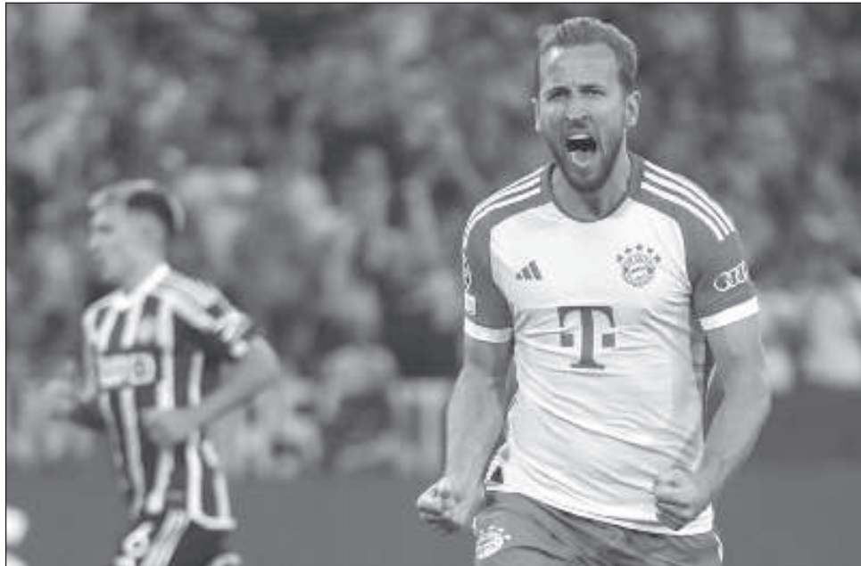
▲ Harry Kane, tras anotar el tercer gol del Bayern ante el Manchester United.

donde quería, en Madrid. Su diana a los 94 minutos significó el triunfo de 1-0 sobre el debutante Unión de Berlín.