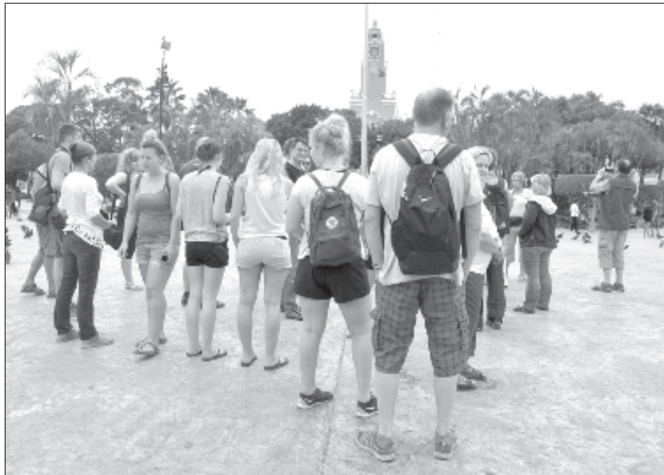
▲ El presidente de la Asociación Mexicana de Hoteles en Yucatán indicó que Mérida fue el principal destino del estado y el que más ocupación alcanzó, con 61 por ciento.