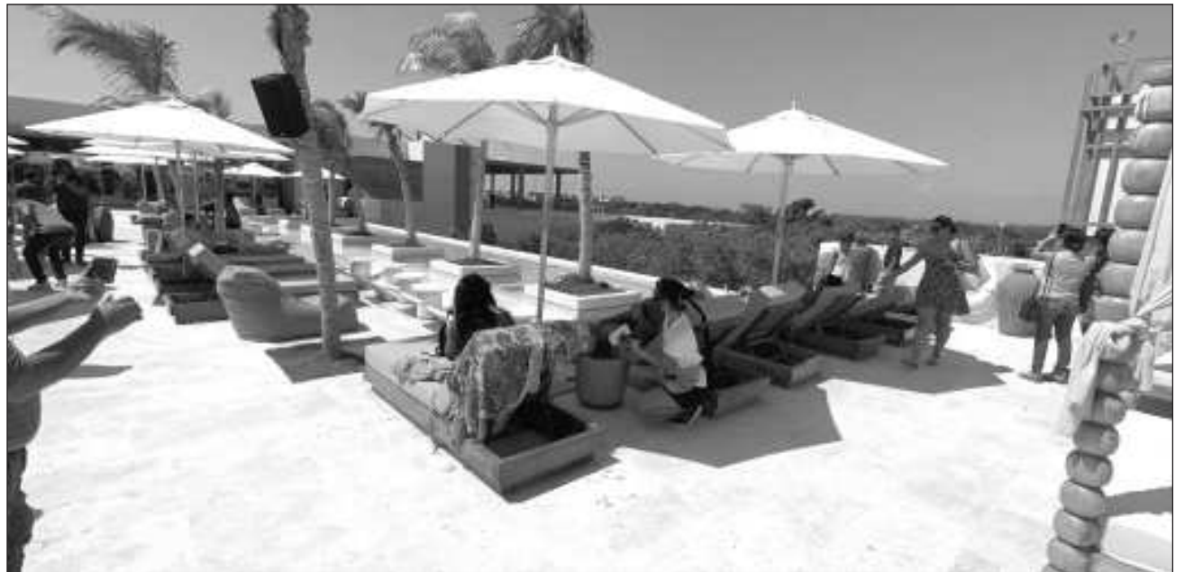
▲ El gerente general del hotel Aloft Tulum agregó que en este periodo complicado del año están atravesando un proceso de análisis y capacitación, pero a su vez están en espera del turismo para evaluar mejor sus áreas de oportunidad.

“Mira evidentemente pues la oferta y demanda ocurre en todas las plazas,