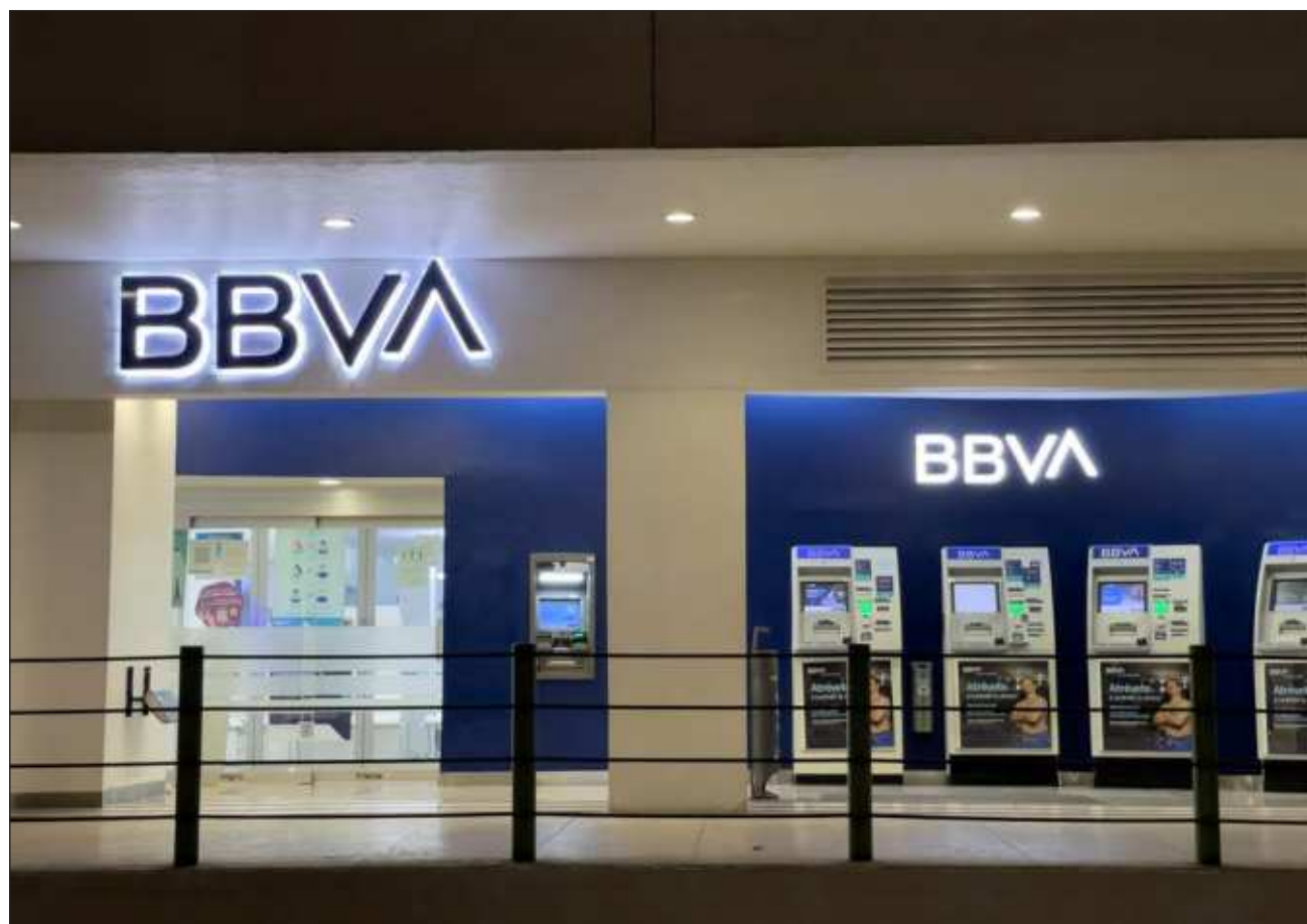
▲ Con más de 21 millones de clientes, BBVA es el banco de mayor presencia que opera en el país.

El banco precisó que si bien, las llamadas que realiza con objetivos de prevención de fraude representan solamente 0.06 por ciento de las 200 millones de transacciones que se realizan con sus tarjetas, la función se pone a disposición de sus clientes para reforzar su seguridad y que los clientes