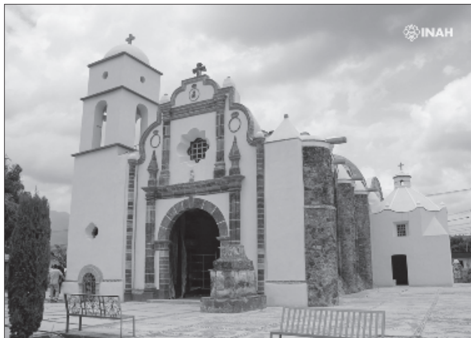
▲ De acuerdo con el director del INAH, existe el compromiso de que la restauración de todos los inmuebles y los bienes muebles afectados termine este año.

Agregó que la Secretaría de Cultura realizó convenios para que algunos estados asuman y ejecuten obras con supervisión y asesoría del instituto, como en Puebla, Morelos, Ciudad de México y Tlaxcala; además, se están realizando trabajos que si bien