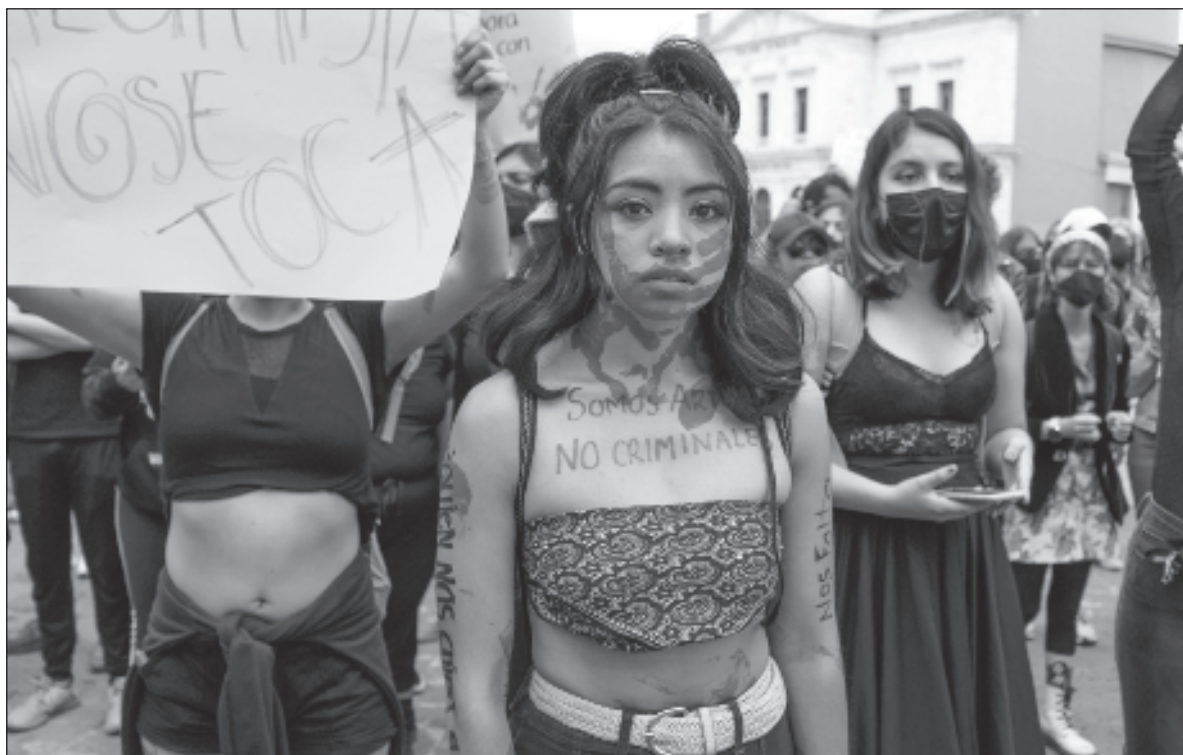
▲ “Sería muy difícil en este punto desmentir a las víctimas después de que frente a decenas de medios y cámaras, directivos e investigadores agredieron sin miramientos a los que dicen proteger en las aulas”.

Pero aún con ejemplos de lo que es una mala gestión de conflictos, este martes 19 de septiembre, la Universidad Autónoma del Estado de Hidalgo decidió hacer oídos sordos a las demandas de sus estudiantes contra el abuso y acoso de profesores y directivos del Instituto de Artes (IdA) y mandó a toda la fuerza