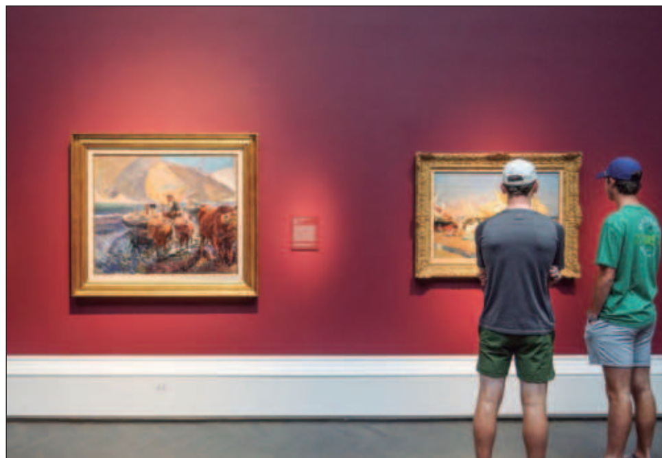
▲ La muestra, integrada por 15 obras, permite hacer una nueva lectura de esa relación de Sorolla con el mar, pero no sólo del Mediterráneo de su infancia, juventud y edad adulta, sino también de sus viajes recurrentes a las playas del mar Cantábrico, a pueblos o ciudades como Zarauz.

De las piezas que reunió la Fundación Mapfre, son muy poco conocidas y