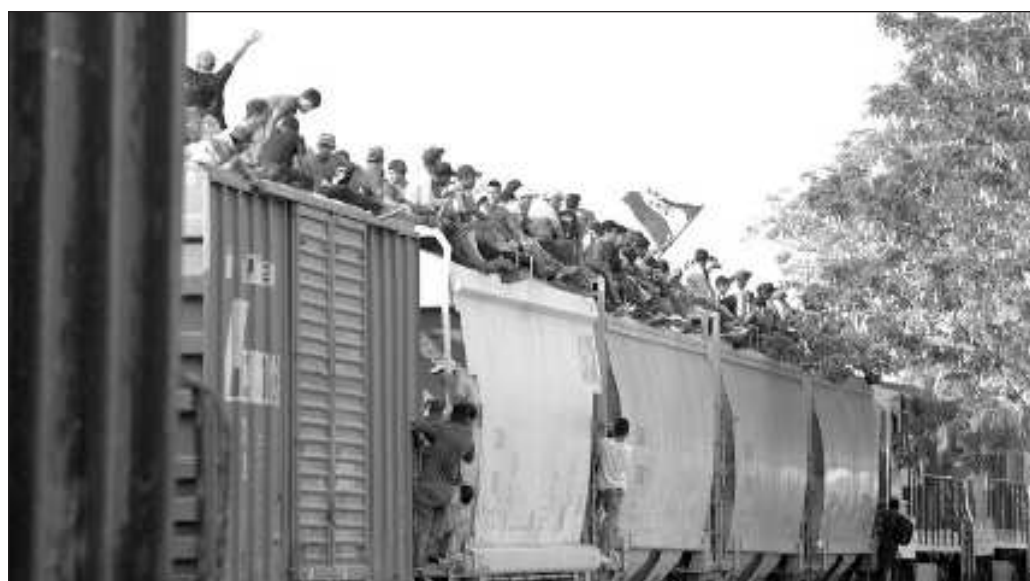
▲ En estos días ha llamado la atención que Ferromex, empresa de Grupo México haya anunciado que "se ve obligado a suspender movimiento de trenes de carga para proteger la integridad de personas migrantes".

Si al gobierno mexicano le interesan los migrantes, como sostuvo el presidente López Obrador en su conferencia de este miércoles, tendríamos que ver una política de acompañamiento por parte del Instituto Nacional de Migración, la Guardia Nacional y el sistema de salud; una preocupación real por el bienestar de esta población que por ratos recibe atención, cuando lo habitual es que sea invisibilizada.