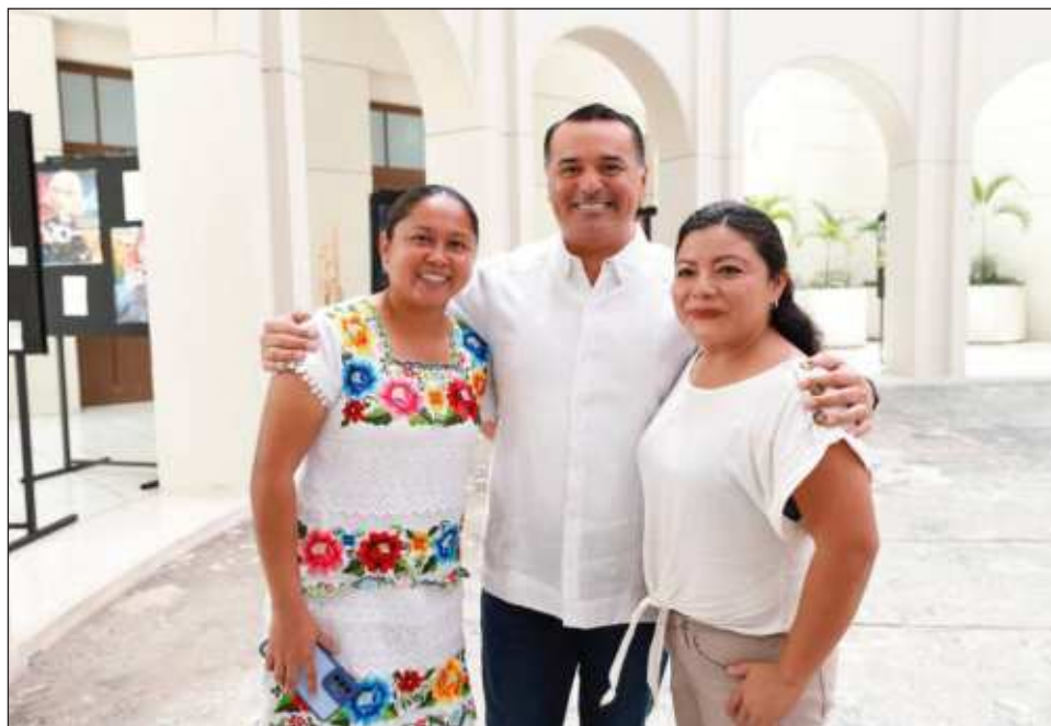
▲ La Unidad Municipal de Mediación ha atendido mil 165 asuntos de mediación, con un impacto en 4 mil 924 personas de Mérida y sus comisarías.