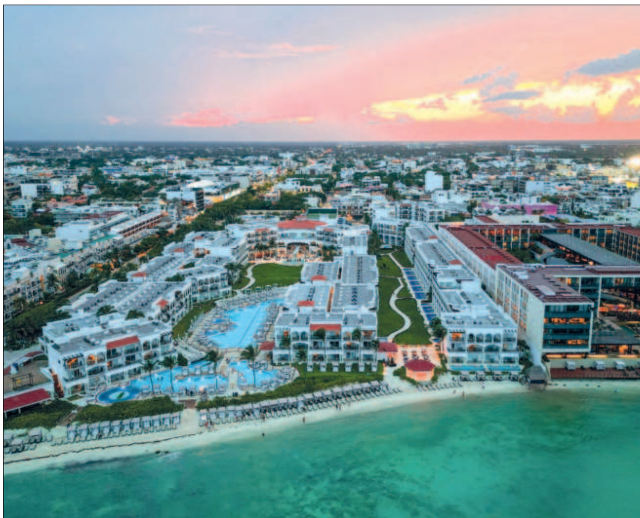
▲ La entidad captó 234 millones de dólares en este concepto, siendo los complejos hoteleros, pensiones y casas de huéspedes, departamentos y casas amuebladas con servicios las ramas con mayor monto de IED.