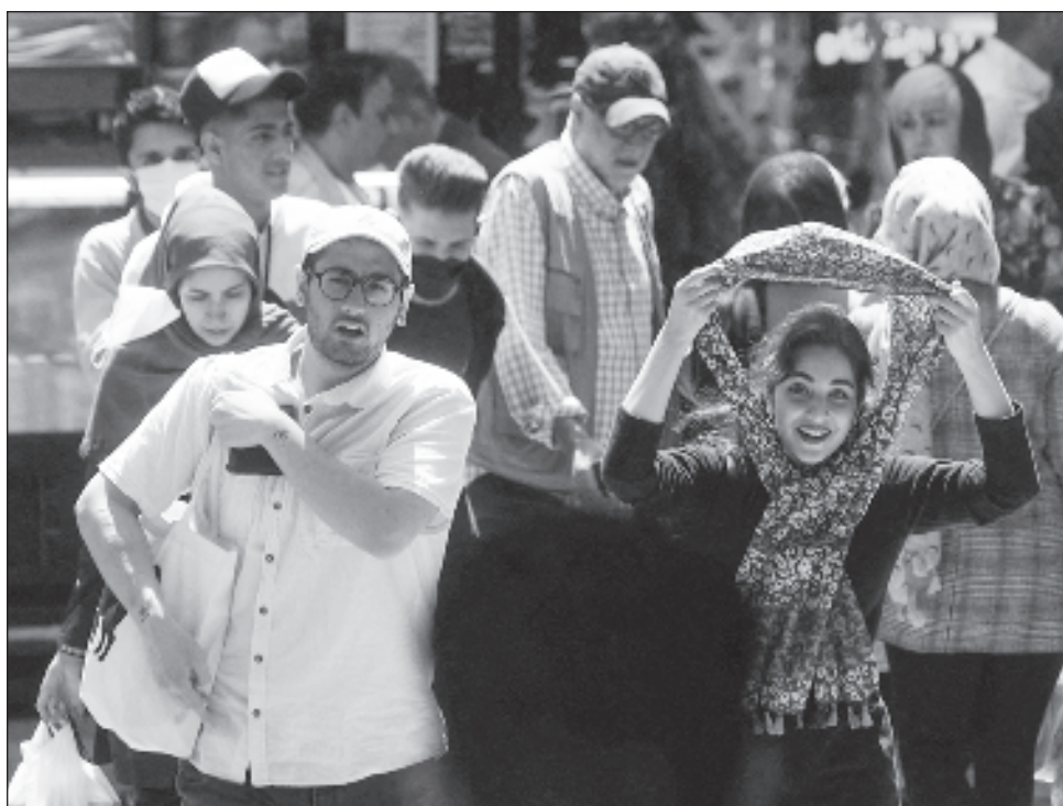
▲ Toda persona que cometa el delito de no llevar velo o llevar "vestimentas inapropiadas" será condenada a una pena de prisión de cuarto grado, es decir entre 5 y 10 años.

Diputados aprobaron la implementación del proyecto sobre el hiyab y la castidad