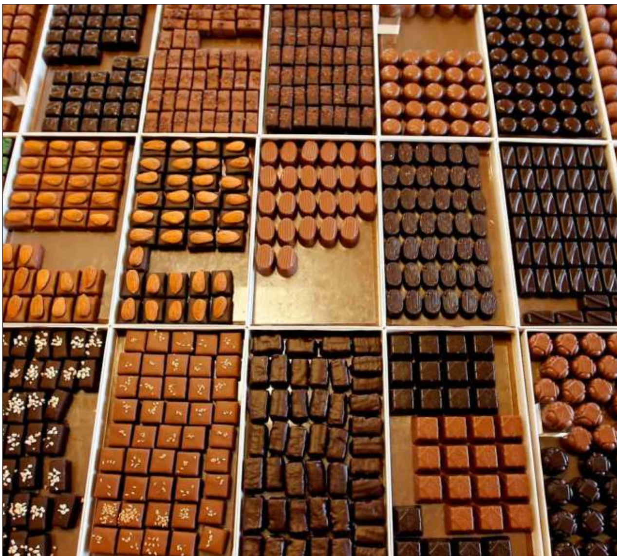
▲ Ti' xookile', ila'ane' táankelem máake' táan u p'áatal tu kaajal ti'al u meyajtik le ki'iki' ba'ala'.

Beey túuno' Páramo tu ya'alaje', u Méxicoe' ti' yaan tu kúuchil 14 ichil máaxo'ob meyajtik kakaw ichil tuláakal yóok'ol kaab. Ts'o'okole' ti' lu'umo'ob je'el bix Tabasco, Chiapas, Guerrero yéetel Oaxaca', ts'o'ok u chan nonojtal u meyajta'al kakaw yéetel mu'uk'an yanik tak tu táan moniliasis (kuuxum multik u che'il