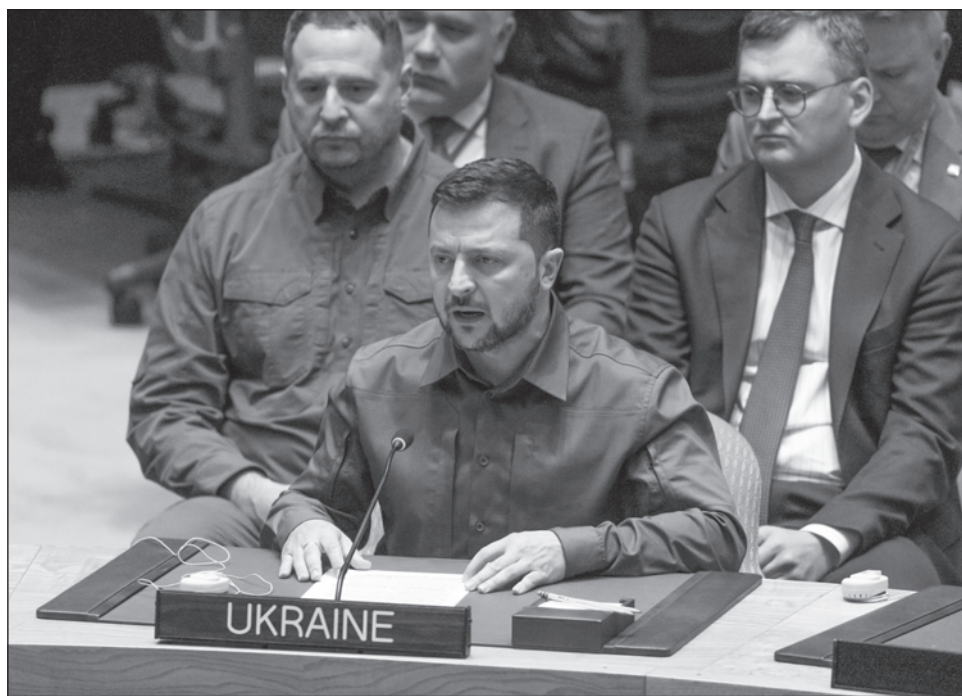
▲ Ataviado con su uniforme militar, Zelensky se sentó por primera vez desde la invasión de febrero de 2022 en la misma sala de la ONU que el representante ruso.

Dirigiéndose a Antony Blinken, dijo: “No creo que sea muy difícil dar una orden para que Zelensky levante el