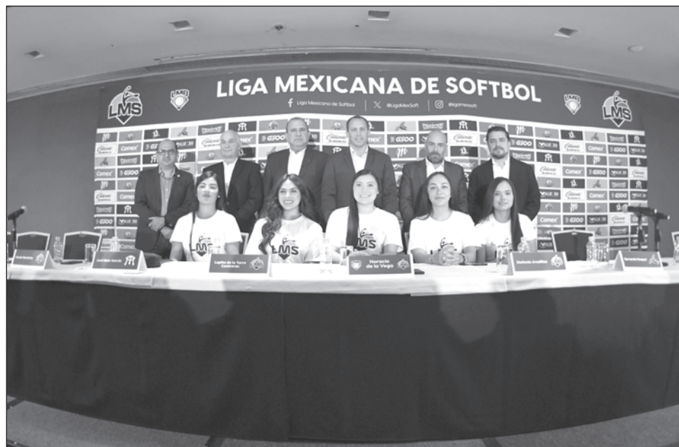
▲ Ayer fue presentada la Liga Mexicana de Softbol femenil.

La LMS busca profesionalizar el deporte femenino y fomentar esta disciplina en México. Su primera edición está proyectada para iniciar el