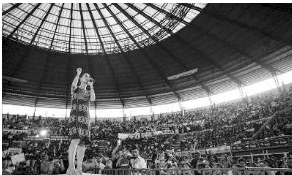
▲ En la Plaza de Toros, Sheinbaum destacó que actualmente, la participación de las mujeres es fundamental para seguir haciendo del país una nación igualitaria.

Claudia Sheinbaum también realizó un recorrido en lancha por la laguna Nichupté, donde escuchó de voz de biólogos la importancia de este sistema y del manglar que alberga. Más tarde, acudió a un mitin masivo en la Plaza de Toros de Cancún. Allí hizo hincapié en que la continuidad de la cuarta transformación tiene como objetivo seguir construyendo espacios para garantizar que todos, pero en especial las mujeres, puedan acceder a los grandes derechos universales.