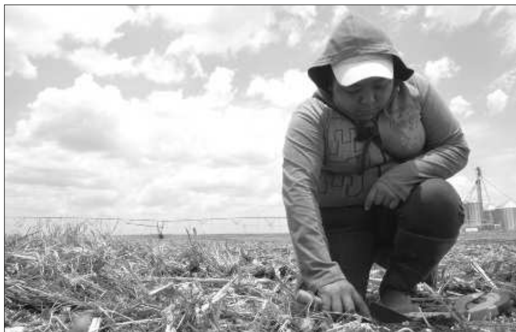
▲ Los presidentes Joe Biden y Andrés Manuel López Obrador saben que el resultado será también político y ninguno de los dos está dispuesto a arriesgar a su clientela en el sector agrícola.

En tanto, el derecho a la alimentación continuará siendo uno de los más frágiles.