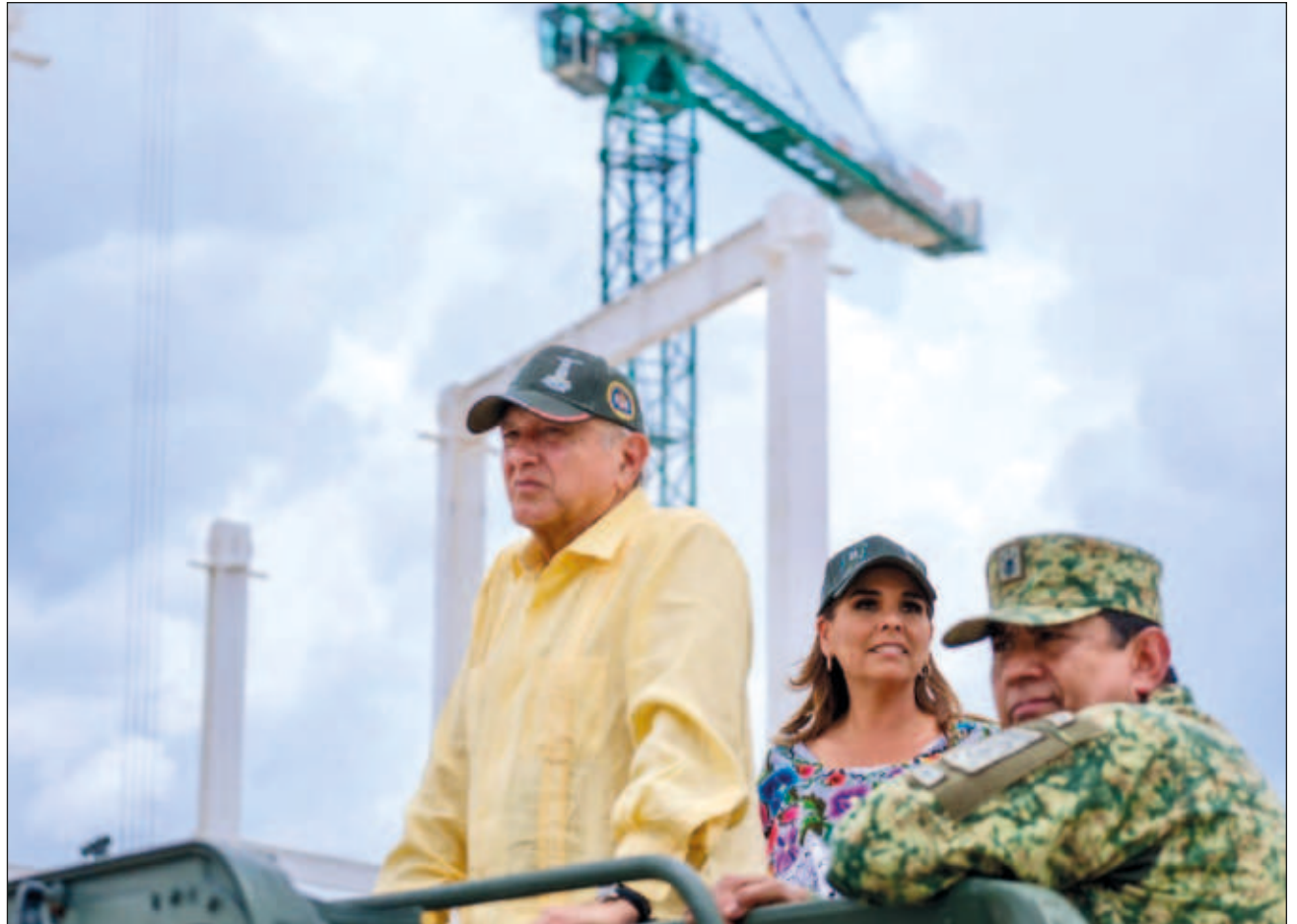
▲ Como cada 15 días, el presidente Andrés Manuel López Obrador visitó Quintana Roo, para supervisar los trabajos del Tren Maya, e indicó que los tramos 1 al 4 llevan un avance de 90 por ciento.

“El Tren Maya se construye con muchas otras obras complementarias, modernización y construcción de carreteras, hoteles, viviendas, parques naturales, mejoramiento de zonas arqueológicas, siembra de árboles, calles de concreto, estaciones, transporte público, Programas para el Bienestar y distribuidores viales, como el de Cancún,