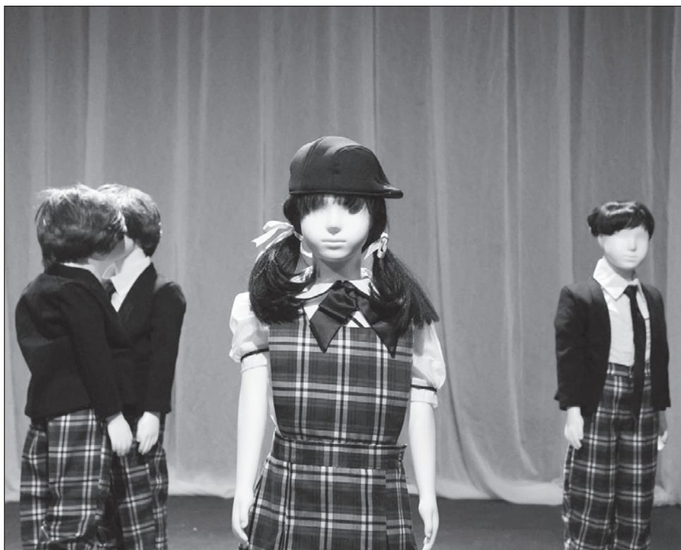
▲ La propuesta escénica articula biodramas de infancias y juventudes que han optado por ser desertores de género.

En este “documental escénico queer ” participan actores no profesionales trans