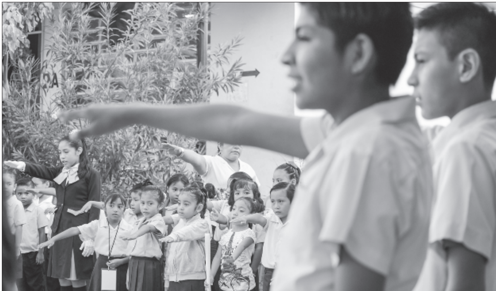
▲ "Educar para la vida es que nuestros niños tengan información sobre su cuerpo y el respeto que merece para que puedan defenderse y denunciar."