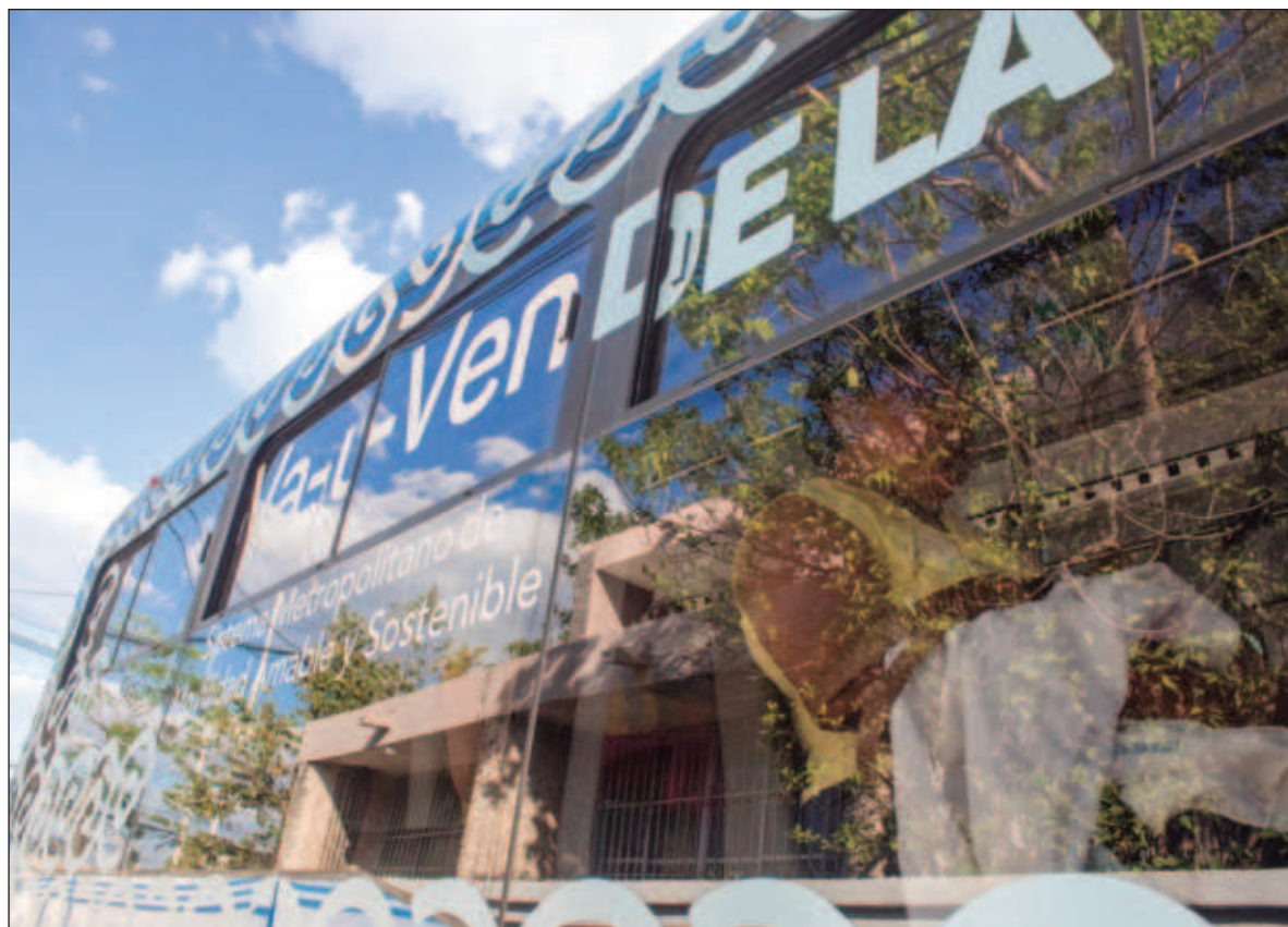
▲ "Poner la disponibilidad de compra y recarga en diversos y distintos puntos de la ciudad permite que la gente vaya adquiriendo la costumbre de cargar su tarjeta de acuerdo a sus necesidades".

COMO HEMOS SEÑALADO , las tarjetas azules son de tarifa general, 12 pesos y tienen un costo de emisión de 25 pesos. Las tarjetas de tarifa social son dos, las amarillas están dirigidas a estudiantes y adultos mayores son gratuitas