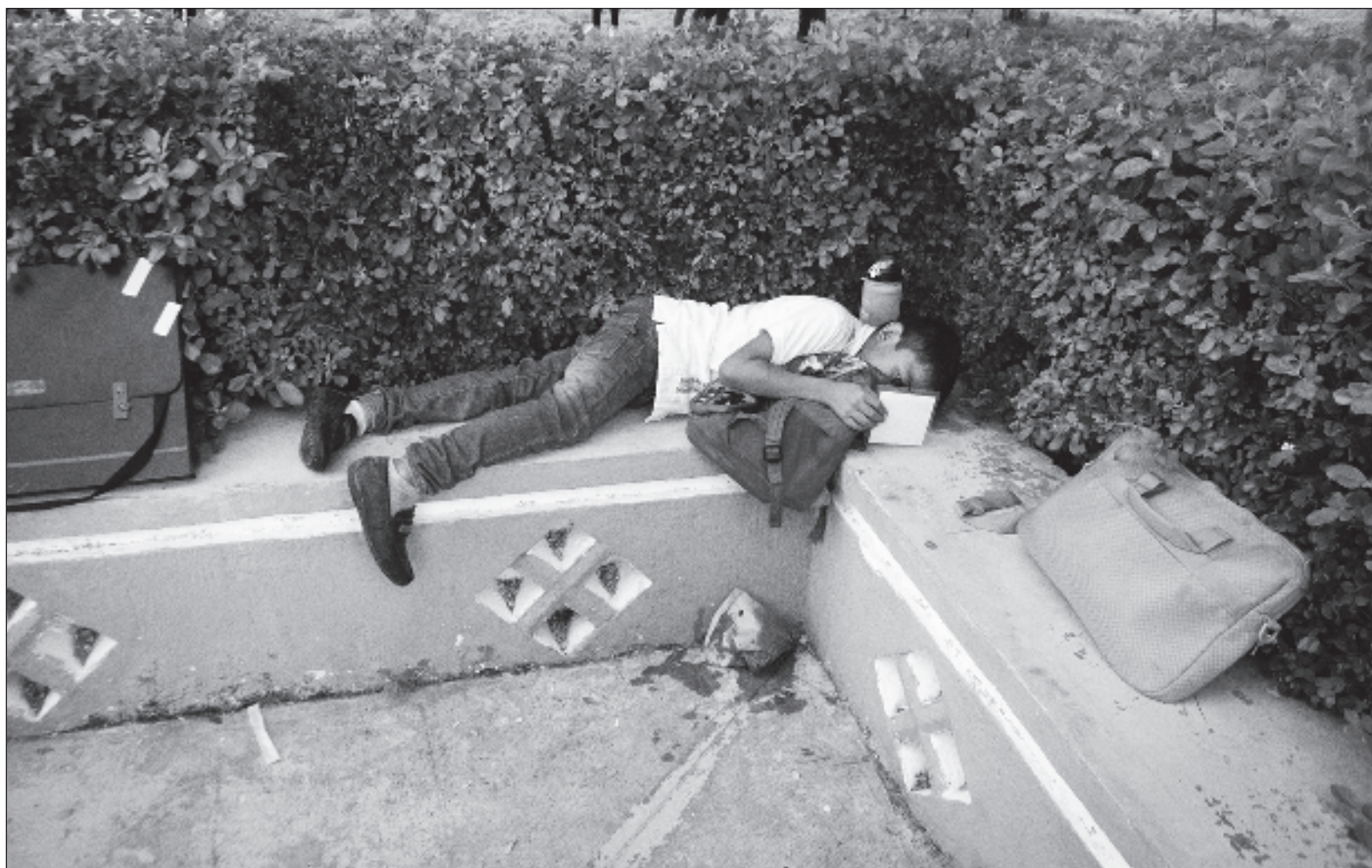
▲ "Los LTG no son los únicos libros que son distribuidos entre la población escolar. Están también los libros que distribuye el Conafe en las comunidades de alta y muy alta marginación, poblaciones rurales donde no es posible ofrecer el servicio educativo regular y que generalmente son micro comunidades".