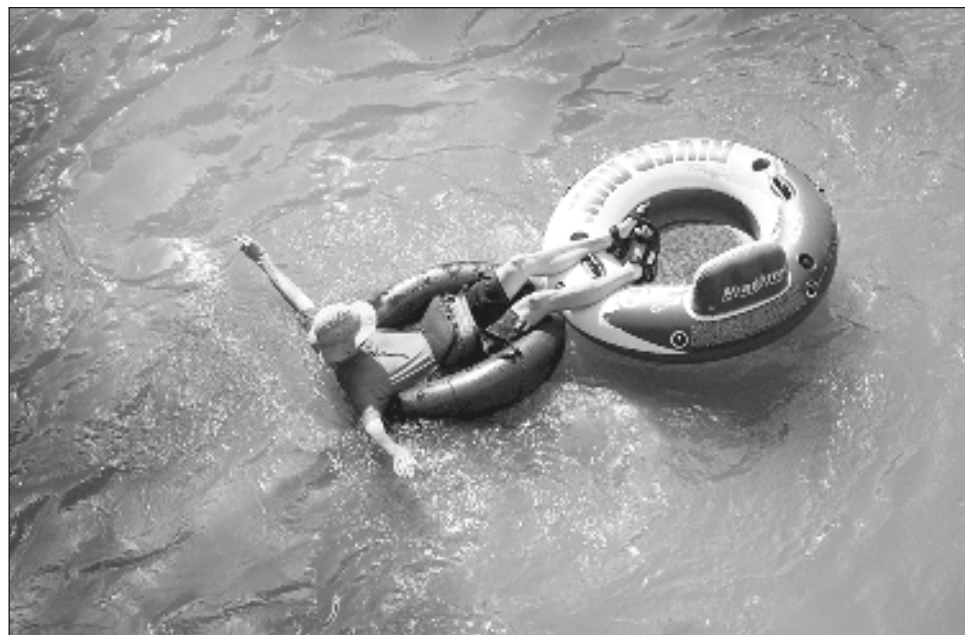
▲ Los científicos han advertido desde hace mucho tiempo que el cambio climático, impulsado por la quema de combustibles fósiles, la deforestación y ciertas prácticas agrícolas, llevará a momentos más prolongados de clima extremo, incluido el ascenso de temperaturas.

Se esperaba que el área de Dallas-Fort Worth alcanzara