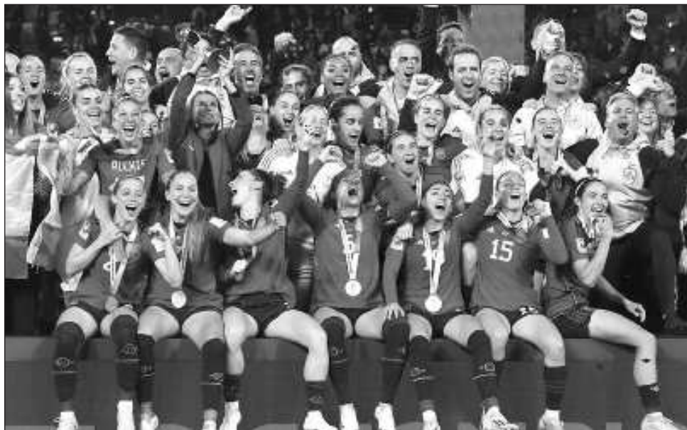
▲ Las jugadoras de España celebran tras conquistar el título del mundial femenino.

Al sonar el silbatazo final, las jugadoras españolas se arremolinaron entre todas frente a su arco. No