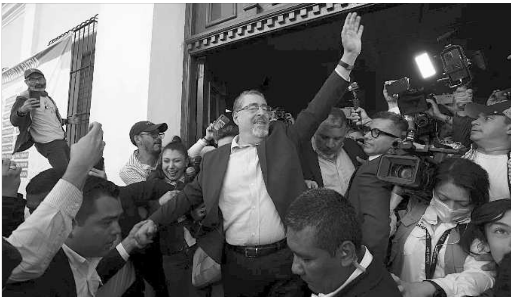
▲ Con 99.17% de los votos escrutados, el Tribunal Supremo Electoral informó que el candidato propuesto por Movimiento Semilla lideraba el conteo con 58.24%.