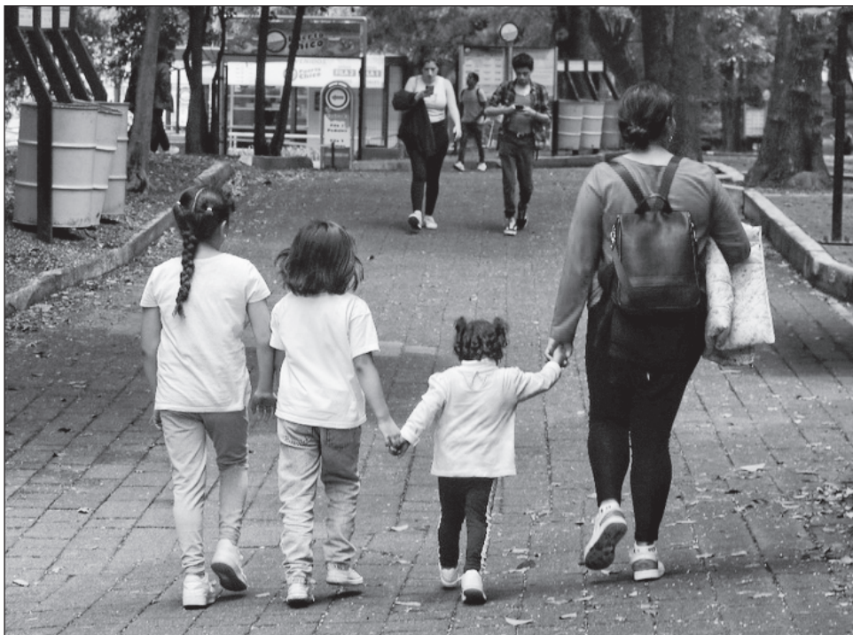
▲ El precepto confirmado por el Pleno Regional sanciona con la pérdida de la patria potestad a quien omita el cumplimiento de esta obligación sin causa justificada.

Dicho precepto sanciona con la pérdida de la patria potestad a quien omita el cumplimiento de esta obligación sin causa justificada. El proyecto de resolución, aprobado por unanimidad, consideró factible dejar de aplicar la fracción VII del