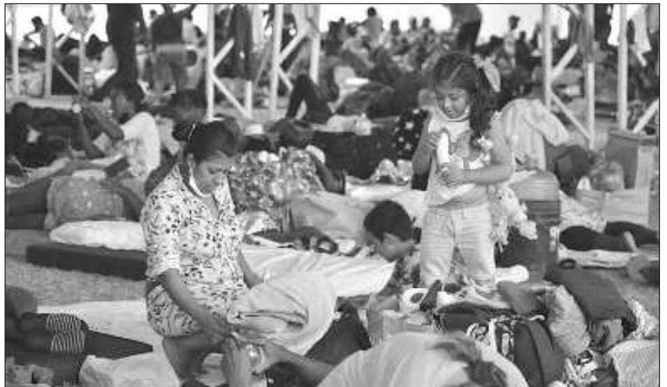
▲ El subsecretario de Derechos Humanos y Migración, Alejandro Encinas, detalló que hasta julio de 2023 se presentaron 87 mil 986 solicitudes de la condición de refugiado, la mayor parte registradas en las oficinas de Ciudad de México y Tapachula, Chiapas.

Dicha mesa busca coordinar el trabajo interinstitucional del gobierno fe-