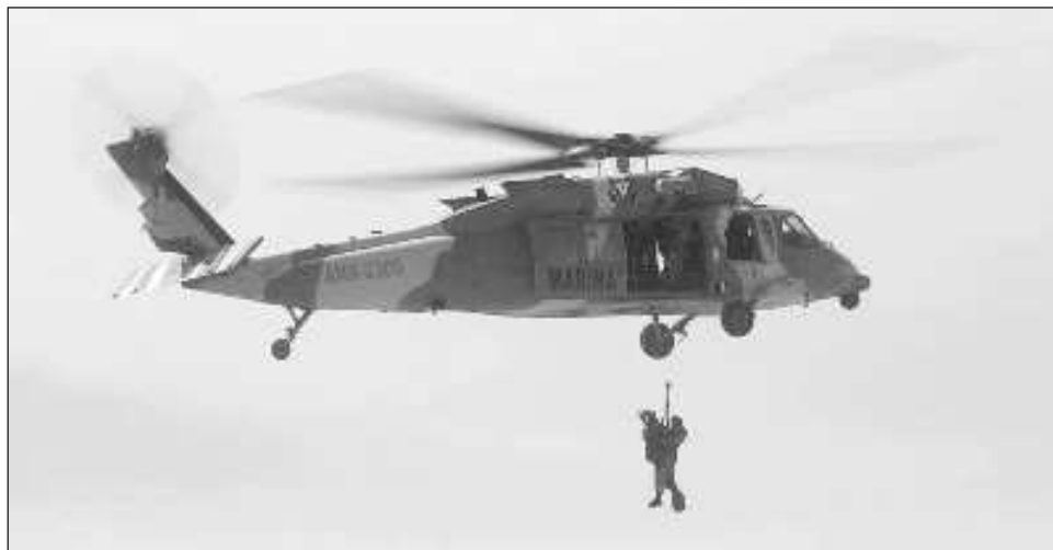
▲ Durante estas demostraciones, realizadas por parte del personal de la Estación Naval de Búsqueda, Rescate y Vigilancia Marítima de Isla Mujeres y de la Brigada de Infantería de Marina Número Nueve, se pudieron apreciar diversas situaciones que ocurren en la vida real.