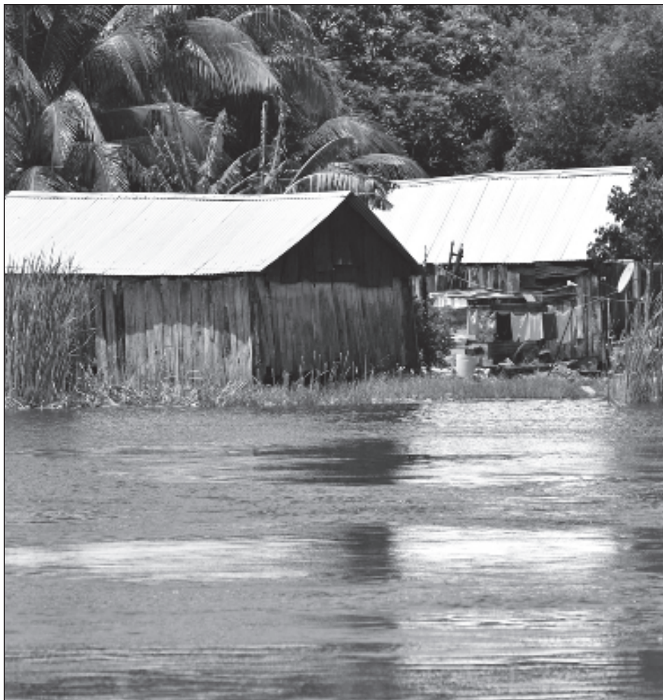
▲ Los promotores asistentes rurales fortalecen la labor del personal de salud y apoyan en primeros auxilios, pues son el primer medio de atención en las comunidades más alejadas.

En 30 años se han formado más de mil PARS en toda la entidad.