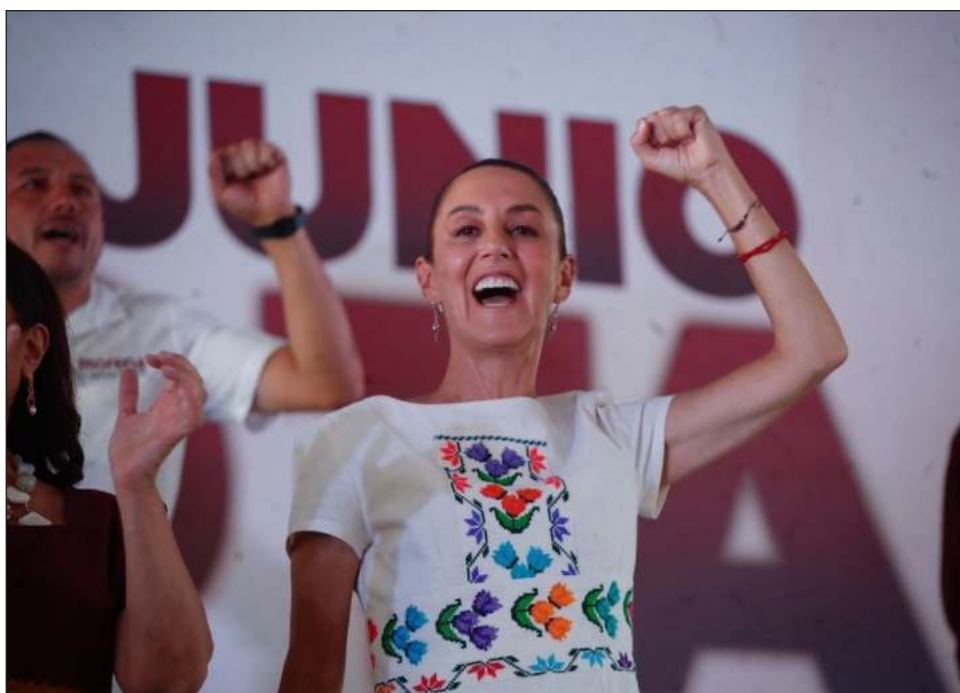
▲ La candidata presidencial de la coalición Sigamos Haciendo Historia dijo que en las próximas elecciones están en juego las libertades y una ciudad de derechos. De gira por Magdalena

Contreras, sostuvo que quienes han luchado por la democracia todos estos años y en contra de los fraudes electorales y la compra de votos, “somos nosotros”.