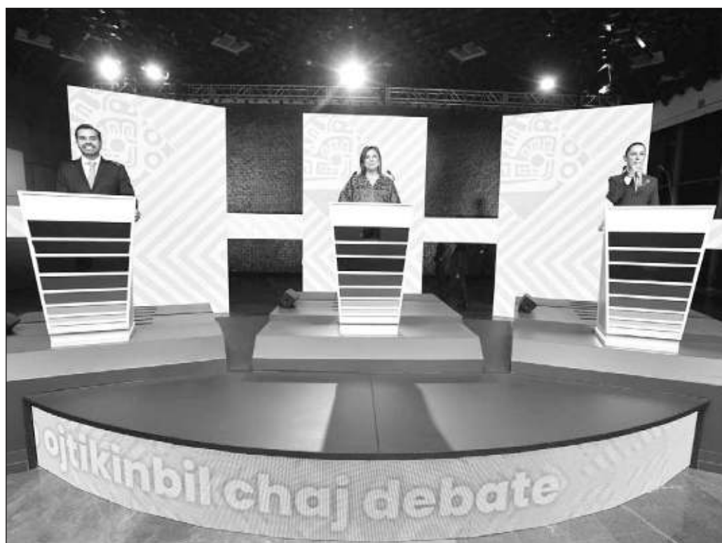
▲ Los ejercicios previos resultaron ejercicios de retórica, intercambios de descalificaciones y provocaciones, privando sobre propuestas. En esta ocasión no hubo novedades ni sorpresas.

Pero en el electorado queda un sabor agridulce. El tercer debate resultó también una especie de dejavú de los previos. A pesar de que los dos últimos experimentaron cambios en su formato, el acartonamiento de las candidatas y el candidato fue la constante en los tres. Cuando los debates terminan por producir cierto hartazgo y decepción en el electorado, es porque se han convertido en ejercicios de oratoria y lo que se incentiva es el abstencionismo; un resultado que no beneficia ni a la ciudadanía, ni a los partidos.