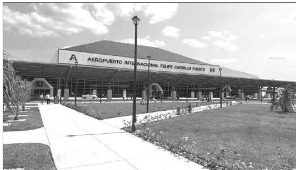
▲ El aeropuerto de Tulum es el punto de partida hacia el desarrollo de un complejo turístico de envergadura, con la meta de recibir hasta 5.5 millones de viajeros anualmente.

Cruz Rodríguez resaltó que esto es el comienzo de un complejo turístico que busca tener hasta 5.5 millones de viajeros anualmente. Esto va a generar que Tulum se conecte al mundo y por ende permitirá que nuevos