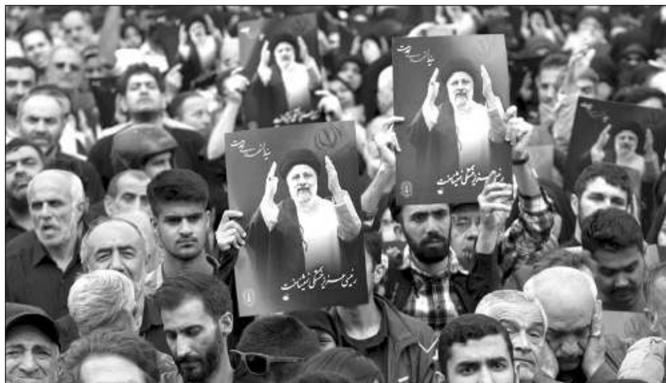
▲ Este martes iniciarán los funerales del presidente Raisi, que estaba en el poder 2021, y el miércoles las autoridades organizarán una procesión fúnebre en Teherán.

Asimismo, el negociador del programa nuclear iraní, Ali Bagheri, fue nombrado canciller interino, tras la muerte del ministro Hossein Amir