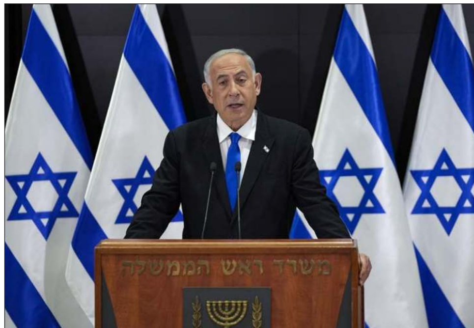
▲ El primer ministro israelí calificó de "escándalo" la decisión de la Fiscalía del Tribunal Penal Internacional de acusarlo por crímenes de guerra y contra la humanidad a raíz de ofensiva militar lanzada sobre la Franja de Gaza tras los atentados de Hamas.

Khan los considera "penalmente" responsables de "crímenes de guerra y lesa hu-