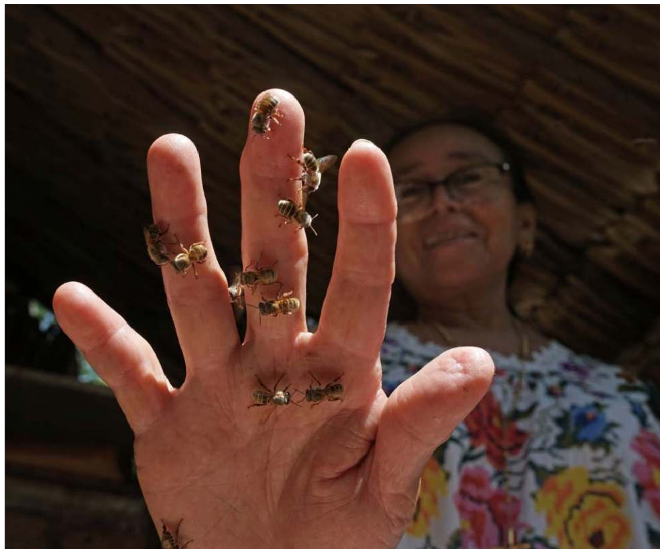
▲ Kuxtalil en maya significa regalo de vida y las mujeres eligieron este nombre porque así es como consideran a la abeja melipona o xunán kab, la cual produce una miel única con propiedades medicinales.

El PPD ha ayudado financieramente a las mujeres con