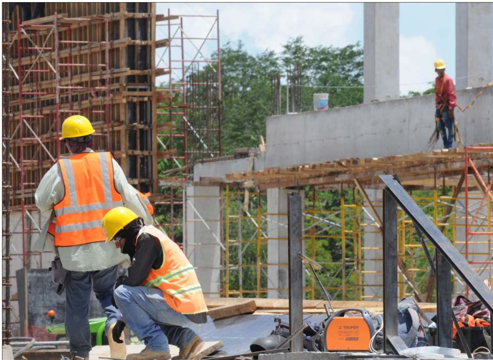
▲ El índice elaborado por el Instituto Mexicano para la Competitividad (IMCO) mide la capacidad de cada estado para generar, atraer, y retener talento e inversión.

En el caso de Quintana Roo su mejor posición, segundo lugar, fue en Infraestructura; y está en el lugar nueve en Mercado de trabajo; mientras que sus peores lugares fueron en Innovación y Economía (25) y en Sistema Político y Gobiernos (30).