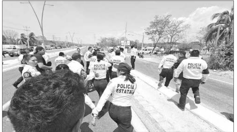
▲ Los más de 100 elementos de la Academia salieron de las instalaciones a provocar a los manifestantes, incluso intentaron despojar los vehículos a los policías en manifestación.

Los más de 100 elementos de la Academia salieron de las instalaciones con la intención de provocar a los manifestantes, incluso intentaron despojar los vehículos a los policías en manifestación, entre ellos dos camiones que usan para transportar a los antimotines y elementos.