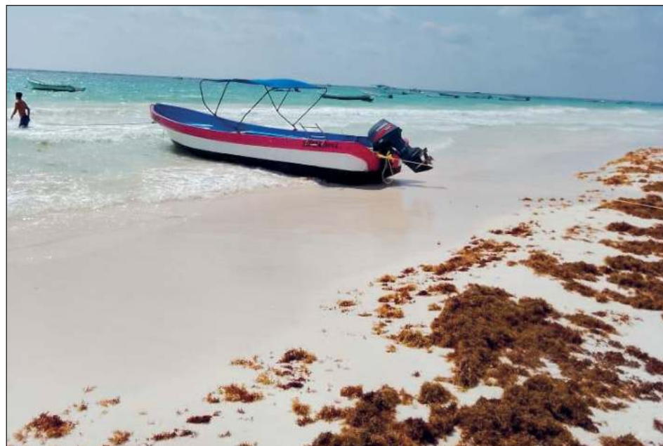
▲ Empresarios reconocen que las estrategias de prevención aminoran el impacto en las playas; siguen atentos y coordinados con las autoridades de los tres niveles.

"Afortunadamente los trabajos ya se hacen de manera previa por parte del municipio, se establecieron estrategias que más o menos han ido funcionando y de al-