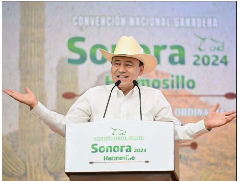
▲ Ante versiones de que Alfonso Durazo podría sumarse a la posible gestión federal de Claudia Sheinbaum, éste lo negó y dijo que su compromiso en Sonora es por seis años.

Respecto a esas declaraciones, el gobernador de Sonora comentó que el presidente “es muy generoso siempre y eso nos compromete cada día más”.