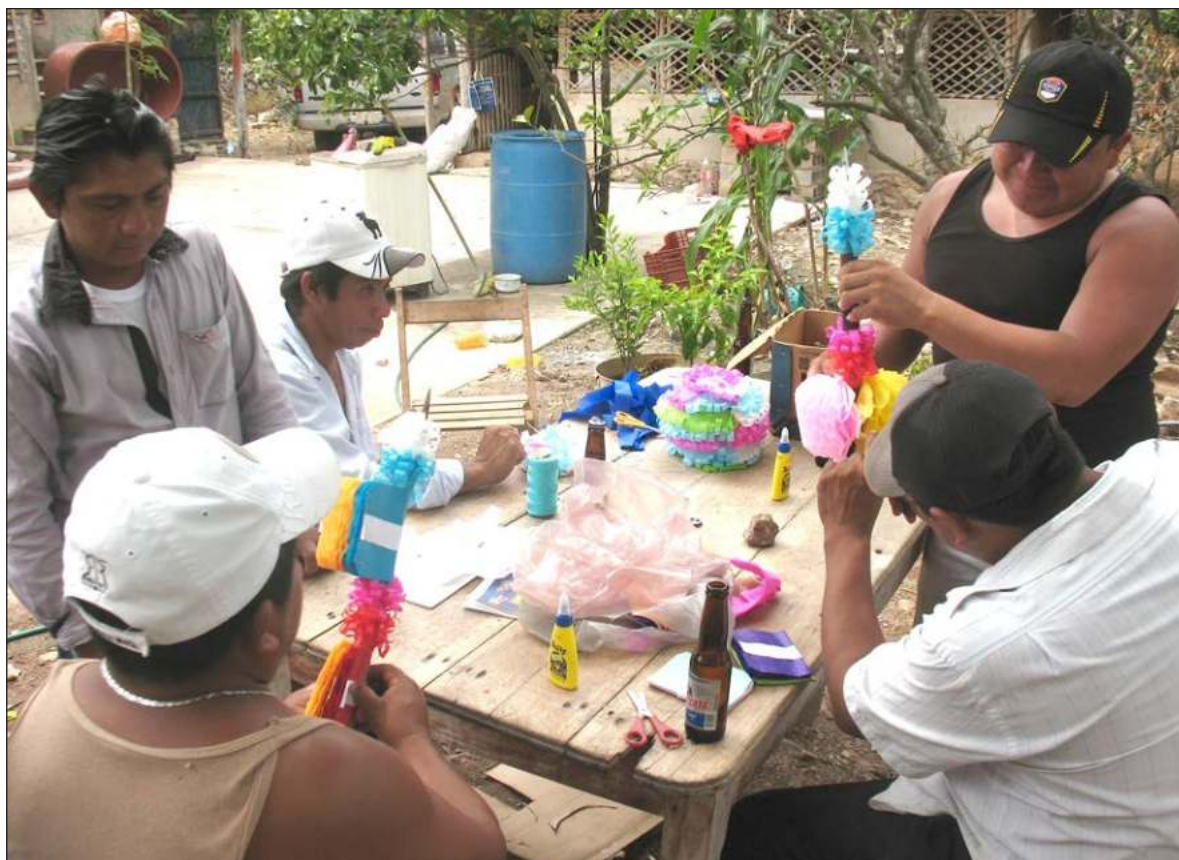
▲ "Hay banderillas especiales y las hay aún más distintivas o 'de lujo'. Comúnmente, las banderillas se adornan con recortes de tiras de papel de china de múltiples colores adheridos con pegamento y, las 'de lujo', incluyen un contenedor de palomas que puede ser formado con pequeños calabazos o con cartulinas".

EL SEGUNDO ACTO, consiste en otra ofrenda de saka' que se entrega después de que objetos y "fierros" han sido introducidos al ámbito de la población (a un solar lóbrego);