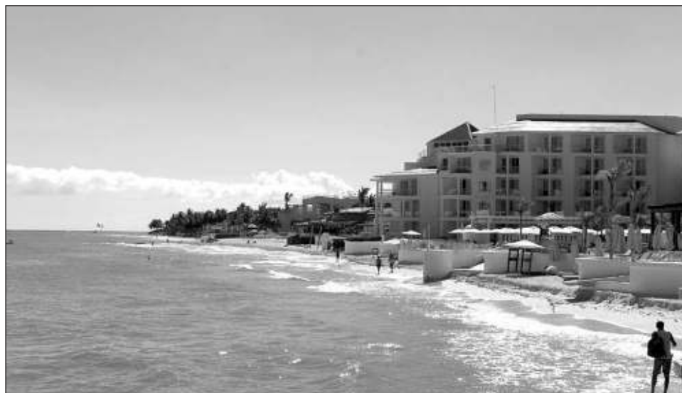
▲ Los centros de playa alcanzaron 71.1 por ciento, mientras que las ciudades registraron una ocupación hotelera de 51.7 por ciento, informó la Sectur.

La Sectur informó que, en este periodo, se tiene como extremos con la mayor ocupación a los Centros