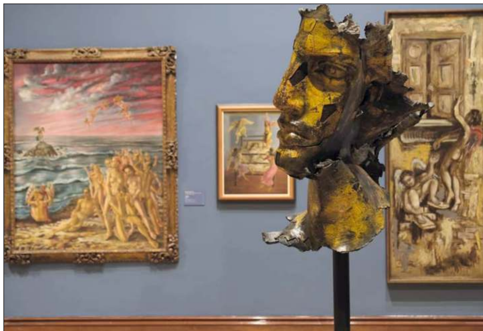
▲ El primer núcleo de la muestra abarca a los ángeles marianos; el siguiente, santos y ángeles; el tercero está dedicado a San Miguel Arcángel, y el último reflexiona sobre el papel de los ángeles alegóricos y su presencia en el arte popular.

Una de las piezas representativas que recibe al público es La Anunciación , pintada por el novohispano