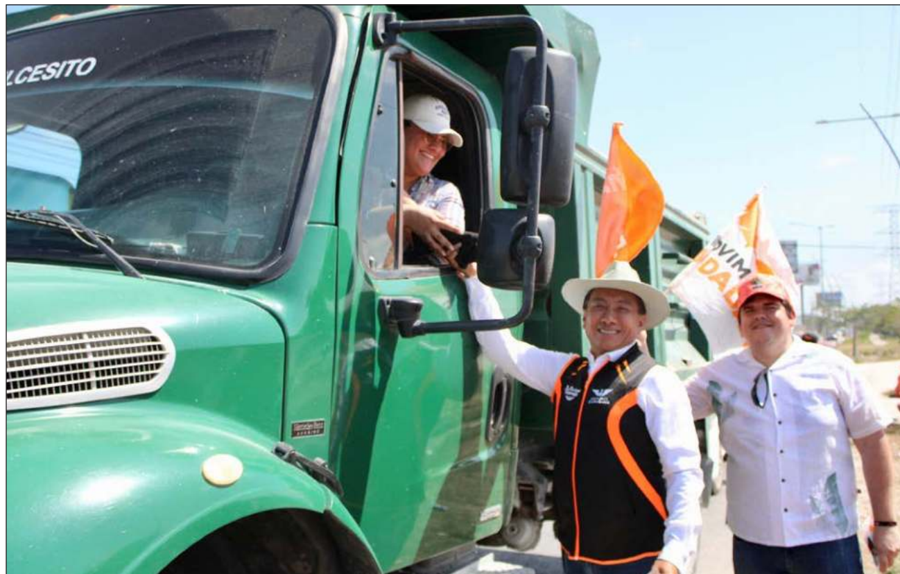
▲ El candidato a la alcaldía de Benito Juárez por Movimiento Ciudadano, puntualizó que "es un trabajo que realizaremos, tú y yo, sociedad y gobierno, el momento es ahora, recuperemos el sueño que nos trajo o nos hizo permanecer en nuestro querido Cancún".

A través de la gestión que realizarán las y los