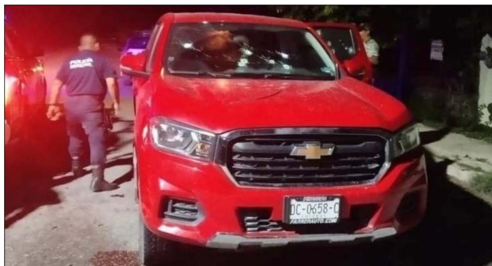
▲ Los casos más recientes se documentaron el domingo en Mapastepec: cinco sujetos fallecieron en un atentado contra el aspirante de Morena a la alcaldía.

Fuentes de seguridad indicaron que en la escena del cri-