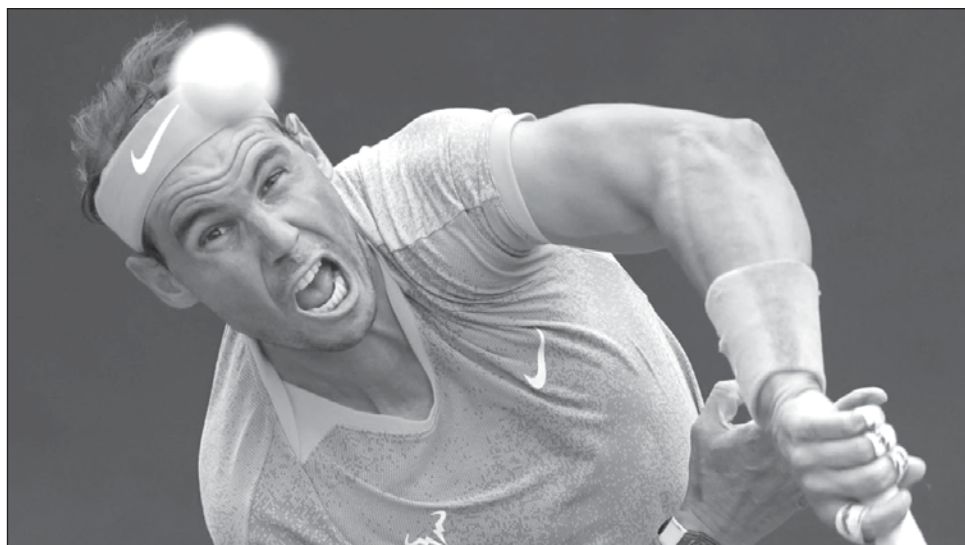
▲ Rafael Nadal saca ante Zizou Bergs en el Abierto de Italia, el pasado jueves 9.

Busca ponerse a tono tras perderse casi todo 2023 tras ser sometido a una cirugía por una lesión en la