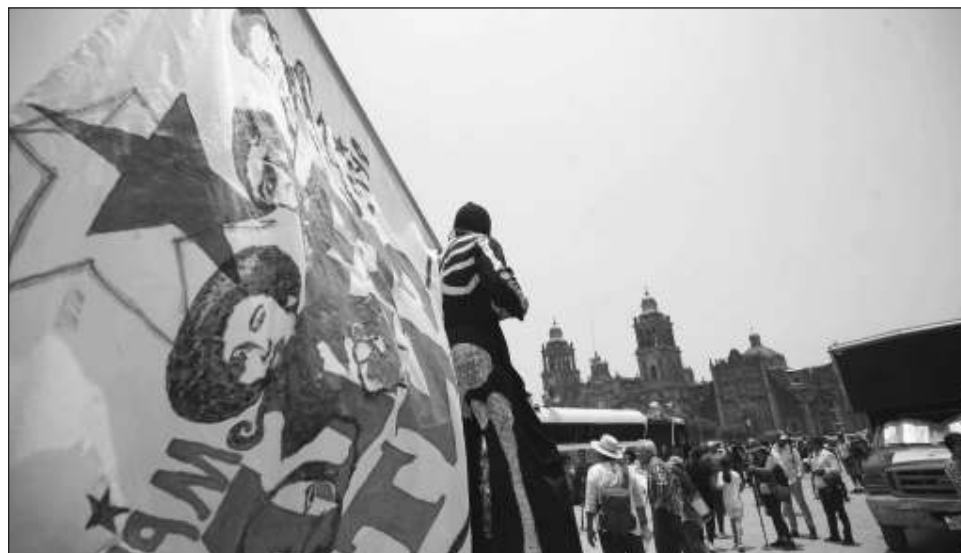
▲ El mandatario refirió que se están realizando mesas de trabajo para atender las demandas de los mentores, “ellos lo van a decidir (si retiran el plantón), se está avanzando”.

El mandatario refirió que se están realizando mesas