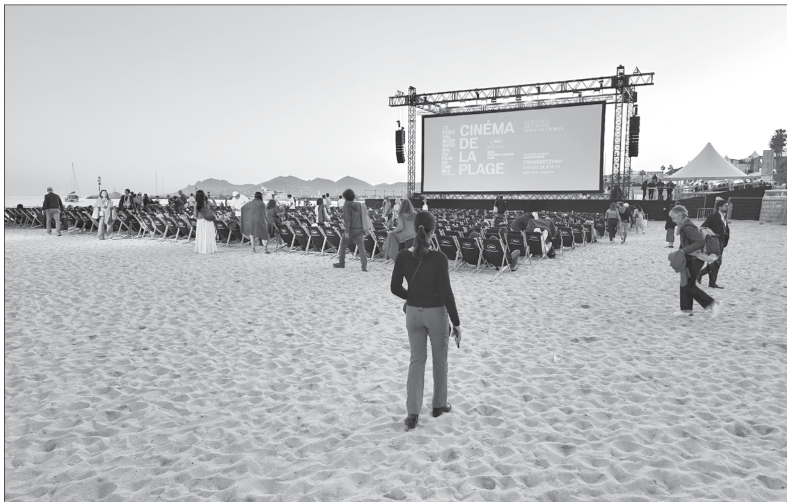
▲ "La película que se proyecta en la playa se mantiene fiel a los temas dominantes de este festival: la inclusión, la igualdad y la diversidad, en el filme argentino Transmizvah . Un largometraje producido con más ganas que recursos, en un país donde la cultura y el cine no son prioridad".