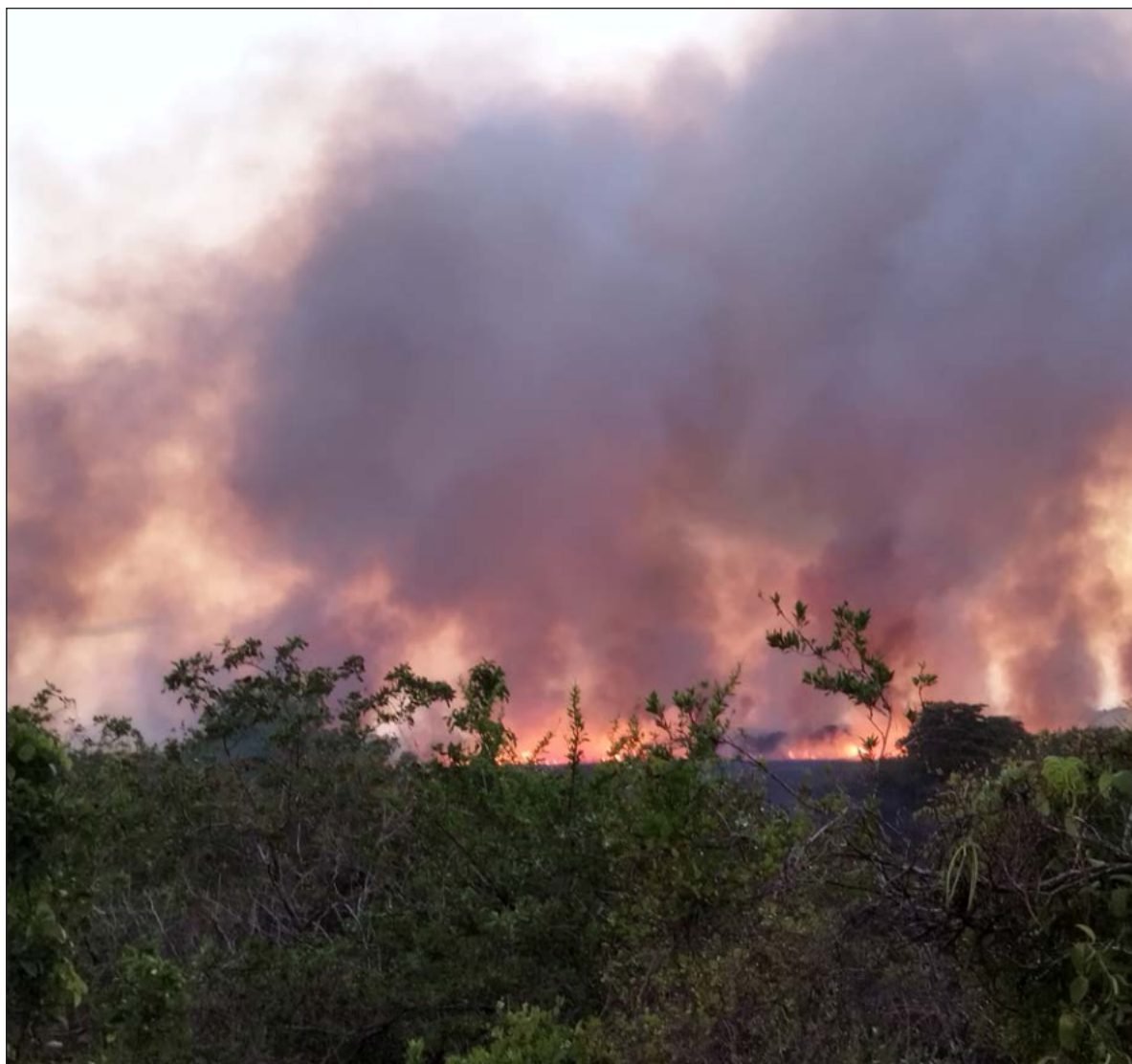
▲ "Hoy la FAO y la Unesco no sólo han cambiado su postura inicial de condena al uso del fuego, sino que promueven el rescate del conocimiento tradicional y su transmisión a nuevas generaciones".

¿QUÉ PASA CON las otras áreas donde los incendios están causando problemas?