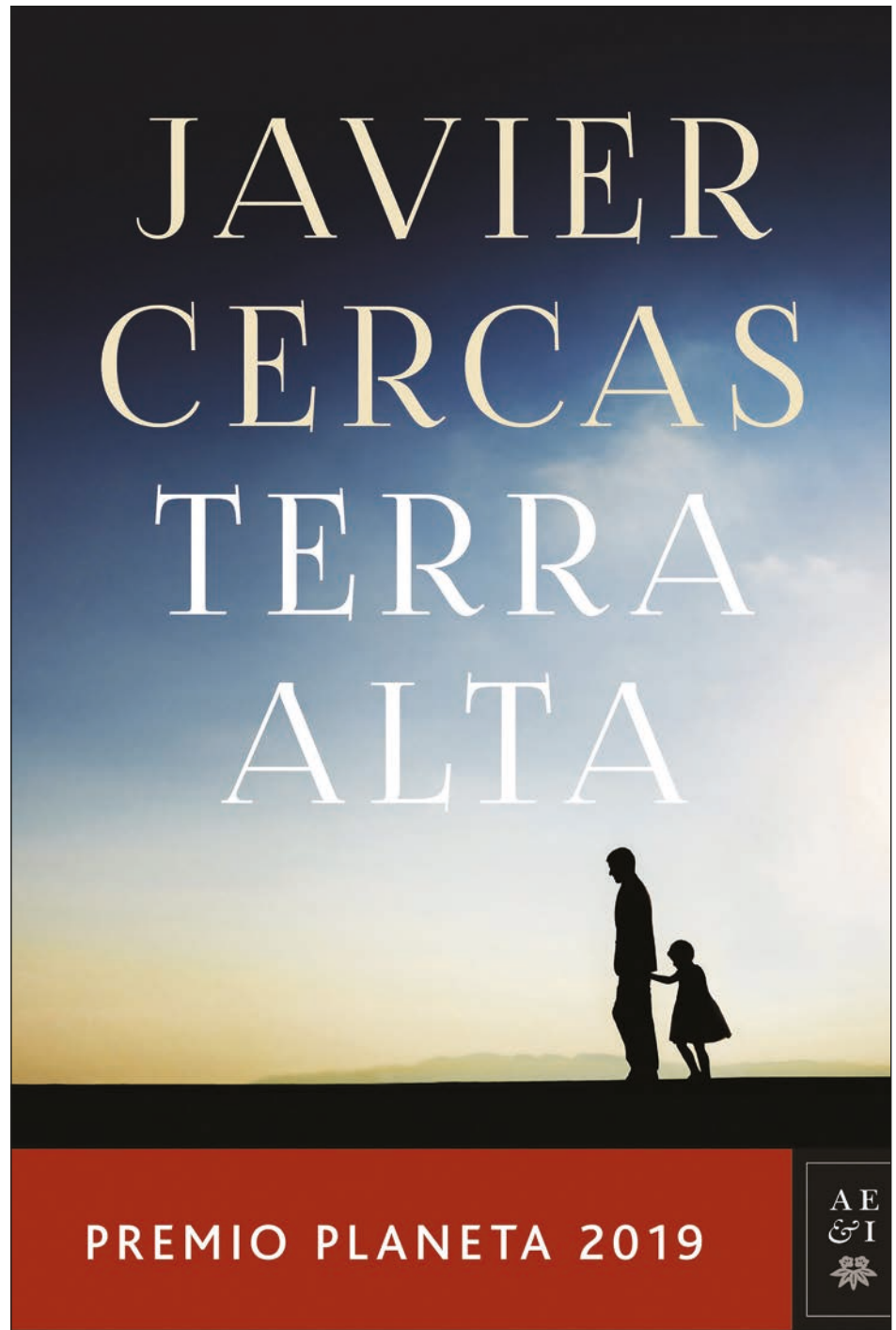
▲ Javier Cercas crea el personaje de un investigador heterodoxo, justiciero que va más allá de las reglas. Foto Facsímil de la portada del libro

RESPECTO AL ESCENARIO de la novela, del sitio en que se desarrolla la mayor parte de la acción, Gadesa, en la Terra Alta , yo había oído hablar solamente por una canción de la Guerra Civil que refiere la heroica batalla librada contra los franquistas. Esta historia y la