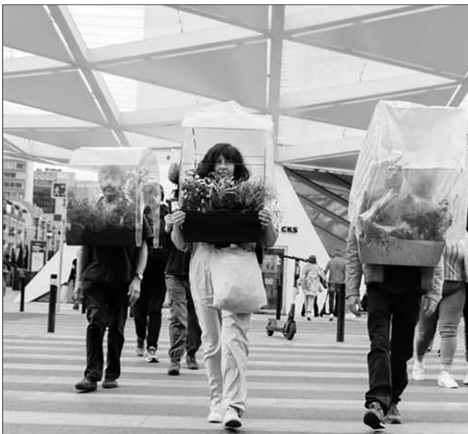
▲ Se trata de un mini-invernadero de plexiglás que se coloca sobre los hombros.