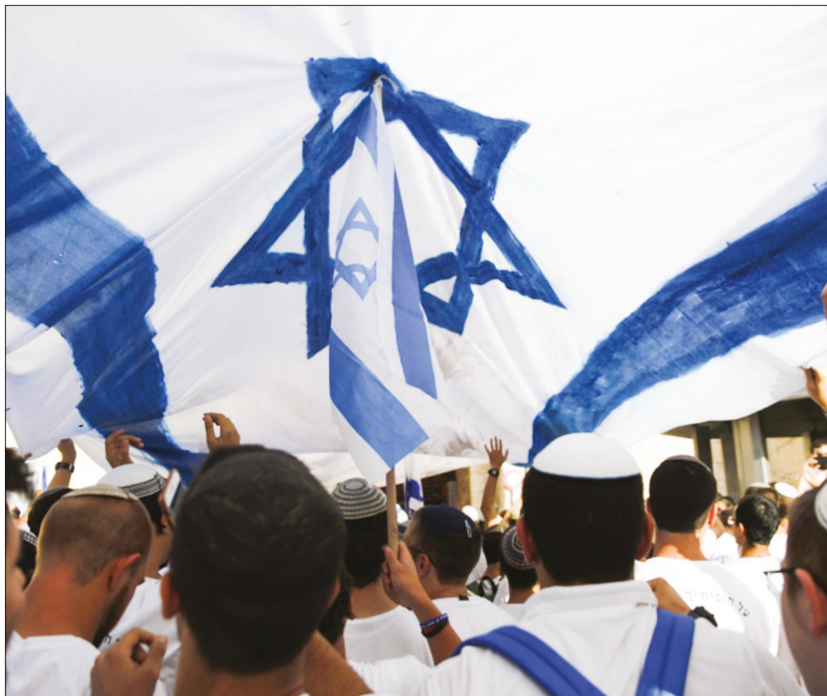
▲ According to Israeli statistics, only 43% of Israeli Jews are secular.

NOT UNLESS MODERATE and progressive Israelis find a way to neutralize the political impact of the growing religious communities of voters and attract a majority of Israelis to a new national narrative.