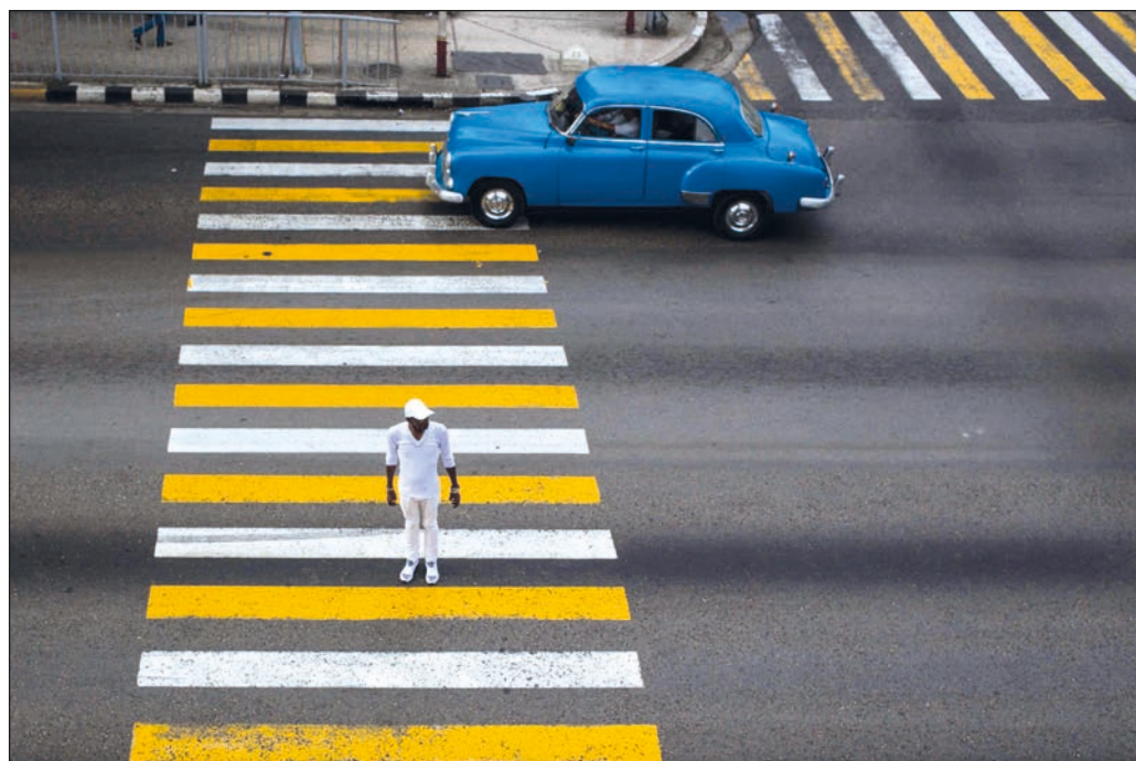
▲ Las condiciones internacionales para la transición cubana distan de ser favorables.

La comunidad internacional en su conjunto tendría que reconocer la solidez de esa institucionalidad y manifestarse de manera inequívoca por el respeto a la soberanía de esa nación caribeña; si en la patria de Martí han de ocurrir nuevas reformas, sólo a los cubanos corresponde determinar el sentido y el ritmo de ellas. En realidad, el único cambio radical que debe esperarse en la situación cubana es el levantamiento del criminal embargo que ha causado por décadas un sufrimiento incuantificable a los habitantes de la isla.