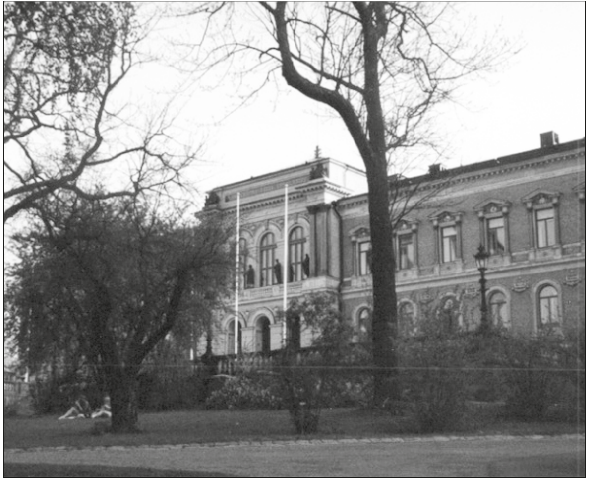
▲ Siento a los suecos muy cercanos. en un par de ocasiones fui a la ciudad de Upsala.

BGT.- CONOCISTE AL filósofo español Luis Villoro, te casaste con él y formaron una "pareja deslumbrante", ¿qué era lo que más admirabas en él?