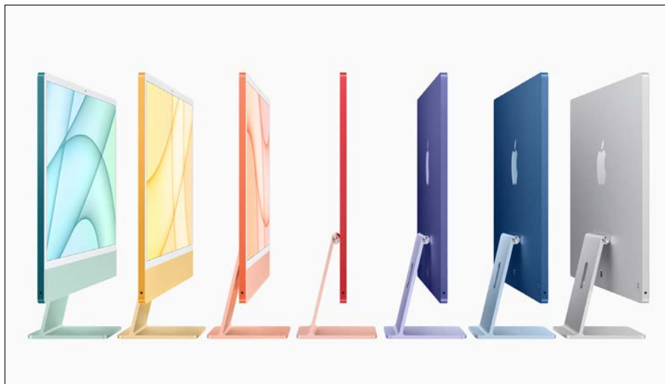
▲ El nuevo iMac es una de las computadoras más completas y caras de todas las que ofrece la compañía. Tiene un elegante acabado en aluminio.

El dispositivo puede conectarse a las redes 5G y tiene una cámara frontal ultra gran angular de 12 megapíxeles con la fun-