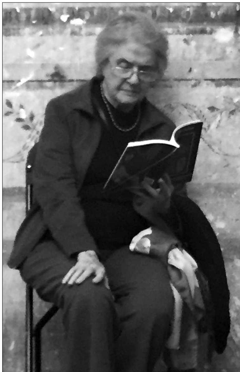
▲ Me gustaría que hubiera un partido político de mujeres, sería un cambio total; sería muy bueno en México.

ERM.- YO CREO que estamos empezando a percibir la destrucción, no digo del planeta, pero sí de una era. Ya ha habido eras en otras épocas como la del hielo, épocas en las que cambia el planeta; se acabaron los dinosaurios precisamente con el aerolito que cayó en Yucatán, la estructura del planeta cambia. Yo pienso que para el año 2050 tal vez se acabe todo, bueno hasta cierto punto, porque siempre queda la esperanza y siempre resurgió algo, resurgirá una nueva era, pero ésta se está acabando, y ojalá que aprendiéramos a cuidar más la naturaleza pero ni siquiera viendo con tanta evidencia el problema lo hacemos, es el egoísmo tan grande que existe en la gente, aun siendo gente preparada e inteligente muchas veces sólo le importa el momento presente y su vida personal e individual, no piensa en los demás; que como te digo, para mí, ese es el sentido de mi vida, ayudar a los demás.