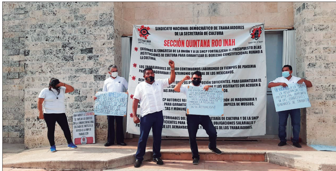
▲ La prioridad del pliego es la regularización presupuestal de las obligaciones patronales con los trabajadores respecto a sus derechos laborales.

Como medida de presión, desde la semana pasada, los trabajadores sindicalizados participaron en mítines con sede en espacios culturales emblemáticos, como la zona