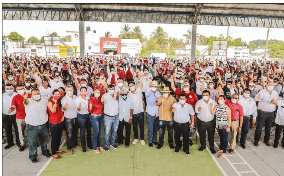
▲ El priísta se reunió este martes con activistas y ganaderos en Escárcega.

En medio de los aplausos de aprobación del sector agropecuario, el candidato de la coalición que integra el mayor número de propuestas para la reactivación económica de Campeche, dijo que Morena realmente es la transformación, pero mala, porque ha destruido no sólo la seguridad del país, sino la economía, la salud y los apoyos para industrias como la ganadera.