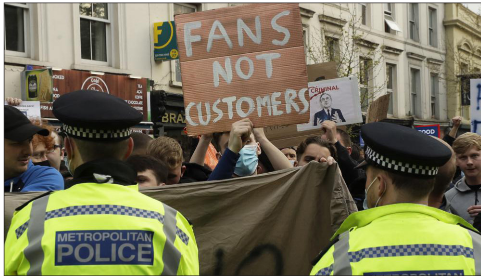
▲ Hinchas de Chelsea protestan frente al estadio Stamford Bridge contra la nueva Superliga.

En tanto, Chelsea preparaba la documentación para decirle a la Superliga que se quiere salir del bloque, señaló a The Associated Press una persona con conocimiento de la decisión. La persona habló con AP