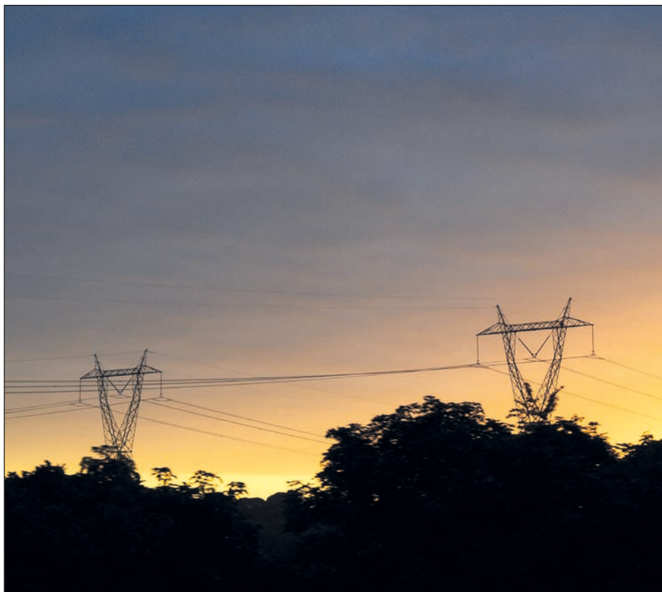
▲ Los cortes eléctricos también perjudican a las empresas, apuntó el gobernador.

También invitó a la ciudadanía a hacer conciencia de que, sobre todo en esta época del año, dada la alta demanda, debemos ser eficientes y cuidadosos en el uso de la energía eléctrica.