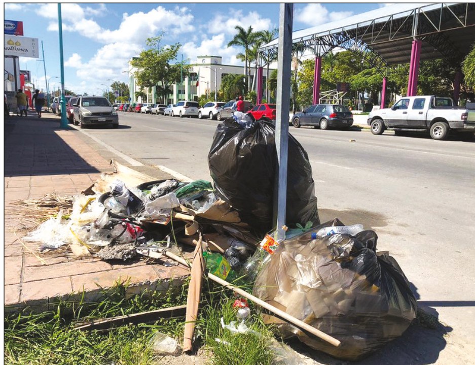
▲ Los habitantes de Tulum expresaron su inconformidad mediante redes sociales.

tión misteriosa provocada por la lamentable muerte del ingeniero, pero sí se ha visto en los últimos días problemas en la recoja de basura y en el alumbrado público”, externó.