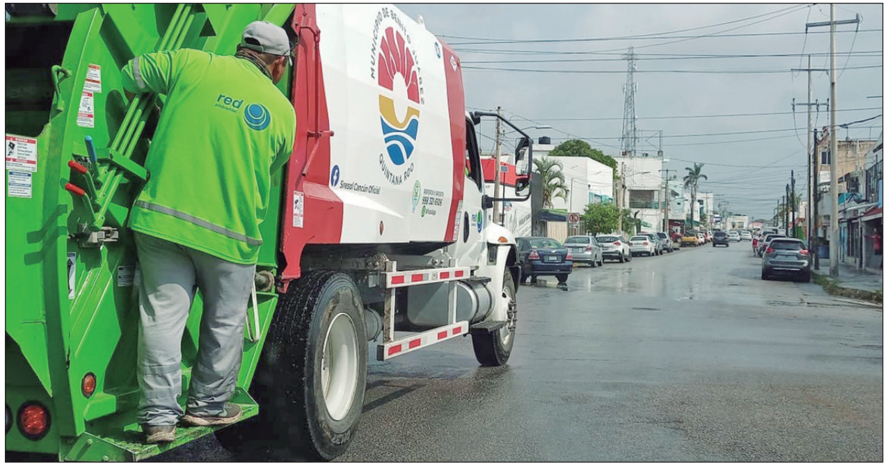
▲ La empresa que lleve mayor cantidad de toneladas de basura al relleno es la que tendrá mayores ganancias.

El objetivo de la NOM es establecer las especificaciones, parámetros y requisitos técnicos de Seguridad Industrial, Seguridad Operativa, y Protección Ambiental que se deben cumplir en el diseño, construcción, operación y mantenimiento de Estaciones de Servicio para almacenamiento y expendio de diésel y gasolinas.