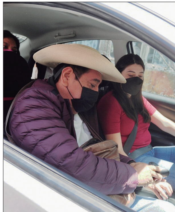
▲ El aspirante a candidato para gobernar Guerrero afirma que son los partidos las entidades que debe presentar gastos de campañas.

que no hay constancia en el expediente en el cual el INE le haya requerido su informe de gastos de precampaña. Por lo demás, a decir del aspirante, la obligación primaria de entregar dicho informe corresponde a Morena.