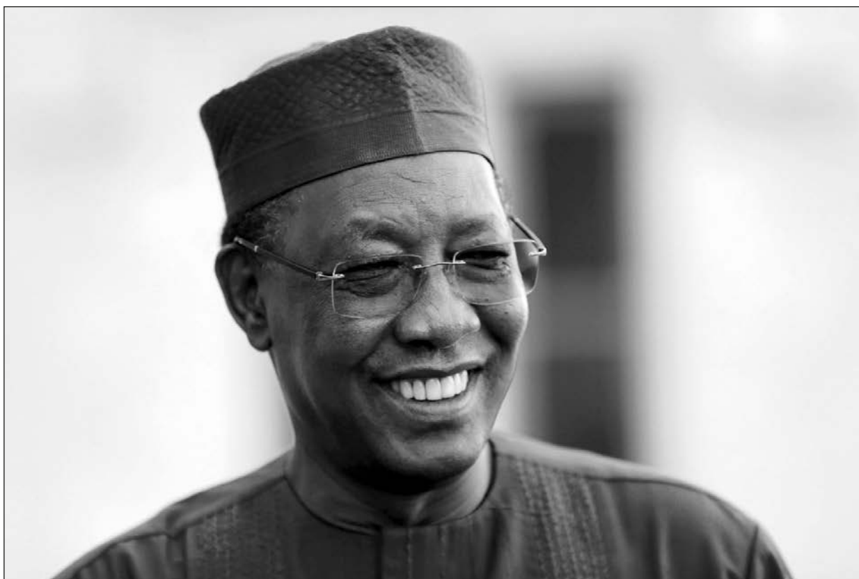
▲ El fallecido dirigente había permanecido en la presidencia de Chad desde hace 30 años.