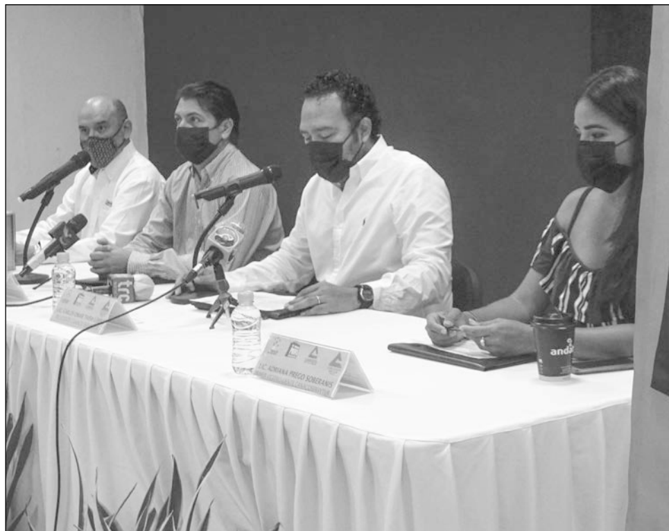
▲ El Mejor Puente busca la reactivación económica postpandemia.

Por la cercanía entre las celebraciones del niño, de las madres y los maestros, la Canaco Nuevo León creó este programa y en Campeche lo retoman para ayudar