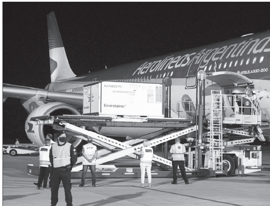
▲ Todas las dosis que sean producidas en Argentina regresarán a Rusia para que desde ahí, el gobierno distribuya al resto del mundo el antídoto.

"El primer lote producido será entregado al Centro Gamaleya (de Rusia) para realizar el control de calidad correspondiente. Está previsto que la pro-