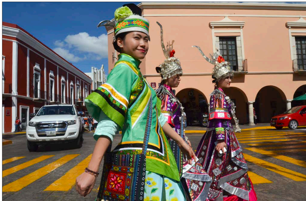
▲ Uno de los personajes, en un acto quijotesco (a decir del autor), reclama públicamente la reparación del daño histórico y exige que la sociedad que persiguió a sus antepasados les pida perdón.

“Somos una sociedad que se ha construido en el victimismo, nos asumimos como víctimas de la conquista; del racismo y la xenofobia de Estados Unidos. Sin embargo, nos cuesta entender