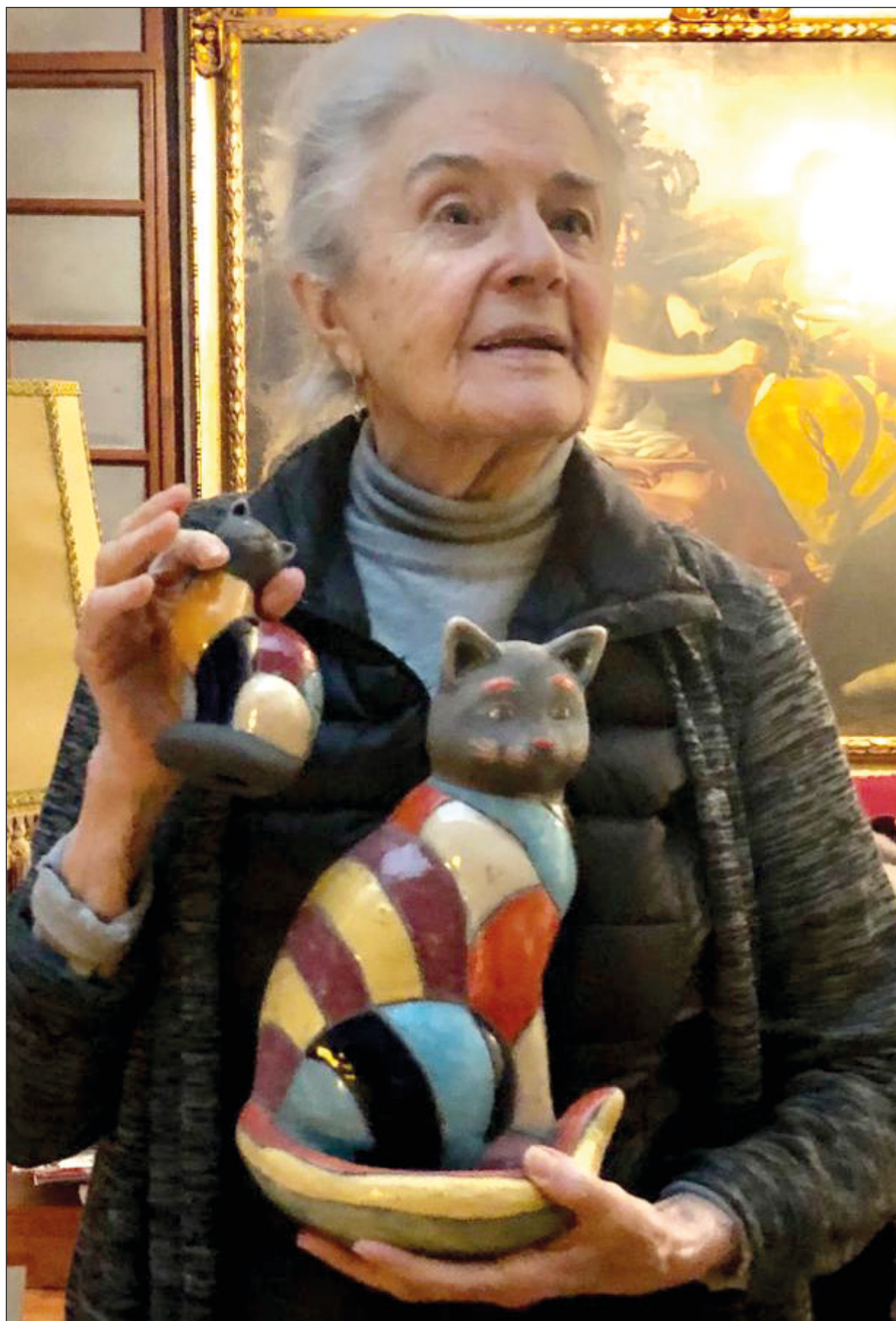
▲ Esta pandemia ha encerrado a los niños, no tienen vida social.