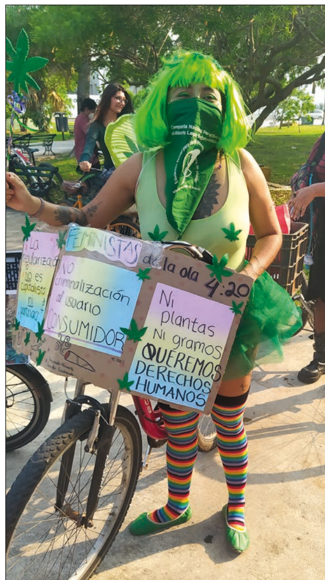
▲ El humo de los porros, junto a la alegría y las risas, se apoderó del contingente cannábico.

La rodada llegó hasta el parque de La Paz, frente al zoológico del Centenario, donde las personas se sentaron en círculo en el área verde para "rolar el porro", algunos se quitaron los zapatos; otros algunos aprovecharon para echarse "el monchis". También compartieron experiencias y testimonios sobre el tema, así como información sobre la regulación del cannabis.