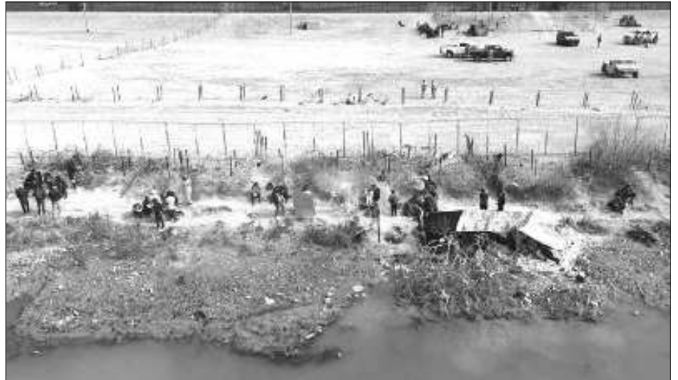
▲ Los migrantes que lograron ingresar al territorio estadounidense tenían la intención de entregarse a la Patrulla Fronteriza para pedir asilo, pero fueron regresados a México.

Aparte en declaraciones públicas, la gobernadora panista de Chihuahua, María Eugenia Campos Galván, ofreció colaboración con Texas y con el gobernador Gregg Abbot, tras la entrada en vigor de la Ley SB4.