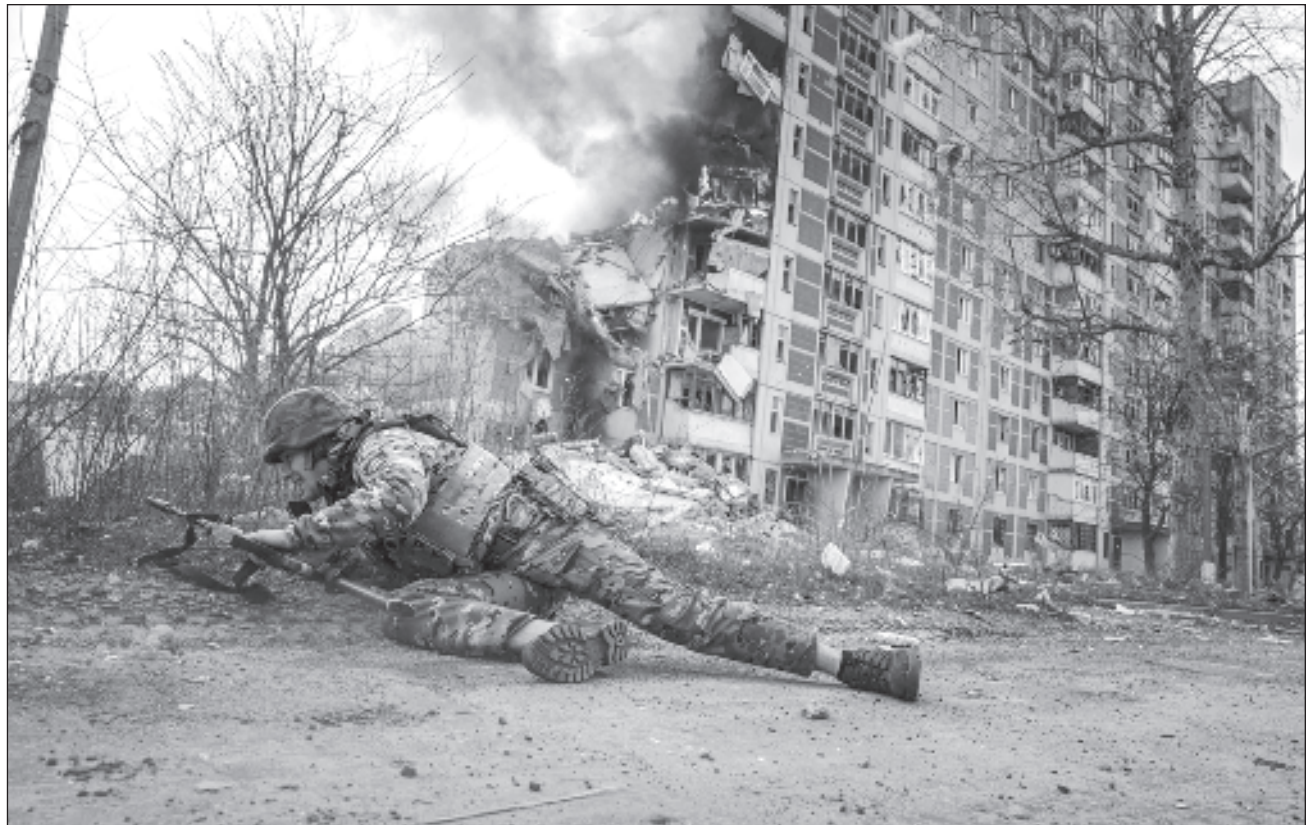
▲ La financiación puente es un mecanismo acordado entre Bruselas y Kiev para atender las necesidades presupuestarias urgentes.

Von der Leyen valoró que es “un buen día” para Ucrania porque los fondos ya fluyen desde Bruselas para que Kiev haga frente a los gastos más acuciantes de su administración, sometida a una gran tensión por la guerra de invasión rusa.