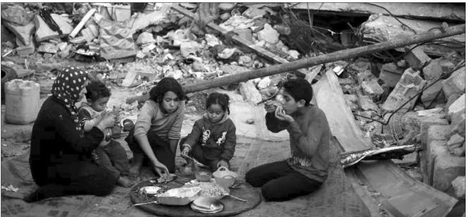
▲ "Iniciar la campaña 'No dejemos de hablar de Palestina', destinada a la denuncia, divulgación y análisis de la agresión sistemática del Estados sionista".

Las cartas a las autoridades universitarias se entregarán de manera presencial en las diversas instituciones en el transcurso de los próximos días. Las cartas a los gobiernos progresistas se entregaron el día 23 de enero de 2024.