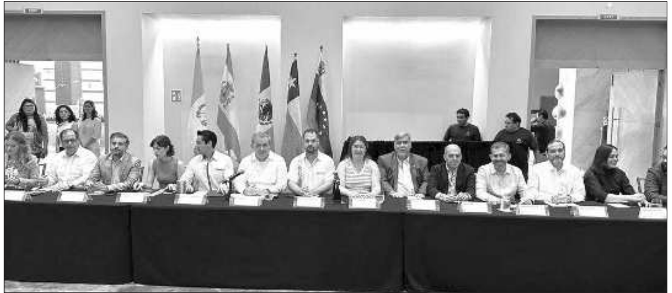
▲ Durante la primera jornada del evento, los expertos coincidieron en que México es “uno de los países líderes en el desarrollo del turismo” porque logró darle visibilidad a las comunidades y territorios rurales.

“Como destino líder en materia turística de México y América Latina, el