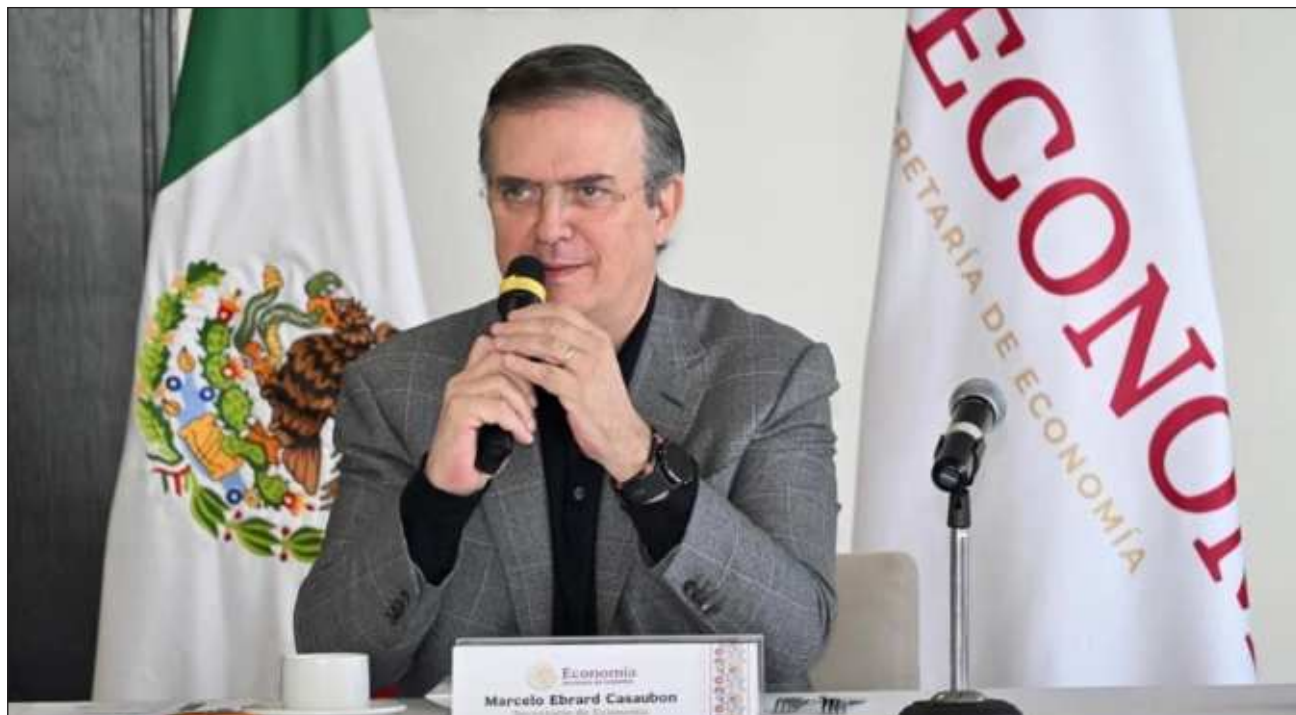
▲ Marcelo Ebrard señaló que la negociación no será tan dura como en 2018, cuando se encontró a un Donald Trump asegurando que el entonces Tratado de Libre Comercio de América del Norte, era el peor acuerdo comercial de la historia.

Para Ebrard, la revisión del T-MEC implica un reto, pero resaltó que "retos siempre habrá", por lo que ahora el equipo negociador de la