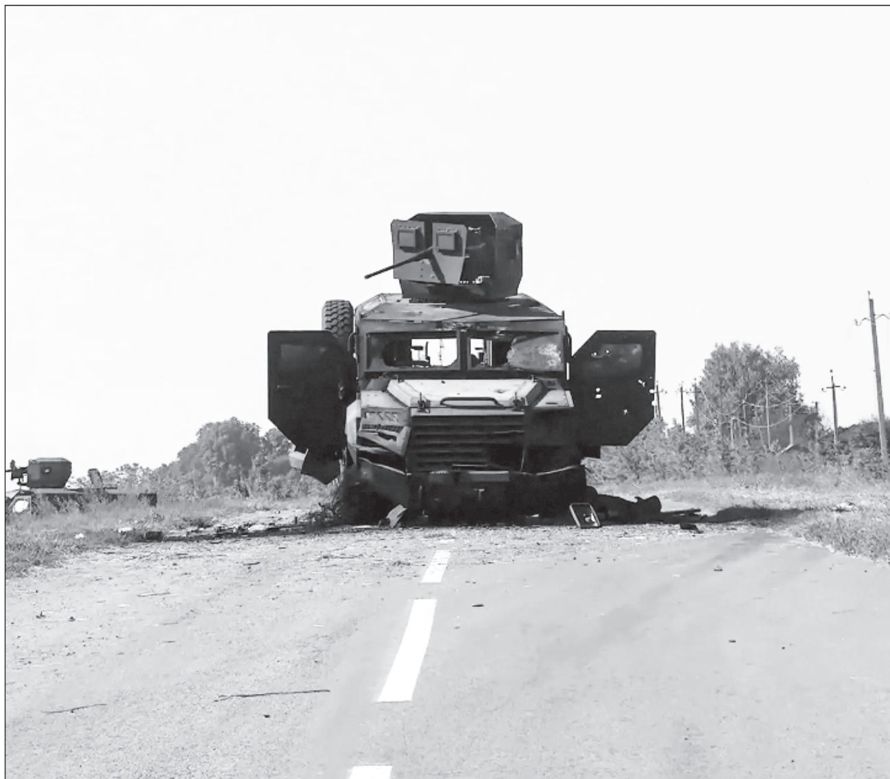
▲ El presidente ruso, Vladimir Putin, advirtió en septiembre que los países de la OTAN estarían “en guerra con Rusia” si permitían a Ucrania atacar territorio ruso con misiles occidentales de mayor alcance.

Esas posibilidades incluyen el recurso a armas nu-