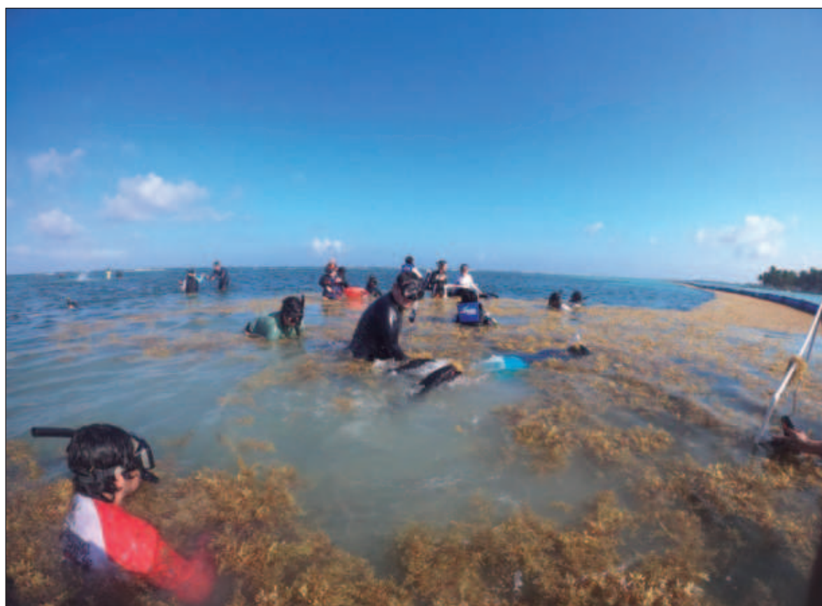
▲ Práctica de campo sobre impacto ambiental en Chuburná Puerto. Durante la actividad, se describieron sistemas ambientales e identificaron posibles golpes como parte de un proyecto hipotético de recuperación de playas.

*Responsable Técnico del Laboratorio de Calidad Ambiental; profesora de asignatura de la Licenciatura en Ciencias Ambientales y presidente del Comité de Ética en Investigación y Docencia de la ENES Mérida.