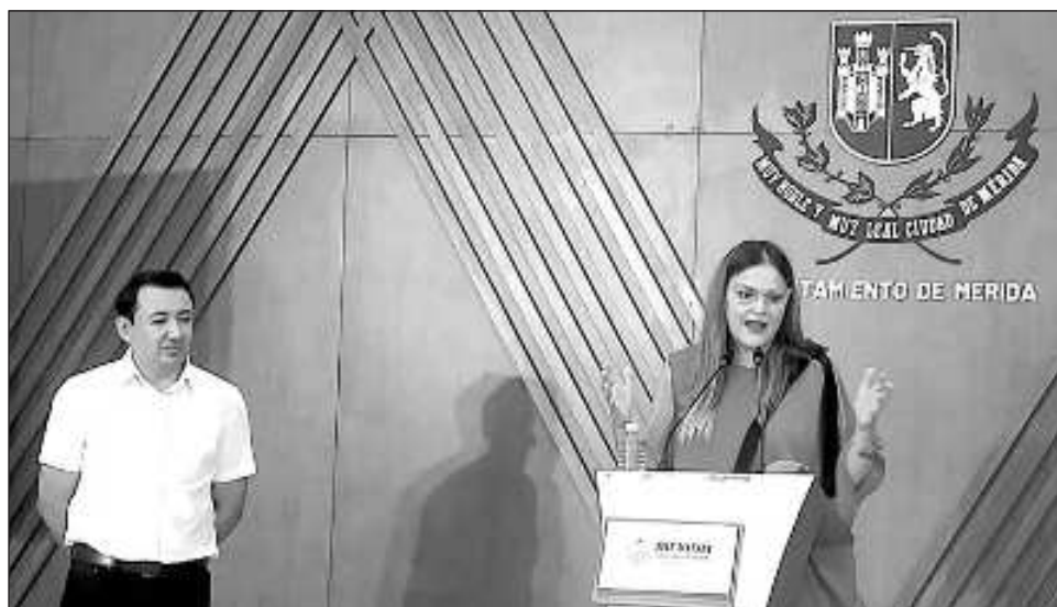
▲ Para finales de 2024, este programa pretende beneficiar a 65 familias de adultos mayores. Se tiene programado que para 2025 este apoyo municipal cubra a 250 familias.

Es requisito indispensable que los solicitantes tengan 60 años o más. Entre las acciones de mejora, se tiene contemplado los trabajos en albañilería, plomería, impermeabilización, poda y jardinería, electricidad y rampas de acceso a viviendas.