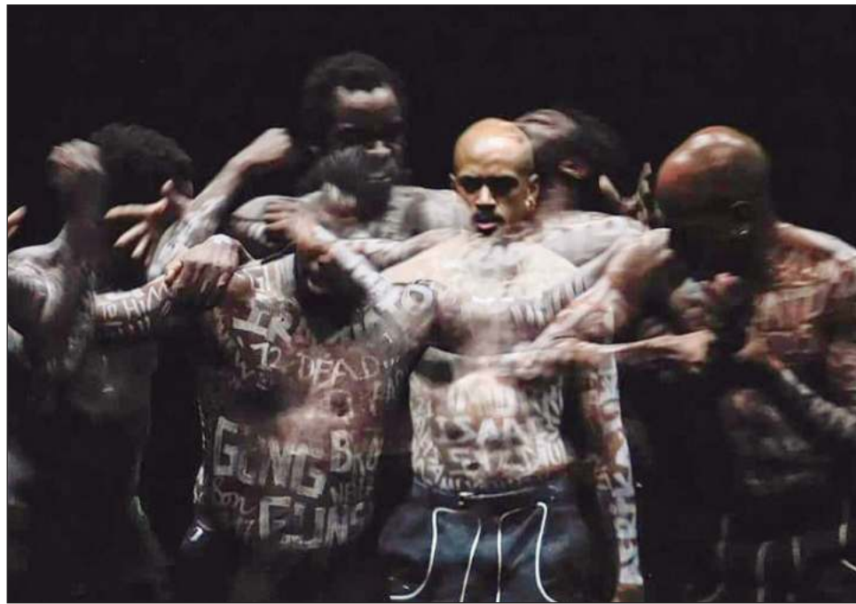
▲ A partir de testimonios de las familias de víctimas de la violencia de armas, los bailarines sirven de puente entre las voces de los afectados y el público.

“En la obra usamos testimonios de personas que han