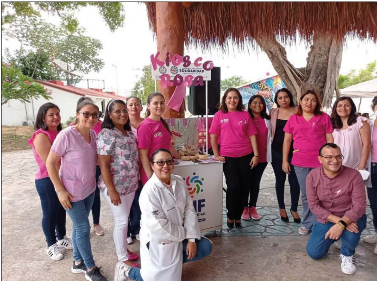
▲ Durante todo octubre, el Kiosko Rosa llevará servicios gratuitos hasta la gente, así como información preventiva y citas para mastografías. También habrá personal capacitado para enseñar cómo hacerse una autoexploración.

Con la autoexploración y análisis de las mamas también pueden detectarse otros cuadros, como procesos infecciosos o tumoraciones benignas, así como enfermedades de la piel, explicó la especialista y esto también es importante porque algunos de estos cuadros, como las infecciones crónicas, puede evolucionar a cáncer.