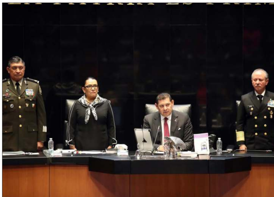
▲ La funcionaria dejó claro que el Gabinete de Seguridad Pública tiene bien definida la línea del servicio público y servir a la delincuencia y “ha elegido servir a México”.

“Sobre las filtraciones, en este gobierno no se esconde