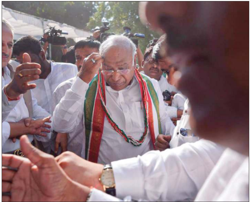
▲ El nuevo líder del partido, Mallikarjun Kharge, un experimentado político oriundo del estado de Karnataka, está considerado como un allegado de Sonia y Rahul Gandhi.

Ahora tiene por delante el desafío de las elecciones de 2024, y de las tres elecciones locales previstas el año próximo, incluyendo su estado de origen.