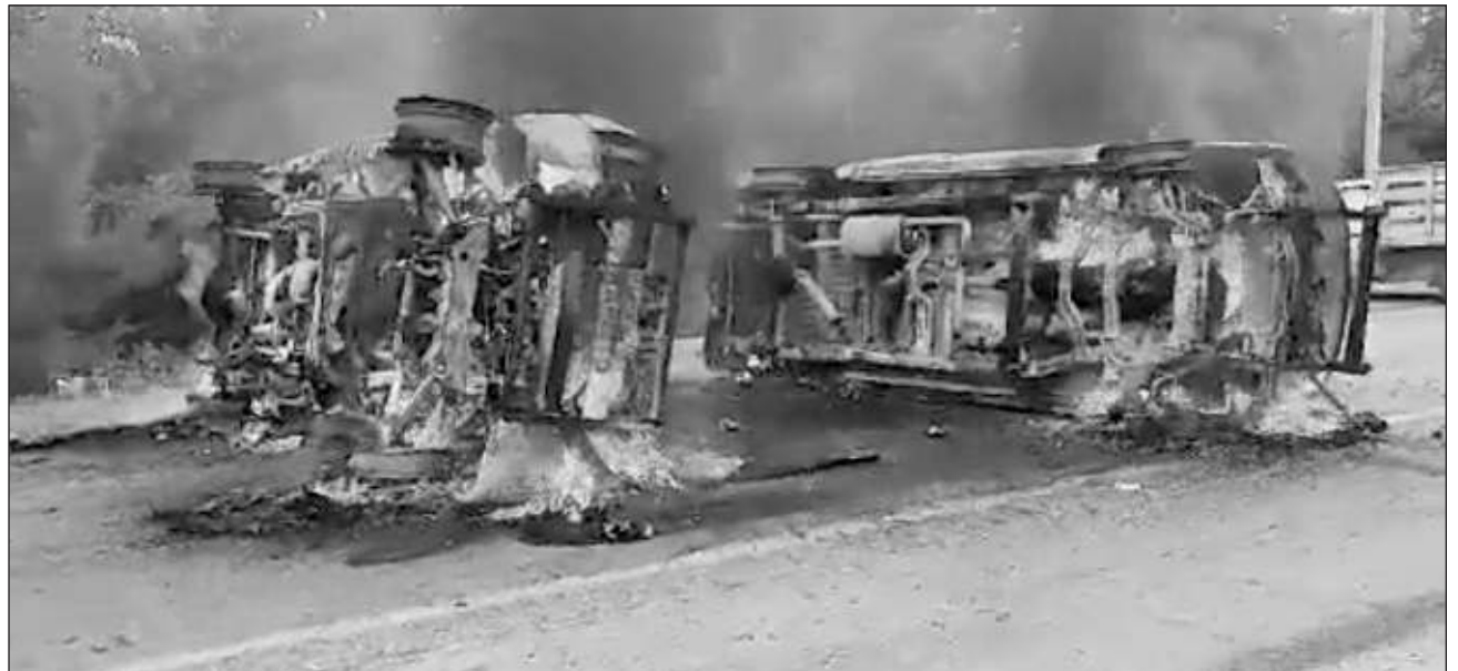
▲ En el desalojo del predio La Victoria, en Mahahual, participaron 72 elementos de la policía estatal, quienes fueron presuntamente agredidos por los vecinos. La riña tuvo como resultado dos personas heridas.