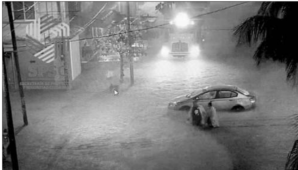
▲ En algunos sectores de la ciudad, particularmente las avenidas Aviación, Camarón, Contadores y 16 de septiembre, las inundaciones alcanzaron 80 centímetros.

Alumnos de las escuelas secundarias y preparatorias del turno vespertino y trabajadores fueron sorprendidos por la lluvia que se dejó sentir en algunos sectores