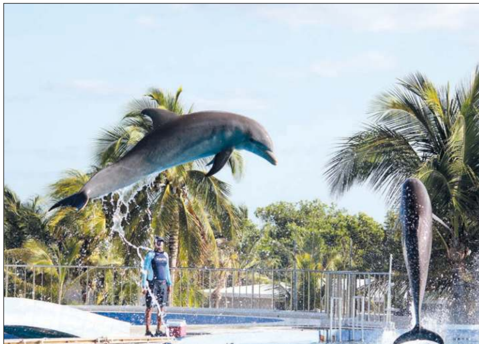
▲ México tiene 8% de los delfinarios de todo el mundo y la industria del cautiverio de delfines más grande de América Latina, según cifras presentadas por los diputados.

Las reformas precisan que “ningún ejemplar de mamífero marino, cualquiera que sea la especie, podrá ser sujeto de aprovechamiento extractivo”, ya sea de subsistencia o comercial, con excepción de la captura que tenga por objeto la investigación científica o con propósitos de enseñanza, para su conservación y preservación.