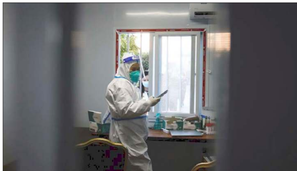
▲ Levantar la declaración de emergencia por el Covid-19 implicaría suspender medidas sanitarias y sociales justo antes del aumento previsto de casos por el invierno septentrional.

Esta decisión fue recomendada por un grupo internacional de expertos que forman el Comité de Emergencia de la OMS, responsable de evaluar cada tres meses si la propagación de una enfermedad constituye una amenaza para la salud