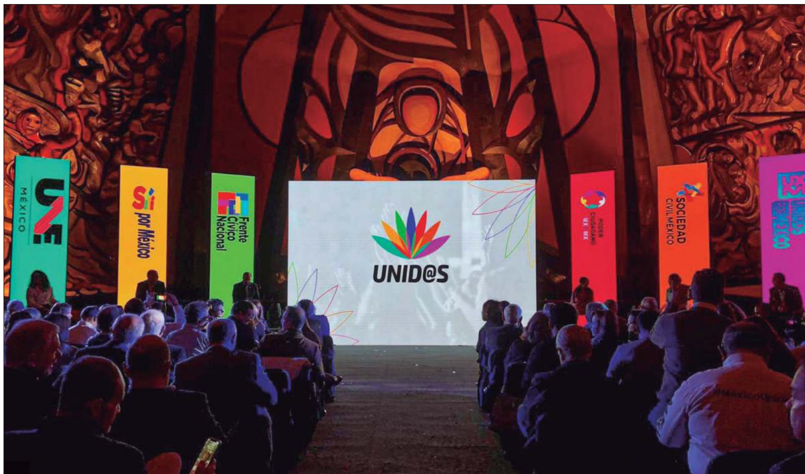
▲ "Tras el rompimiento de Va Por México , los mismos promotores de esa alianza se ostentan como 'sociedad civil' escudados en organizaciones que tienen su génesis y directrices en los partidos PAN-PRI-PRD. Su nombre es UNID@S, pero la estrategia es la misma: polarizar, mentir, odiar".