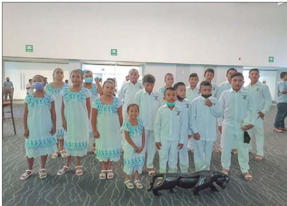
▲ La finalidad del coro es fomentar en los niños de la comunidad de Kinchil la lengua maya, pues la tradición se ha ido perdiendo debido a la educación obligatoria en español.

Los menores, junto a otros niños y niñas, portando el traje típico de Yu-