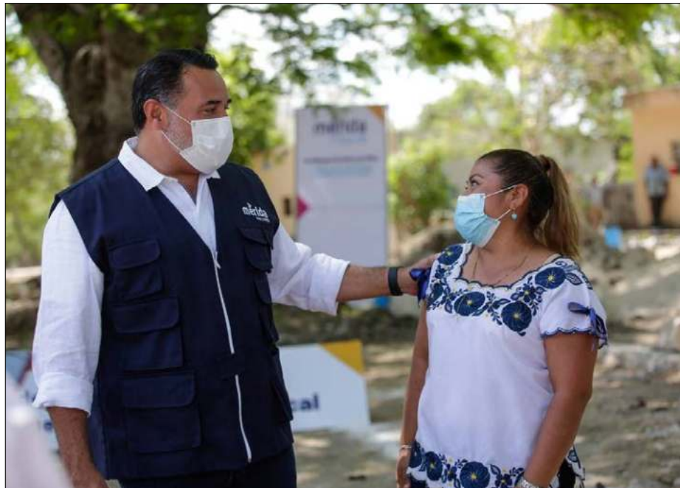
▲ De acuerdo con el alcalde Renán Barrera, el ayuntamiento de Mérida trabaja "para que los programas y acciones alcancen cada vez a más personas".

Cabe señalar que el Coneval indicó que en 2020