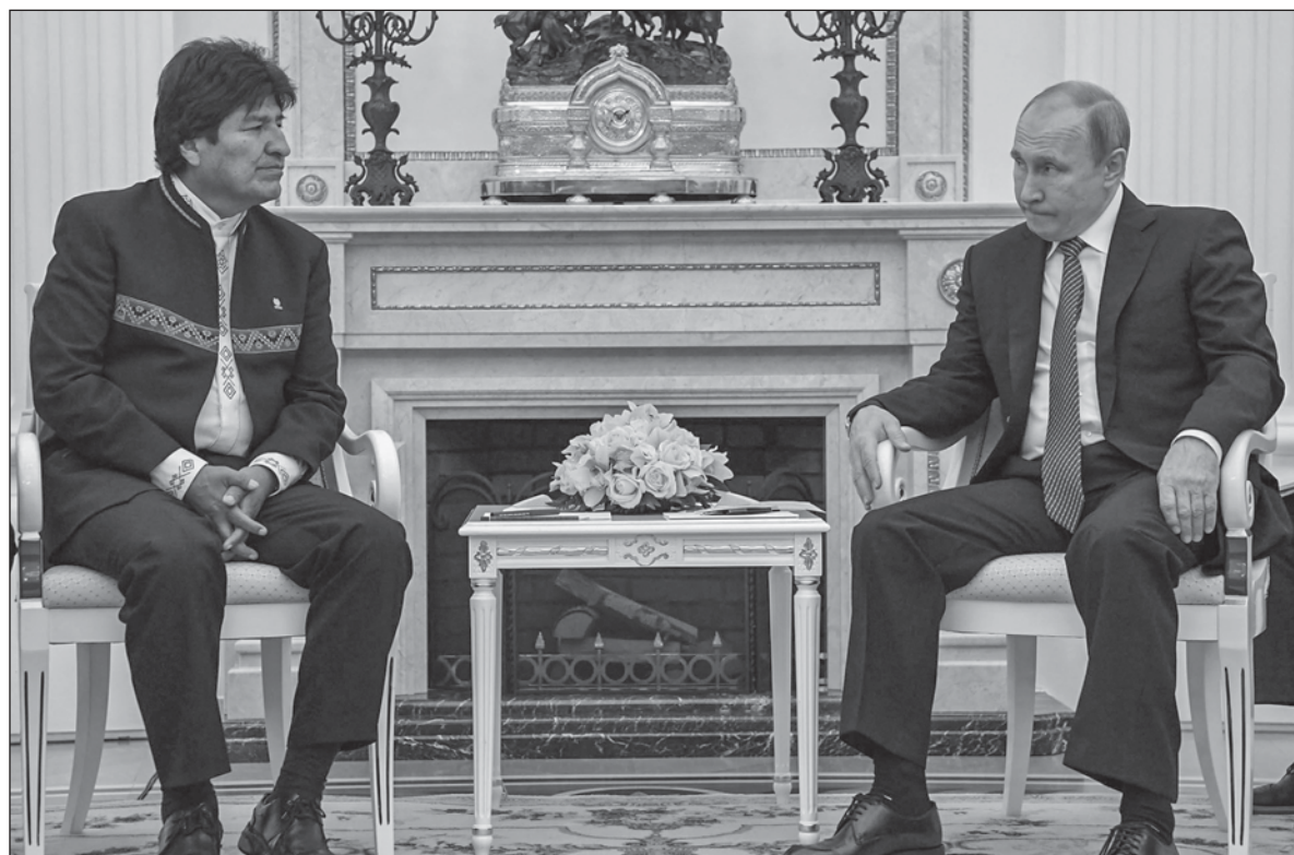
▲ “Today, Venezuela, Nicaragua and Bolivia owe the Russians plenty of money for arms and other support they have received as Putin tries to penetrate what the U.S. appears to claim is its sphere of influence”.

NICARAGUA’S DANIEL ORTEGA was and continues to be a loyal client of Russia’s. He remembers that the U.S. supported the Con-