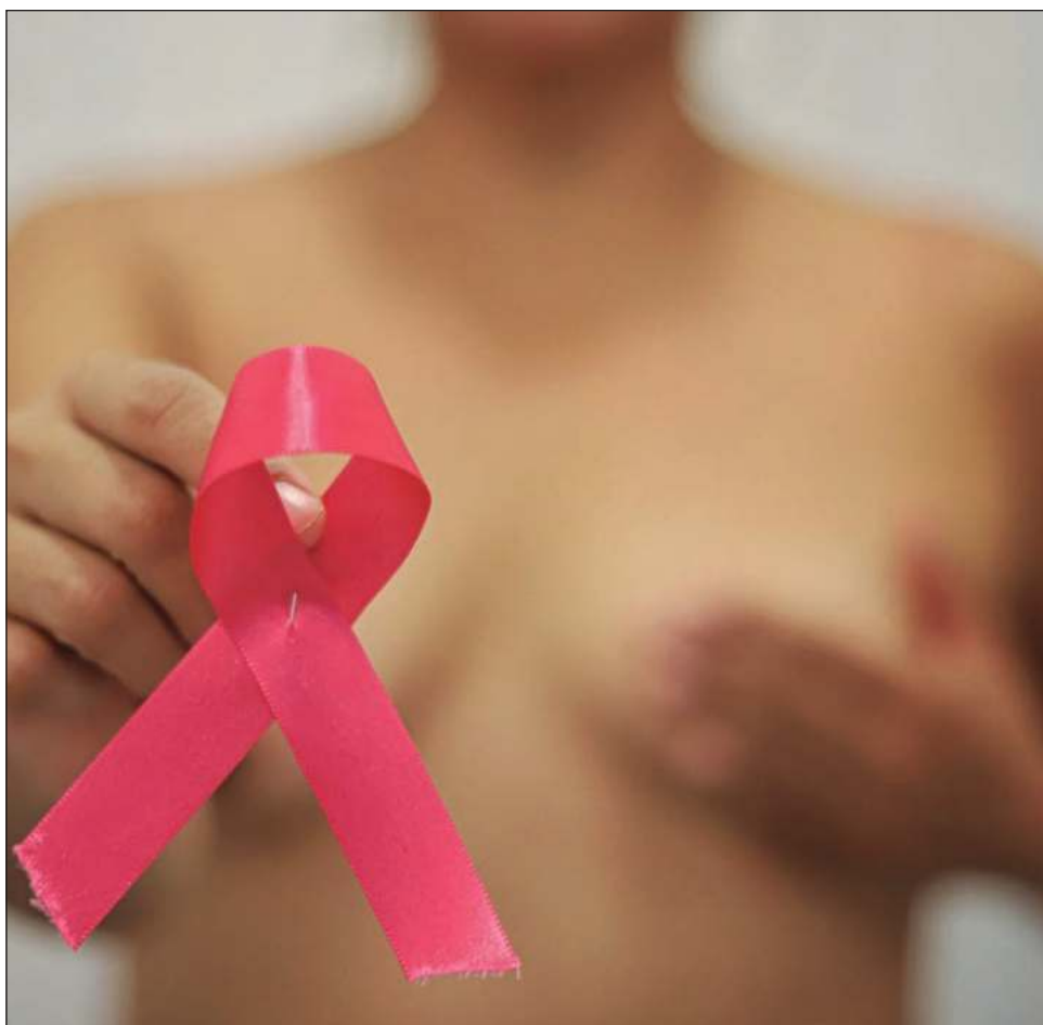
▲ “Escudriña buscando ese bulto extraño que puede combatirse si se detecta a tiempo (...) es una enfermedad silenciosa que no siempre muestra síntomas”.

Aunque en este mes el tema cobra impulso, resaltó que el fin es visibilizar la lucha, pero que esto no significa que solamente sea relevante durante octubre.