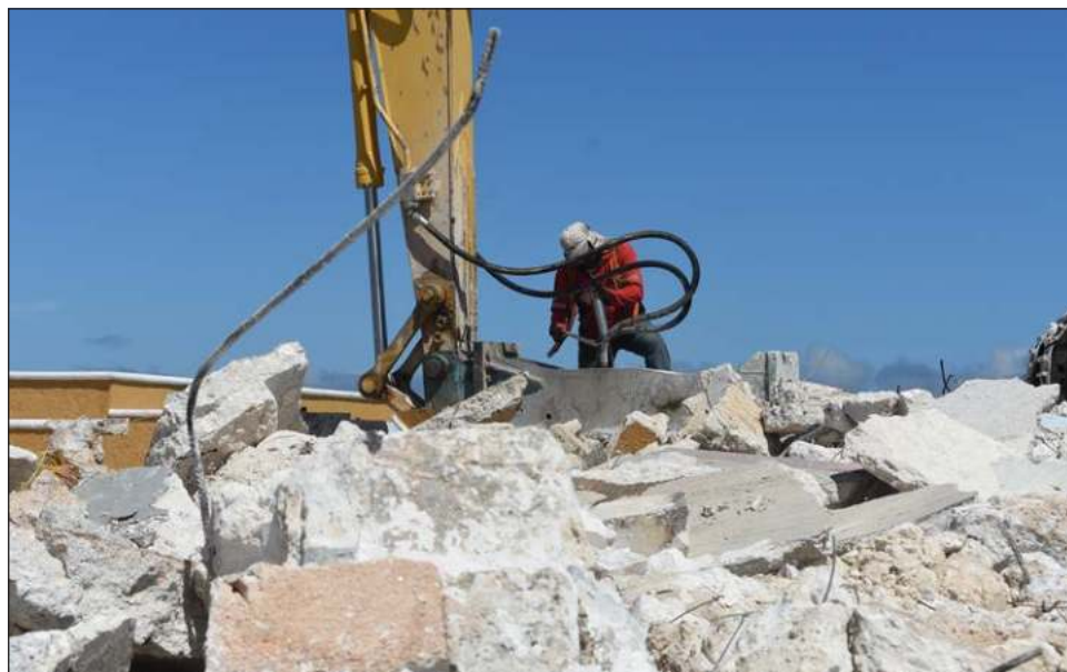
▲ La gobernadora Layda Sansores señaló que coincidió con la alcaldesa Biby Karen Rabelo en utilizar el recurso del pueblo en las situaciones correctas.

"Era momento de cambiar todo, nosotros no entramos al gobierno con la espada desenvainada ni buscando venganza; nosotros buscamos justicia y no hay mejor justicia y política para el pueblo que atender sus necesidades y hacer de Campeche municipio un