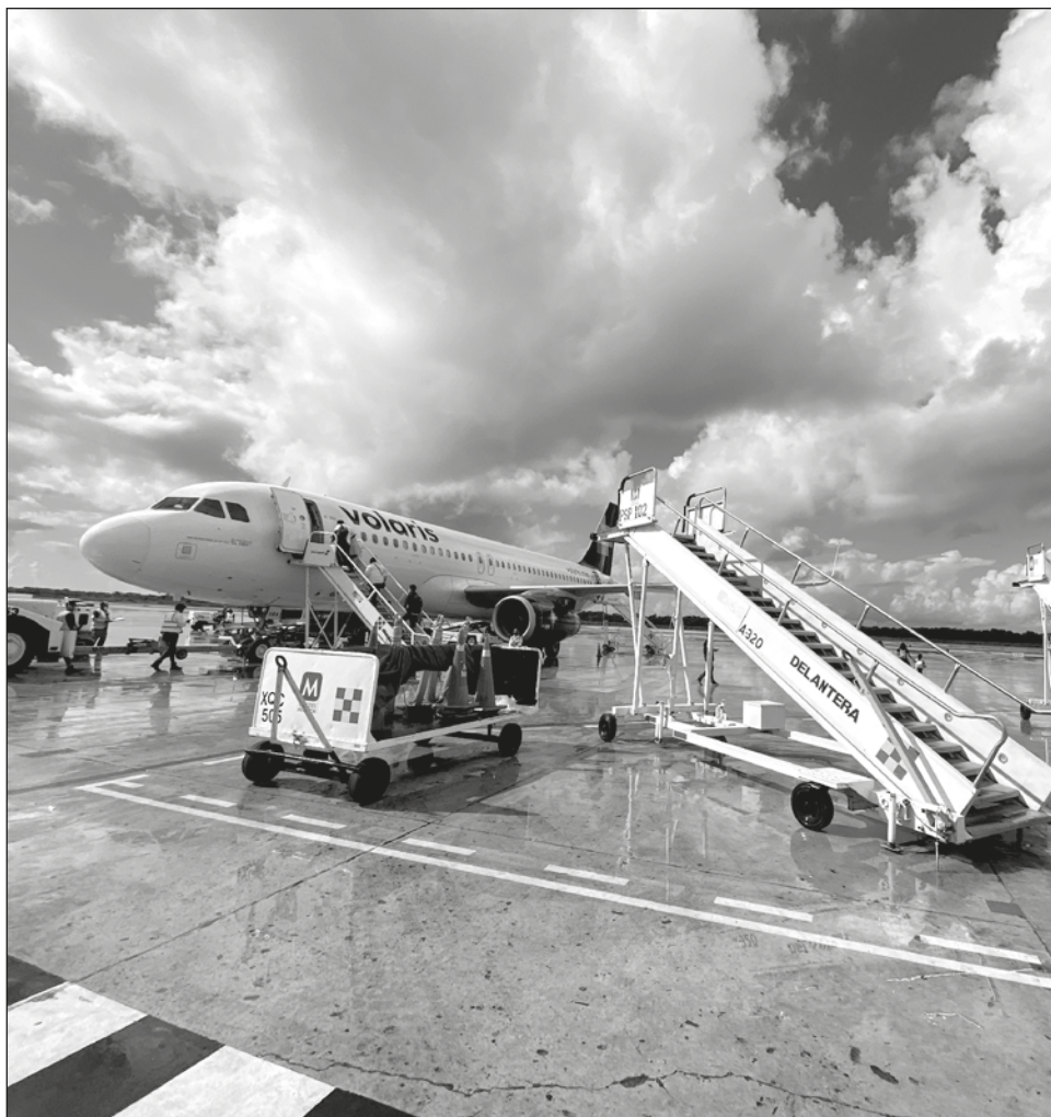
▲ Yucatán ha superado las cifras de pasajeros previas a la pandemia. Foto Juan Manuel Valdivia

Recordó que Viva Aerobus tendrá en Mérida su nuevo hub de operaciones, lo que representará empleos para la región.