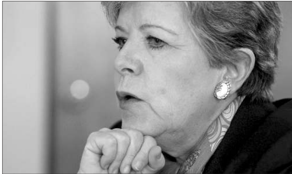
▲ Alicia Bárcena Ibarra, embajadora de México en Chile, se negó a hablar de su anunciada candidatura a dirigir el Banco Interamericano de Desarrollo, pero habló de estrategias.

Sobre la reunión de los presidentes: "En el corto plazo en México habrá un evento que es la cumbre de la Alianza del Pacífico, se van a reunir los cuatro gobiernos el 24 y 25 de noviembre. Es muy