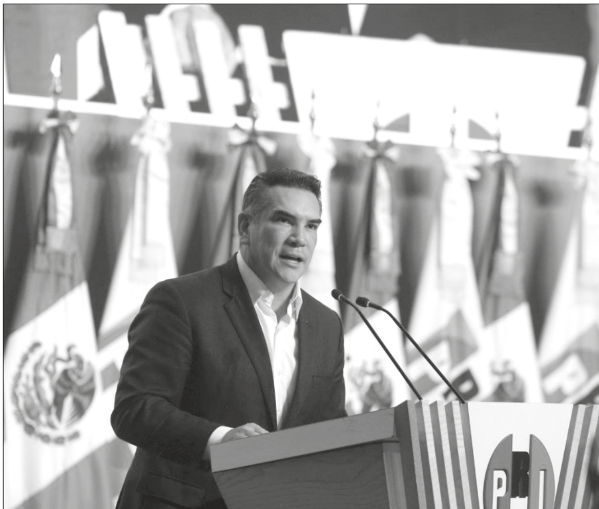
▲ “La rehabilitación alcanzó al político con mayor densidad judicial hasta hace semanas, Alito, quien ganó una impunidad ostentosa, pero también a sus compañeros legisladores y a la militancia priísta en general”.