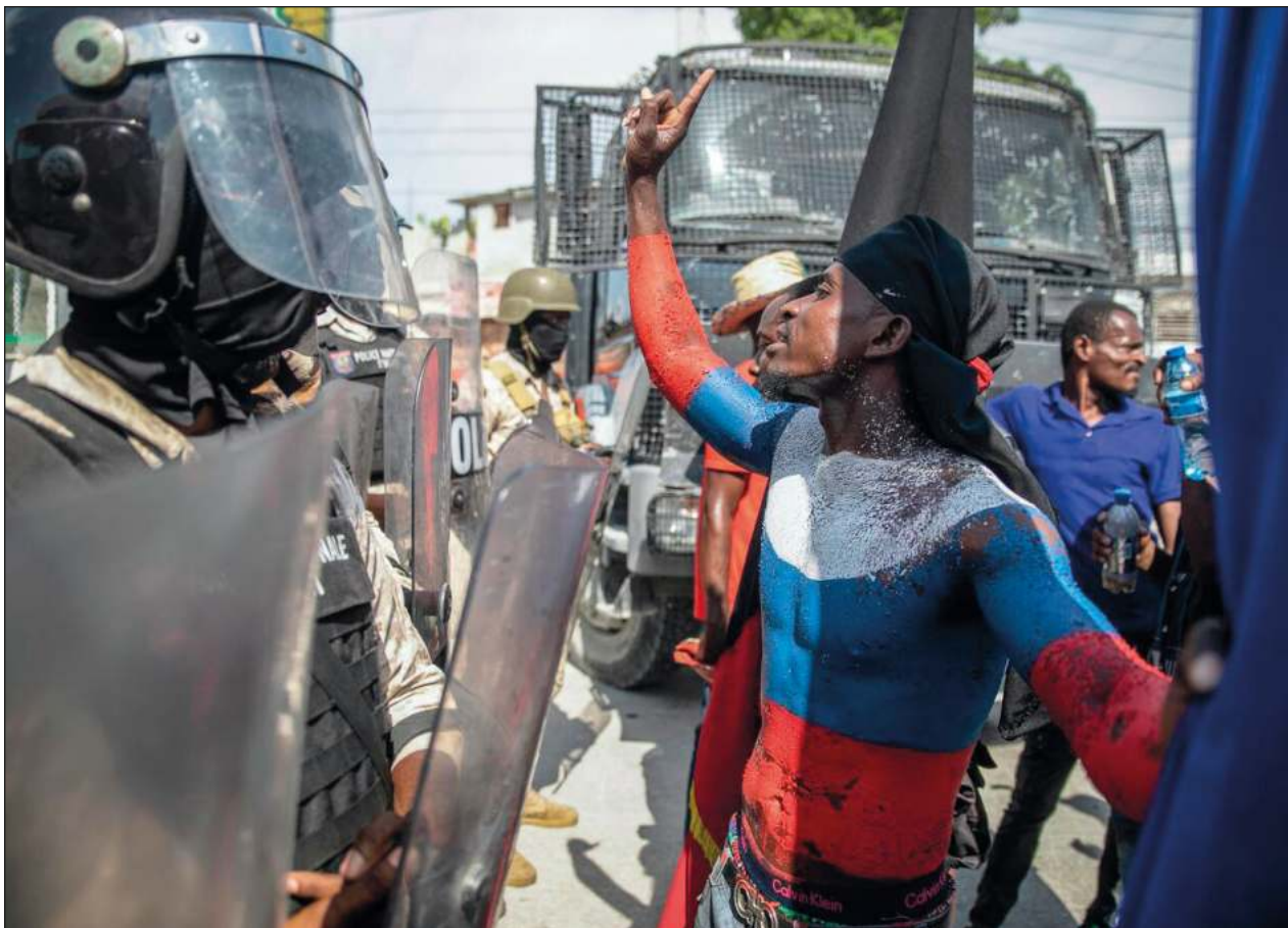
▲ Pandillas de Haití bloquearon la entrada al depósito de combustibles Varreux, tras la medida de subida de precios, provocando una escasez justo cuando también hay falta de agua y el país lidia con un brote de cólera.

“Tengo la delicada misión de llevar ante el Consejo de Seguridad el grito de angustia de todo un pueblo (...) los haitianos no viven, sobreviven”, declaró ante el Consejo el ministro de Exteriores de Haití, Jean Victor Geneus. Mientras siguen aumentando los casos de cólera, manifestantes volvieron a protestar el lunes en Puerto Príncipe y otras regiones de la isla para exigir la renuncia del jefe del gobierno.