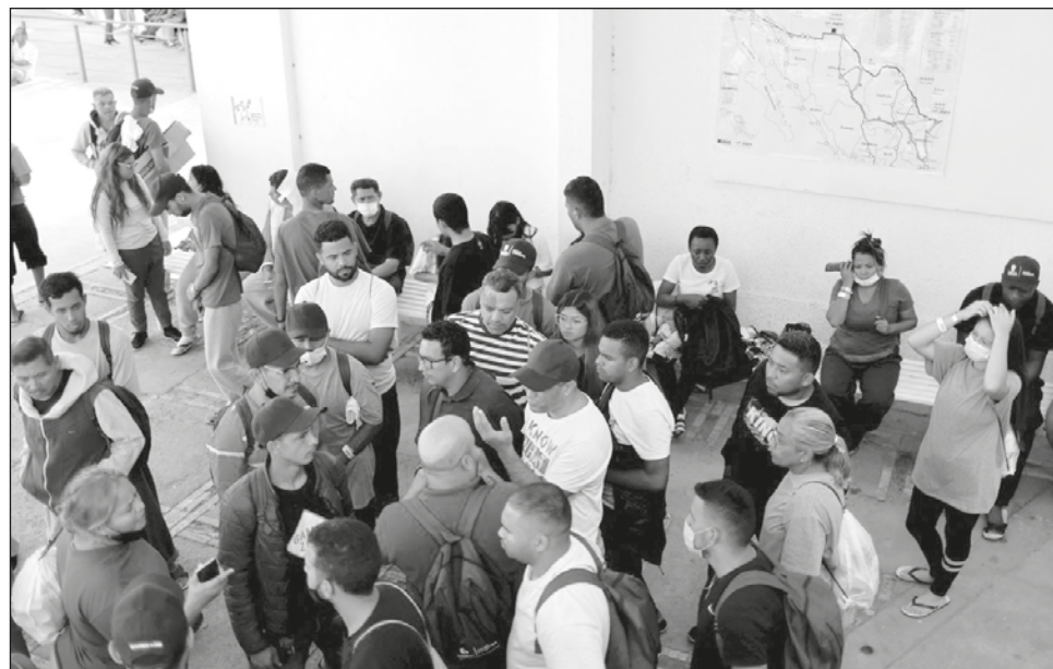
▲ Un grupo de 40 personas irrumpió durante la madrugada en la estación para incitar a migrantes retenidos en las celdas a unirse a la protesta para exigir que no los deporten.