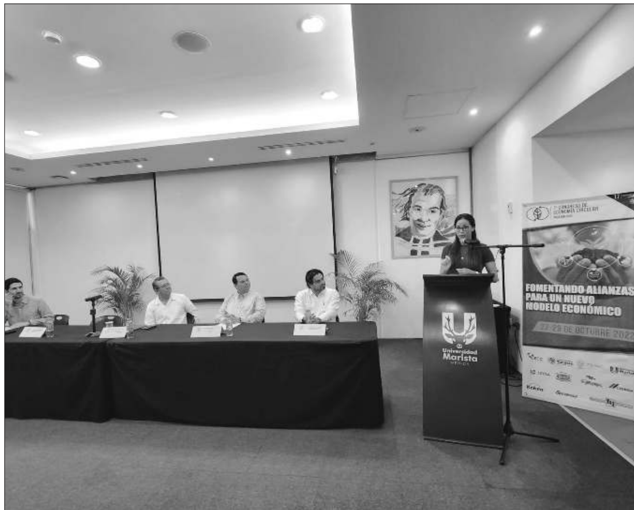
▲ El Congreso de Economía Circular se celebrará en la Universidad Marista del 27 al 29 de octubre.

La Secretaría de Desarrollo Sustentable (SDS), la Secretaría de Fomento Económico y Trabajo (Sefoet) y el Instituto Yucateco de Emprendedores (IYEM), integran el comité organizador con la casa de estudios sede.