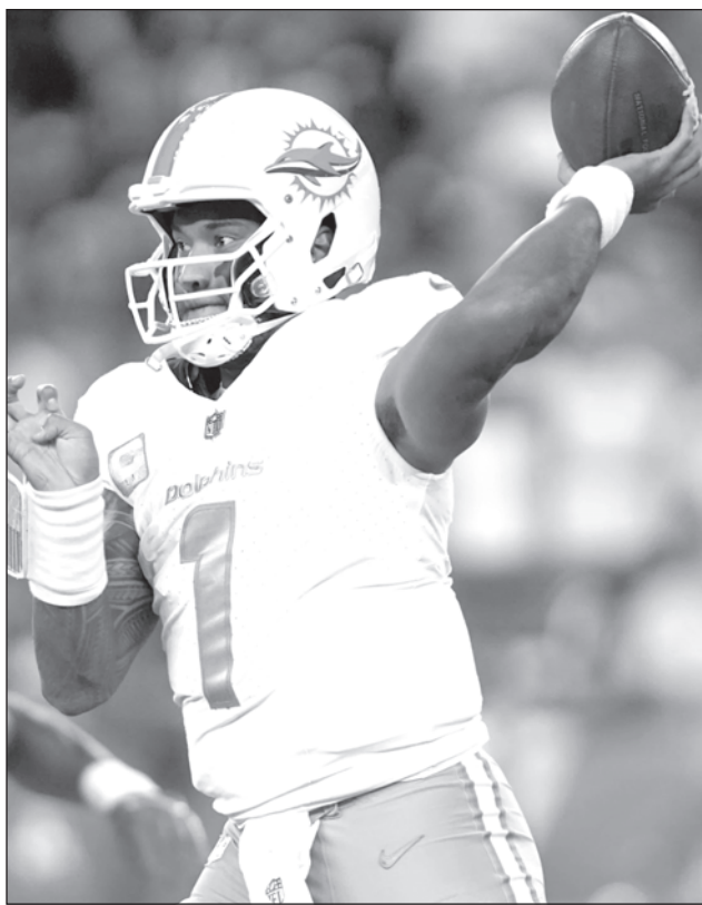
▲ Bajo el mando de Tua Tagovailoa, la ofensiva de los Delfines es explosiva y productiva. Este domingo, Miami buscará mejorar a 3-0.

Entre las decepciones, luego de dos semanas de actividad, destacan los Bengalíes de Cincinnati, que después de otorgar un contrato millonario que colocó a Joe Burrow, su quarterback, como el mejor pagado de la NFL, acumulan dos derrotas.