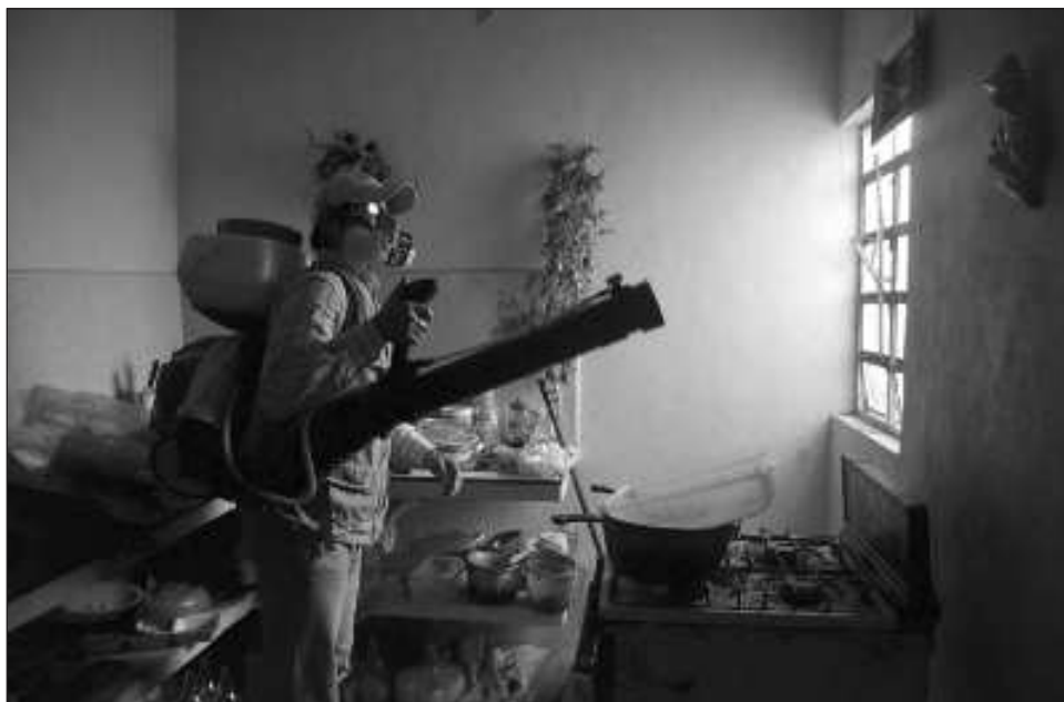
▲ En las últimas semanas, la dependencia estatal de Salud ha trabajado en la implementación de medidas para combatir el dengue, interviniendo en 148 mil 700 hogares.

Hizo un llamado a “que mantengamos nuestros hogares y espacios comunita-