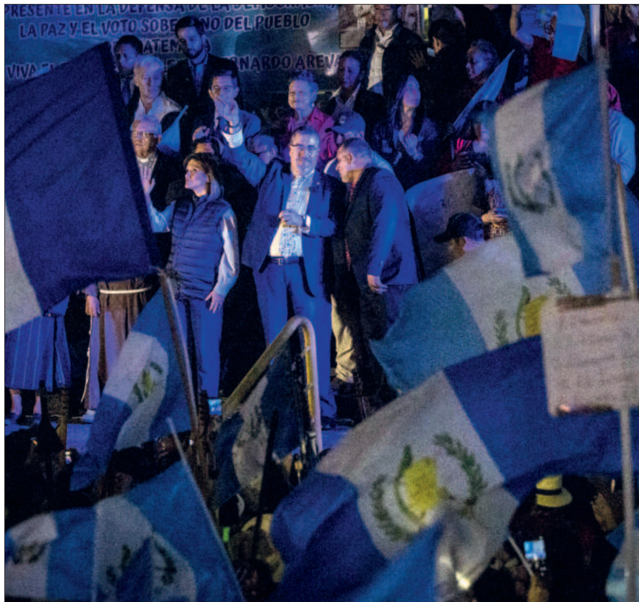
▲ El embajador de Estados Unidos ante la OEA, Francisco Mora, instó el lunes a las autoridades guatemaltecas a poner fin a sus "esfuerzos de intimidación" contra funcionarios electorales y miembros del partido de Arévalo.

Mora calificó los allanamientos como "un asalto al Estado de derecho".