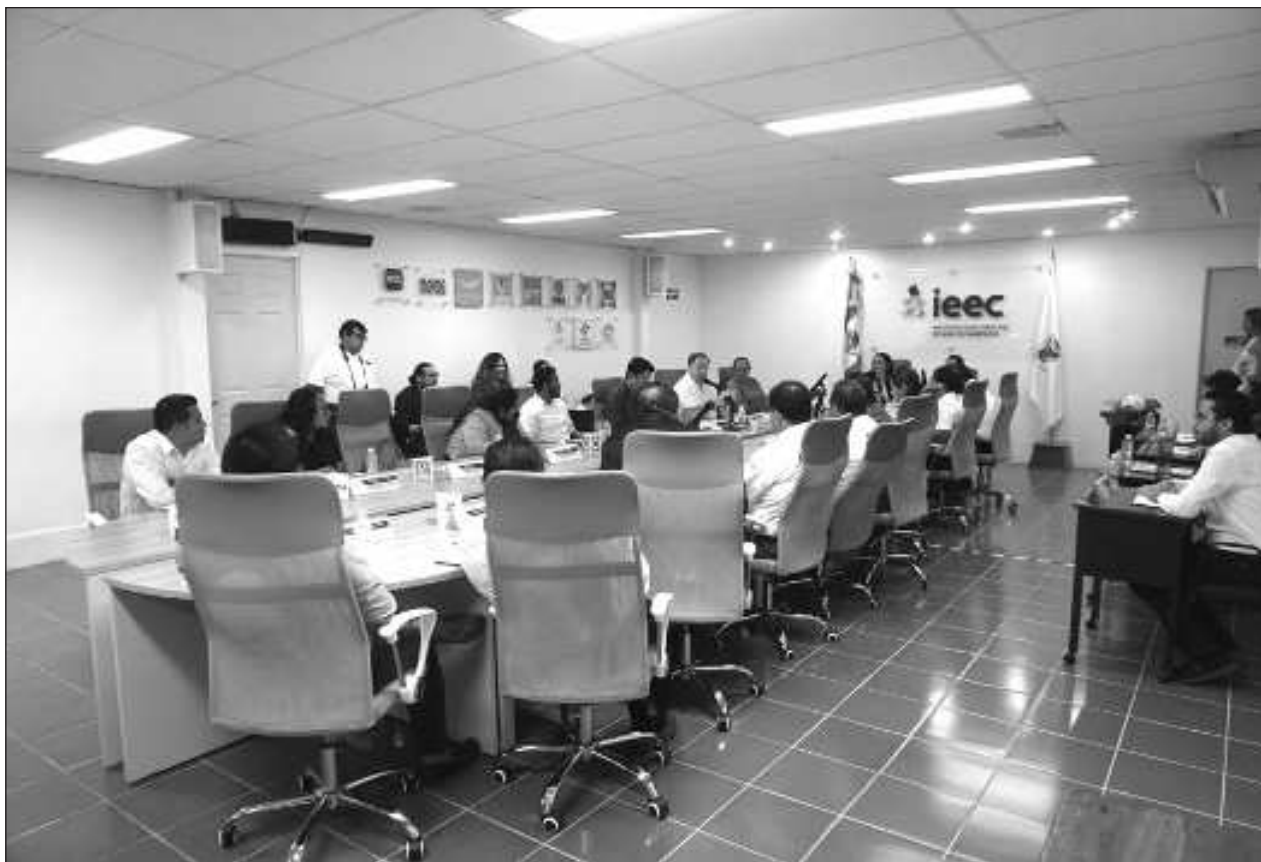
▲ La presidente del Instituto Electoral del Estado de Campeche afirmó que "parece más golpeteo político, pero no me corresponde señalar a nadie y prefiero no meterme en esos temas controversiales, mi única función es defender al IEEC".

Proyectaron un video con las actividades, más de 100 reformas de leyes aprobadas, 15 de estas emanadas del ejecutivo estatal, entre los logros más llamativos; sin embargo, hubo un momento en el cual dijo Gómez Cazarín "el pueblo quiere trabajo, que nos dejemos de peleas pues el no estar de acuerdo solo generó atrasos en las actividades legislativas de importancia, el pueblo lo que quiere es esto", señaló.