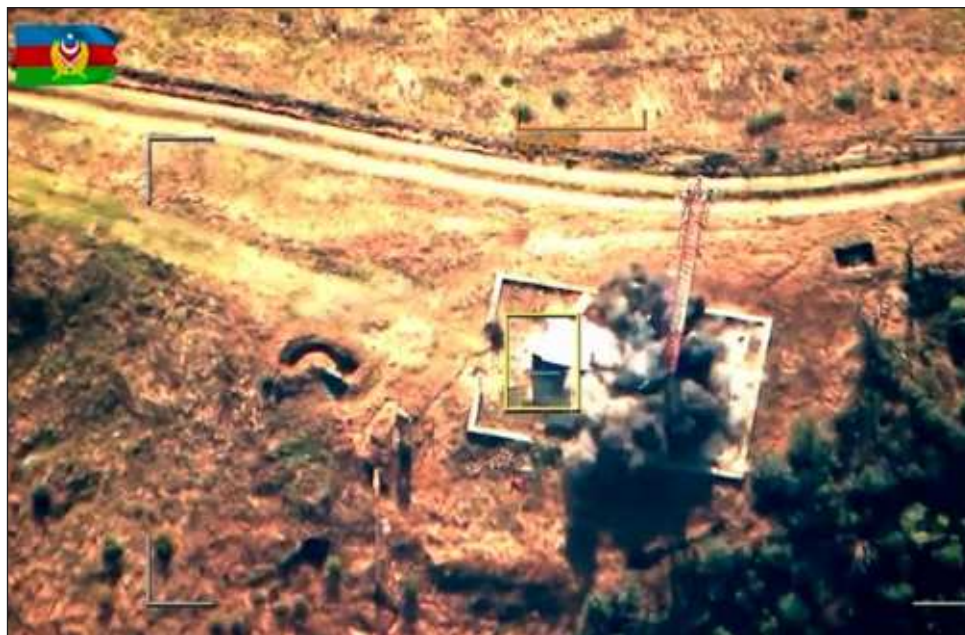
▲ La operación militar del Ejército azerbaiyano en el territorio separatista de Nagorno Karabaj tiene lugar tres años después de la última guerra entre ambos bandos.

El Ministerio armenio de Defensa recalcó, sin em-