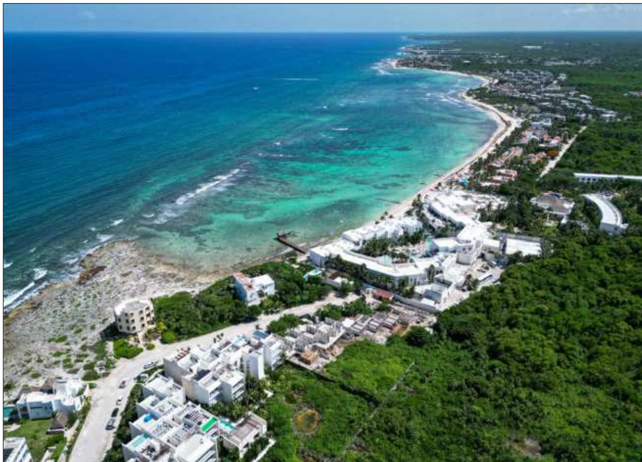
▲ La declaración de áreas naturales protegidas es una de las acciones con las que el gobierno federal contribuye al combate contra el cambio climático; la otra es el programa de reforestación Sembrando Vida.