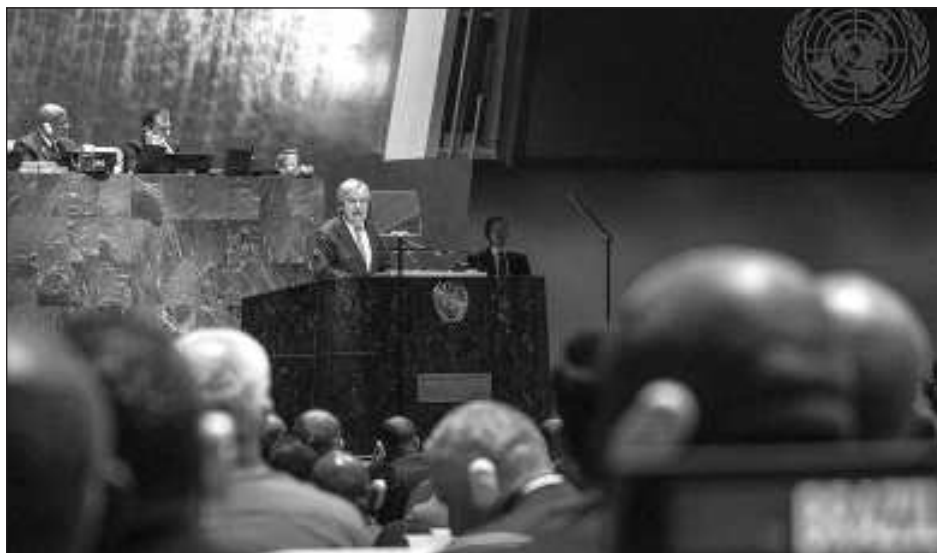
▲ La primera cumbre presencial de líderes mundiales desde que la pandemia trastocó los desplazamientos globales, tiene 145 discursos de mandatarios programados.

"El mundo ha cambiado. Nuestras instituciones, no", dijo Guterres antes de la apertura del debate en la Asamblea General. "No podemos responder eficaz-