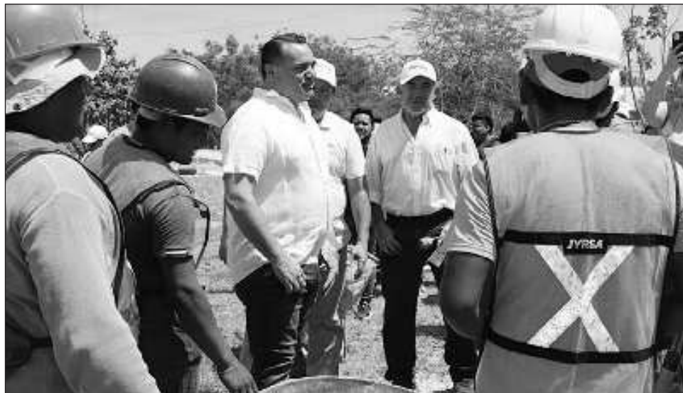
▲ Como parte del Día Nacional de Protección Civil se realizó un simulacro de incendio en todos los edificios municipales e impartieron un curso a brigadistas.

La responsabilidad de la Comuna de proteger a las y los meridanos requiere una capacitación continua para brindar atención en los edificios públicos en caso de suceder un siniestro; además, hay protocolos para garantizar la seguridad dentro del