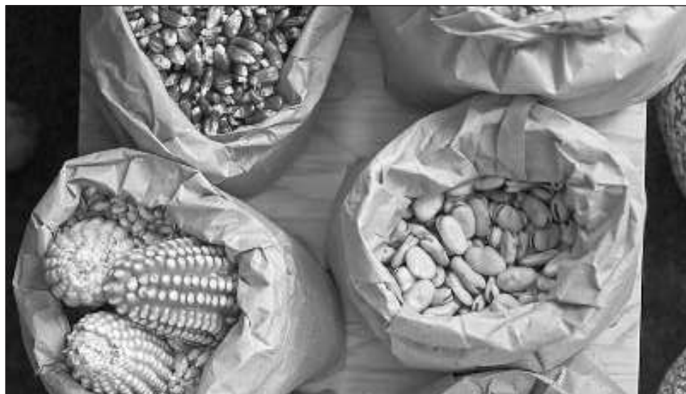
▲ Una de las actividades de mayor importancia es el encuentro de saberes e intercambio de semillas, entre productores, ya que ello "permitirá conocer y recuperar semillas que hoy día son cultivadas muy poco en el país", señalaron los organizadores.

También se realizará el foro En Defensa del Decreto Presidencial sobre Maíz Transgénico, Glifosato y Transición Agroecológica ,