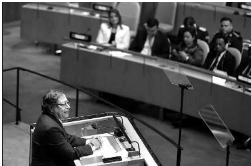
▲ "A Latinoamérica la han llamado para entregar máquinas de guerra, hombres para ir a los campos de combate; se olvidaron que a nuestros países los invadieron varias veces los mismos que ahora hablan de luchar contra invasiones", dijo el presidente colombiano.

"Nos hemos dedicado a la guerra, nos han convocado a la guerra, a Latinoamérica la han llamado para entregar máquinas de guerra, hombres para ir a los campos de combate; se olvidaron que a nuestros países los invadieron varias veces el mismo que ahora hablan de luchar contra invasiones", criticó el presidente colombiano.