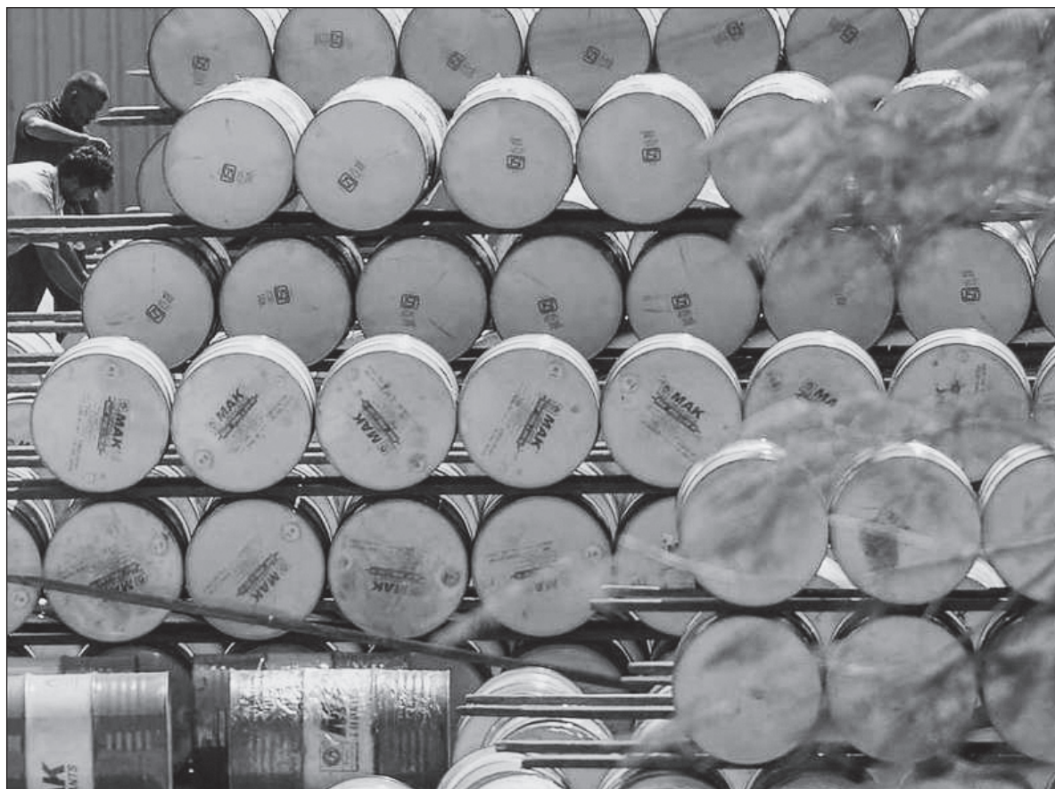
▲ "Hace 40 años hubiera sido una gran noticia que el precio del petróleo se fuera al infinito, algo que vanamente esperó el presidente López Portillo. Disfrutó unos meses de alzas continuas, pero de un día a otro el precio se vino al suelo y quebró al país".

HACE 40 AÑOS hubiera sido una gran noticia que el precio del petróleo se fuera al infinito, algo que vanamente esperó el presidente López Portillo. Disfrutó unos meses de alzas continuas, pero de un día a otro el precio se vino al suelo y quebró al país. Por fortuna, México dejó de ser un país dependiente de la exportación de petróleo, la economía se ha diversificado y, ¡oh, paradoja!, el principal ingreso de divisas proviene de los migrantes, las familias que huyeron de nuestro país con motivo de las recurrentes crisis financieras, las devaluaciones y los desplomes petroleros, que se reflejaban en desempleo y pobreza. Sin embargo, los vaivenes del mercado de la energía siguen afectándolo.