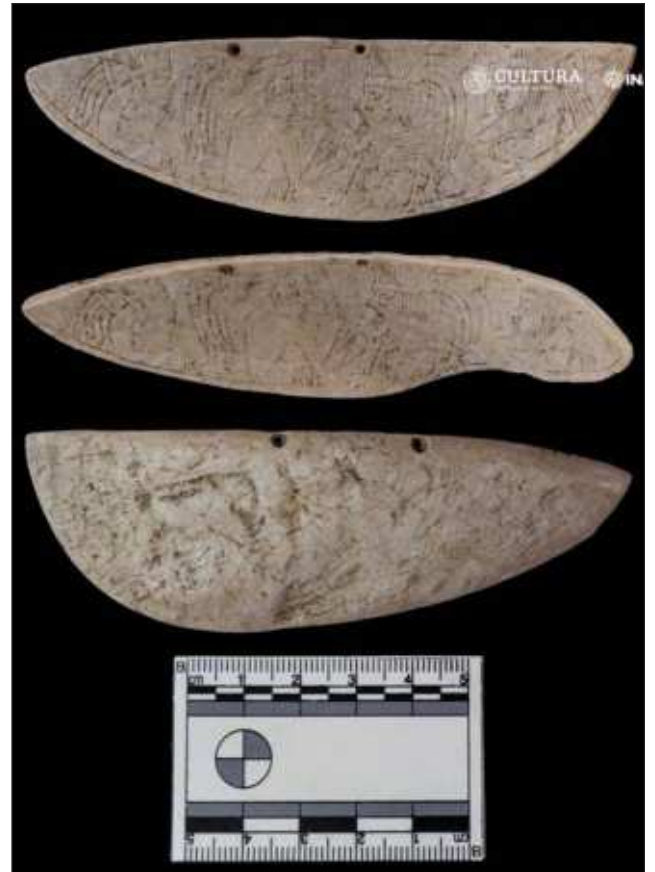
▲ El accesorio, que pudo ser labrado en la época prehispánica entre los años 830 y 900 de nuestra era, mide 9.7 centímetros de largo y 2.9 centímetros de ancho, con un milímetro de grosor.

La pieza recién descubierta permanecerá bajo el resguardo del INAH y continuará bajo estudio, dado que, por su calidad y excepcionalidad, se contempla su futura exhibición en una sede por definir.