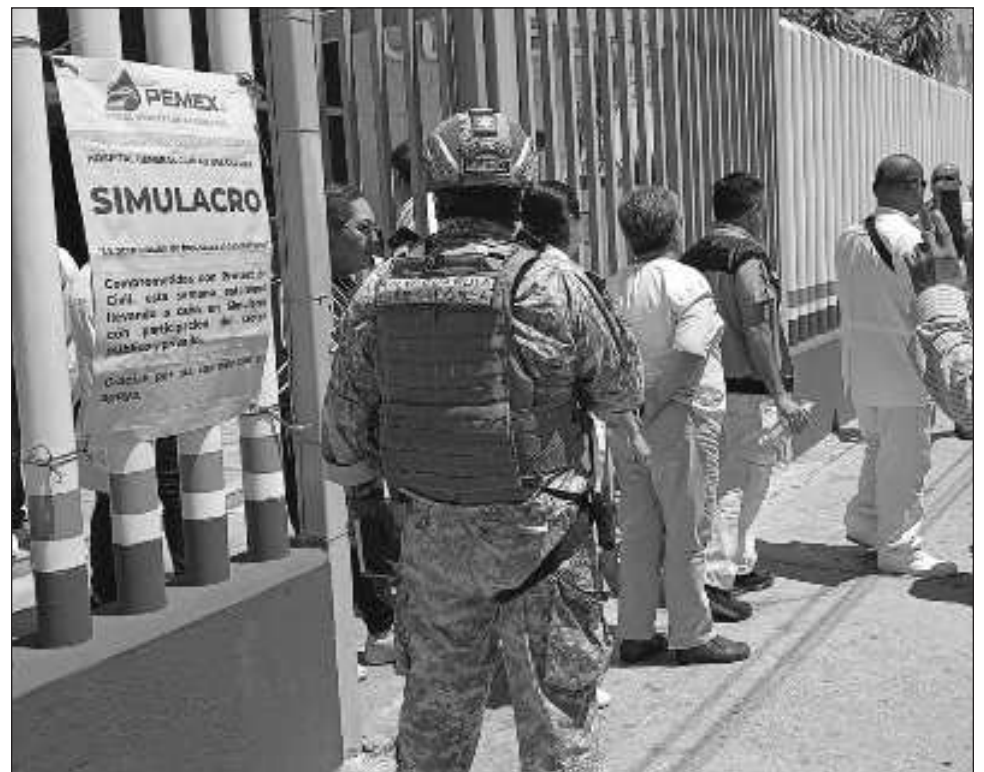
▲ En las instalaciones de Pemex en tierra, se estima que colaboraron 4 mil obreros.

De la misma manera, el Hospital General de Sabancuy, el Conalep plantel Ciudad del Carmen, así como empresas y diversas depen-