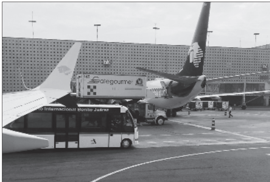
▲ El Presidente remarcó que lo cierto es que aún sin tener esa categoría, la aviación en el país "despegó; después de la crisis creció el número de operaciones".

"No tenemos una proyección sobre cómo va a beneficiar el que sea regresado a categoría 1. Los de la aviación comercial, los que operan todo lo relacionado con los viajes de aviones y de turismo, hablan de que va a ayudar mucho a que sigan creciendo el número de operaciones, los vuelos a EU sobre todo. Pero no tenemos nosotros una proyección".