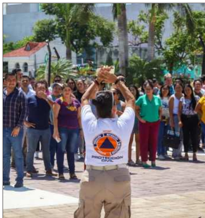
▲ Será grave si dejamos de atender los llamados de las autoridades a la preparación para un posible huracán.

Sin embargo, la mayor amenaza para los tres estados si-