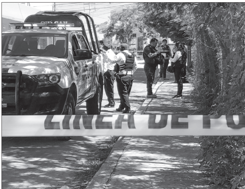
▲ En Baja California han sido seis meses con tendencia ascendente de homicidios, y en Chihuahua en agosto se dieron 24 homicidios más que el mes anterior.

Rosa Icela señaló que meses anteriores se presentaron casi 83 asesinatos por día