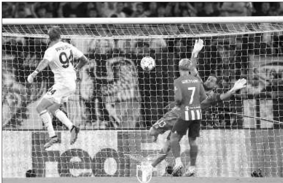
▲ El arquero Provedel evitó la caída de la Lazio con un gol en el último minuto. El italiano se convirtió en apenas el cuarto portero que anota en la Liga de Campeones.

Celtic finalizó con nueve jugadores, al caer por 2-0 en Feyenoord. La racha del campeón escocés sin triunfo en la fase de grupos se amplió a 11 partidos.