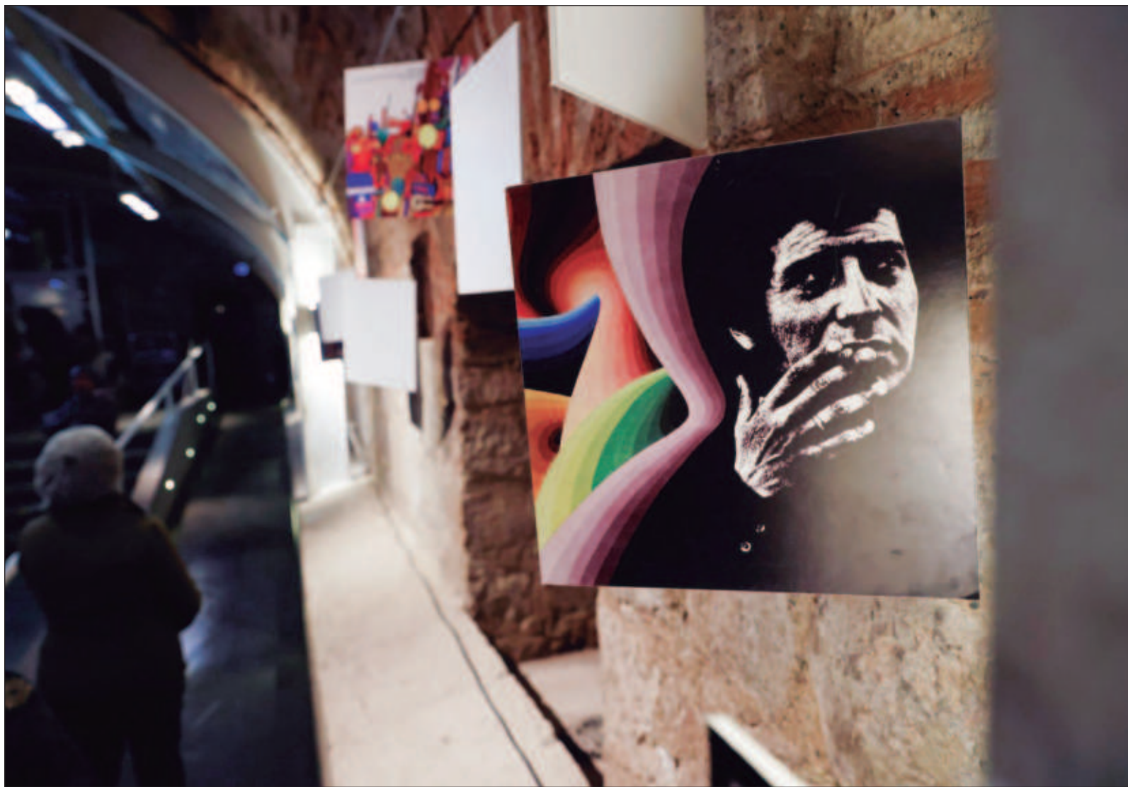
▲ "Tras el golpe militar fue detenido y torturado, se le condujo al Estadio Chile –que hoy lleva su nombre– y ahí vivió sus días finales, sintiendo el odio fascista al amor por la humanidad. Antes de su muerte escribió sus últimos versos: La sangre para ellos son medallas / La matanza es un acto de heroísmo".