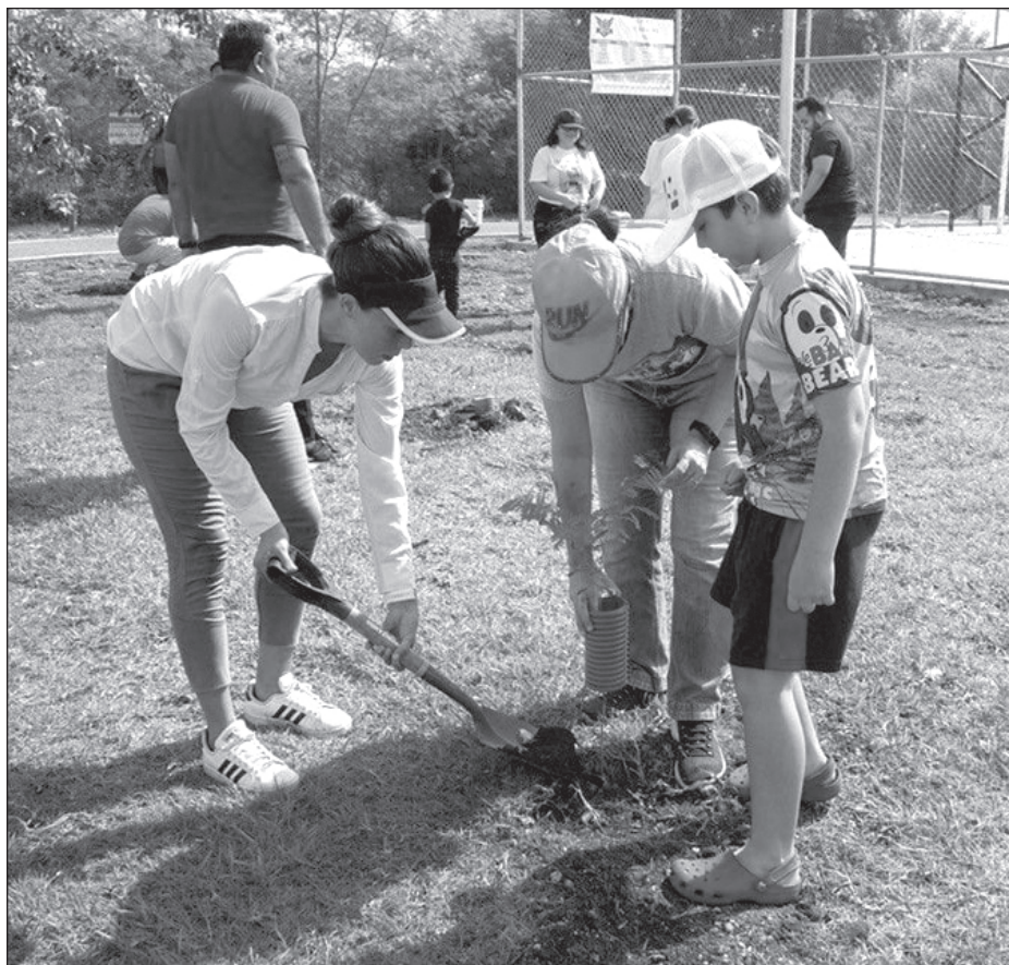
▲ El esquema Un niño, un árbol consiste en sembrar más de 300 mil unidades durante los cursos 2022-2023 y 2023-2024, en beneficio de 352 mil 423 niñas y niños.

Las nueve entidades que elegirán gobernadores el próximo año son Ciudad de México, Chiapas, Morelos, Guanajuato, Jalisco, Tabasco, Veracruz, Puebla y Yucatán.