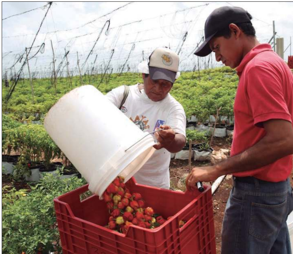
▲ U meyajil k'áaxe' ku ts'áak u páajtalil u yantal náajal ti' máak, jejeláas bix u beeta'al, le beetike' k'a'ananiil u xo'okol jach bix yanik meyaj tu lu'umil México.

"Ti'al u na'atal tu beel k'áaxe', najmal u túulis tukulta'al paklan yanik éejidatario'ob, meyajnáalo'ob yéetel nojoch mola'ayo'ob; beyxan najmal u tukulta'al bix suuka'an u meyajta'al k'áax yéetel bix u kaláanta'al u meyajil kool", tu tsikbaltaj Márquez.