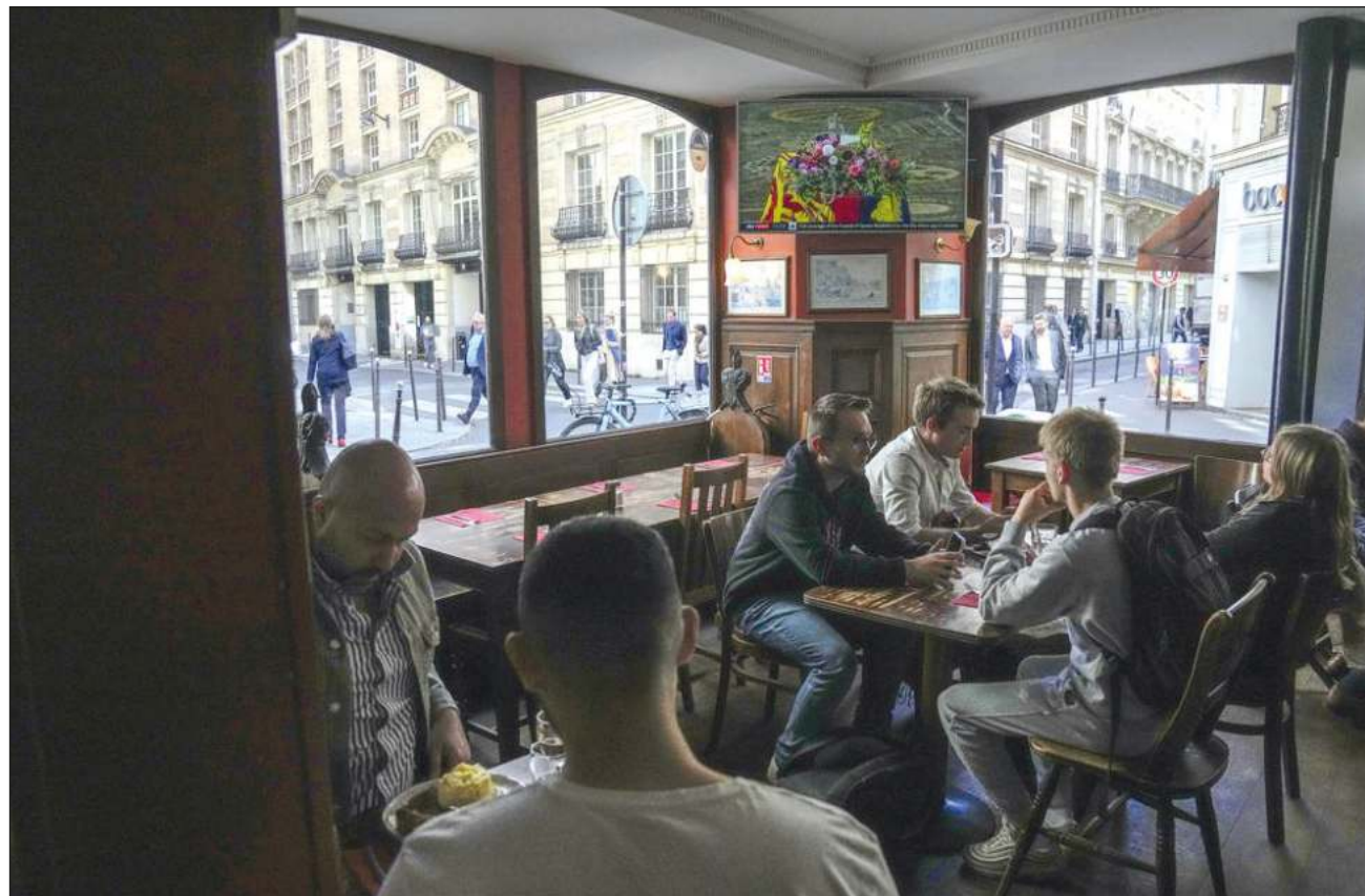
▲ Millones de personas siguieron los funerales de la reina Isabel II a través de televisores e Internet.

En un país conocido por la pompa y el boato, el pri-