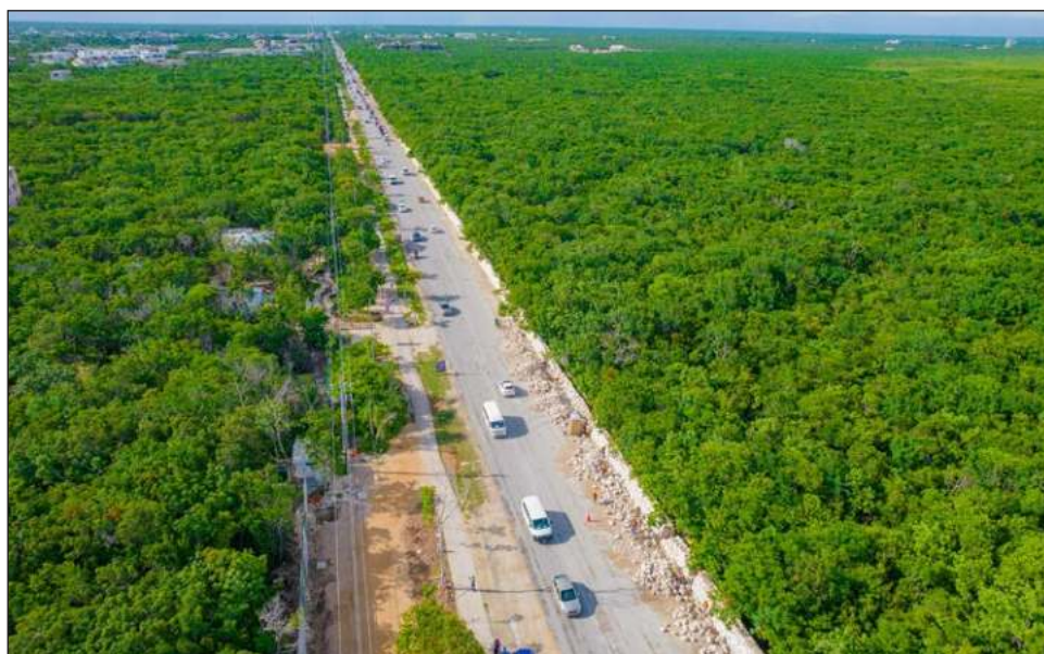
▲ La zona de 664 hectáreas fue denominada como Parque Nacional Tulum desde 1981.

“Se deben evitar todas esas construcciones. No ha-