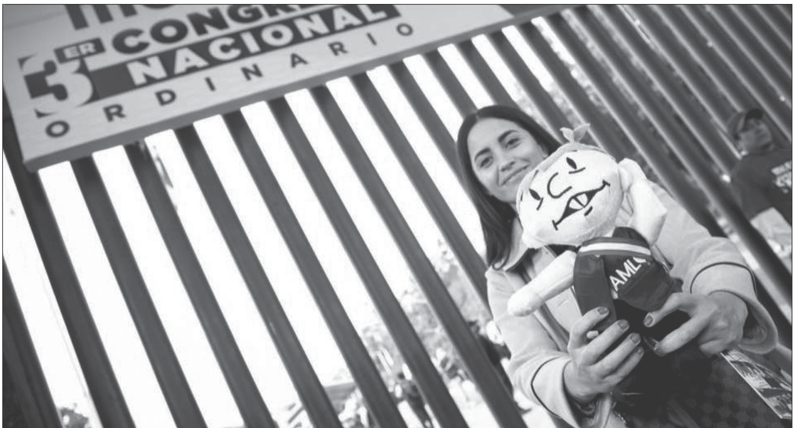
▲ "En la competencia de aplausos ganó de manera notable Claudia Sheinbaum, mientras Adán Augusto recibió menor apoyo masivo".