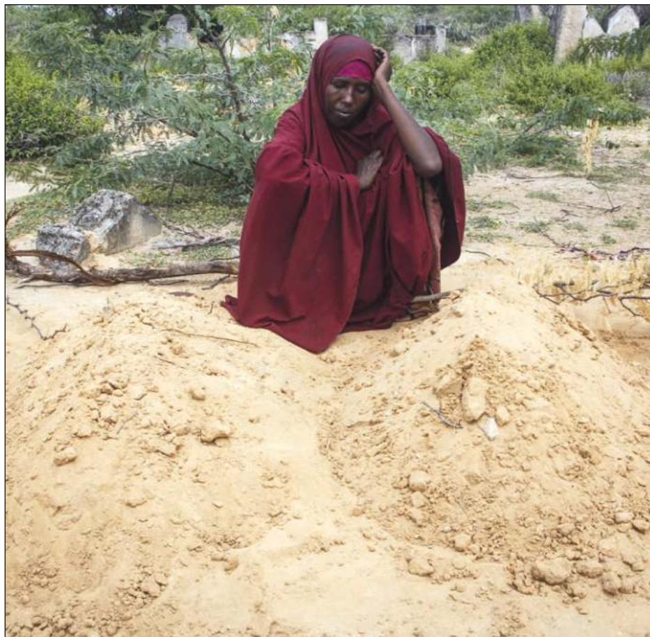
▲ En su informe, la OCDE advirtió que los 60 lugares más afectados abarcan a 73 por ciento de quienes viven en pobreza extrema y afectados por hambre.

Según la OCDE, los cinco países más frágiles el año pasado eran Somalia, Sudán del Sur, Afganistán, Yemen y la República Centroafricana. Y tres países —Benín, Timor-Leste y Turkmenistán— fueron añadidos en la lista de países frágiles el año pasado; ningún país fue retirado de esa lista.