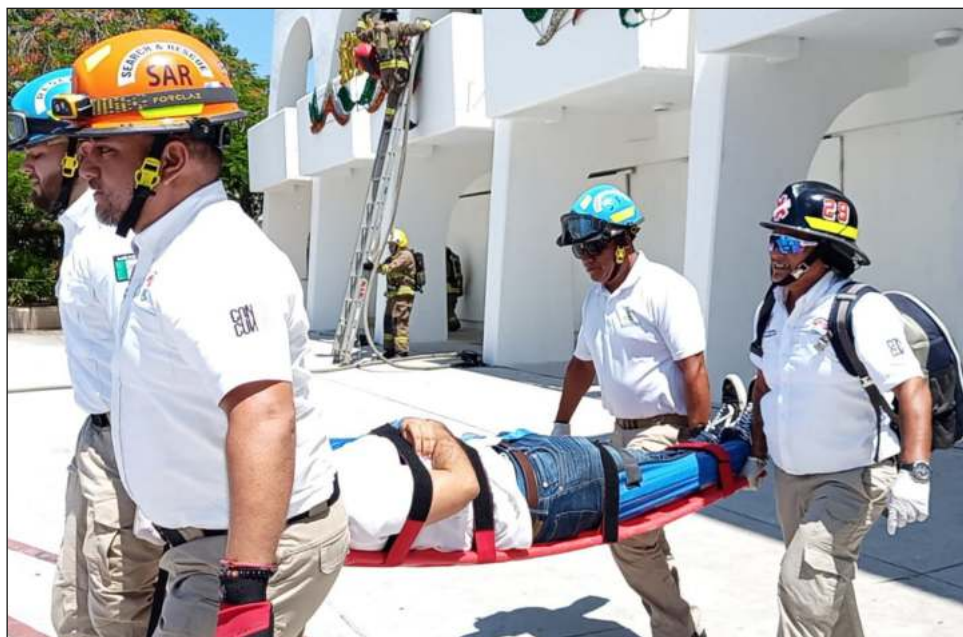
▲ Los destacamentos de bomberos, Cruz Roja, Protección Civil, Seguridad Pública y Tránsito llevan varios años trabajando en mejorar tiempos de respuesta.

“Lo que queremos es fomentar esa cultura de prevención... es un ejercicio muy