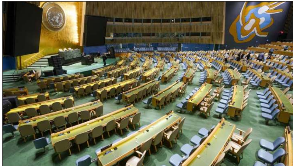
▲ El presidente Andrés Manuel López Obrador lamentó que las potencias del mundo no hayan hecho lo necesario para evitar la confrontación entre Rusia y Ucrania.

“De manera muy vulgar se descalifica, una vulgaridad mental, que se padece cuando no hay convicciones, cuando no hay ideales, y cuando se actúa en función de intereses políticos o económicos”, planteó en la mañana luego que se le preguntara en la mañana de este lunes sobre las afirmaciones de un vocero del presidente de Ucrania, Volodimir Zelensky, que señaló que el planteamiento de López Obrador “es un plan ruso”.