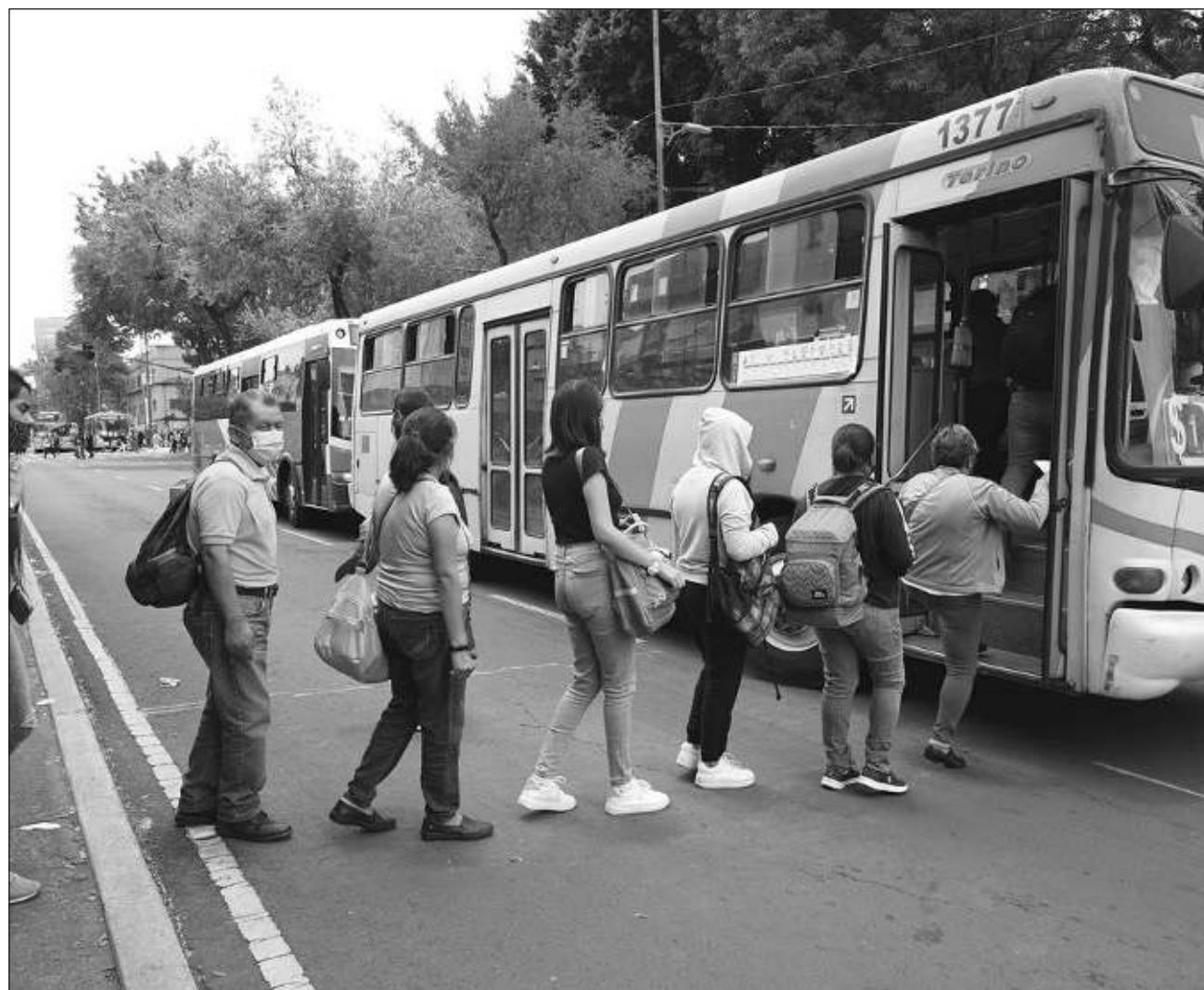
▲ En julio, el sistema de transporte en la zona Metropolitana del Valle de México prestó servicio a 137.8 millones de personas, 6.5 por ciento menos respecto a junio de 2022, cuando ese mes contabilizó a 147.4 millones de usuarios.

Este decreto impulsa al congreso del estado a aprobar el matrimonio igualitario en la legislación local, por lo que será discutido en los próximos días.