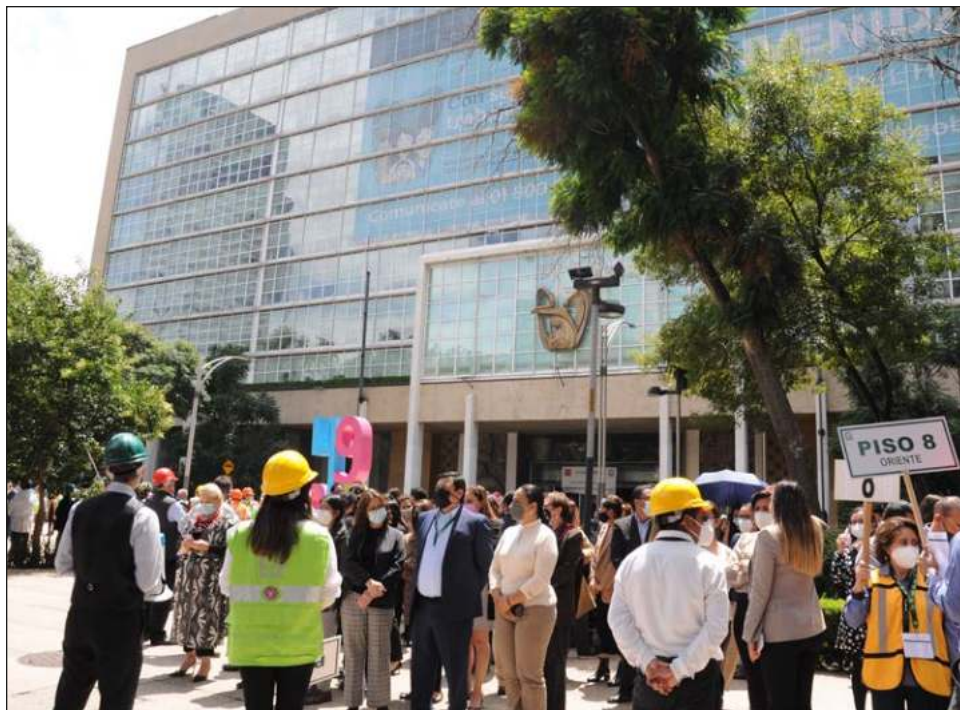
▲ A las 12:19 de la tarde de este lunes 19 de septiembre, autoridades de la Ciudad de México determinaron la activación de los casi 14 mil altavoces.

El sonido tiene la duración de un minuto. Este ejercicio se realiza año con año en memoria de las víctimas de los sismos ocurridos este día, pero del año 1985 y del año 2017.