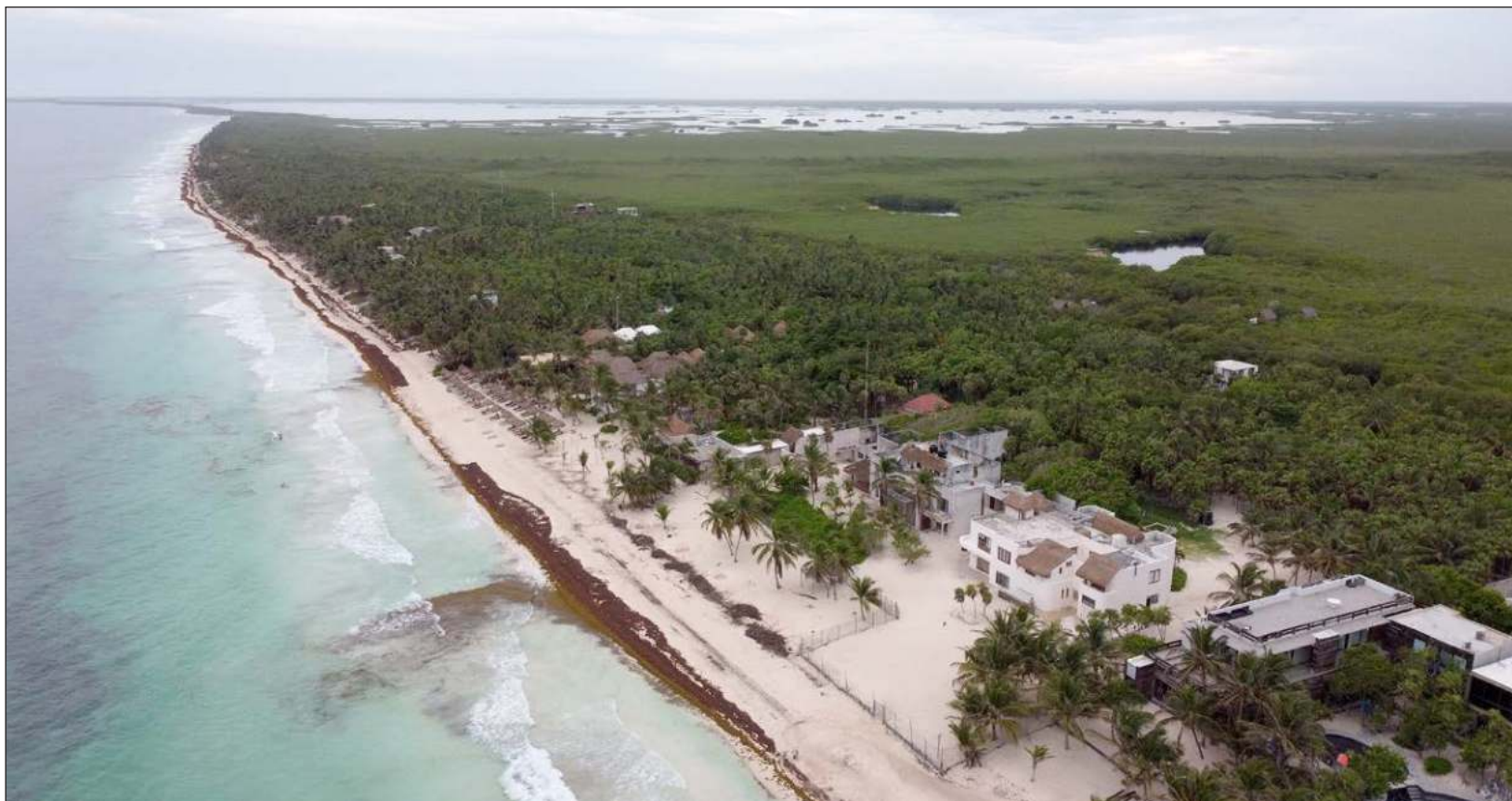
▲ Los hoteles irregulares fueron detectados durante las inspecciones de la Secretaría de Desarrollo Agrario, Territorial y Urbano en la zona.