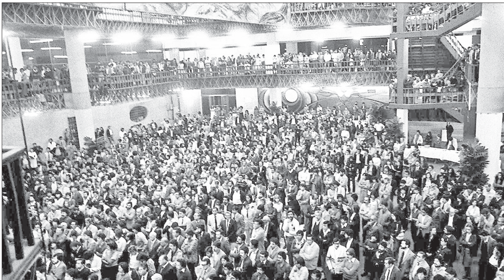
▲ Lo que comenzó como la aventura de un pequeño ejército de periodistas soñadores se ha convertido en una pequeña gran hazaña.