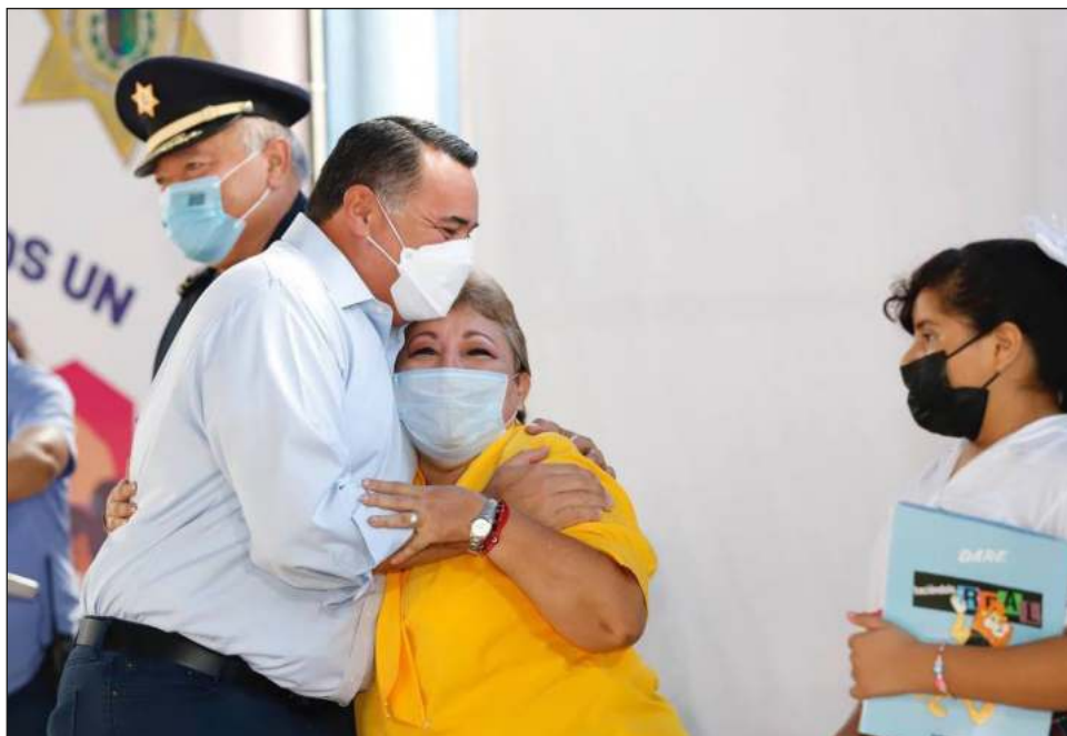
▲ El programa busca que las y los alumnos comprendan lo negativo que es el uso de las sustancias intoxicantes y las consecuencias nocivas a la salud.