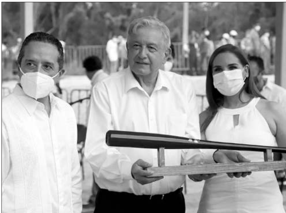
▲ El gobernador Carlos Joaquín González dejará el cargo el próximo 25 de septiembre y tomará posesión la morenista Mara Lezama Espinosa.

En general, la ocupación hotelera se elevó aproximadamente 15 puntos porcentuales, lo que permitió colocarse a destinos como Cancún, Puerto Morelos e Isla Mujeres, en promedios de 70 a 80 puntos porcentuales de viernes a domingo.