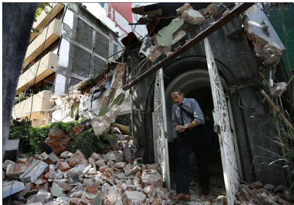
▲ Con el sismo de ayer, el ánimo colectivo ya asocia a estos fenómenos como "temporada de temblores", pero no hay razón científica que avale el despropósito.

Pero es indispensable entender que la corrupción mata y multiplica los impactos de fenómenos naturales. No olvidará que vuelva a ocurrir.