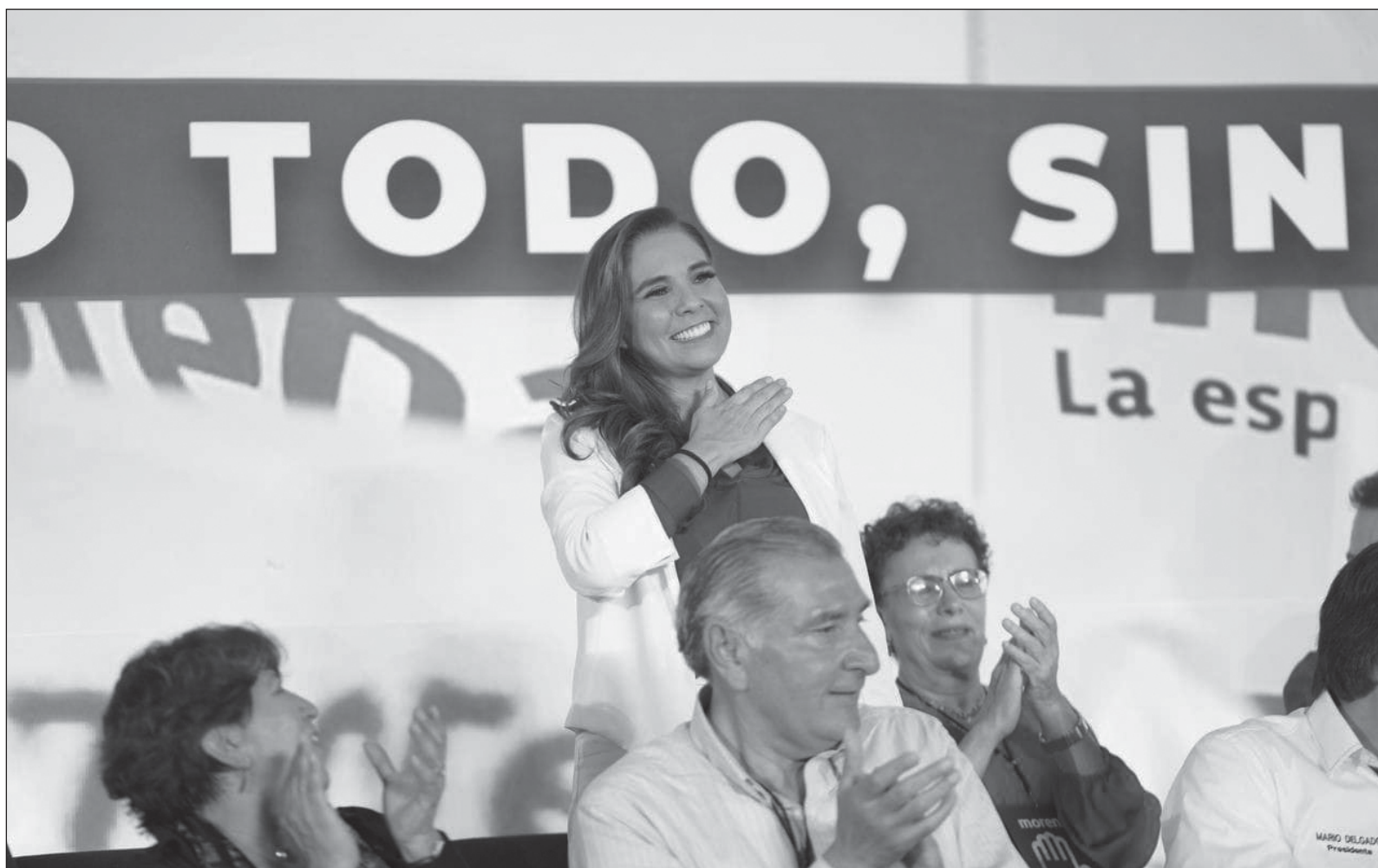
▲ "En Quintana Roo estamos a menos de una semana para conocer los nombres de quienes integrarán el gabinete del Ejecutivo".