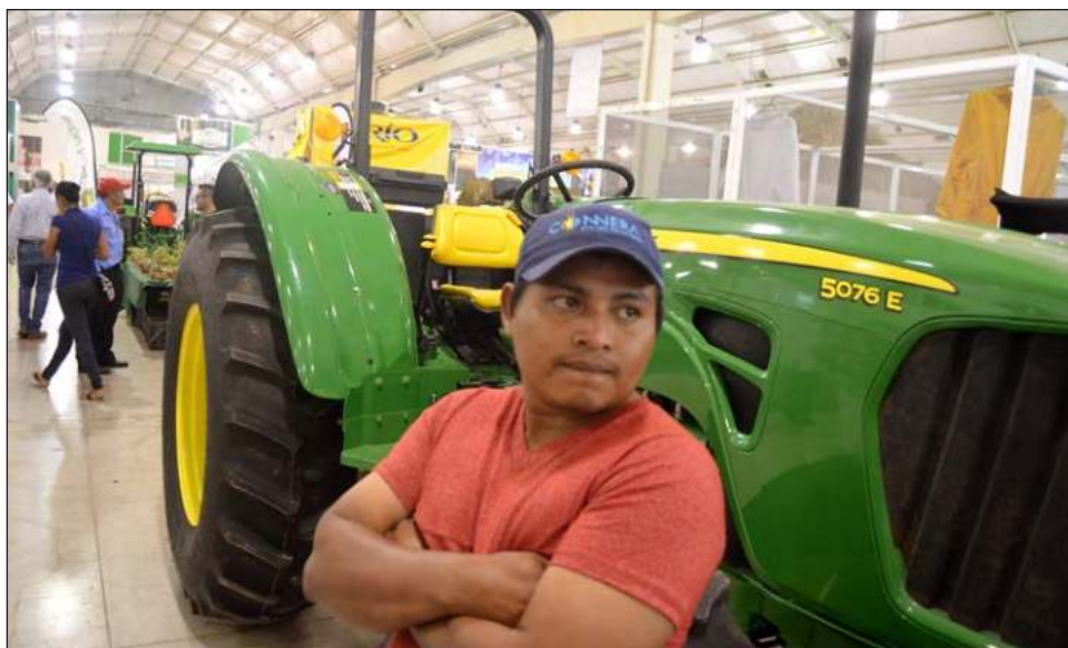
▲ El objetivo del censo es obtener estadísticas actuales de la producción de cultivos, la cría de especies pecuarias, el aprovechamiento forestal y datos de condiciones estructurales.

Con base en la experiencia de censos y encuestas anteriores, se definieron tres diferentes cuestionarios.