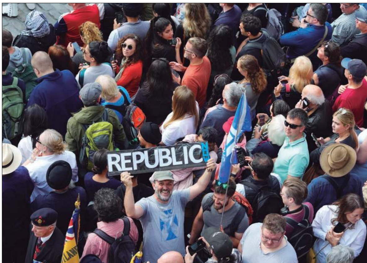
▲ "Most of my Latino friends have waxed eloquent about the benefits of an elected president over a hereditary, constitutional monarch". In image, a cartel among the attendants to the proclamation of King Charles III.

CONSTITUTIONAL MONARCHIES IN Sweden, Norway, Denmark, the United Kingdom, Canada, Australia, New Zealand, Japan, and Spain have seen the development of highly functional democratic societies and dy-