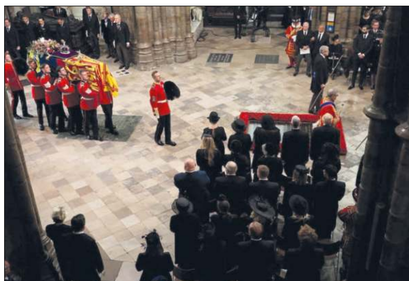
▲ Este lunes fue declarado feriado nacional en honor de la reina Isabel II; cientos de miles de personas acudieron a Londres para presenciar los homenajes. Mucho antes del inicio del funeral, las autoridades londinenses dijeron que todas las zonas para presenciar la ruta del cortejo fúnebre estaban llenas.