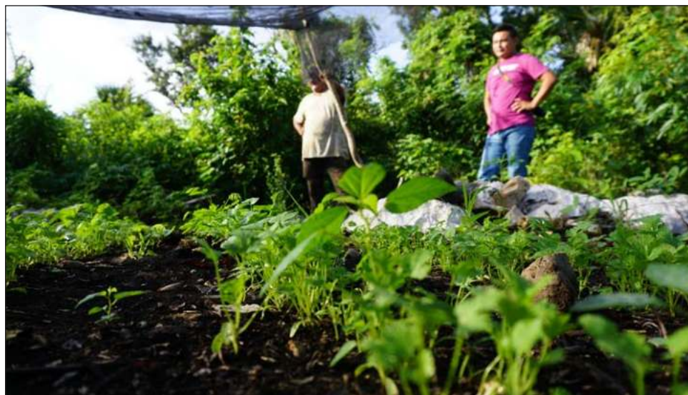
▲ Del sector agropecuario dependen económicamente 19% de los hogares mexicanos.

Asimismo, el campo mexicano comprende el