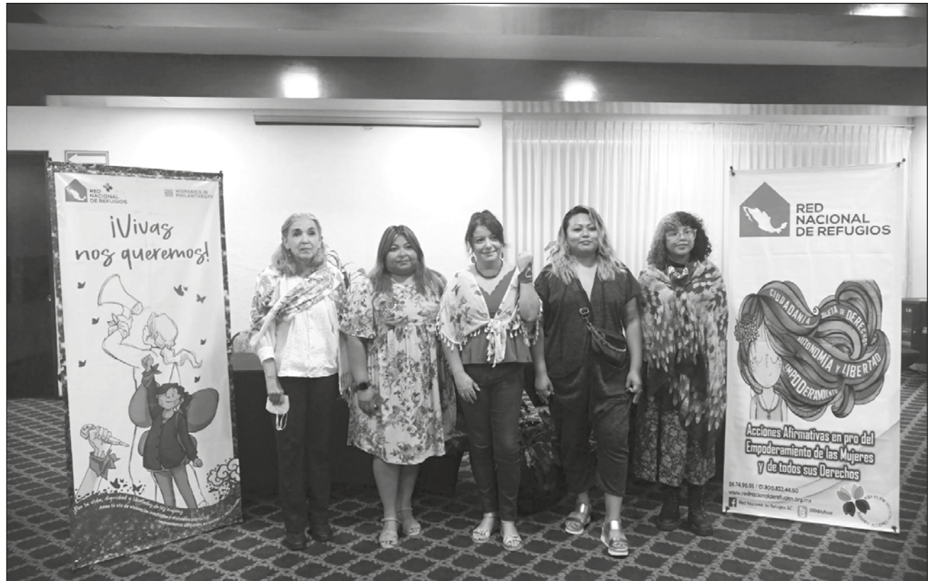
▲ A través de la campaña Marea Violeta , la Red Nacional de Refugios recorrerá algunos estados del país con el objetivo de exigir una solución a las omisiones del Estado mexicano ante la situación machista.

Aunque han logrado continuar operando los 75 espacios entre refugios, centros externos y casas de transición, esto ha sido solamente por las donaciones que han recibido y acciones de recaudación de fondos