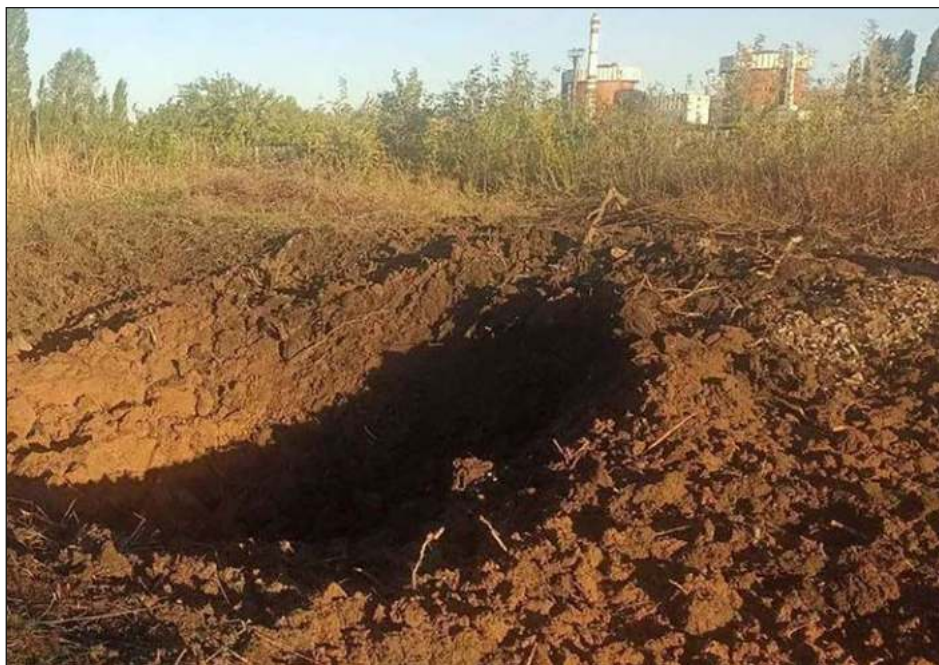
▲ El Ministerio ucraniano y Energoatom describieron el ataque como un acto de "terrorismo nuclear". Rusia no hizo comentarios sobre la agresión en un primer momento.

Imágenes en blanco y negro grabadas por una cámara de seguridad y publicadas por el Ministerio ucraniano de Defensa mostraban dos grandes bolas de fuego que estallaban en sucesión en la oscuridad, y a continuación una lluvia de chispas. La hora en el video marcaba que pasaban 19 minutos de la medianoche.