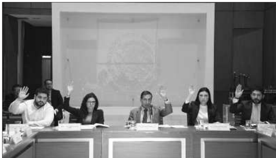
▲ En la reunión participaron la gobernadora del BdeM, así como los secretarios de Gobernación, Luisa María Alcalde, y del Trabajo, Marath Bolaños, y la titular del ISSSTE, Bertha Alcalde.