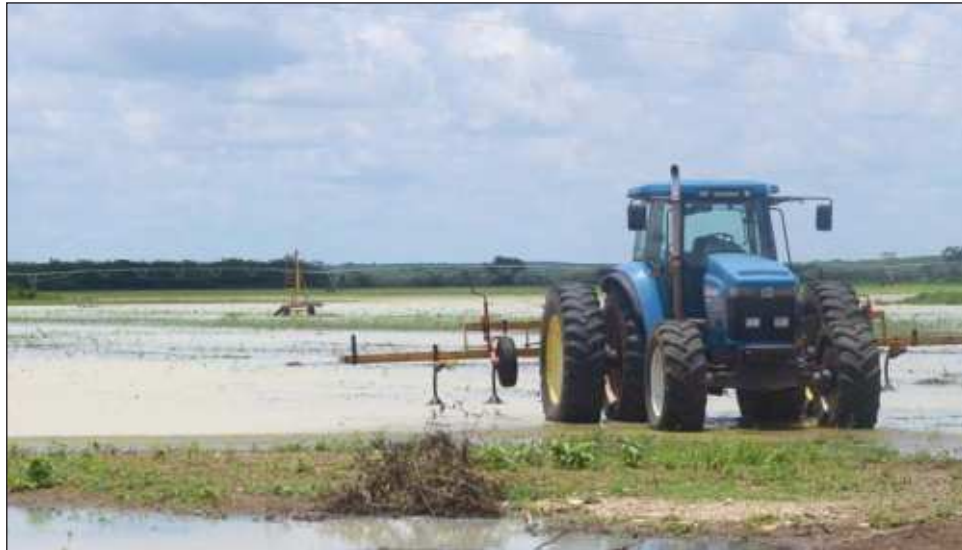
▲ Los horticultores dijeron que "hay sospecha de que la obra no finalizada de las vías del Tren Maya obstruye el caudal natural del cauce por donde se drenan las aguas de esta zona".

Las caras de los productores lo decían todo, meses de trabajo desaparecieron debido a la inundación de áreas que no se encharcaban severamente. Las lechugas, el rábano y otras hortalizas no podrán rescatarse, al menos no está cosecha, aún