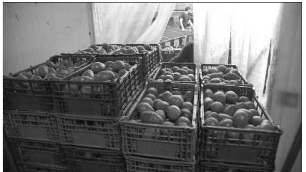
▲ La retención de dos empleados del APHIS de Estados Unidos no fue por motivos de inseguridad, sino que había una manifestación de tipo social en la carretera Aranza-Paracho, donde había un bloqueo, afirmó el gobernador de Michoacán, Alfredo Ramírez Bedolla.

En declaración ante medios informativos dijo que los dos inspectores de aguacate nunca estuvieron en riesgo,