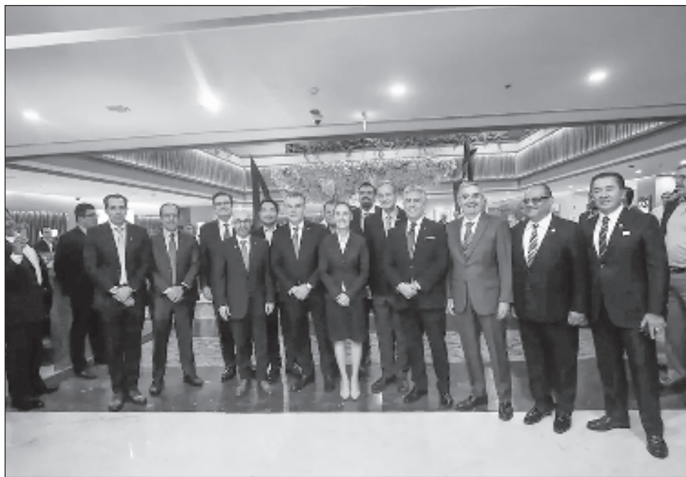
▲ En el siguiente sexenio no habrá una reforma fiscal, dijo Claudia Sheinbaum Pardo, virtual presidenta electa de México, ante empresarios, quienes anunciaron nuevas inversiones por más de 42 mil millones de dólares para este año 2024.

Les dijo: “de ninguna manera esta reforma va a repre-