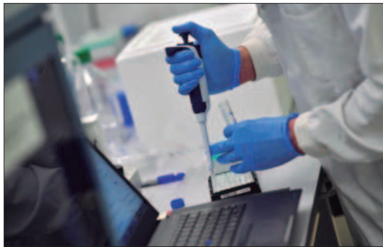
▲ "Cómo pasamos de la carrera por los puntos a la instrumentalización de las comunidades en los proyectos que buscan la incidencia social".

El problema es que tenemos una comunidad científica que aún no está preparada para hacer este profundo salto cualitativo y también