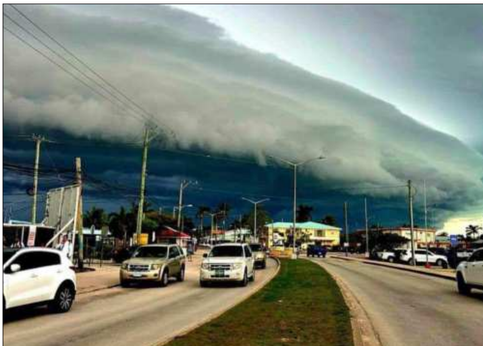
▲ El término potencial ciclón tropical nació ante la falta de una nomenclatura para los fenómenos que están apenas desarrollándose, pero que presentan vientos fuertes.

Para que ya sea considerado huracán tiene que alcanzar velocidades superiores a 110 km/h para la categoría 1; de ahí por velocidad de viento si rebasa 154 km/h entra a categoría 2; después de 178 km/h es categoría 3; desde 209 km/h categoría 4 y hasta que supere 252 km/h es categoría 5.