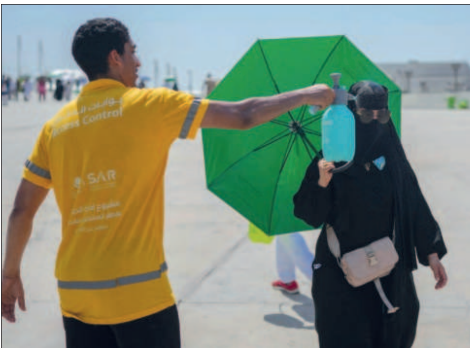
▲ De acuerdo con un estudio saudita publicado en mayo, las temperaturas en los lugares donde se llevan a cabo los rituales aumentan en 0.4 grados centígrados cada 10 años.

Enseguida, Putin apuntó: “Hoy luchamos juntos contra el hegemonismo y las prácticas neocoloniales de Estados Unidos y sus satélites, oponiéndonos a los intentos de imponer modelos de desarrollo y valores que son ajenos para nosotros”.