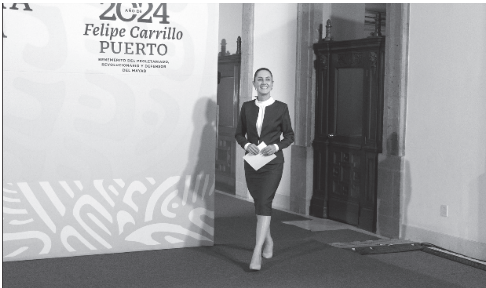
▲ "El reto más grande e importante que asumirá la virtual presidenta de México, Claudia Sheinbaum, será mantener la unidad y liderazgo sobre un movimiento heterogéneo de mujeres y hombres (...) ajenos al ideario de AMLO. Muchos priistas, panistas, perredistas, etcétera".