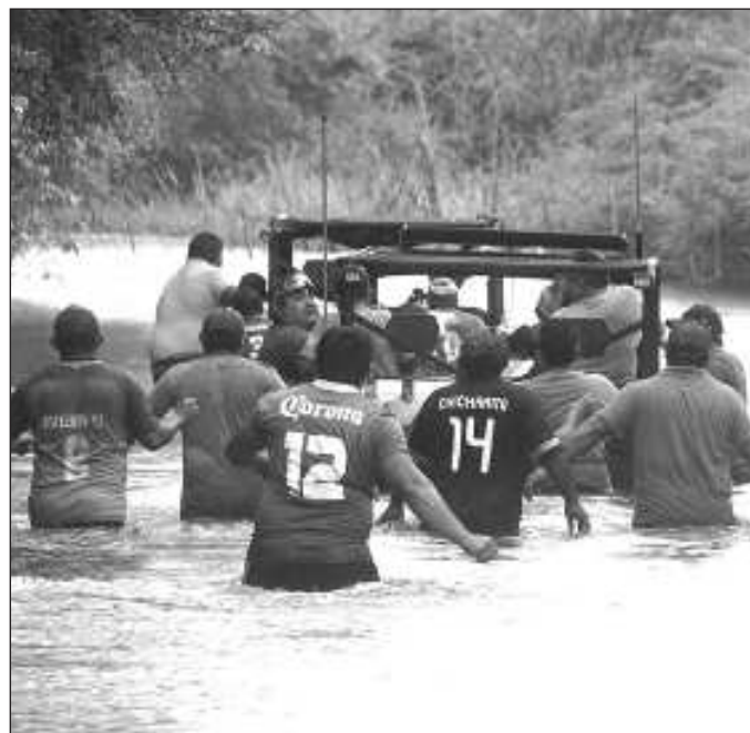
▲ Nos toca a todos participar, en la medida que nos corresponda, para que un fenómeno meteorológico no se convierta también en desastre económico y social.

La prevención implica varios ámbitos: desde el resguardo de los documentos personales, en especial los más difíciles de remplazar (como las escrituras de la casa o la factura del vehículo) hasta las medidas de seguridad que deben aplicarse en el