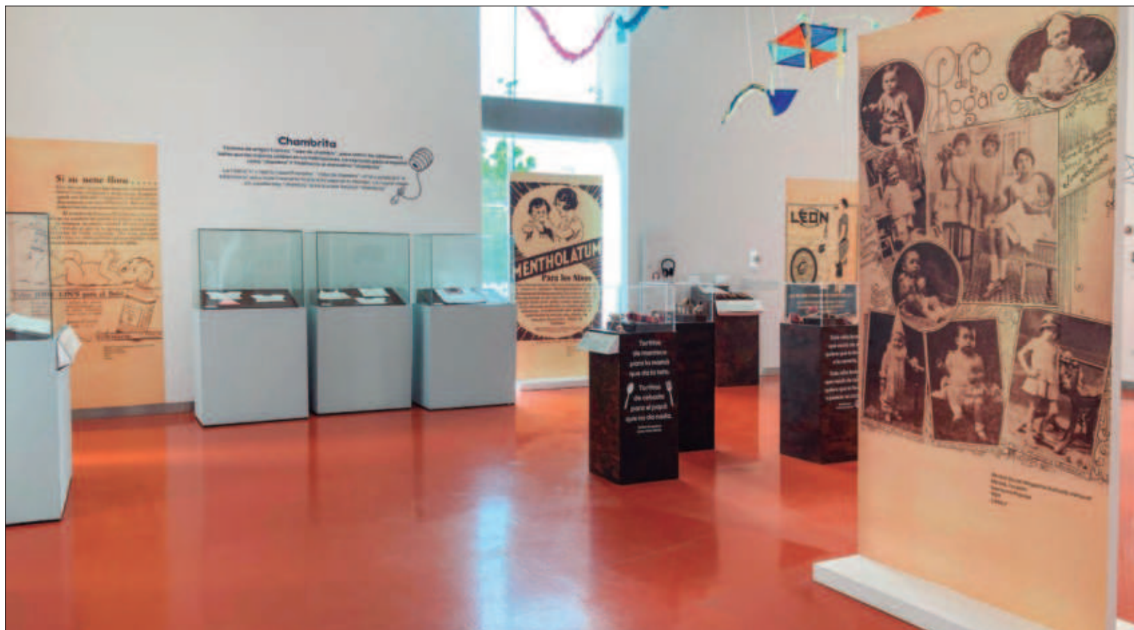
▲ La exposición es nostálgica; es capaz de transportar al visitante a los juegos de la infancia, las poses en las fotografías que todavía no se digitalizaban o el recuerdo de la primera comunión. También es recordar esas costumbres para recibir al bebé y la ceremonia del jéets méek' .

Chan paal. Nenés, niños y niñas en Yucatán es una exposición temporal que estará hasta el próximo 30 de septiembre de miércoles a lunes de 9 a 17 horas con entrada gratuita. La muestra está abierta y dirigida a todo tipo de público.