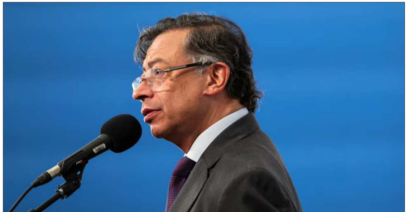
▲ Según Noboa, Petro se reunió con algunos miembros de la organización política ecuatoriana Revolución Ciudadana

"He decidido demandar penalmente al presidente Noboa por su calumnia", escribió el gobernante colombiano en X, quien un día antes había negado conocer al mencionado líder criminal. No precisó la fecha ni