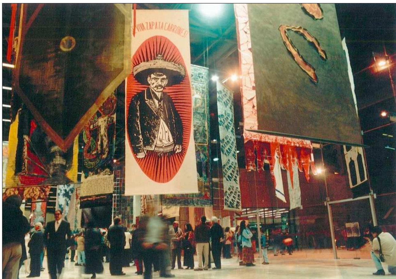
▲ El evento cultural nació en 1996 como un salón anual orientado a propiciar el encuentro entre artistas; trató de combinar los emergentes, con otros de trayectoria internacional y figuras claves del arte contemporáneo.

das las piezas irían enrolladas en un solo tubo. El estandarte más pesado es de 12 kilos”. Hasta el mo-