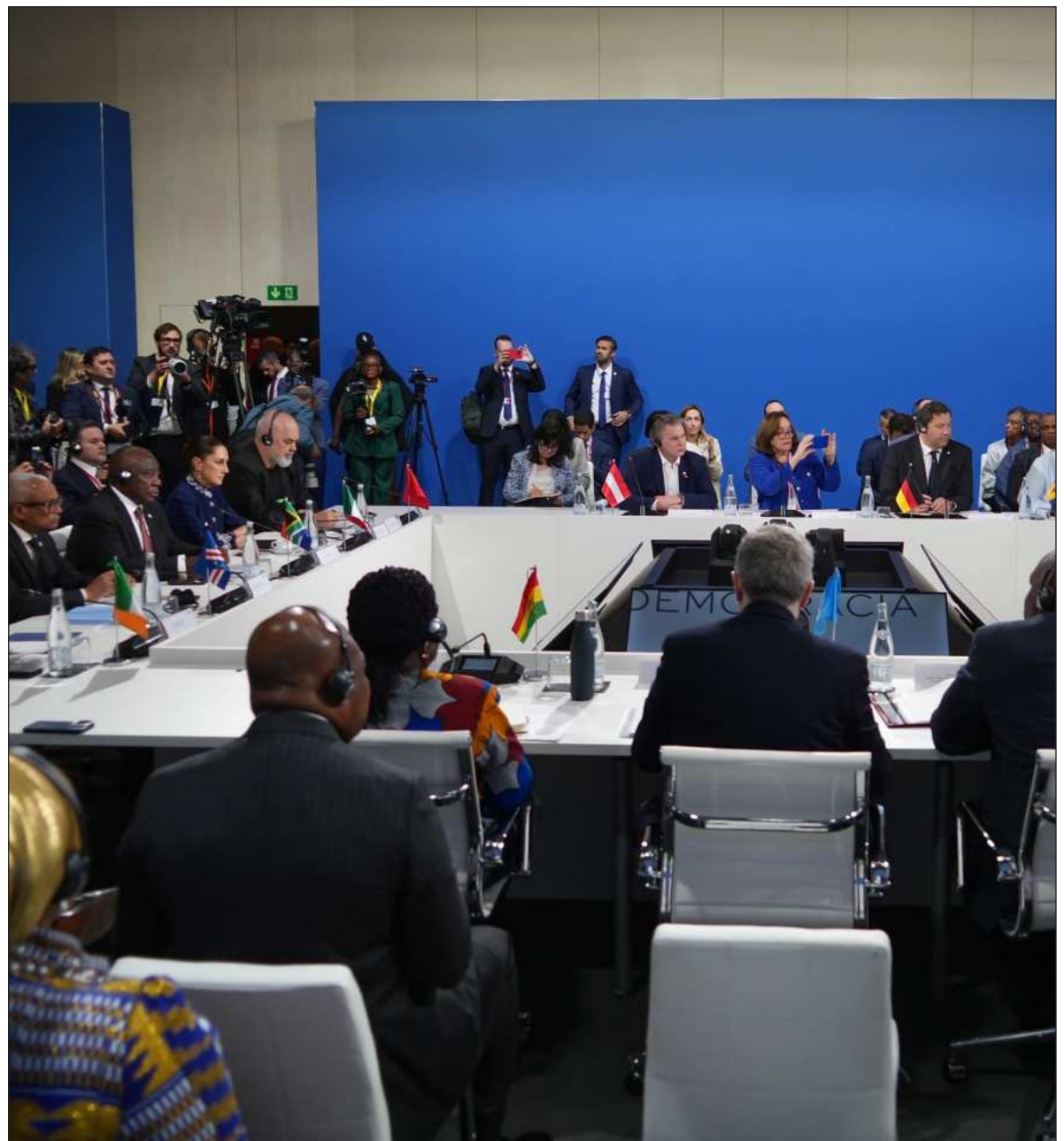
▲ “La postura del gobierno de la presidenta sheinbaum en la cuarta cumbre en defensa de la democracia reafirma la avanzada de la 4T por seguir el rumbo hacia la revolución de las conciencias”.