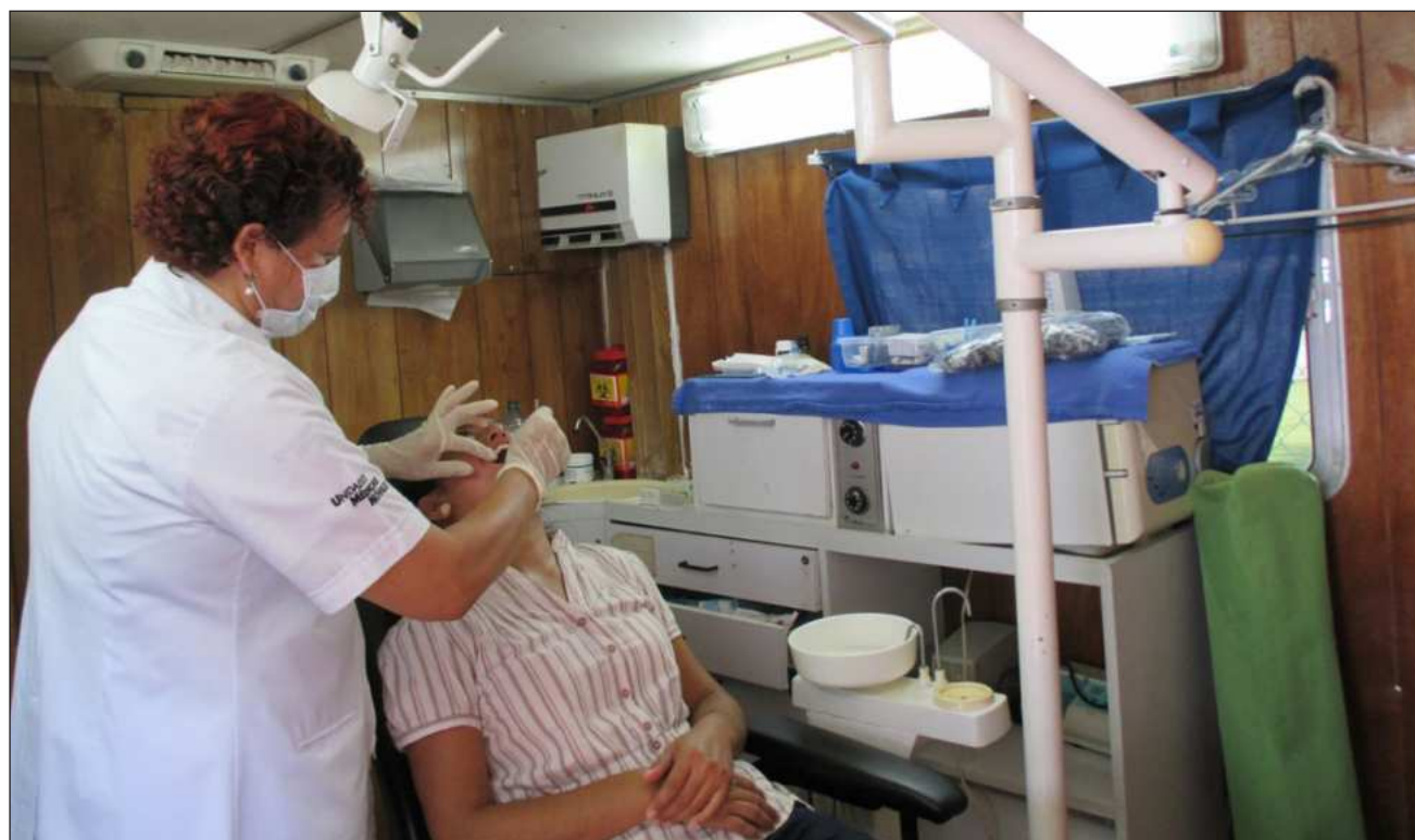
▲ La basificación de trabajadores fortalece el compromiso de quienes integran las brigadas de campo.

“Cabe mencionar que la gobernadora del estado, previo a que se diera el tema del sarampión, como lo ha venido haciendo con ciertas categorías de la Secretaría de Salud, basificó al personal de primera línea, que es el personal que está en