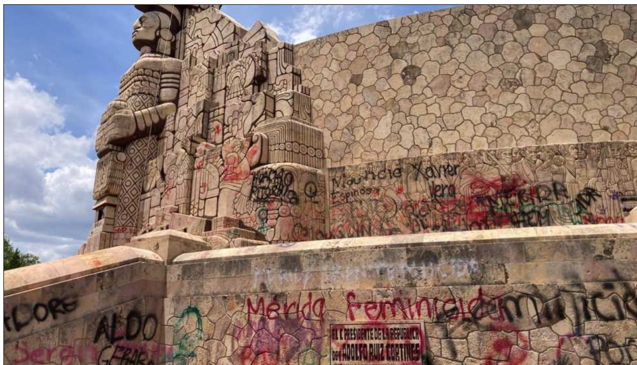
▲ El reporte del SESNSP no tiene rango de comparación ya que en años anteriores el delito fue invisibilizado.

En comparación con años anteriores, se mantienen los registros durante