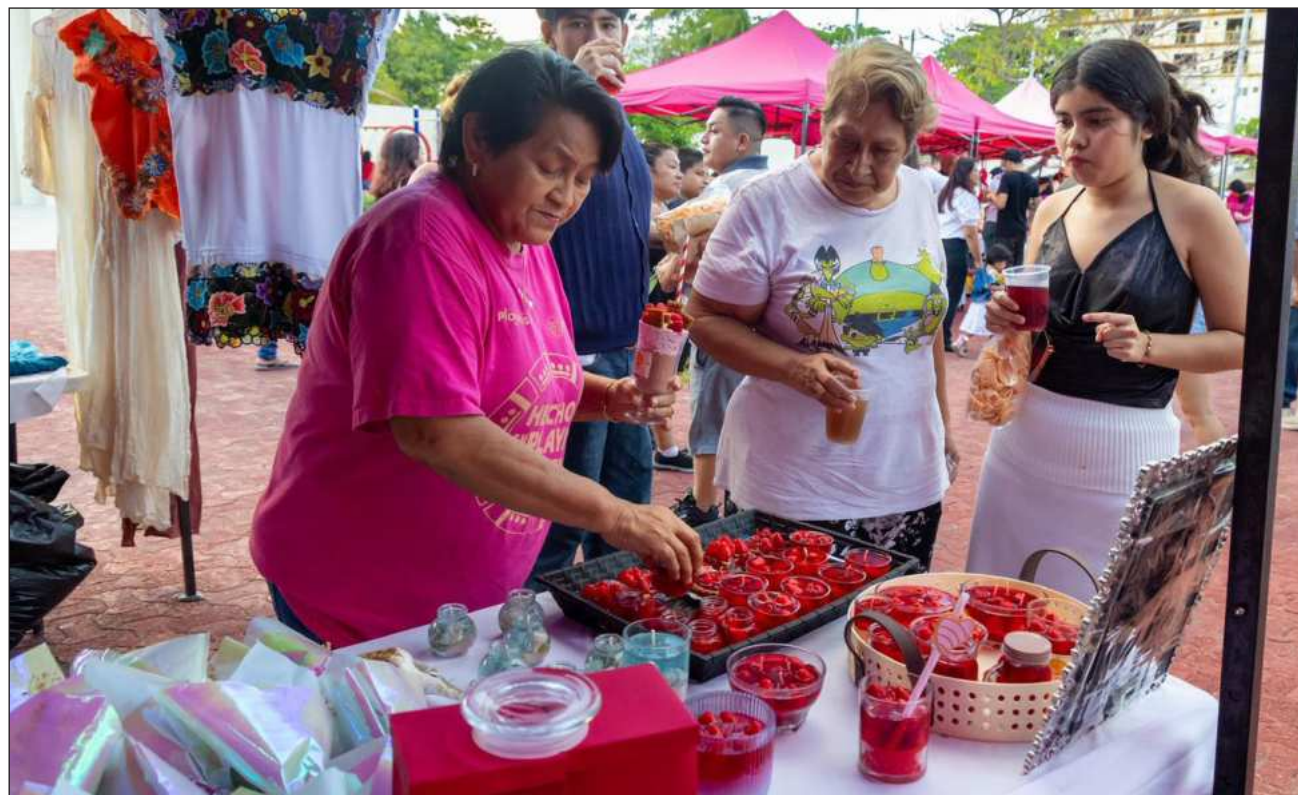
▲ El Mercado Hecho en Playa se proyecta como un nuevo punto de encuentro social y económico.