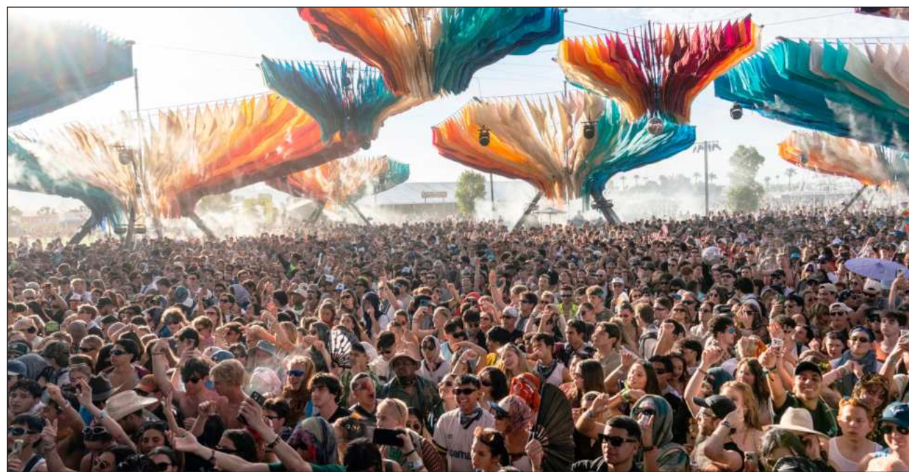
▲ Los organizadores esperaban recibir a unas 250 mil personas en dos fines de semana en el Empire Polo Club de Indio.

Por eso, los organizadores esperaban recibir a unas 250 mil personas en dos fines de semana en el Empire Polo Club de Indio, donde dece-