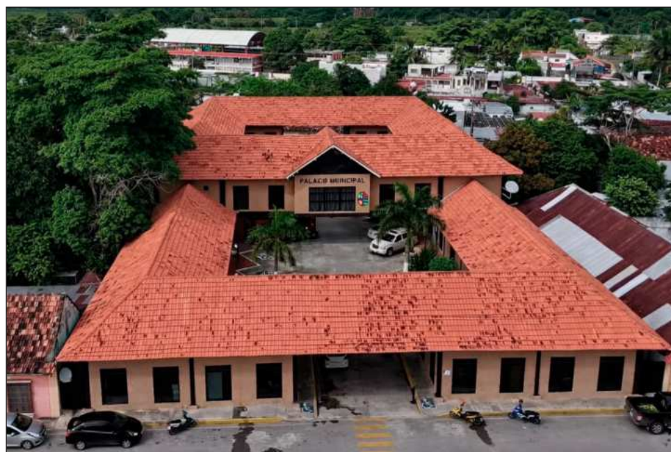
▲ Integrantes del Cabildo señalaron que existieron tratos políticos entre el sindicato y el alcalde, "acuerdos internos que no podemos aprobar debido a la situación financiera del ayuntamiento, donde estamos obligados a rendir cuentas a los paliceños".

Asimismo, recordó que el ayuntamiento de Palizada