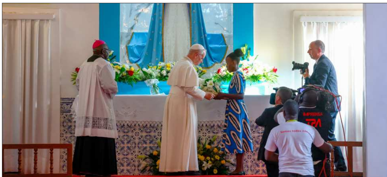
▲ Muchos habitantes de Angola son católicos por el Code Noir que obligaba a bautizar a los esclavos portugueses.

León XIV encabezó una misa en epicentro del comercio de esclavos del país africano