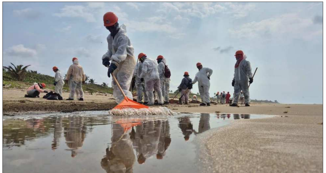
▲ El derrame habría ocurrido en febrero pasado, en la zona petrolera de Abkatun-Cantarell, según la paraestatal.

Para contener su presencia se han instalado 2.5