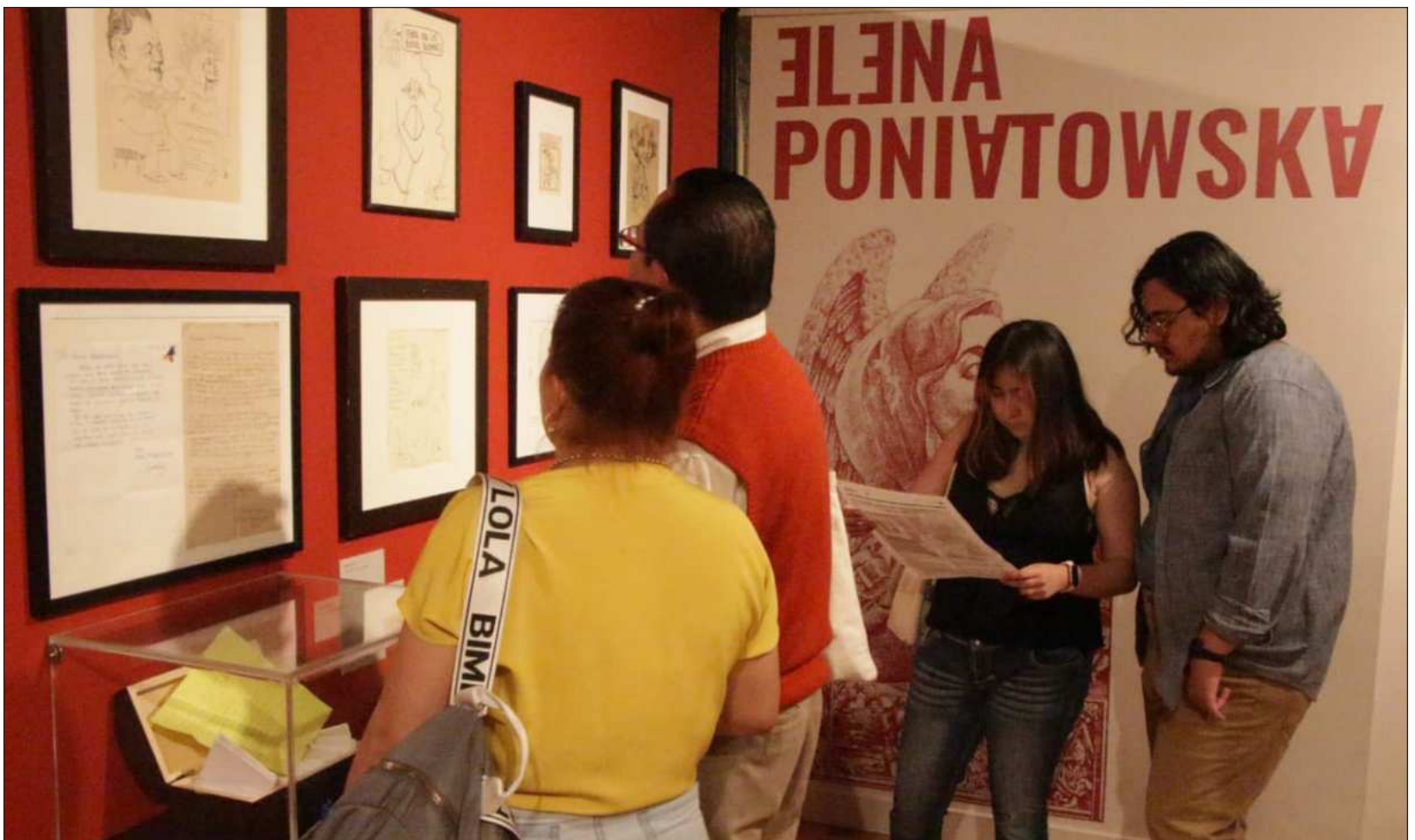
▲ En el recorrido de la exposición dedicada a Poniatowska se explica su amplia obra dedicada a movimientos políticos y sociales.

Gracias, enfatizó Brito, "por permitirnos fisgonear los álbumes familiares, las fotos de tus cuates y personajes entrevistados que han dejado huella en el arte, la cultura y la lucha social en los 70 años recientes".