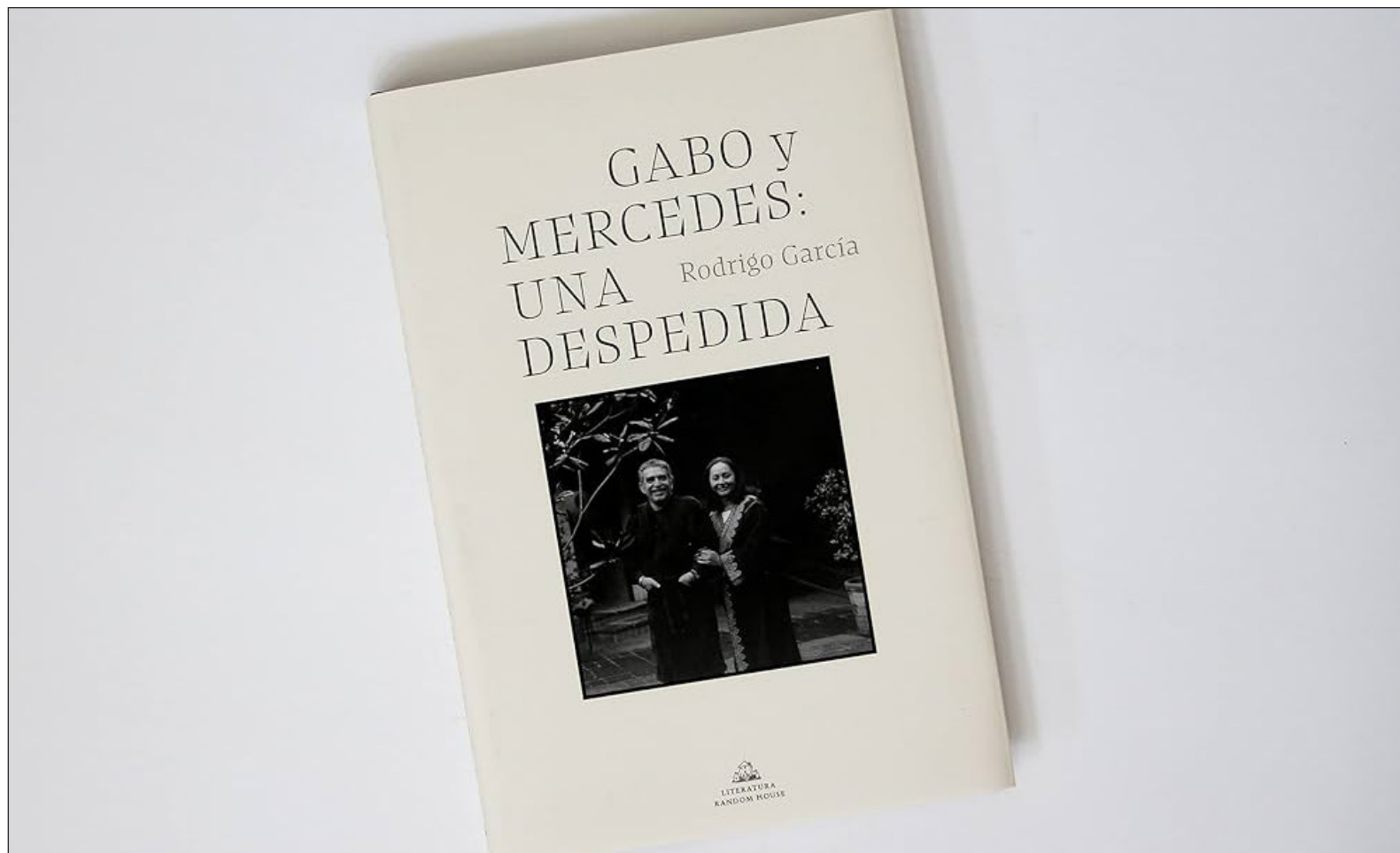
▲ "La despedida, ese instante en que soltamos una mano o acariciamos por última vez un rostro, se convierte en la puerta a la memoria". Foto Facsímil