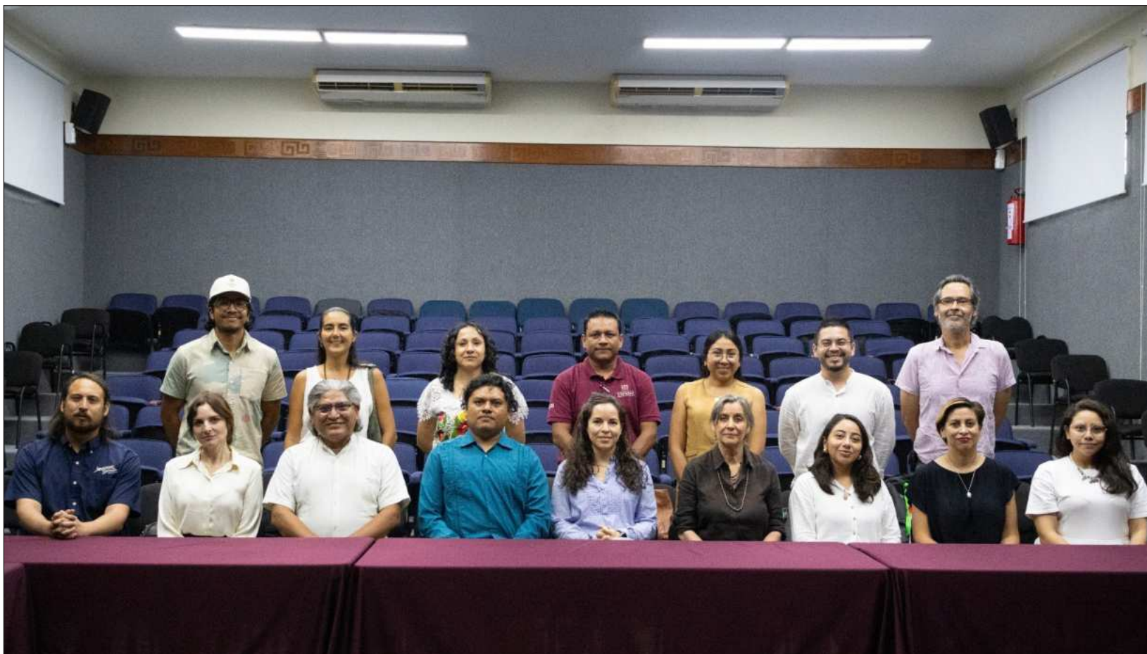
▲ "El Consejo está integrado por cinco miembros de organizaciones de la sociedad civil, cinco miembros de la academia y dos miembros representantes de empresas. Esta conformación asegura que funcione como una entidad de carácter multidisciplinario, imparcial y multisectorial".