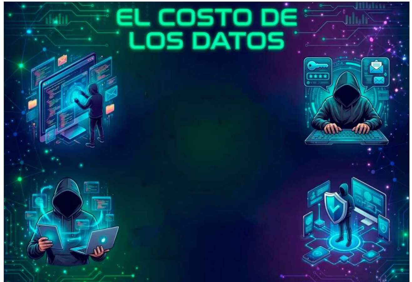
▲ Las filtraciones masivas, los ataques constantes y la reventa sistemática de datos han saturado la oferta en la red oscura ( dark web ), donde los registros robados se acumulan con rapidez y pierden valor en la misma medida en que se replican.

De acuerdo con la firma de ciberseguridad ESET, este abaratamiento no implica que la información haya perdido utilidad, sino que se ha vuelto excesiva. Las filtraciones masivas, los ataques constantes