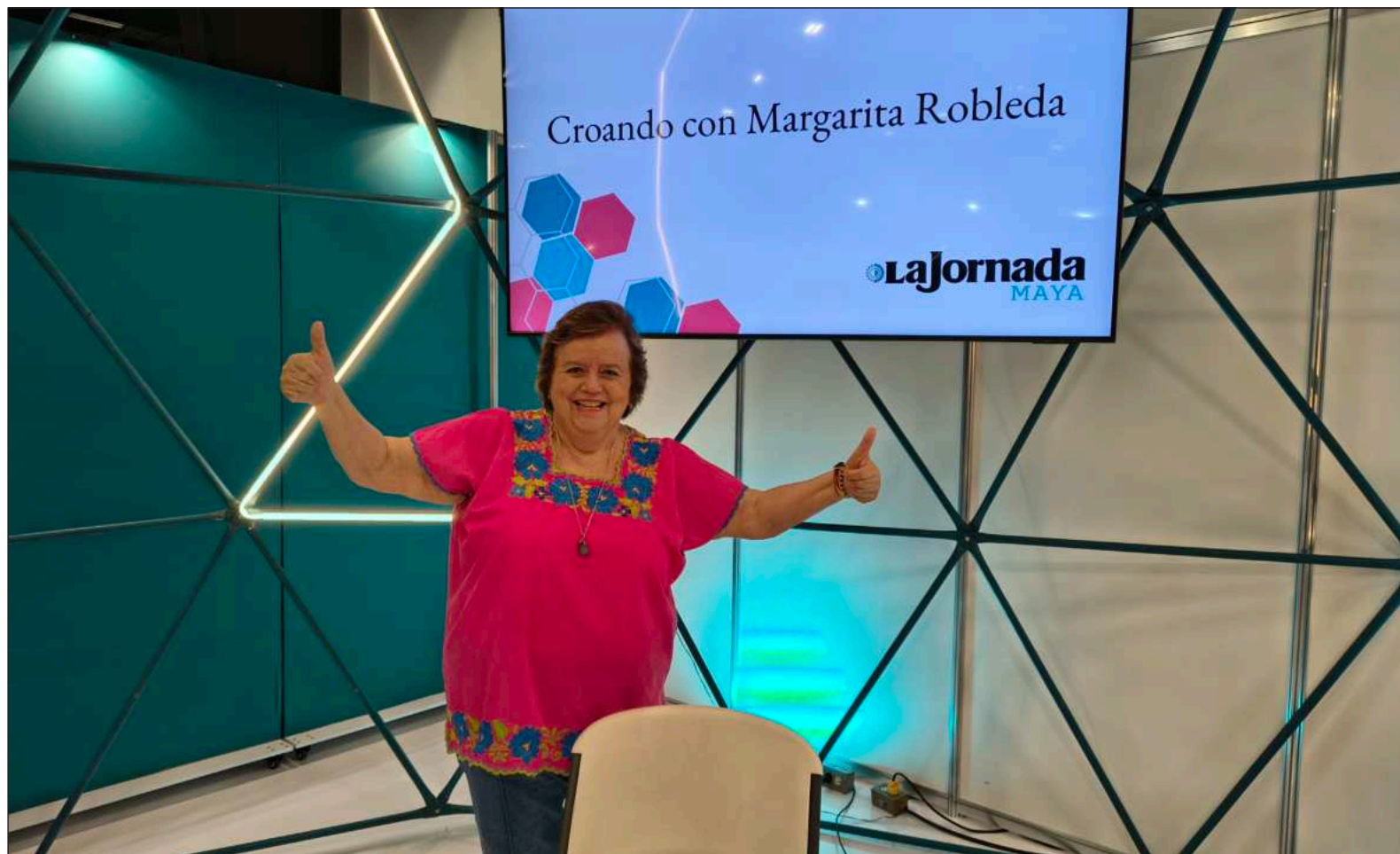
▲ “Hay mujeres a las que les pesa comentar su edad. No entiendo por qué, tendríamos que sentirnos muy afortunadas de estar vivas, no todas llegan”.