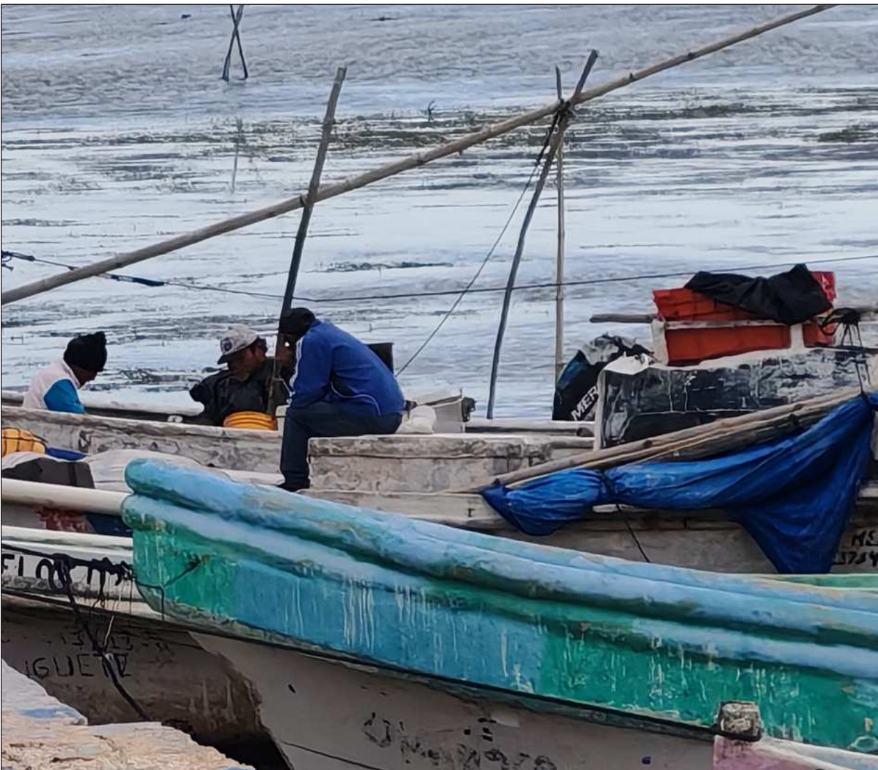
▲ Los hombres de mar subrayaron que para un pescador ribereño su lancha y su motor no son lujos, sino herramientas esenciales de trabajo, por lo que un asalto como este puede significar la ruina económica de una familia.

“Hoy la solidaridad entre pescadores salvó seis vidas, pero no se puede dejar la seguridad a la suerte. Es urgente que la Secretaría de Marina y la Fiscalía actúen para desarticular las bandas que operan en la Sonda, antes de que el próximo rescate no llegue a tiempo”, expresaron.