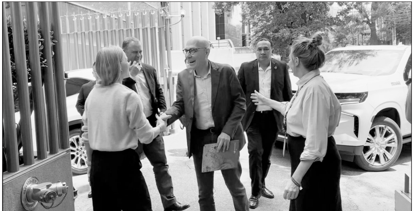
▲ Türk arribó a CDMX para una primera reunión con integrantes y representantes de diversas agrupaciones.

Türk arribó a oficinas de la Organización de las Naciones Unidas (ONU) en la Ciudad de México alrededor de las 13 horas para una primera reunión con integrantes y representantes de diversas agrupaciones, entre ellas, Documenta; el Centro fray Juan de Larios; Centro de Derechos Humanos Miguel Agustín Pro Juárez; Amnistía Internacional; Centro de Derechos Humanos de la Montaña Tla-