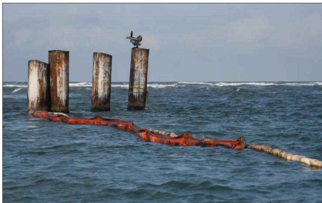
▲ Existe un daño ambiental en un ecosistema que es a la vez el espacio territorial del cual varias comunidades obtienen el sustento a través de la pesca o del turismo.

Y finalmente, dentro de Pemex debe operarse un cambio radical, porque algo en la estructura hizo que un grupo de funcionarios pudiera sentirse lo suficientemente confiado como para negarle información específica al director general, con los efectos que esto pudiera tener en lo que él reportaba a la Presidenta, que también es superior de ellos mismos.