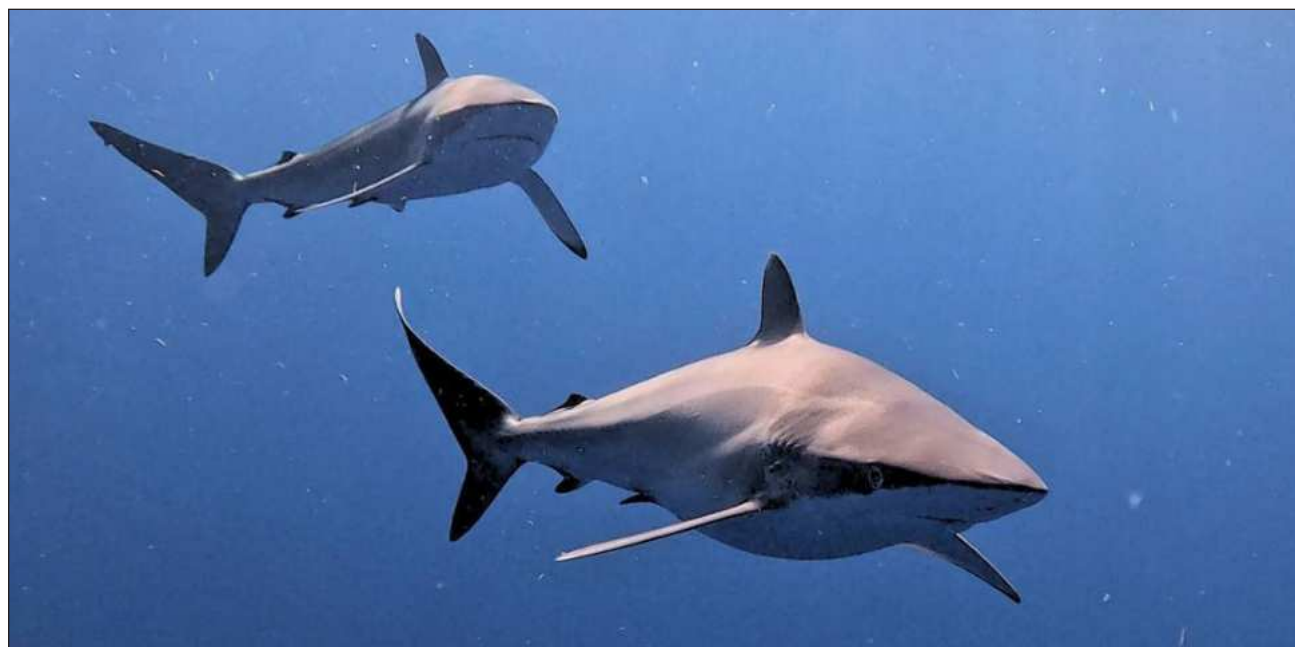
▲ En el mundo 11 mil tiburones capturados cada hora, lo que equivale a 100 millones al año.

“Hicimos esta sesión de trabajo que le llamamos la Alianza Intersectorial por la Conservación Marina del Caribe Mexicano, en el que hablamos de la importancia de los tiburones, presentamos un caso de éxito de lo que estamos trabajando con la cooperativa Kab Xok (mundo tiburón) que pasó de la pesca a la conservación y de la conservación al ecoturismo”, compartió.