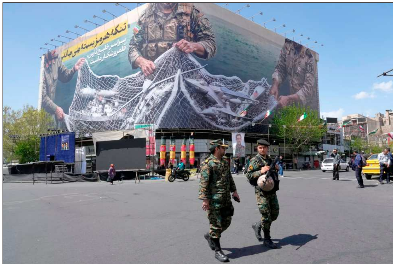
▲ Según Trump, la Marina de EU en el golfo de Omán advirtió a la embarcación que se detuviera, pero no lo hizo.

La incertidumbre generó una nueva alza de los precios