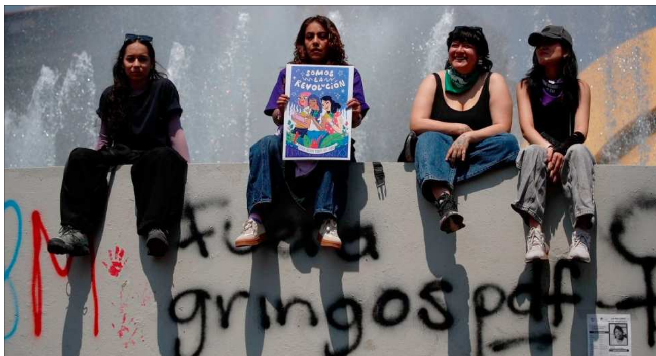
▲ Las brechas salariales entre docentes hombres y mujeres en la región rondan 17 por ciento.

Menos de 20 por ciento de las rectorías en América Latina son ocupadas por mujeres