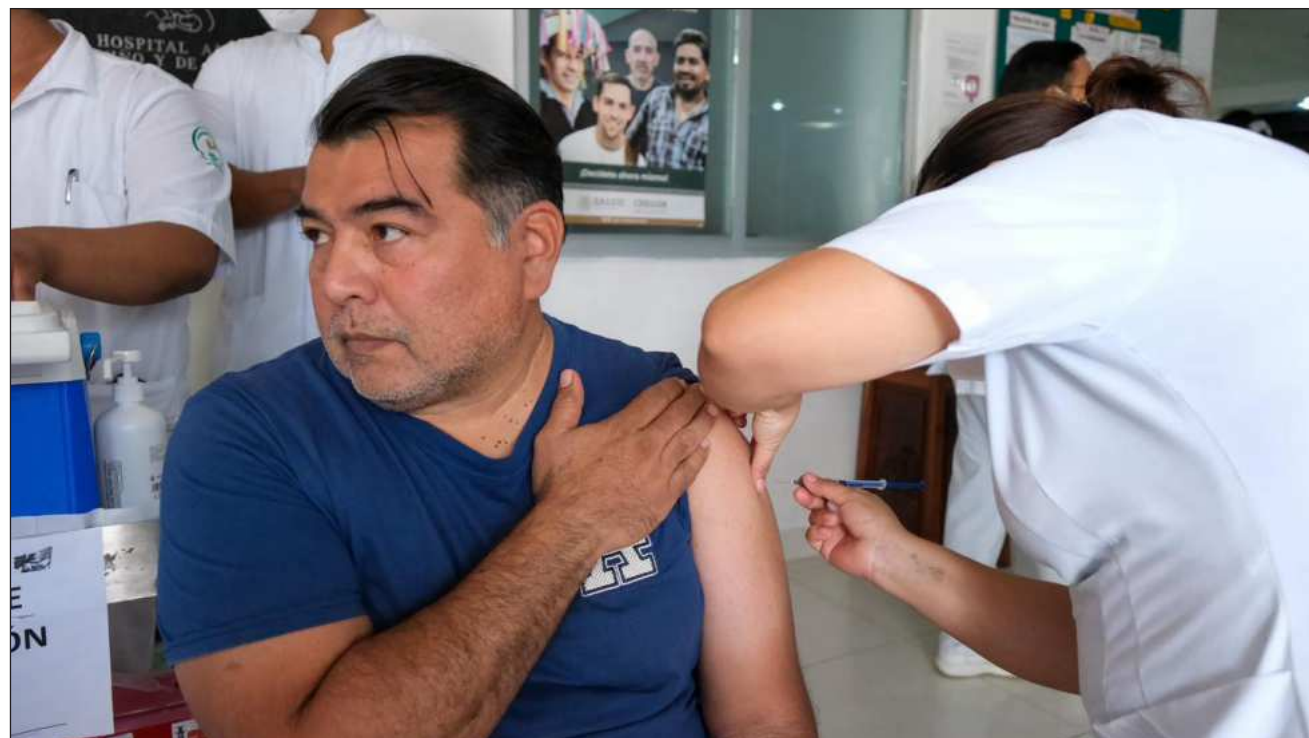
▲ Para asegurar que el cierre de la campaña sea contundente, se han incorporado 33 vacunadores adicionales y cuatro vehículos utilitarios para fortalecer las brigadas de salud, informó el secretario Carlos Flavio.

Actualmente se registran 185 casos confirmados de sarampión en la entidad, los cuales se concentran primordialmente en los municipios de Benito Juárez, Othón P. Blanco y Playa del Carmen. Ante esto, el secretario explicó que la estrategia de bloques vacunales y barrios casa por casa ha dado resultados sumamente positivos en zonas específicas, como Holbox y el sur del estado.