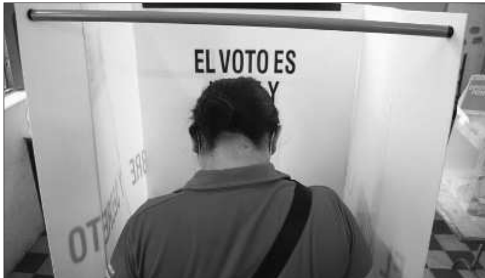
▲ Lorenzo Córdoba precisó que al INE no se le entregaron fondos adicionales para organizar la elección, sino que fue "gracias a las economías y el buen manejo de sus recursos".

El INE expuso que aquella estructura permitió organizar, en un tiempo breve, la elección para elegir a un senaduría por esa entidad, que quedó vacante después de que el titular de la fór-