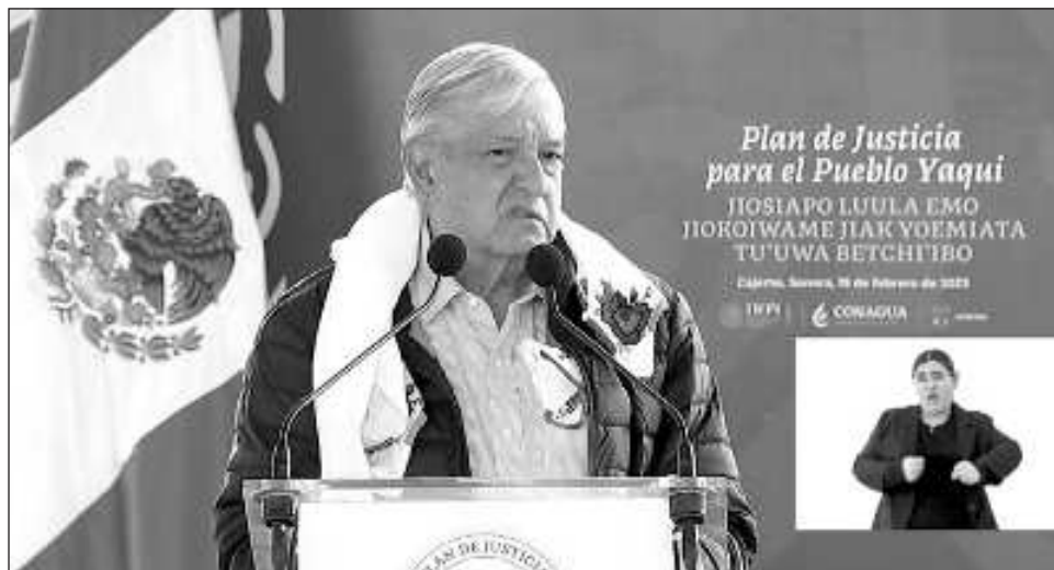
▲ El presidente Andrés Manuel López Obrador dijo que "lo más importante es que podamos hacer realidad lo que planteamos, es lo que estamos haciendo con este plan de Justicia Yaqui. Yo ya voy a entregar en un año ocho meses pero no quiero dejar nada inconcluso".

"Lo que me preocupa, aunque ya se ha avanzado bastante, es el sistema de riego, este canal y los otros canales, estamos hablando de canales para regar 50