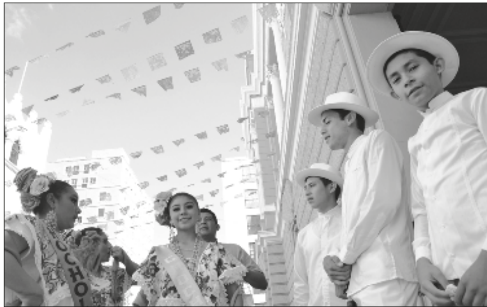
▲ El Día Internacional de la Lengua Materna fue proclamado por la Conferencia General de la Unesco en noviembre de 1999 con el objetivo de promover la preservación y protección de todos los idiomas que emplean los pueblos del mundo.

Cabe recordar que el Día Internacional de la Lengua Materna fue proclamado por