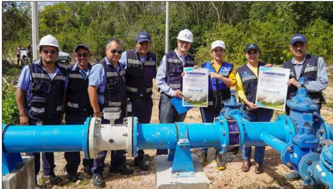
▲ Estos pozos contarán con un sistema de telemetría, último en tecnología e innovación hidráulica para monitorear en tiempo real volúmenes y posibles afectaciones al servicio que se pudieran presentar.

"La incorporación de estos cinco nuevos pozos a la Zona de Captación