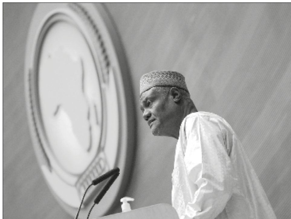
▲ Una de las prioridades que abordaron los líderes del continente en esta cumbre fue la implementación del Acuerdo de Libre Comercio Continental Africano.

“Quizás sea necesario insistir en sanciones individuales específicas que puedan disuadir a los que dan los golpes de Estado y evitar que sanciones generales puedan afectar