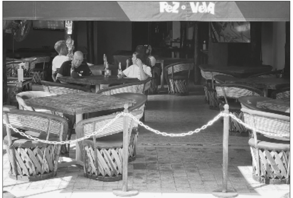
▲ Tanto restaurantes como hoteles han tenido afectaciones por la prohibición de fumar en dichos establecimientos, con clientes y huéspedes enojados debido a esta ley.

“Yo calculo que en el estado vamos a tener alrededor de 400 a 500 amparos aproximadamente antes del 24 de febrero”, estimó.