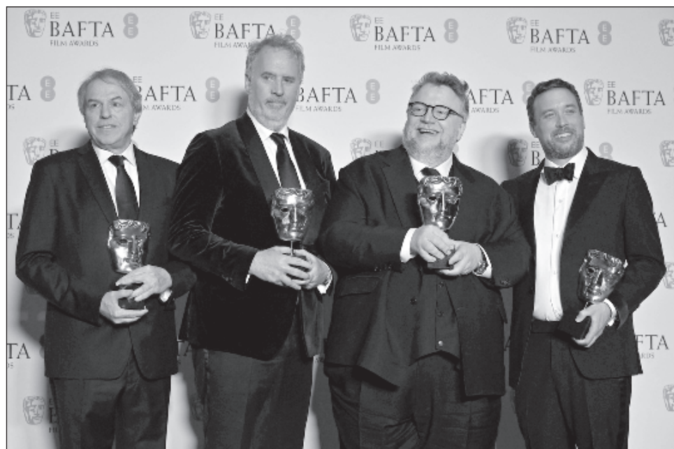
▲ En su discurso, el director mexicano Guillermo del Toro dio las gracias a Netflix por confiar en la historia de Pinocho durante la Italia de Benito Mussolini.

"Le agradezco mucho a los Bafta permitirnos estar aquí, porque la animación no es algo para niños. Es