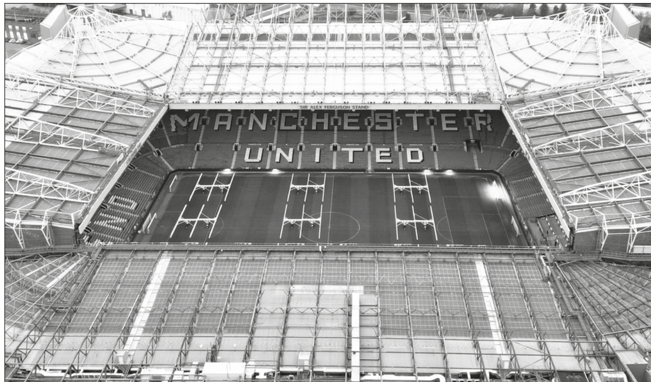
▲ Los propietarios actuales del equipo, la familia Glazer, deben ahora decidir si entran en una segunda fase de negociación o dan acceso a compradores potenciales a informaciones financieras sobre el club para que afinen su oferta.

Aunque el viernes había sido presentado como fecha límite, los Glazer y el banco Raine, encargado de la venta, estarán obligados a estudiar in-