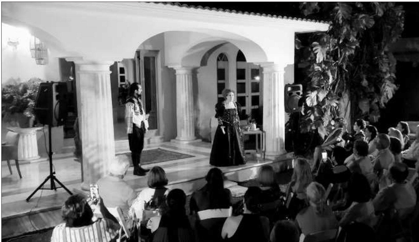
▲ A través de un mensaje esperanzador, La noche que jamás existió , del dramaturgo mexicano Humberto Robles, nos propone un cuestionamiento sincero acerca del amor y por encima de todo, respecto a la recuperación de este sentimiento.