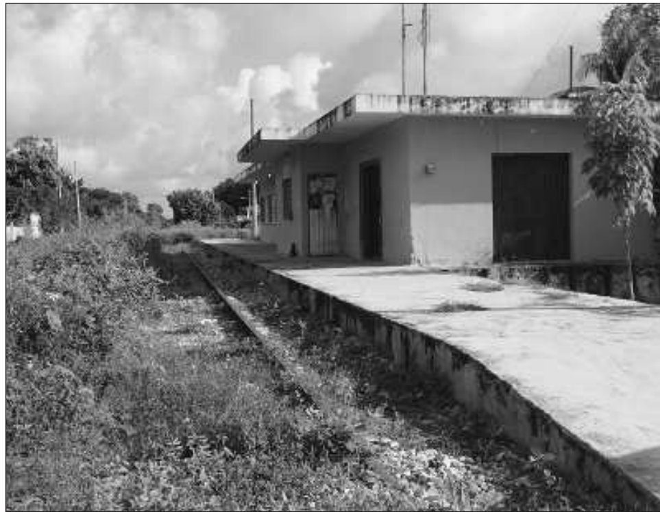
▲ Los pobladores aseguraron sentirse decepcionados ante la negativa a su petición de un paso peatonal, que sería útil principalmente a los adultos mayores que se dedican al trabajo de campo.

Sin embargo, en todo momento argumentó que su problema es social, pues las vías del Tren cortan la libre circulación de la calle 15 de Pomuch, y que ya