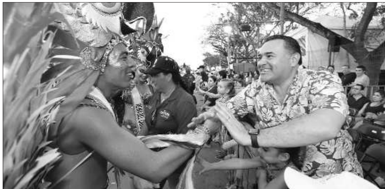
▲ El alcalde Renán Barrera acudió a Ciudad Carnaval acompañado de su familia para presenciar el desfile.

El alcalde Renán Barrera Concha acudió acompañado de su familia para compartir con los más de 148 mil personas que esperaban el inicio del desfile, donde esparcieron la diversión en grande los 19 carros alegóricos, en los cuales destacaron los te-