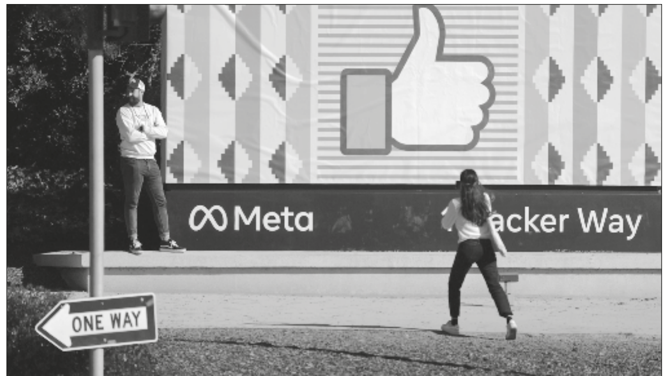
▲ Meta Verified , que se implementará primero en Australia y Nueva Zelanda esta semana “y pronto en más países”, permitirá a los usuarios “autenticar su cuenta” y dará beneficios como “acceso directo a la atención al cliente”.

Los intentos iniciales de Musk de lanzar un servicio similar en Twitter el año pasado fracasaron, con una serie de