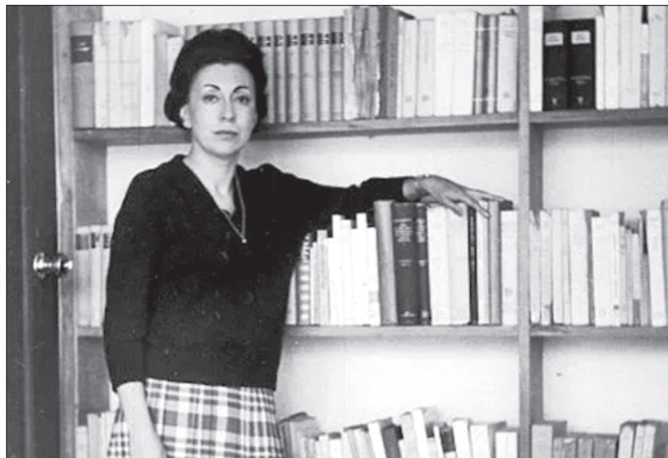
▲ Sus actividades, comentaba ella, “era el cultivo y la enseñanza de las letras, su dedicación al aula universitaria y a la escritura”. También su pasión como líder de opinión en el tema del feminismo, “mi mero mole”, como reiteraba constantemente.