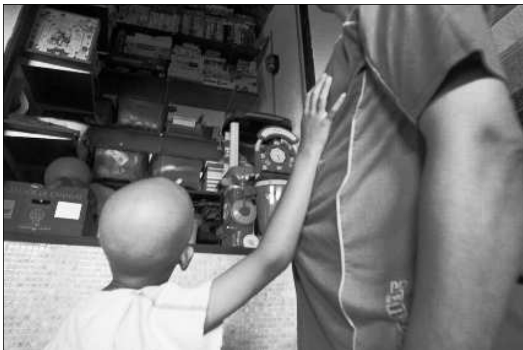
▲ En la península, Campeche reconoce al menos 220 pacientes infantiles de cáncer; en Yucatán, la Asociación Mexicana de Ayuda a Niños con Cáncer apoya a 260 infantes y adolescentes. Foto Efe

Pensemos que cuando suena una campana por haber vencido al cáncer o alguna otra catástrofe, no ha sido únicamente una victoria de un niño y sus médicos. El triunfo es para padres y madres, tíos, abuelos, hermanos, padrinos, y también de quienes hallaron en la pérdida de un ser querido la oportunidad de ser héroes para alguien más, a quien probablemente no conozcan, pero con quien establecen un vínculo invisible y de gratitud eterna. Así, cada niño triunfante nos representará como sociedad.