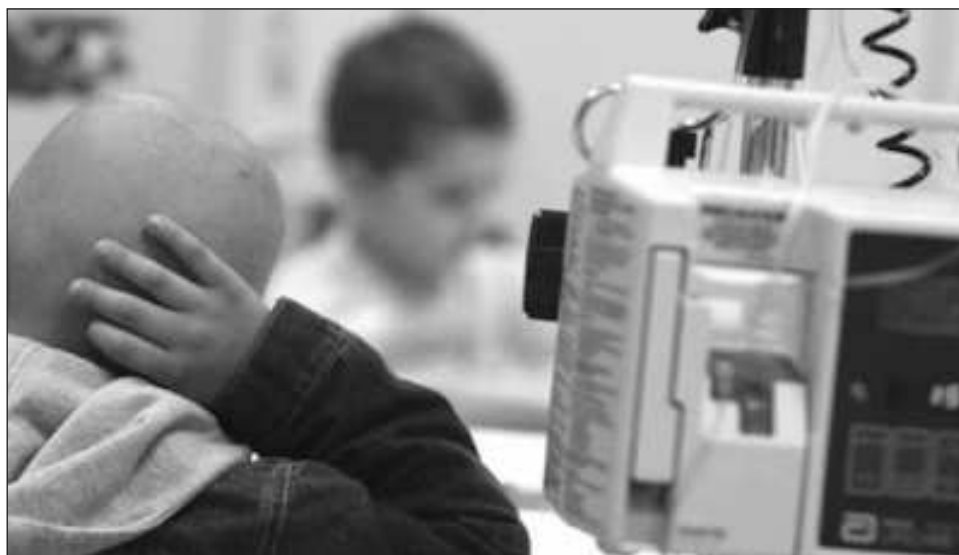
▲ Fundación Ayab hizo un llamado a las personas y a las empresas para que se sumen a este esfuerzo, apadrinando a niñas y niños con cáncer, "ya que una sólo organización no puede con toda esta lucha".

El evento, desarrollado en el Centro de Convencio-