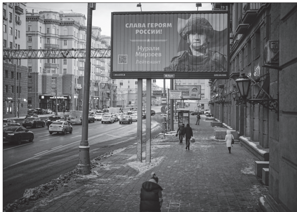
▲ El Banco Central de Rusia estabilizó el hundimiento del rublo subiendo las tasas de interés y la moneda es más fuerte frente al dólar que antes de la invasión.