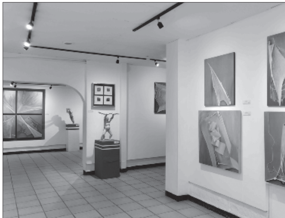
▲ La exposición está conformada por 68 piezas, en su mayoría pintura, concebida como un recorrido por las inquietudes de la artista sinaloense.

En la entrada de la primera sala se exhibe la escultura La gema , de gran formato, realizada en varilla y masa roca, que forma parte del conjunto de ocho piezas de la serie integrada por pintura, collage, grabado, música y performance El largo viaje desde el Rabinal , basada en el libro de teatro danza maya quiché El varón del Rabinal , muestra de que