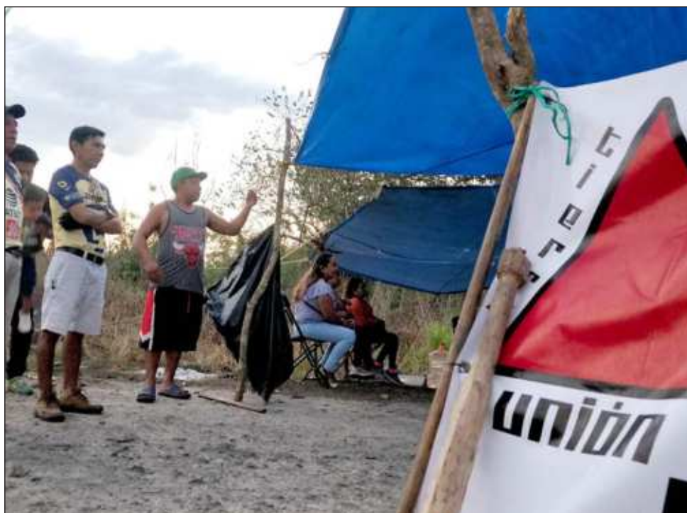
▲ Kanan Derechos Humanos dio a conocer que el colectivo La Esperanza de Sitalpech había sido víctima de represiones policiales mientras realizaban un bloqueo en una granja.

Para continuar en la lucha en defensa del agua y el medioambiente, por las noches se quedan aproximadamente 20 personas para mantener el bloqueo y vigilar la zona.