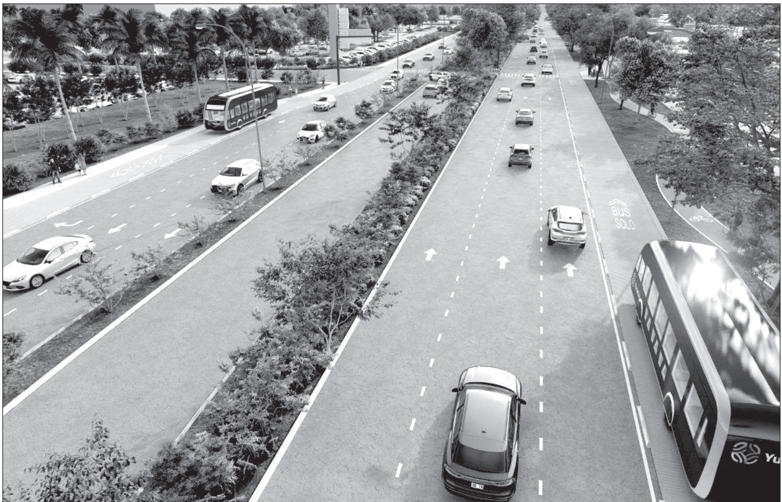
▲ "Hace falta que el transporte público en Mérida, que cuenta ya con una serie de problemáticas, se constituya en una alternativa de movilidad eficiente, para que así sea tomada en cuenta incluso por aquellas personas que ya cuentan con vehículo propio".