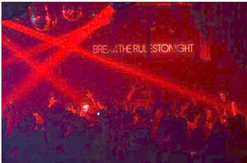
▲ "Comprendemos, respaldamos, apoyamos y velamos por la protección de los derechos humanos de todas las personas integrantes de la comunidad LGTBTTIQ+", señaló MC.

Señalaron que, con base en el artículo primero constitucional, el cual establece: "Queda prohibida toda discriminación motivada por origen étnico o nacional, el género, la edad, las discapacidades, la condición social, las condiciones de salud, la religión, las opiniones, las preferencias sexuales, el estado civil o cualquier otra que atente contra la dignidad humana y tenga por objeto anular o menoscabar los derechos y libertades de las personas".