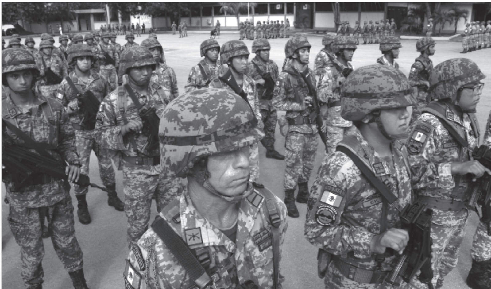
▲ "Sirvan estas líneas para recordar a los soldados y guerreros que a lo largo de la historia nos han dado patria, soberanía, dignidad y libertad".