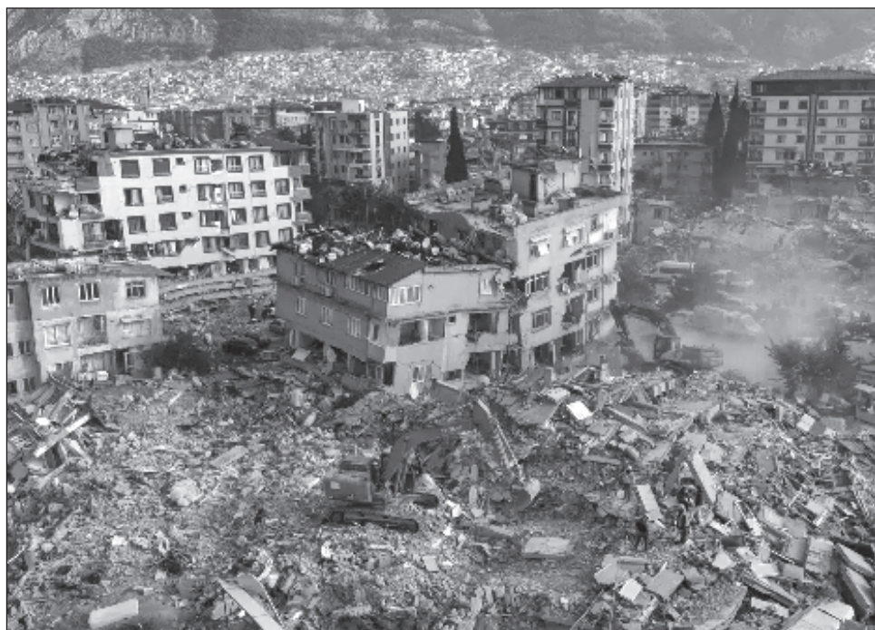
▲ La nueva cifra en los dos países afectados eleva el número de muertos a 44 mil 377. La ONU ha dicho que el alcance total de las muertes en Siria tardará en determinarse.

Sezer dijo a los periodistas en Ankara que el trabajo de búsqueda y rescate