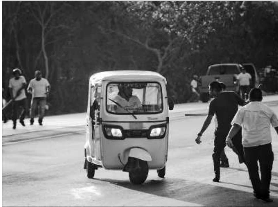
▲ En su más reciente sesión, los integrantes de la XVII Legislatura aprobaron reformas mediante las cuales se regulará el servicio de transporte de mototaxis.

“En el tema de Uber el artículo 85 TER se reservó, porque viene una fracción que habla del cobro de 2 por ciento y de la variedad de facetas por las que