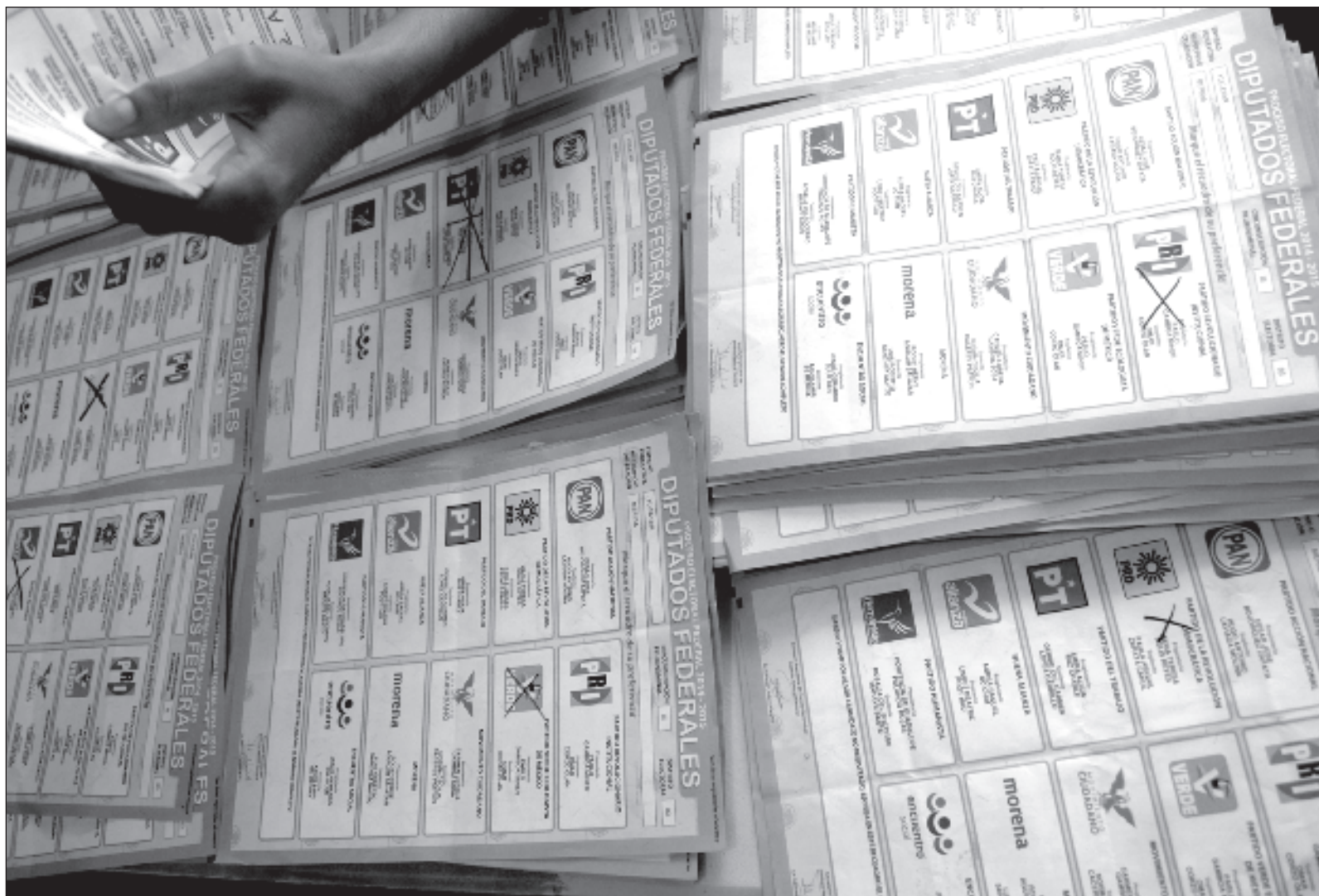
▲ “En política no hay nada seguro y querer asegurar algo es apostar a asfixiarlo, descomponerlo, descuadrarlo, hacerlo inerte”.