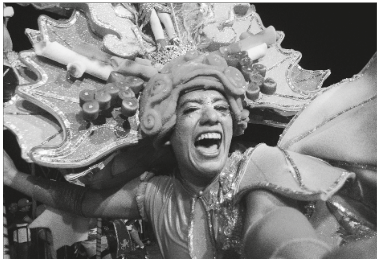
▲ Yéetel u chokoj k'iinil le k'iino'oba', u ki'iki' juumil paax, óok'ot yéetel múuch'o'obe' tu líik'saj u yóol Ciudad Carnaval, tu noj kaajil Jo', tumen beeta'ab le ba'ax k'aaba'inta'ab Domingo de Bachata, tu'ux táakpaj 19 u p'éeel kaarros

áalegorikóos, yéetel u múuch'ilo'ob óok'ot. Tu jo'olaj chúumuk k'iine', ya'abach máak káaj u k'uchul tak te'e kúuchilo', tu'ux cha'anta'ab le jejeláas ba'ax biinsa'ab ti'al u náaysik u yóol máak.