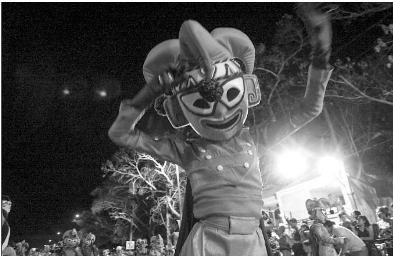
▲ El martes de Carnaval es un día considerado como inhábil en respeto a los usos y costumbres de la población de Yucatán.