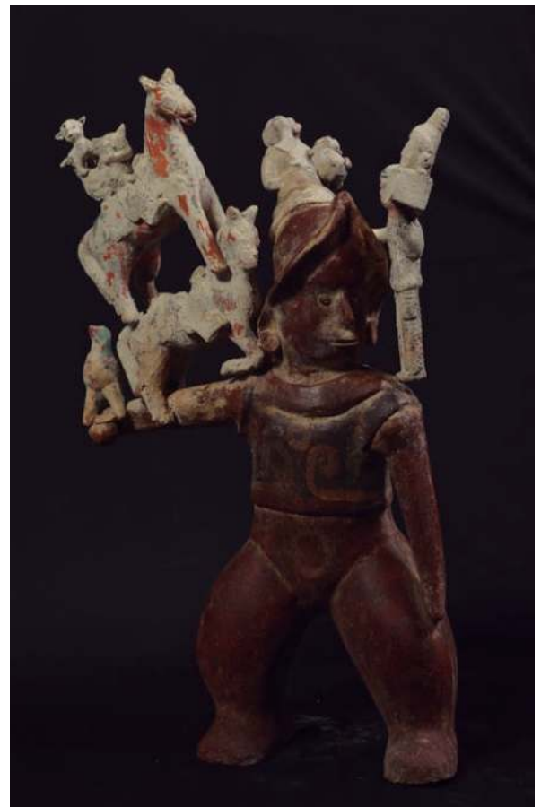
Árbol de la vida

“ El artista originario del Estado de Oaxaca, internacionalmente reconocido, empezó tempranamente a reflexionar sobre el tema de la hibridación