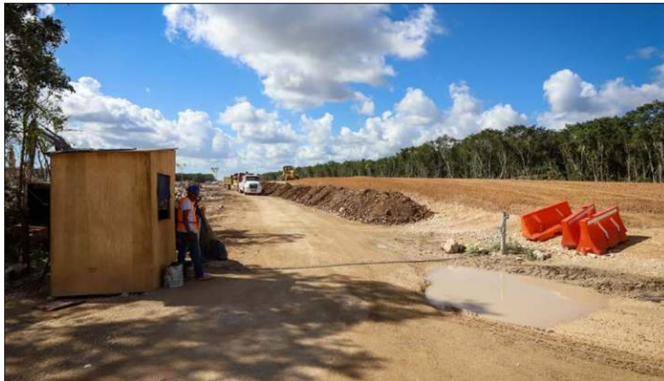
▲ El pasado 17 de enero, el Juzgado Primero de Distrito ordenó detener los actos de tala y desmonte de selva en todo el tramo 5, que va de Cancún a Tulum.

“Los amparos anteriores del tramo 5 sur y norte se concedieron debido a la