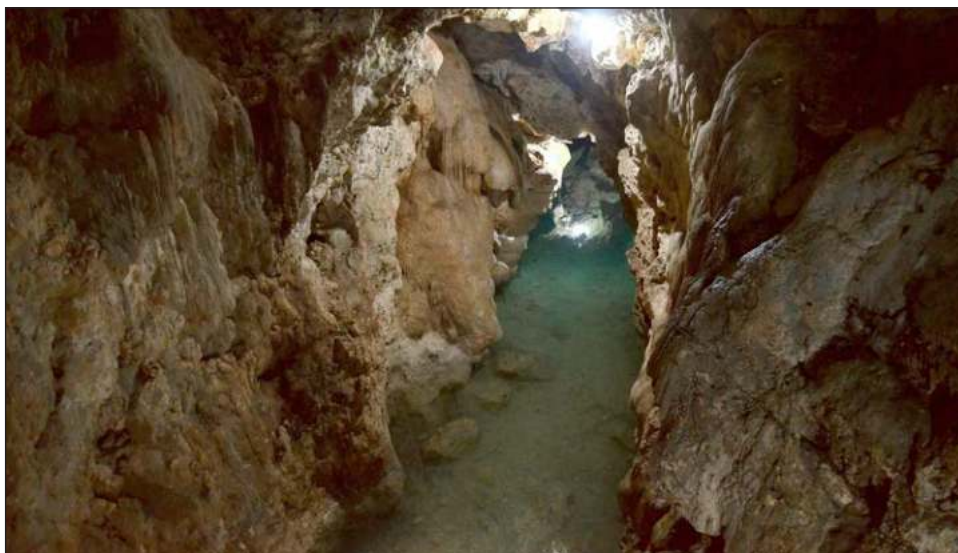
▲ Una de las problemáticas es la agricultura intensiva que contamina debido a los agroquímicos que utilizan en la producción, considerando que los plaguicidas no solo afectan al acuífero.