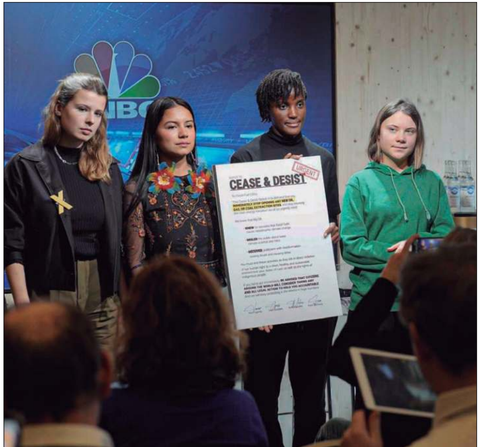
▲ Al margen del programa oficial junto a otras tres jóvenes: la ecuatoriana Helena Gualinga, la ugandesa Vanessa Nakate y la alemana Luisa Neubauer, Greta señaló a empresarios.

La sueca de 20 años participó en un panel organizado por la cadena CNBC en el que también estuvo el director de la Agencia Internacional de la Energía (AIE), Fatih Birol.