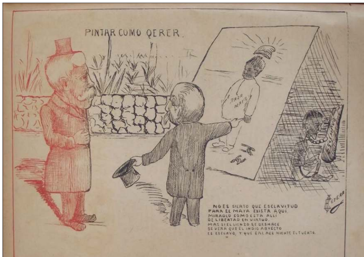
▲ La visita de Porfirio Díaz sirvió para finalizar con la polémica de la esclavitud practicada por los hacendados en Yucatán. Foto Etcétera, “Pintar como querer”, El Padre Carencio, 11 de febrero de 1906.

AHORA, LA NOTA en el diario de José María Pino Suárez tenía por objetivo promover la reflexión sobre cómo eran vistos los yucatecos en la Ciudad de México y el resto del país, por lo que se percibe un diálogo entre ambos periódicos, pues El Popular comienza diciendo que su propósito era “que procuremos sacar algo práctico en todas esas novedades, y que no nos limitemos a una admiración estéril de los recursos y riquezas con que cuenta tan importante estado de la República [...] para que tomemos ejemplo, y tratemos de imitar aquello que nuestro pueblo pueda secundar, de tan elocuentes lecciones”.