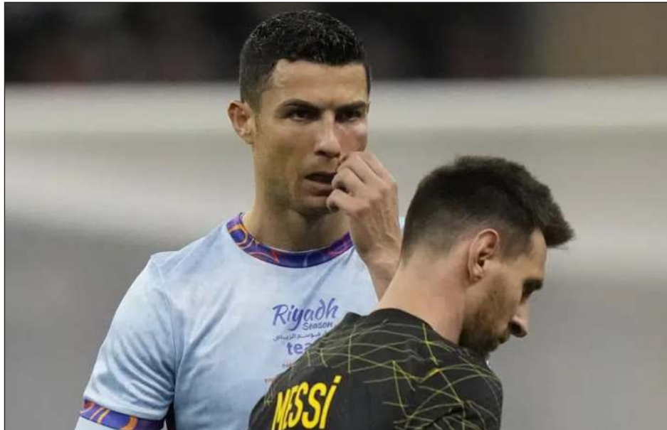
▲ Cristiano Ronaldo gesticula durante el partido entre un combinado de clubes de Arabia Saudí frente al PSG de Lionel Messi. El luso fue nombrado el más valioso del juego.

Al final del primer tiempo, la mejilla de Cristiano estaba roja, pero el