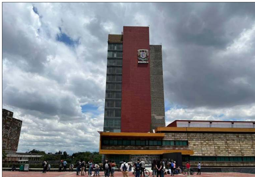
▲ Las autoridades de la UNAM no parecen haber caído en la cuenta de que el escándalo arroja una sombra de duda sobre su capacidad para certificar la aptitud profesional de sus graduados.

Por añadidura, el control de daños ensayado por la rectoría con la expulsión de una maestra no sólo es fallido, sino también contraproducente, por cuanto deja la impresión de que se busca dar carpetazo al escándalo por medio de un chivo expiatorio. Es ineludible que, en ejercicio de su autonomía, las máximas instancias de la UNAM dejen atrás la ambigüedad y hasta la pusilanimidad, realicen un extenso ejercicio de transparencia y de autocrítica, emprendan una revisión exhaustiva de posibles casos de plagio en tesis profesionales y tomen las medidas correctivas y preventivas correspondientes. Está en juego nada menos que la credibilidad de la máxima casa de estudios del país.