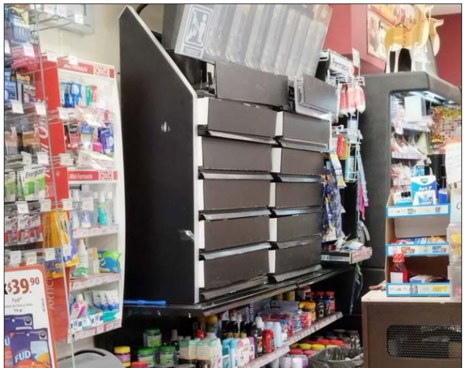
▲ Las autoridades advierten que en los próximos operativos se decomisará todo aquel producto que no cumpla con los lineamientos establecidos.

“Es necesario dejar en claro, que de acuerdo con la Ley, el desconocimiento de los alcances de estas, no son un argumento para que no se cumpla con lo establecido, por lo que es necesario que se evite el exhibir las cajetillas y publicidad del tabaco”.