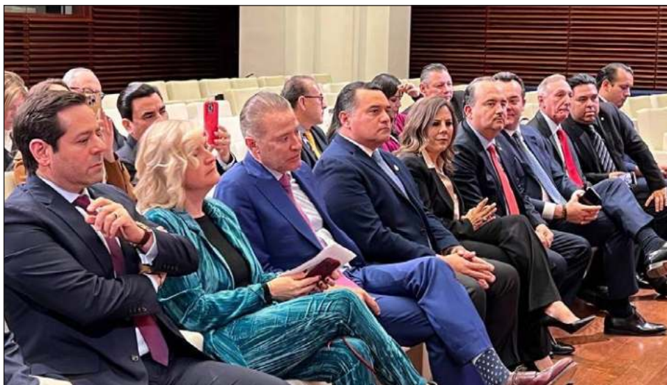
▲ El alcalde Renán Barrera Concha se reunió con los representantes de la administración municipal de Madrid para sentar las bases para futuros proyectos.

El alcalde recordó que en Mérida existe una gastronomía intercultural debido a la mezcla de las cocinas maya, española, libanesa y coreana, las cuales se han fusionado para dar identidad a nuestra cocina yucateca. "En Mérida impulsamos la creatividad gastronómica con el proyecto dado a conocer el año pasado para crear el corredor gastronómico de la calle 47 del barrio de Santa Ana, hacia lo que será el Gran Parque de la Plancha, en nuestro centro histórico."