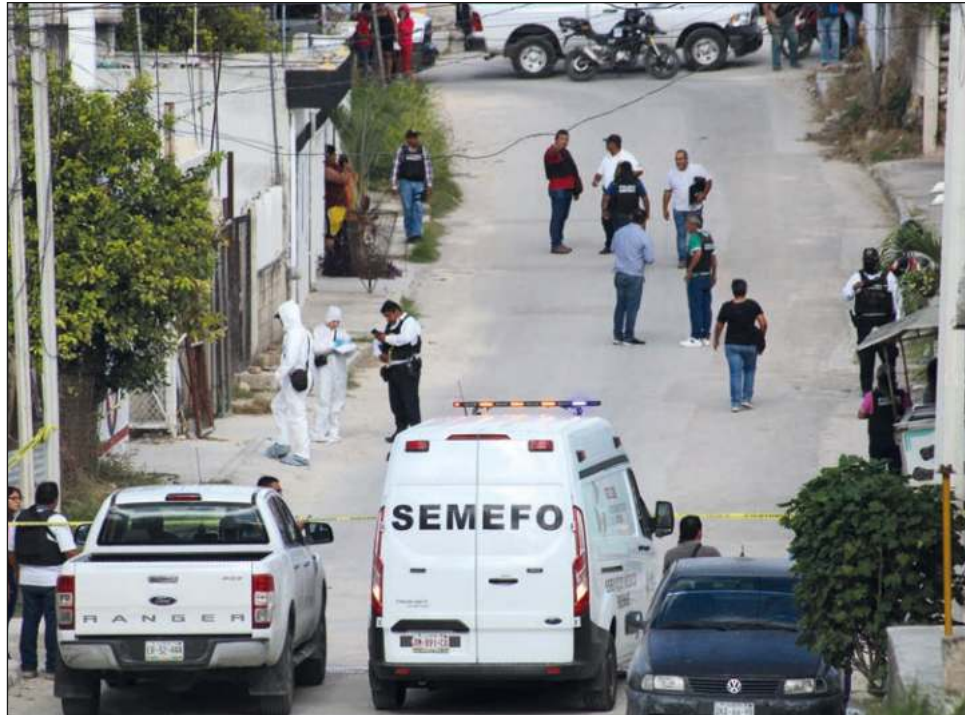
▲ Una de las ciudades con mayor crecimiento de miedo fue Campeche, que en el tercer trimestre de 2022 tenía 42 por ciento de percepción poblacional de inseguridad, y para el último trimestre del año, pasó a 66 por ciento, según encuesta del Inegi.

Esto tomando en cuenta los homicidios dolosos violentos reportados en diferentes puntos del estado, pero donde el mayor protagonista ahora fue la capital, cuando en años anteriores este tema era más de municipios como Candelaria, Escárcega, Palizada, Calakmul y Carmen. Carmen, también entró a la encuesta y a comparación de la capital me-