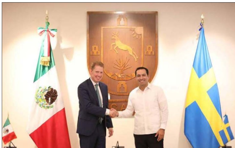
▲ En su primera visita oficial al estado, el diplomático Gunnar Alden destacó la transformación del territorio y los buenos índices de seguridad.

En materia de sustentabilidad, indicó que para