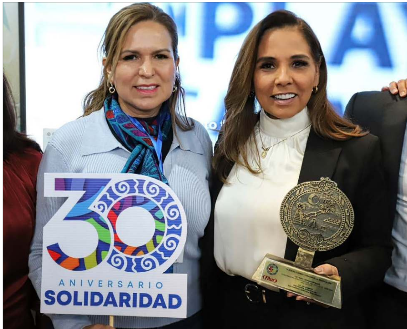
▲ En la edición 43 de la Feria Internacional de Turismo, con sede en España, se dio a conocer que el próximo festival culinario del Caribe Mexicano se realizará en el municipio de Solidaridad; el año pasado se llevó a cabo en Cancún.

La gobernadora también sostuvo una reunión con Julia Simpson, CEO del Consejo Mundial de Viajes y Turismo (WTTTC) sobre diseño de políticas públicas orientadas a la seguridad turística, la sostenibilidad y la diversificación de los destinos turísticos del Caribe Mexicano.