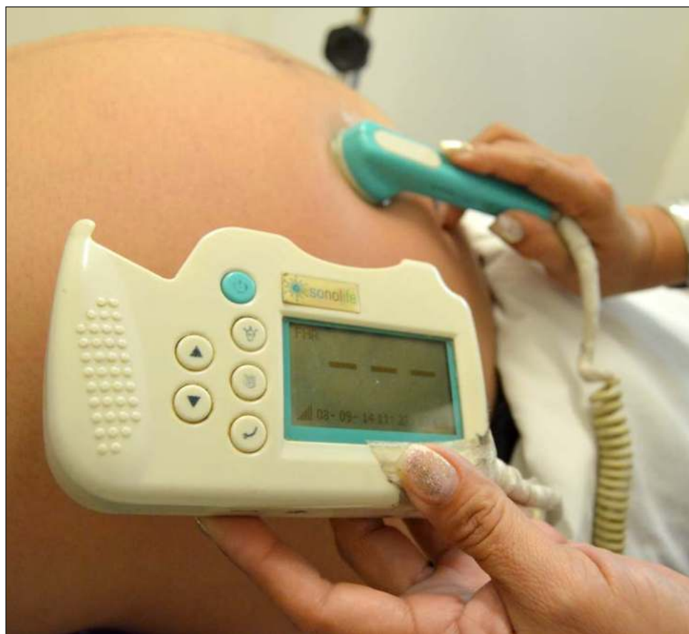
▲ La fijación del estándar jurisprudencial regional reconoce que la violencia obstétrica sucede durante el embarazo, parto y puerperio.

Así como intervenciones médicas forzadas o coaccionadas y en la tendencia a patologizar los procesos reproductivos naturales.