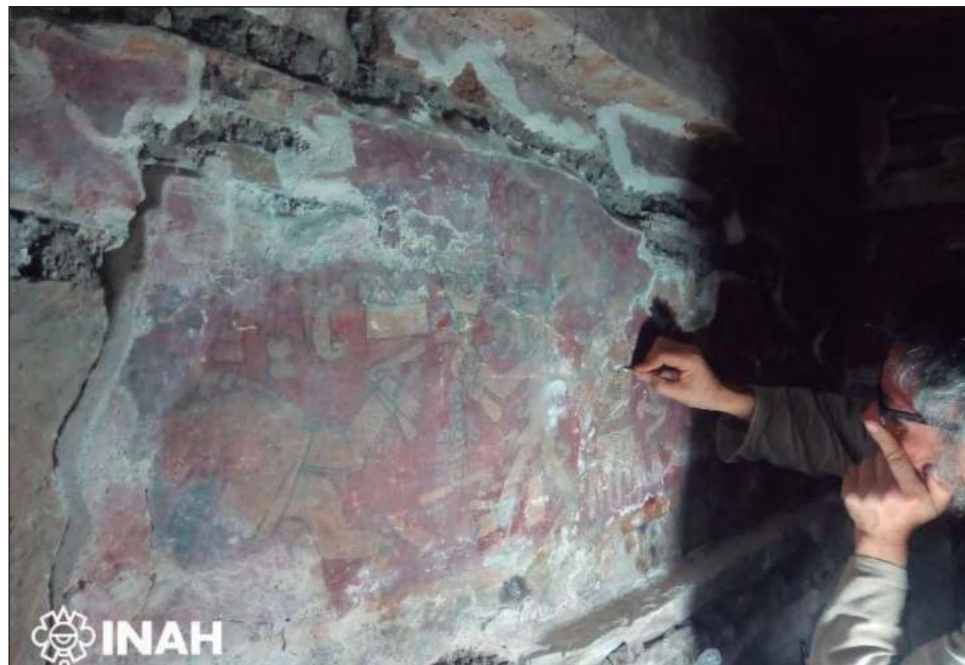
▲ Las pinturas en los muros de la cámara principal, realizadas en estilo códice, muestran escenas de guerra con personajes ricamente ataviados, pintados con líneas negras.

San Pedro Nexicho fue uno de los más grandes e importantes asentamientos zapotecos de la región, como lo atestiguan la docena de antiguas tumbas que ahí se ubican, cinco de las cuales fueron recuperadas recientemente por un equipo interdisciplinario del INAH, con el apoyo económico de la Fundación