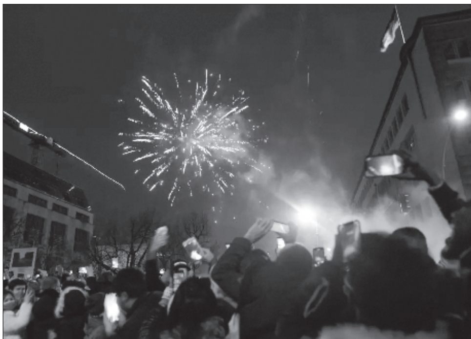
▲ Por cuarta vez consecutiva, la capital checa no organizará institucionalmente fuegos artificiales de Nochevieja y Año Nuevo, y la razón es que el río "representa un lugar de hibernación significativo para los pájaros acuáticos", según el portavoz del ayuntamiento.

Praga ha lanzado además la campaña Este año sin petardos , en la que insta a los visitantes, con un mensaje en checo y en inglés, a que celebren estas fiestas navideñas sin esos artefactos explosivos.