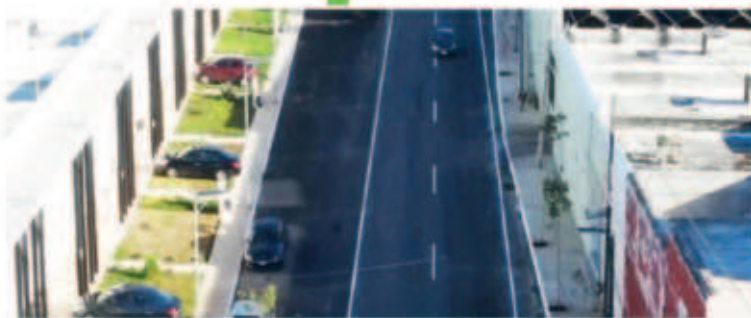
Construcción y repavimentación de más de 3.8 kilómetros de calles que abarcan la 46, 43 y 55. Adicionalmente se realizará la construcción de banquetas y guarniciones, señalética, sistema de iluminación y pozos pluviales.