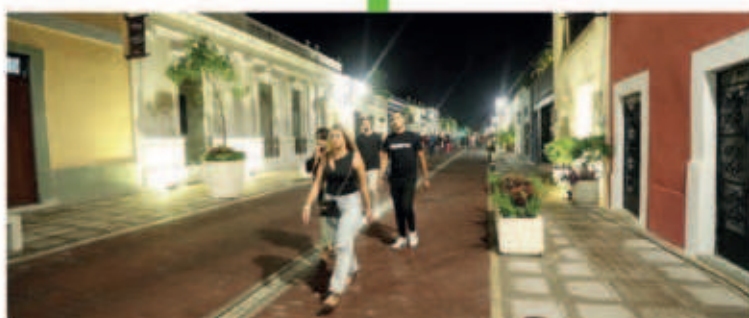
Estamos realizando el Corredor Turístico - Gastronómico de la calle 47 y 60 para conectar a la Plaza Grande, el Parque de Santa Lucía y de Santa Ana con el nuevo Parque la Plancha, en conjunto con el Ayuntamiento de Mérida.