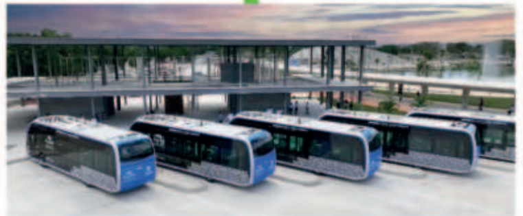
Se construye la estación del IETRAM en el Parque la Plancha, para 3 rutas de este transporte público 100% eléctrico y único en su tipo en Latinoamérica.