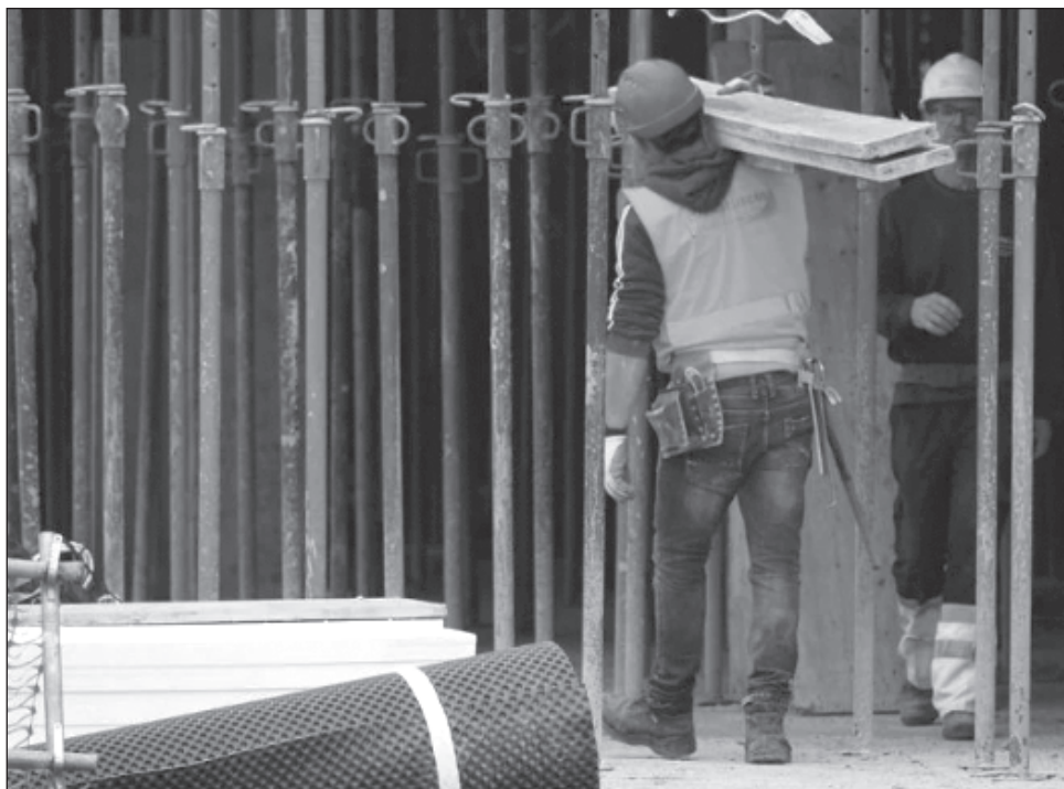
▲ Durante el periodo enero-noviembre de 2023, el estado de Yucatán registró 649 nuevos patrones ante el IMSS, cifra superior a la media nacional de 385.

También, con el fin de continuar haciendo crecer los emprendimientos, micro y pequeñas empresas para que sigan generando economía y empleos el gobernador distribuyó recientemente un total de mil 146 apoyos de programa MicroYuc productivo y 221 de MicroYuc Social, respaldo que representa una inversión total de 7.8 millones de pesos.