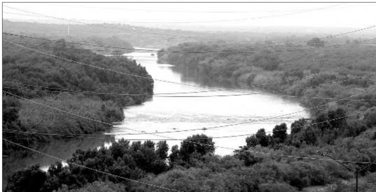
▲ Legisladores tamaulipecos y del Senado señalan que esta medida viola el Tratado Internacional de Aguas de 1944 suscrito por ambos países, que establece la entrega de una tercera parte del líquido del río Bravo, y lo que ahora se plantea es el envío de dos terceras partes.

Con el tratado, México asigna al país vecino, del lado del río Bravo, 431.6 millones de metros cúbicos anuales, una tercera parte del líquido. Las entregas de este cauce se hacen en ciclos de cinco años, por lo que de los mil 294.8 millones de metros cúbicos que se ten-