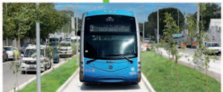
Construcción de vías en donde transitarán las unidades del IETRAM, además de construcción de banquetas y guarniciones, señalética, sistema de iluminación y pozos pluviales.