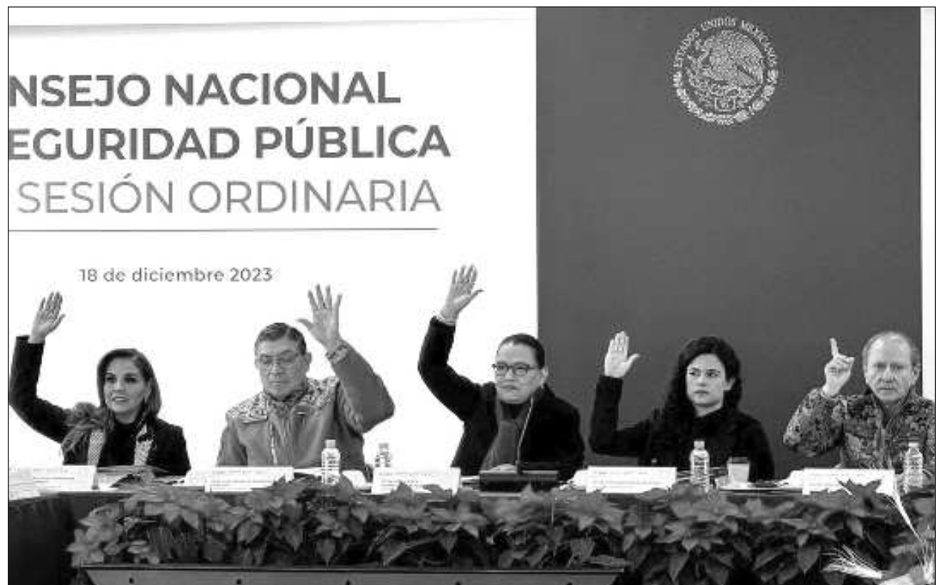
▲ Durante la XLIX Sesión Ordinaria del consejo de Seguridad Pública, en Palacio Nacional, la gobernadora Mara Lezama reiteró la importancia de atender los orígenes de la violencia y criminalidad.

Durante este marco la gobernadora destacó que en Quintana Roo a través del Nuevo Acuerdo por el Bienestar y Desarrollo de Quintana Roo se trabaja de la mano de los ciudadanos en la construcción de la