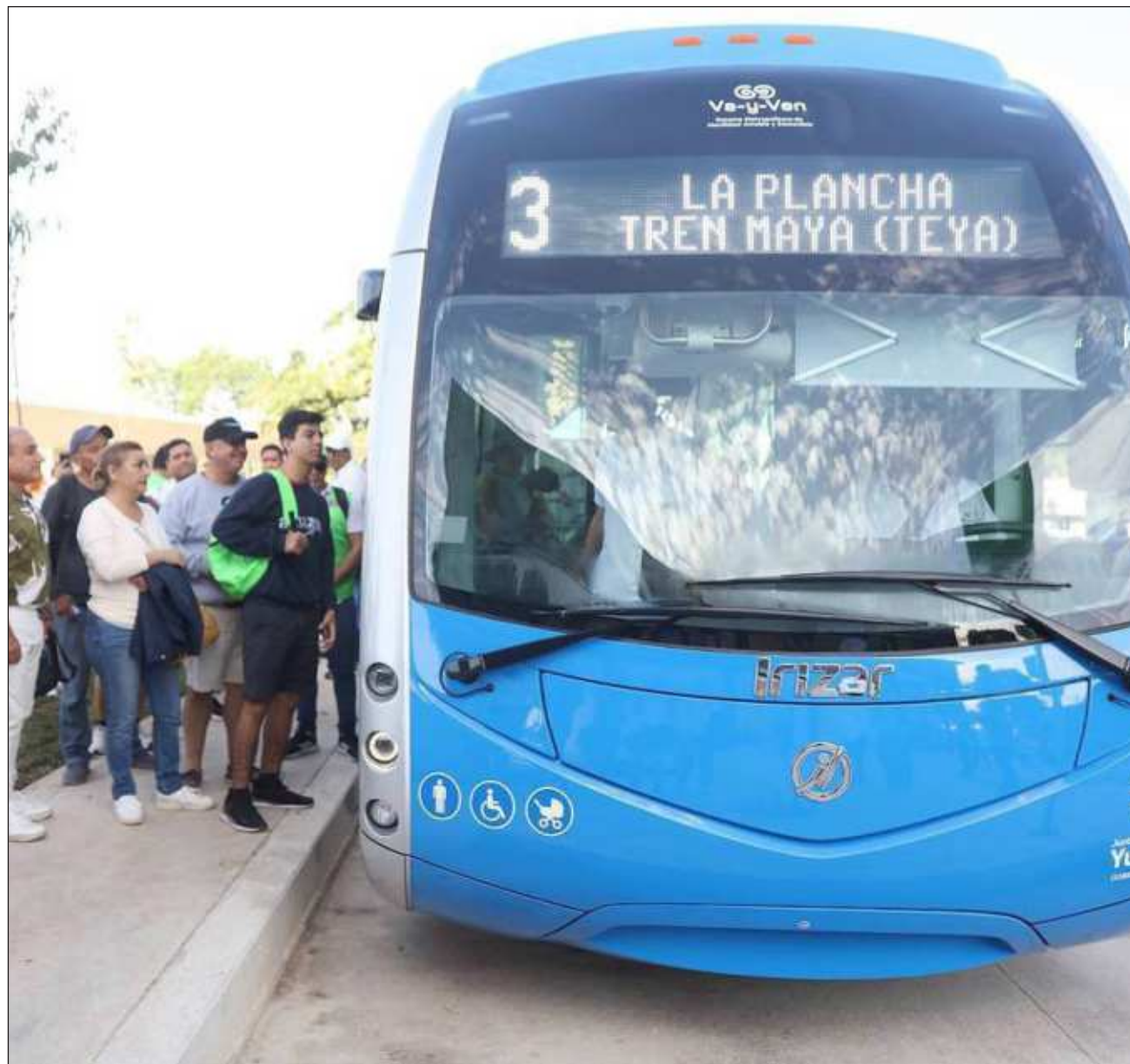
▲ Yucatán tiene la mejor estación del Tren Maya en operaciones al momento: el IE-Tram, inaugurado el pasado viernes, sale del Paseo 60 y del Parque la Plancha hacia la estación, y el cobro es de 45 pesos por persona.

Yucatán tiene la mejor estación del Tren Maya en operaciones al momento, además de amplia y con el mayor número de andenes, el servicio de transporte público para llegar y salir de la estación es el