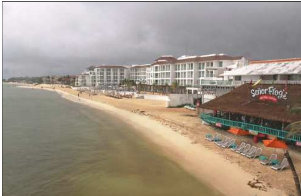
▲ La masa de aire frío mantendrá el cielo parcialmente nublado y viento del noroeste y norte de 30 a 40 km/h, principalmente en la zona norte y zonas costeras.