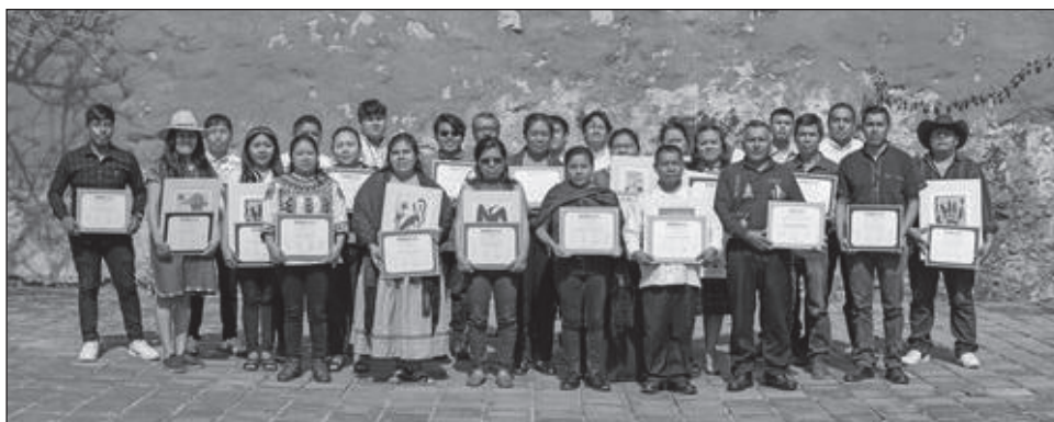
▲ “Estos incentivos tienen más de una década de historia; fueron creados por el maestro Toledo en un intento por preservar las lenguas originarias y defender los derechos humanos”.