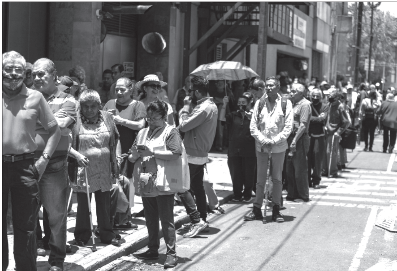
▲ El Inegi estimó que durante 2022, los gobiernos estatales y locales contribuyeron al Producto Interno Bruto del total de la economía mexicana con un valor agregado bruto de 1.54 billones de pesos corrientes, de los cuales el 14.6 por ciento se refiere a los servicios de salud y de asistencia social.

De los gobiernos de las entidades con mayor participación en el total de la inversión fija destacaron el Estado de México, con 11.3 por