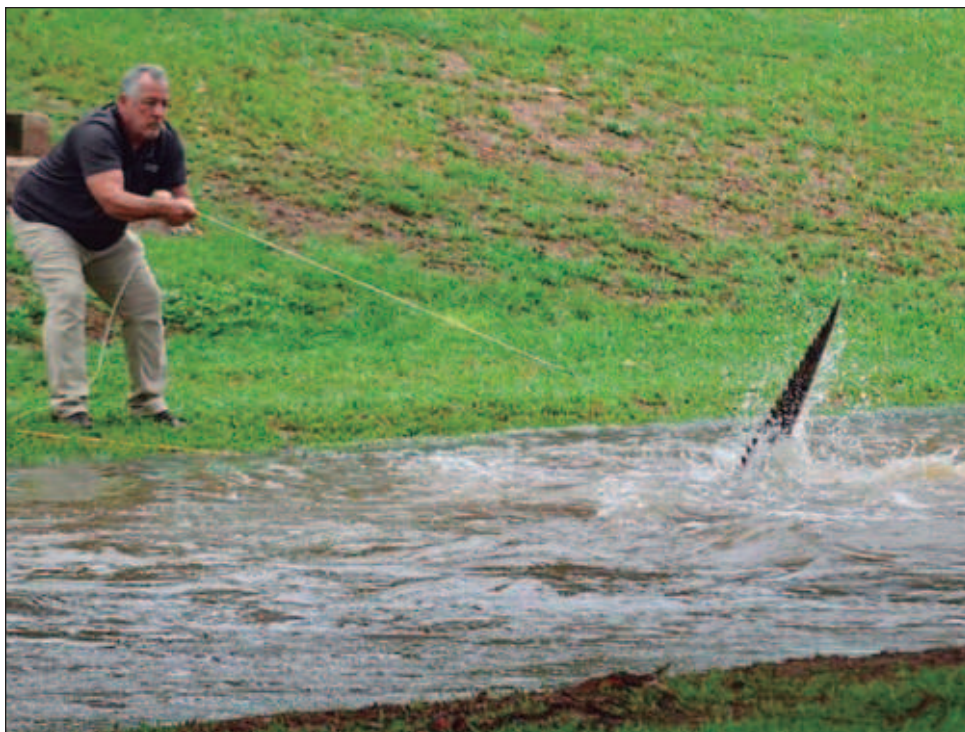
▲ Varios lugareños buscaron refugio en los techos de hospitales y residencias. “Sabemos que esas personas se encuentran ahora en una situación desesperada”, declaró Kiley Hanslow.