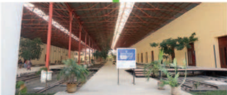
La Universidad de las Artes, UNAY, que ahora es la más importante del sureste del país, se está ampliando para aumentar su capacidad y recibir hasta 2 mil alumnos.

ESTAS SON LAS NUEVAS OBRAS QUE GENERAN GRANDES BENEFICIOS PARA TI Y TU FAMILIA