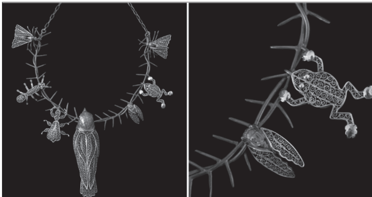
▲ Piezas talismánicas inspiradas en mitos mesoamericanos, entre ellas un sapo, así como la cigarra que alegre volvió a cantar después de la pandemia, acompañan este logro de la orfebrería que se exhibe en Ciudad de México.

En su taller continúan con la técnica tradicional a su hijo y su yerno. Su papá murió hace tres años; siempre estaban juntos. “Yo le dije que enseñáramos. Antes los maestros eran más celosos”.