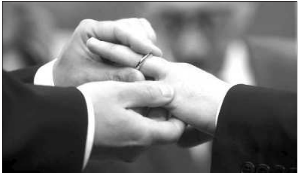
▲ La bendición a estas parejas "irregulares" deberá consistir en una "oración breve" y "espontánea" en la que un cura podrá pedir "paz, salud, espíritu de paciencia, diálogo o ayuda mutua" a sus miembros.

"En su misterio de amor, a través de Cristo,