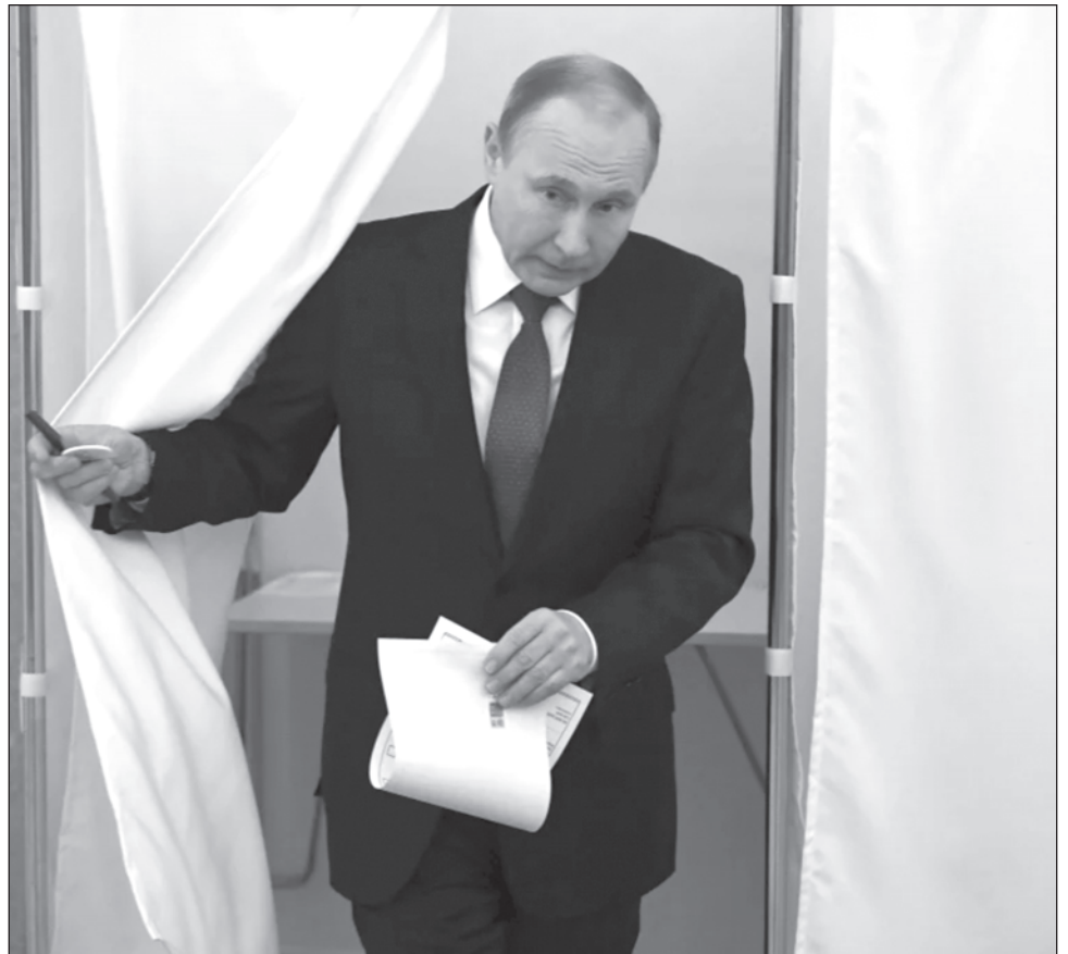
▲ De acuerdo con las encuestas oficiales de los últimos días, 80 por ciento de los rusos aprueba la gestión de Vladímir Putin, que dirige este país desde el año 2000.

La oposición al Kremlin considera que las elecciones serán un referéndum sobre la actual guerra, en la que Rusia no ha logrado los objetivos que se marcó en febrero de 2022 y habría sufrido, según Occidente, más de 300 mil bajas, entre muertos y heridos.