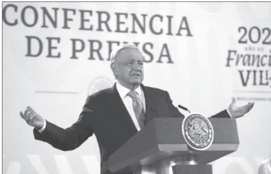
▲ Durante su conferencia de prensa, López Obrador consideró que los magistrados actúan por consigna y mediante acuerdos en las altas esferas.

Tras describir el proceso para cancelar a estas candidaturas en la cual dio entender que actuaron conjuntamente con el Instituto Nacional Electoral, el Pre-