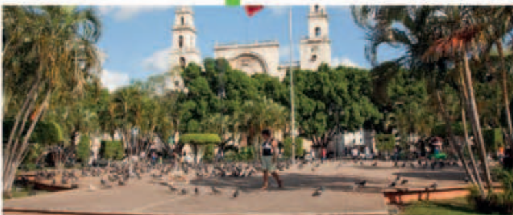
Realizaremos la remodelación de la Plaza Grande