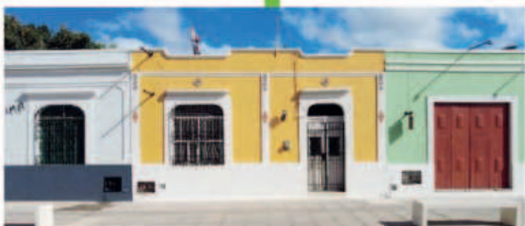
El Ayuntamiento de Mérida invirtió en la pintura en las fachadas de las viviendas que rodean al Parque de la Plancha.