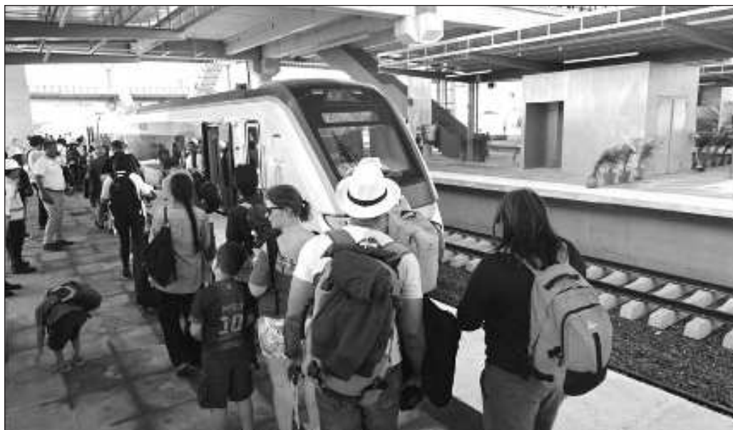
▲ De momento, la novedad del ferrocarril ha llevado a pasar por alto que alrededor de las terminales no hay un servicio regulado de transporte para el turismo, que queda expuesto a tarifas arbitrarias tanto por parte de las agrupaciones de taxistas como de las plataformas.

Brindar al viajero un abanico amplio de opciones para trasladarse cómodamente desde las terminales hasta el lugar donde se hospede o al punto en donde tenga un negocio por atender, termina siendo una tarea en la cual las autoridades locales tienen mucho por hacer, y en esta ocasión es necesario decir que Yucatán ha mostrado el camino.