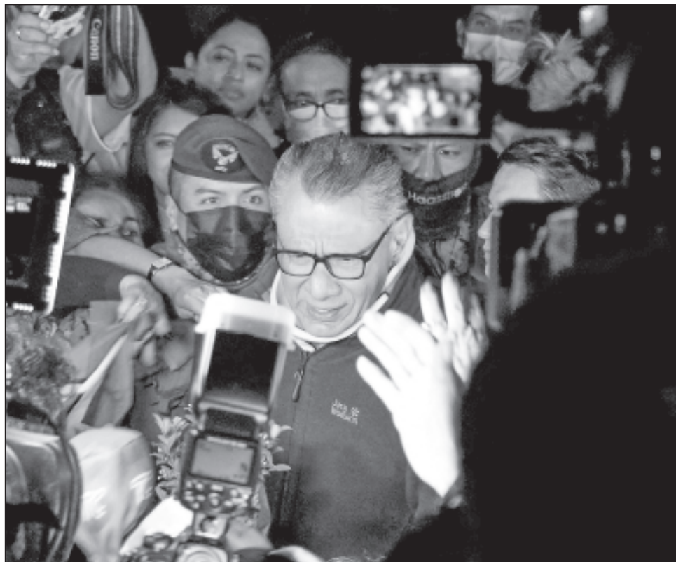
▲ López Obrador planteó que gobernadores de oposición: PRI y PAN están a favor de que la GN dependa de la Sedena, pero quienes se oponen son los legisladores.

“No existe una orden de detención, no es que se ha solicitado que sea capturado, como quizá hemos podido leer en varias redes sociales”, dijo Salazar en la televisión Telamazonas.