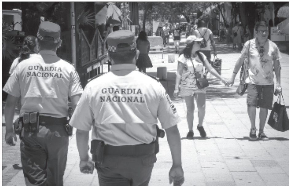
▲ López Obrador planteó que gobernadores de oposición están a favor de que la GN dependa de la Sedena, pero quienes se oponen son los legisladores.

El jefe del Ejecutivo planteó que incluso los gobernadores de oposición: PRI y PAN están a favor de que la Guardia Nacional dependa de la Secretaría de la Defensa, pero quienes se opo-