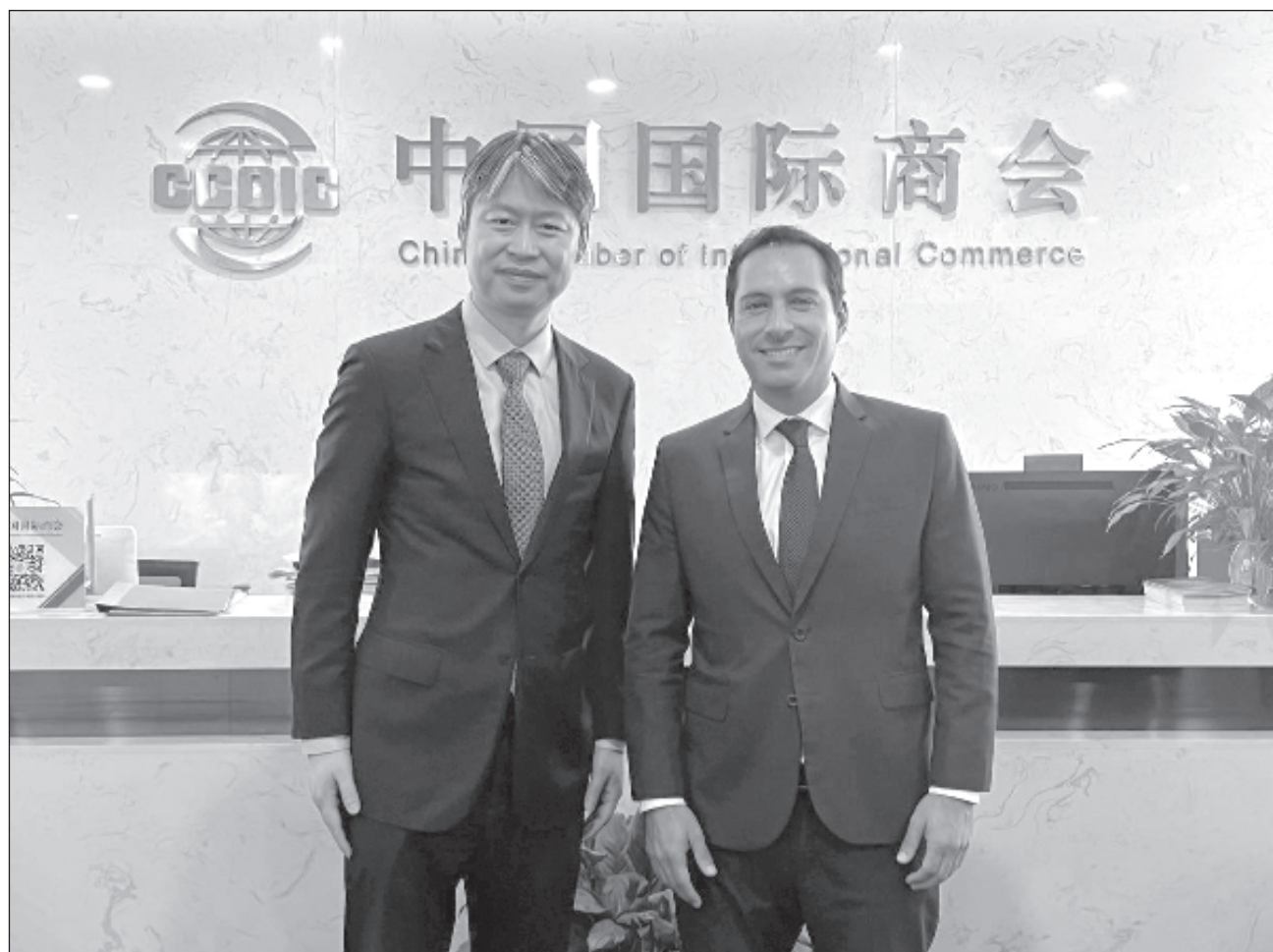
▲ El gobernador Mauricio Vila y representantes de la Cámara de Comercio de China lograron establecer una serie de acuerdos para que empresas locales se conviertan en proveedores de mercancías hacia esa nación.

En su exposición, Vila Dosal recordó que para