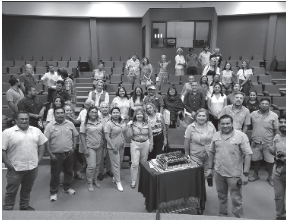
▲ Para celebrar ofrecerán servicios de mantenimiento a telescopios, así como visitas guiadas, funciones en el domo digital y la obra Los supersónicos con 100cia .

"Estamos cumpliendo 10 años y durante estos años que llevamos de ser el Planetario