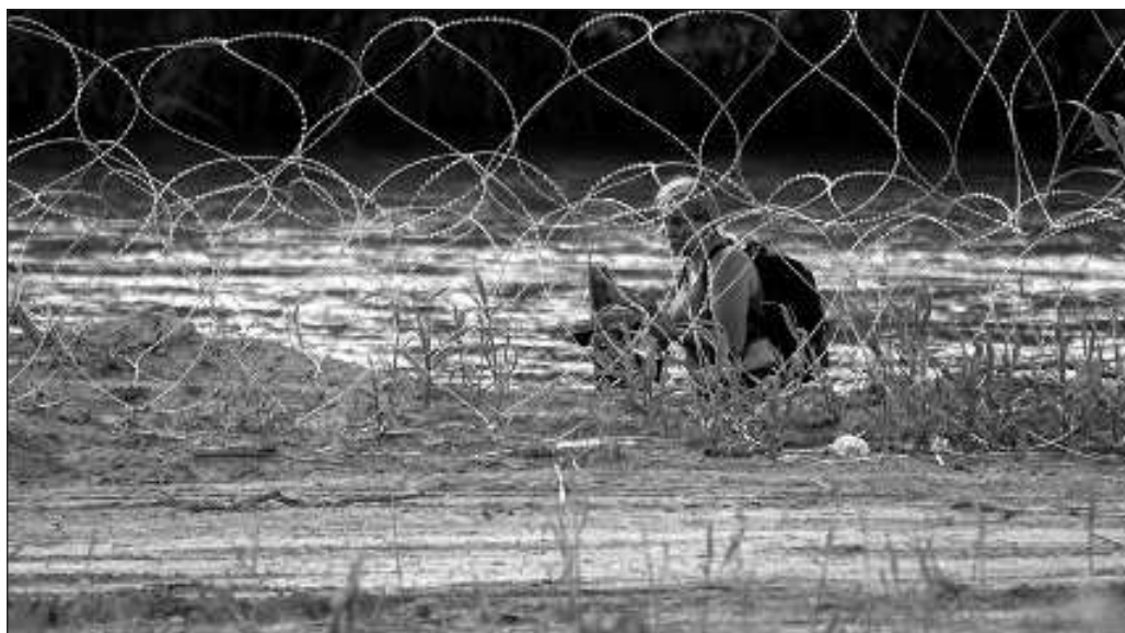
▲ En Texas, la policía fronteriza tiene orden de empujar al río a niños pequeños y bebés lactantes, así como de negarle el agua a quienes ingresen a ese territorio desde México.

México no puede decirse ajeno a este problema. Miles de personas provenientes de varias partes del mundo, no solamente centro, Sudamérica y el Caribe, buscan atravesar el territorio desde el Suchiate hasta el Bravo y tampoco hacen ese recorrido con garantías de seguridad de sus vidas y para su dignidad como personas. Son víctimas tanto de la delincuencia organizada como de organismos del gobierno, incluido el Instituto Nacional de Migración. Todavía en marzo pasado el incendio de la estación migratoria de Ciudad Juárez dejó 40 muertos de los cuales el Estado era responsable. No miremos la paja en el ojo ajeno cuando tenemos responsabilidad en el problema.