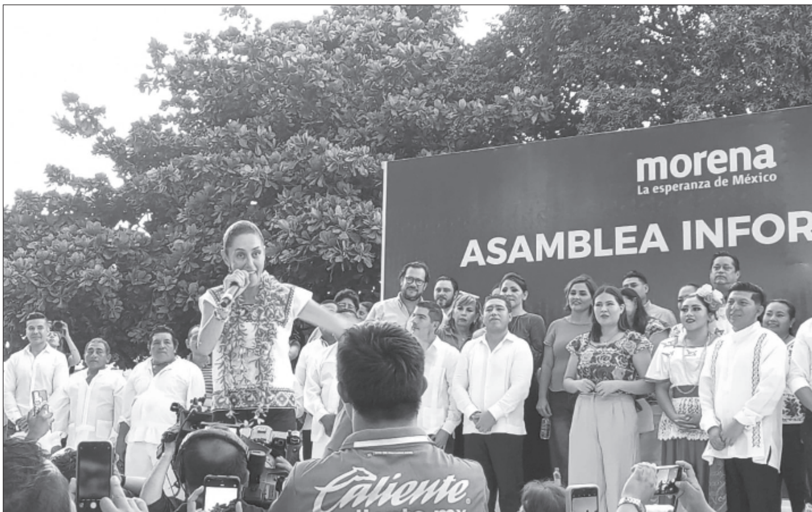
▲ La asamblea informativa de Claudia Sheinbaum Pardo en el deportivo Toro Valenzuela, donde miles de simpatizantes le refrendaron su apoyo.

A casi un mes de que se lleven a cabo las encuestas de Morena para definir a su candidato presidencial, Sheinbaum dijo que ha visto que la gente quiere mucho a su presidente y lo que representa la cuarta transformación y que les ha ido muy bien en su recorrido.