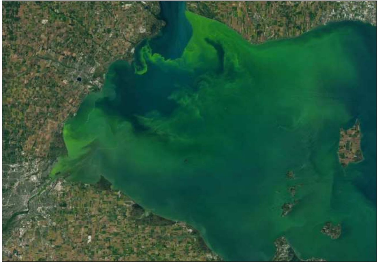
▲ Ikil u béeytal u yila'al tu jach ka'anail bix yanik le ja'o', tu chíikpajal bix u k'éexel u boonil.

Ba'ale' yaan xan uláak' ba'alo'ob maas náach k'iin