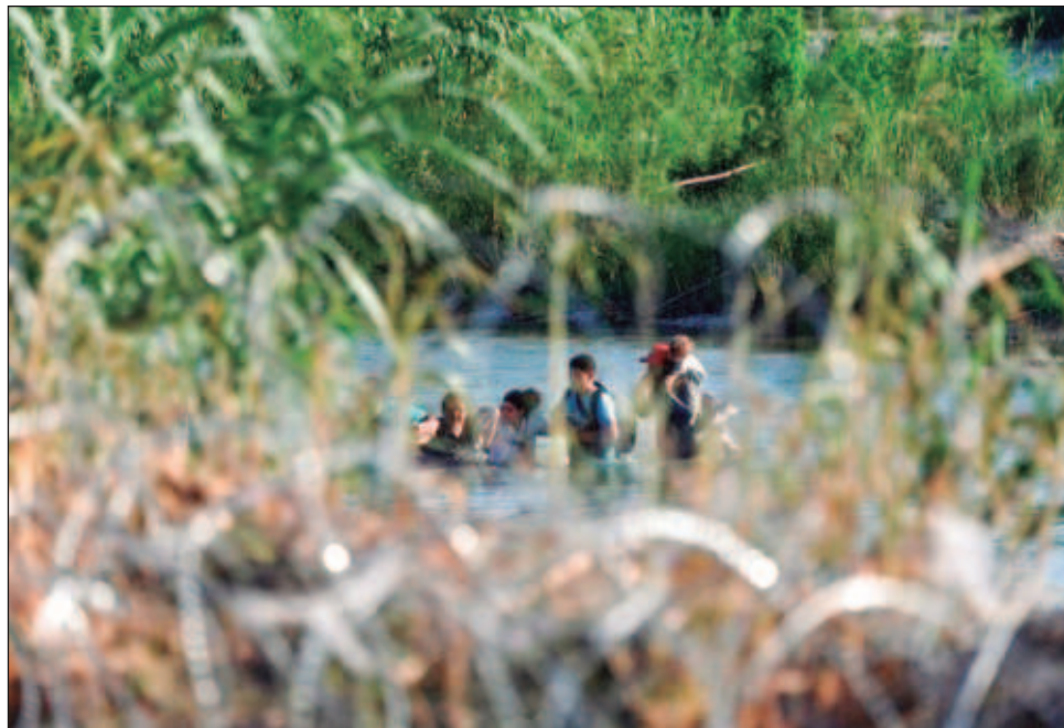
▲ La información fue dada a conocer luego de que un policía del Departamento de Seguridad Pública enviara un correo electrónico al portal de noticias Houston Chronicle , en donde solicitó una serie de cambios de política rigurosos para mejorar la protección de los migrantes.

De acuerdo con la publicación, en el mensaje, que envió un policía a un superior, sugiere que Texas ha colocado "trampas" de barriles envueltos en alambre de púas en partes del río con mucha agua y poca visibilidad.