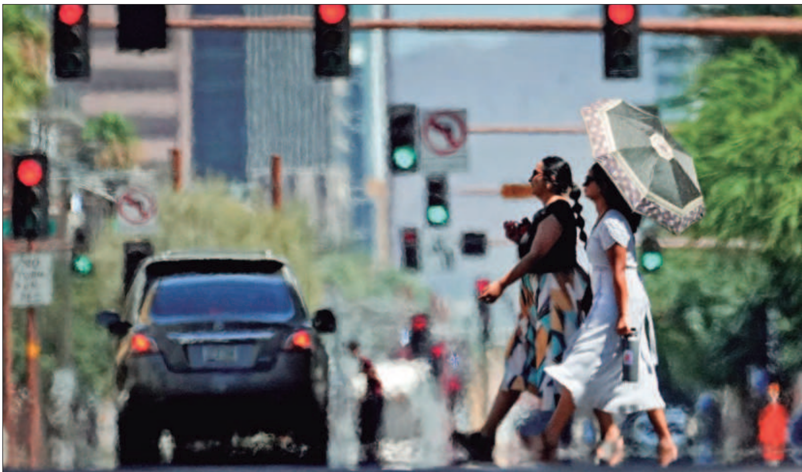
▲ "Y es con la irrupción de esta canícula con la que comenzamos a creer, por primera vez, en los meteorólogos, hasta antes sólo un poco más dignos de credibilidad que lectores de cartas o de entrañas de peces. Esta ola, que aún comienza, será peor que la que acabamos de sobrevivir".