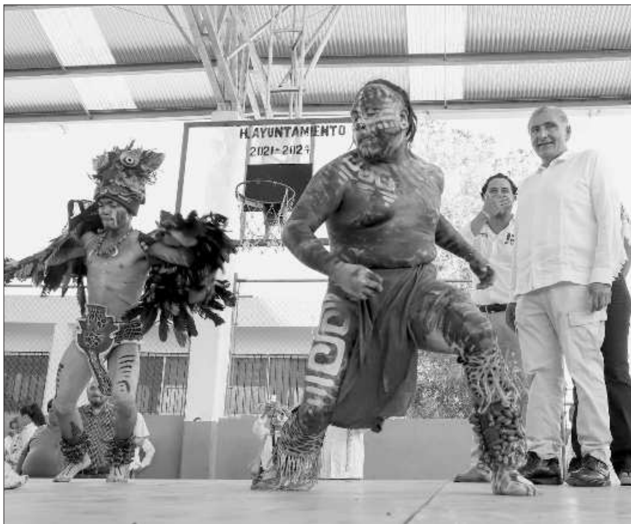
▲ El ex secretario de Gobernación aseguró que a la entidad le espera "mucho apoyo y progreso".