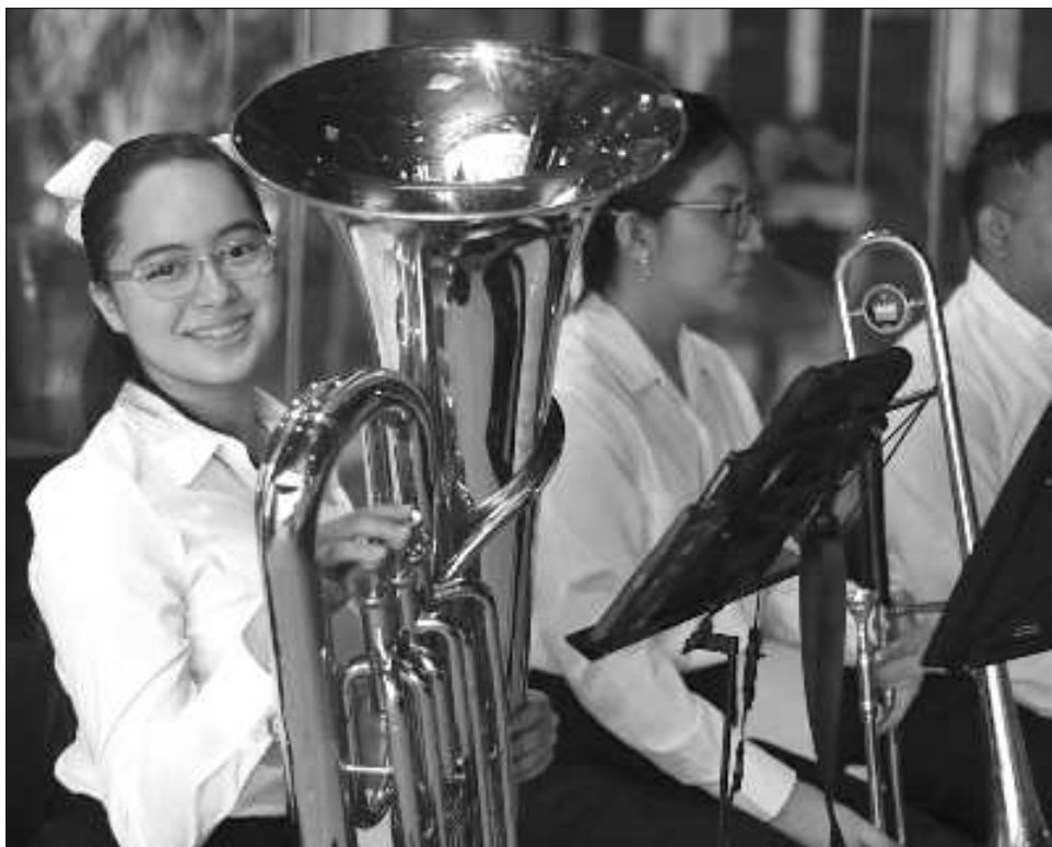
▲ Los jóvenes músicos son parte del proyecto Ko'one'ex Paax, que fomenta la creación de agrupaciones comunitarias formadas por infantes y adolescentes de entre 6 y 18 años de edad.

"Es una experiencia muy padre. Es la tercera vez que la tengo, de hecho con esta agrupación es la tercera vez, primero en el Peón Contreras, luego en línea debido a la pandemia y ahorita estamos re-