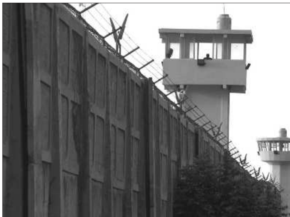
▲ De acuerdo con el Cnsipee-F el total de personas ingresadas en los tres estados son: 3 mil 204 en Q. Roo; mil 555 en Yucatán, y mil 76 en Campeche.

Quintana Roo está basado en la ocupación de camas útiles con 131 por ciento; mientras que Campeche está en 58 por ciento y