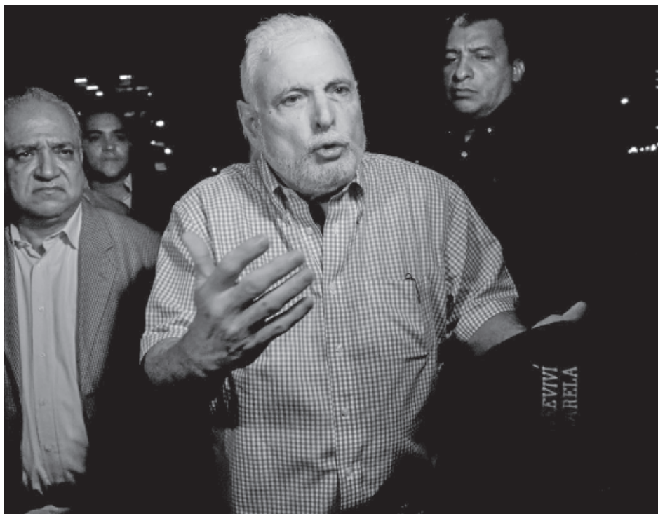
▲ Al ex gobernante de 71 años también se le impuso una multa de 19 millones de dólares en el caso New Business , relacionado con la compra de una editorial de periódicos.

Kim Yo Yong, la poderosa hermana de Kim Jong Un, afirmó el lunes que el despliegue del submarino únicamente "alejara más" a Pyongyang de eventuales diálogos.