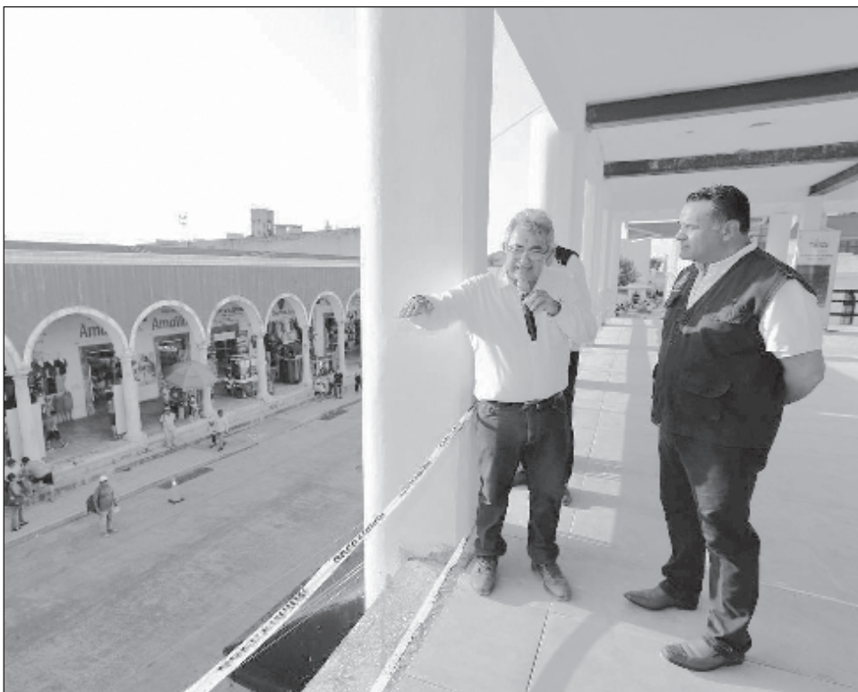
▲ El alcalde Renán Barrera dijo que Mérida se distingue por ser dinámica en materia turística donde "destacan los atractivos arquitectónicos, culturales, gastronómicos y la paz social".

"En el San Benito tenemos un 75 por ciento de avance en los trabajos que iniciaron en diciembre pasado, ahora trabajamos en la limpieza y aseguramiento de las tuberías de drenaje sanitario y pisos en el nivel del estacionamiento, colocación de nuevos domos de acrílico en el techo del mercado", detalló.