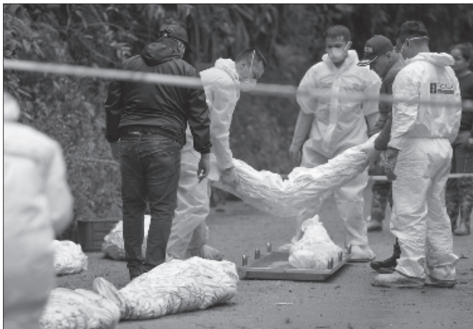
▲ El deslizamiento de lodo y piedras en la carretera que conecta Bogotá con el sureste de Colombia fue ocasionado por las lluvias, arrasando a su paso 20 viviendas.

"No se ha podido cuantificar el número de personas