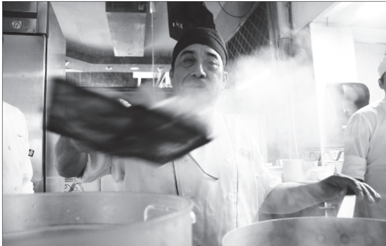
▲ Veracruz, Sinaloa y la Ciudad de México siguen rezagadas en la recuperación de empleo formal, donde la cantidad de trabajadores afiliados al IMSS es hasta dos por ciento inferior a la registrada antes de la crisis.

La población ocupada por estado, comparado el primer trimestre de 2020 con el mismo periodo de 2023,