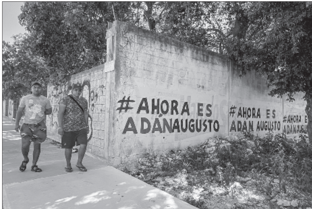
▲ “Cuando escuchamos acerca de lo que van haciendo las corcholatas, nos entretenemos en pensar si #EsClaudia, o si Estamos Augusto, o si la experiencia de Ebrard podrá convencer hacia el final del camino”.

La coalición Frankenstein (ese Va por México , que con órganos y miembros del depósito de cadáveres intenta crear un nuevo ser viviente), temiendo que Morena les toma una delantera amenazadora, han inventado un pretendido método de selección de “coordinador”, que también se espera convertir en candidato, método que parece que no convence a muchos, pero con el que algunos juegan, y nos tienen entretenidos pensando si el Creel reencarnado en la furibundez estridente, o Xóchitl en bicicleta, o el delfín de Miguel de la Madrid,