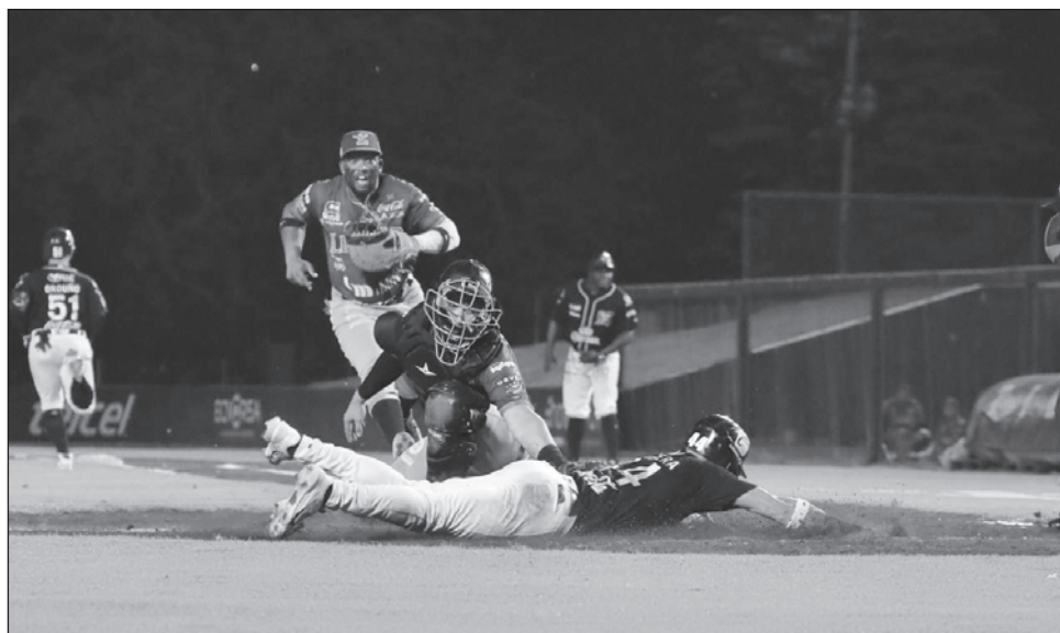
▲ Los Tigres vencieron a los melenudos, 3-2 en 11 entradas, anoche en Cancún.