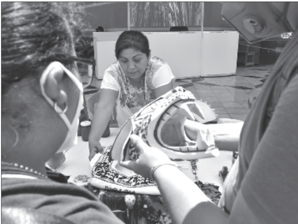
▲ La Secretaría de las Mujeres del gobierno del estado lanzó una convocatoria para que las interesadas se inscriban y puedan obtener uno de los 40 lugares disponibles. La Cuarta Feria de Mujeres Emprendedoras se realizará del 10 al 13

de agosto y las participantes serán notificadas cuando finalice la convocatoria, que está abierta hasta el 30 de julio. Se deberá llenar un formulario, disponible en su sitio web, donde se ofrecen dos oportunidades de participar.