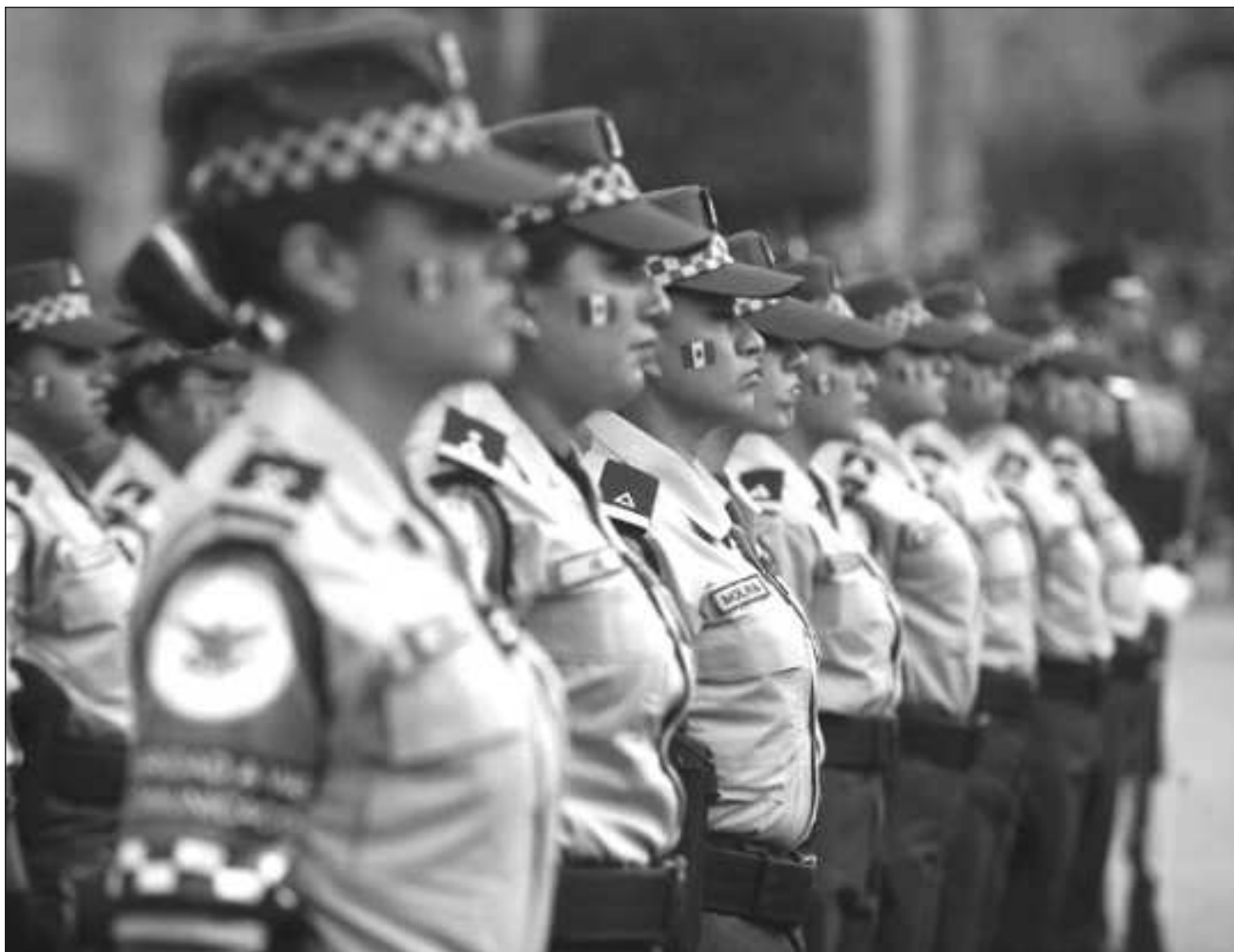
▲ Ante pregunta al respecto durante la conferencia de prensa diaria, el mandatario respondió: “Veo a Claudia (Sheinbaum) muy fuerte, pero además (las fuerzas armadas) son muy leales, disciplinados, tanto en la Marina como en la Defensa”.