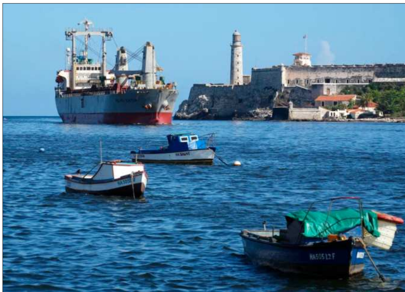
▲ Es el quinto envío de ayuda humanitaria desde México hacia la isla comunista desde febrero de este año.

“La voluntad de la presidenta de México (Claudia Sheinbaum) ha sido ayuda rápida para apoyar con alimentos y algunos productos de aseo personal”, explicó Díaz.