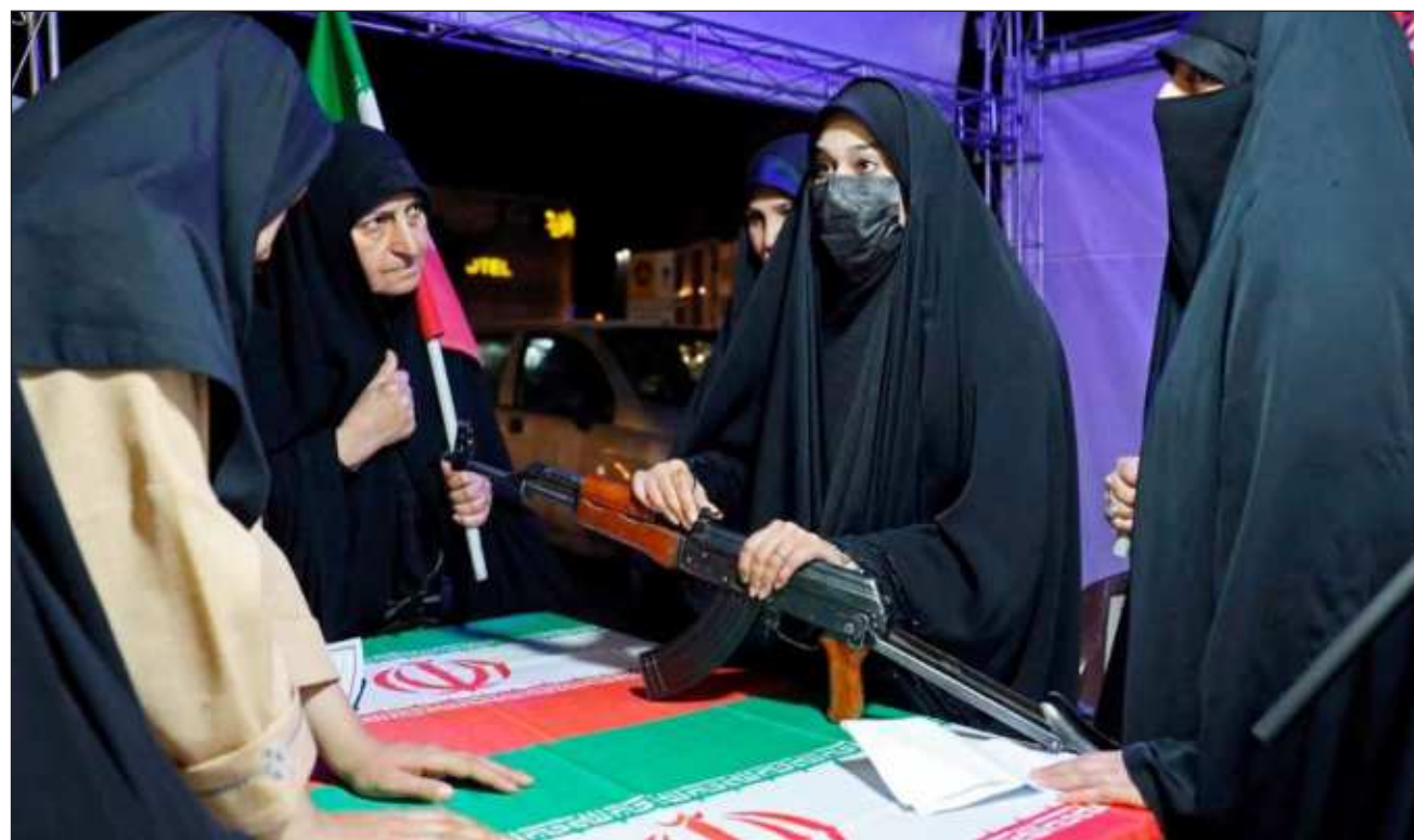
▲ Washington y Teherán se han intercambiado propuestas de acuerdo para terminar con el conflicto mediante Pakistán.

"Como anunciamos ayer (domingo), nuestras preocupaciones fueron transmiti-