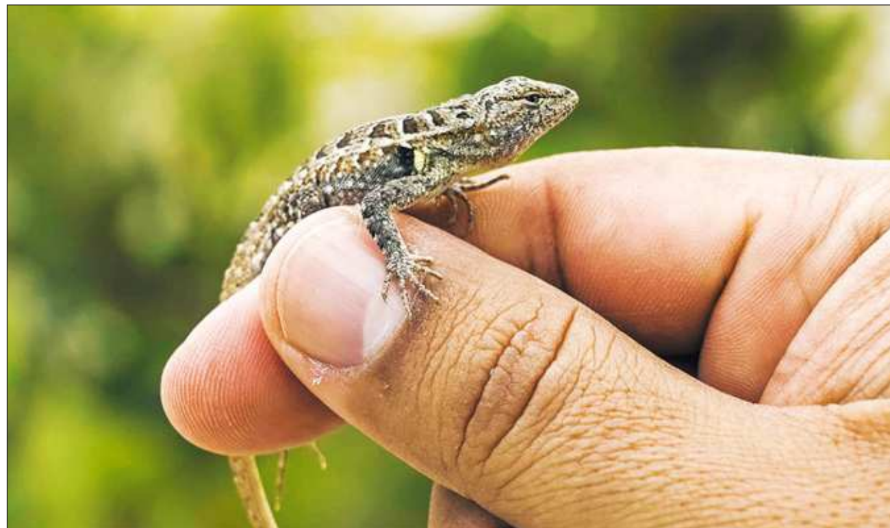
▲ La desaparición de esta lagartija implicaría no sólo la pérdida de una forma de vida, sino de linajes evolutivos irrepetibles.

Las lagartijas costeras están adaptadas para vivir en ambientes cálidos. Para alimentarse, moverse o reproducirse necesitan entornos de entre 30 y 40 grados. Modelos