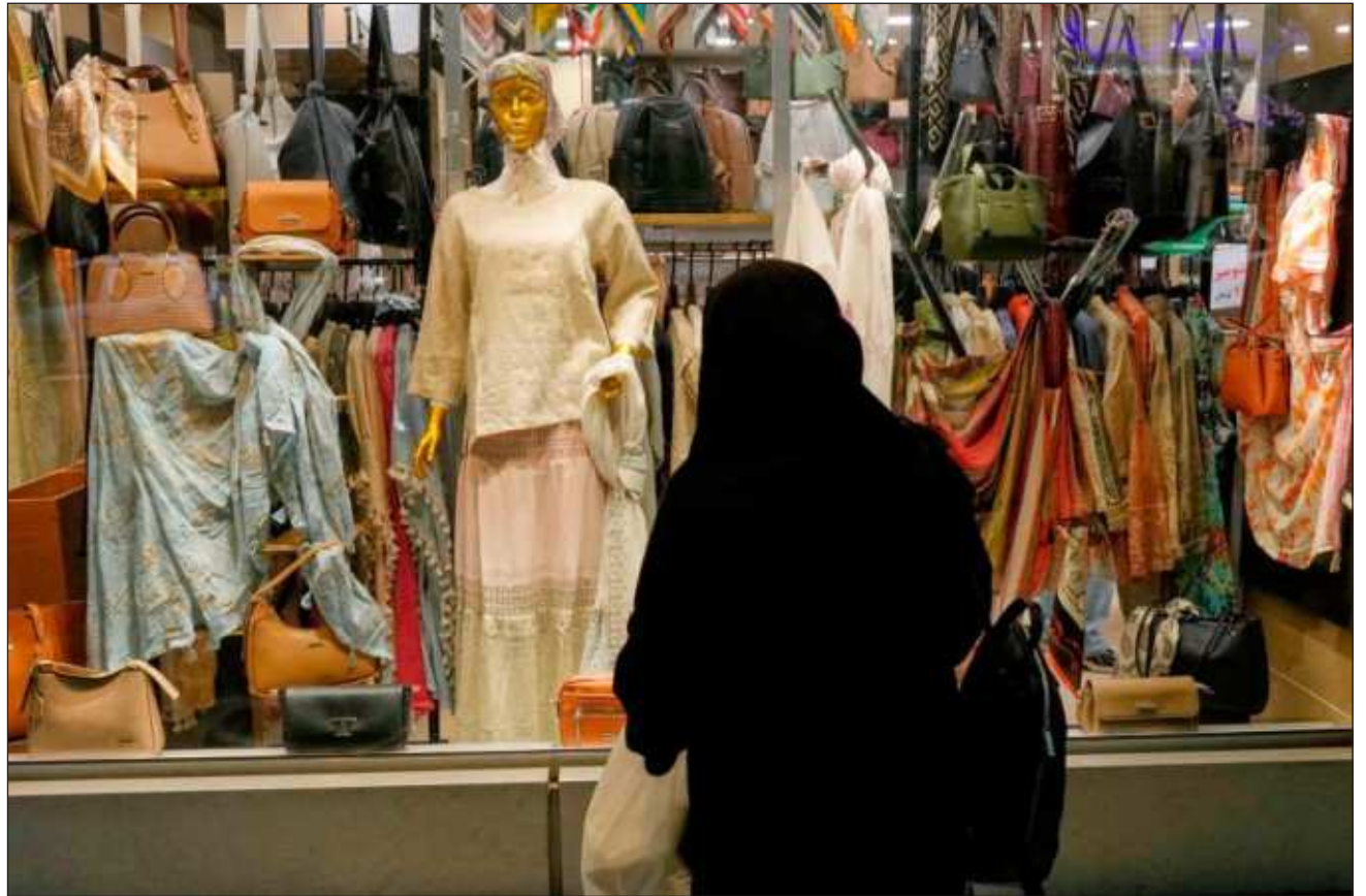
▲ Al menos 279 empresas han citado la guerra como motivo para adoptar medidas y mitigar el impacto financiero.

Al menos 279 empresas han citado la guerra como motivo para adoptar medidas defensivas destinadas a mitigar el impacto financiero, entre ellas subidas de precios y recortes de producción, según muestra el análisis. Otras han suspendido los dividendos o las recompras de acciones, han despedido temporalmente a personal, han añadido recargos por combustible o han solicitado ayuda gubernamental de emergencia.