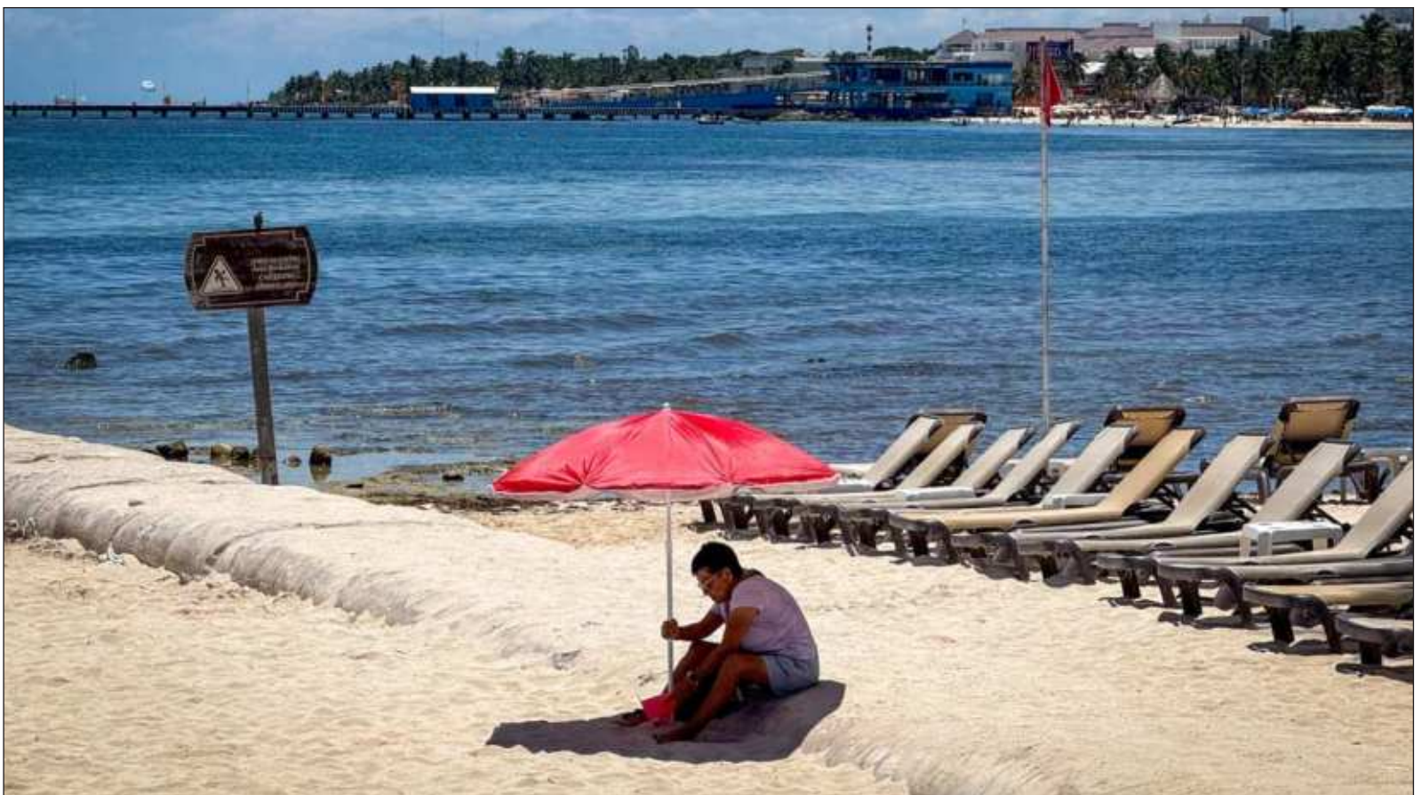
▲ “Normalmente en nuestro país experimentamos El Niño con veranos secos y cálidos, en el invierno hay lluvias en el norte”.