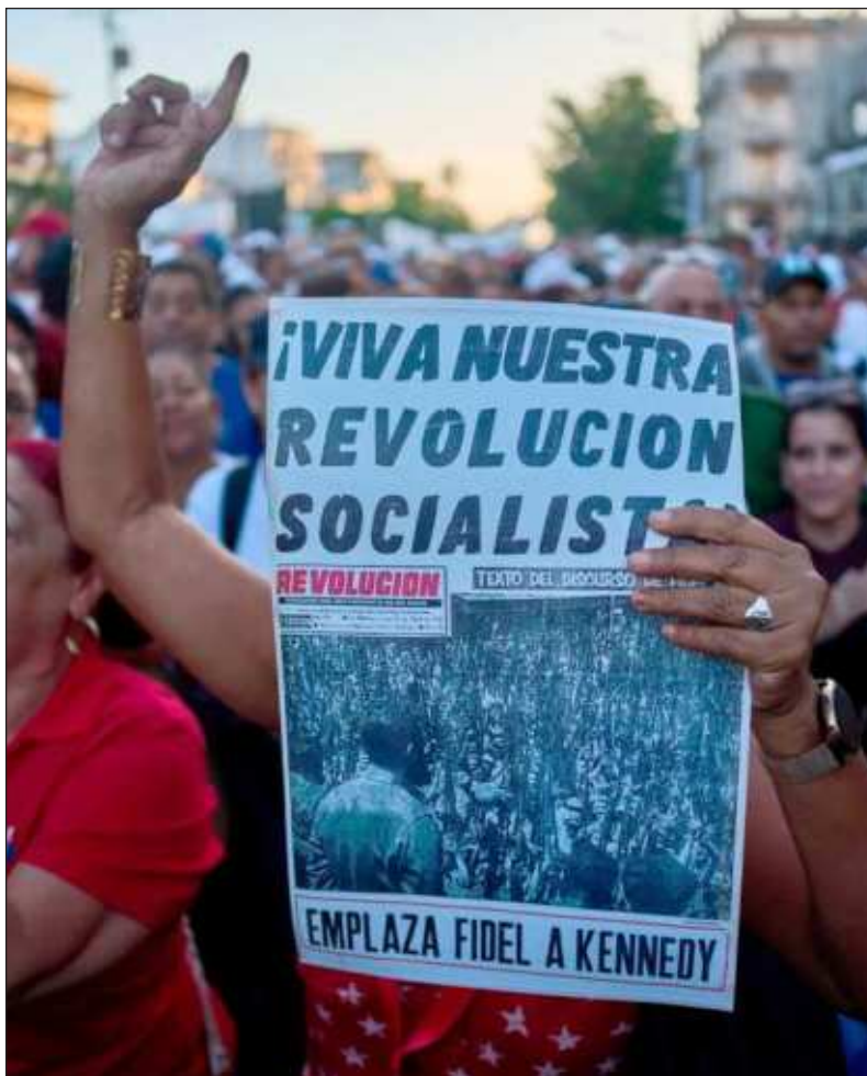
▲ "La narrativa imperialista ha buscado crear una imagen distorsionada de la realidad cubana (...) con mentiras relacionadas a los derechos humanos".