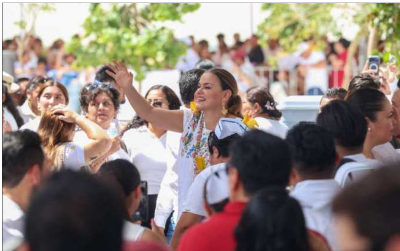
▲ La alcaldesa recordó que el ayuntamiento sólo se encarga del servicio hídrico en las comisarías.

Aunque celebró la inversión, destinada principalmente para mejorar el servi-