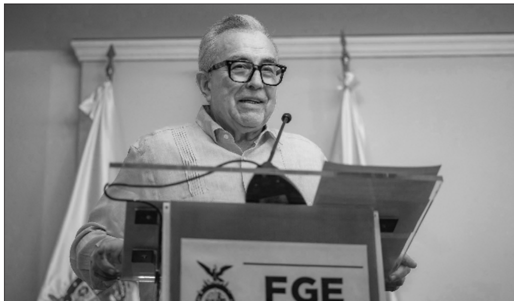
▲ Con el mero anuncio del congelamiento de cuentas, ya han saltado quienes claman por la extradición de Rocha Moya, sin considerar que la incautación no es definitiva.

Ahora, en cuanto a criterios numéricos y por lo tanto medibles, la colaboración entre Estados Unidos y México ha rendido muy buenos frutos en lo que refiere al combate al crimen organizado y el tráfico de enervantes. La coordinación es deseable y también que, cuando sea necesario, la extradición sea un mecanismo claro y su justificación sea técnicamente legal y no políticamente necesaria, como parece ser también en el caso de Sinaloa.