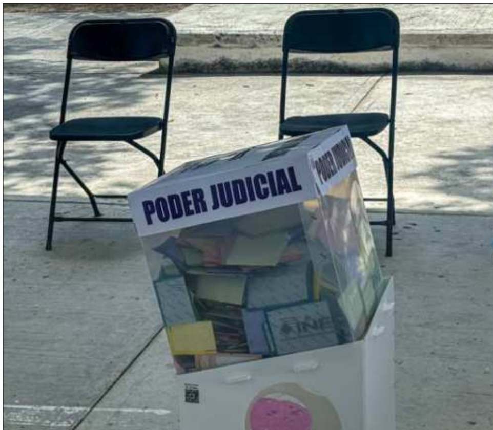
▲ Una vez que el pleno apruebe la reforma, se enviará de inmediato al Senado.

Conforme al calendario que ya comenzó a circular entre los diputados, una