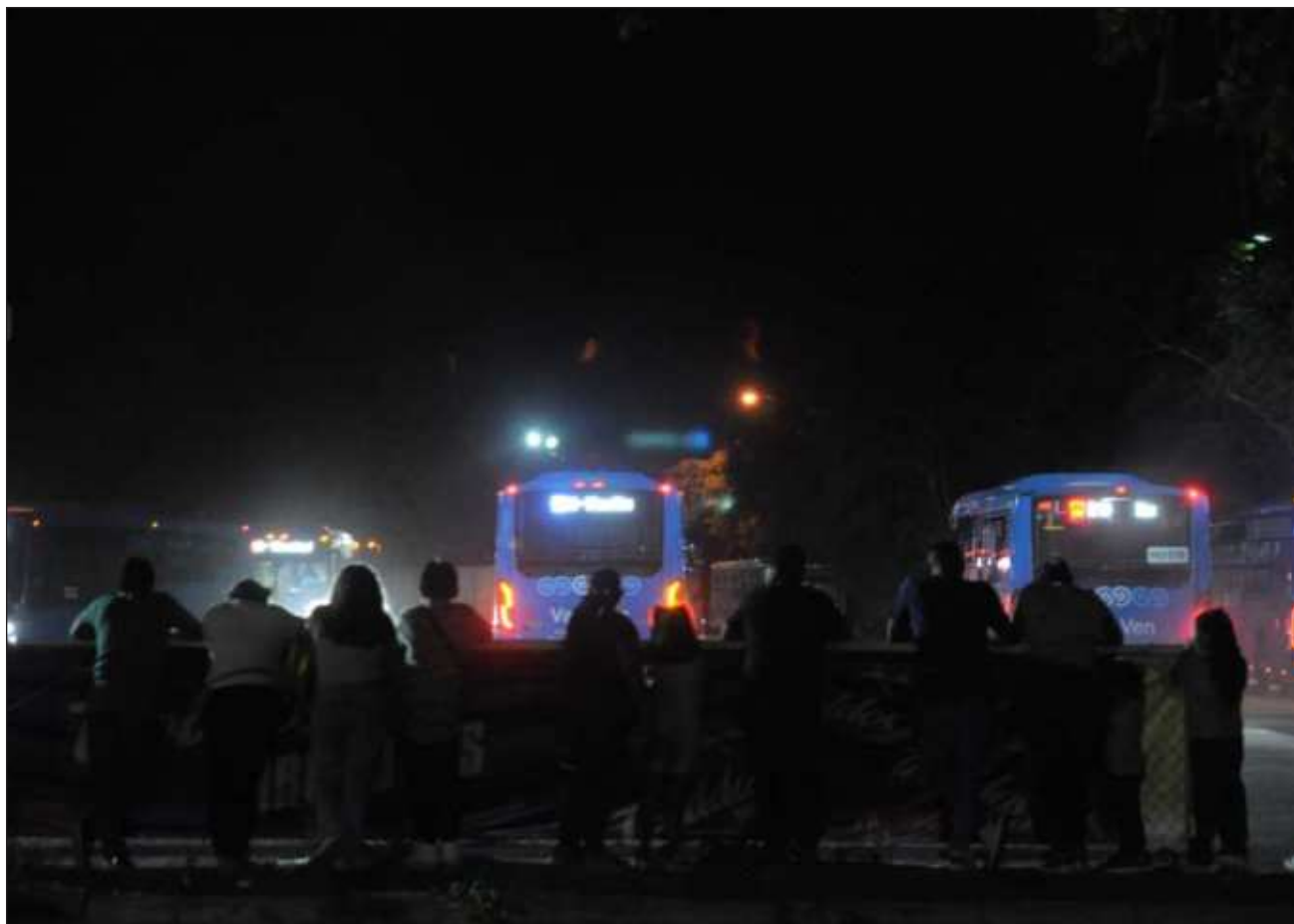
▲ Las modificaciones a la Ley de Transporte –planteadas por el mandatario estatal– atenderán las deficiencias de todo el sistema, incluidos los taxistas, y el servicio será sostenible, digno, accesible, eficiente y humano, aseguraron legisladores morenistas.

“Esta reforma corrige ese modelo jurídico y financiado que nos han heredado, porque hay que terminar con prácticas hechas para beneficiar a unos cuantos mientras se hipoteca el futuro del transporte público de nuestro estado”.