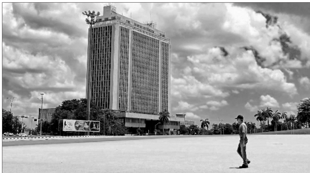
▲ El gobierno del país caribeño ha denunciado una campaña de presión económica y política contra la isla.

nicaciones y el presidente de la Asamblea Nacional forman parte de los funcionarios cubanos sancionados de la Oficina de Control de Bienes Extran-