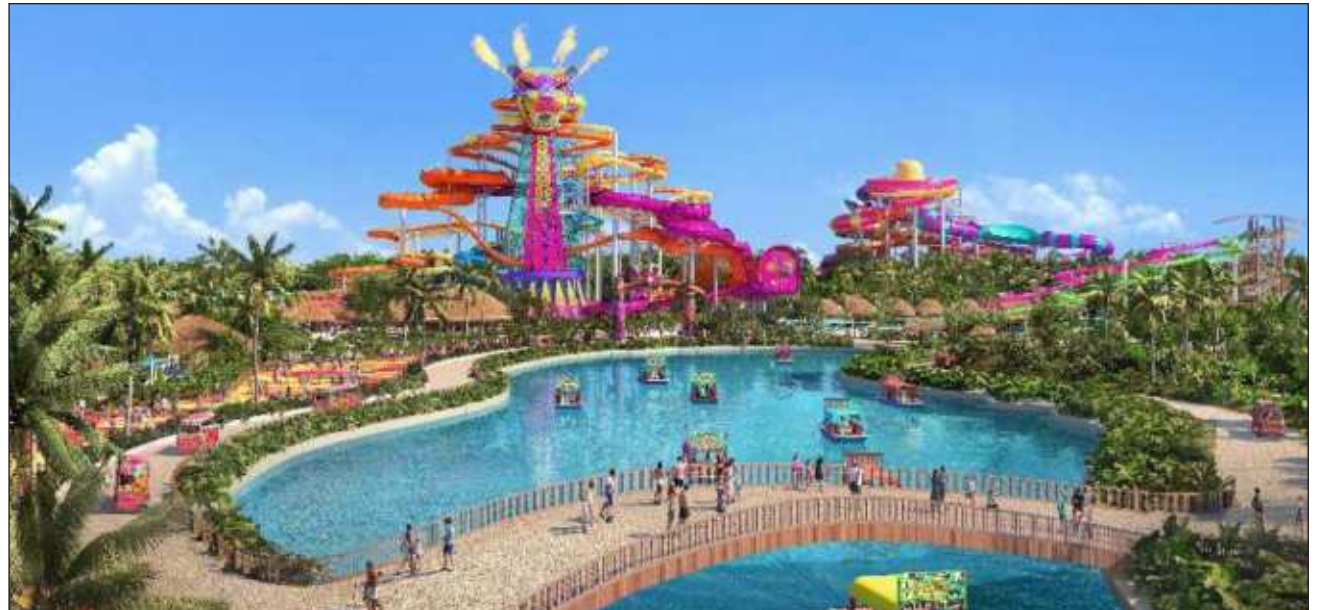
▲ La semana pasada la organización ecologista Greenpeace desplegó una manta en el palacio de Bellas Artes, en la Ciudad de México, en protesta contra el proyecto, denominado Perfect Day .

proyecto de una empresa, Royal Caribbean, que tiene planeado hacer en el sur de Quintana Roo. Ha habido muchas protestas y muchas personas que están en contra, es un