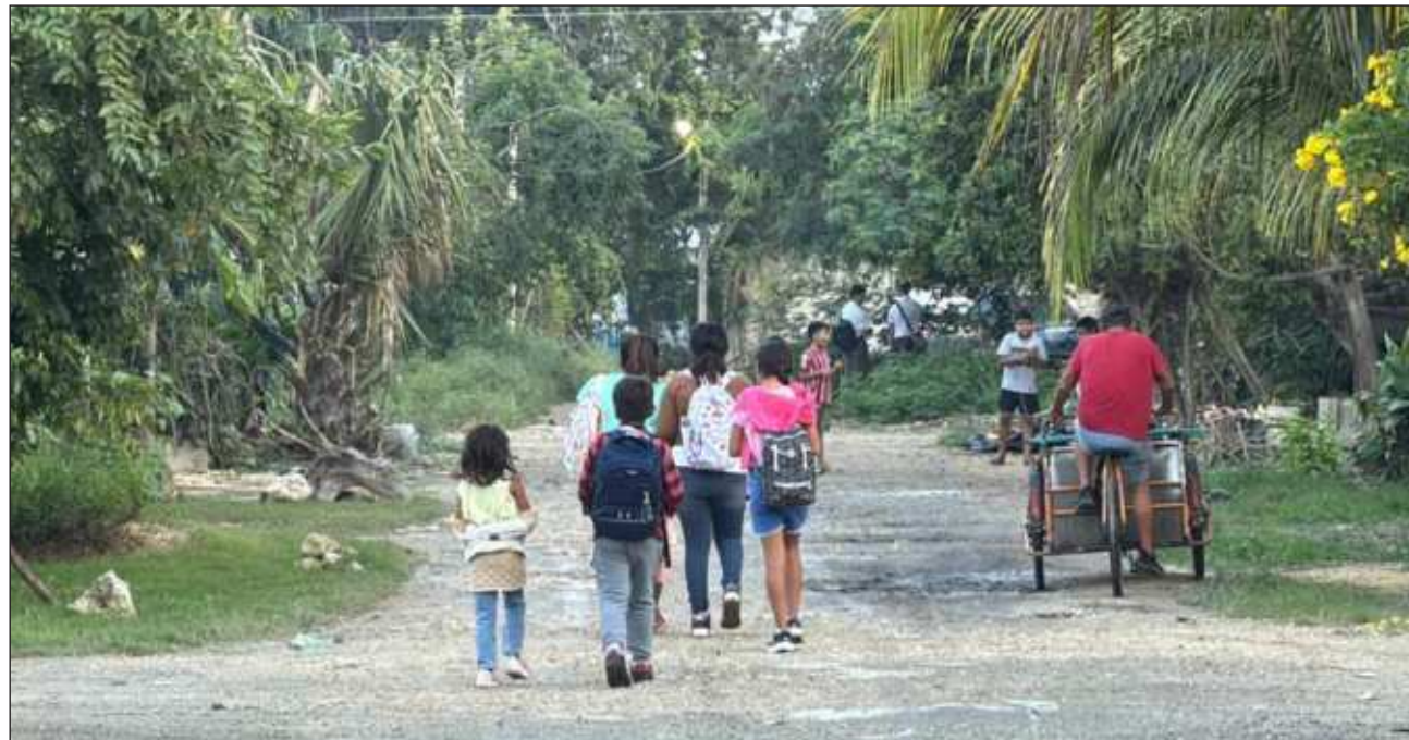
▲ El proyecto no sólo contempla la creación de nuevas rutas, sino también la coordinación con autoridades y organismos para mejorar las condiciones urbanas de estas zonas, especialmente vialidades y servicios.