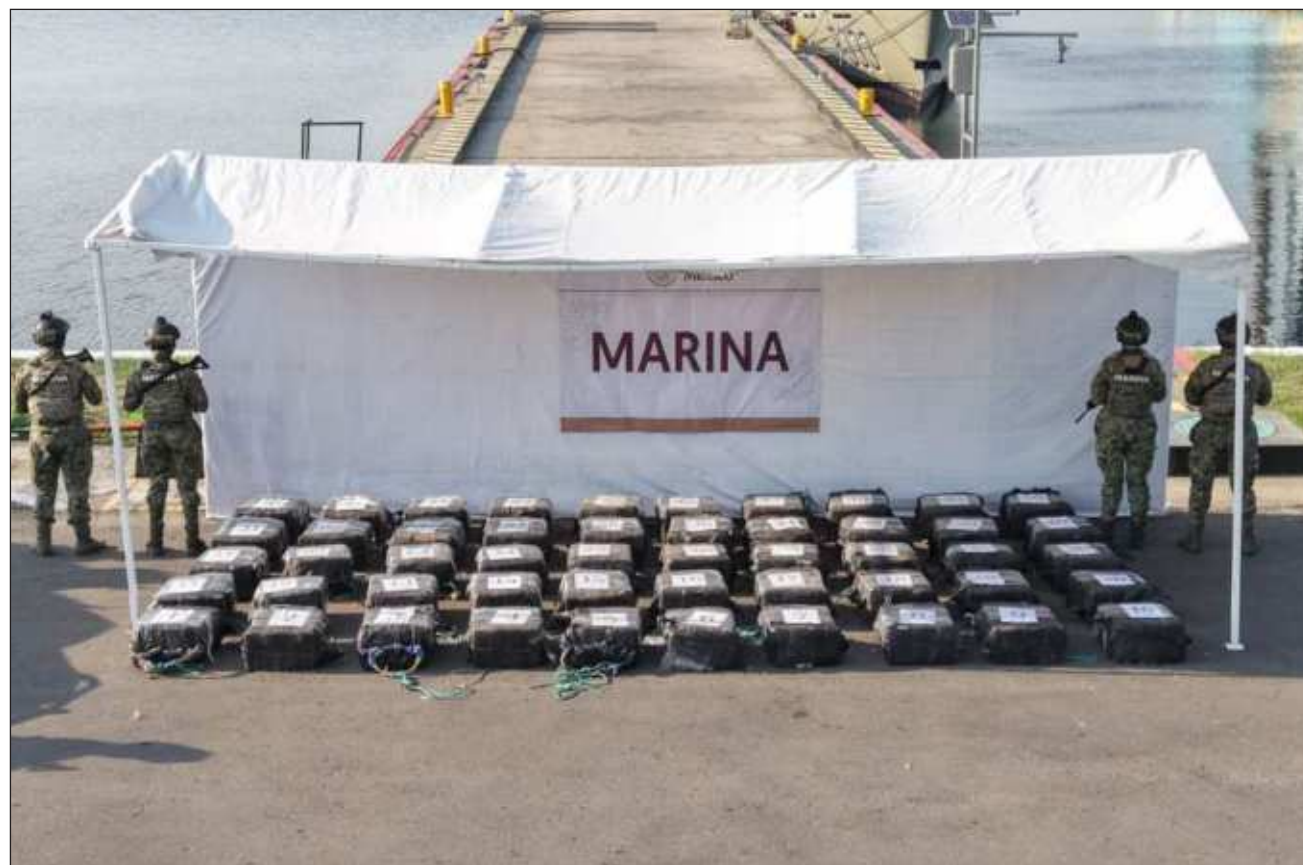
▲ La droga y la embarcación decomisados fueron puestas a disposición de las autoridades.

En el marco de la Estrategia Nacional de Seguridad y derivado de labores de vigilancia marítima y aérea de personal naval, en aguas del Pacífico mexicano, se detectaron y recuperaron 50 bultos negros, con 32 paquetes cada uno, que contenían una sustancia con