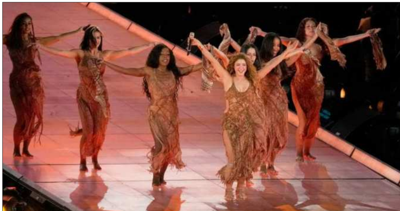
▲ El caso se circunscribe a una cantidad de algo más de 55 millones de euros reclamados a la cantante.

“Nunca hubo fraude, y la propia Administración nunca pudo demostrar lo contrario, sencillamente, porque no era cierto”, ha manifestado