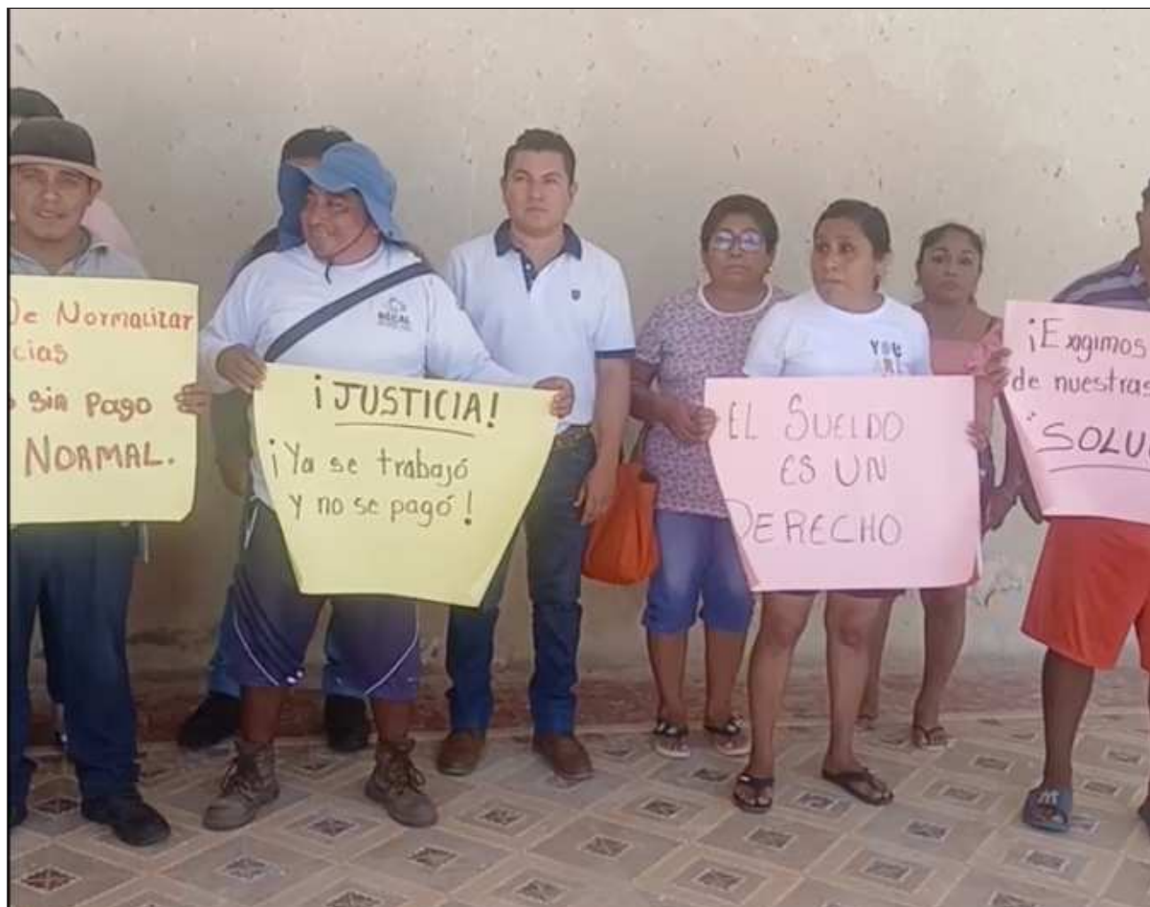
▲ En la junta municipal Bécál los reclamos no se han hecho esperar debido a que hay sobre nómina. Foto captura de pantalla

"Pues llegan a las casas y no hay ninguna pastilla para una persona que tenga un padecimiento grave; ¿cómo se va a enfrentar, si no tenemos las condiciones en los hospitales ni médicas para poder enfrentarlo?", expuso.