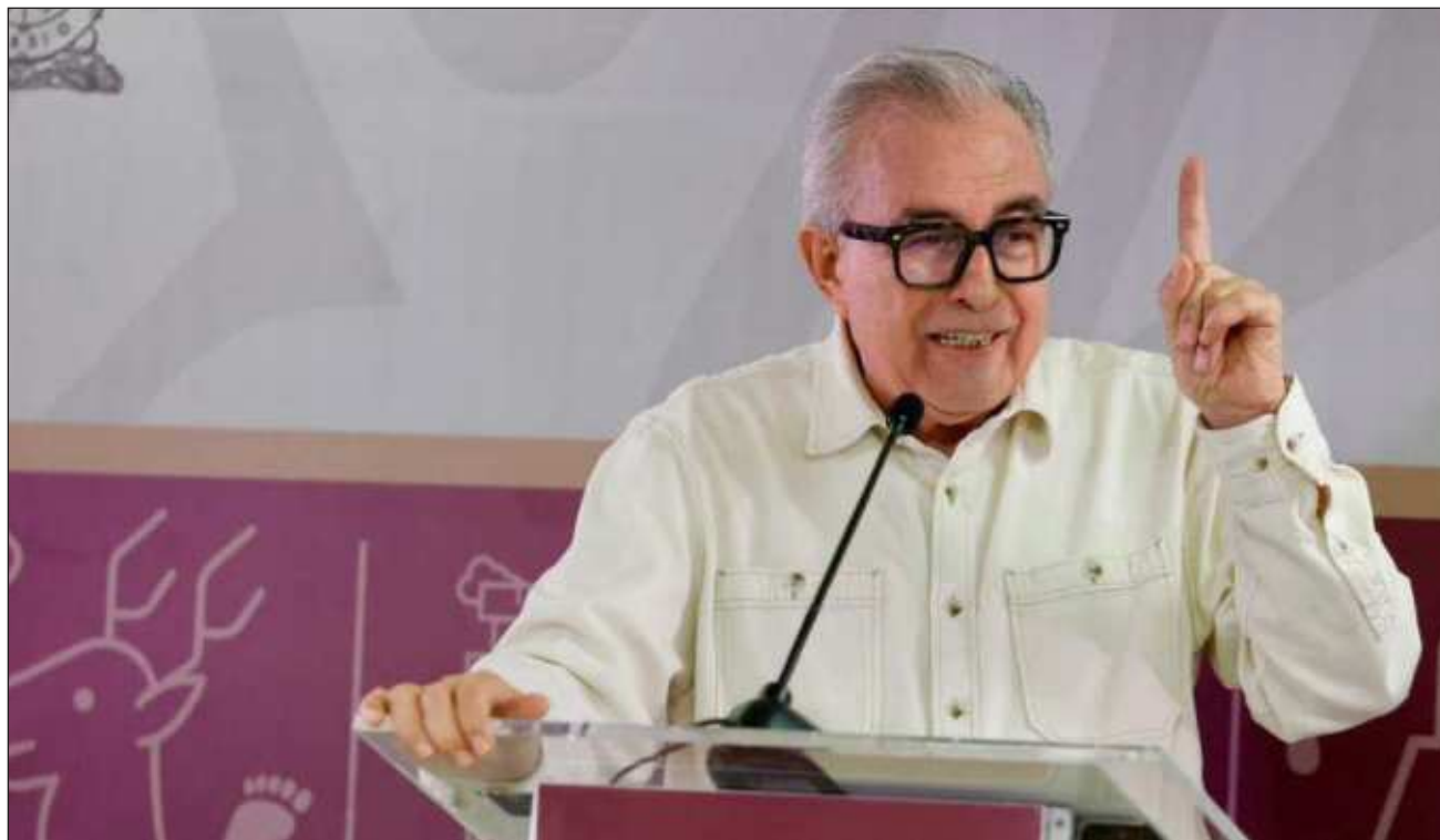
▲ La UIF confirmó a través de un comunicado las medidas aplicadas contra Rubén Rocha.

Sin embargo, precisó que no existe una investigación por parte de la UIF, sino que, debido a la relación de los bancos mexicanos con entidades financieras estadounidenses, el congelamiento se efectuó de manera preventiva.