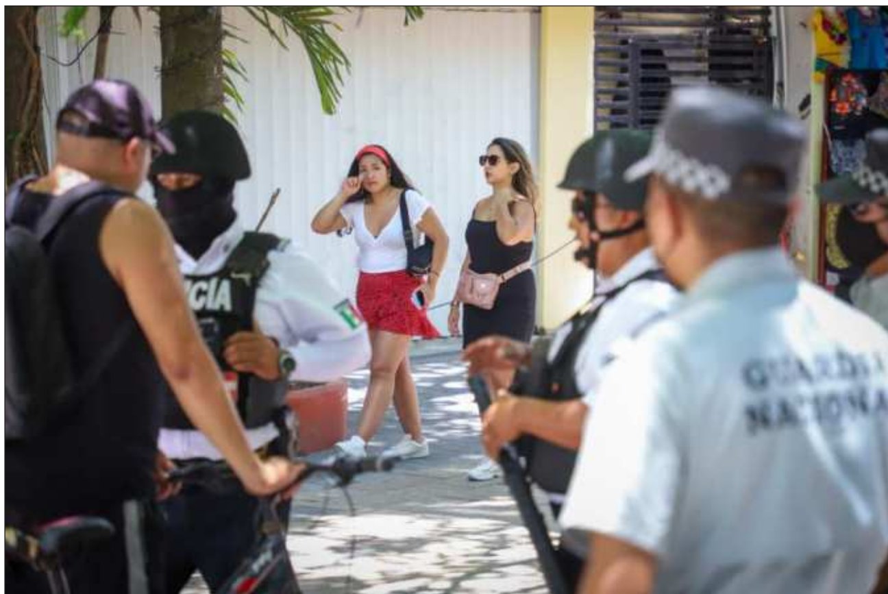
▲ Eventos masivos permiten que depredadores “se cuelen” y aprovechen la vulnerabilidad de las niñas.

La organización trabaja con empresas ubicadas en ciudades sede y zonas turísticas