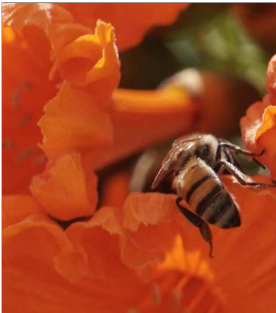
▲ El programa contempla visitas guiadas a la exposición de abejas melíponas para estudiantes de nivel básico y medio superior, ponencias, presentaciones de danza y espectáculos musicales.

El reto culinario premiará los tres mejores postres elaborados principalmente con miel. El primer lugar recibirá cinco mil pesos, el segundo tres mil y el tercero dos mil pesos.