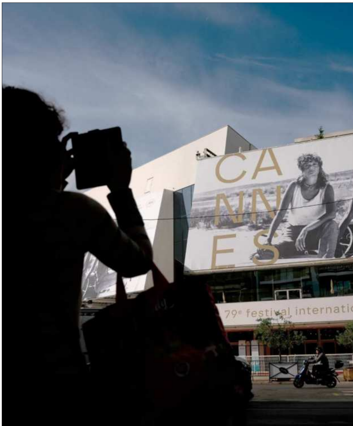
▲ "Cannes siempre ha sido eso: un lugar donde la gente viene a observar y ser observada. Ciudad coleccionista de imágenes luminosas de personas que avanzan una junto a otra sin tocarse completamente".

Como aquella ocasión en la que Akira Kurosawa caminó bajo la lluvia por la Croisette com-