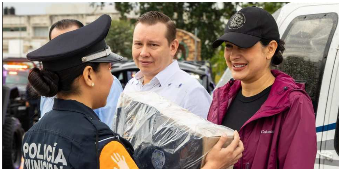
▲ Las cámaras permitirán monitorear en tiempo real su desempeño operativo, fortalecer la transparencia y garantizar la rendición de cuentas en la actuación policial, destacó la edil durante el acto.

Estos dispositivos cuentan con visión nocturna de 360 grados y almacenamiento en