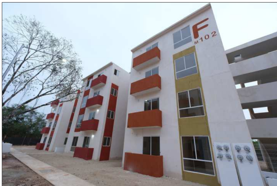
▲ En enlace con la presidenta Sheinbaum, se detalló que las viviendas cuentan con todos los servicios básicos y están cerca de escuelas y centros de salud.

El enlace se realizó un día antes de la visita de la presidenta de México a Cancún, donde inaugurará la 89 Convención Bancaria y se reunirá con el presidente alemán. La mandataria pernoctará en este polo turístico y el viernes 20 encabezará la conferencia mañanera desde ahí mismo; posteriormente visitará la obra del puente Nichupté y viajará a Felipe Carrillo Puerto. Allí se dará por primera vez un certificado de turismo comunitario.