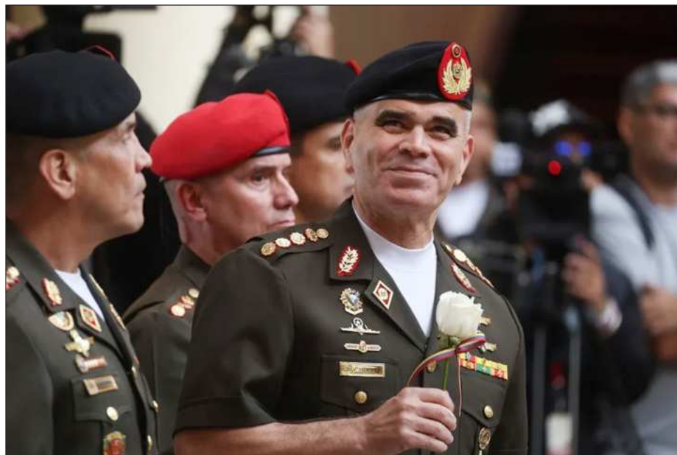
▲ Padrino es el militar activo más antiguo de Venezuela y una figura muy respetada en el país.

Durante una fracción del primero, ocupó también el Ministerio de Relaciones Interiores (2015-2016) sin dejar de dirigir personalmente la inteligencia. Desde noviembre de 2024, González López