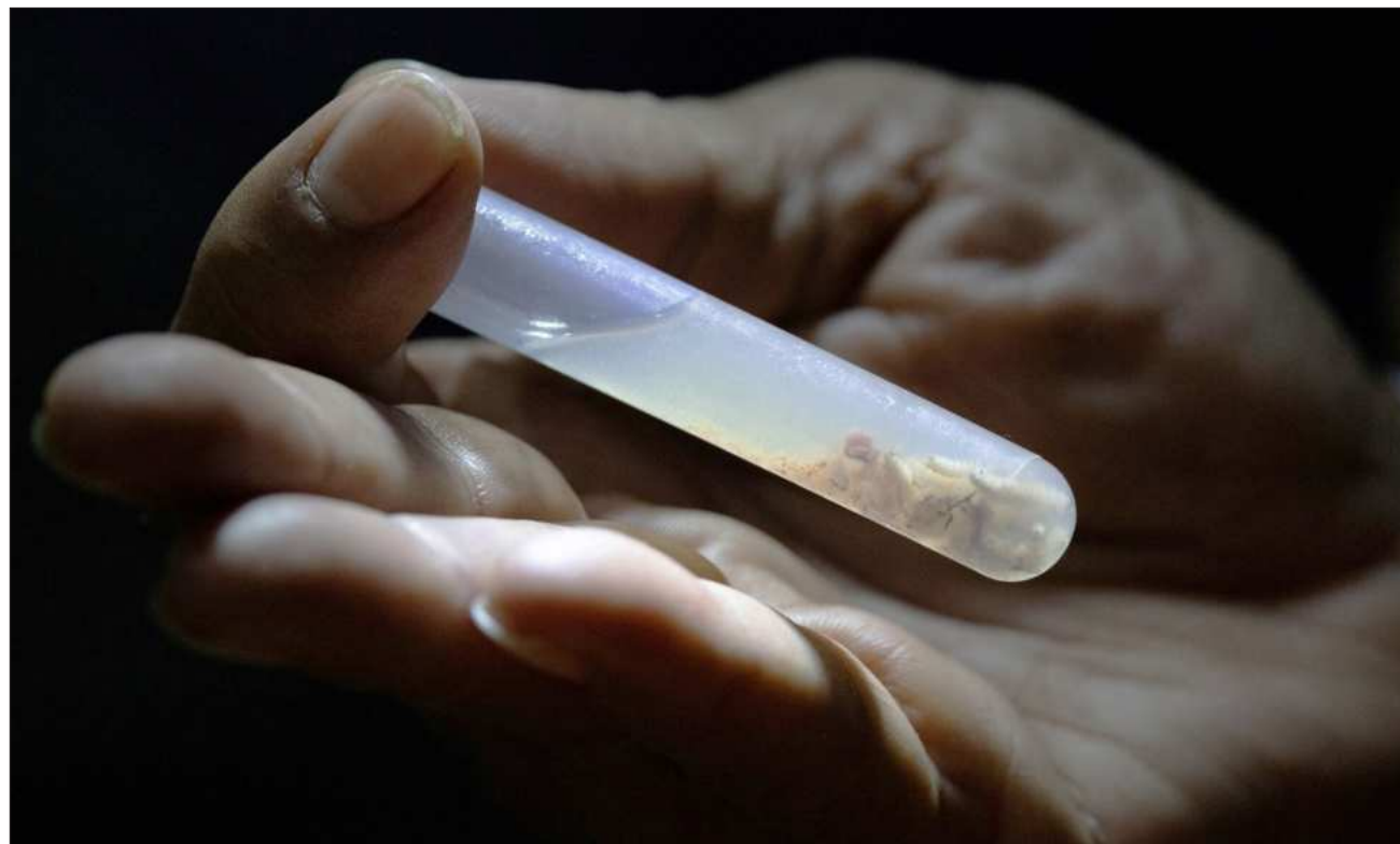
▲ El ayuntamiento de Candelaria reafirmó su compromiso de trabajar de manera coordinada con las diferentes instancias para salvaguardar la salud del hato ganadero, y proteger el desarrollo del sector pecuario.

El H. Ayuntamiento de Candelaria reafirmó su compromiso de trabajar de manera coordinada con las diferentes instancias para salvaguardar la salud