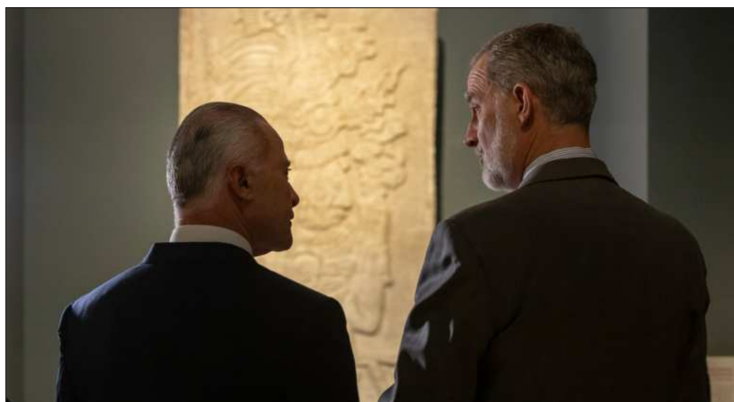
▲ El gran pendiente es resolver a quién iban dirigidas las palabras de Felipe VI.

En cuanto a la Historia, aunque muchos se han esforzado en borrarla, siempre será necesario volver a ella también en busca de momentos que han sido de construcción y de la colaboración entre sujetos de diferentes orígenes para materializar el México y la España de hoy. En ambas naciones, la polarización política está llevando a la descalificación mutua; haciendo historia, el peligro es volver a caer en la tentación del autoritarismo.