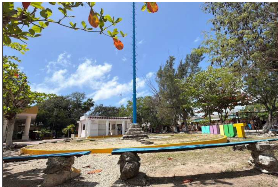
▲ El ritual de los voladores es una ceremonia originaria del Totonacapan, en Veracruz, reconocida por la Unesco como Patrimonio Cultural Inmaterial de la Humanidad.

Explicó que el grupo llevaba aproximadamente