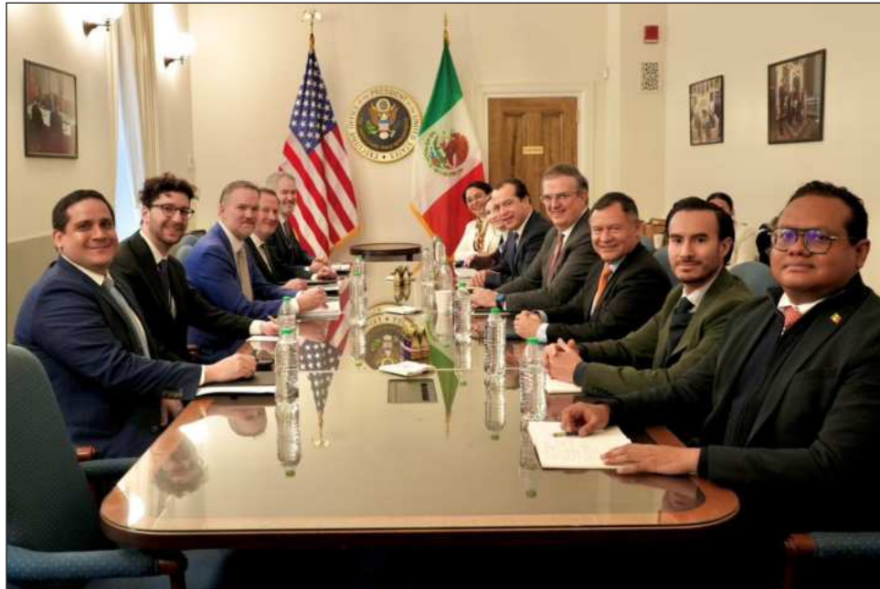
▲ Marcelo Ebrard, secretario de Economía y el equipo técnico mexicano, se reunieron con Jamieson Greer, titular de la Oficina de Representación Comercial de Estados Unidos, para iniciar discusiones respecto al T-MEC, en Washington.

En la primer reunión, realizada en la sede de la USTR, en Washington DC, Marcelo Ebrard Casaubón, titular de la SE, y Jamieson Greer, Representante Comercial de Estados Unidos, instruyeron a los equipos técnicos a examinar opciones específicas para incrementar la producción y el