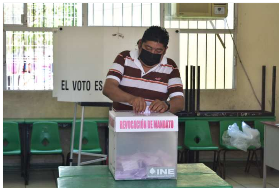
▲ La bancada de Morena acordó avalar la propuesta presidencial unánimemente

“Nosotros creemos que el pueblo pone y el pueblo quita. El pueblo manda, esa es nuestra convicción. Ojalá hubiera habido antes con otros presidentes. Claro, tiene que haber un número suficiente de votos. Relacionado con las consultas populares, es uno de mis compromisos, iba a someterme a revocación de mandato.”