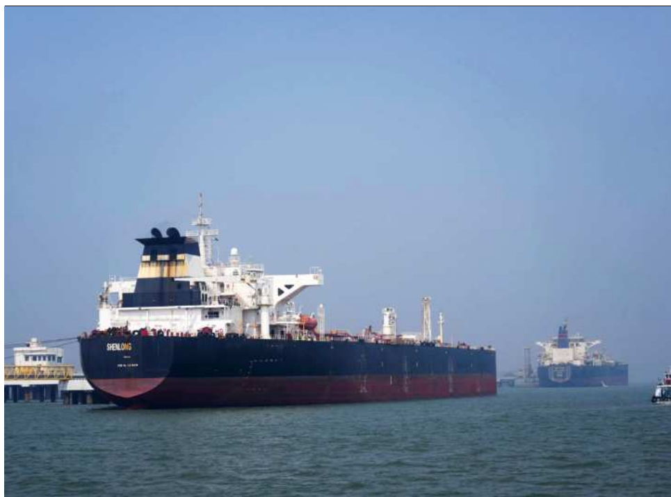
▲ El conflicto ha disparado los precios del petróleo por el cierre del estrecho de Ormuz.

Jatib es el último de una serie de altos funcionarios iraníes abatidos en la guerra, entre ellos el anterior líder supremo Alí Jamenei, muerto el 28 de febrero, el