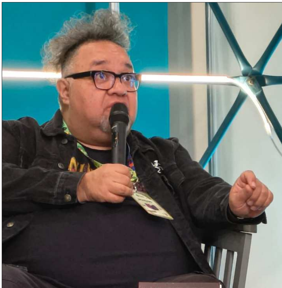
▲ El escritor y artista gráfico se encuentra en Yucatán porque este jueves presenta en el salón Uxmal 4 a las 23 horas El llanto del aire , obra que marca su regreso a la novela.

En la entrevista compartió que antes de comenzar cualquier trabajo de ciencia ficción le gusta realizar una investigación profunda para tener un andamio sólido donde colgar sus historias.