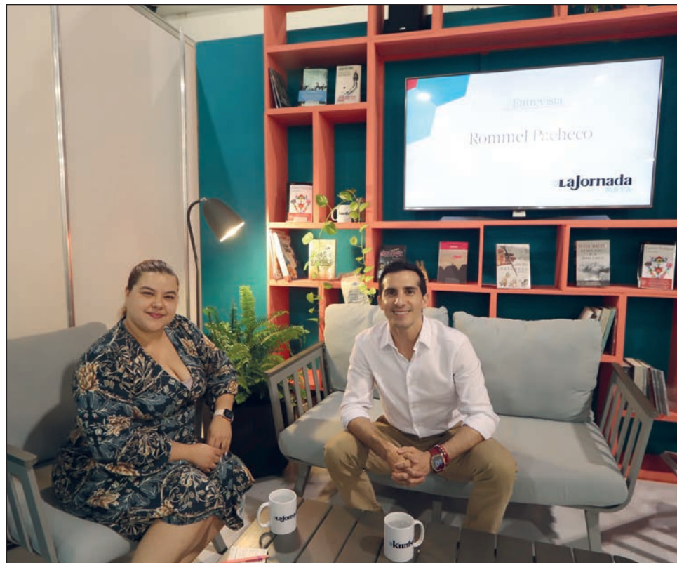
▲ El también diputado federal recordó que en 2015 se celebró en el Complejo Deportivo Kukulcán u, que fue una de las competencias que más disfrutó al encontrarse en casa.

Con entusiasmo, el también diputado federal recordó que en 2015 se celebró en el Complejo Deportivo Kukulcán una serie mundial de clavados, que fue una de las competencias que más disfrutó al encontrarse en casa.