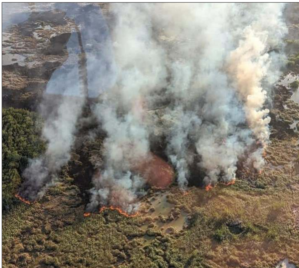
▲ Para atender el incendio, la Secretaría de Marina desplegó un helicóptero con un helibalde que tiene una capacidad para transportar 2 mil 500 litros de agua por cada carga.

Por lo anterior, tras realizar un sobrevuelo de reconocimiento en el área afectada, se dio inicio con el combate al incendio mediante cinco descargas con helibalde en los puntos con mayor afectación, vertiendo un total de 12 mil 500 litros de agua; acciones que continuarán hasta su total extinción, señala la dependencia.