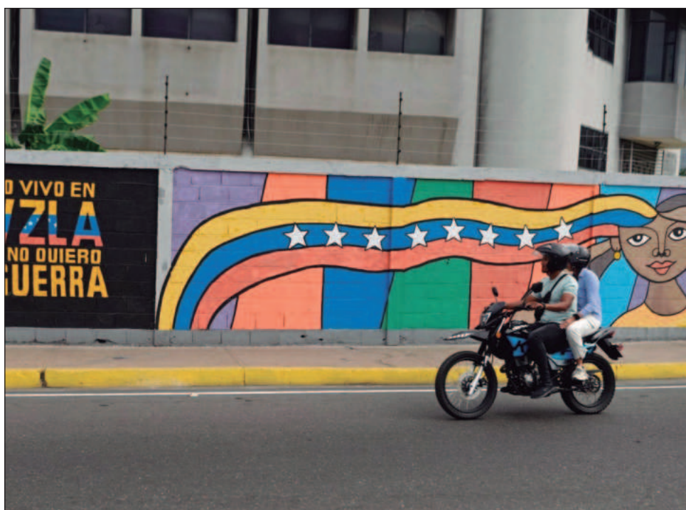
▲ Los firmantes condenan el uso de la fuerza armada y el cerco militar al territorio venezolano, así como las amenazas de intervención armada contra México.

El texto responde al ataque del 3 de enero en Venezuela, donde murieron 100 personas