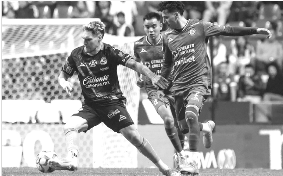
▲ El Cruz Azul venció al Puebla por la mínima en el estadio Cuauhtémoc.

El estratega André Jardine no contó de nueva