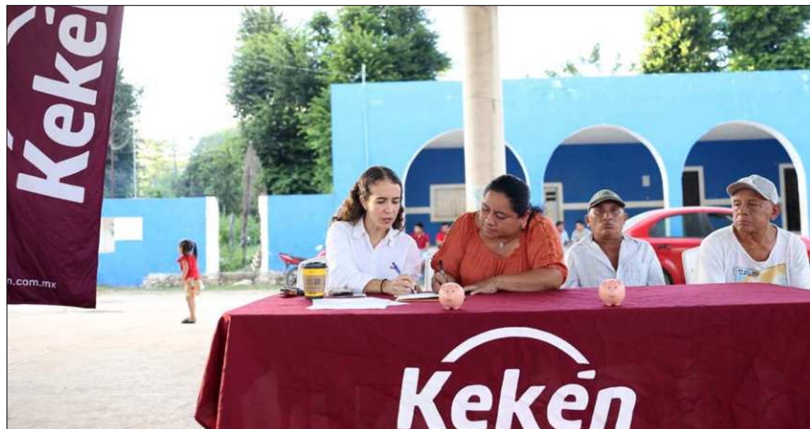
▲ Empresa agroalimentaria y comisaría de Cantamayec renuevan trabajo colaborativo con acciones sociales en la región en beneficio de agricultores, atención a la salud de niños y adultos mayores, entre otras.