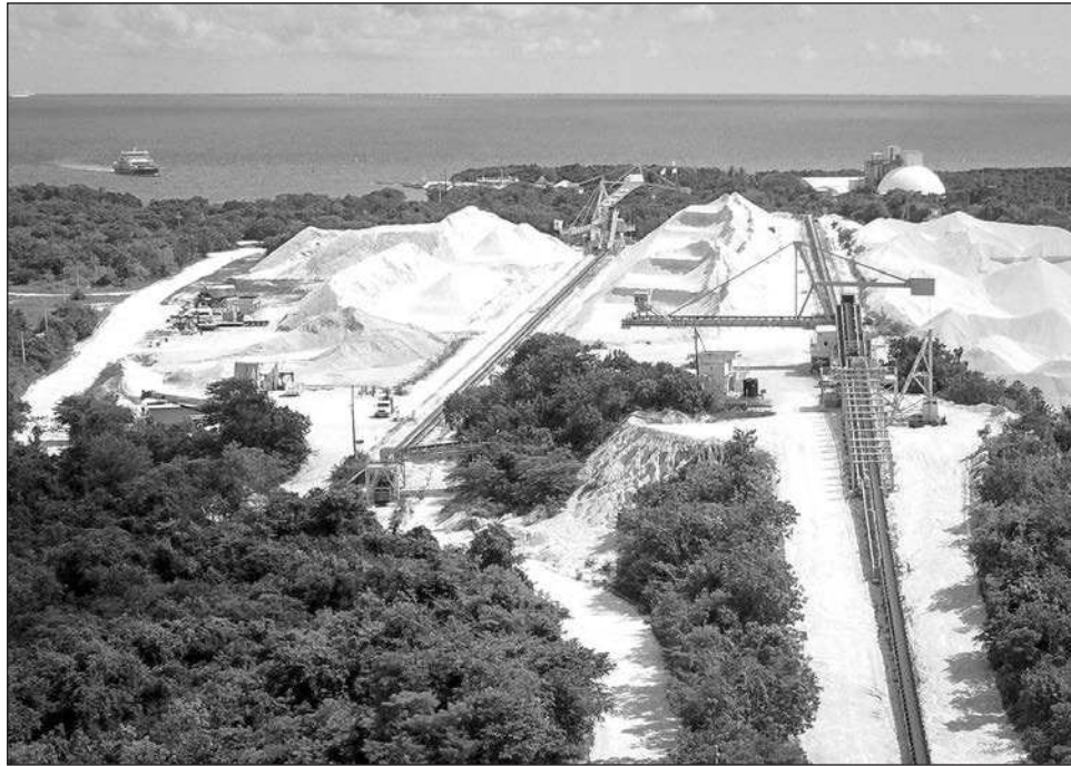
▲ Guajardo advirtió que la fortaleza turística puede verse comprometida si se debilita la confianza de los inversionistas internacionales, como cuando surgen disputas legales de alto perfil.

Al analizar las perspectivas económicas y turísticas del país, en un contexto internacional marcado por la