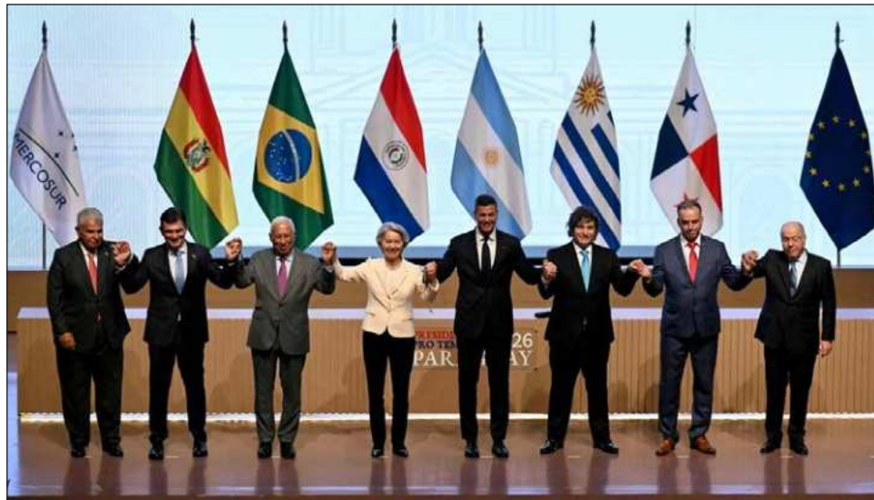
▲ En la ceremonia estuvieron presentes los presidentes de Argentina, Javier Milei; de Uruguay, Yamandú Orsi, y del anfitrión Paraguay, Santiago Peña. También el mandatario de la recién incorporada Bolivia, Rodrigo Paz, y del Estado asociado Panamá, José Raúl Mulino.

“Estamos creando la zona de libre comercio más grande del mundo, un mercado que representa casi 20 por ciento del producto interno bruto (PIB) mundial. Brindando oportunidades incalculables para nuestros 700 millones de ciudadanos”, dijo en un discurso durante la ceremonia de firma la presidenta de la Comisión Europea (CE), Ursula von der Leyen, quien en el último año tuvo un papel protagónico en este tratado.