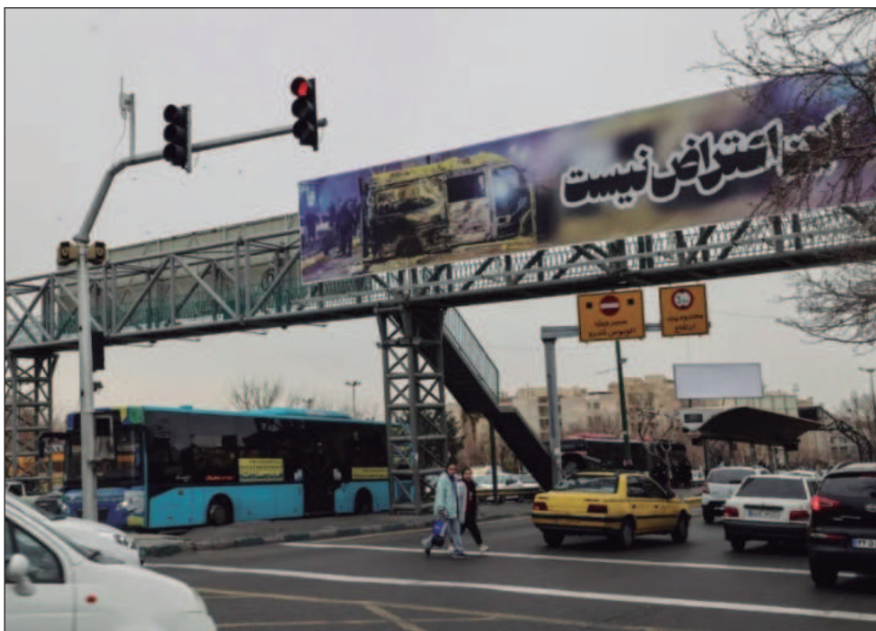
▲ Según grupos de derechos humanos, el bloqueo que duró 240 horas tenía el objetivo de ocultar la magnitud de la represión de las protestas, que dejó miles de muertos.

Irán cortó todas las comunicaciones el 8 de enero, en respuesta a la ola de protestas, que comenzaron luego de manifestaciones por el aumento del costo de la vida y que derivaron en un movimiento contra el régimen teocrático en el poder desde 1979.