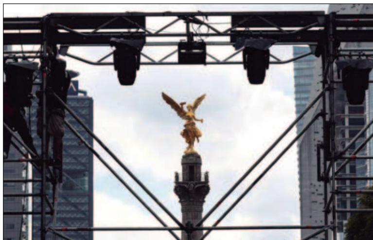
▲ “Un ejercicio inédito al tratarse de una invitación a enviar, en forma directa y sin intermediación de instituciones o foros previos, propuestas legislativas o ideas para mejorar la Cultura en la capital del país”.

Es un buen ejercicio, sobre todo porque, como digo al inicio, abre la puerta para que la comunidad presente en forma directa al Poder Legislativo sus propuestas, sin pasar por instancias del Poder Ejecutivo local, en concreto la Secretaría de Cultura de la ciudad que, como vimos en el caso de la primera sesión ordinaria del Consejo de Fomento Cultural, no pudo reunir el quórum necesario para realizar la sesión, no sabemos aún si por incapacidad, por falta de seguimiento o por