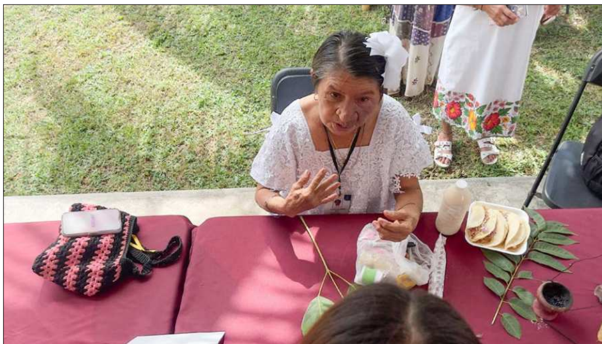
▲ “Es imperativo que desde la política científica y tecnológica se creen mecanismos para dar continuidad a estas iniciativas a través de nuevos fondos y convocatorias, con el objetivo de brindar sostenibilidad a las redes generadas entre los diversos actores participantes y que pueda lograrse en el mediano y largo plazo un impacto positivo”.

EN GENERAL, SE parte del supuesto de que las universidades y centros de investigación no son los únicos actores que producen conocimiento y por tanto deben establecer colaboraciones con otros actores como: asociaciones civiles, colectivos ciudadanos, cooperativas, comunidades rurales e indígenas, por mencionar algunos. Esto con el fin de lograr una mayor incidencia social del conocimiento,