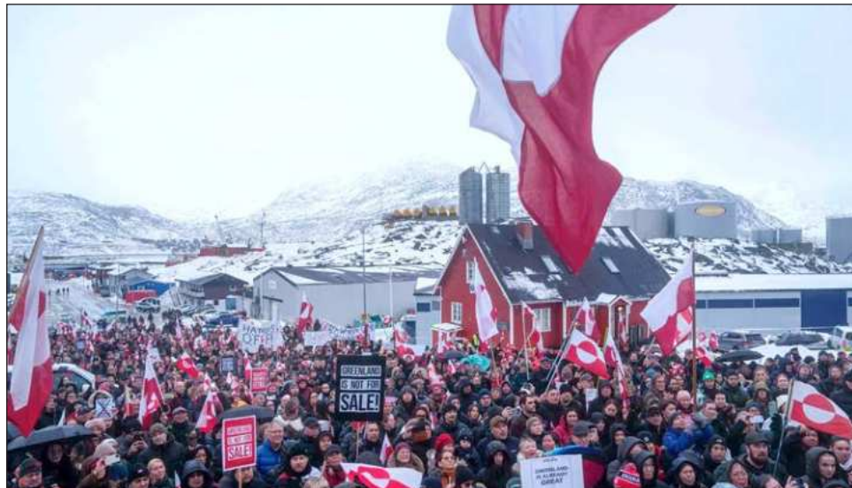
▲ Tras las conversaciones de emergencia entre los enviados nacionales de la UE el domingo, el presidente del Consejo Europeo, António Costa, indicó que los líderes del bloque están de acuerdo en que “los aranceles socavarían las relaciones transatlánticas”.

La declaración conjunta inusualmente firme de Dinamarca, Noruega, Suecia,