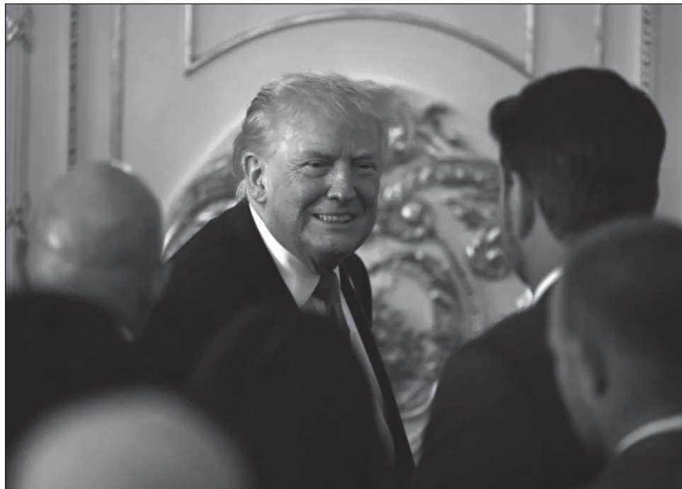
▲ Según la Casa Blanca, este órgano tendrá por misión asesorar al comité tecnocrático palestino de 15 miembros que se encargará de la administración provisional del territorio.

"El anuncio de la composición del Comité director de