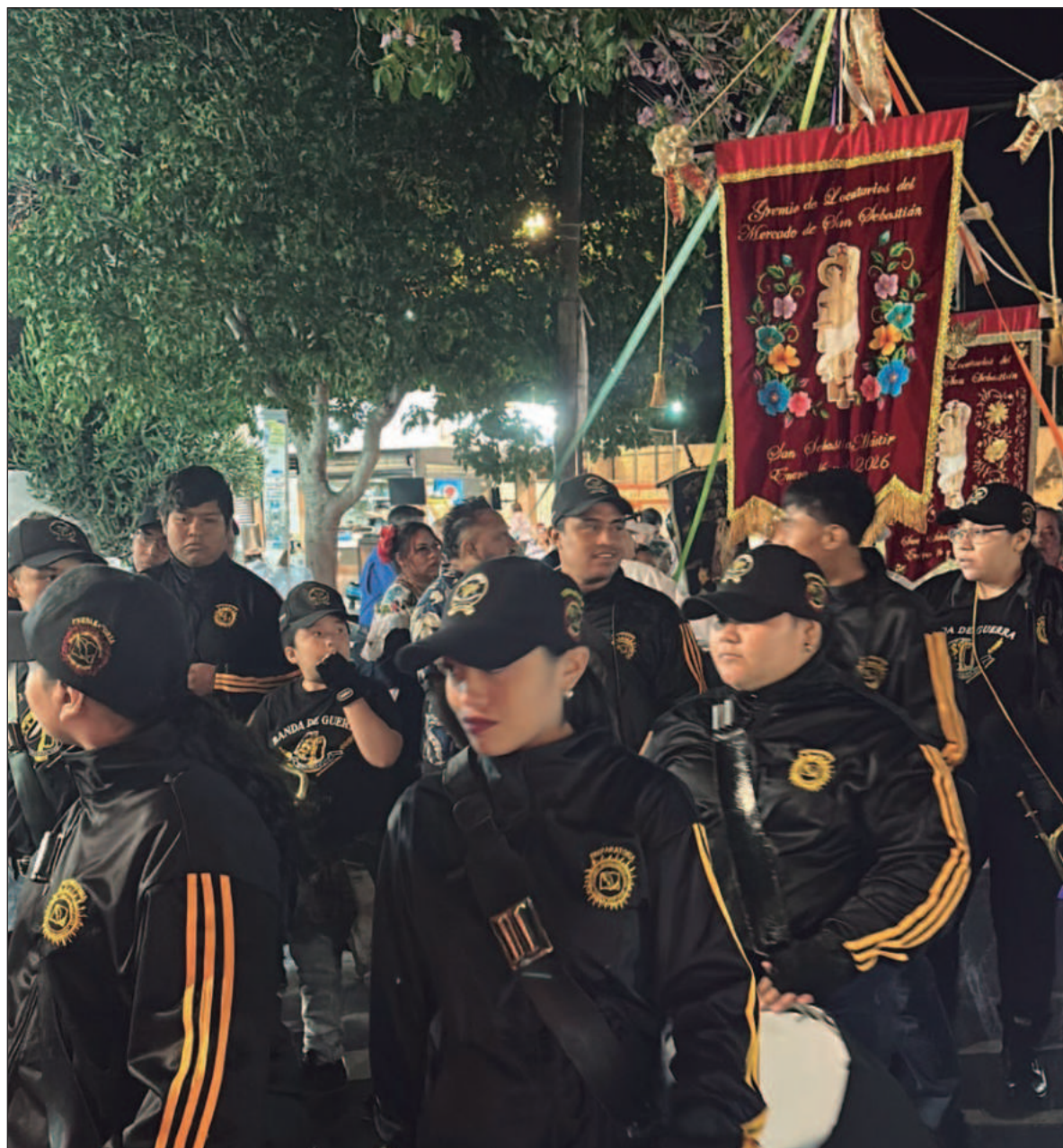
▲ “Fue una gozada, escuchar reventar los voladores, mientras la banda de la escuela abría paso con sus tambores y cornetas, y un carro “toneado” con música de jarana en su cajuela”.

Merida cuenta con nueve barrios tradicionales en el centro de la ciudad y el de Itzimná que seguramente era un pueblo cercano que el tiempo anexó: Santiago, Santa Ana, Santa Lucía, San Juan, San Sebastián, La Ermita, La Mejorada, San Cristóbal e Itzimná. Cada uno con oferta propia, además de la belleza arquitectónica, algunos aún ofrecen las delicias del panucho y el caldo, cochinita y anexas, con el sabor verdadero, antes del invento de los lights, que, si bien nos cuidan, una escapada de vez en cuando es para ir a beber al cenote de nuestra