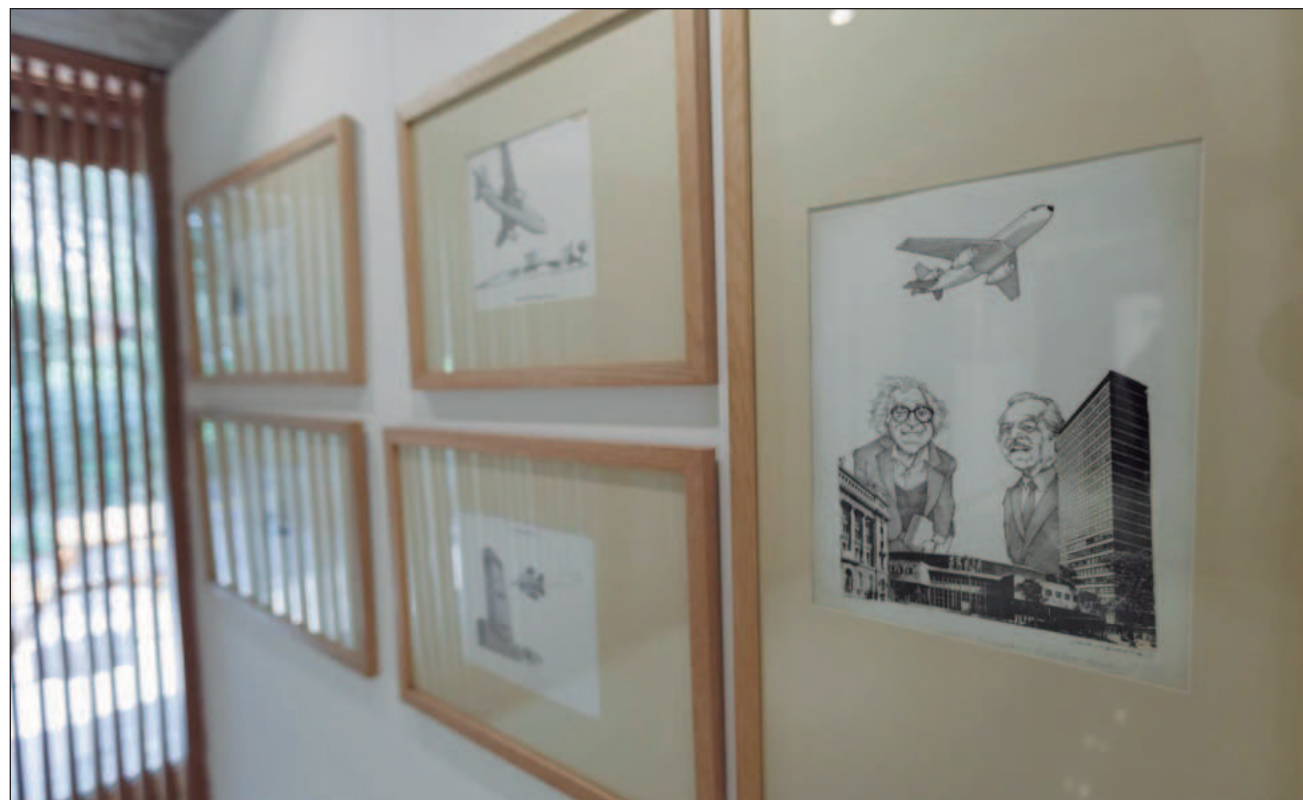
▲ Antonio Helguera fue un artista que entendió la caricatura “como una herramienta muy poderosa para cuestionar al poder, desnudar contradicciones y recordarnos que la democracia también se defiende desde el lápiz y el papel”.