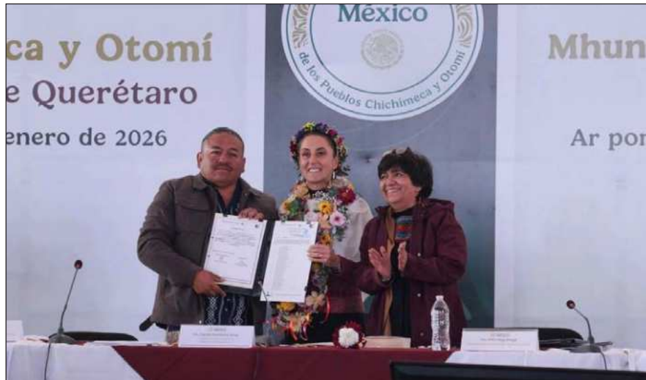
▲ La Presidenta puso fin este domingo a un conflicto agrario histórico que se prolongó por más de 80 años entre comunidades indígenas en San Miguel de Allende, Guanajuato.

El nuevo ejido Nuevo Cruz del Palmar, con una extensión de 569 hectáreas, puso fin al conflicto histórico entre el ejido La Petaca y la comunidad de