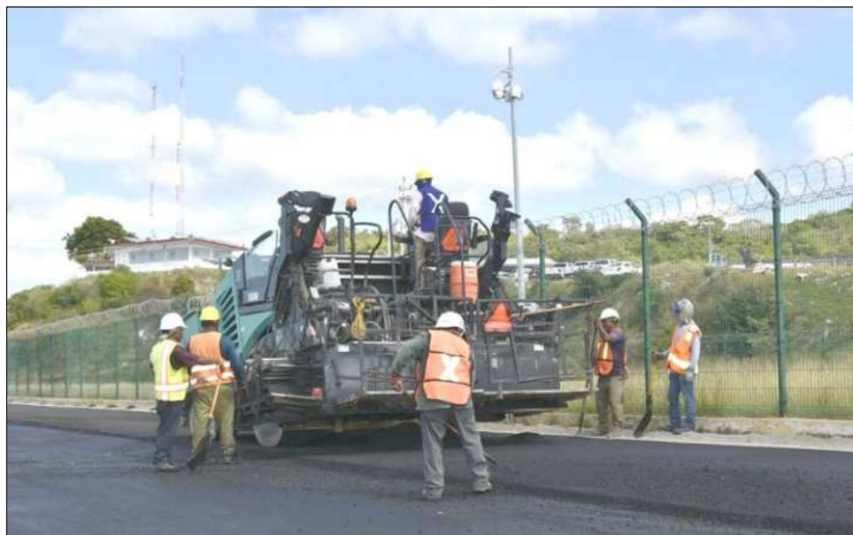
▲ La resolución de la Suprema Corte revierte las modificaciones aprobadas y restablece la obligación de pagar los permisos correspondientes ante los ayuntamientos.