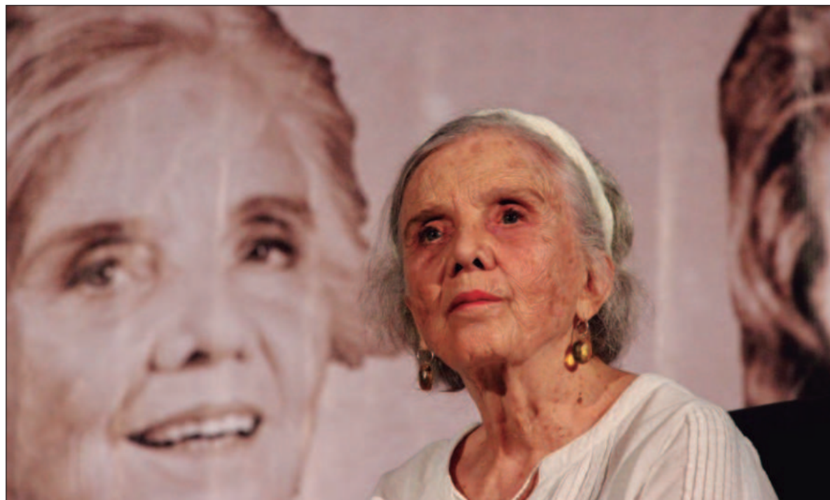
▲ "México era pura luz. Comíamos arroz rojo con chícharos y el aguacate que nunca habíamos probado en Francia. Todos nos sonreían y nos decían 'güeritas'".

Fuimos a Madrid desde la estación de Toulouse en tren y ahí en el andén, para despedirnos de papá, vestido con su uniforme militar, quién se quedaba en la guerra, representamos una pequeña obra que nos enseñaron en la École Communale, Kitzia era Hitt-