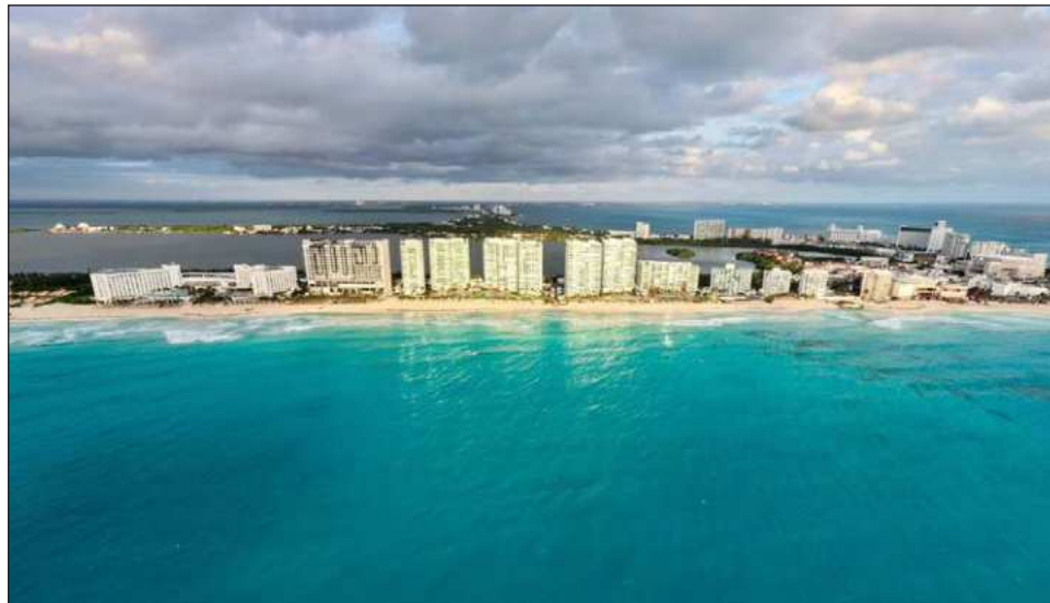
▲ En el caso específico del Caribe Mexicano, Expedia reporta que 2025 cerró con un crecimiento moderado, menor a 10 por ciento.

"Estamos teniendo buenos números para el año para el Caribe Mexicano, pero todavía nada fuerte relacionado con el Mundial; construimos una landing page en Expedia especial para México para todo el tráfico de gente buscando los partidos y creemos que eso va a dar mucha visibilidad a otros destinos e incentivar que la gente diga, 'bueno, me quedo más tiempo y voy a otro destino' y el Caribe es el que tiene conectividad aérea con las 16 ciudades mundialistas", resaltó.