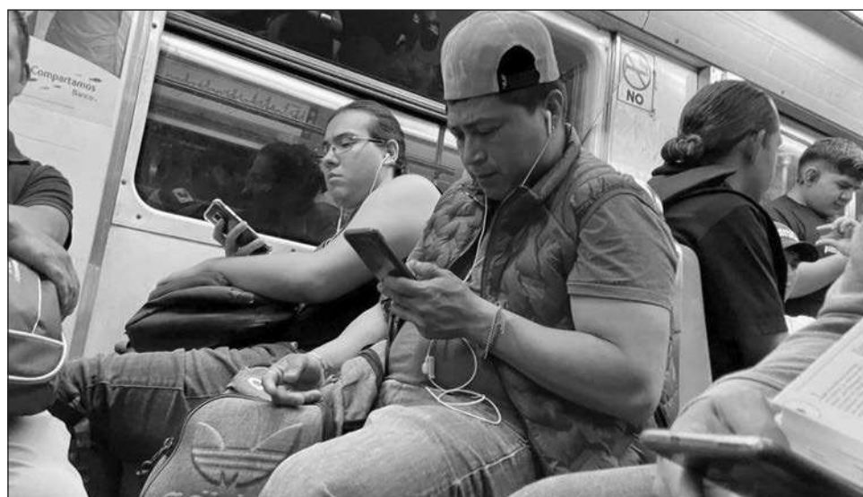
▲ El coordinador de la bancada morenista, reconoció que “algunos usuarios de telefonía móvil encontraron debilidades que podrían poner en riesgo información sensible de las personas, por lo que se expusieron dudas respecto a la seguridad informática”.

De esta forma, se permite que cada línea esté asociada a un usuario “real y