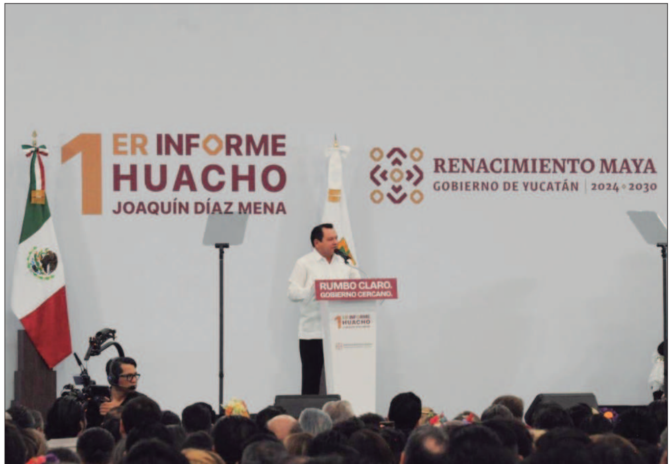
▲ Ante la presencia de su gabinete legal y ampliado, así como integrantes de varios sectores, el gobernador aseguró que 87 por ciento de los compromisos hechos para todo el sexenio ya tienen presupuesto asignado y se encuentran en marcha.

Con un cambio de sede de última hora al pasar del Puerto de Altura de Progreso al Centro Internacional de Congresos (CIC), este domingo el gobernador de Yucatán rindió cuentas de las acciones realizadas durante su primer año de gestión, destacando avances en materia de apoyo a las mujeres, a las juventudes, al campo, la pesca, personas con discapacidad, así como los logros en salud, seguridad, obra social, medioambiente, economía, turismo, cultura y deporte.