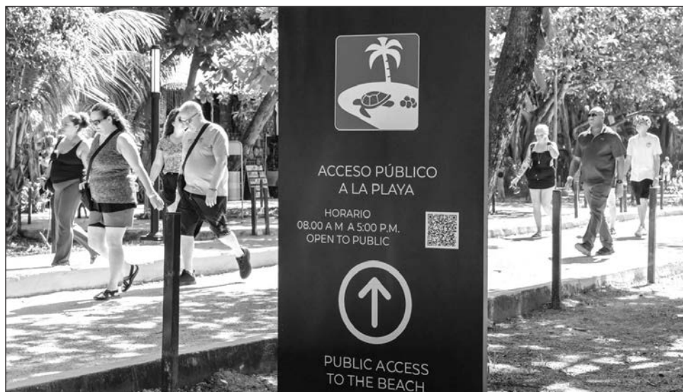
▲ Q. Roo cuenta con un esquema de promoción, a través del Consejo de Promoción Turística del estado, que es considerado un ejemplo a nivel nacional por su eficiencia y resultados.

"Diría yo que fue una temporada invernal exitosa, por supuesto empezamos enero con algunos retos, arribos tempranos de sargazo y bueno, eso nos pone a prueba para redoblar esfuerzos para el comienzo de este año", indicó el también