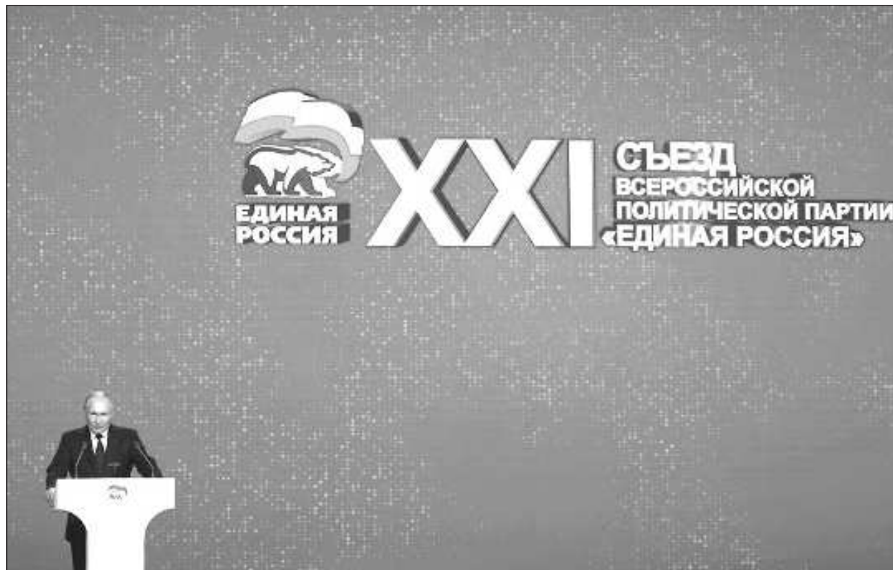
▲ Si Vladimir Putin es reelegido como presidente, una opción probable en un sistema en el que la oposición es casi inexistente, podría permanecer en el Kremlin hasta 2030: todos sus opositores están en la cárcel o en el exilio.

Putin, de 71 años, ha dicho que hará de la “soberanía” uno de los objetivos clave de su quinto mandato en el Kremlin.