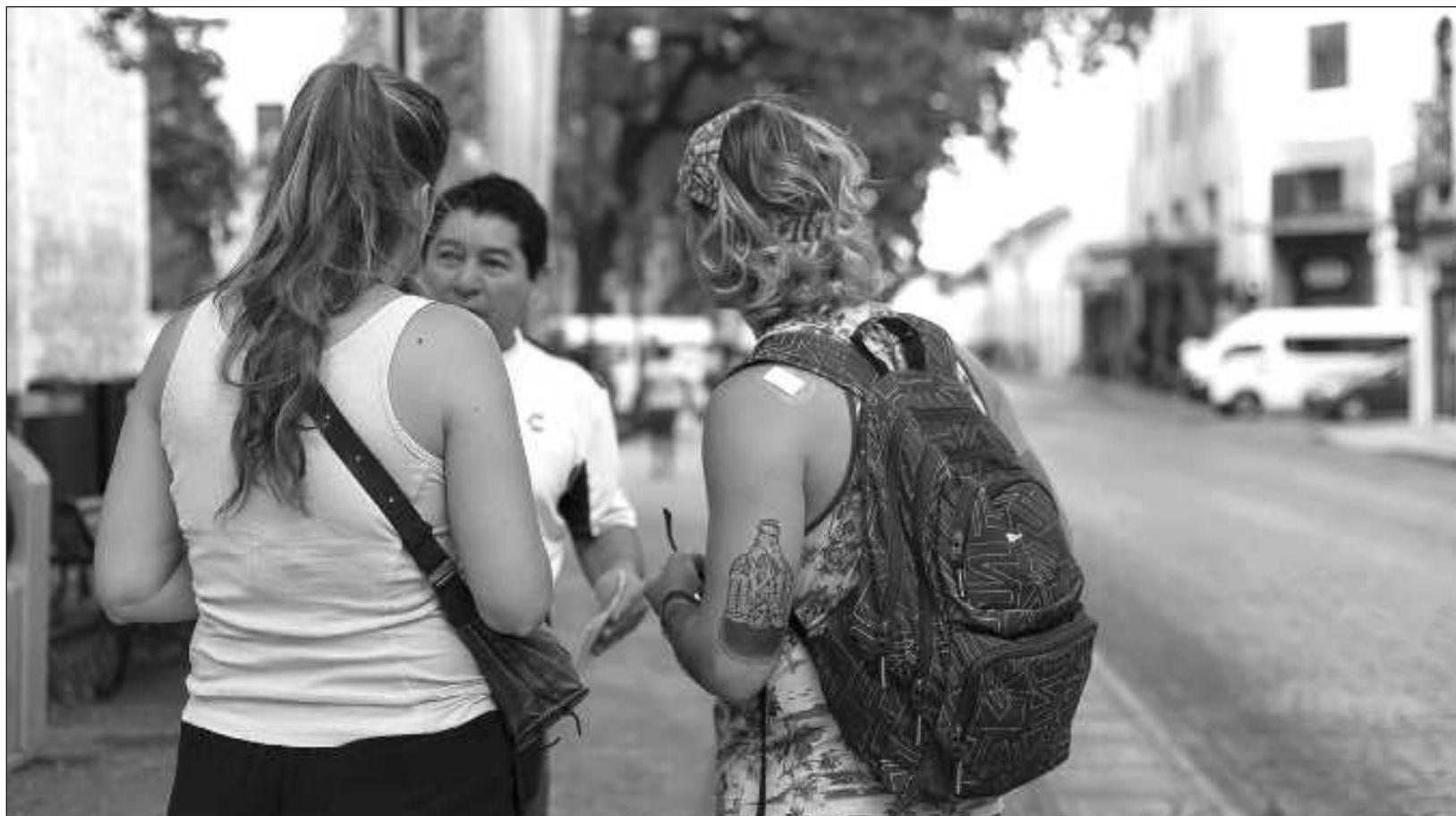
▲ La iniciativa tiene como objetivo crear un espacio de reflexión y diálogo en torno a la experiencia migratoria, centrándose en la perspectiva juvenil.