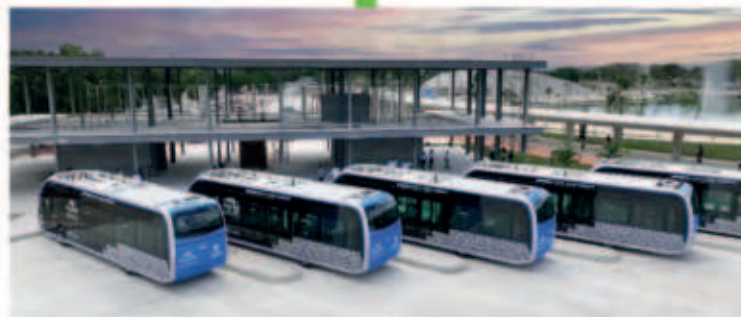
Se construye la estación del IETRAM en el Parque la Plancha, para 3 rutas de este transporte público 100% eléctrico y único en su tipo en Latinoamérica.