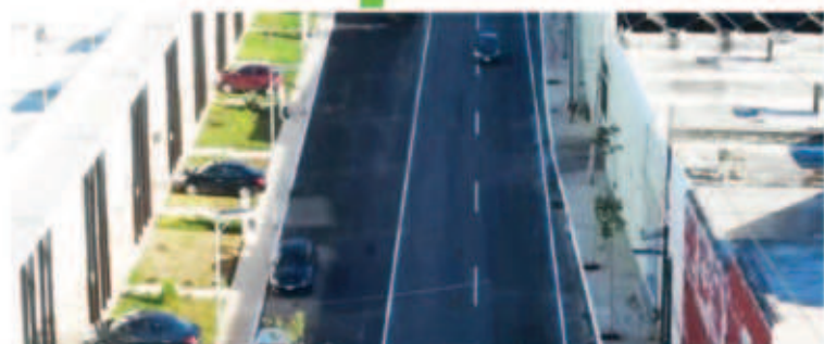
Construcción y repavimentación de más de 3.8 kilómetros de calles que abarcan la 46, 43 y 55. Adicionalmente se realizará la construcción de banquetas y guarniciones, señalética, sistema de iluminación y pozos pluviales.