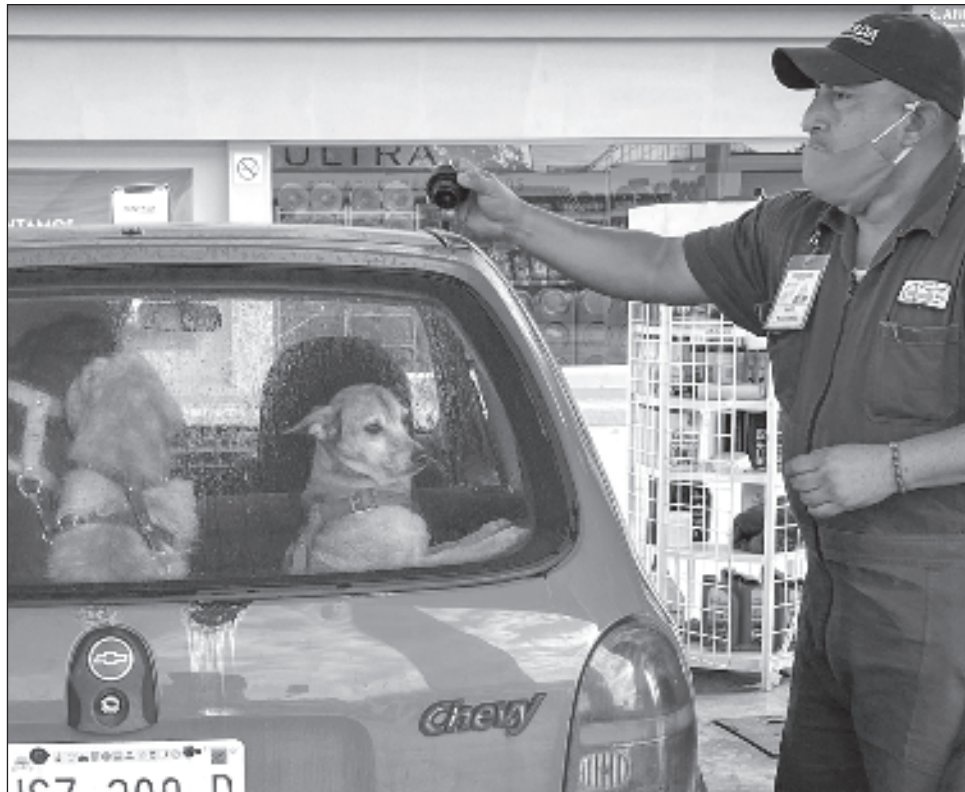
▲ A los despachadores “ya no se les llama gasolineros oficiales, les llaman propineros ” ya que no alcanzan ni el salario mínimo y viven de las propinas.

De acuerdo con la resolución emitida por el Consejo de Representantes de la Comisión Nacional de los Salarios Mínimos en diciembre del año pasado, desde el 1° de enero