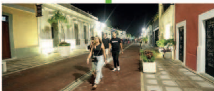
Estamos realizando el Corredor Turístico - Gastronómico de la calle 47 y 60 para conectar a la Plaza Grande, el Parque de Santa Lucía y de Santa Ana con el nuevo Parque la Plancha, en conjunto con el Ayuntamiento de Mérida.