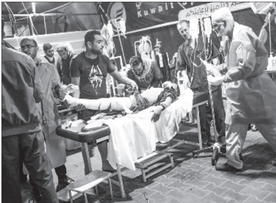
▲ El equipo de la Organización Mundial de la Salud que visitó el centro médico reportó que vio cientos de heridos y que cada minuto llegaban nuevos pacientes.

Los quirófanos ya no funcionan por falta de oxígeno y los empleados de la OMS indicaron que el hospital “necesita ser sometido a una reanimación”.