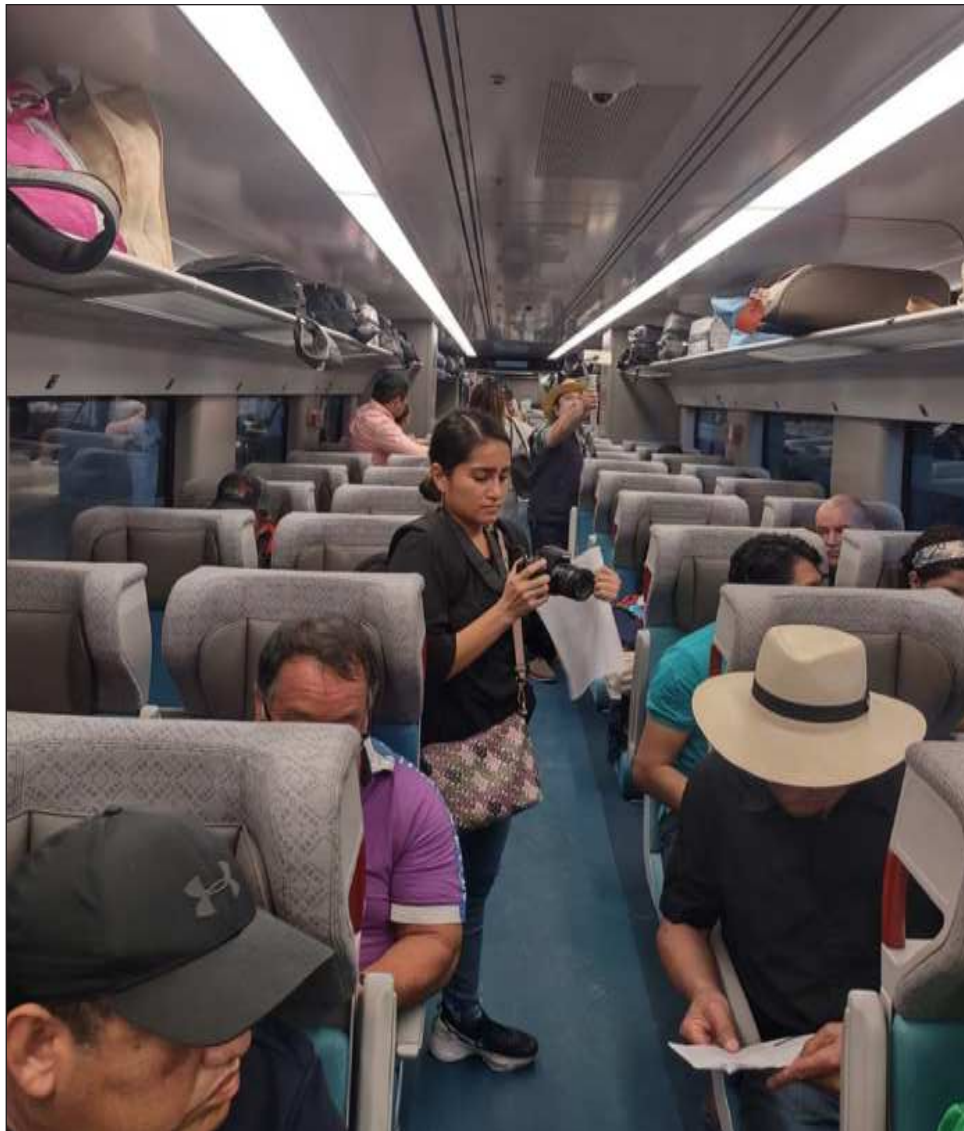
▲ Los pasajeros se decían contentos, orgullosos de que ahora, como no se imaginaban antes, hay un trayecto que circulará por toda la península de Yucatán.

El recorrido valió la pena, decían entre porras los primeros viajeros, muchos de ellos con hambre,