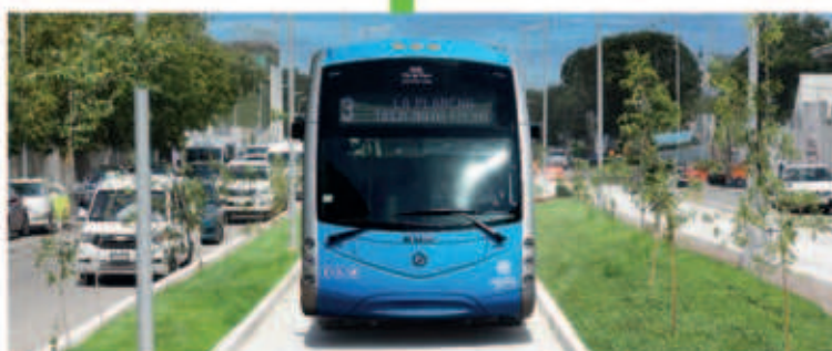
Construcción de vías en donde transitarán las unidades del IETRAM, además de construcción de banquetas y guarniciones, señalética, sistema de iluminación y pozos pluviales.