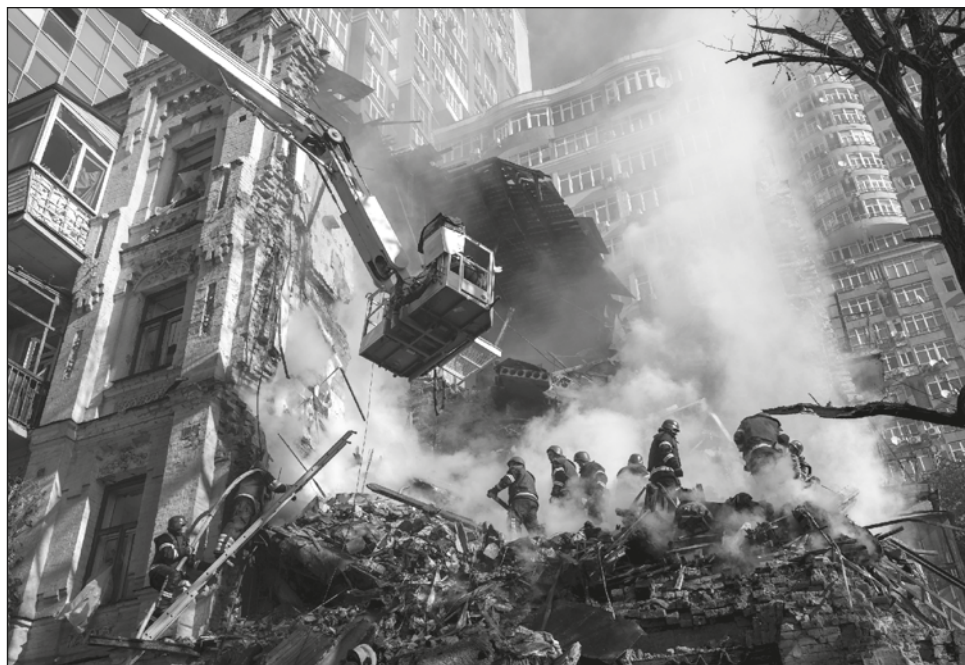
▲ Según el ministerio de Defensa de Kiev, "en las últimas 13 horas", los ucranianos habían derribado 37 drones de fabricación iraní y tres misiles de crucero.

Periodistas de Afp en Kiev vieron drones sobrevolando un barrio central de la capital y cómo los oficiales de la policía les dispararon con armas automáticas.