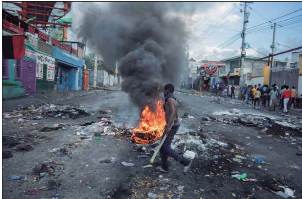
▲ La terminal petrolera de Varreux está bloqueada por bandas criminales armadas.

La terminal petrolera de Varreux, la más importante de Haití, permanece bloqueada por bandas criminales armadas desde mediados de septiembre, paralizando todo el país.