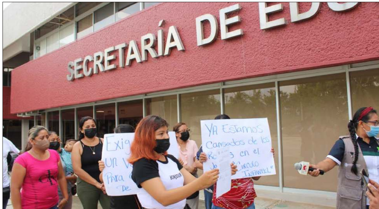
▲ La comunidad del jardín de niños Círculo Infantil reclamó que van 19 robos a la escuela sólo en este 2022.

El jardín de niños Círculo Infantil está ubicado en una de las zonas más conflicti-