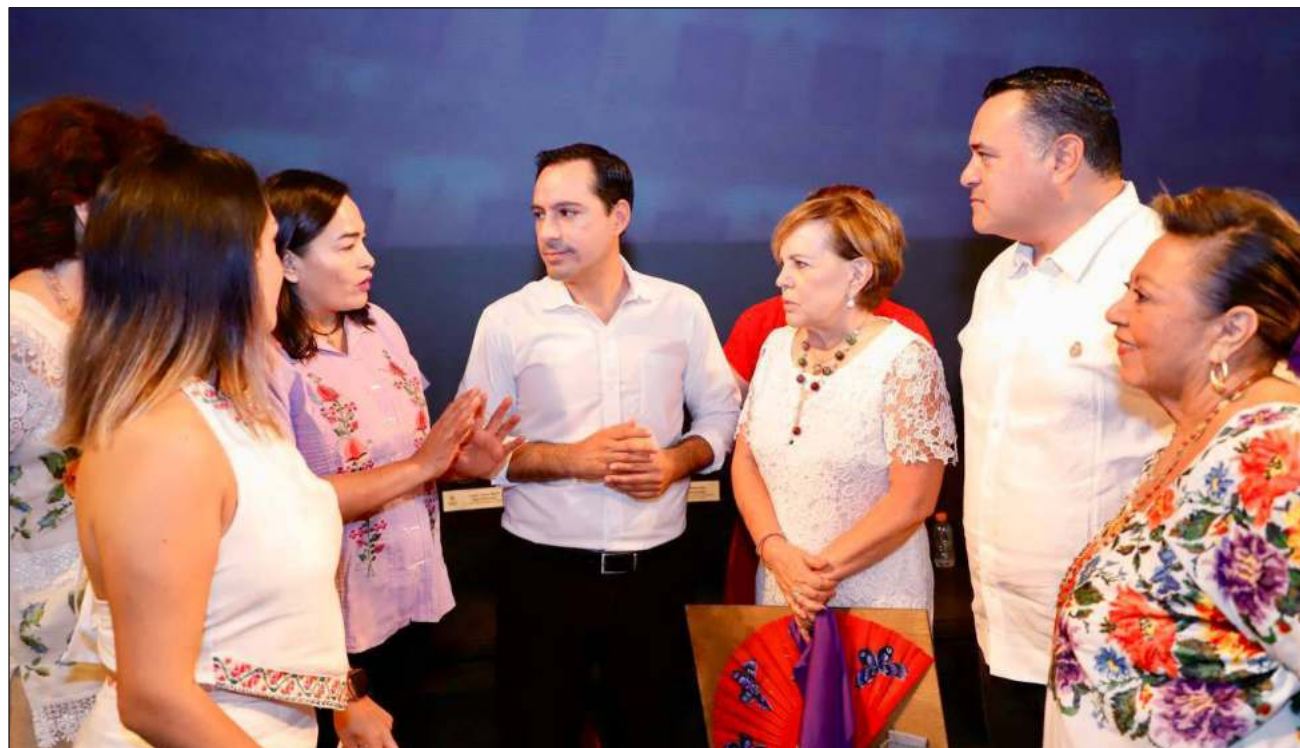
▲ Las ponentes resaltaron que sin importar que las feministas sean señaladas como peligrosas, continuarán luchando en la defensa de la vida los derechos humanos; mientras autoridades señalaron que la paridad ya está presente en el país.

"Hacemos un llamado al Congreso y a los gobiernos de todo el país para asegurar que, por lo menos las mujeres