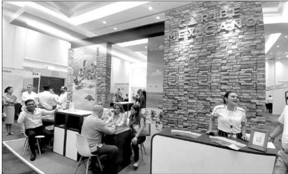
▲ Con más de 350 participantes y seis nuevos países, se inauguró este lunes la edición 34 del Cancún Travel Mart, con la asistencia de hoteleros, empresarios y funcionarios.

Presente en la inauguración del Cancún Travel Mart