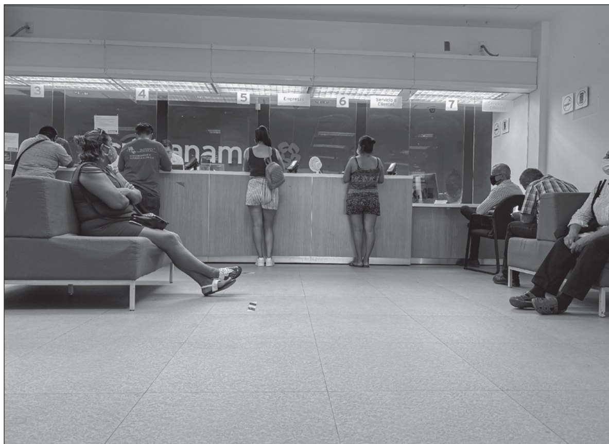
▲ Los bancos acosan y amenazan a sus deudores con despachos de abogados que parecen gánsters. ¿Por qué no con el mismo ahínco buscan a los dueños de depósitos supuestamente abandonados?.

EL TEMA HA desatado inquietud. El presidente López Obrador propuso que el fondo se dedique a programas sociales. Es una mejor idea. Pero aun antes lo adecuado es devolver el dinero a sus dueños. Cuando un cliente le debe dinero al banco éste no descansa hasta localizarlo para que le pague. Lo persigue por teléfono día y noche, lo amenaza a través de despachos de abogados que más bien parecen gánsters, lo acosa en su domicilio y en su trabajo. ¿Por qué no pone cada banco el mismo ahínco para encontrar a los dueños de los