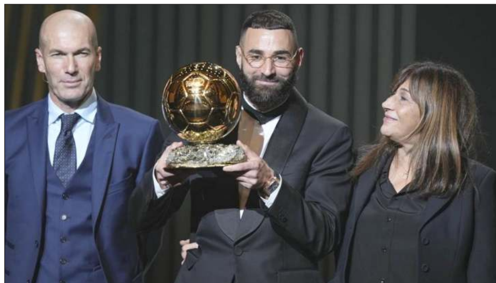
▲ Karim Benzema muestra el Balón de Oro 2022, junto a su madre Wahida y Zinedine Zidane.

Con 34 años, Benzema es el ganador de mayor edad desde el primer consagrado en 1956, el inglés Stanley Matthews. "La edad es nada más un número para mí", dijo Benzema en la ceremonia realizada en el Teatro del Chatelet en París. "Los jugadores ahora pueden prolongar sus carreras mucho más y yo preservé una ferviente motivación. Es lo que me es-