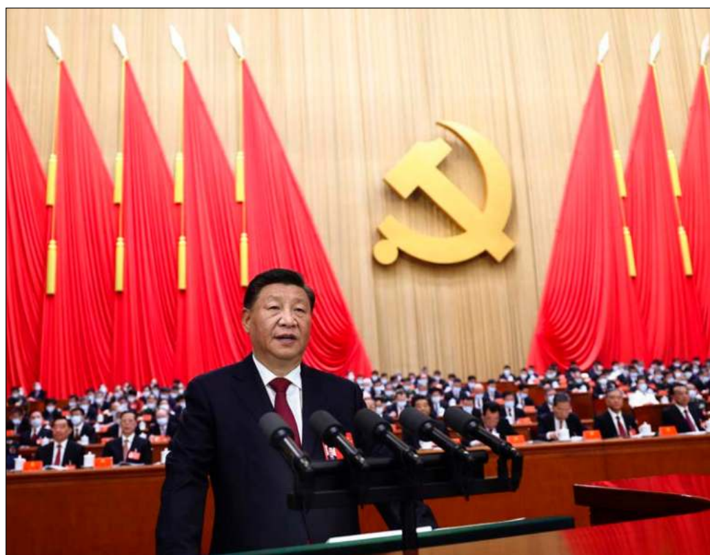
▲ China ya no sólo es la fábrica del mundo sino también el principal motor del comercio, una potencia espacial, un factor de desarrollo y cooperación en zonas tan remotas como África.

La suerte del propio Xi Jinping, quien se encamina a un tercer periodo de gobierno, depende de ello. Y eso es justamente lo que se procesa en el congreso en curso del partido gobernante.