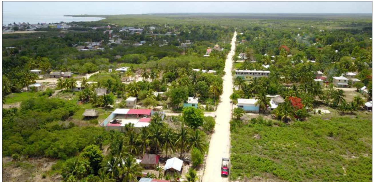
▲ Se destinará la superficie de 74.05 metros cuadrados de zona federal marítimo terrestre ubicada en el bulevar costero de Chiquilá; mientras que en Holbox se cedieron 103.41 metros cuadrados en la zona ubicada en la avenida Caleta.

La siguiente publicación específica: "se destina al servicio de CFE Distribución, empresa productiva subsidiaria de Comisión Federal de Electricidad, la superficie de 103.41 metros cuadrados de zona federal marítimo terrestre del estero, ubicada