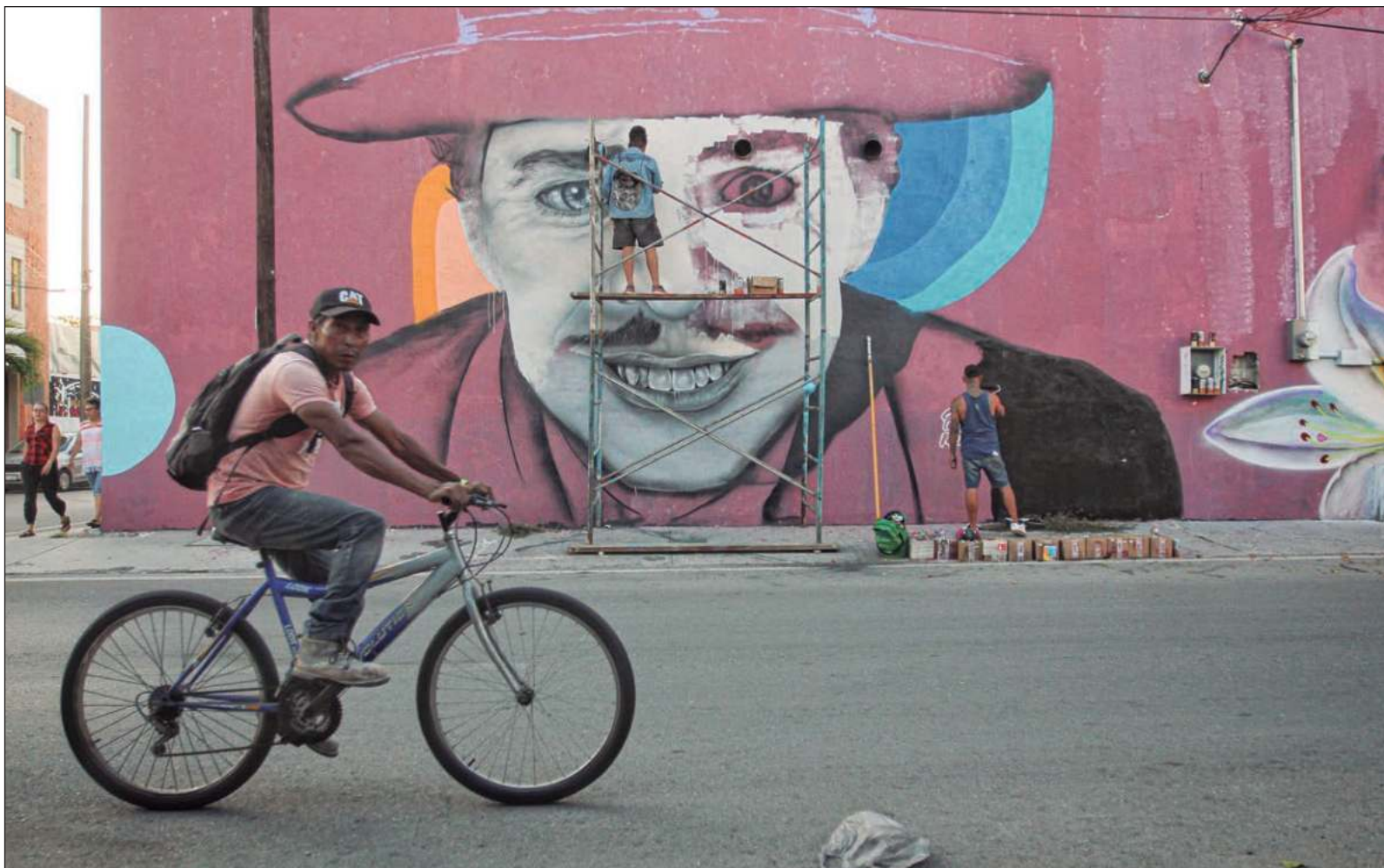
▲ En Q. Roo, el victimario viola derechos humanos y no tiene que pagar siquiera un quinto. La Comisión de DH necesita más dientes.