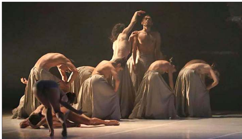
▲ En la obra, que se presenta en la edición 50 del Cervantino el 20 y 21 de octubre a las 21 horas en el Teatro Juárez de Guanajuato, se escucha la voz en off de Mario Lavista explicando aspectos interesantes de su vida y su interés por la música religiosa y contemporánea.