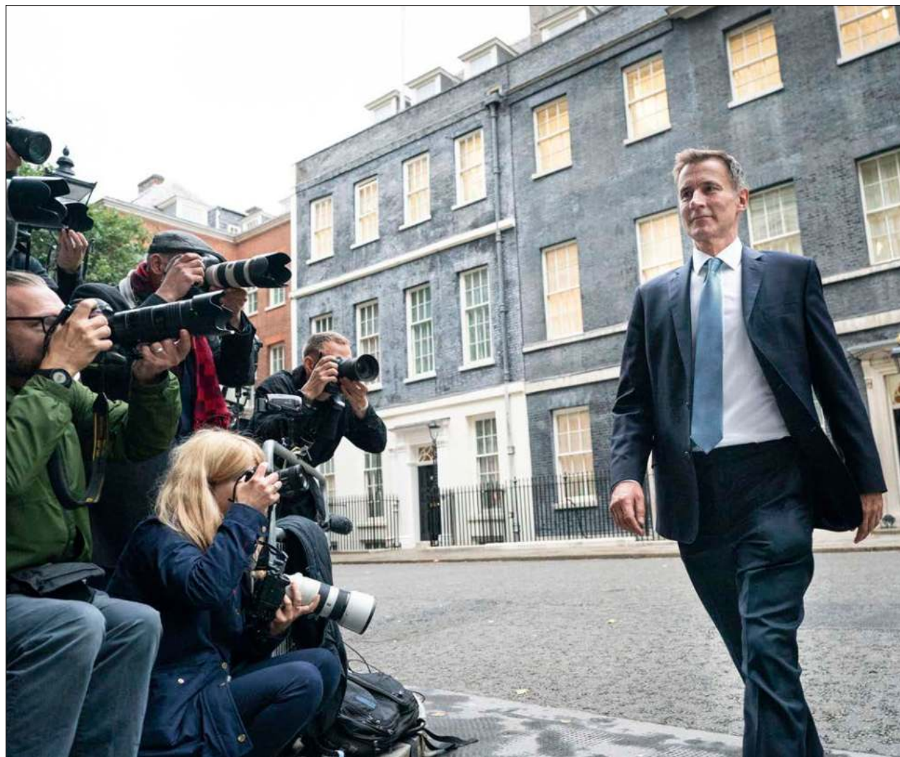
▲ El nuevo secretario del Tesoro, Jeremy Hunt, anunció que el plan que presentó la primera ministra británica, Liz Truss, de reducir un punto porcentual el impuesto sobre los ingresos, no se aplicará a partir de 2023, como estaba planeado.