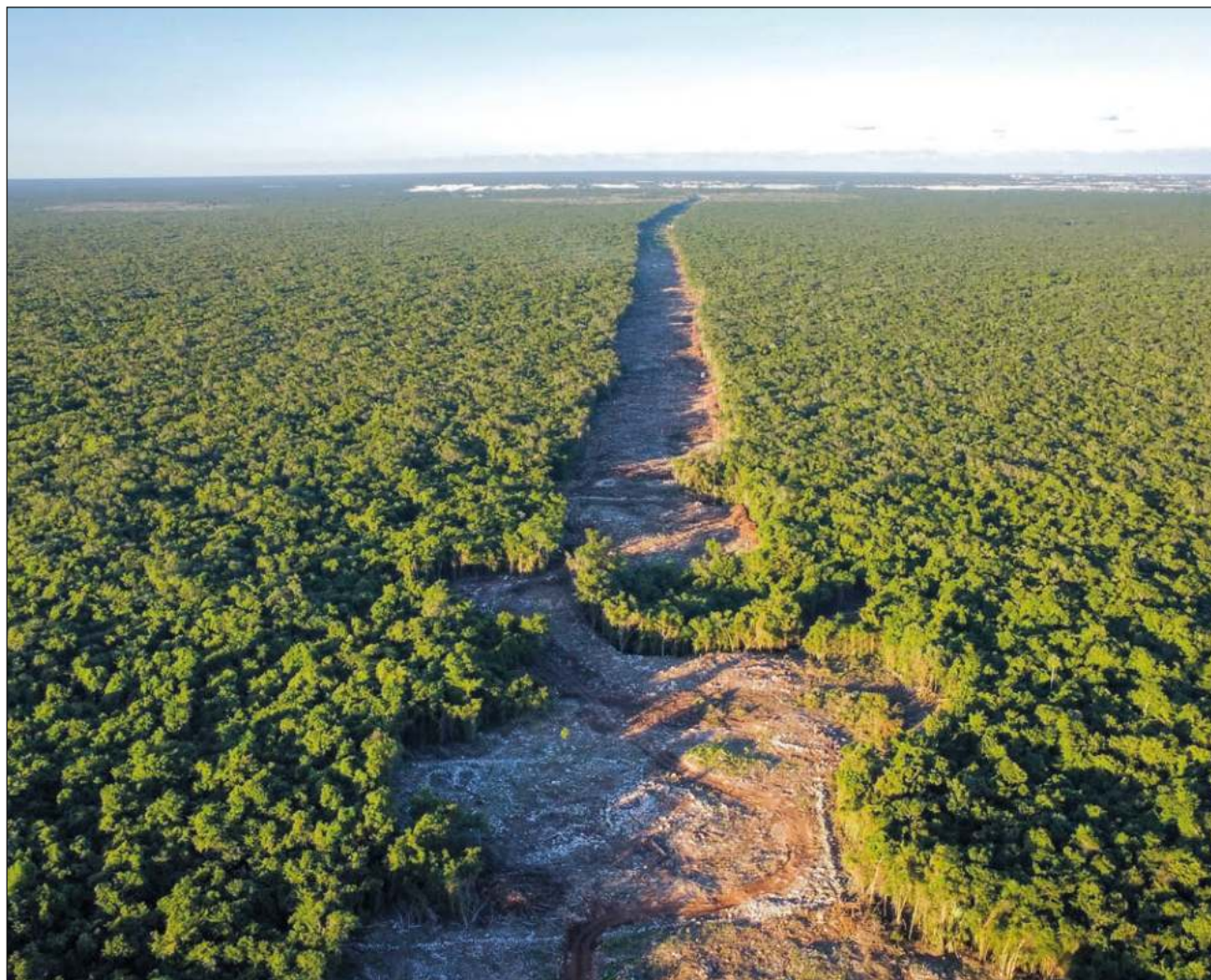
▲ El Presidente advirtió que si los ejidatarios de Quintana Roo no aceptan los avalúos que se les presenten, el trazo del Tren Maya se irá por el derecho de vía en el tramo entre Chetumal y Escárcega.

Si los ejidatarios no aceptan los avalúos presentados, el trazo del Tren Maya se irá por el derecho de vía. Se requieren 40 metros de ancho y el tramo entre Chetumal y Escárcega es de una sola vía. "Y si hay bloqueos y presiones se queda