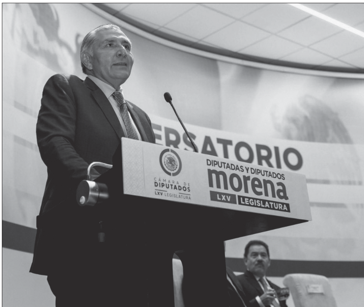
▲ Adán Augusto López Hernández, anunció en días pasados que se trabó un acuerdo con el PRI que va más allá del punto de la Guardia Nacional y la continuidad militar en ella.