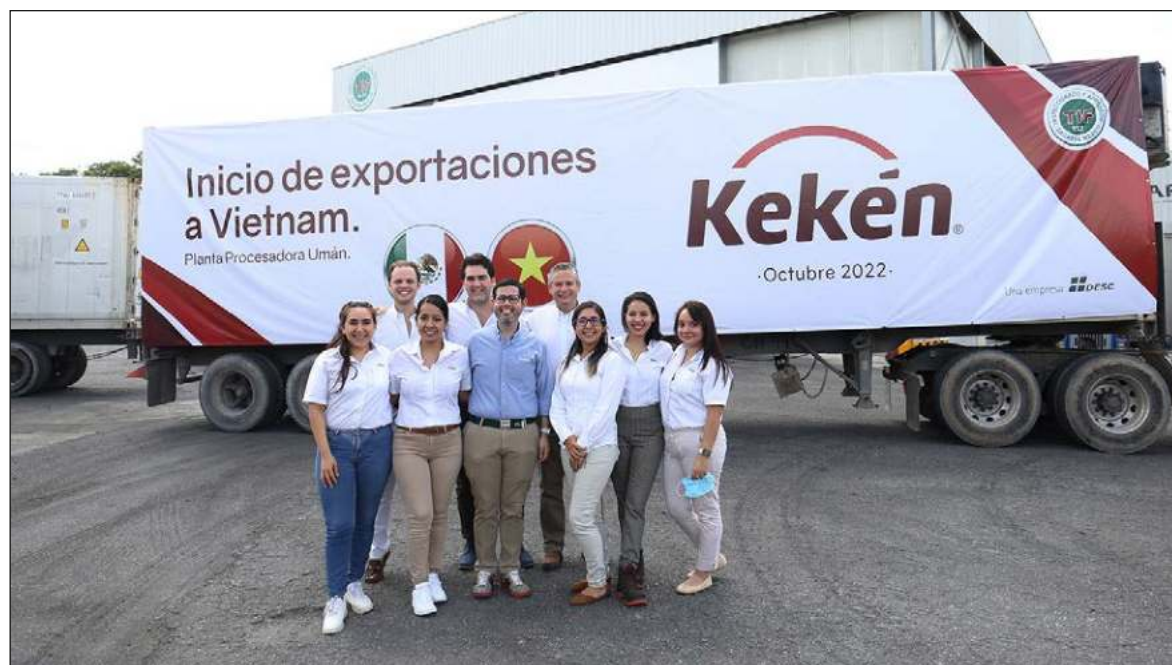
▲ La exportación pactada con Vietnam es de 110 toneladas de carne durante el mes de octubre, de las cuales ha partido ya una quinta parte. Con esto, Kekén tiene presencia en 12 países.