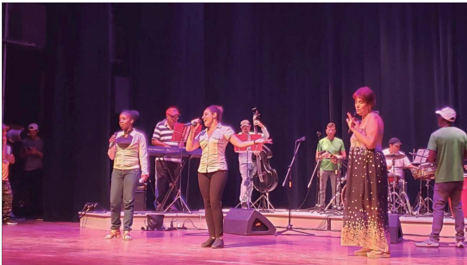
▲ Nacida en Holguín, al oriente de Cuba, la Orquesta Hermanos Avilés, de música popular bailable, celebró este domingo 140 años de su fundación, lo cual la confirma como la agrupación de este tipo más longeva de América Latina.