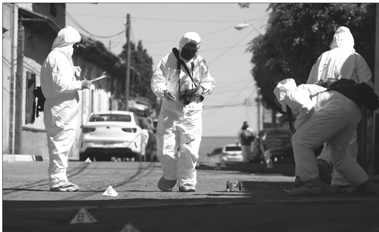
▲ El informe diario del SESNSP se elabora con la información que reportan todas las mañanas las secretarías de seguridad y fiscalías estatales, con base en los informes policiales homologados que se levantan en campo.

El segundo fin de semana más violento es el que transcurrió entre el 5 al 7 de agosto con 263 asesinatos, y en tercer sitio los del 1 al 3 de julio y del 22 al 24 del mismo mes, cuando se registraron 262 asesinatos en cada uno.