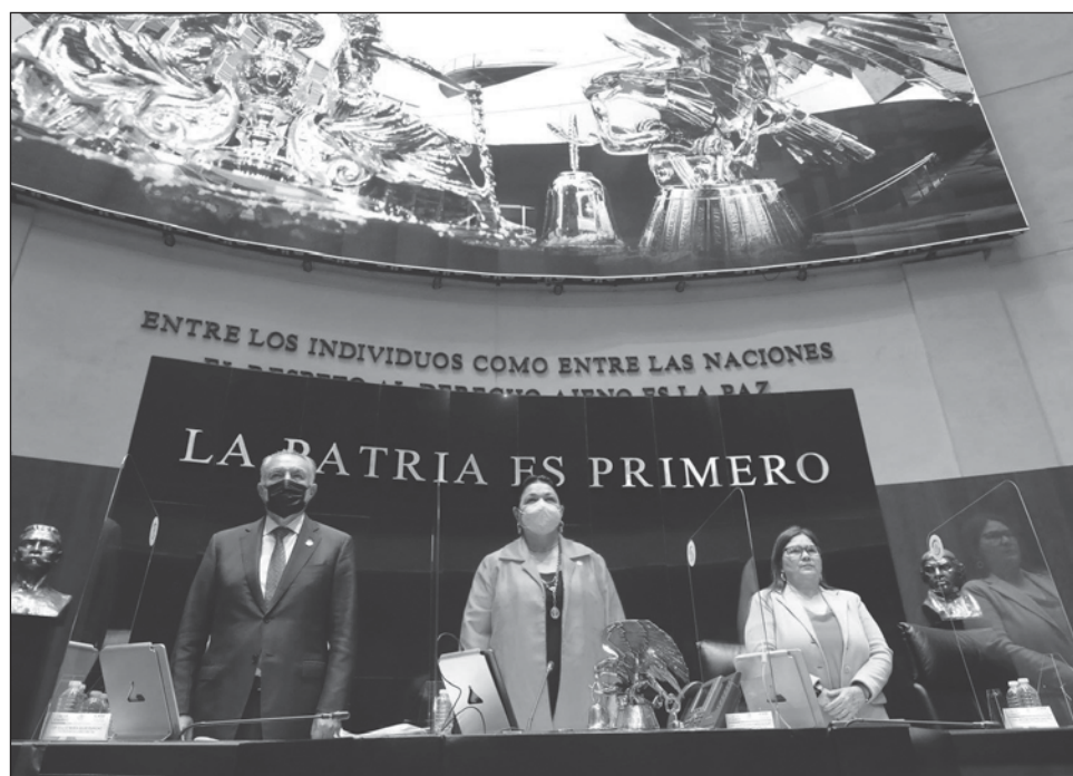
▲ Dulce María Sauri Riancho, ex presidente del PRI, reconoció que “faltan muchísimas cosas por transformar para llegar a una verdadera igualdad”.

“Uno de los temas recurrentes que han emergido a raíz de la llegada de las mujeres, es el tema de la violencia política en razón de género, que se da tanto para tratar de impedir la candidatura, pero también para impedir el ejercicio del cargo para el cual han sido electas”.