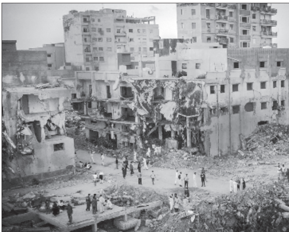
▲ El fin de semana pasado, las fuertes lluvias de la tormenta Daniel causaron inundaciones en el este de Libia; las dos represas se desbordaron, enviando una "pared de agua" a través del centro de Derna que destruyó vecindarios enteros y arrastró a los residentes al mar.

Según ella, la sociedad civil velará por que los responsables de la tragedia comparezcan ante la justicia.