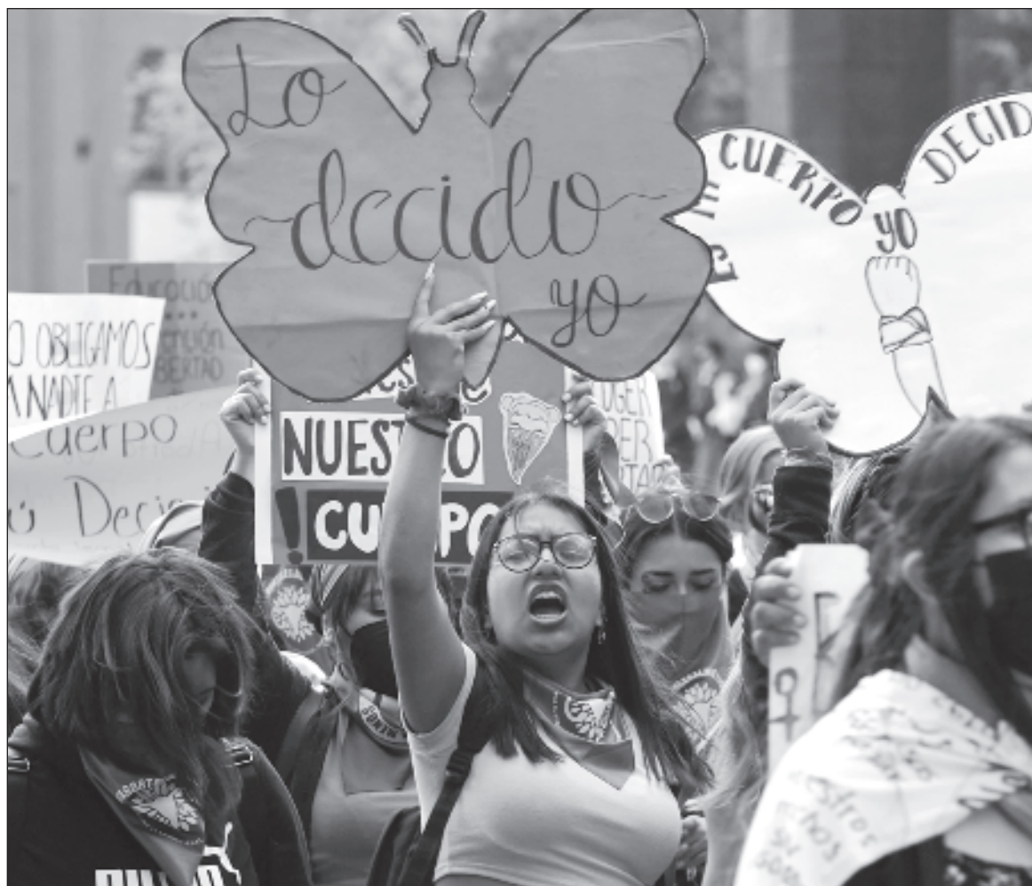
▲ "Si bien México ocupa el primer lugar con el mayor porcentaje de mujeres en los parlamentos entre los países miembros de la Organización para la Cooperación y el Desarrollo Económicos (OCDE), el reto es avanzar hacia una representación sustantiva, de acuerdo a García Méndez (2009) significa que quien ocupe un cargo actúe de forma independiente".

POR EJEMPLO, LAS mujeres ganan el 24 por ciento menos que los