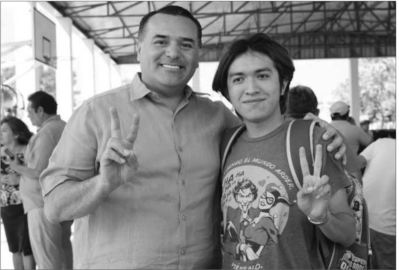
▲ El programa representa una inversión de 2.5 millones de pesos por semestre dirigidos a la comunidad estudiantil.