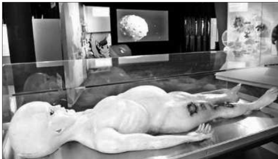
▲ Los especialistas piden una “rigurosa campaña de recopilación de datos. La importancia de detectar” estos fenómenos con “múltiples sensores bien calibrados es fundamental”.

Al mismo tiempo, la agencia espacial anunció la