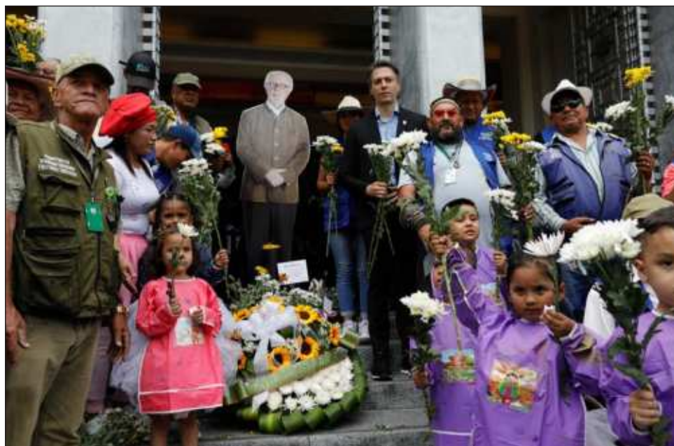
▲ En la entrada del Museo Botero de Bogotá, uno de los lugares turísticos más visitados de la capital, se ubicó un espacio donde visitantes del mundo ofrecieron flores como homenaje al artista.

Nacido en Medellín, Botero no formó parte de ninguna escuela artística, pero