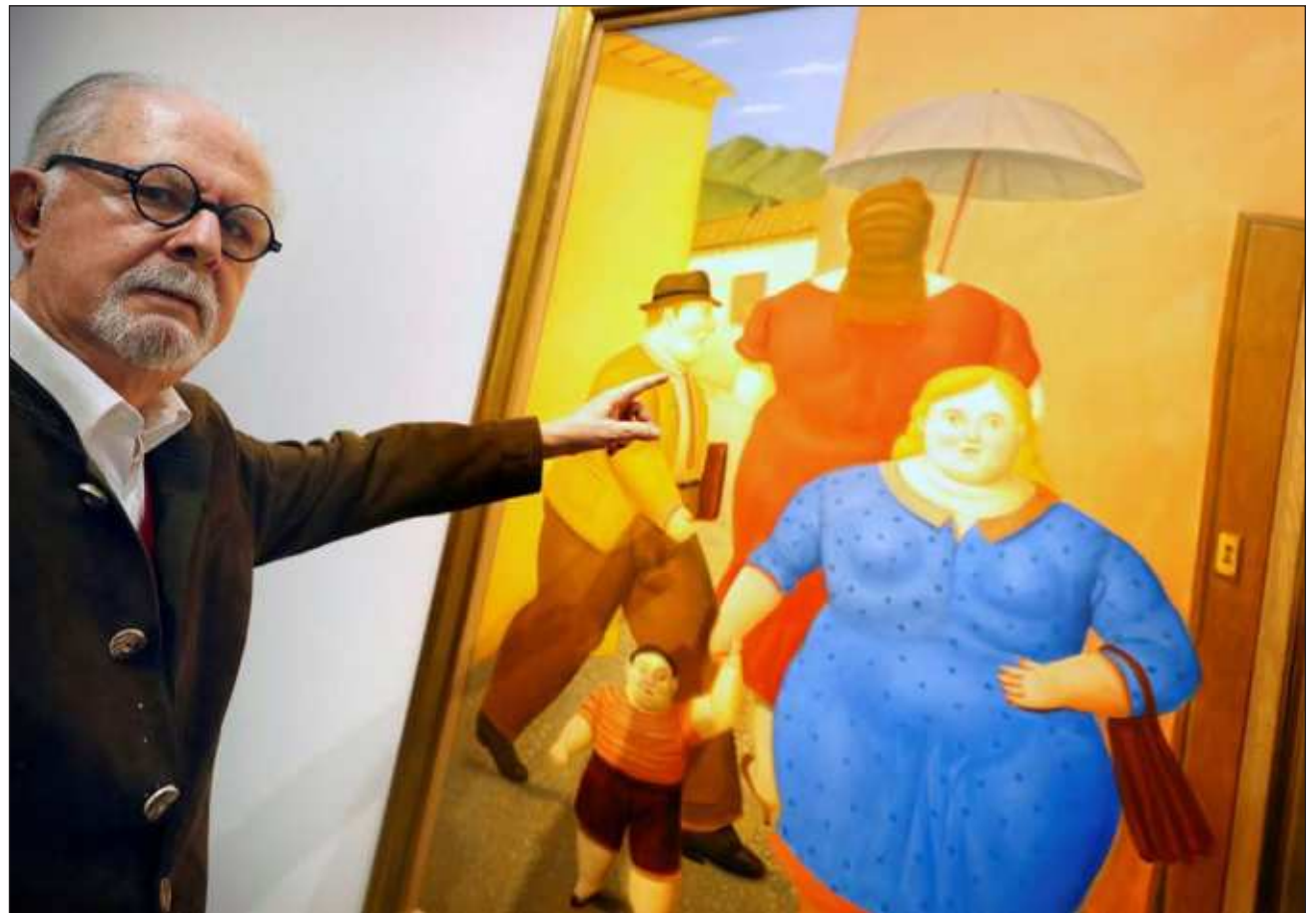
▲ Te'ela' ku yila'al jpóol máak tu táan jump'éel meyaj tu beetaj.

Káaj ka tu chukaj 14 u ja'abil. Áanta'ab tumen u na', ba'ale' a'alab ti'e' tu juunal ken u kaxt u tojol u xook.