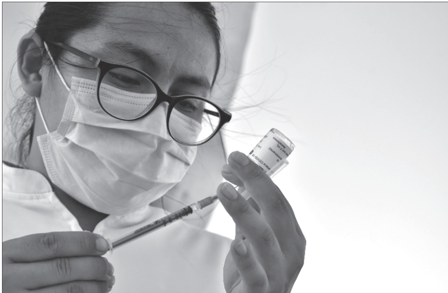
▲ “Me parecen frívolas las opiniones de que el gobierno mexicano debería traer las vacunas que apruebe la OMS o tener sólo la Abdala y la Sputnik, y vacunarse por vacunarse. Nuevamente, considero que es importante hacer un llamado a no caer en la histeria colectiva”.