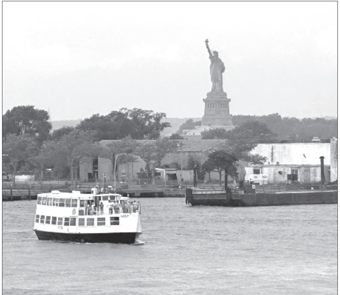
▲ “Retornando al muelle que se encuentra frente a la Estatua de la Libertad, el Esmerald Princess es una ciudad flotante que vive tantas historias como navegantes traslada y que, para los ojos de una aspirante a escritora, se transformó en un festín de posibilidades”.

Al cabo de los días, comencé a ver al grupo de seres humanos en los que la vida nos ha ido convirtiendo. De pronto la película de Wally, aquel robot en un Nueva York destruido, que busca compañía y cuando descubre que los seres humanos huyeron de la tierra y viven en una nave espacial esperando señales de que pueden sobrevivir, para bajar: son enormes y no pueden caminar.