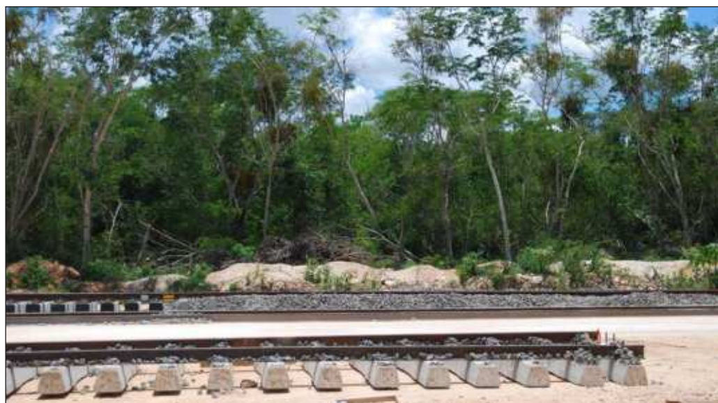
▲ Será hasta dentro de tres o cuatro años que tendremos elementos para afirmar categóricamente que el proyecto se trató apropiadamente o si se construyó un elefante blanco.

Las empresas saben que mover carga mediante trenes es un ahorro significativo cuando se compara con el transporte por carretera. El impacto en la economía peninsular será positivo si es que los capitanes de los negocios saben aprovechar; pero tendremos que poner la mira también en los pequeños productores de comunidades rurales que tendrán una alternativa para llevar cosechas o animales a mercados vecinos, y que igualmente verán llegar visitantes y gente que necesitará de sus servicios. Será el desafío al Yucatán que se imaginó en el siglo XIX, con una bandera que hoy ha vuelto a ondear en Mérida.