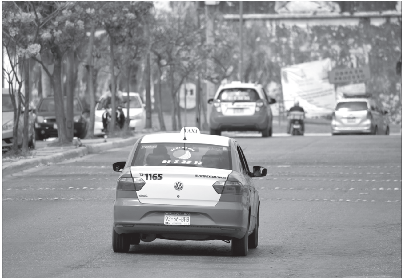
▲ La Sociedad Cooperativa de Taxis Ecológicos indicó que los trámites para dichas concesiones se encuentran avanzando ante el Instituto Estatal del Transporte (IET), instancia que deberá hacer entrega de este documento.

Recordó que desde el 2001, 65 socios pagaron las concesiones que se les solicitaron desde gobierno del estado, además de cumplir con los requisitos; sin embargo, no se les cumplió con la entrega de los permisos.