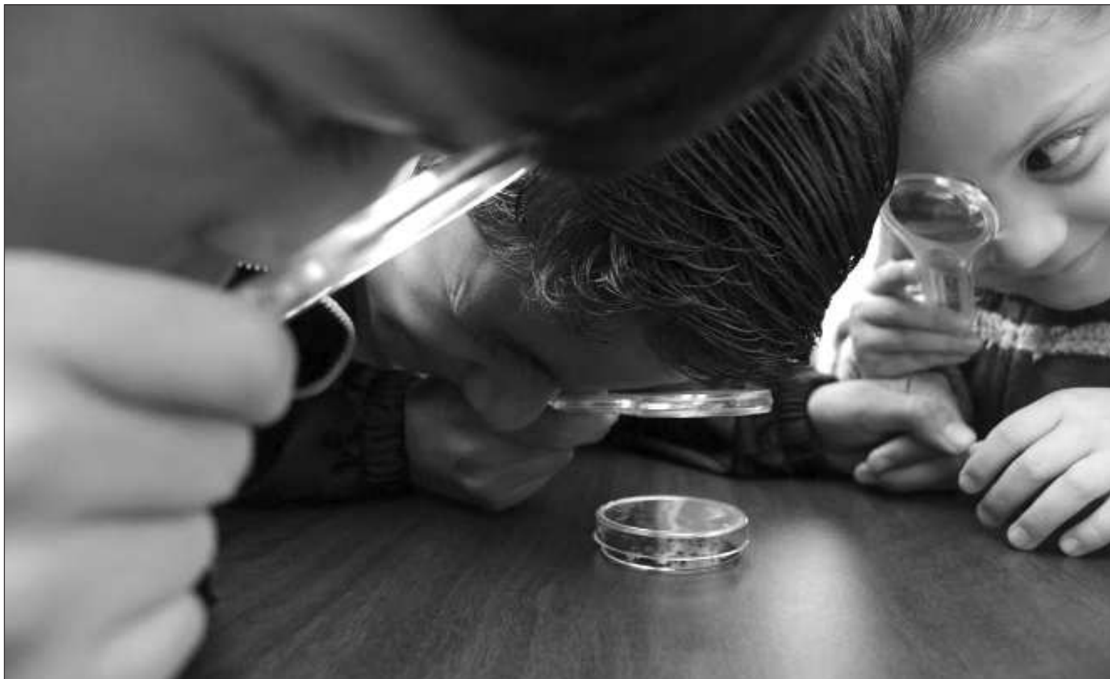
▲ “Todo lo ponía bajo la óptica del microscopio, observar y describir el microcosmos de la vida me han acompañado desde niña”.