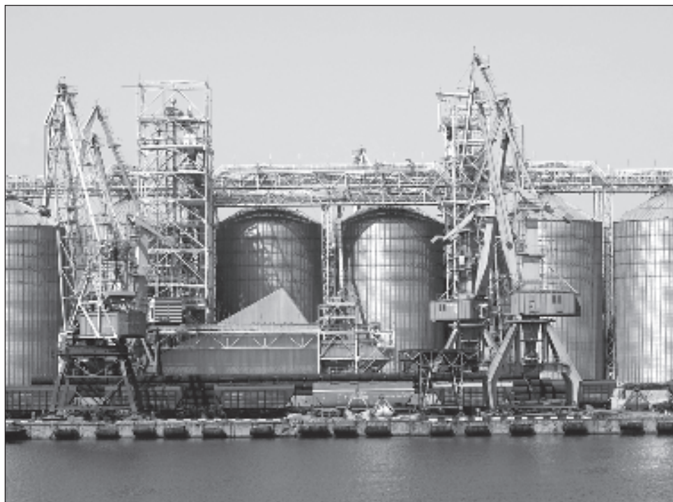
▲ Los dos buques entregarán 20 mil toneladas de trigo a países de África y Asia.

Durante meses, Ucrania, cuya economía depende en