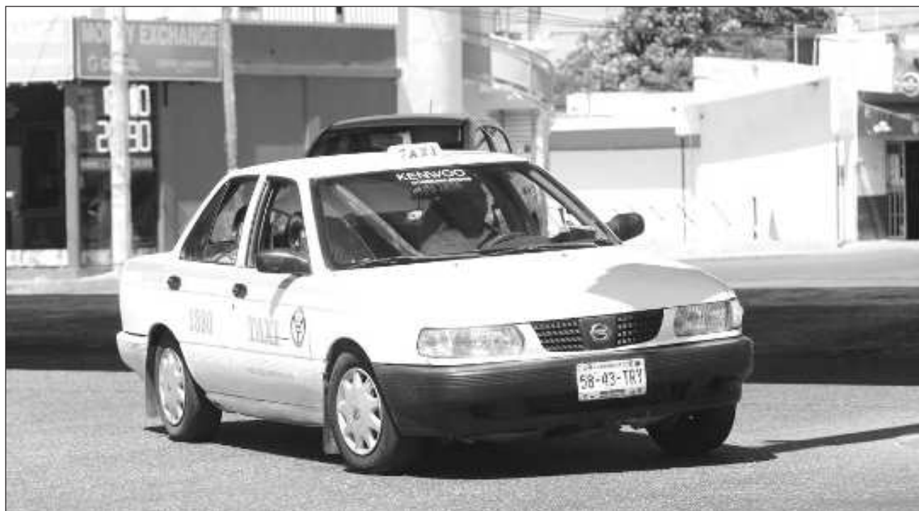
▲ El secretario general del FUTV no precisó si uno o los dos sindicatos General Francisco May de Felipe Carrillo Puerto, y Tiburones del Caribe de Tulum, están buscando la opción de operar en las zonas administradas por la federación.

“Obviamente dejar al pasajero sí, pero te repito, pero para entrar a la explotación hay que generar alguna empresa, alguna sinergia, en la cual las organizaciones puedan también recibir los be-