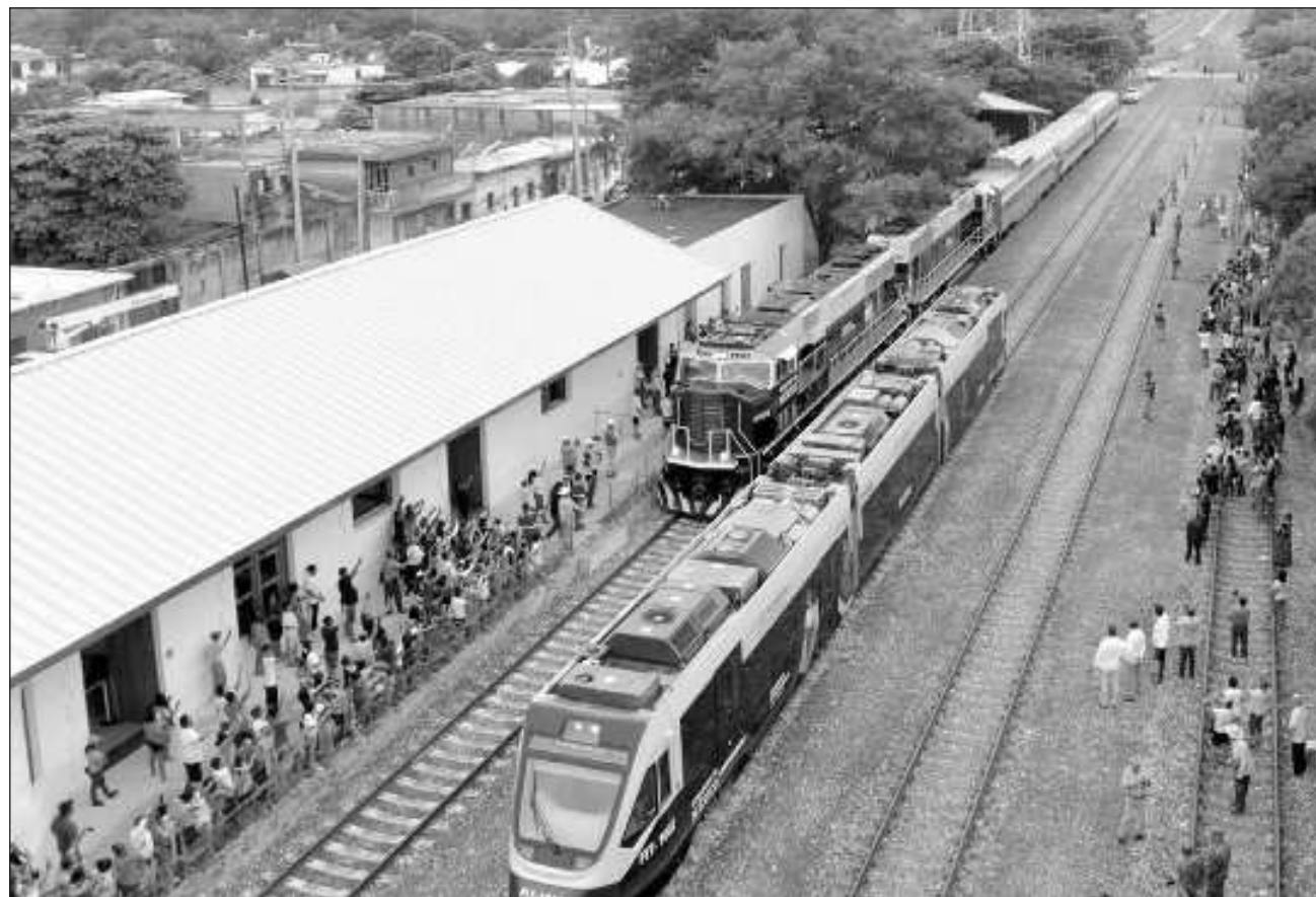
▲ Por medio de redes sociales, diversos usuarios han replicado videos en los que se ve a la gente aplaudir al paso de la locomotora, en una región en la que hasta la privatización de este sector, era conocida como zona ferrocarrilera.

"Iniciamos junto a nuestro Presidente @lopezobrador_, el recorrido de prueba del tren de pasajeros del Corredor Interoceánico en el Istmo de Tehuantepec, nos