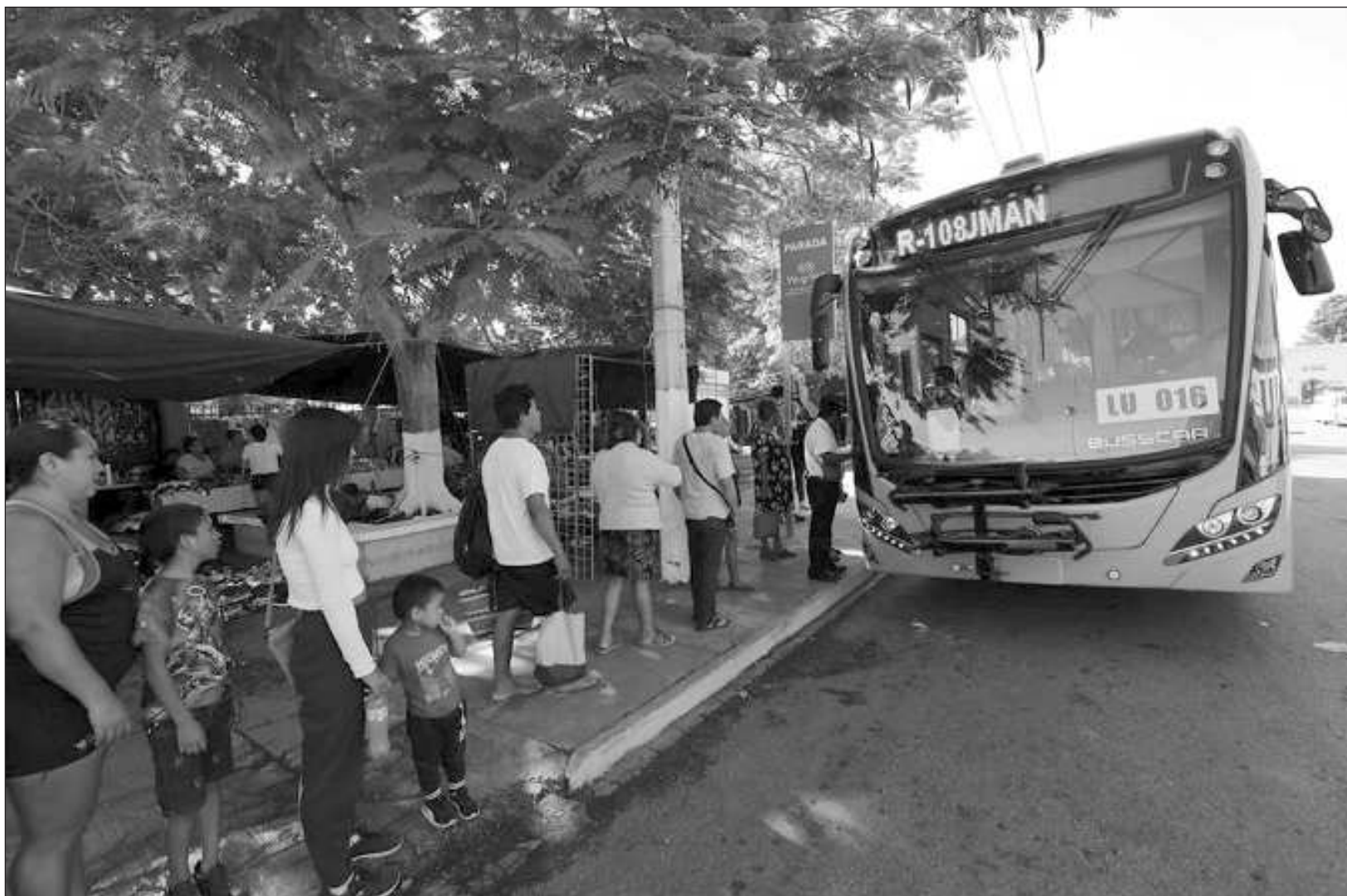
▲ La ruta Umán contará con tarifa social beneficiando a 3 mil 73 estudiantes, 5 mil 954 adultos mayores y 3 mil 406 personas con alguna discapacidad.

amigables con el ambiente; tienen racks para bicicletas y pago por tarjeta inteligente; son de accesibilidad universal, con piso bajo y podotáctil, rampa para sillas de ruedas, señalética en Braille y tanto asientos como espacios preferentes para personas con discapacidad, adultas mayores y de talla baja. Además, cuentan con anuncios luminosos LED, que indican el nombre de la ruta; cargadores USB; equipo GPS para rastreo con la aplicación; cámaras de seguridad, y equipo de cobro electrónico, que evitará que el conductor se distraiga, agiliza los viajes y ayuda a planificar el gasto.