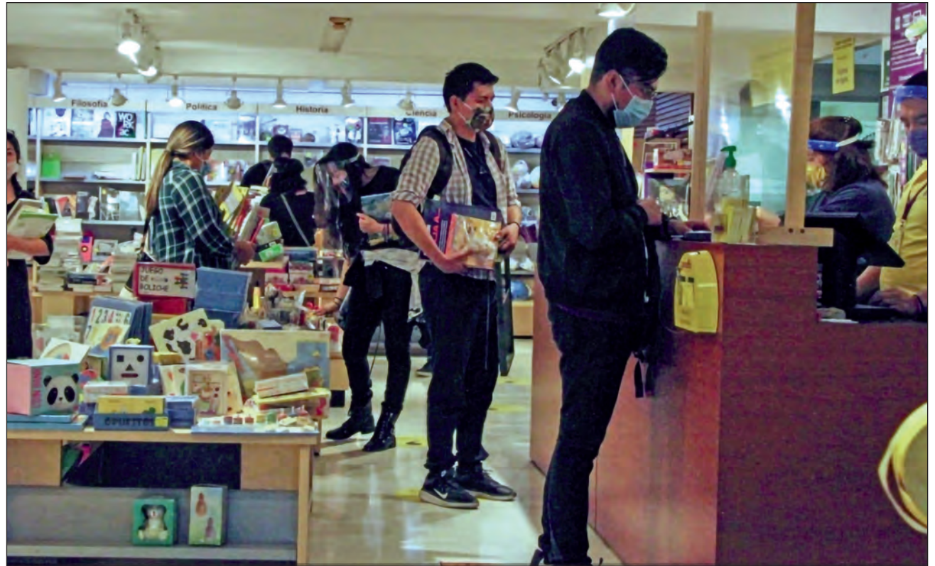
▲ De acuerdo con la empresa, la sucursal que cerró ya no era rentable, lo cual se agravó con la contingencia y el confinamiento sanitario.