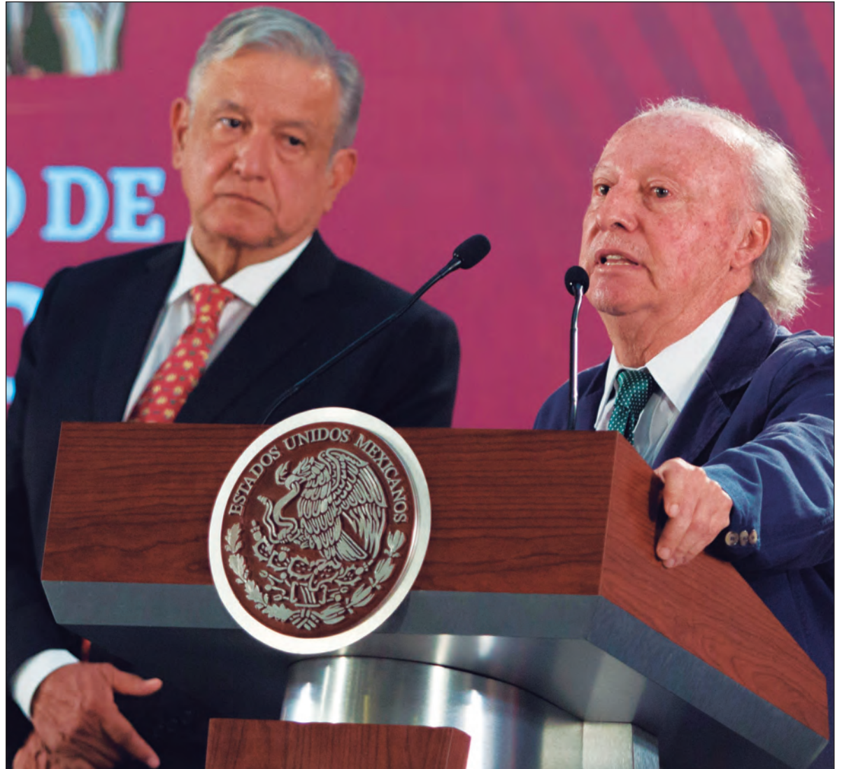
▲ El sistema de gobierno debe favorecer las críticas, con formas y normas definidas, pero de ninguna manera suprimirlas.

En este sentido, para efecto de sistematización, la pregunta ¿qué? se refiere a la política comprometida en campaña. Por ejemplo, el candidato se comprometió con la soberanía alimentaria y la conservación del ambiente. ¿A “qué” se comprometió el Presidente? queda claro como política de su gobierno. La implementación de esa política, o sea el diseño de política pública y plan de gobierno, corresponde al ¿cómo? Aquí es donde puede exis-