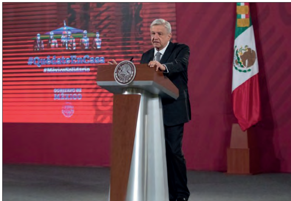
▲ El presidente reiteró que en el caso de las investigaciones al ex director de Pemex, Emilio “L”, se debe dar a conocer toda la información a la población por ser un asunto de Estado, y de estar involucrados ex presidentes.

“Ese contrato se tiene que cancelar, es mi opinión, por ser un contrato leonino, se