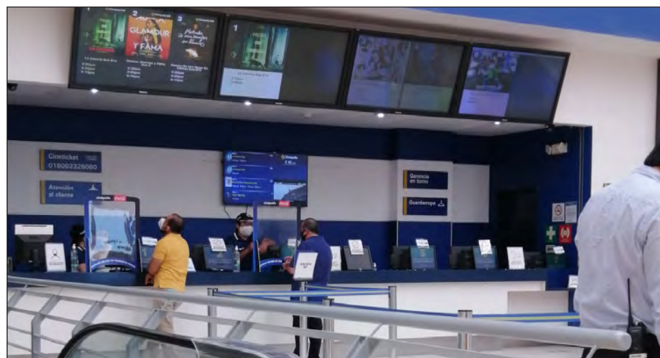
▲ Aunque se vio poco público en los cines, los empleados manifestaron que había funciones ya agotadas.

A comparación de otras entidades, su dulcería está en funciones y, al igual que la entrada, hay que seguir