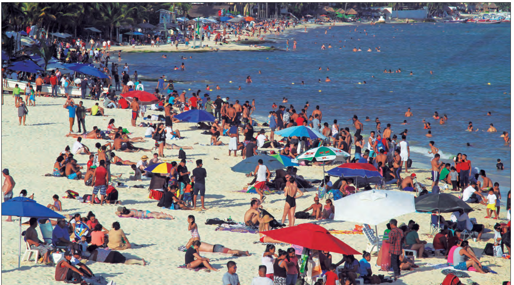
▲ De enero a julio de este año, Quintana Roo ha recibido un millón 74 mil 815 visitantes de Estados Unidos.

Destacó que de abril a julio el CPTQ ha llevado a cabo 49 webinars con prestadores de servicios turísticos, otros destinos y asociaciones, 21 reuniones de negocios con aerolíneas y tour operadores y que crearon una sección de elearning o aprendizaje digital, que es una plataforma de entrenamiento interactivo para los agentes de viajes; está disponible en seis idiomas en el portal https://www.caribemexicano.travel/ .