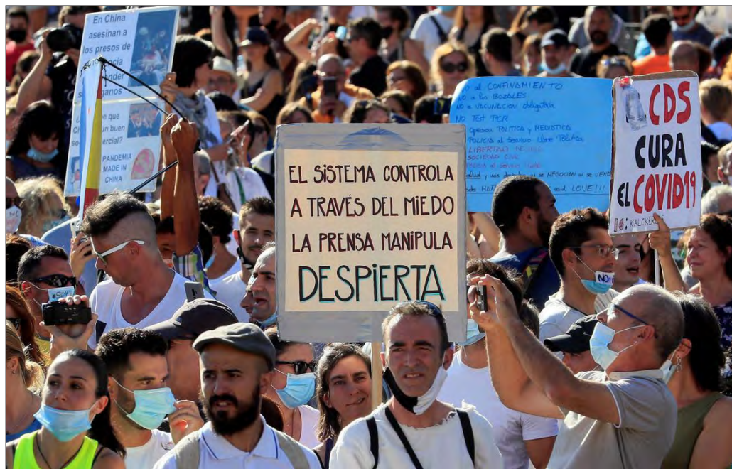
▲ Confundir a la población con mentiras y falacias podría llevar a un recrudecimiento de la pandemia, en especial ante rebrotes como el que está ocurriendo en España.

En las capitales de España y Bélgica se realizaron antier sendas manifestaciones para protestar por la obligatoriedad del uso de cubrebocas, en rechazo al desarrollo de vacunas para prevenir el COVID-19 y en contra de la tecnología 5G, el sistema de telecomunicaciones de nueva generación que está siendo instalado en varios países.