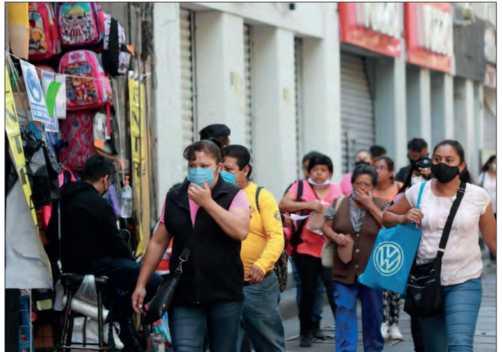
▲ El IMEF calcula que durante 2021 se recuperarán 374 mil 500 empleos con registro ante el IMSS, una tercera parte de los que hasta el momento se han perdido.

Con la presentación del Paquete Económico en puerta, el IMEF subraya la importancia de intentar proyectar un marco fiscal adecuado dada la coyuntura. En el primer semestre del año, el Saldo Histórico de los Requerimientos Financieros del Sector Pú-