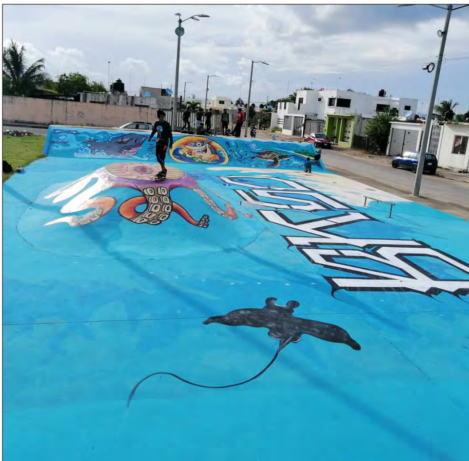
▲ El colectivo Backside realizó murales con graffiti, hasta invirtiendo 9 mil pesos de sus propios bolsillos.