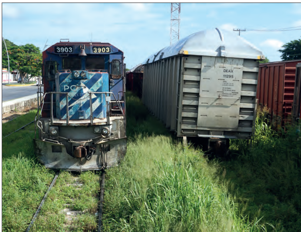
▲ Con el convenio se gestionaría obtener los más de mil plazas de trabajo que el Tren Maya ofrecería en el tramo 3, que va desde Calkiní a Izamal.

"Que el dinero se quede en la región donde se lleva a cabo la obra, no traer gente que se lleve el proyecto", apuntó.