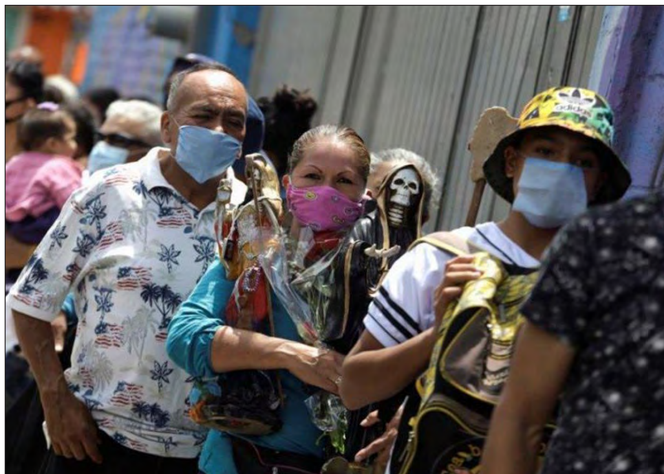
▲ Pese a las medidas sanitarias implementadas, México suma más de 7 mil nuevos casos diarios.

Cuatro países encabezaron la lista con más de 10 mil casos diarios, según los datos de las autoridades nacionales recibidos por la OMS. India reportó más de 65 mil nuevas infecciones diarias, seguida de Brasil, con 60 mil 91; Estados Unidos con 52 mil 799, y Colombia, con 11 mil 286. Las naciones con una carga diaria de casos entre mil y 10 mil se encuentran principalmente en América Latina, Europa y Asia.