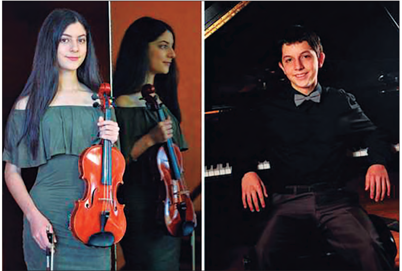
▲ Los jóvenes veracruzanos obtuvieron los primeros lugares en certámenes de Singapur, Londres y Salzburgo.

En el concurso de Singapur, realizado el mes pasado, Aisha interpretó el tercer movimiento del Concierto no. 5 de Mozart; el concierto para violín de Chaikovski, y la Legendé , de Wieniawski; el Enkor lo ganó con el Concierto 5 de Mozart, el no. 2 de Wieniawski y La introducción y Tarantella , de Pablo Sarasate.