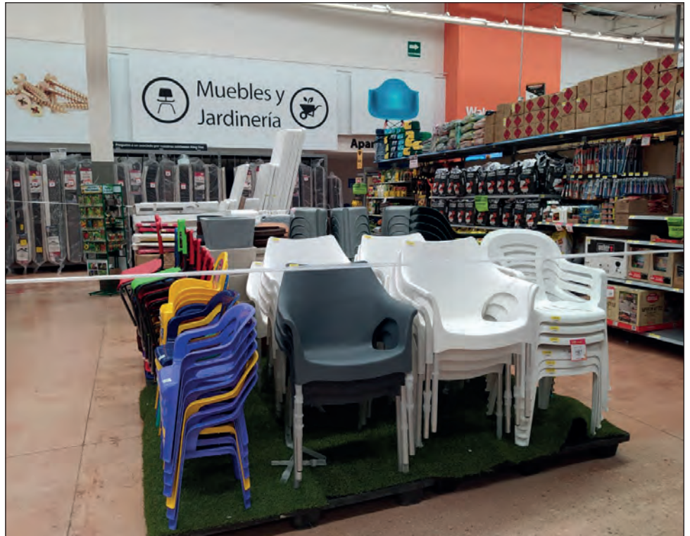
▲ Entre las medidas para evitar contagios está la restricción de venta de artículos “no esenciales” en los supermercados.

El rango de edad de los contagiados oscila entre un mes y 98 años.