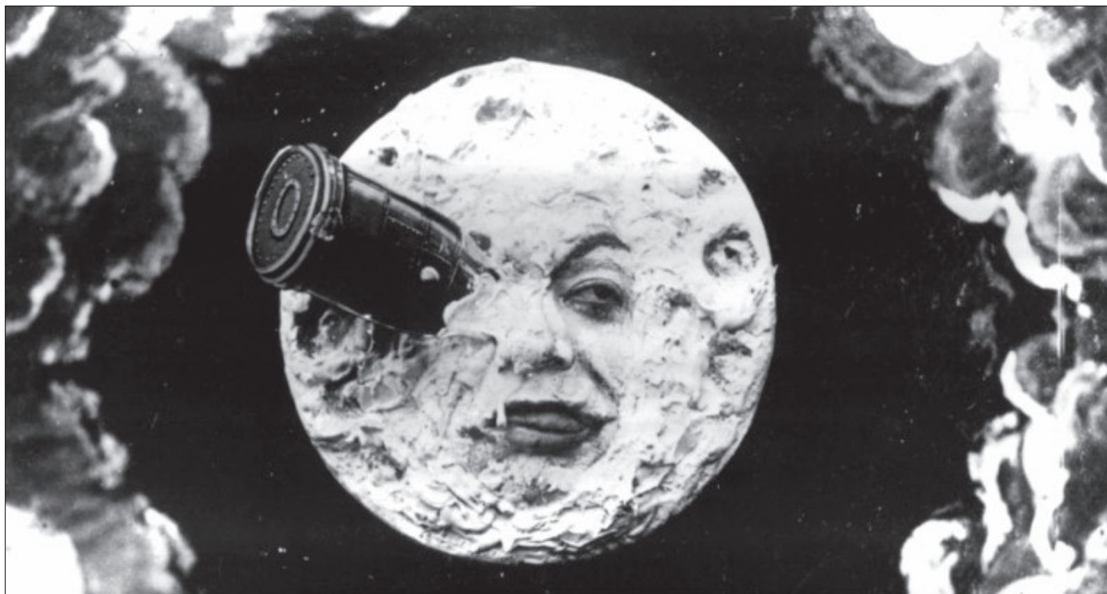
▲ Viaje a la luna es una vibrante muestra del talento creador de Georges Méliès. Fotograma de la película Le Voyage dans la Lune