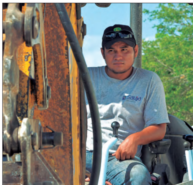
▲ De los 25 mil afiliados a la CROC, el 10% ha perdido el trabajo.

Los más afectados son del ramo de la industria de la construcción. "Si nos ha pegado duro la pandemia", reconoció el líder sindical, quien además dijo que por