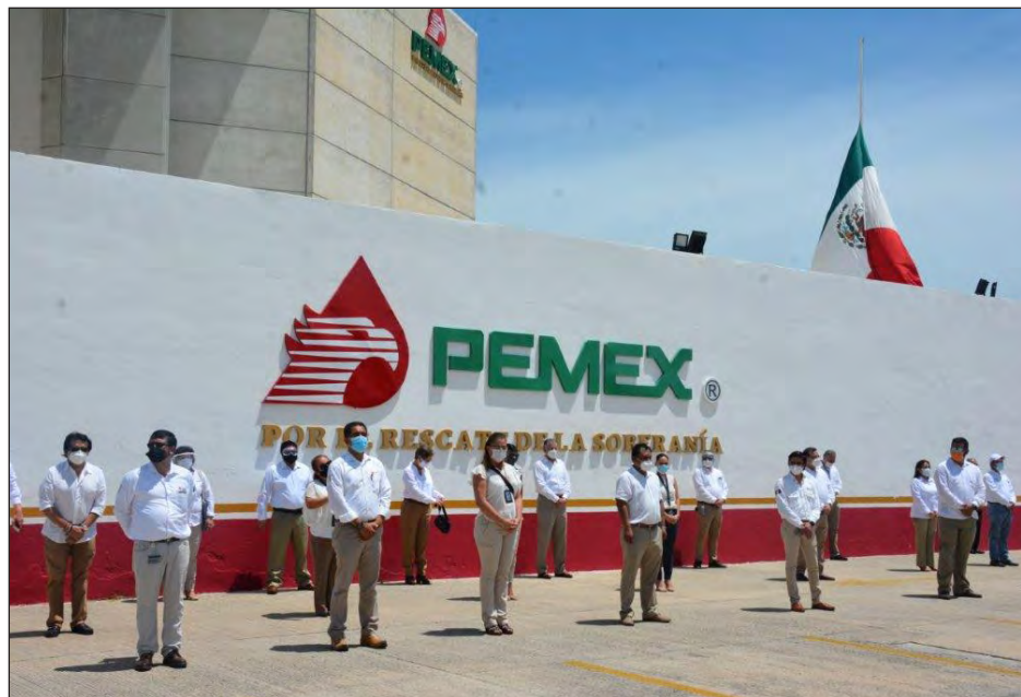
▲ La bandera nacional se mantendrá a media asta durante 30 días, hasta el próximo 11 de septiembre.

Núñez López dio lectura a un mensaje del director general de Pemex, en el que señaló que estas ceremonias se llevan a cabo en cumplimiento al decreto presidencial por el que se