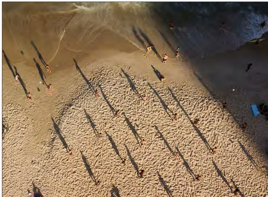
▲ Ante la escasa vigilancia, bañistas ignoran las normas y se aglomeran sin mascarilla en las famosas Copacabana o Ipanema.

El proyecto preveía delimitar espacios individuales