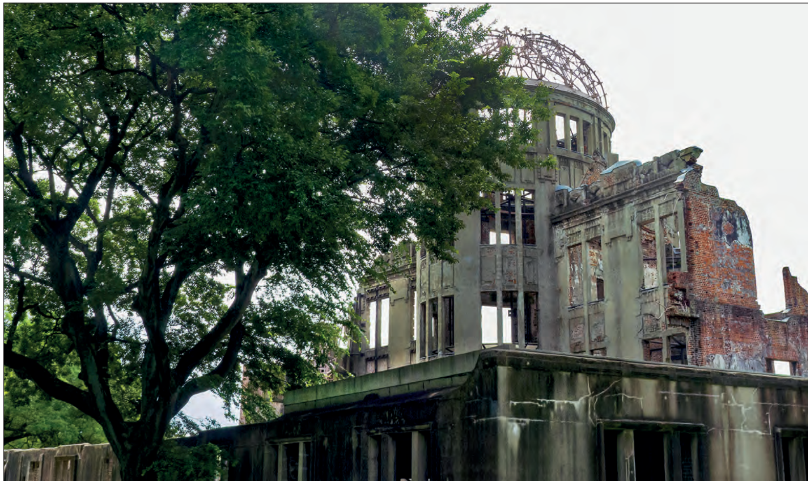
▲ Han pasado 65 años desde el lanzamiento de las bombas atómicas en Hiroshima y Nagasaki por parte de Estados Unidos, sin importarle que la Segunda Guerra Mundial había finalizado y que Japón estaba derrotado.