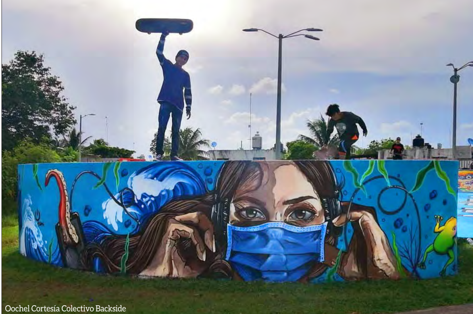
Oochel Cortesía Colectivo Backside

RESCATE DE SKATE PARK MUESTRA LA REALIDAD DE LA JUVENTUD CHETUMALEÑA