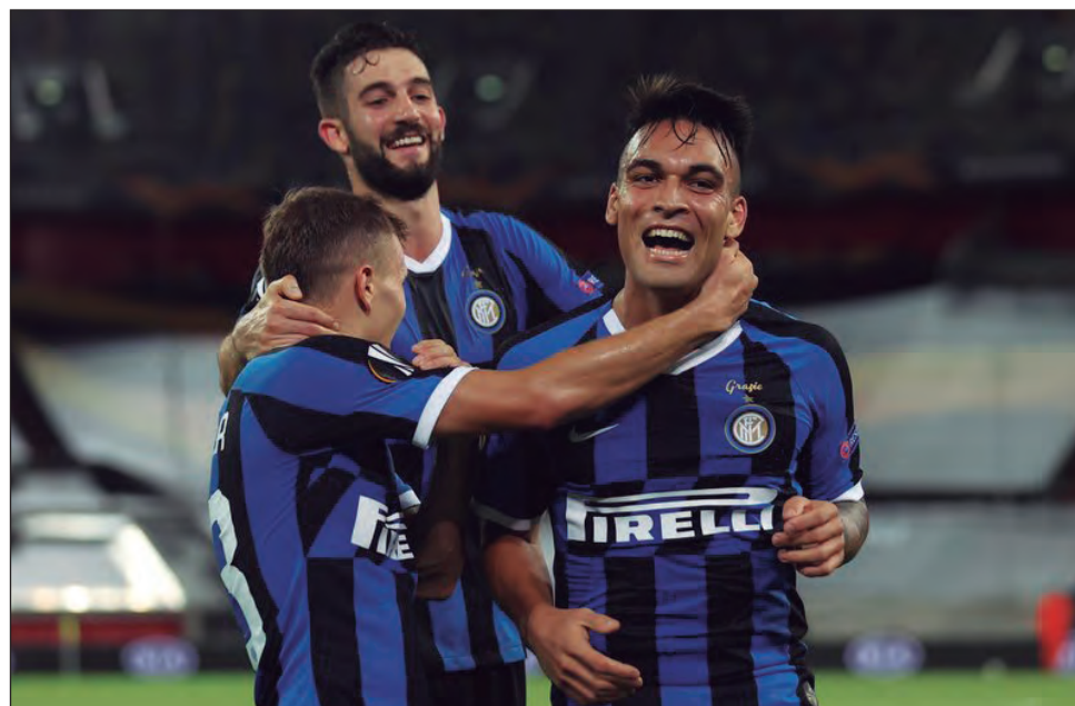
▲ El argentino del Inter de Milán, Lautaro Martínez, celebra con sus compañeros luego de anotar el tercer gol de su equipo ante el Shakhtar Donetsk.

"No quiero hablar de presión, sino de sueños, de jugar una semifinal de Champions ", declaró el mediocampista español Ander Herrera, del PSG. "El club llega a semifinales después de veinticinco