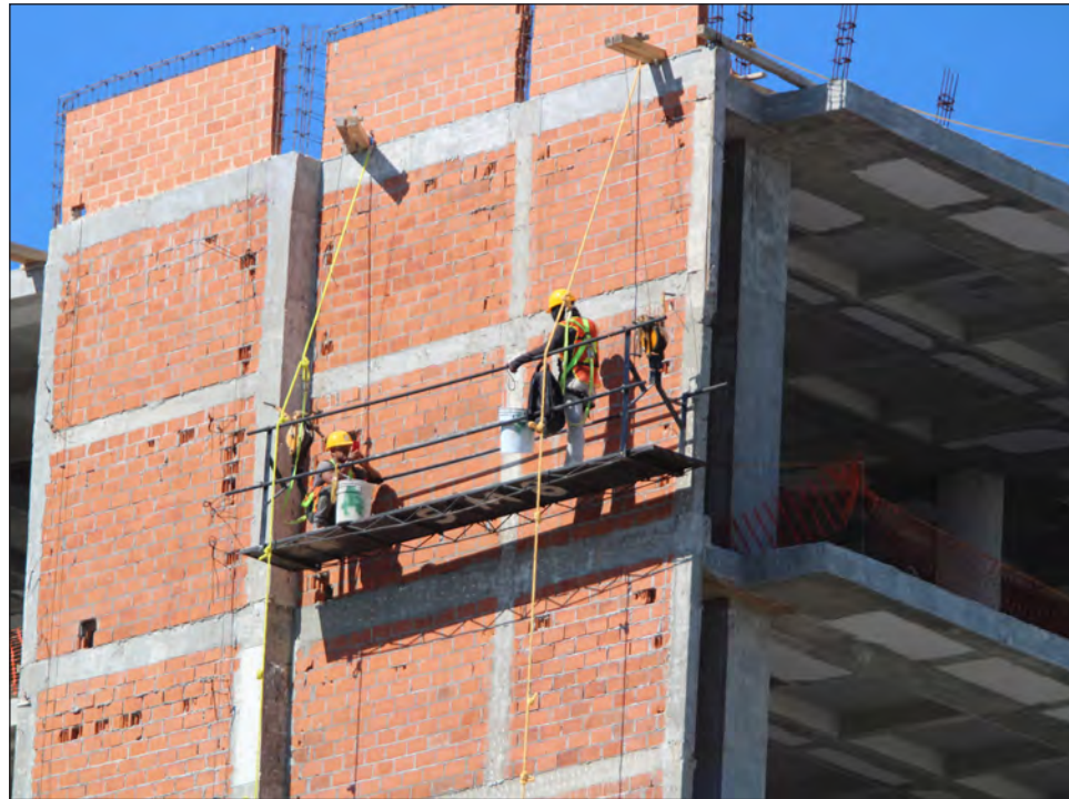
▲ Aunque desde el 1° de junio la construcción es considerada actividad esencial, la obra pública ha sido escasa y 85% de las empresas del ramo depende de ello.

“Estamos sufriendo una falta de inversión de recursos en obra pública progra-