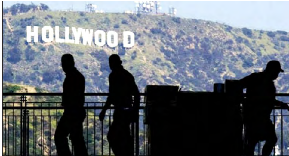
▲ A pesar del crecimiento de otros centros de filmación como el estado de Georgia, muchos cineastas parecen decididos a permanecer en Los Angeles.

Los temores sobre la salud del equipo, la incerti-