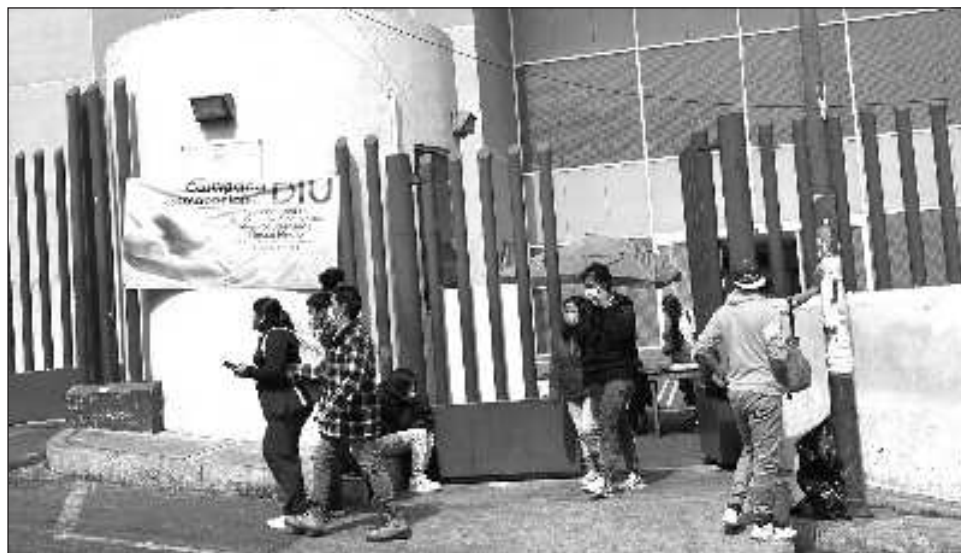
▲ El especialista puntualizó que aunque se registra el ingreso al país de nuevas subvariantes del coronavirus, hasta ahora no tienen la capacidad de provocar cuadros graves de la enfermedad.

El resto de institutos y nosocomios trabajan con normalidad en la atención de los pacientes en las respectivas especialidades, afirmó el también titular de la Comisión Coordinadora de los Institutos Nacionales de Salud y Hospitales de Alta Especialidad y recordó que desde su aparición en el mundo, la transmisión del coronavirus se ha incrementado en verano e invierno.