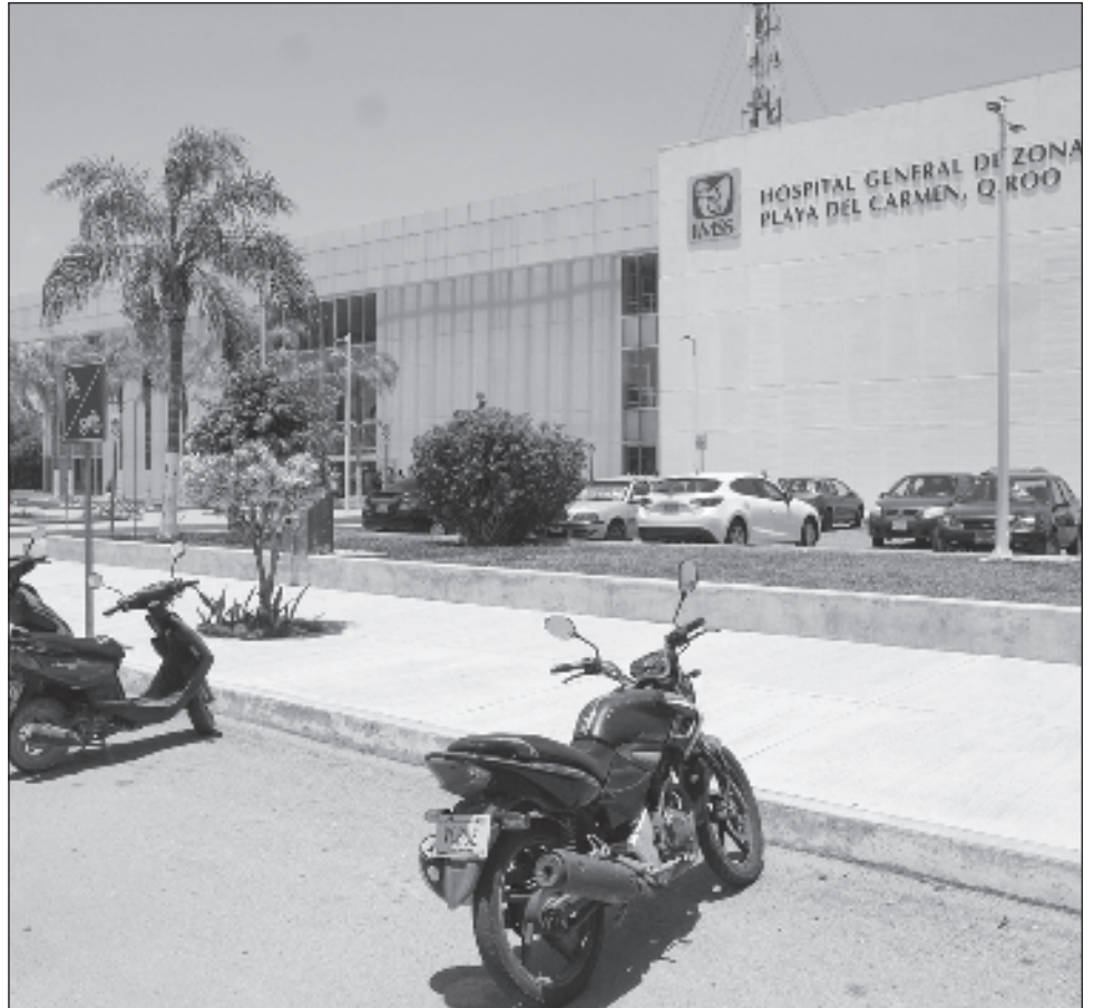
▲ Sitravem era la responsable de dar mantenimiento a los elevadores en el Hospital General de Zona Número 18; Aitana murió en una de estas estructuras el año pasado.

Lo anterior es en cumplimiento a la resolución del procedimiento administrativo de sanción iniciado a la empresa en el expediente PISI-A-NCDS-0008/2024, y por el cual se dictó la resolución 00641/30.15/4186/2024, de fecha 8 de julio de 2024. Además se impuso una multa de la cual no se especifica monto. La sanción entrará en vigor este jueves 18 de julio.