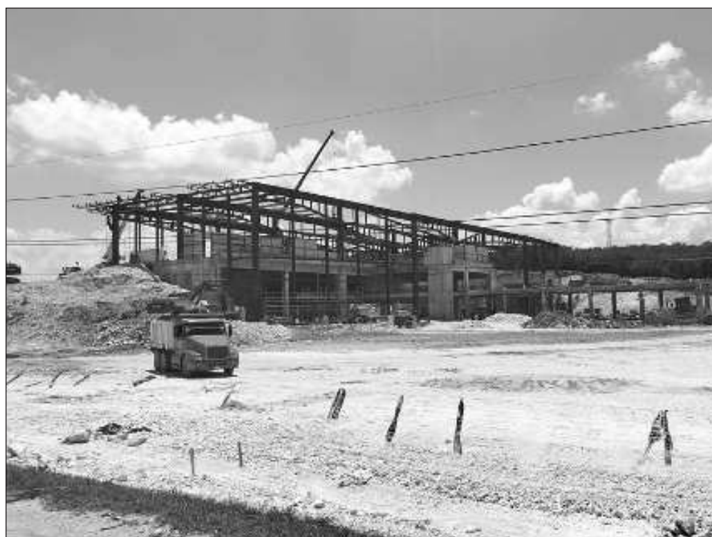
▲ Si en el tramo 3 no halló obstáculos fue porque también existió la visión de que sus efectos, puestos en una balanza, son de mayor beneficio que el perjuicio que puedan causar.

Pensar que se trata solamente de un tren turístico es dejar de ver todas las posibilidades que tiene el Tren Maya. Si en el tramo 3 no halló obstáculos fue porque también existió la visión de que sus efectos, puestos en una balanza, son de mayor beneficio que el perjuicio que puedan causar.