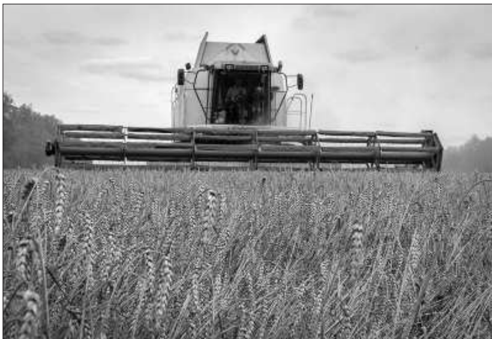
▲ El anuncio de Moscú se produce horas después de que drones navales atacaran el puente que une Rusia con la península anexada de Crimea, clave para transportar suministros a los soldados rusos.

También animaron a los rusos que viajan hacia y desde la península, anexionada por Moscú en 2014, a hacerlo por los territorios ucranios ocupados.