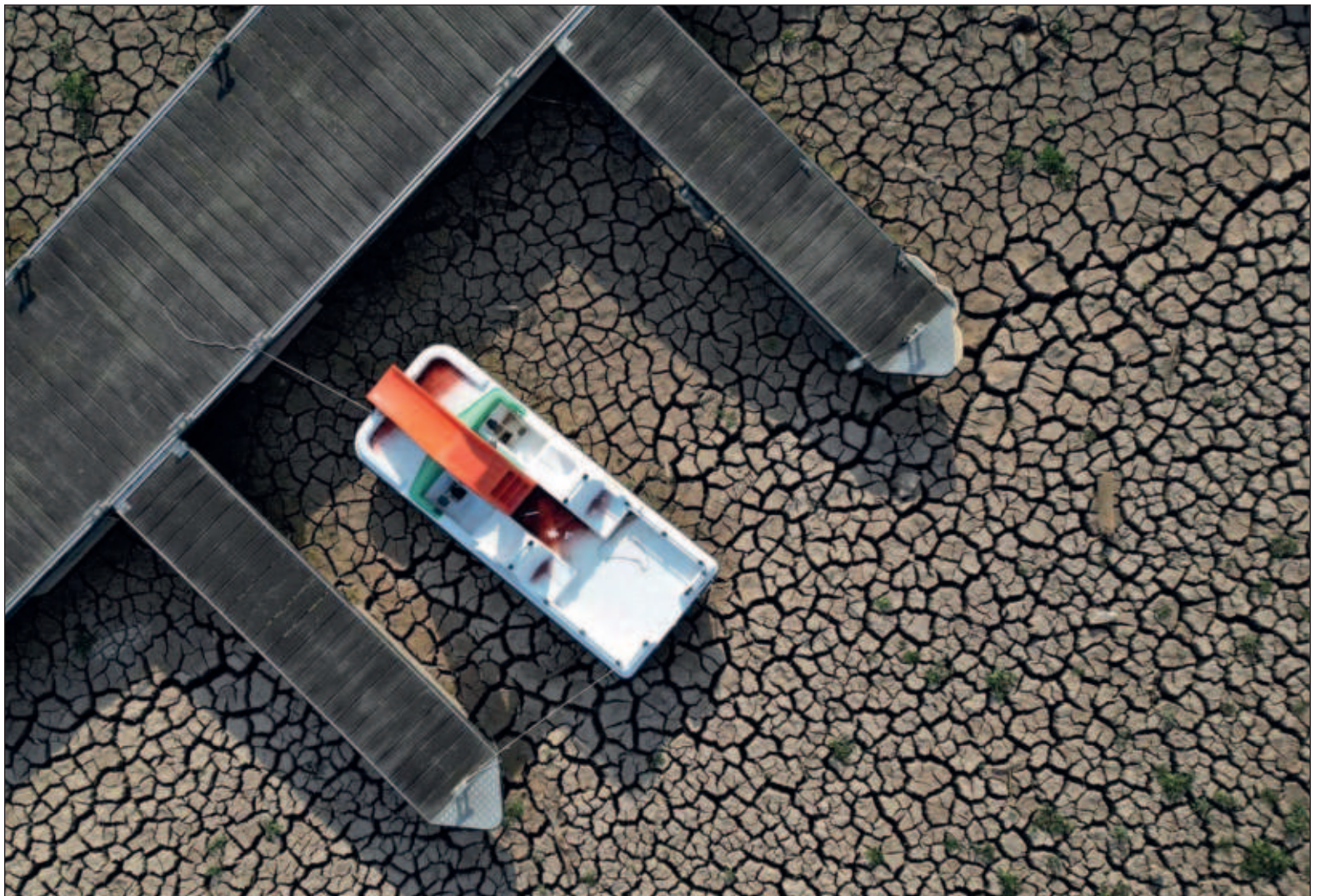
▲ “La vida en el planeta peligra junto a toda la humanidad: más de 1.6 mil millones de personas padecen escasez de agua”.