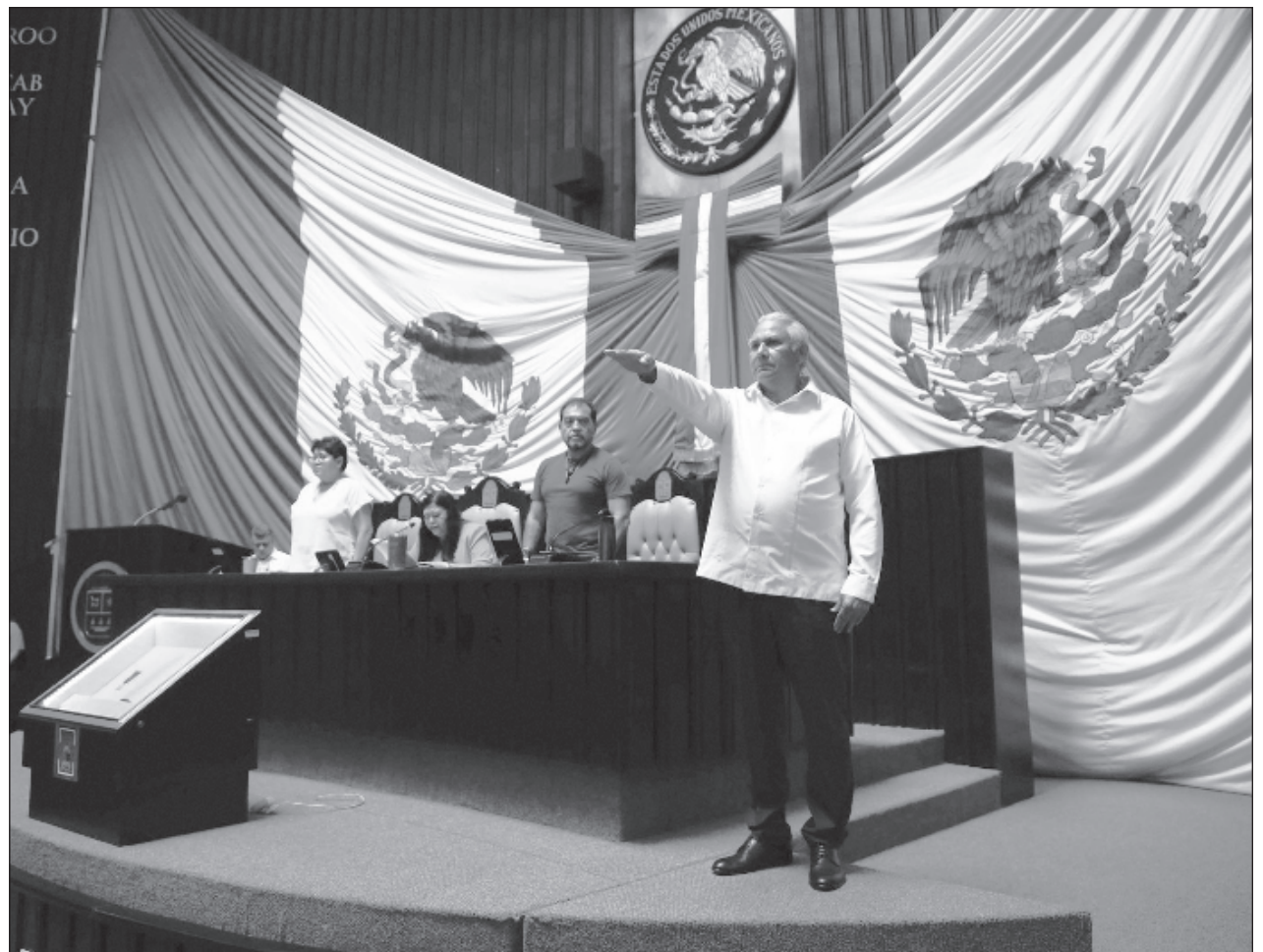
▲ Raciel López ofreció “una profunda reestructuración” de la fiscalía para recuperar la confianza ciudadana: “Habrá seguridad y justicia con sentido humano,” aseguró el funcionario.

“Quintana Roo tendrá un fiscal de pocas palabras, sereno y prudente, habrá seguridad y justicia con sentido humano. Con seguridad y justicia hay inversión, desarrollo y armonía”, señaló López Salazar y aseguró que en él tendrán a alguien que verá por la seguridad de las familias y evitará la inseguridad en espacios públicos.