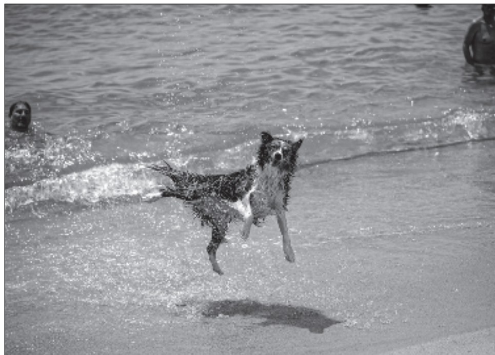
▲ En España, que ya vivió una semana sofocante, la agencia meteorológica emitió una alerta naranja para el lunes, con "temperaturas inusualmente altas".

En España, que ya vivió una semana sofocante, la agencia meteorológica emitió una alerta naranja para el lunes, con "temperaturas inusualmente altas", de entre 38