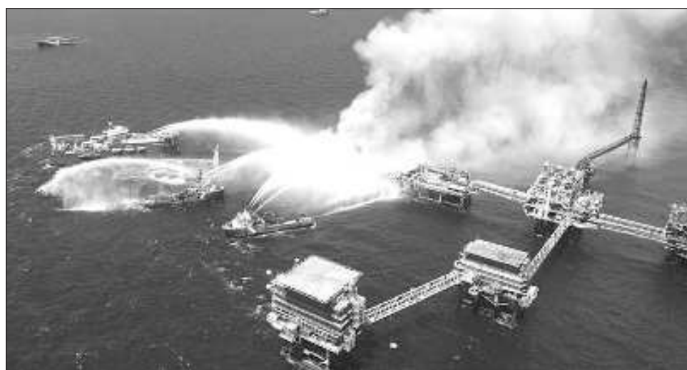
▲ Uno de los parámetros que toman en consideración las evaluadoras internacionales, es el factor de accidentes, pérdidas humanas, lesiones, horas-hombre perdidas, entre otras particularidades.

De acuerdo con la calificadora, Pemex redujo de la calificación "BB-" a "B+", "cuatro escalones por debajo de la puntuación soberana, con un alto grado de especulación de inversión y con perspectiva negativa", lo cual de acuerdo con el informe presentado, refleja el impacto ambiental y social, derivado de múltiples acci-