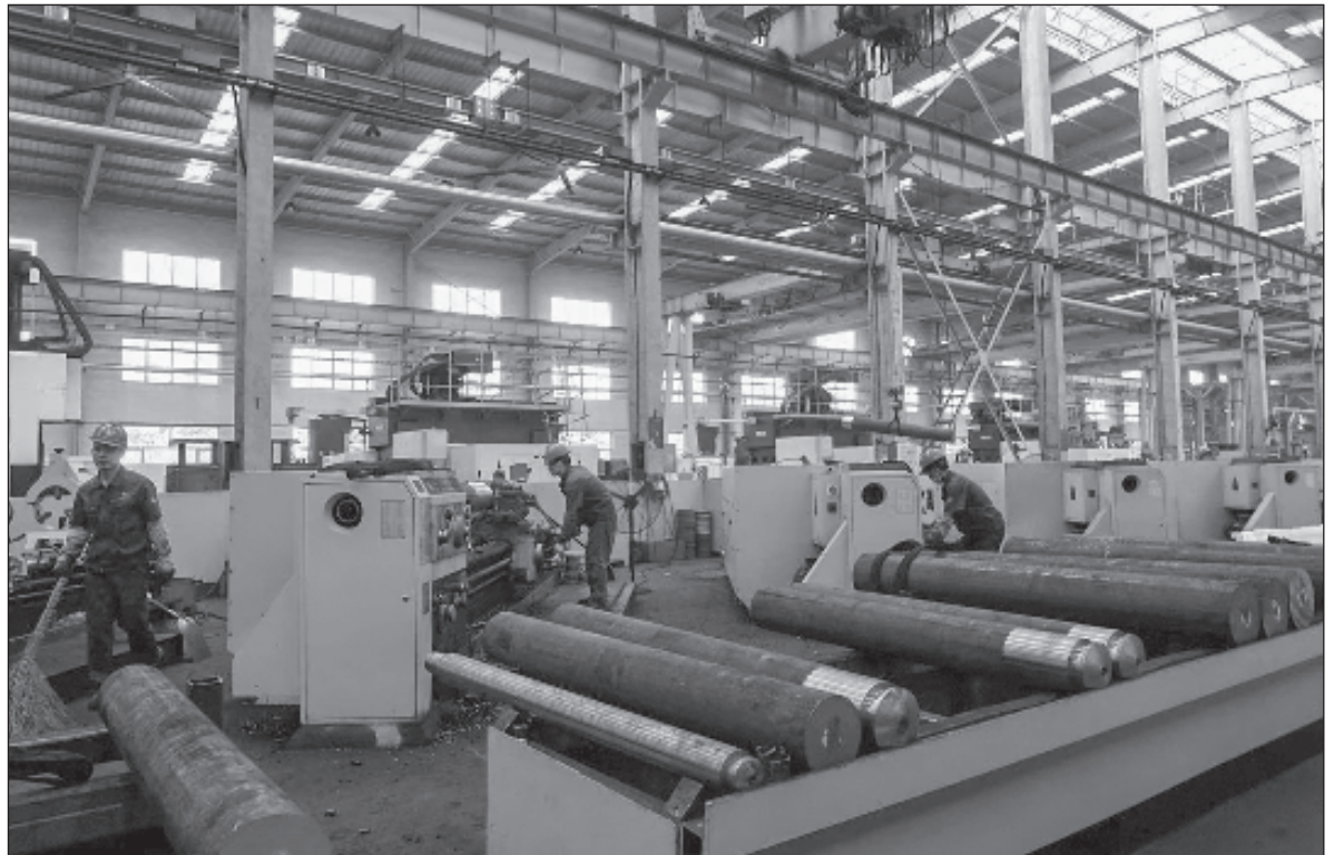
▲ "For years China felt increasingly confident with the West, comfortable with Western dependency on its industrial base for the consumer goods sought by its citizens and its banking system dependent on China's enormous holdings of US debt".

THIS LED TO the creation of new chip manufacturing facilities in India, South Korea, and the continental US - thus breaking the China's near-monopoly over this strategic product. The new reality is regionalization of production of strategic products so that no one government controls supply chains.