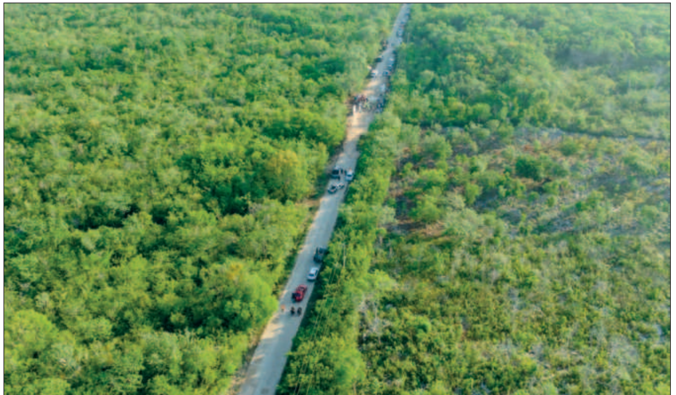
▲ La construcción del Tren Maya en la zona lleva un avance de 80 por ciento.