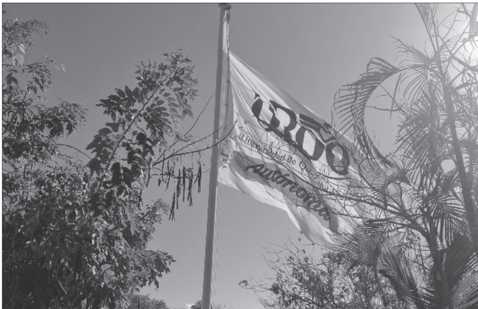
▲ “El papel eficaz de la persona que ocupa una rectoría no depende solamente de sus credenciales académicas, también influye su experiencia y habilidades políticas, pero en el buen sentido de la palabra (...) Con la misma lógica, no debería haber rectores sólo con credenciales políticas”.