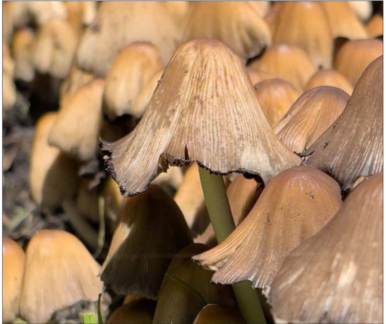
▲ Yaan xaak'alo'ob ts'o'ok u yáax beeta'al ti'al u yila'al bix je'el u yutstal u meyaj ti' máak ti'al ts'akikubáaj.

Tu winalil febrero túune, Australiae' tu jeel jatsaj ba'ax yaan ichil le ka'ap'éel kuuxumo', tu jo'oloy beeta'ak le éensayoso' tumen Agencia