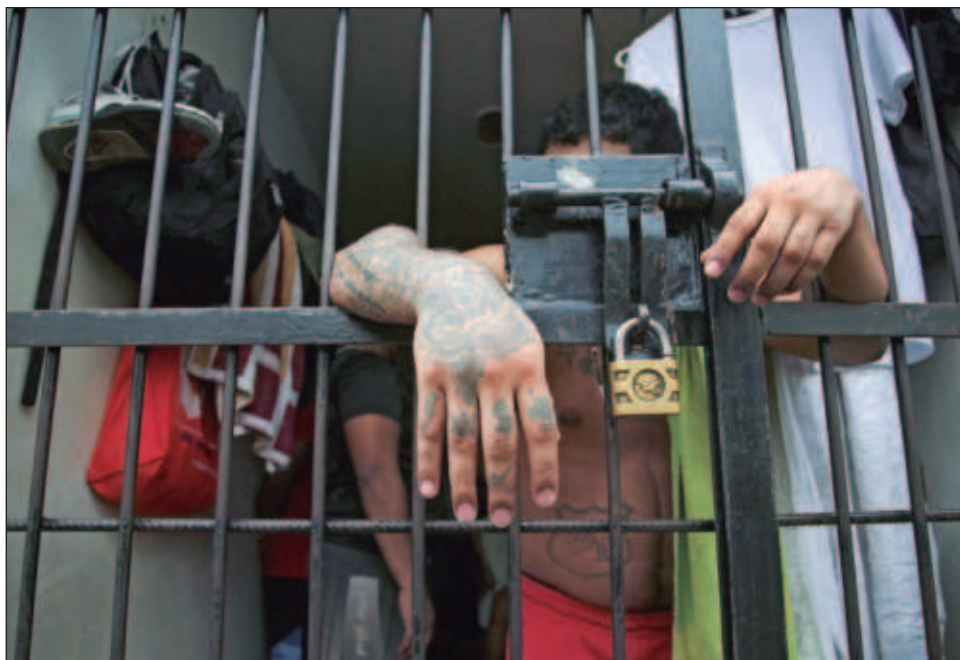
▲ El occiso fue detenido por encontrarse en estado de ebriedad y dormir en la vía pública, y también por portar un artefacto punzocortante.

La SSP indicó a través de un comunicado que dio aviso a la Fiscalía General del Estado (FGE) y puso a su disposición la unidad policial y a su tripulación para las diligencias de ley y el respectivo deslinde de responsabilidades.