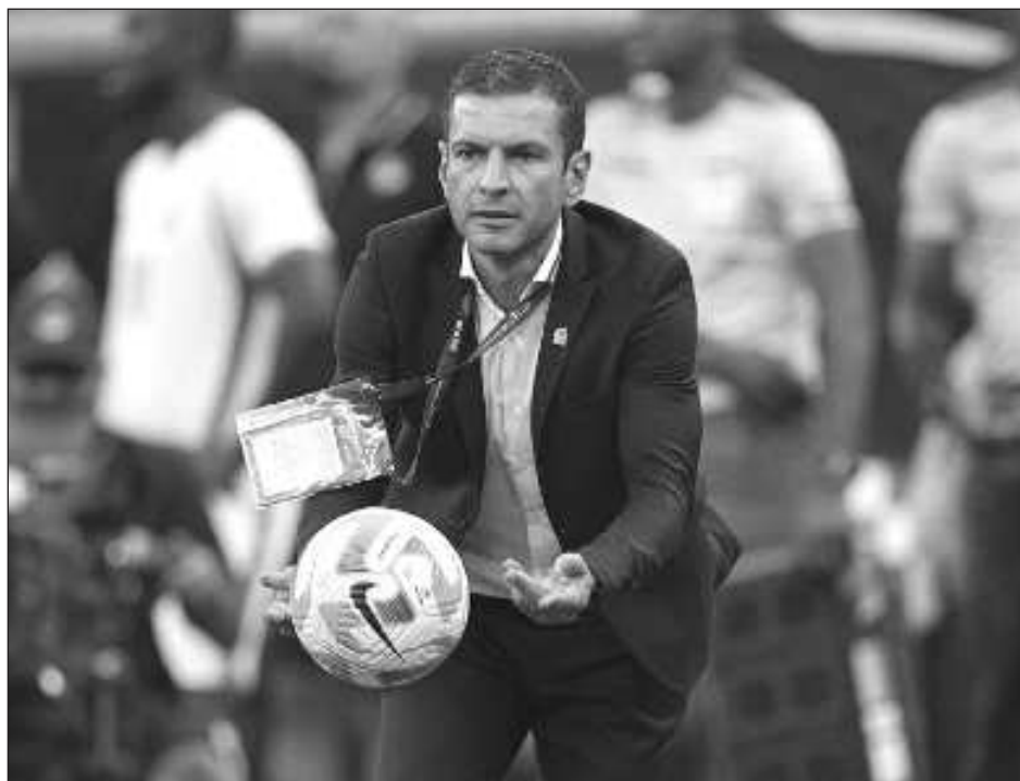
▲ La selección de Jaime Lozano conquistó la Copa Oro y lo hizo jugando bien.

Recién el viernes pasado, el presidente ejecutivo de la Federación Mexicana de Fútbol, Ivar Sisniega, advirtió que los buenos resultados del Tricolor no le garantizaban la continuidad a Lozano. Dijo que acabando el torneo iniciarían un proceso para elegir a un nuevo seleccionador