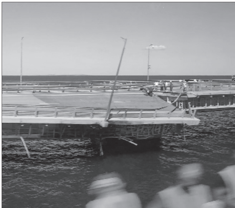
▲ El Puente de Kerch es un vistoso símbolo de las reclamaciones de Moscú sobre Crimea y una conexión importante a la península, que Rusia capturó de Ucrania en 2014.

El tráfico de vehículos en el puente se detuvo el lunes, mientras que el tráfico