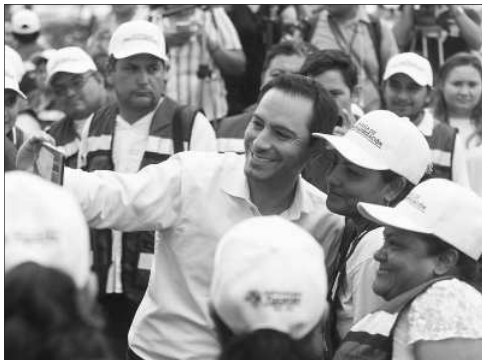
▲ El gobernador también tendrá reuniones con diplomáticos de la embajada de México en China, así como con ejecutivos y directivos de los principales grupos chinos de generación de energía.

Durante esta misión comercial, el gobernador también tendrá reuniones