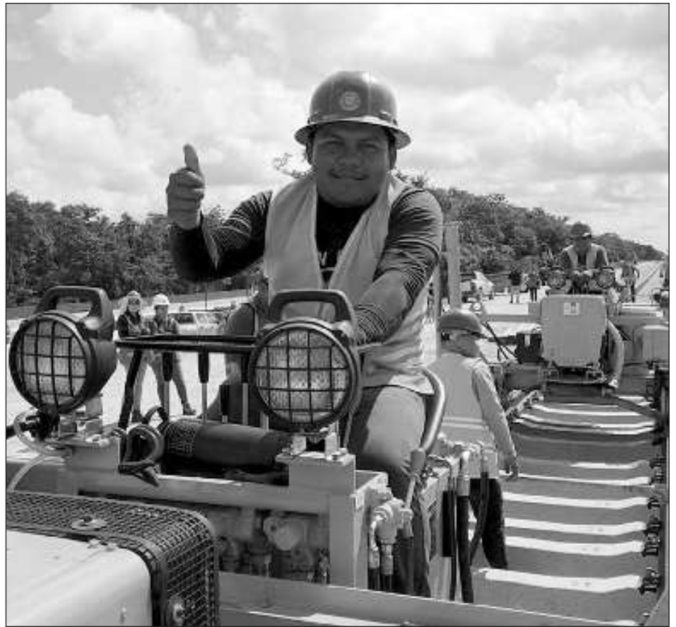
▲ Las estaciones de Mérida e Izamal están en 71 y 60% de avance, respectivamente.

Para realizar el trámite es necesario contar con acta de nacimiento de Estados Unidos o certificado de naturalización así como una fotografía a color para Pasaporte Americano .