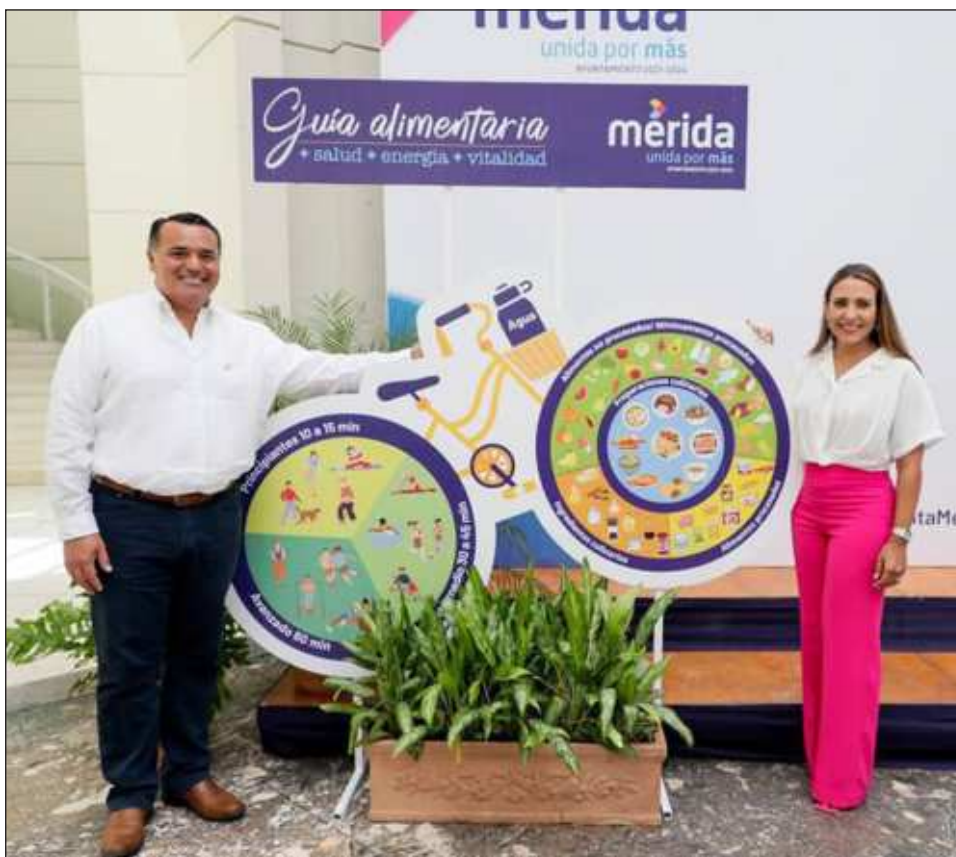
▲ La Guía Alimentaria + Salud + Energía + Vitalidad se basa en tres ejes principales: alimentación, consumo de agua y ejercicio físico.

La primera Guía Alimentaria basada en alimentos, consumo de agua y ejercicio físico de la Ciudad de Mérida, es resultado de investigaciones realizadas a través del proyecto Ciudades Cambiando la Diabetes en la zona urbana del municipio.