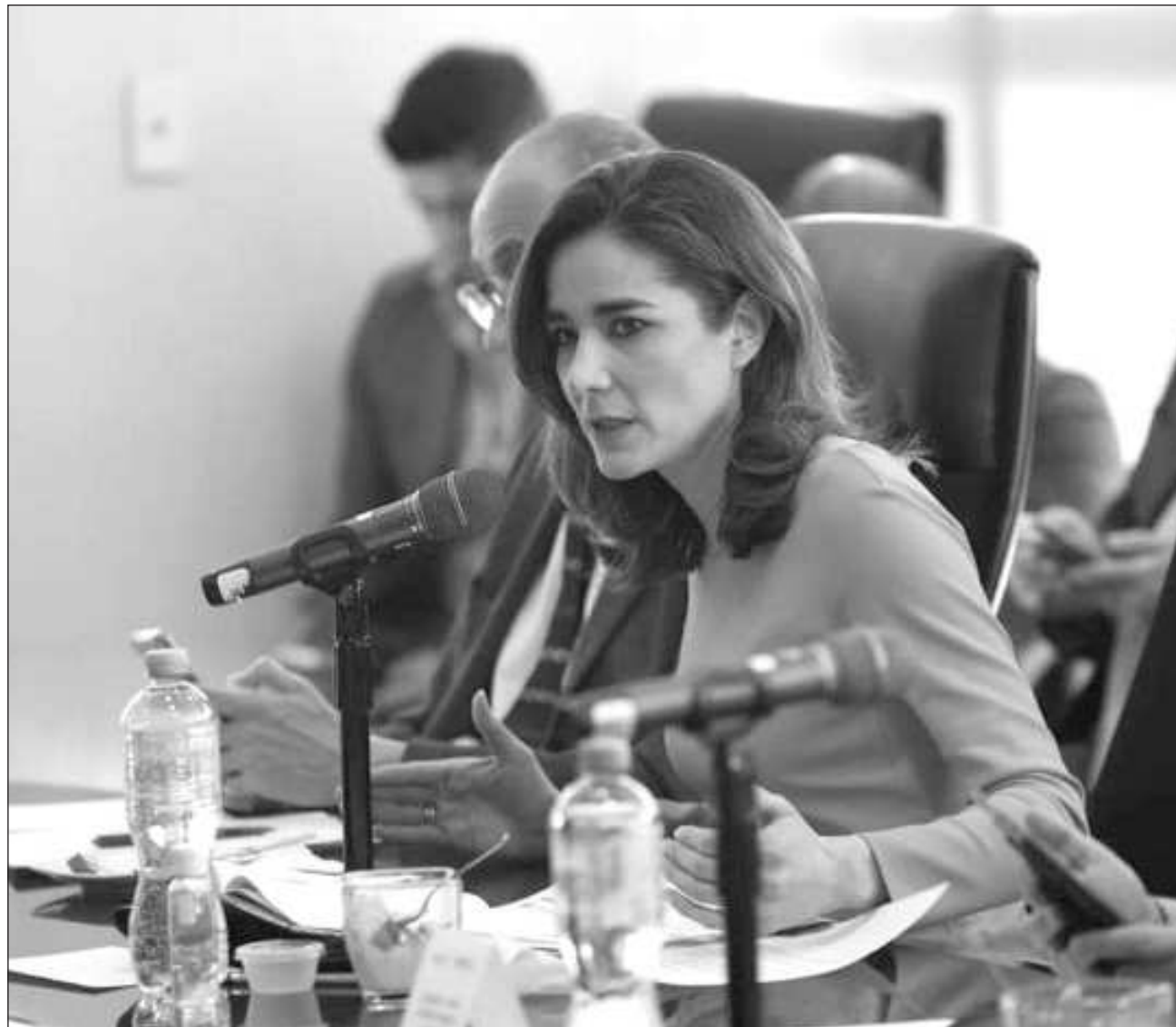
▲ La consejera Ravel Cuevas puntualizó que el INE ha sido consistente en tratar de evitar expresiones de mandatarios contra aspirantes y partidos políticos o alianzas, y “seguimos haciendo nuestro trabajo, dictamos medidas cautelares”.

Sobre las restricciones que emitió la Comisión de Quejas del INE respecto a las asambleas de las corcholatas , comentó que si hay actos anticipados de precampaña, el Tribunal Electoral del Poder Judicial de la Federación (TEPJF) es quien debe determinarlo.