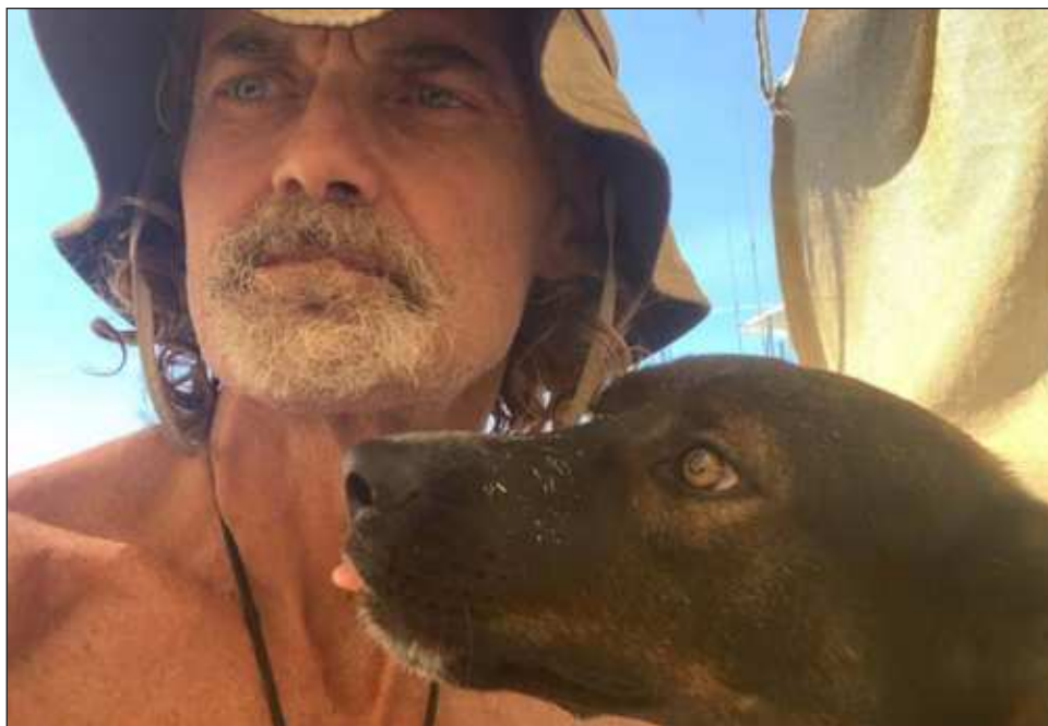
▲ El mariner y Bella partieron en abril de la ciudad costera mexicana de La Paz con destino a la Polinesia Francesa, pero una fuerte tormenta dañó la embarcación.