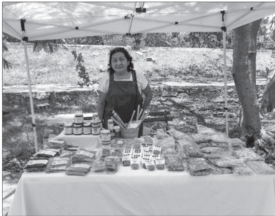
▲ El Mercado Riqueza Local, ubicado en el Parque Gonzalo Guerrero, ofrece productos como carne de una finca que promueve la responsabilidad social, hortalizas de una huerta que usa semillas silvestres, así como repostería gluten free y sin conservadores.

Aquí se ofrece carne de una finca que promueve la responsabilidad social, hortalizas de una huerta que usa semillas silvestres, repostería gluten free y sin conservadores o alimentos