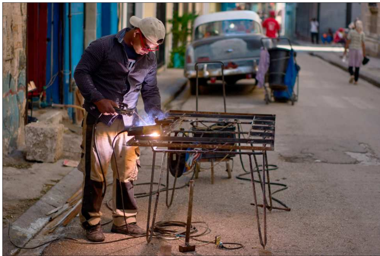
▲ La Presidenta dijo que cuando hay conquistas del pueblo, estos “resisten por su libertad, que no es la del mercado”.

La Presidenta reiteró en este contexto que la ultrade-