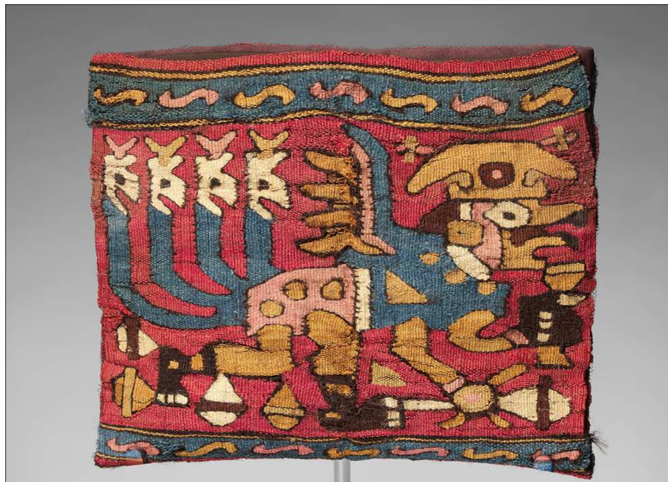
▲ La exposición que se presenta en Nueva York nace de un intercambio entre curadoras del museo expertas en las artes y cultura europea y latinoamericana, donde descubren y crean un diálogo entre estos mundos.