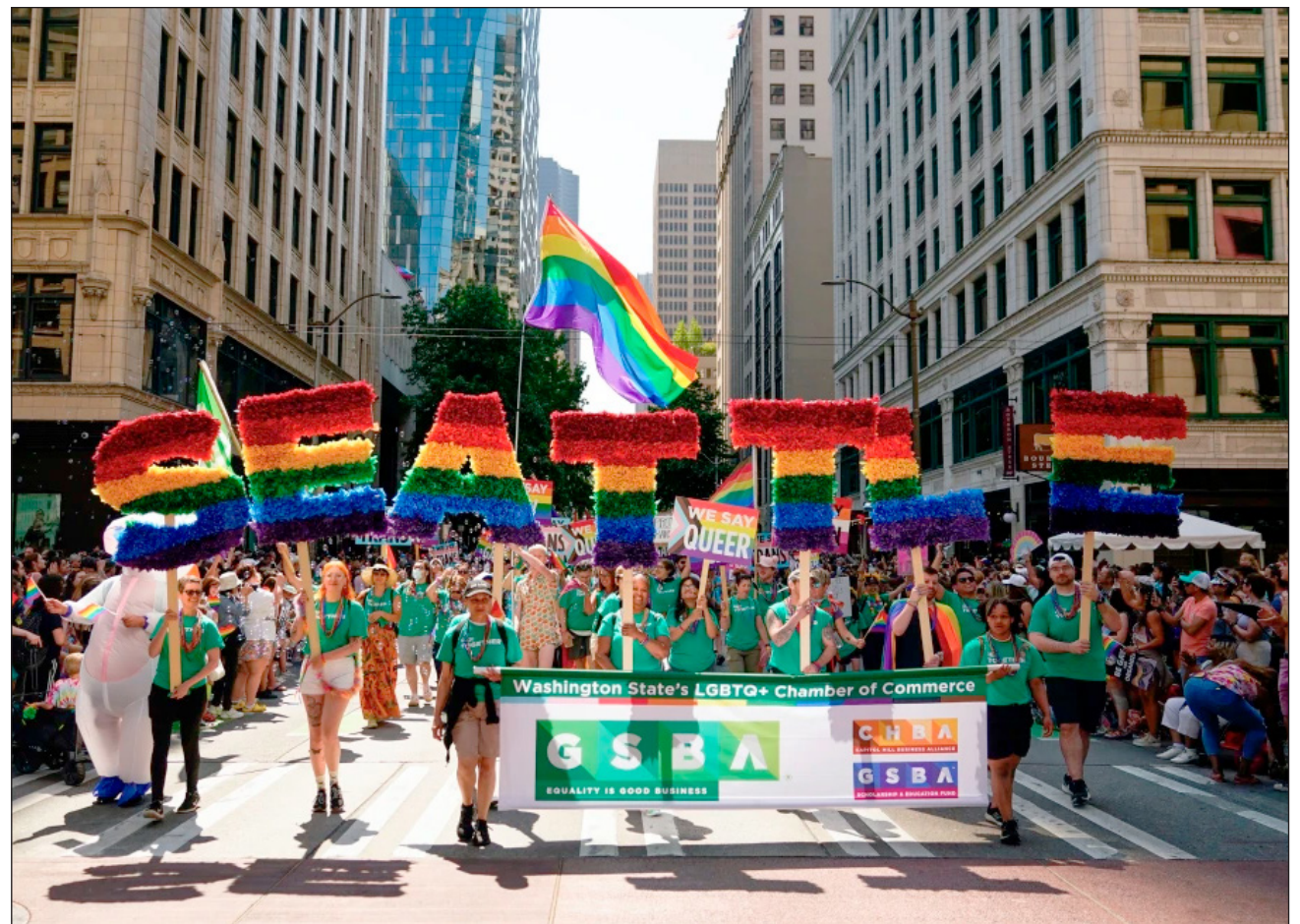
▲ En Irán, las relaciones entre personas del mismo sexo son ilegales, mientras que Egipto ha detenido y procesado a gays y lesbianas basándose en vagas leyes de indecencia, y ha reprimido cualquier expresión pública del Orgullo.

Ambos países presentaron quejas ante la FIFA en diciembre. La federación de fútbol de Egipto afirmó que