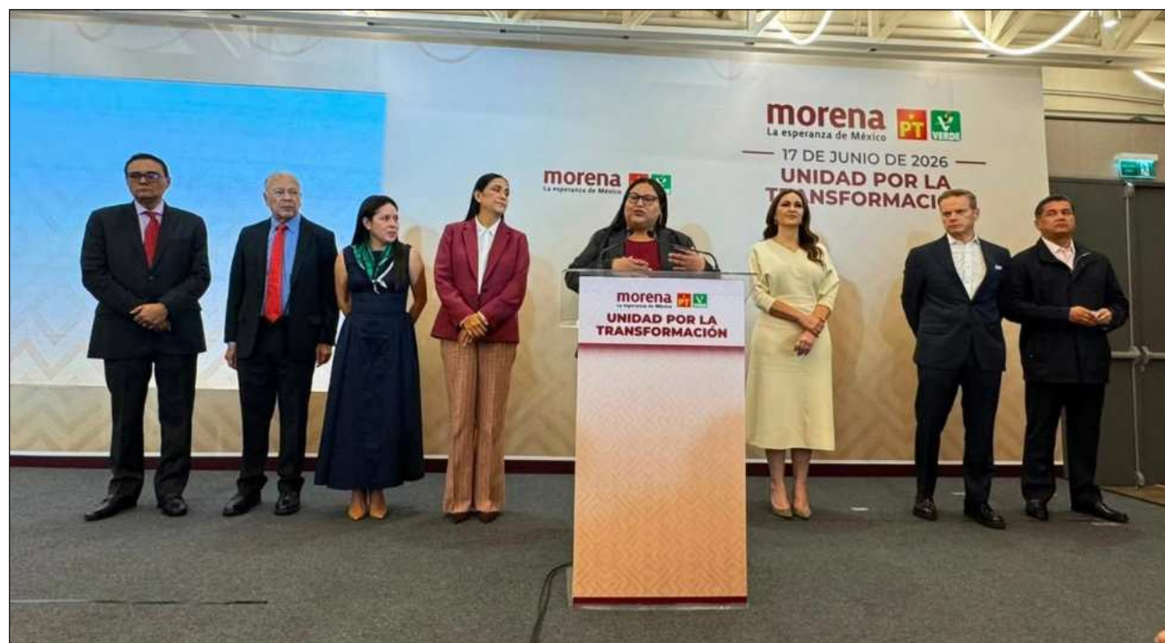
▲ La líder nacional morenista sostuvo que hay una imperiosa necesidad de seguir transformando, de defender los logros de la 4T y la soberanía del país; los líderes partidistas adelantaron que la encuesta final debe incluir máximo seis perfiles.

Los interesados podrán anotarse hasta el 27 de junio, excepto el día 24 porque juega el tricolor