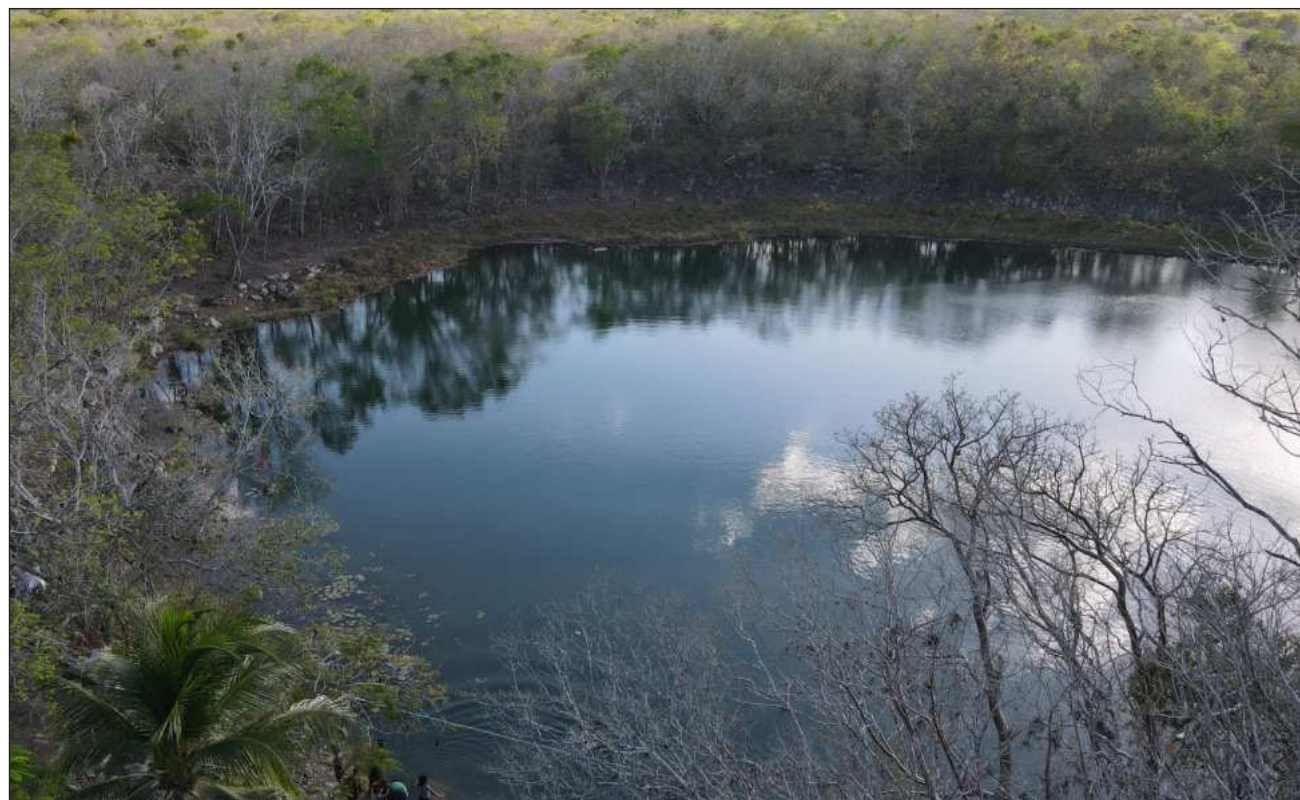
▲ La comunidad de Homún es epicentro de dos casos: uno de ellos involucra la instalación de una granja porcícola, mientras que el otro busca el reconocimiento del Anillo de Cenotes como sujeto de derechos, meta que también persiguen los habitantes de Hopelchén, en Campeche, para proteger a las abejas de amenazas como monocultivos y deforestación.

“No podemos tener esta tranquilidad al ver que no hay cerdos, no podemos estar tranquilos solamente porque todo está en calma, necesitamos tener la resolución definitiva para que nos respalde y sintamos al mismo tiempo que nuestra comunidad está a salvo de esta granja, pero también es importante pensar que no la