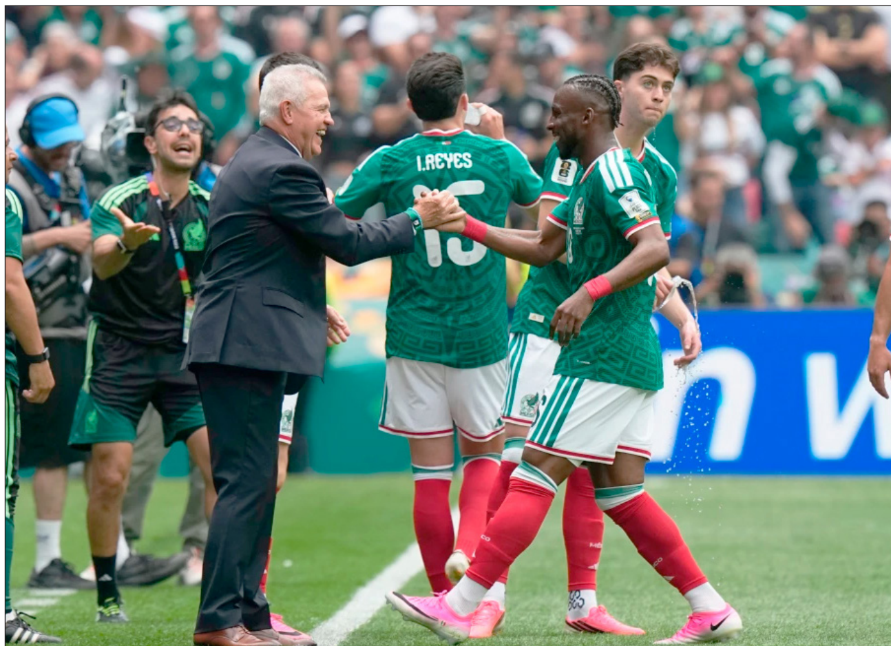
▲ Al jugar en casa, la meta es emular lo hecho en 1970 y 1986, cuando alcanzaron los cuartos de final.

Debido al nuevo formato de 48 países, México necesitaría llegar a un sexto encuentro para igualar esa marca.