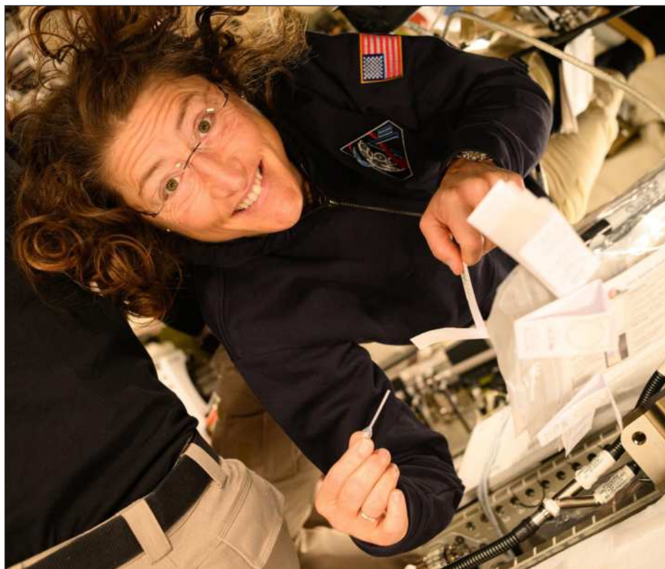
▲ La astronauta, de 47 años, se apoyó en “un amplio trabajo colectivo, cuya ejemplaridad se proyecta a todos a través del mensaje de la misión espacial Artemis II: ‘Tierra, son un equipo’”.

Su trayectoria es “una inspiración para futuras generaciones –sobre todo de mujeres– y un símbolo de la capacidad humana para superar retos y desafíos a través del trabajo, la colaboración y