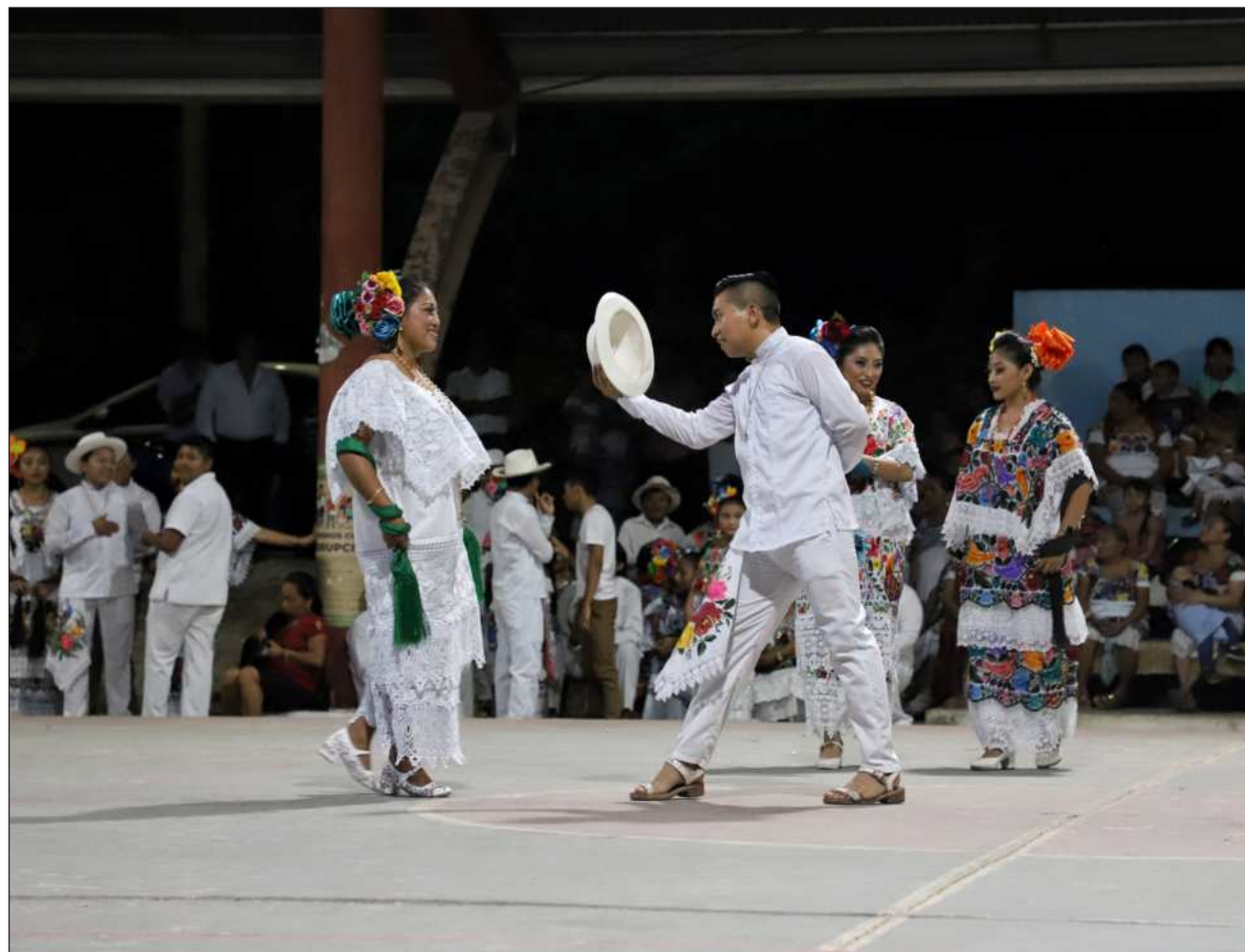
▲ La maestra y promotora cultural subrayó que “necesitamos más personas que se unan para enfocarse en promover Tulum desde sus raíces”, destacando que el municipio “se escucha, se lee y se habla en maya”.

La maestra señaló que apostar por Tulum implica mostrar al mundo no solo sus atractivos naturales, sino también el legado cultural que ha sido transmi-