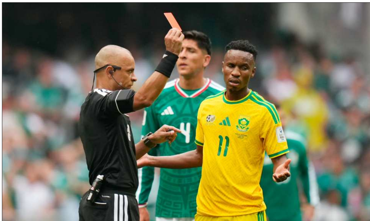
▲ Las expulsiones en las Copas del Mundo acarrearán al infractor una suspensión automática de un partido, pero en caso de juego anti deportivo, la comisión disciplinaria de la Federación Internacional puede ampliar las sanciones.