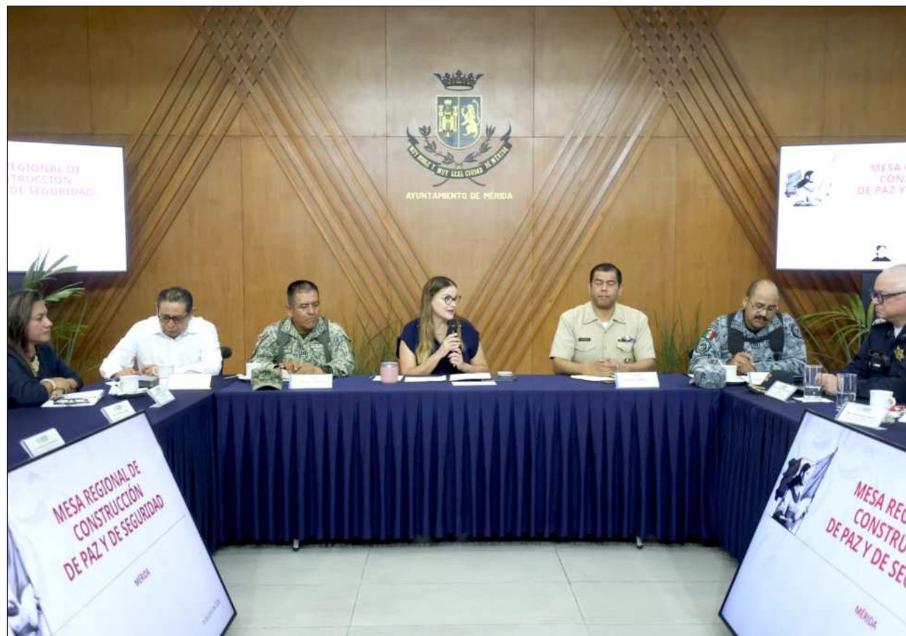
▲ La presidenta municipal, Cecilia Patrón Laviada, destacó que el compromiso, la disciplina y la cercanía con la ciudadanía son fundamentales para mantener a Mérida como una ciudad segura.

Reiteró que su administración continuará fortaleciendo las condiciones laborales y operativas de la corporación mediante mejores instalaciones, equipamiento y capacitación constante en temas como derechos humanos, vialidad, prevención de fraudes y extorsiones, delitos cibernéticos, inclusión e