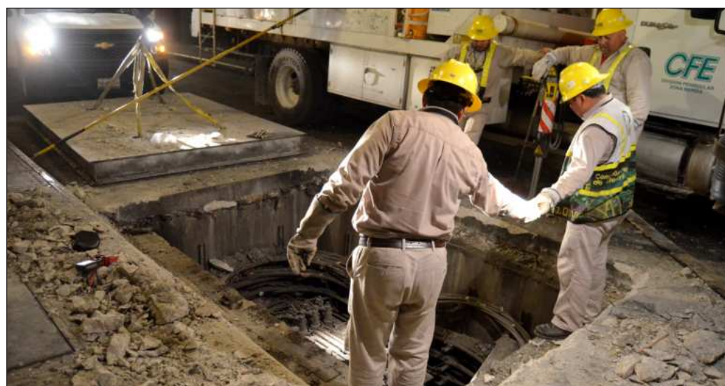
▲ Tendría que reconocerse que hay un problema enorme en la red de distribución, algo que es sabido desde hace tiempo, pero la CFE ha preferido concentrarse en la producción.

Los números siguen ahí. En Ciudad del Carmen se contaron 16 apagones en diferentes colonias este martes. De hacerse el ejercicio en Mérida, Campeche, Cancún y Chetumal, tendría que reconocerse que hay un problema enorme en la red de distribución, algo que es sabido desde hace tiempo, pero la CFE ha preferido concentrarse en la producción. Queda por ver si el excedente energético que se consiga no termina por colapsar la red peninsular, alimentando la idea de que México vive el surrealismo.