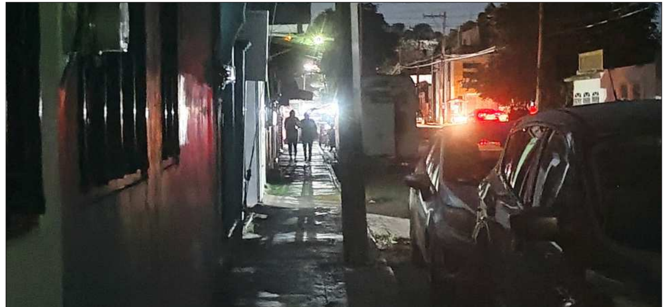
▲ La causa que lleva a que este problema se incremente en esta temporada de calor es que no existe la planeación de mantenimiento preventivo a las líneas de conducción y a los transformadores.

Tan sólo en lo que va del presente año, se han registrado ocho bloqueos a calles, avenidas y a la carretera federal 180, en distintos tramos, acusando el mal servicio que brinda la CFE en el suministro de energía, generando frecuentes fallas e interrup-