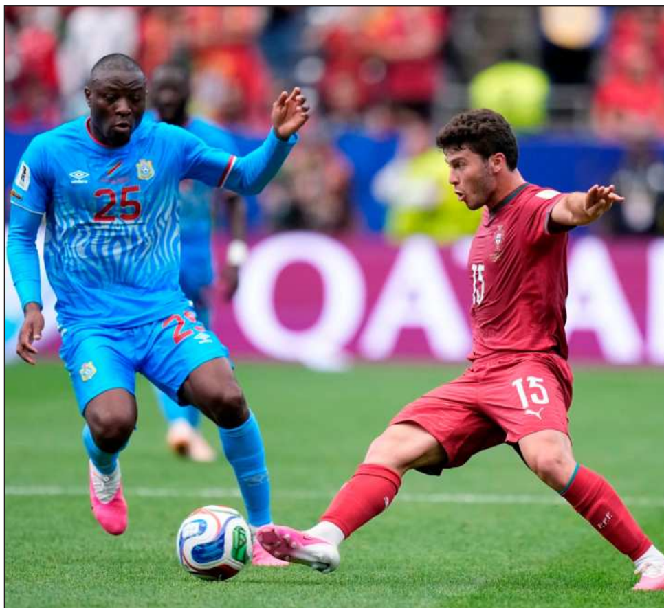
▲ La selección portuguesa parecía haberse adelantado en el marcador en el minuto 55 con una espectacular anotación de chilena de João Cancelo, sin embargo, la anotación fue anulada porque el árbitro marcó la jugada como fuera de lugar.

Ronaldo se convirtió en el jugador de campo de mayor edad en ser titular en un partido de la Copa del Mundo, superando el récord establecido hace cuatro años por el centrocampista canadiense Atiba