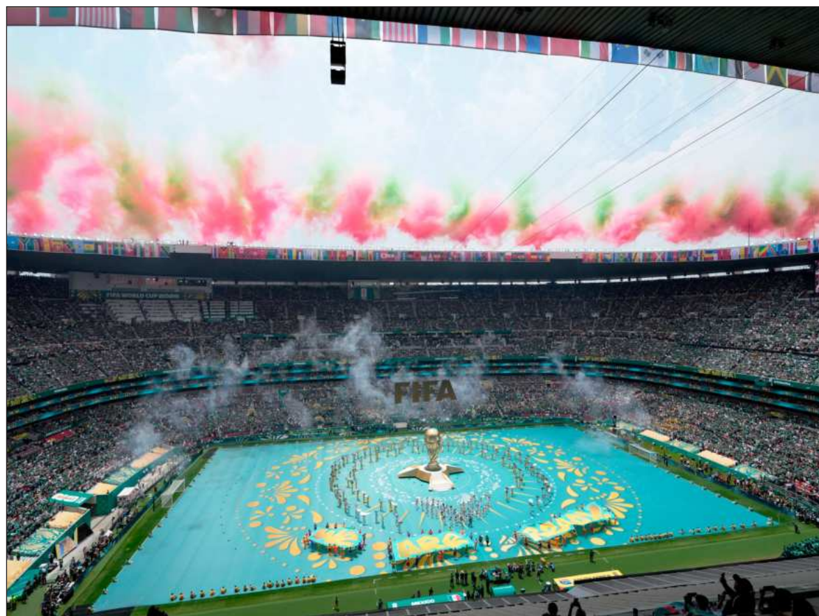
▲ "A este mundial desmedido se espera que lleguen 7.38 millones de espectadores, y que se incremente la contaminación con la apabullante cantidad de prendas deportivas confeccionadas para la ocasión".

Pero para Boeing, una mega empresa multinacional, con sede en Estados Unidos, que fabrica y vende satélites, aviones, helicóp-