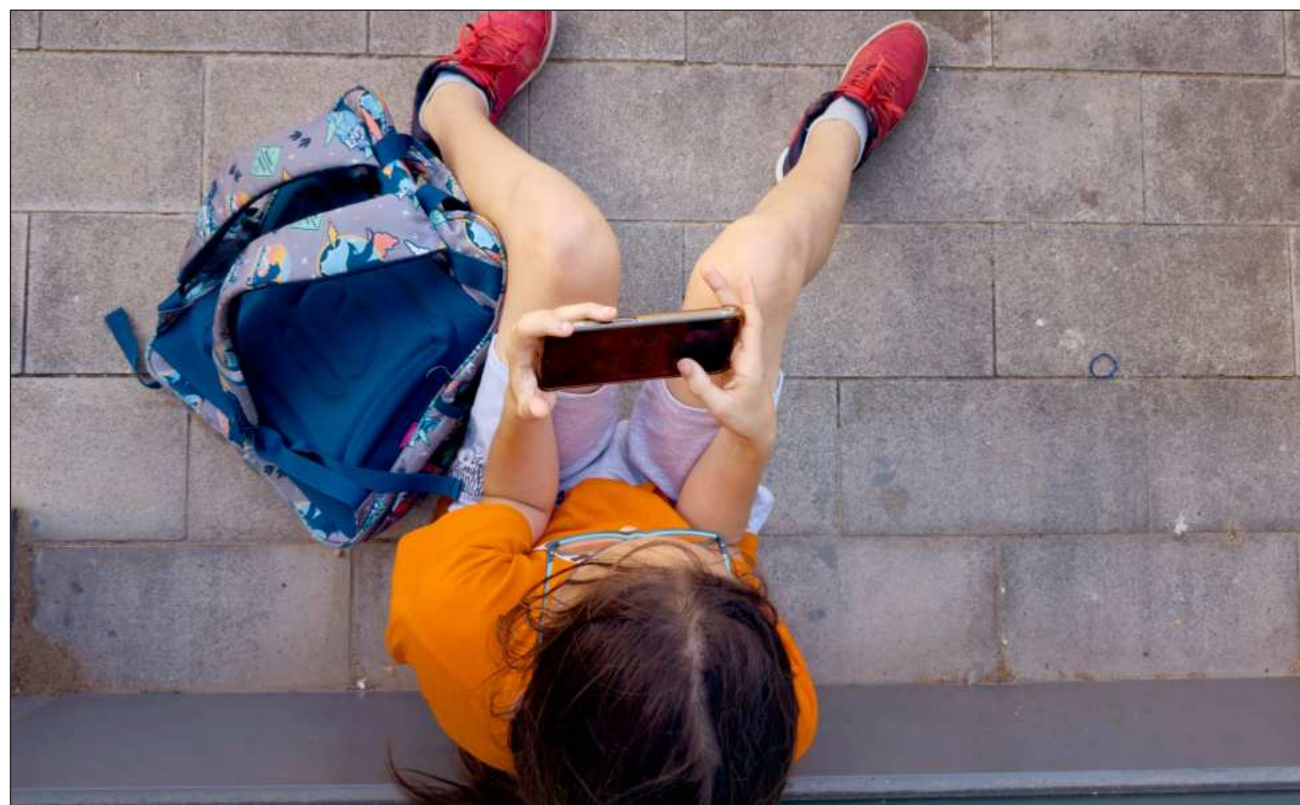
▲ La jefa del Ejecutivo argumentó que el país registra un elevado índice de horas de consumo digital entre la infancia y la juventud, lo cual impacta directamente en los procesos de socialización, así como en el bienestar general.

Tras revelar que encuestas muestran un respaldo mayoritario de los padres para prohibir celulares en primarias, la mandataria advirtió que el apego digital y los algoritmos están relacionados con severos cuadros de adicción, ansiedad y pérdida de sueño en la niñez y la juventud.