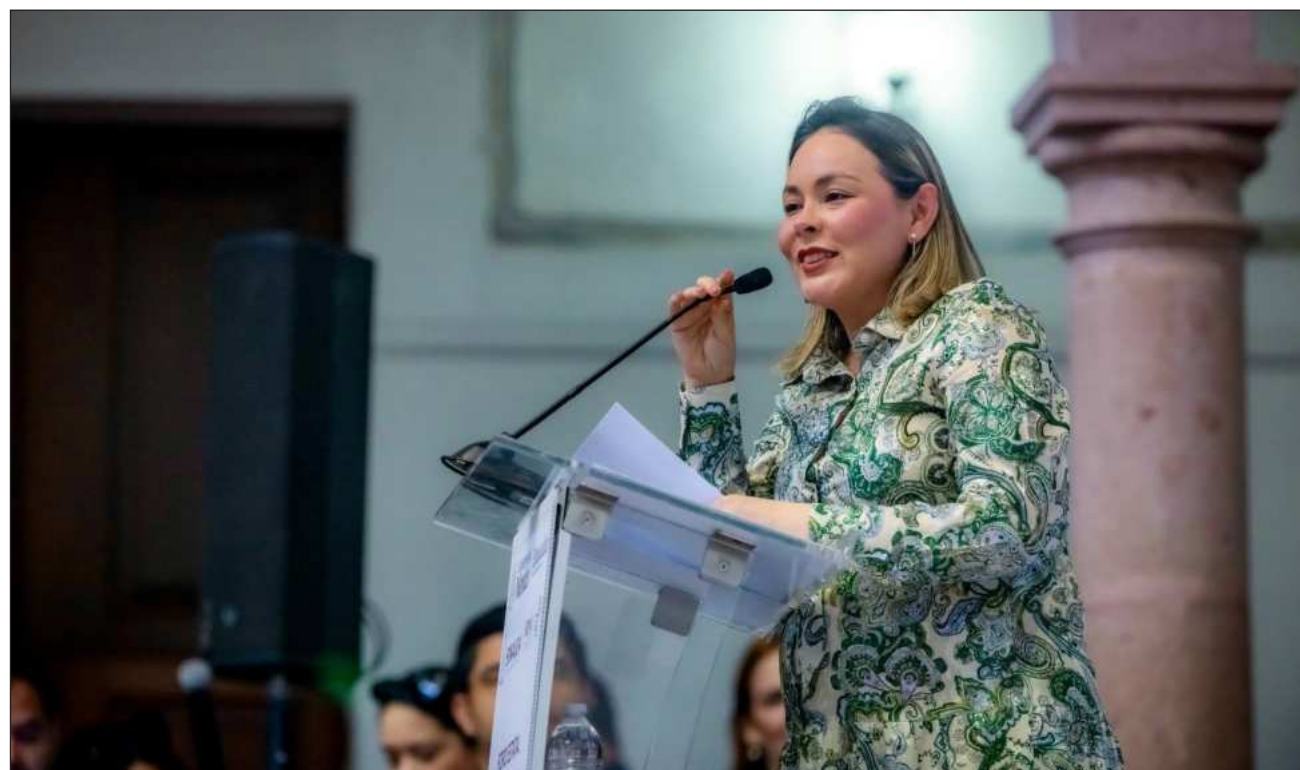
▲ Los hechos delictivos perpetrados por distintos grupos delictivos siguen en Culiacán, Mazatlán y la zona sur.

Durante este periodo, la entidad ha enfrentado algunos de los episodios más complejos de violencia e incertidumbre política de los últimos años. Los hechos delictivos han continuado en Culiacán, Mazatlán y la zona sur del estado, mientras la crisis derivada de las acusaciones de Estados Unidos contra Rocha Moya sigue generando repercusiones políticas y sociales.