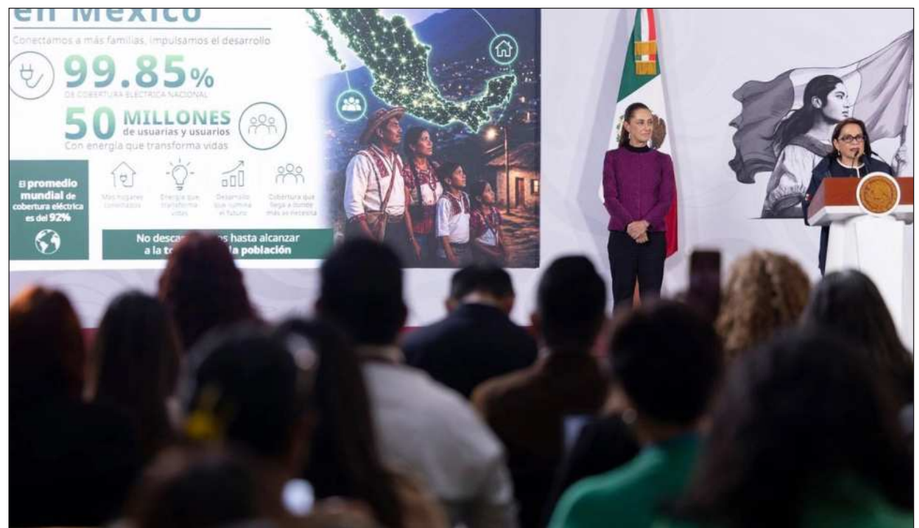
▲ La presidenta Claudia Sheinbaum Pardo sostuvo que el plan trata de una acción de justicia energética.

La directora general de la Comisión Federal de Electricidad (CFE), Emilia Esther Calleja Alor, detalló que actualmente la cobertura eléctrica nacional es de 99.85 por ciento y que aún quedan pendientes de electrificar 8 mil 247 lo-