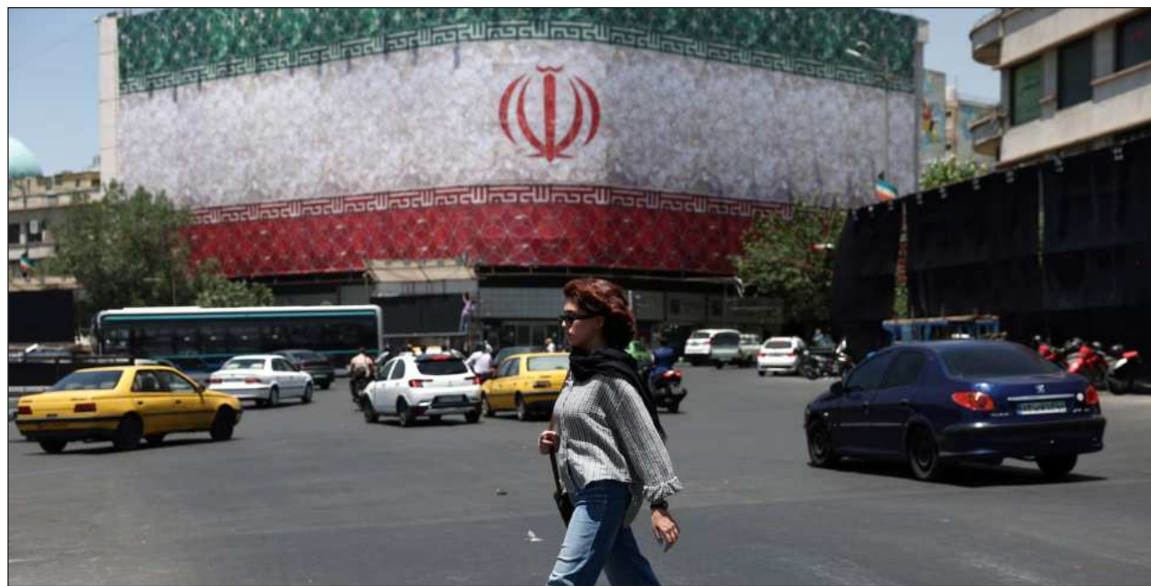
▲ En el acuerdo, cuya firma se adelantó este miércoles tras la reunión del G7 en Francia, se establece que Estados Unidos trabajará para poner fin a todas las sanciones estadounidenses y de Naciones Unidas impuestas a Teherán.

Líderes afirmaron “que les encanta este acuerdo porque quieren verlo concretado”