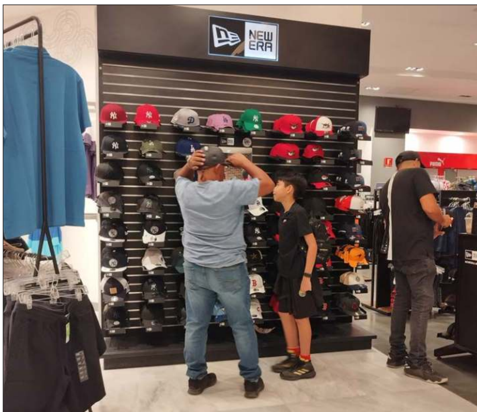
▲ Tras los festejos por el Día del Padre, los comerciantes aseguran que registran un aumento en sus ventas de hasta 60 por ciento, afirmó el presidente de la Cámara Nacional de Comercio,

Servicios y Turismo (Canaco-Servytur) de Carmen, Carlos Arjona. Explicó que la celebración cayó en quincena y la población contó con recursos para regalos.