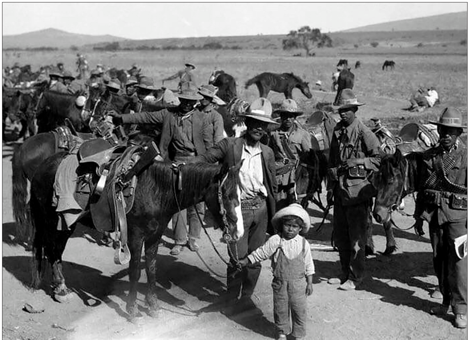
▲ “¿Cuántos de los ahí presentes reflexionamos acerca de los acontecimientos que, a más de cien años de distancia, dieran lugar a que ahora gocemos de esta libertad que vivimos, de que disfrutemos igualmente de todos los derechos ciudadanos que la constitución señala para los mexicanos?”.