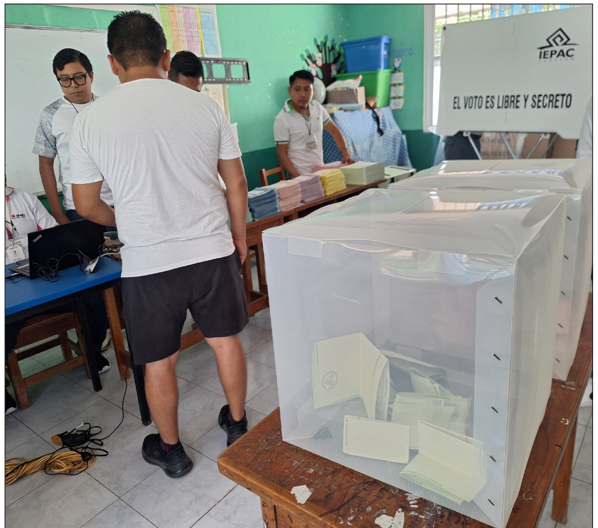
▲ Sobre las elecciones federales están disponibles las actas desde 2006 hasta 2024.

Por su parte los Vocales Ejecutivos Distritales Omar Valle Flores y Juana Contreras Hernández navegaron por el sitio web explicando a detalle los resultados de sus