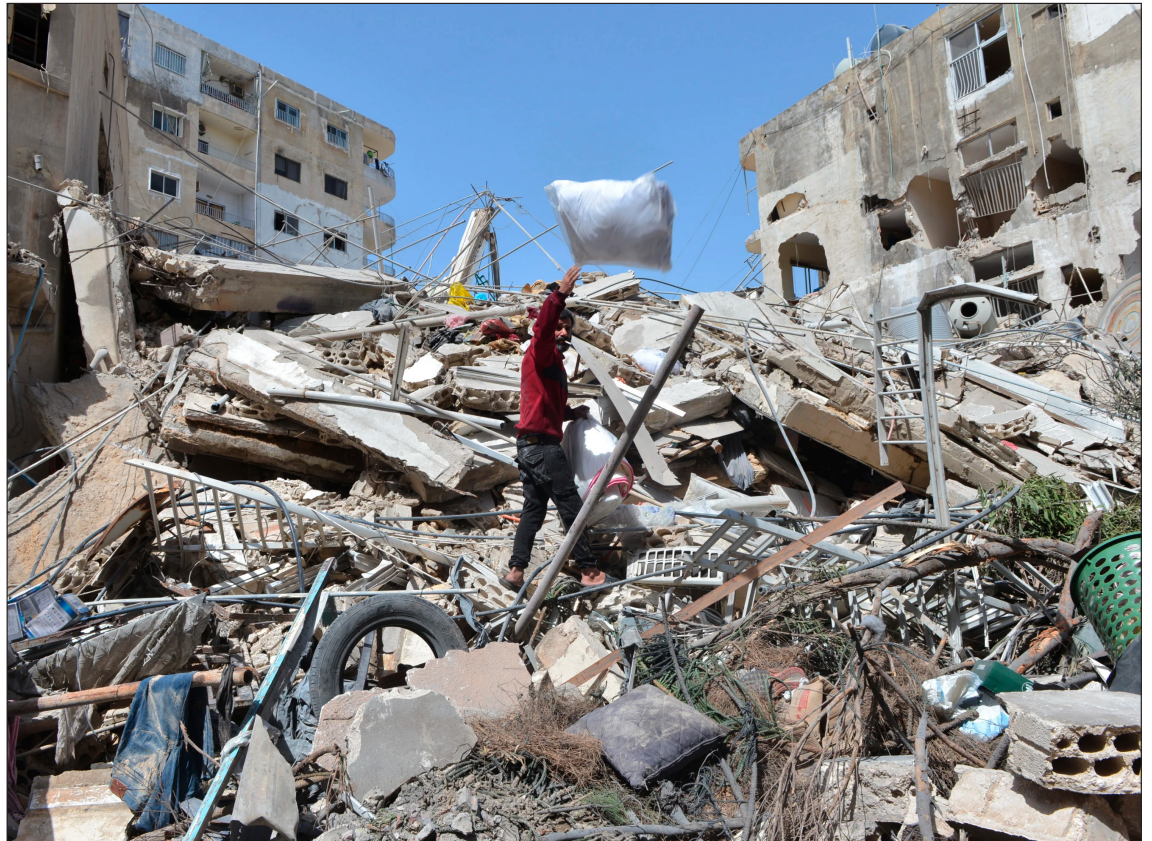
▲ Los EAU, que han albergado defensas aéreas y personal de Israel, recientemente acusaron a Irán de lanzar ataques.

Trump repetidamente ha fijado plazos para Teherán pero luego se da marcha atrás.