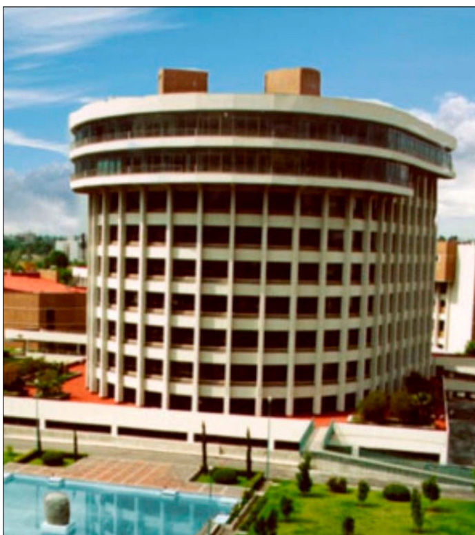
▲ "Llegaron para formarse en los prestigiosos Institutos de Cardiología y Nutrición, Enfermedades Tropicales y Cancerología".