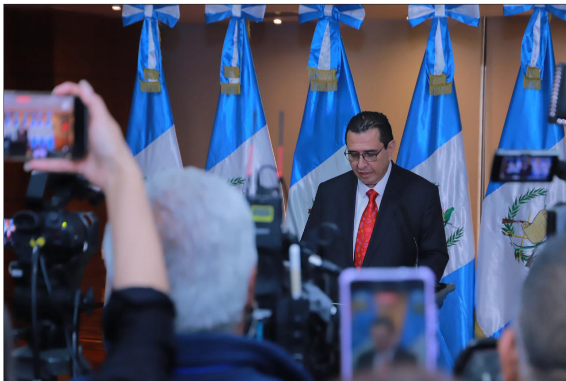
▲ García Luna aseguró que "guatemaltecos perdieron la confianza porque la justicia dejó de creerles a ellos".

García Luna aseguró que, "durante años, muchos guatemaltecos perdieron la confianza en la institución, no porque dejaron de creer