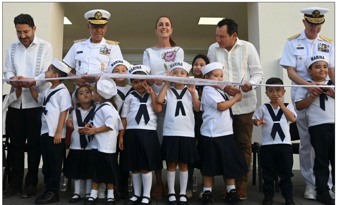
▲ El nuevo recinto tendrá quirófanos, terapia intensiva para adultos y niños y 16 especialidades médicas.

“Ya se lo merecía la familia Naval de Yucatán y del sureste de México. Es importante que así como ustedes le cumplen a México, México les pueda cumplir que puedan tener acceso a la salud