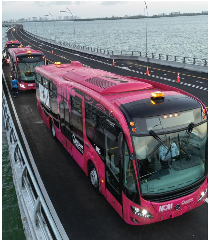
▲ Las nuevas unidades forman parte del Sistema de Movilidad del Bienestar (MOBI), enfocado en mejorar la experiencia de traslado de miles de usuarios.

La etapa piloto tendrá una duración de cuatro semanas.