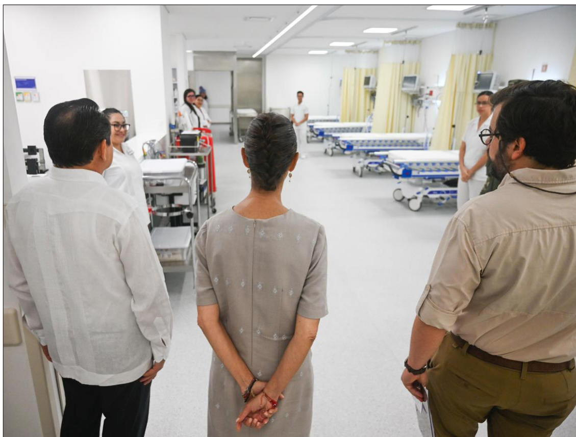
▲ "Hoy inauguramos un nuevo hospital y abrimos las puertas del derecho a la salud en el estado de Yucatán", subrayó Sheinbaum.

"No olviden ni un solo día que ante los pacientes ustedes son la cara, los ojos, los oídos y el corazón de nuestra presidenta en este hospital. Representenla con honor para que cada paciente sienta una atención empática y humanista, como ella siempre lo pide".