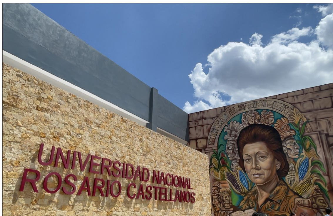
▲ La titular del Ejecutivo federal cortó el listón del plantel en compañía del gobernador Joaquín Díaz Mena.

Por ello, la Presidenta celebró que cada vez más estu-