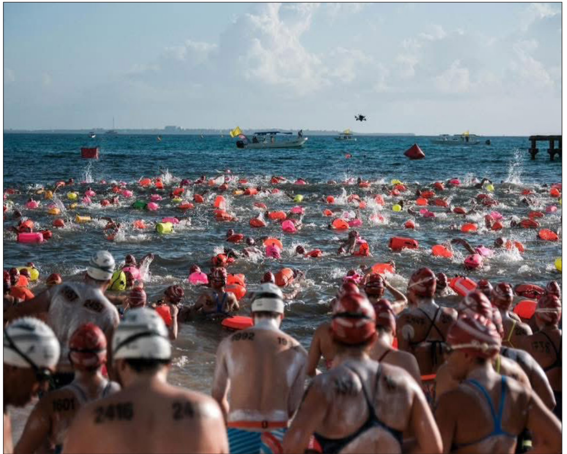
▲ En esta edición participan atletas provenientes de 21 países y de 32 estados de la República Mexicana, quienes compiten en 13 categorías dentro del recorrido principal de 10 kilómetros entre Cancún e Isla Mujeres.

Durante el trayecto, se realizará un minuto de silencio a la altura de plaza Las Américas en memoria de las personas de la comunidad fallecidas y se dará un posicionamiento público en El Ceviche.