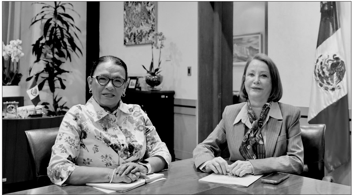
▲ La presidenta del Senado, Laura Itzel Castillo, se reunió el viernes 15 con la secretaria de Gobernación, Rosa Icela Rodríguez, para tratar asuntos legislativos pendientes y todo indica que fue en torno a la reforma.

Diputados y en la mayoría de los congresos estatales, la declaración de validez por la Comisión Permanente y su publicación en el Diario Oficial de la Federación .