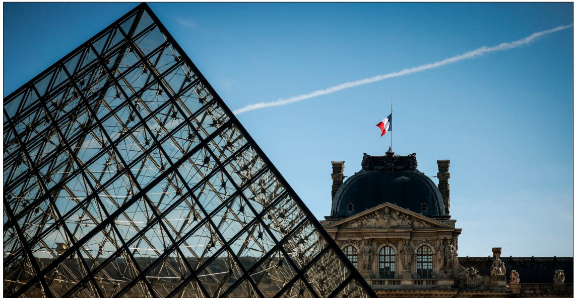
▲ La renovación del recinto elevó su costo previo, pasó de entre 700 y 800 millones de euros a unos mil 150 millones. Foto

Según el informe, el documento inicial fue elaborado por el Departamento de Seguridad de la firma de joyería Van Cleef & Arpels. A éste se sumó una auditoría realizada en 2017 por otra organización, que ya advertía sobre vulnerabilidades en el sistema de protección del museo, entre ellas la obsolescencia de equipos técnicos y