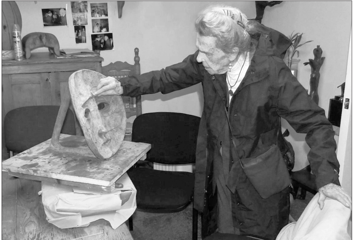
▲ La exposición está cimentada en la apreciación de que México parecía predestinado al surrealismo.

La institución divulgó por medio de un texto del poeta y músico Théo Plantefol que se explora cómo el encuentro con nuestro país transformó, entre otros, la visión y arte de los creadores franceses Breton, Benjamin Péret, Antonin Artaud y Pierre Mabillet, además del chileno Roberto Matta y Leonora Carrington, de origen británico.