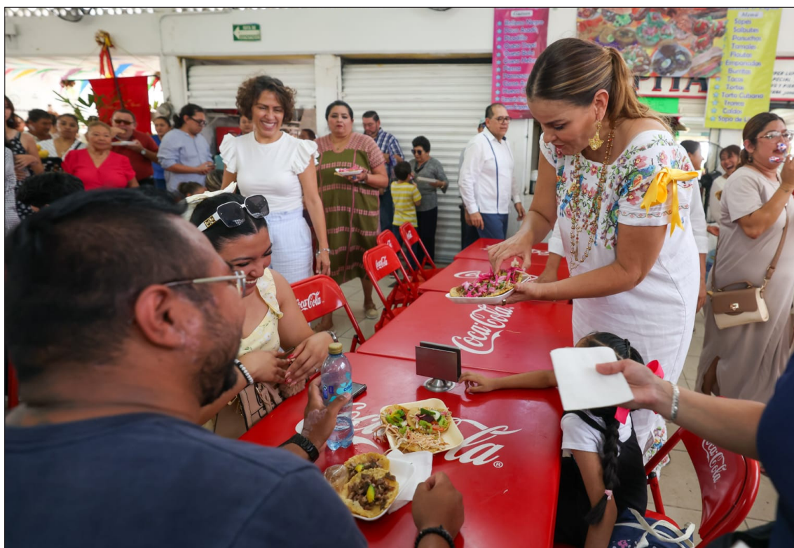
▲ La presidenta municipal agradeció a la comunidad y a los vecinos por mantener viva esta tradición.

Durante la feria de este antojito se ofrecieron propuestas con camarón