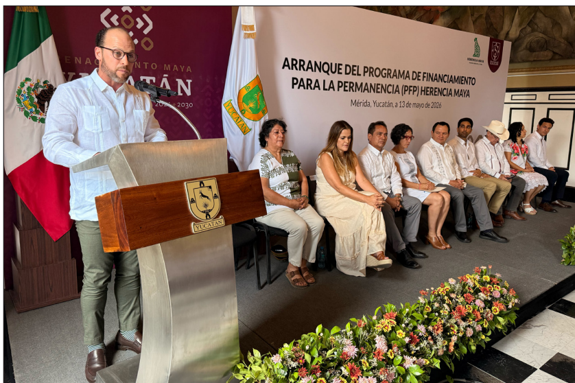
▲ “Yucatán hoy está dando un paso decidido hacia la meta 30x30 y está apoyando los compromisos que se adquirieron a nivel federal para lograrlo”, indicó la directora general de WWF México.

Bepensa es un grupo empresarial mexicano, conformado por más de 40 compañías agrupadas en 5 unidades de negocios: Bepensa Bebidas, Bepensa Motriz, Bepensa Industrial, Bepensa Capital y Bepensa Spirits. Juntas, brindan empleo y bienestar a más de 14,000 personas en México, República Dominicana y Estados Unidos. Sus decenas de marcas, muchas de ellas líderes globales en sus categorías, buscan satisfacer las necesidades de sus más de 350 mil clientes registrados y millones de consumidores en esos 3 países. Conoce más en: http://www.bepensa.com/ .