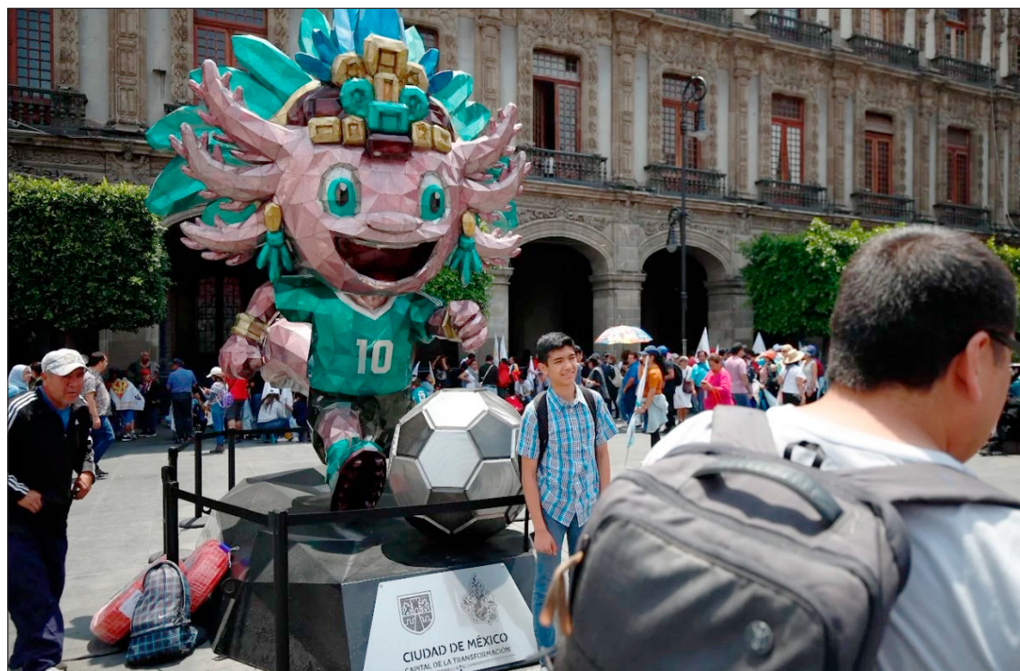
▲ El verdadero riesgo no está sólo en la apariencia de las páginas, sino en la lógica detrás de ellas; los ciberdelincuentes entendieron que la ansiedad de los aficionados también juega a su favor durante este Mundial.

La investigación de Eset encontró páginas con direcciones como fifa26.shop o 26-fifa.com, que utilizan una técnica conocida como typosquatting , consistente en copiar dominios oficiales y