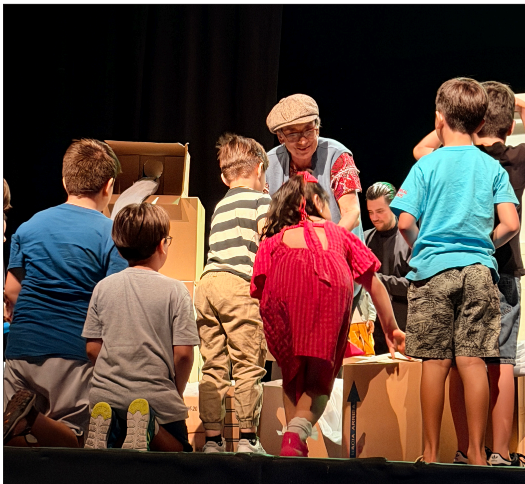
▲ “Como señala su misión: impulsaron el imaginario de los niños para que desarrollen su pensamiento creativo, empatía —tan escasa— y razonamiento, para que consoliden su identidad en comunidad”.

El abuelo está perdiendo la memoria, Eva, en cambio, apenas comienza a comprender el mundo. Junto con su hermano, pasan el último día en la casa del abuelo que hoy se muda: ya no puede vivir solo. Entre juegos, riesgos y mucha imaginación, dos niños y un abuelo desmemoriado transforman este día en una aventura inolvidable. Con la ayuda del público, deberán llegar a la misteriosa isla de las Mariposas, un lugar donde los recuerdos, el amor y el presente se entrelazan.