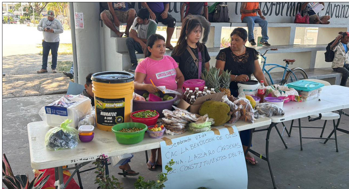
▲ Los participantes del Tianguis Campesino coincidieron en que la agricultura orgánica representa no solo una forma de producción sustentable, sino también una herencia cultural para las futuras generaciones.

Durante el evento, los productores señalaron que continúan utilizando semillas naturales y evitan productos transgénicos o químicos para proteger la salud de los consumidores y preservar la calidad de sus cosechas.