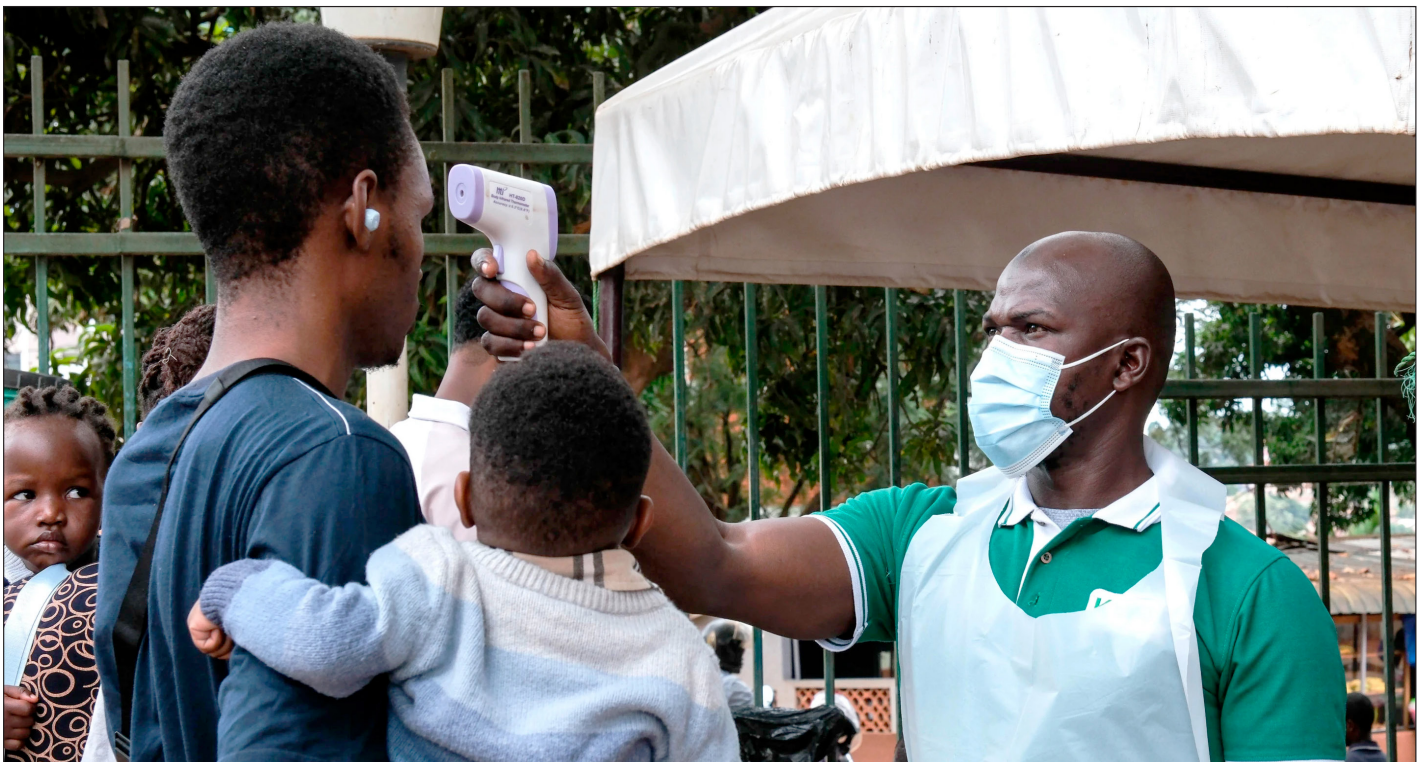
▲ La Oficina Regional de la OMS para África señaló que un equipo de 35 expertos había llegado a Bunia, junto con siete toneladas de suministros y equipo.

El virus Bundibugyo fue detectado por primera vez en el distrito Bundibugyo de Uganda, durante un brote en 2007 y 2008, en el que 149 personas resultaron infectadas y 37 murieron. La segunda vez fue en 2012, en un brote en Isiro, RDC, donde se reportaron 57 casos y 29 fallecimientos.