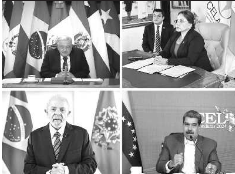
▲ Los presidentes de Brasil, Cuba, Colombia, Venezuela, Bolivia, Guatemala, y Guyana en representación de los países que integran la Comunidad del Caribe (Caricom), manifestaron su apoyo a México.

En su conferencia de prensa diaria en Palacio Nacional, destacó que los miembros de la Celac han expresado sus apoyos a los derechos de México y en contra de la violación del derecho internacional cometida por Ecuador con el asalto a la embajada mexicana en Quito y la detención a su interior del ex presidente ecuatoriano Jorge Glas.