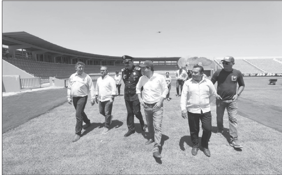
▲ El gobernador Mauricio Vila recorrió el parque de Kanasín, que está prácticamente listo para la Liga Mexicana y que será la casa de los Leones en esta temporada.