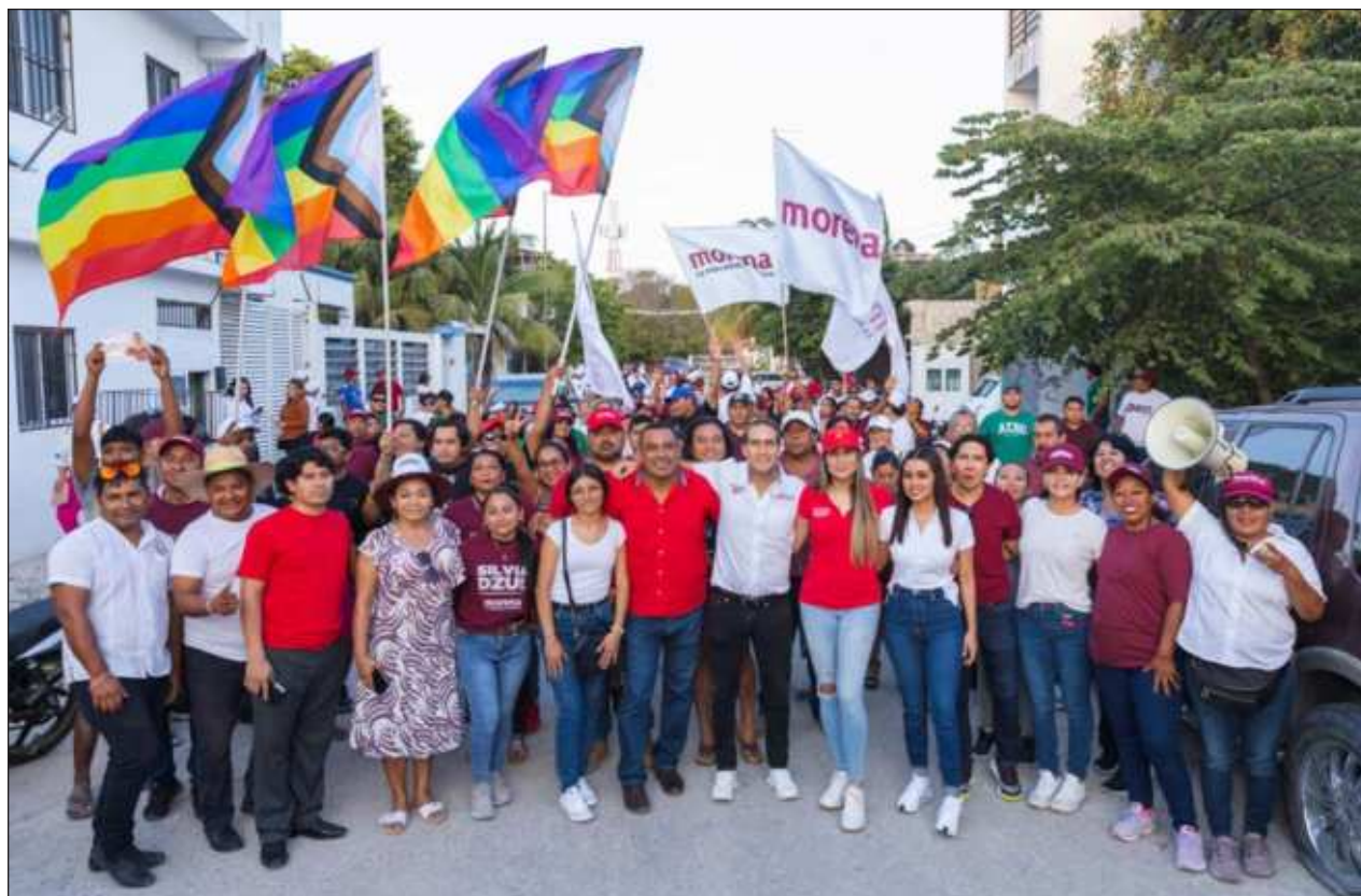
▲ En su segundo día de campaña, el candidato a alcalde de Tulum visitó a las familias de la colonia Tumben Kah y se reunió con ingenieros y arquitectos, a quienes presentó sus compromisos de favorecerle el voto el 2 de junio.