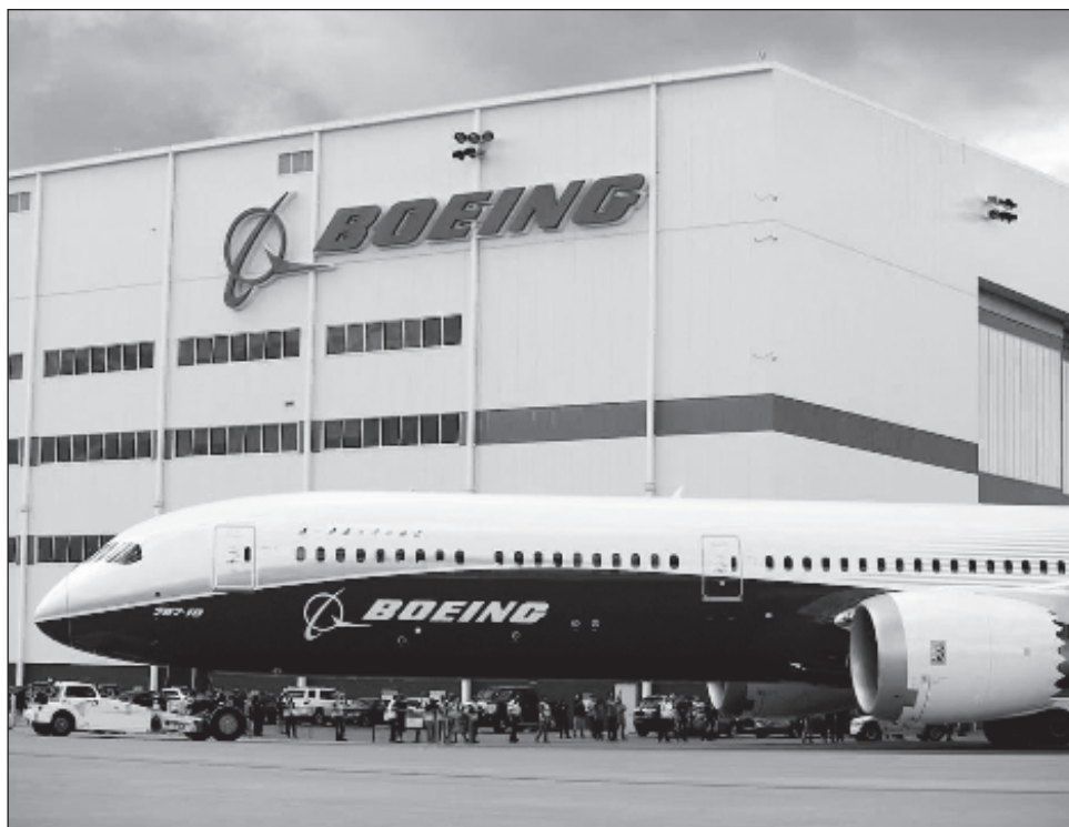
▲ De acuerdo con el grupo, “Boeing comprende la importancia de las responsabilidades de la comisión en términos de supervisión y cooperamos con esta investigación”.