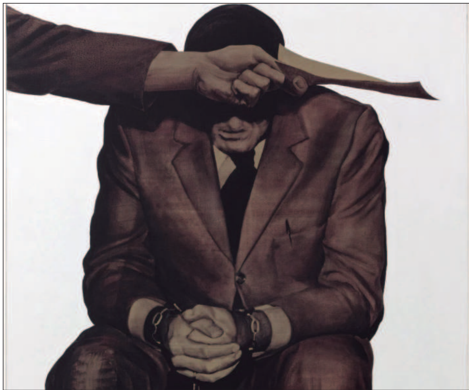
▲ La ampliación consiste en una introducción y tres itinerarios; se parte de la transición a la democracia en España para después abordar temas como el feminismo, el lesbianismo, el auge del sida, la llegada de la heroína y los atentados del 11S en EU. © Juan Genovés, VEGAP, Madrid, 2026

Segade explicó durante la rueda de prensa de presentación que "la tarea del