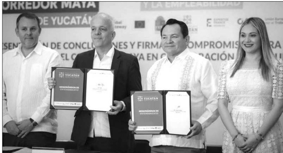
▲ El gobernador señaló que Yucatán se encuentra en un momento estratégico y que el Corredor Maya abre oportunidades de inversión, comercio y turismo; este dinamismo debe acompañarse de capacitación técnica y mecanismos que faciliten la transición a la formalidad.

Al dirigir su mensaje, el gobernador señaló que Yucatán se encuentra en un momento estratégico y que el Corredor Maya abre oportunidades de inversión, comercio y turismo; este dinamismo debe acompañarse de capaci-