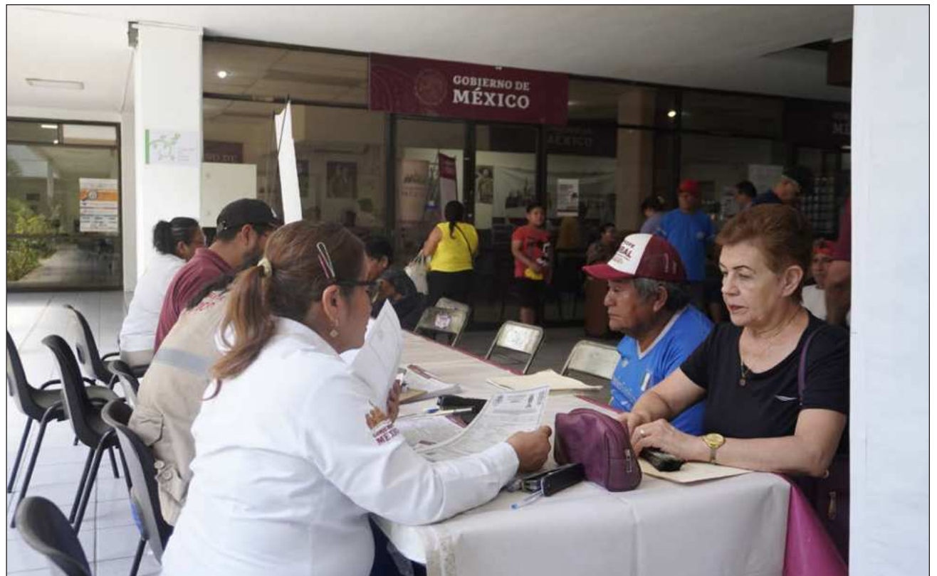
▲ Los Centros Integradores ubicados en los 13 municipios permanecerán abiertos de lunes a domingo, en un horario de 9 a 16 horas para brindar atención oportuna a quienes deseen incorporarse a los Programas del Bienestar.

Destacó que estos programas son parte de las estrategias del Gobierno de México para que estos grupos vulnerables tengan un apoyo que sirva para su cotidianidad, así como para su desarrollo y autosuficiencia. "Se hicieron con la finalidad que el pueblo salga del rezago y acceda a una vida más plena", expuso Cardozo Rivero.