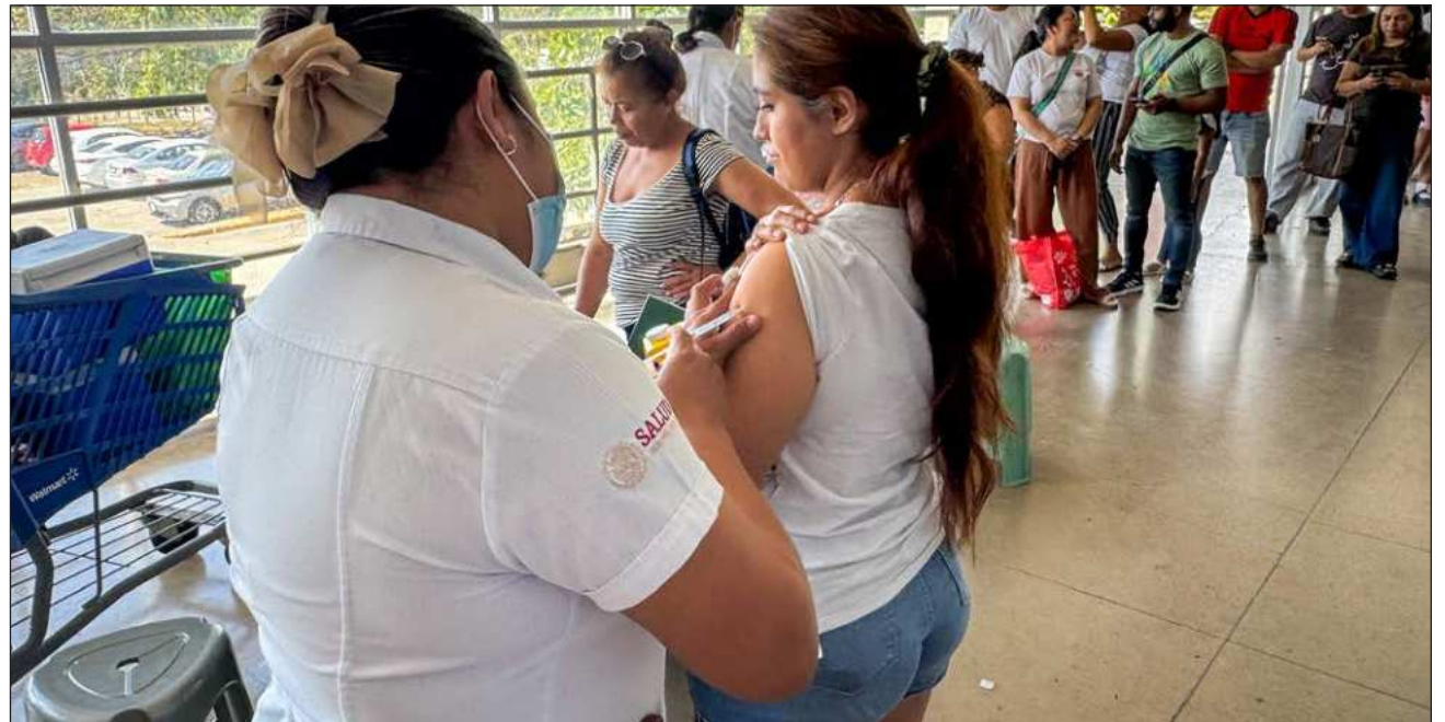
▲ Mara Lezama anunció una jornada especial para facilitar el acceso a la población durante el fin de semana. El sábado 21 y domingo 22 de febrero se instalarán módulos en el Parque de Las Casitas, así como en plaza Las Américas.

Mara Lezama anunció una jornada especial de vacunación para facilitar el acceso a la población durante el fin de semana. El sábado 21 y domingo 22 de febrero se instalarán módulos en el Parque de Las Casitas, de 9 de la mañana a 2 de la tarde, y en plaza Las Américas, de