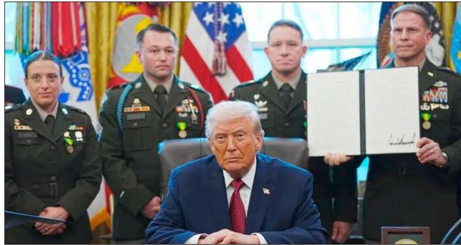
▲ Sheinbaum detalló que Trump podrá decretar el fentanilo como un arma letal, pero si no se instrumentan cambios en torno a la manera en que las personas llegan al consumo, seguirá el riesgo.

Durante su conferencia, ratificó la visión de México de que, si bien, se debe perseguir a quienes operan la fabricación y distribución de drogas, lo fundamental es la atención a las causas de las adicciones porque podrá decretarse el fentanilo como un arma letal, pero si no se instrumentan