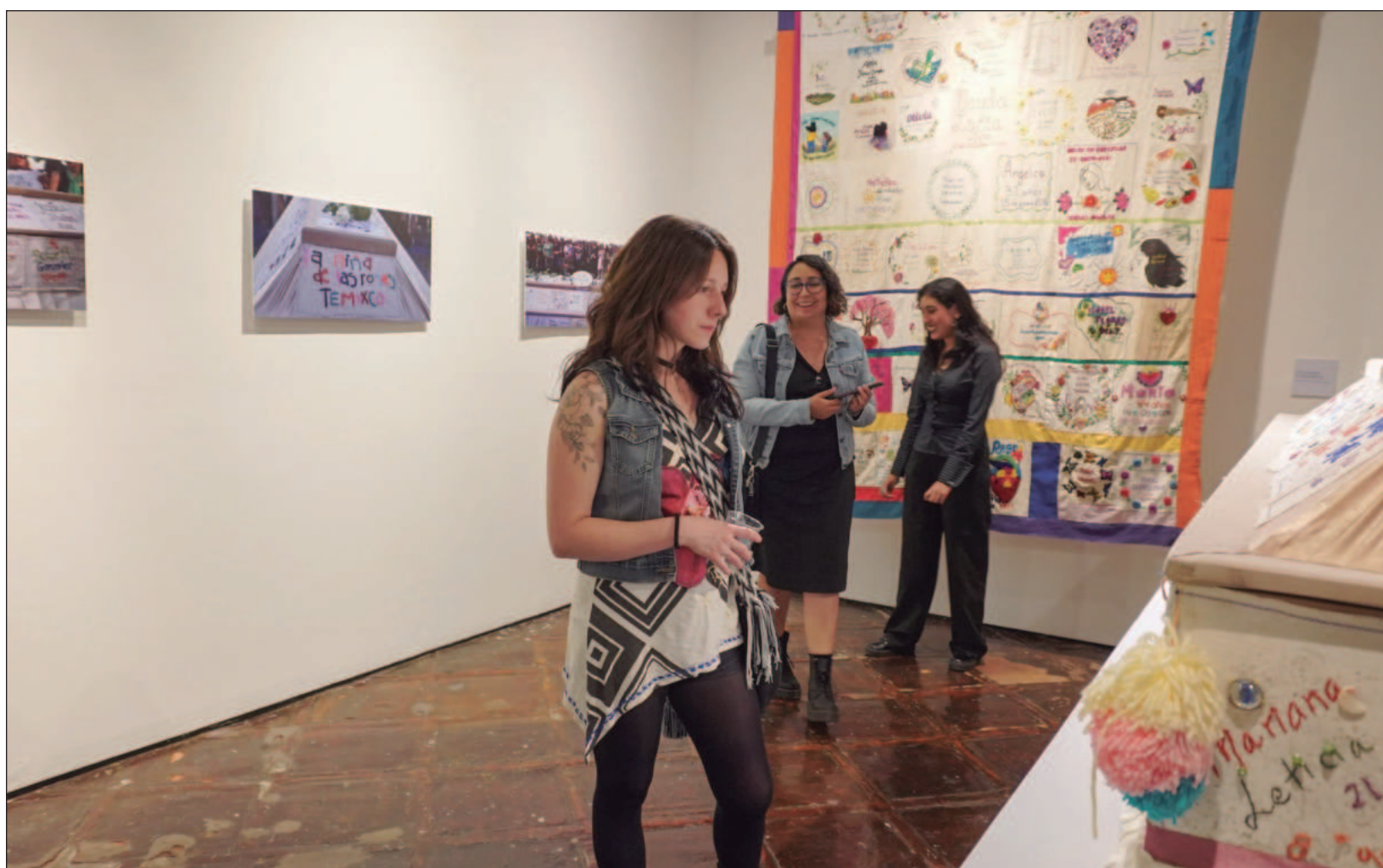
▲ La muestra reúne piezas que revelan el poder del hilo y la aguja como herramientas de activismo, acompañamiento y denuncia.

Creada con motivo del Día Internacional de la Eliminación de la Violencia contra la Mujer, la exhibición transforma el bordado en un acto de memoria, resistencia y cuidado. Cada puntada sostiene una historia y cada hilo teje un llamado a no olvidar.