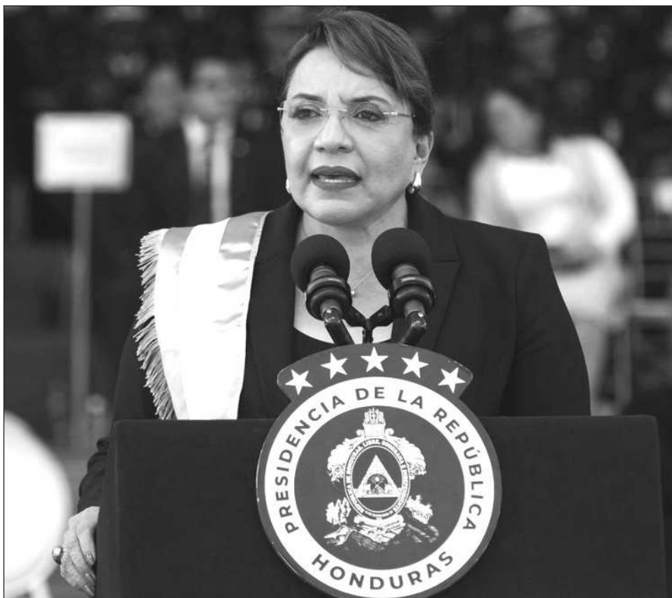
▲ La presidenta Castro instó a “la población, los movimientos sociales, colectivos, organismos de base, militancia y ciudadanía” a “concentrarse de manera urgente y pacífica en Tegucigalpa para defender el mandato popular” y “rechazar cualquier intento golpista”.

Los datos oficiales publicados hasta la fecha sitúan al candidato ultraderechista Nasry Asfura (Partido Nacional) con 40.52 por ciento por delante del conservador Salvador Nasralla (Partido Liberal, 39.20 por ciento), una vez realizado 99.4 por