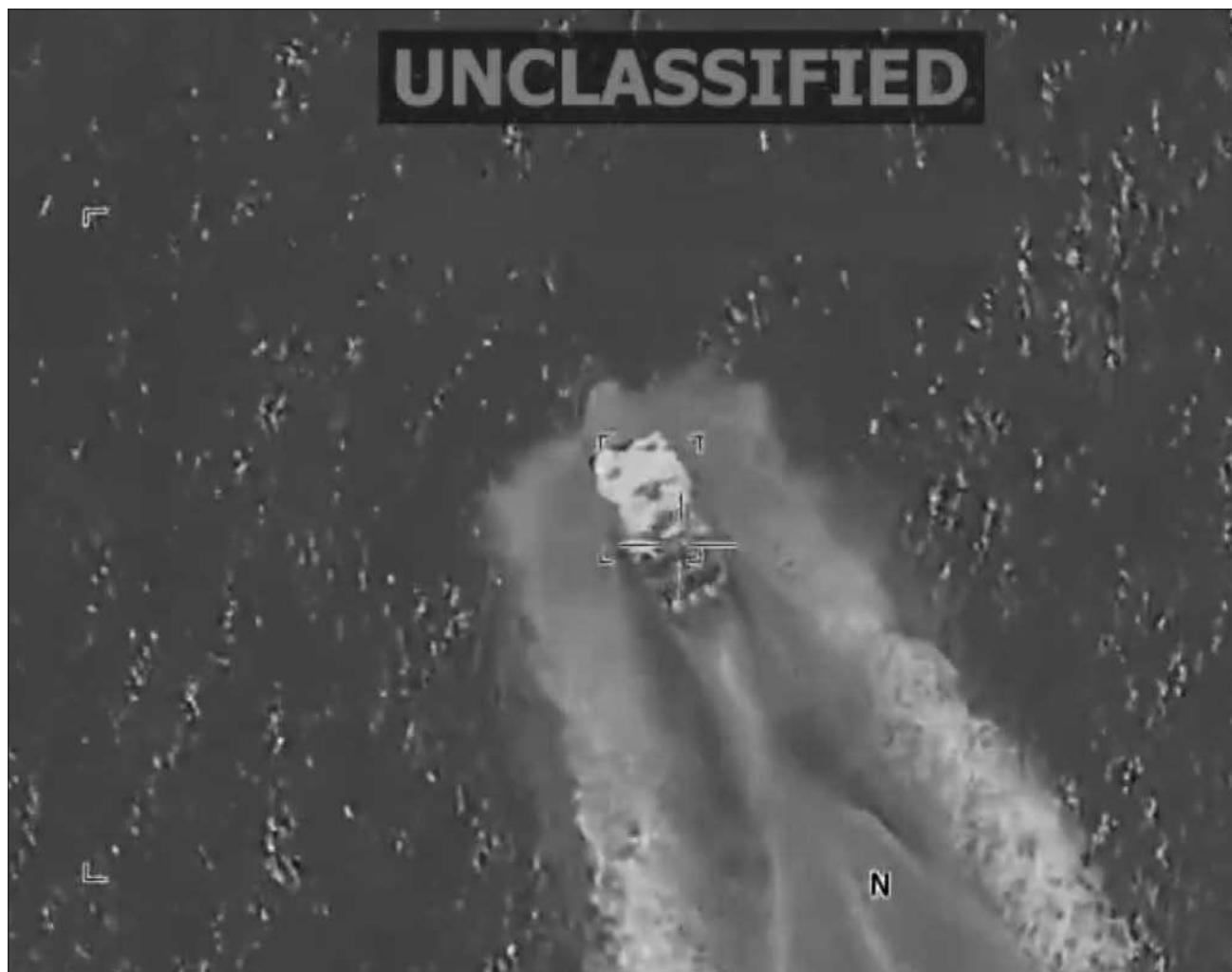
▲ Creciente inquietud en el Congreso por la expansión de la campaña del presidente en aguas de América Latina.

La sesión clasificada precedió a una posible votación en el Senado sobre resoluciones destinadas a restringir que Trump lance una acción militar contra Venezuela sin el consentimiento del Congreso.