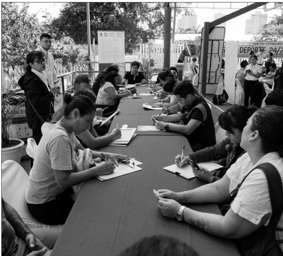
▲ En alfabetización, las mujeres superan a los hombres en un rango de 5 por ciento, mientras que en secundaria representan un 20 por ciento más que los varones.

Uno de los datos más relevantes es la mayor participación de las mujeres, particularmente en los procesos de alfabetización y secundaria. En alfabetización, las mujeres superan a los hombres en un rango de 5 por ciento, mientras que en secundaria representan aproximadamente un 20 por ciento más que los varones, lo que evidencia un interés creciente por mejorar su formación académica y sus oportunidades laborales.