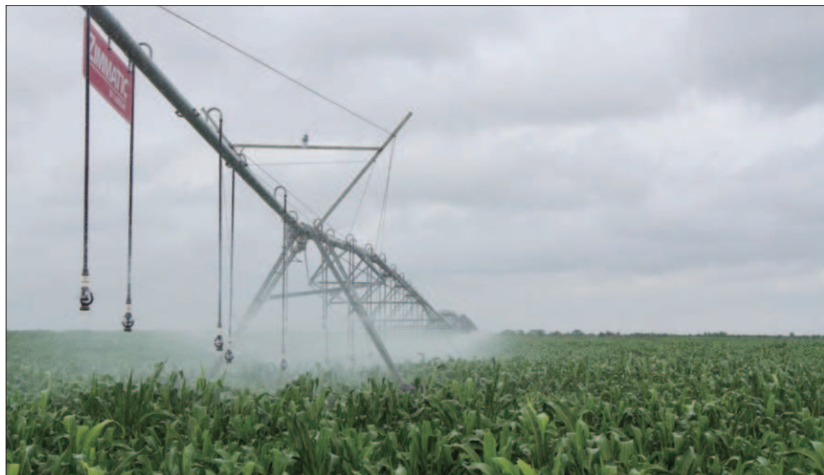
▲ “Como reza el lugar común más repetido, el agua es “el vital líquido”: su disponibilidad se convierte muy rápidamente en un asunto de vida o muerte (de las personas, el ganado, los cultivos, las ciudades o las industrias) ¿cómo, entonces, repartirla? ¿o a qué actividades se le debe destinar preferentemente?”.

Elinor Ostrom, que obtuvo el premio Nobel de Economía gracias