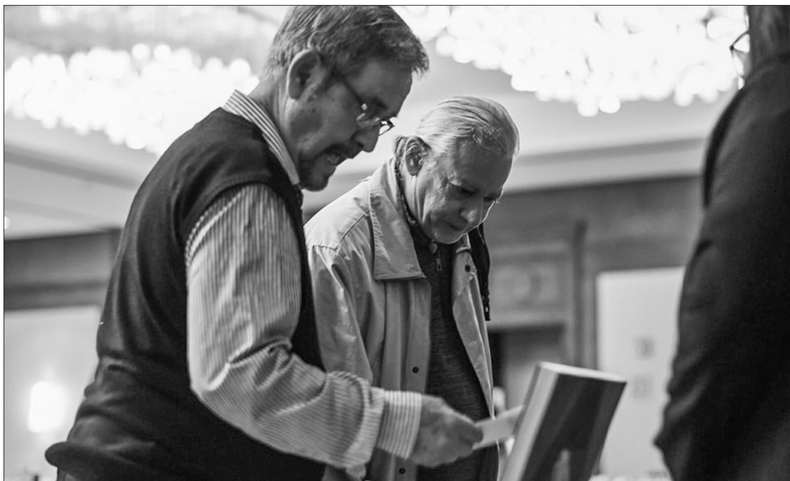
▲ "La conmemoración del Día del Escritor debe implicar asuntos propios de la escritura, la literatura, el periodismo cultural, la crítica de arte y otras formas de expresión en que sea empleada la palabra. Por otra parte, habrá que destacar el talento de los escritores y su dedicación".