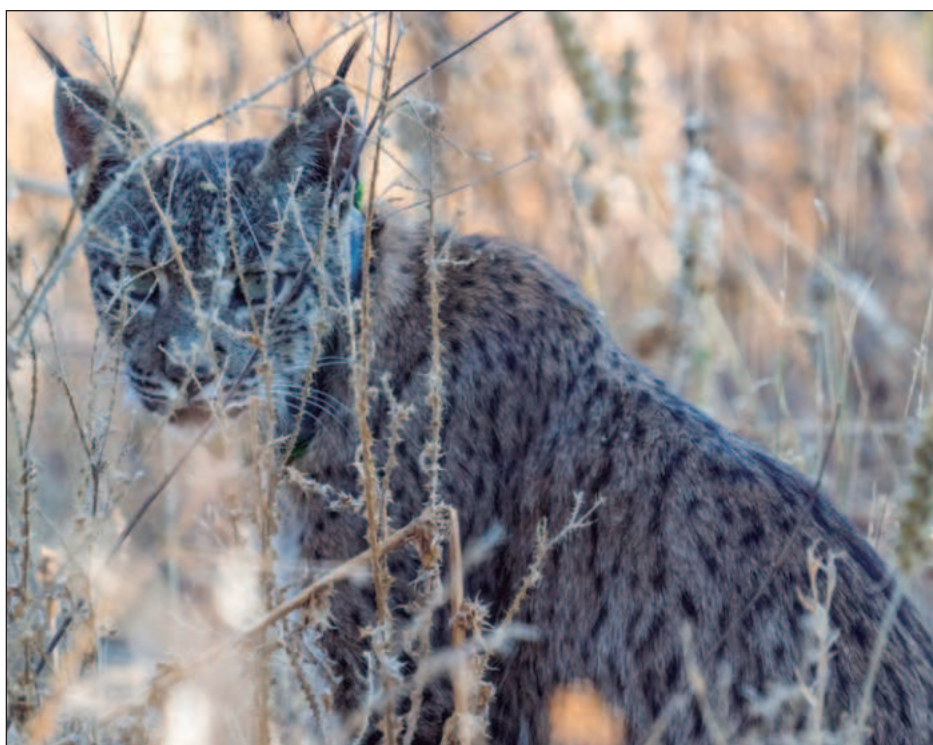
▲ Debido a la pérdida de diversidad genética del lince, corren el riesgo de endogamia, lo que disminuye sus probabilidades de supervivencia, ya que provoca enfermedades.

Los gorilas de montaña alcanzan una tasa de reproducción completa de 6 por ciento, en tanto los chimpancés alcanzan sólo 4 por ciento, al mismo nivel que los delfines. Varias especies de macacos, desde los japoneses (2.3 por ciento) hasta los rhesus (uno por ciento), se sitúan casi al final de la tabla.