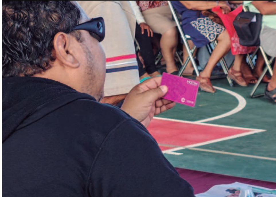
▲ Las primeras unidades del sistema de transporte Ko'ox comenzaron a operar en agosto; desde ese entonces, los plásticos para abordar los camiones no funcionaban.

De igual manera, en comparecencia, se informó que la telemetría que sería usada por Movibus para entender el flujo de pasajeros costó 45 millones de pesos, sin embargo, Briceño Oliva-