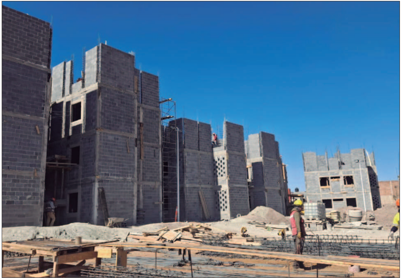
▲ La Sedatu destacó que cumplieron las metas para 2025 de iniciar la construcción de 390 mil 973 viviendas en el país.

Ayer se sortearon 139 viviendas y a partir del miércoles se efectuarán otros 154 sorteos