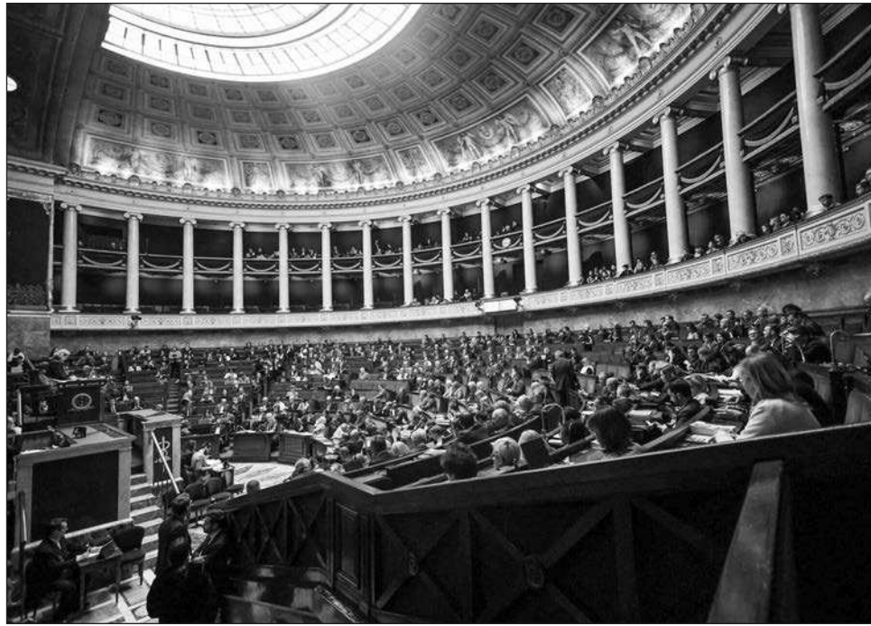
▲ “Es una victoria del Parlamento”, celebró su presidenta, Yaël Braun-Pivet, máxime cuando el gobierno renunció a la posibilidad de aprobarlo sin el voto de los legisladores.

“Es una victoria del Parlamento”, celebró su presidenta, Yaël Braun-Pivet, máxime cuando el gobierno renunció a la posibilidad de aprobarlo sin el voto de los legisladores, como le permite la ley y ha hecho desde 2022.