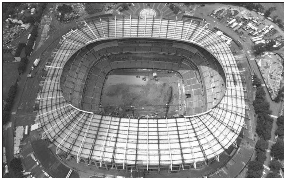
▲ El estadio Banorte (Azteca) será sede del partido inaugural del mundial.

En total, el 50 por ciento de la asignación de las federaciones participantes corresponderá a las categorías más económicas, es decir, entradas de grada asequible (40 por ciento) y de grada básica (10 por ciento). El resto de los tickets se dividirán entre grada estándar y zona preferente. "Además, al realizar las devoluciones en los casos en que las solicitudes no se aprueben, no se cobrará la tasa administrativa a los aficionados que solicitan boletos a través de la federación miembro y