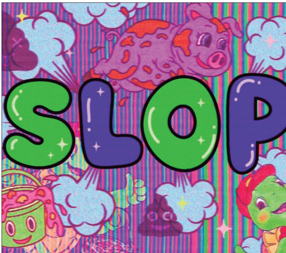
▲ La palabra “refleja videos absurdos, propaganda cursi, noticias falsas y muchos gatos que hablan y que han invadido las redes sociales de las personas durante este año”.

Por otro lado, Oxford University Press, editor del Oxford English Dictionary, eligió como palabra del año rage bait , definido como “contenido en línea deliberadamente diseñado para provocar ira o indignación”.