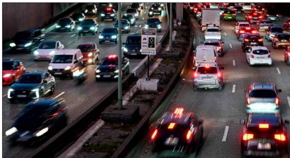
▲ Tras el anuncio, Friedrich Merz, el jefe del gobierno alemán, el país europeo con la mayor industria automotriz, afirmó que la medida va “por el buen camino”; Francia espera revertir el plan.

“El objetivo sigue siendo el mismo, la flexibilidad es una realidad pragmática que tiene en cuenta la aceptación de los consumidores y la dificultad de los fabri-