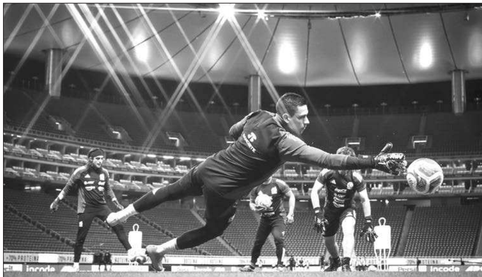
▲ El Tricolor se enfrentará a Islandia en Querétaro a finales de febrero próximo.

El "Tri", que cerró este año sumido en una racha de seis encuentros sin triunfo, regresará a su país después de medirse a panameños y bolivianos para enfrentar a Islandia, en