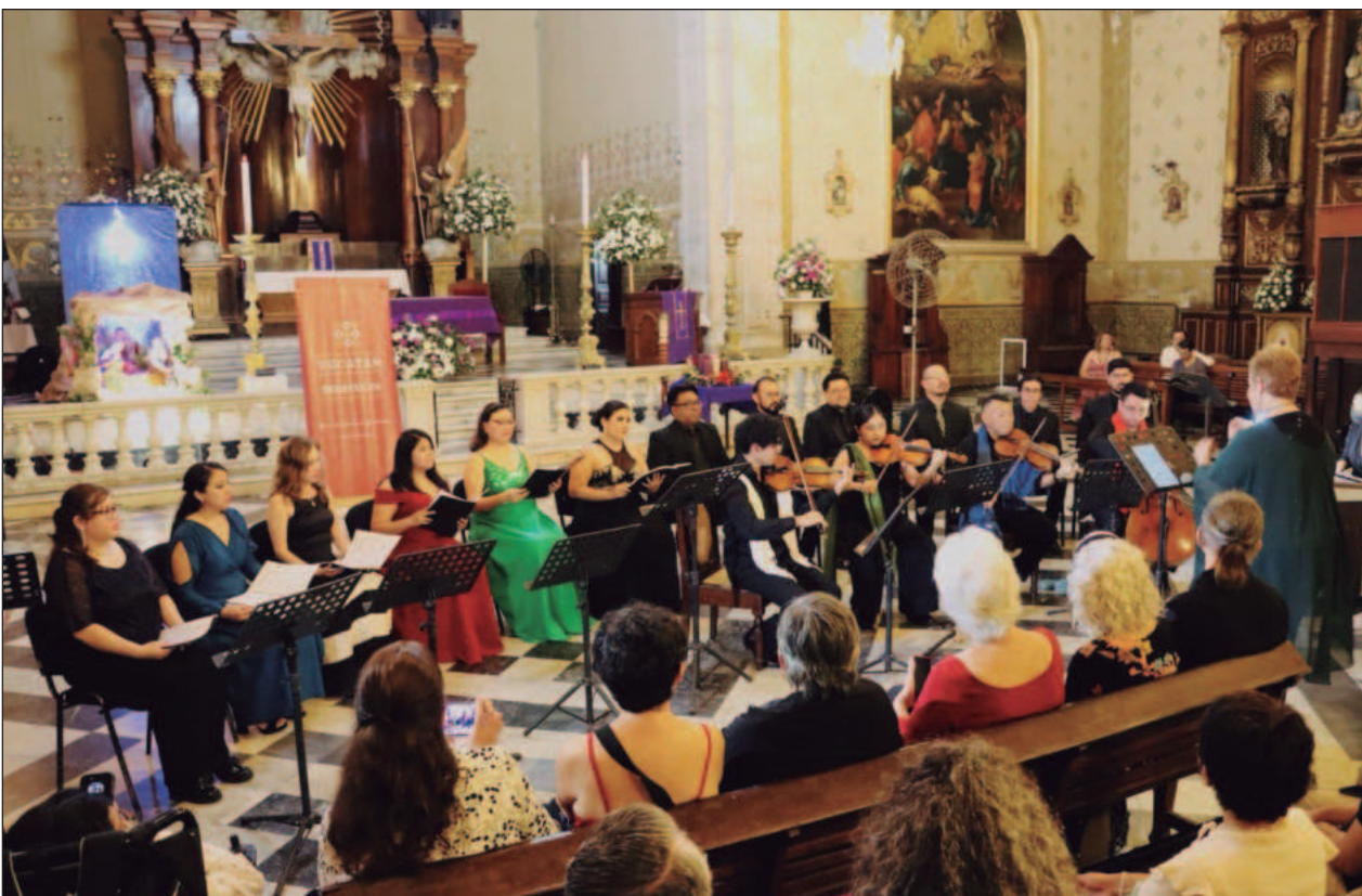
▲ La luz tenue del recinto reforzó la sensación de intimidad, dotando una atmósfera profundamente solemne.

Hay una competencia real entre esos dos personajes. Ahora oigo que dicen “felices fiestas” en vez de decir “feliz Navidad” y veo y re veo la frenética actividad por comprar los regalos que trae Santa. Dicen que mi amo miraba las estrellas y que yo pisaba la tierra. Y en este pisotón veo que el gordo ganó por mucho.