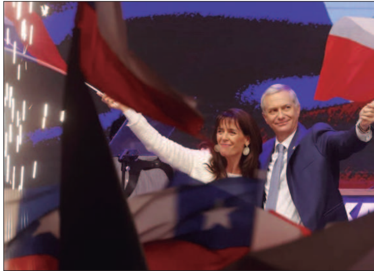
▲ “La elección de un candidato que coquetea abiertamente con el Pinochetismo, y Nazismo, de ideología extrema (...) y de pensamiento muy próximo al fenómeno Milei en Argentina, revela una fractura profunda”.

LA ELECCIÓN DE un candidato que coquetea abiertamente con el Pinochetismo, y Nazismo, de