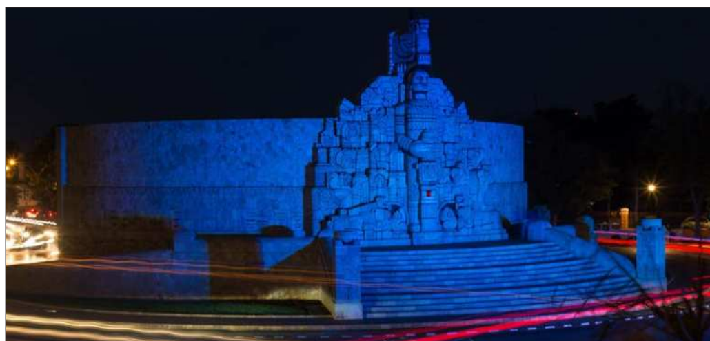
▲ La parte temible de la nueva ley es que todo lo que se pueda diseñar en beneficio de las personas con autismo y sus familias queda supeditado a dos palabras: disponibilidad presupuestal.

Precisamente, hay un dato que falta: el costo de la atención e inclusión de las personas con autismo. Entre diagnósticos, terapias de rehabilitación y lenguaje, e incluso monitores escolares, las familias invierten una parte sustancial de su presupuesto, muchas veces consiguiendo avances muy lentos. Esta realidad no cambia en este momento con la nueva ley. Es por ello que las finanzas del estado debieran garantizar un porcentaje mínimo para el cumplimiento de la misma, y entonces podremos decir que se tiene un avance sustantivo en la creación de una sociedad incluyente.