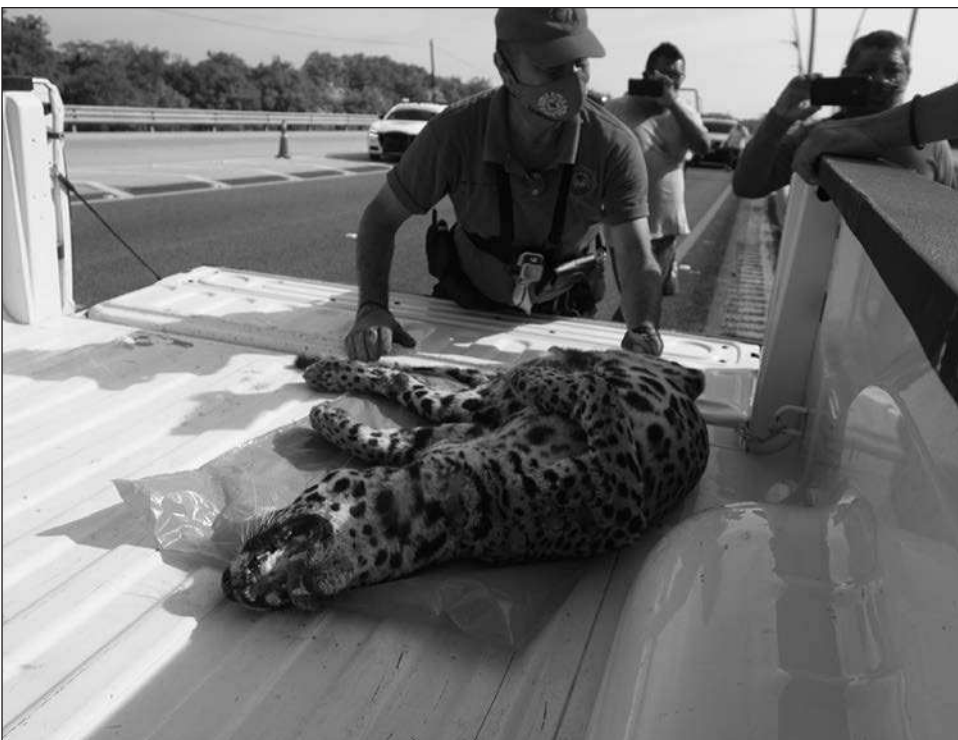
▲ Recientemente el caso Legacy, grupo inmobiliario que pretendía edificarse en Playacar, mostró la necesidad del equilibrio entre desarrollo y cuidado a la naturaleza.