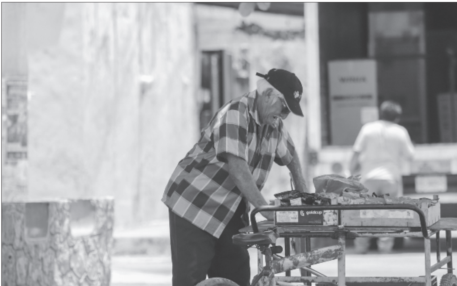
▲ "Las áreas que recibieron recortes fuertes (...) incluyen a medio ambiente, salud, seguridad y el INE".