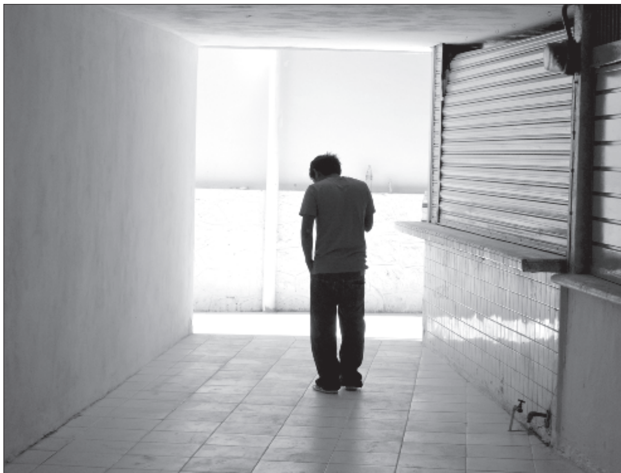
▲ La especialista explicó que la soledad y desesperanza, suelen incrementar en las personas que presentan depresión.

Con respecto al Presupuesto Estatal 2025 para Campeche, señaló que mantienen la postura de defender la visión de la gobernadora.