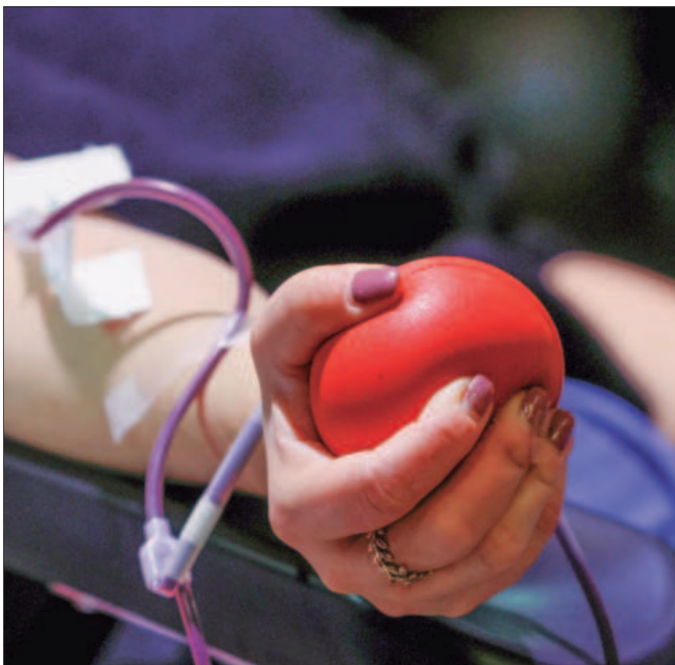
▲ La colecta es liderada por el Grupo Cooperativo Iberoamericano de Medicina Transfusional y busca favorecer el logro del modelo de donación 100% voluntaria.

El CETS Campeche, invita a la población a acudir a la avenida Lázaro Cárdenas a un costado del Hospital General de Especialidades a donar de forma voluntaria, con horarios de lunes a viernes de 7 a 18 horas; sábados, domingos y días festivos de 7 a 16 horas.