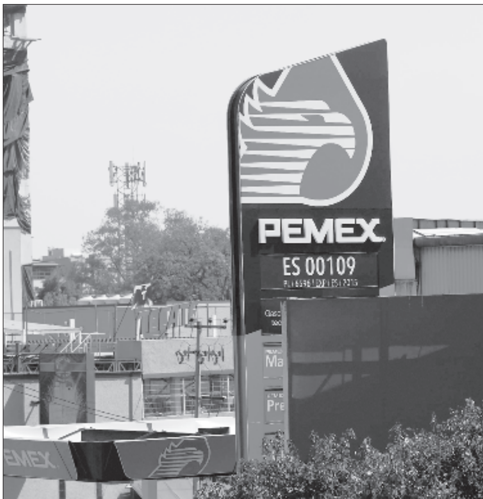
▲ Los empresarios calificaron como un error que Pemex busque contratar créditos para pagar deuda, ya que las financieras buscarán imponerle intereses muy altos.

Cada día que transcurre los empresarios pierden la esperanza que se lleve a cabo pago alguno a los proveedores, reconociendo que en caso de ser así, se estaría poniendo en riesgo fuentes de empleo en el municipio y en la entidad; además de avanzando a una crisis general.