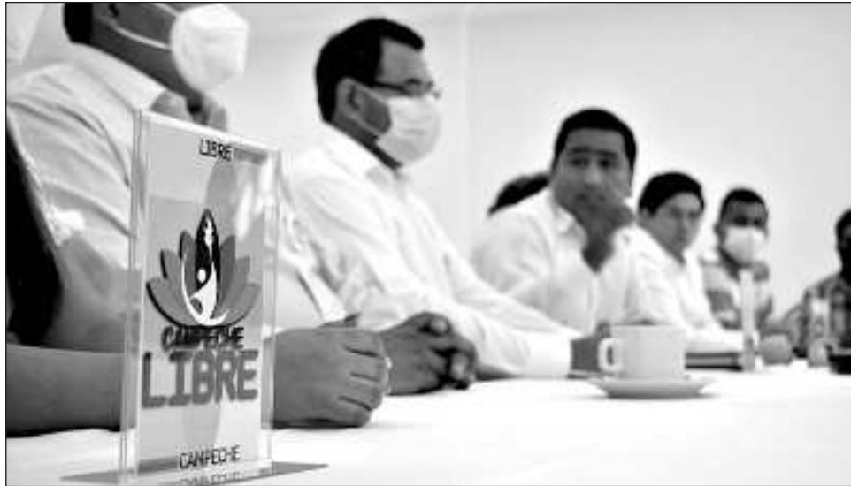
▲ Destaca que algunos de los partidos en cuestión de perder su registro, no alcanzaron 1 por ciento de la votación general de lista nominal en el estado.

Del resto, en Espacio Democrático en Champotón su