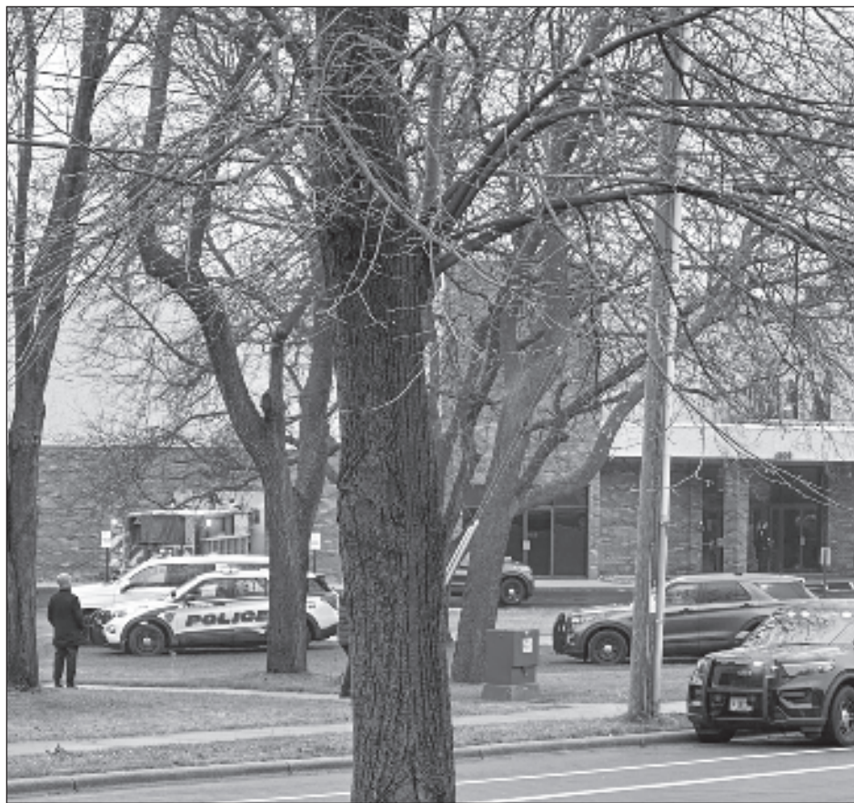
▲ Shon Barnes indicó que el presunto agresor se encuentra entre los muertos.

Shon Barnes no especificó si las víctimas son alumnos o trabajadores de la escuela y agregó que los heridos tienen lesiones menores y otras que pueden ser mortales.