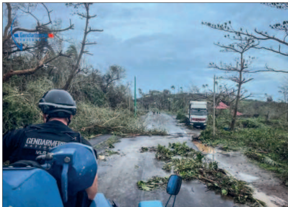
▲ Las imágenes de Mayotte mostraban escenas de devastación y, entre los principales objetivos de los rescatistas, está encontrar supervivientes y proporcionar agua y alimentos.

Mayotte tiene oficialmente 320 mil habitantes, pero se calcula que habría entre 100 mil y 200 mil personas más, según esta fuente, precisando que pocos de ellos acudieron a los refugios previstos por miedo a ser controlados.