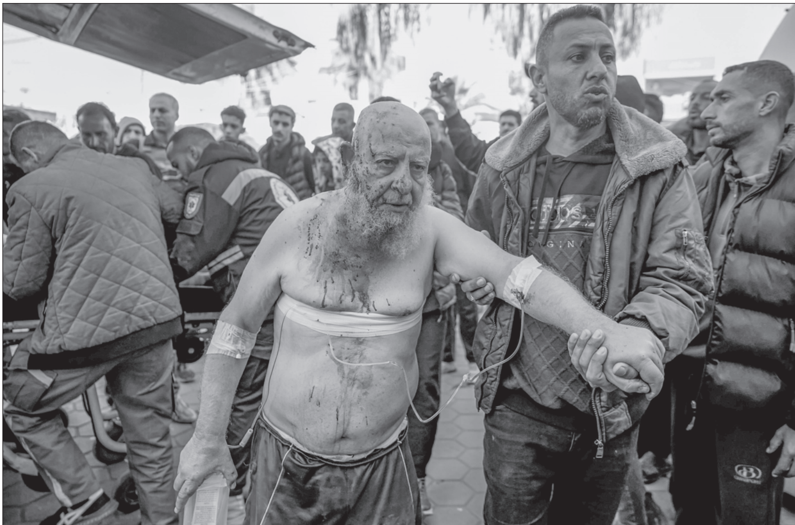
▲ "Occidente, erigido por sí mismo como el definidor del destino de los pueblos, usa la coyuntura para incrementar su asedio a Palestina".