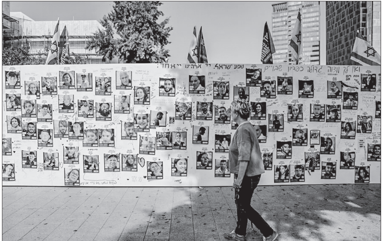
▲ En más de un año de conflicto, Hamas e Israel sólo han llegado a un acuerdo de alto el fuego y liberación de rehenes. Entonces fueron liberados 105 de los 251 cautivos, a cambio de 240 presos palestinos que estaban encerrados en cárceles israelíes.

Fuentes cercanas a las conversaciones indicaron a Efe el pasado martes que el acuerdo podría llegar "en una o dos semanas", después