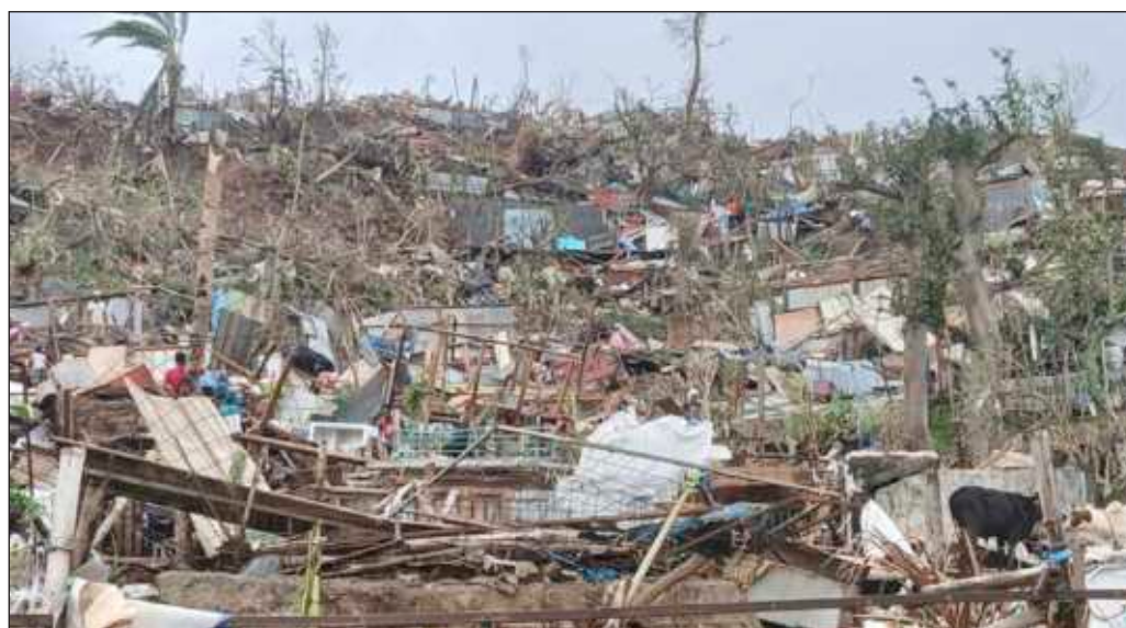
▲ No hay ciertamente manera de evitar fenómenos naturales como los ciclones, pero si Chido se abatió con un saldo tan trágico sobre la población mayotesa, ello se debe a las misérrimas condiciones en las que vive.

No hay ciertamente manera de evitar fenómenos naturales como los ciclones, pero si Chido se abatió con un saldo tan trágico sobre la población mayotesa, ello se debe a las misérrimas condiciones en las que vive la mayor parte de ella, en aglomeraciones de chozas y con carencias sanitarias, de comunicaciones y vialidades que ningún europeo desearía para sí. En suma, por más que se disfrace de democracia, el colonialismo sigue vivo en el mundo. Hoy, sus consecuencias están a la vista.