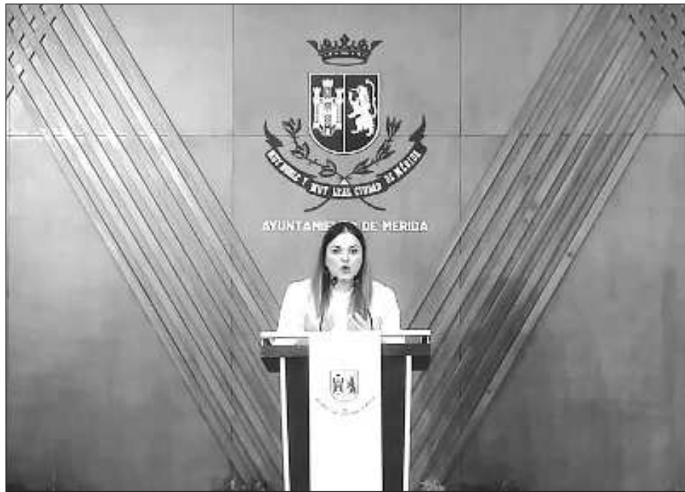
▲ La alcaldesa de Mérida, Cecilia Patrón Laviada, anunció que presentará una Controversia Constitucional ante la Suprema Corte de la Justicia de la Nación.

En cambio, sí se aprobó una reforma a la Ley de Hacienda del Ayuntamiento de Mérida para incluir aumentos al impuesto predial