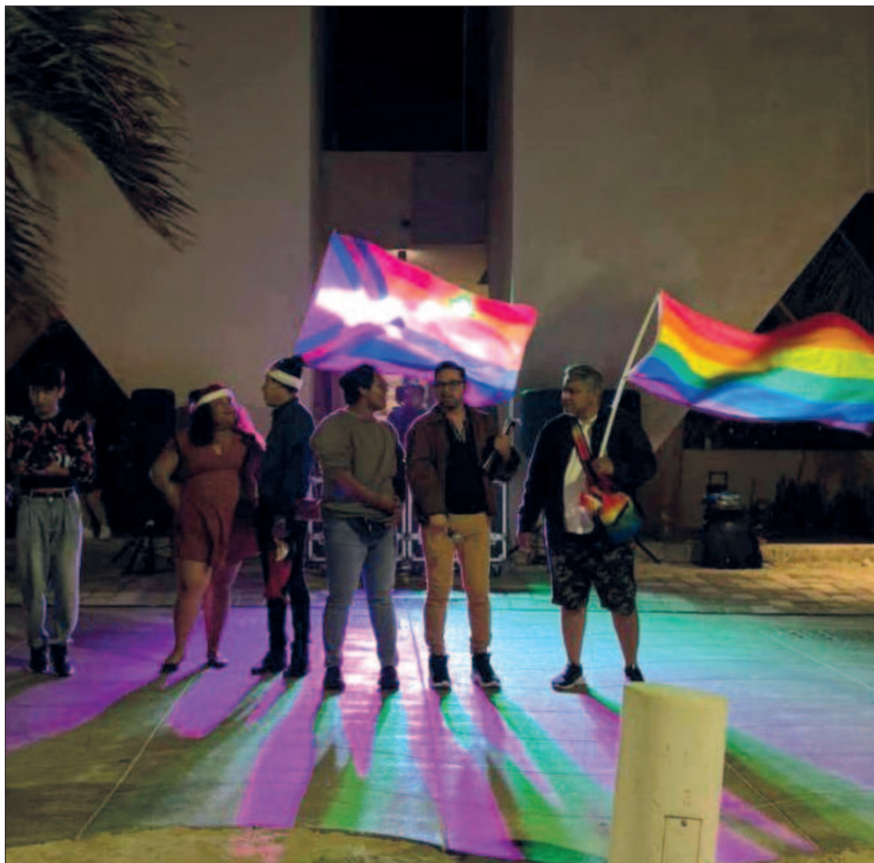
▲ El evento buscó crear un espacio seguro para la comunidad LGBTTTIQ+.

Afirmó que el DIF Yucatán continuará trabajando arduamente para garantizar que nadie se quede atrás y que todos puedan disfrutar de una vida digna y plena.