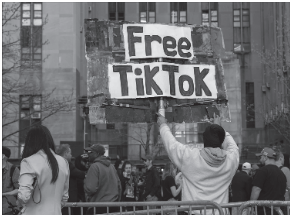
▲ El 6 de diciembre, el Tribunal de Apelaciones del Circuito del Distrito de Columbia rechazó los argumentos de usuarios de que la ley viola su derecho a la libertad de expresión.

El Congreso aprobó la ley en abril por motivos de seguridad nacional. El Departamento de Justicia ha afirmado que, como empresa china, TikTok representa “una amenaza para la seguridad nacional de inmensa profundidad y es-