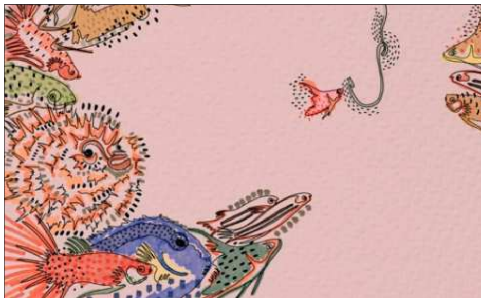
▲ Uno de los distintivos de la revista es que "conmina a sus lectores a utilizar sus contenidos como referencia e inspiración para abordar nuevas creaciones". Ilustración Río Seco

Quizá el texto con el que inicia Afluentes ilustra de mejor manera el corifeo