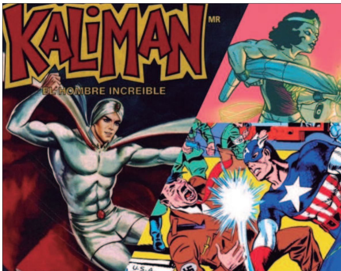
▲ "El cómic ha contribuido a construir realidades a través de la conformación de imaginarios sociales, creando universos de referencia, moldeando el sentir social o fomentando el morbo".

DURANTE LAS DÉCADAS de 1940, 1950 y 1960, la historieta mexicana vivió su edad de oro, con tirajes que superaban los tres millones de ejemplares semanales. En esta época surgieron superhéroes mexicanos icónicos como Chanoc, Santo el Enmascarado de Plata y Kali-