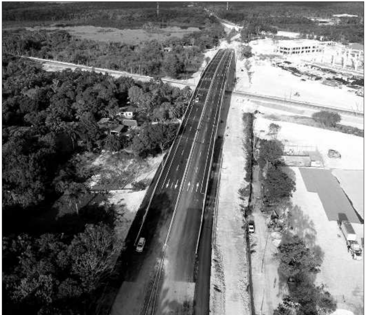
▲ Por este puente que une puntos estratégicos de la capital, confluirán quienes vengán de la carretera federal 186 y la 307 y pasarán por encima de las vías del Tren Maya, cuya estación es visible desde el lugar.

La gobernadora enfatizó que la avenida Álvaro Obregón es fundamental y hoy el acceso está abierto. Y como se establece en el Nuevo Acuerdo por el Bienestar y Desarrollo de Quintana Roo “seguiremos invirtiendo en nuestra hermosa capital”.