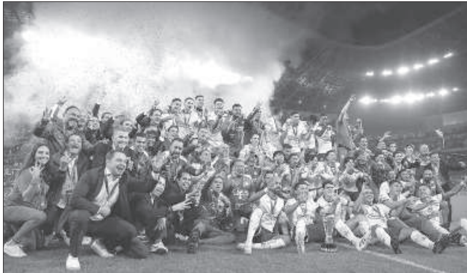
▲ Las Águilas jugaron su mejor fútbol en la liguilla para conseguir su título 16.

América no había ganado ninguno de sus campeonatos cerrando una serie fuera de