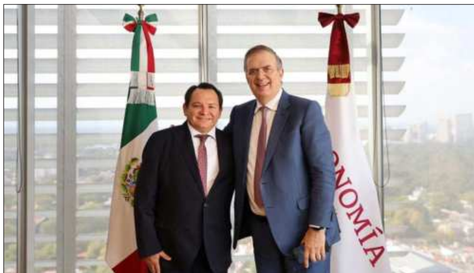
▲ El gobernador Joaquín Díaz Mena se reunió en la CDMX con Marcelo Ebrard y Mario Delgado, secretarios federales de Economía y Educación Pública, respectivamente.

"El Renacimiento Maya es una visión de futuro para Yucatán, que busca transformar nuestro estado a través de la generación de oportunidades, el fortalecimiento