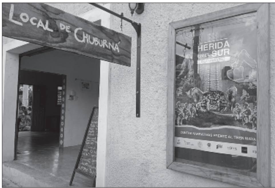
▲ El documental Una herida en el sur busca revertir algunas de las narrativas más frecuentes alrededor de la justificación de este mega proyecto, como es el argumento de su creación en beneficio de la independencia económica de los pueblos originarios.

"No sólo es un tren, es un proceso de reordenamiento del territorio con el cual se va a potenciar la llegada de más empresas para el despojo, para seguir extrayendo una Península de Yucatán que está sumamente dañada", comentó Kanan Derechos Humanos A.c.