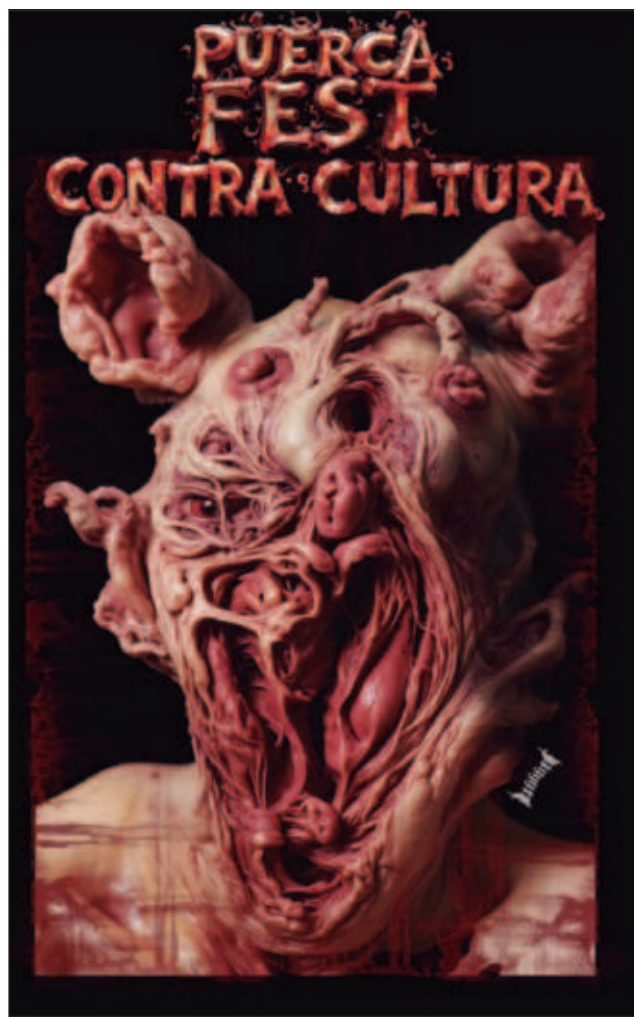
▲ El proyecto contracultura del artista yucateco u666o se llevará a cabo este viernes en la galería Amorcito Puerco; habrá una sesión de poesía y una obra electroacústica.

“Niego toda la corrupción cultural y no quiero ser parte de ello... No soy una persona que puedan censurar, soy contestatario, mientras más me quieran censurar más voy a atacar, no me gusta que censuren mi trabajo y mis ideas”.