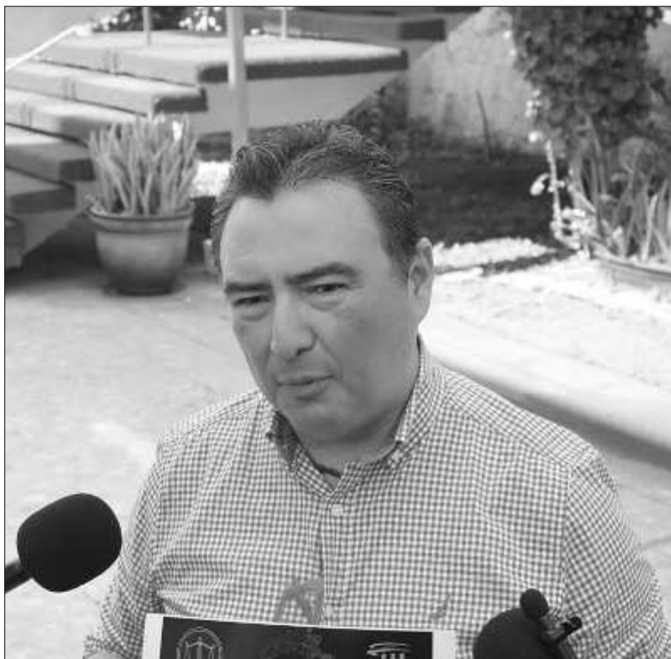
▲ El regidor exigió “que se informe cuáles son los tramos de responsabilidad y acciones a ejecutar, para poder evaluar y medir sus resultados en beneficio de la gente”.

y mucho menos sin darle garantías a los ciudadanos con convenios en lo oscuro, queremos que se aclare la forma de operación de este convenio y sus atribuciones, pues de no cumplirse podría incluso exigirse la cancelación del servicio”, finalizó.