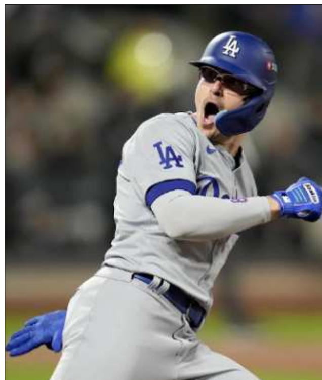
▲ Kiké Hernández, tras batear jonrón de dos carreras en el sexto acto del tercer partido de la final de liga en Nueva York.

Luis Severino cargó con la derrota tras permitir dos carreras sucias en cuatro rollos y dos tercios. El dominicano concedió cuatro boletos y los lanzadores de los Mets su-