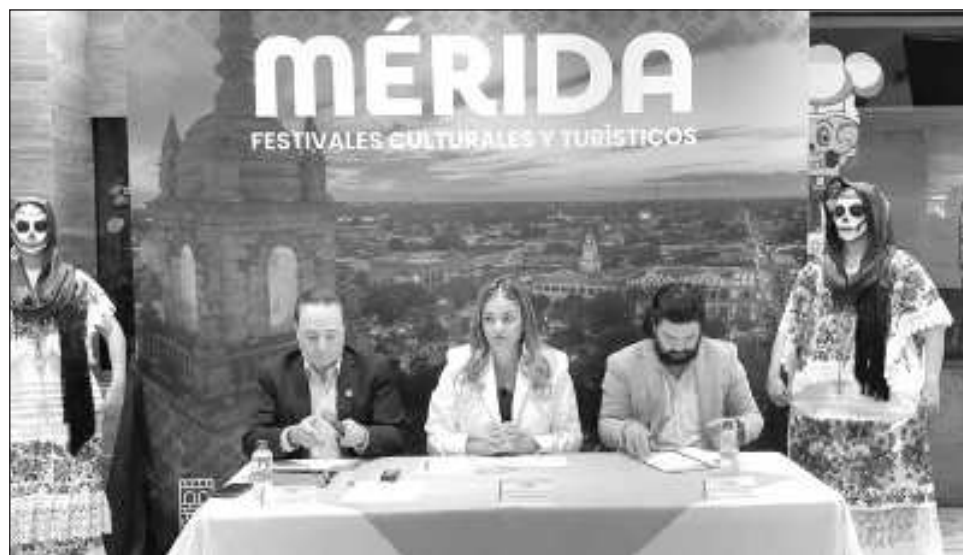
▲ Ante medios nacionales en Ciudad de México, la alcaldesa destacó que eventos como el Festival de las Ánimas, La Noche Blanca, el Mérida Fest y el Marat'hon de la ciudad promueven la identidad cultural y la calidez que distingue a las y los meridianos. Foto captura de pantalla

“De cada 100 pesos que se generan en Mérida, 11 son del turismo, por lo que es un factor de construcción de justicia social”.