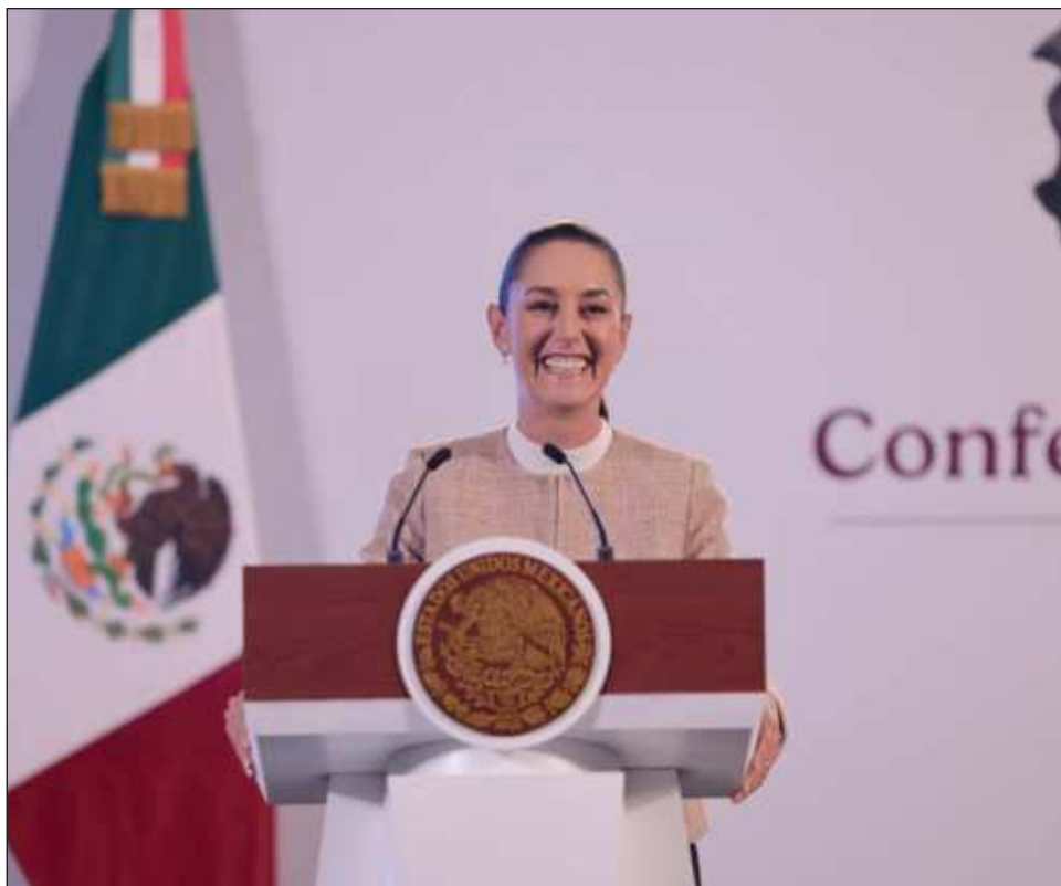
▲ La Presidenta anunció que este fin de semana realizará su primera gira por el sureste de México y visitará los estados de Tabasco, Campeche y Yucatán. En el caso de la tierra del

Mayab , será el próximo domingo 20 de octubre en Puerto Progreso alrededor del mediodía. Los detalles de su recorrido serán revelados más adelante.