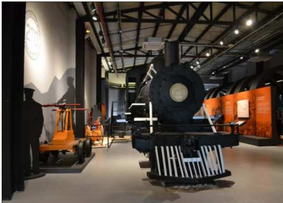
▲ El recinto alberga cinco salas permanentes y una temporal en donde se disfrutarán experiencias sensoriales, como un recorrido a bordo de una locomotora.

Además, los domingos, las personas con residencia yucateca entran gratis.