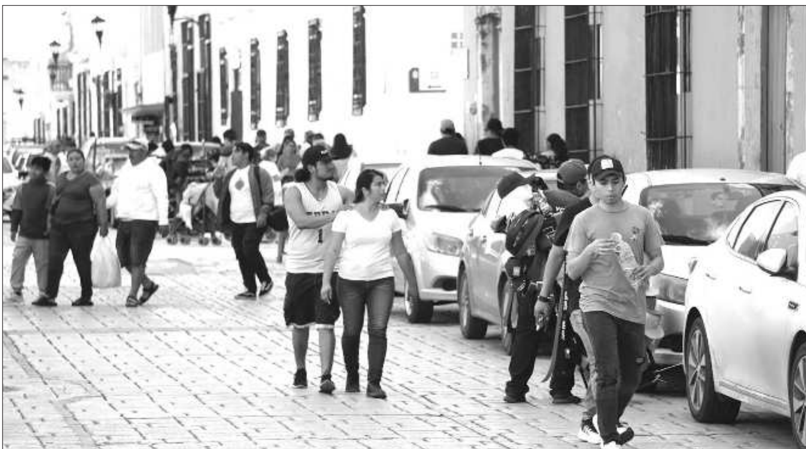
▲ “Se convirtió en un buen negocio, en una gran industria (...) Casi todos tienen un lugar para extraer néctar del juego democrático”.

Si la ideología dominante generó la circunstancia actual, ¿por qué no construir nuevos escenarios con nuevos agentes sociales en nuevos emprendimientos? La intuición de comenzar a pensar distinto puede simplificarse a imposibilidad. Quizá es tiempo de magnificarla como la más grande disputa en términos del concepto sociedad.