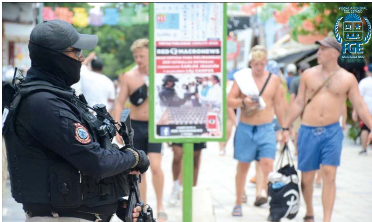
▲ Fuerzas armadas y autoridades de los tres niveles de gobierno sostuvieron una reunión en Tulum para establecer estrategias de seguridad a fin de disminuir los índices delictivos en la zona norte del estado.

Asimismo, elementos de la Policía de Investigación trabajarán encubiertos en todos los giros comerciales de la zona hotelera, a fin de actuar de