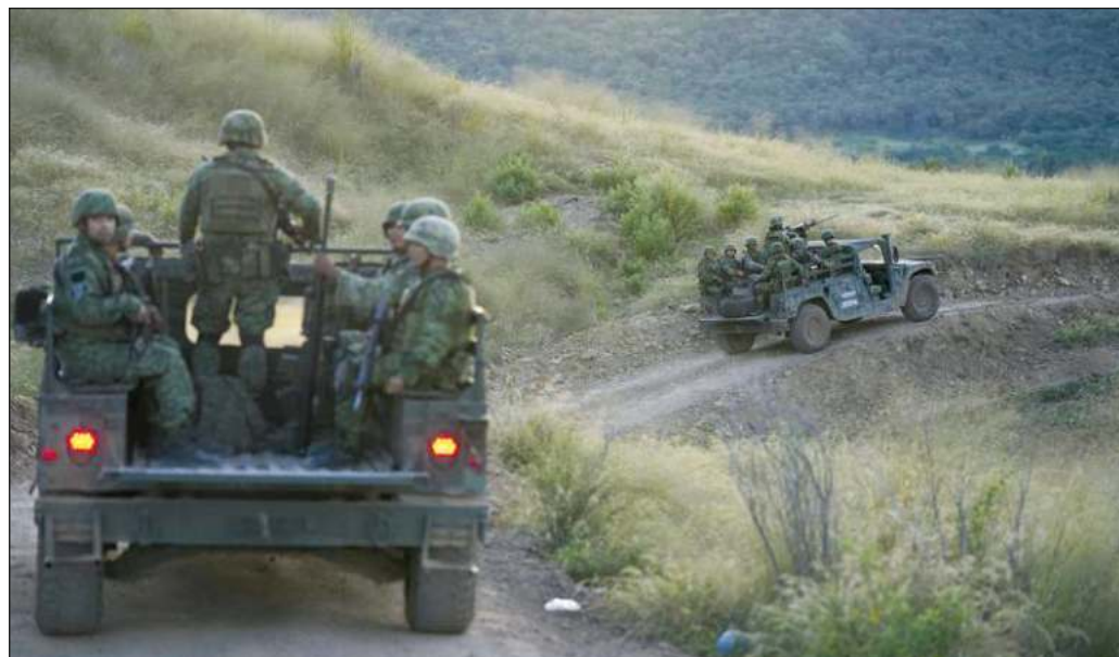
▲ Llamar “terroristas” a los cárteles mexicanos llevaría a volver a los postulados del calderonato cuya aplicación desencadenó la violencia delictiva que sigue padeciendo el país.

En México, por fortuna, y a pesar de las aparatosas acciones criminales que aún es capaz de desplegar la delincuencia organizada, no hay terrorismo.