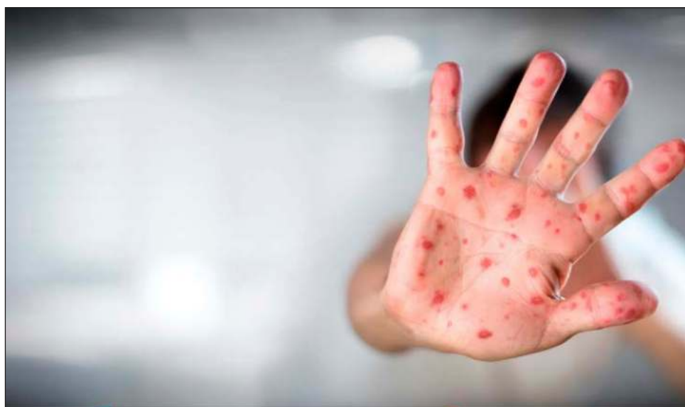
▲ Al corte del 15 de agosto, la Ciudad de México es la entidad con mayor afectación por la enfermedad pues se contabilizan 141 casos positivos confirmados; le sigue Jalisco.

En relación a las entidades con más prevalencia de la viruela símica son Ciudad de México (141), Jalisco (46), Yucatán (9) y Estado de México (9).