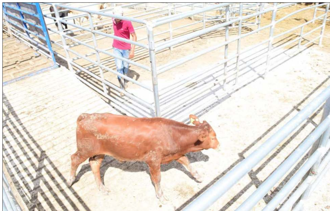
▲ El curso que ofrece la Facultad de Medicina Veterinaria y Zootecnia de la UADY comenzará en la comunidad de Felipe Carrillo Puerto, Quintana Roo, y seguirá, durante aproximadamente un año, en otros 12 municipios peninsulares.

En tal sentido, comentó que en este proyecto también participan estudiantes de las licenciaturas en Agroecología y de Medicina Veterinaria y Zootecnia, quienes realizan mo-