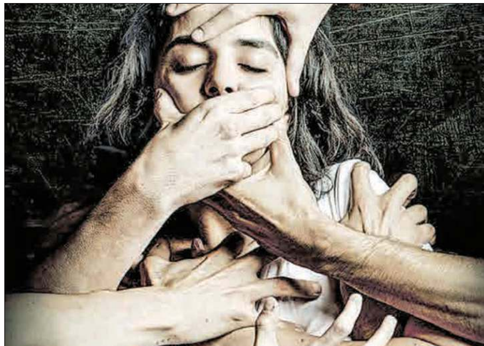
▲ La reflexión de la obra “giraría en torno a visibilizar las cosas, pues al observarlas en documentos escénicos toman otra potencia y voz”, señaló la directora.

El caso tiene múltiples aristas; remite a cinco hombres de La Manada , luego de que llega-