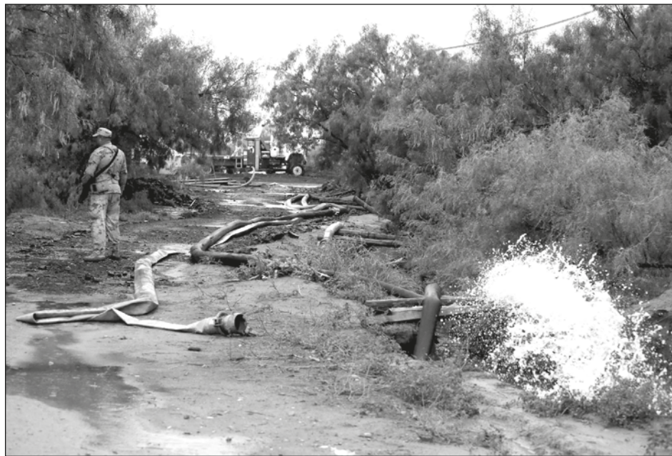
▲ El Presidente de la república subrayó que la FGR realiza las indagatorias para definir las causas y responsables del accidente que ha dejado hasta ahora a diez mineros atrapados bajo tierra, y se comprometió a no dar nuevas concesiones mineras.

Recordó que algo similar la hoy oposición hizo en Sonora, tras el incendio en la guardería ABC. “Se presentó