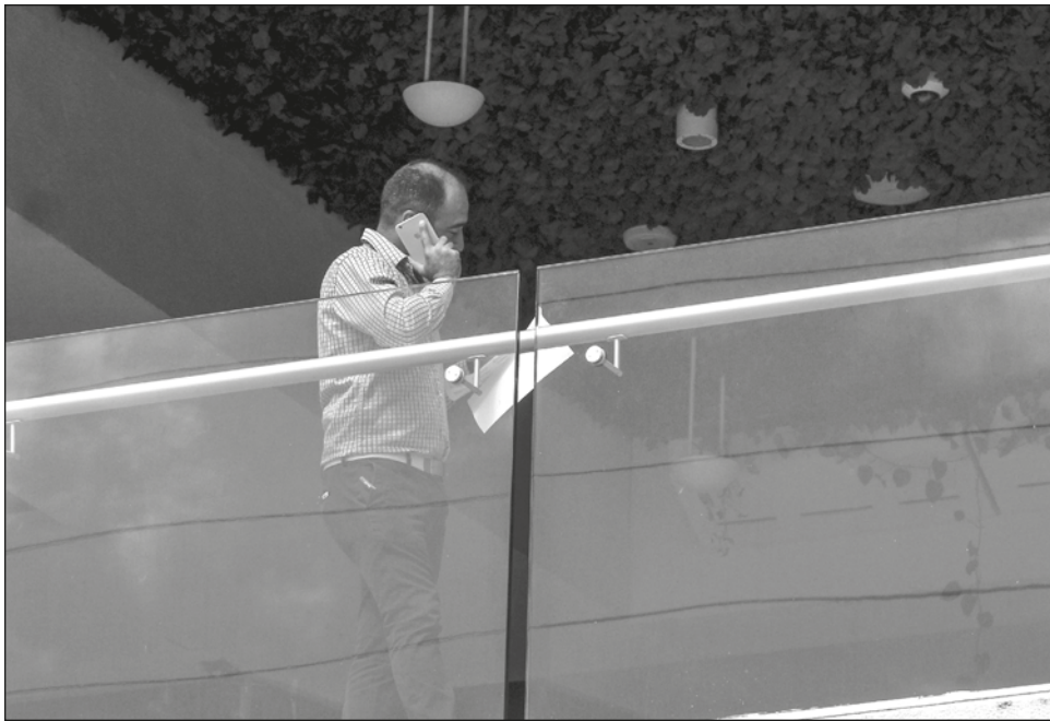
▲ Las extorsiones telefónicas "llanas" se realizan desde un penal.

Reconoció que también han tenido diversos accidentes automovilísticos, pero se han quedado en daños materiales y no pérdidas de vidas que lamentar.