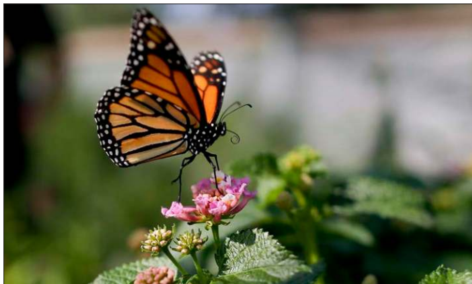
▲ La mariposa monarca migratoria fue agregada a la "lista roja" de especies amenazadas.

esto plantaran una planta de algodoncillo, el beneficio sería palpable. El algodoncillo ( Asclepias spp ) es la única planta que comen las orugas de la monarca, y es donde las mariposas adultas ponen sus huevos. Sin ella, la especie simplemente no podría existir.