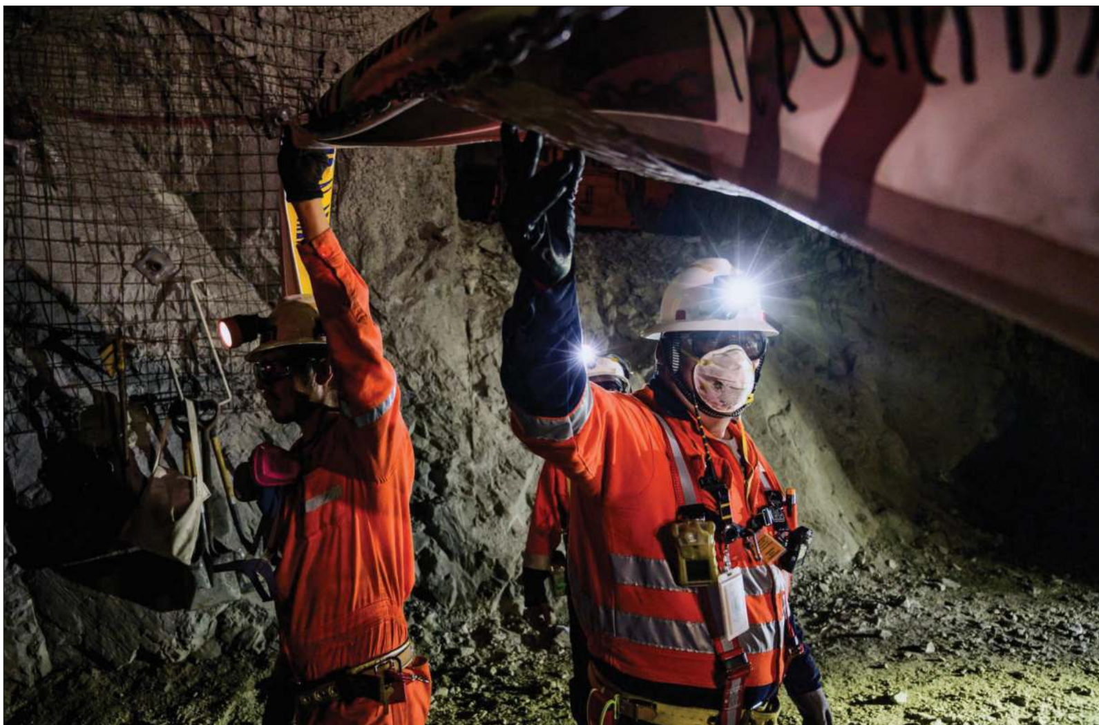
▲ "En otro y en este siglo, hombres escarban en escape frustrado, arrancando trozos negros, ahí donde reina la oscuridad total".