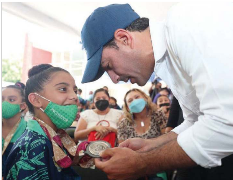
▲ El gobernador informó que en 2023 retomarán la intervención de la Unidad Benito Juárez y se rehabilitarán otros centros como estaba planeado antes de la pandemia.

Posteriormente, se dirigió hacia el Kukulcán para poner en marcha las labores correspondientes; al dirigir su mensaje, resaltó la impor-