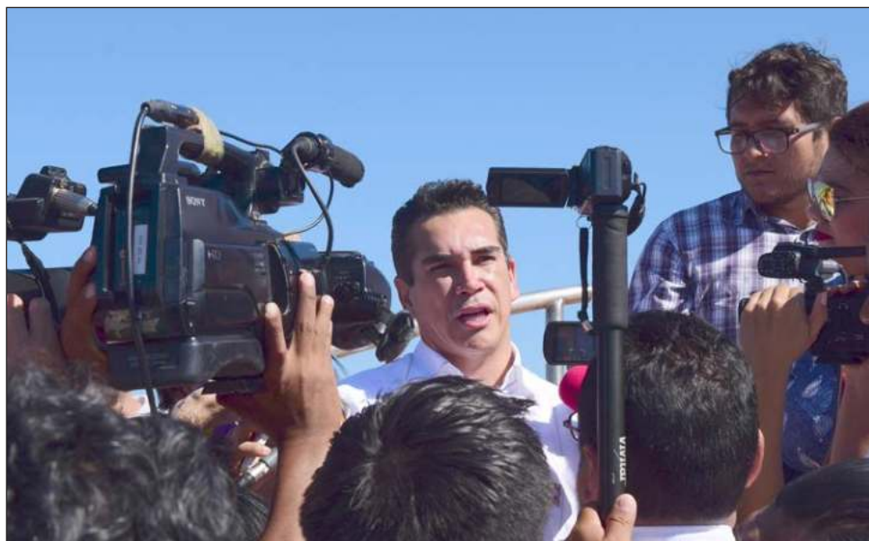
▲ Cuestionado en San Lázaro sobre la visita del fiscal de Campeche, el diputado federal y presidente nacional del PRI se limitó a decir "es bienvenido las veces que quiera venir".