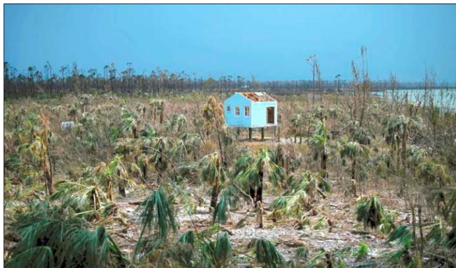
▲ Para muchos en todo el Caribe, la certeza de que habrá más tormentas de categoría 5 en el futuro subrayó la urgencia de abordar el cambio climático.

Uno de esos desastres fue el huracán Dorian,