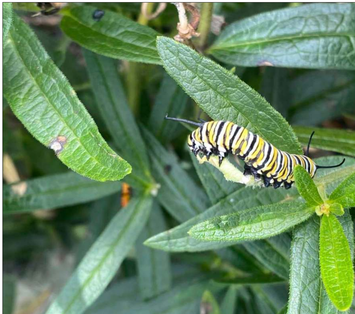
▲ "La deforestación y avance de la urbanización de los sitios en que las monarcas hibernan en los tres países ponen en peligro de extinción al símbolo de la cooperación ambiental del tratado de libre comercio".

Varios estudiosos de la monarca en Estados Unidos, entre ellos los integrantes de la Xerces Society, mostraron cómo la cantidad de ejemplares que pasan el invierno en las costas de California se redujo a niveles