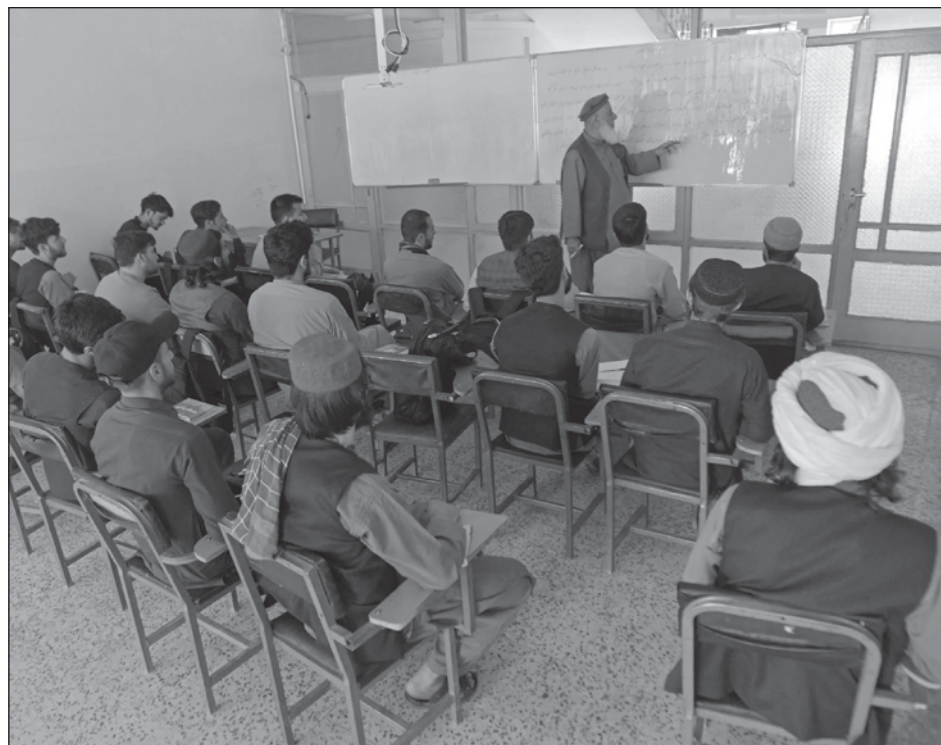
▲ El ministerio de Educación añadió cinco materias religiosas suplementarias a las ocho existentes, entre las que destacan Historia Islámica, Política y Gobernanza.

La comunidad internacional ha hecho de la educación una condición esencial para el reconocimiento oficial del régimen talibán, lo que hasta ahora no ha hecho ningún gobierno.