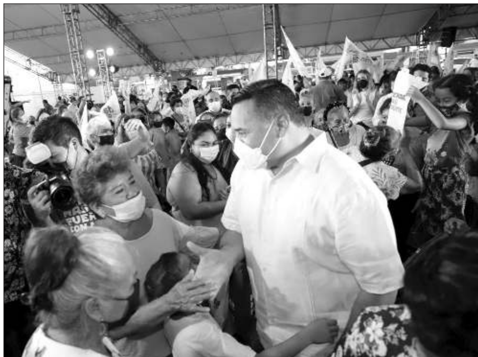
▲ En Vergel II, Renán Barrera destacó que gracias a la participación ciudadana Mérida se hace más fuerte, lo que permite remontar los problemas de la pandemia.

En economía se entregaron 230 equipos del programa Computadora en Casa y 2 mil 671 becas económicas, con Círculo 47 se brindó capacitación, visibilización y vinculación de 306 productores con mercados que propician el intercambio y precio justo de los productos y finalmente, en servicios públicos dio a conocer que