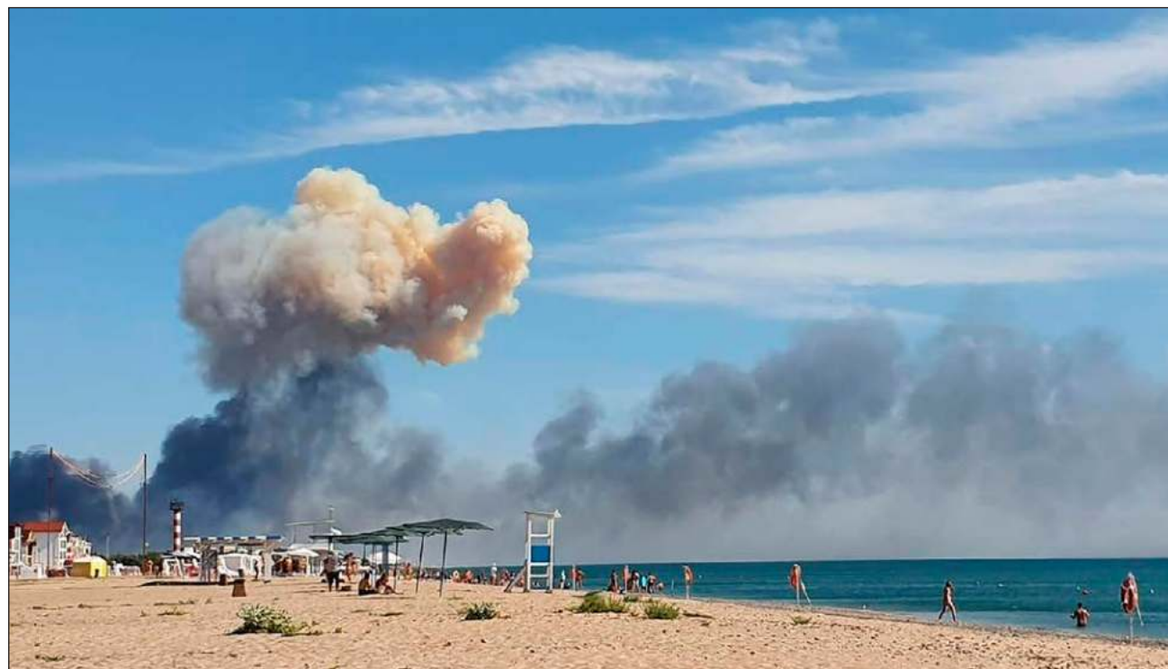
▲ El depósito militar situado cerca de Dzhankói, en el norte de Crimea, fue dañado la mañana del 16 de agosto, soltando grandes columnas de humo negro; el ejército ruso precisa que el suceso no provocó heridos graves.

El asesor presidencial ucraniano Mijailo Podoliak dijo el martes que las últimas explosiones en Dzhankói eran un “recordatorio” de que “la Crimea ocupada por los rusos son explosiones de los depósitos de municiones y un alto riesgo de muerte para los invasores y ladrones”.