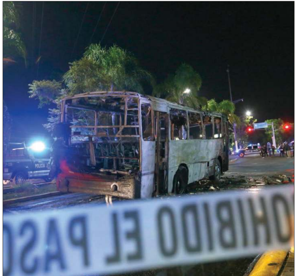
▲ Episodios violentos en muchas partes del país ahuyenta a potenciales inversionistas.

De acuerdo con el informe del IMEF, las perspectivas recopiladas por la encuesta del Comité Nacional de Estudios Económicos presentan un deterioro, con algunos pequeños contrastes y siguen mostrando un panorama complicado y poco favorable.