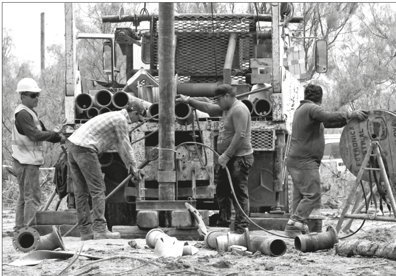
▲ Los trabajos cumplieron 303 horas y se cuenta ahora con 13 bombas que extraen 437 litros por segundo.

Velázquez detalló que el martes se iniciarían los estudios geofísicos que permitirán determinar dónde irán estas oquedades para la inyección de cemento a fin de construir una pared entre las dos minas y con ello evitar una nueva filtración de agua.