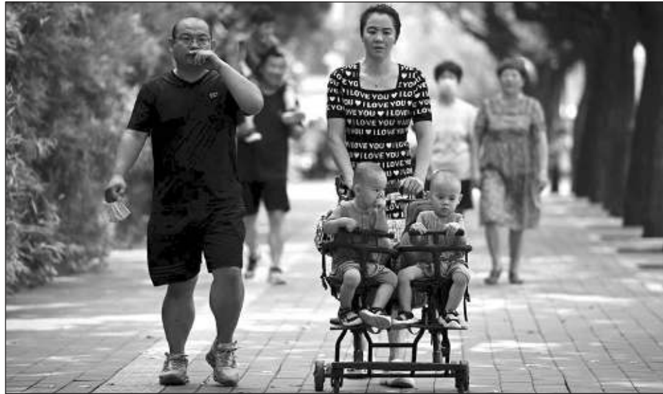
▲ China, con sus más de mil 400 millones de habitantes enfrenta una crisis demográfica que amenaza su crecimiento económico por el rápido envejecimiento de su población en edad laboral.

Por lo que las últimas pautas buscan presionar al resto del país a que tomen medidas similares.