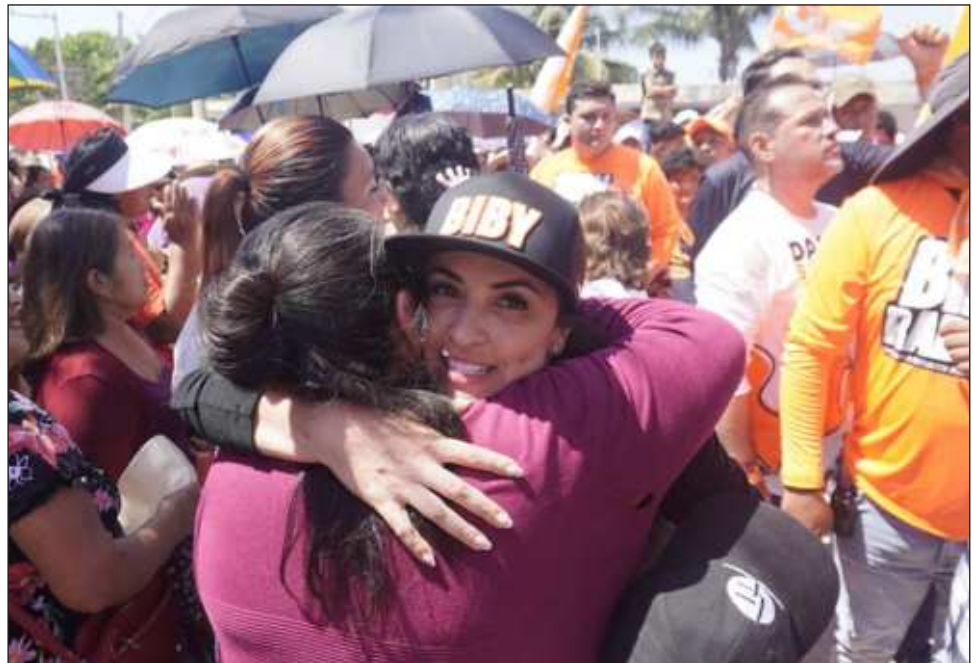
▲ Hasta ahora Rabelo de la Torre no ha dado postura respecto a la invitación de Farfán.

En el lado de Jamile Moguel Coyoc, candidata morenista, ha destacado entre