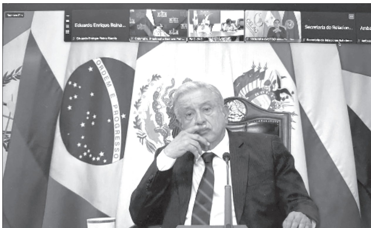
▲ En cumbre virtual extraordinaria, el presidente Andrés Manuel López Obrador recordó que México busca que Ecuador sea suspendido de las Naciones Unidas y lo declare responsable de violaciones al derecho internacional.

Ralph Gonsalves, primer ministro de San Vicente y las Granadinas, dijo que su gobierno “deplora de manera inequívoca las acciones del gobierno ecuatoriano” y agregó que su nación apoya todas las medidas pacíficas adoptadas por México para hacer valer sus derechos.