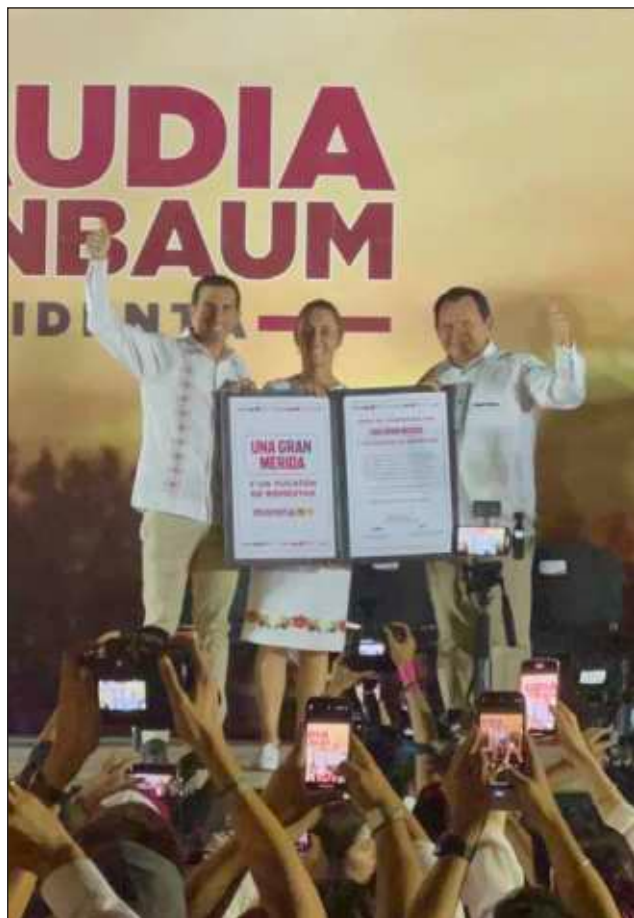
▲ Los candidatos de Sigamos Haciendo Historia firmaron ayer el Compromiso por Una Gran Mérida “para bien y beneficio de todos”.

“En la gran Mérida nadie se va a quedar atrás con Claudia como presidenta,