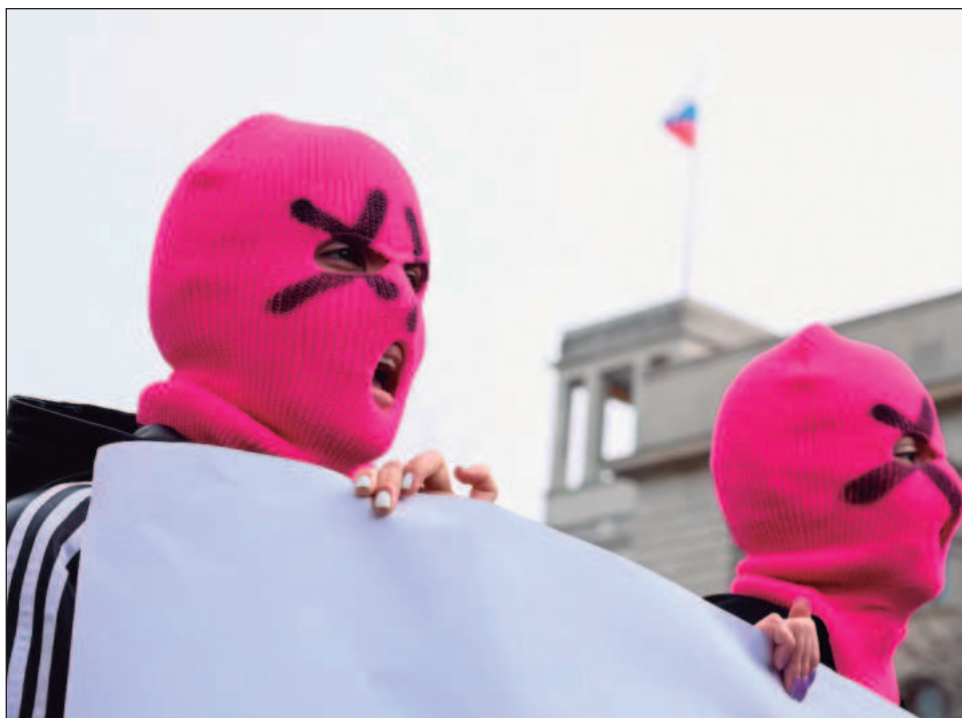
▲ El colectivo feminista se dio a conocer en 2012 con una “oración punk” que pedía a la Virgen María “expulsar” al presidente ruso, cantada en la catedral de Cristo Salvador de Moscú.

Sus miembros, muchos de los cuales han sido condenados a prisión por su activismo y hoy viven en el exilio, también se oponen a la ofensiva rusa contra Ucrania.