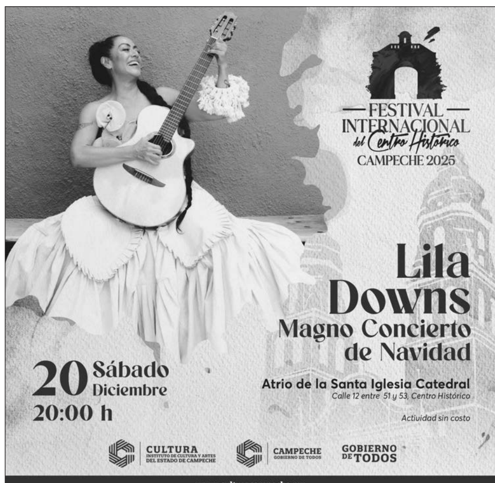
▲ El momento más esperado llegará el sábado 20 de diciembre a las 20 horas, cuando el Atrio de la S.I. Catedral se ilumine con el Magno Concierto de Navidad con la presentación artística de Lila Downs, intérprete reconocida internacionalmente.

El martes 16 de diciembre a las 20 horas, el Teatro Francisco de Paula Toro recibirá al Grupo Nematatlin, Ballet Folclórico de Puerto de Veracruz de la Universidad Veracruzana, que celebrará las tradiciones mexicanas con un