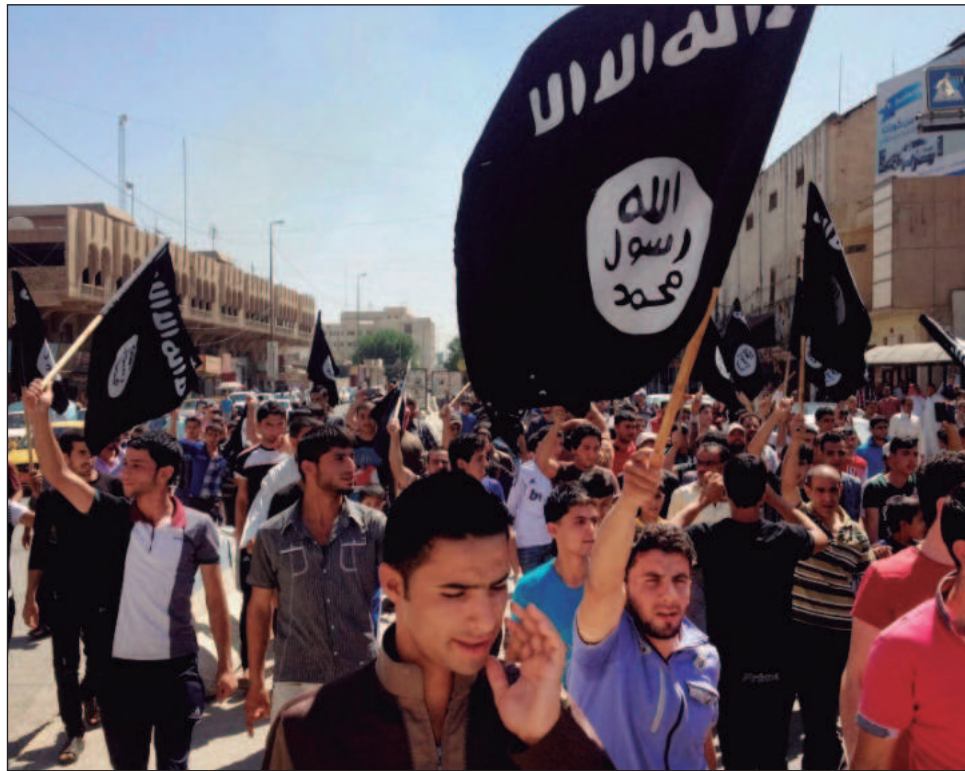
▲ El EI, que tomó territorio en Irak y Siria hace años pero ahora es una alianza descentralizada de grupos que comparten una ideología violenta, se dio cuenta hace años de que las redes sociales podían ser una herramienta potente para el reclutamiento y la desinformación.

"Para cualquier adversario, la IA realmente facilita