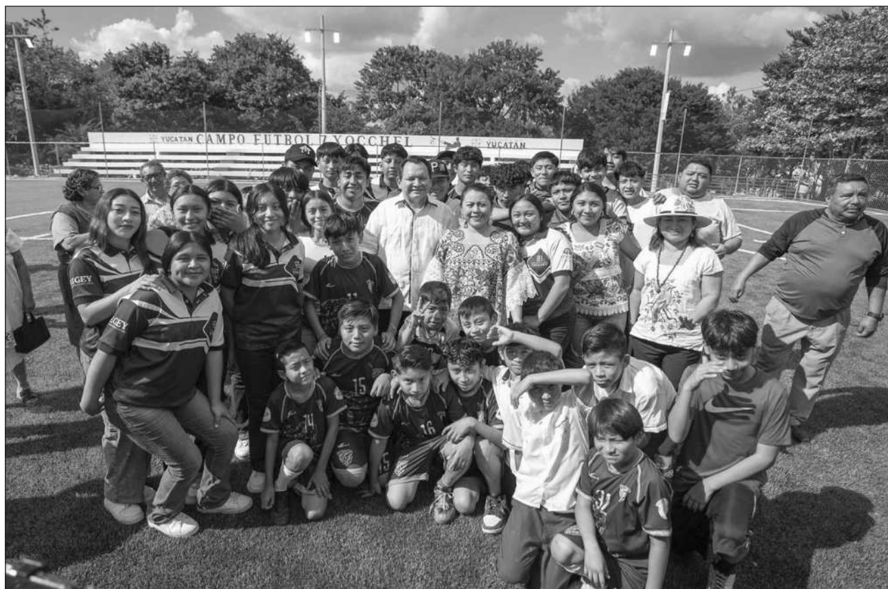
▲ Mediante una inversión estatal de 2 millones 752 mil 418 pesos, el gobernador destacó que el objetivo de la obra de rehabilitación es ofrecer a las y los jóvenes un espacio digno y seguro para realizar actividades deportivas.

“Son casas de dos cuartos, sala, comedor, cocina y baño para las familias que más lo necesitan. Nunca se había hecho en Xocchel. Vamos a