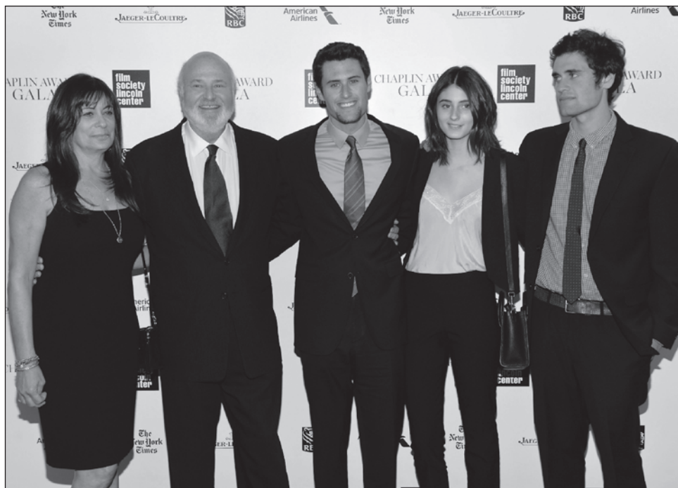
▲ Según el sitio TMZ, la hija de Rob y Michele Reiner encontró los cuerpos y dijo a la policía que un miembro de la familia sería el responsable de la muerte de sus padres.

El autor de clásicos como When Harry met Sally... (1989) o The wolf of Wall Street (2013) y su esposa fueron hallados muertos el domingo en su