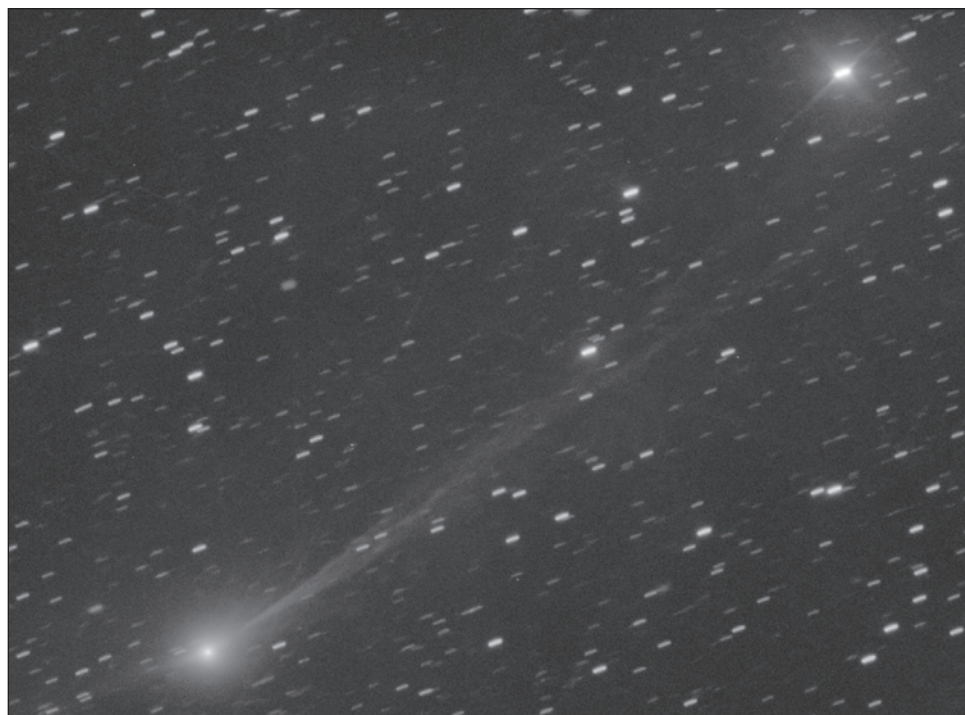
▲ Los cometas interestelares como el 3I/Atlas son absolutamente extraños y auténticos forasteros, portadores de pistas sobre la formación de mundos mucho más allá del nuestro.

Estos cometas son absolutamente extraños. Todos los planetas, lunas, asteroides, cometas y formas de vida de nuestro Sistema Solar comparten un origen común. Pero los cometas interestelares son auténticos forasteros, portadores de pistas sobre la forma-