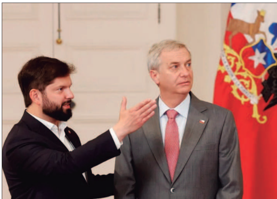
▲ Kast se convertirá, a partir del próximo 11 de marzo, en el primer mandatario de ultraderecha desde el fin de la dictadura de Augusto Pinochet hace 35 años.

Pero "quiero ser honesto desde el primer día: no hay soluciones mágicas", añadió.