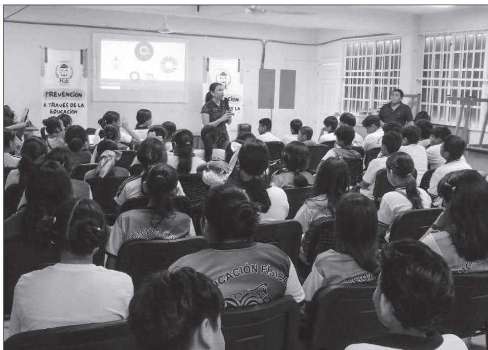
▲ Del 8 de noviembre del 2024 al 30 de noviembre del 2025, con el programa se atendieron a 94 mil 490 personas y se realizaron visitas a 85 centros educativos.