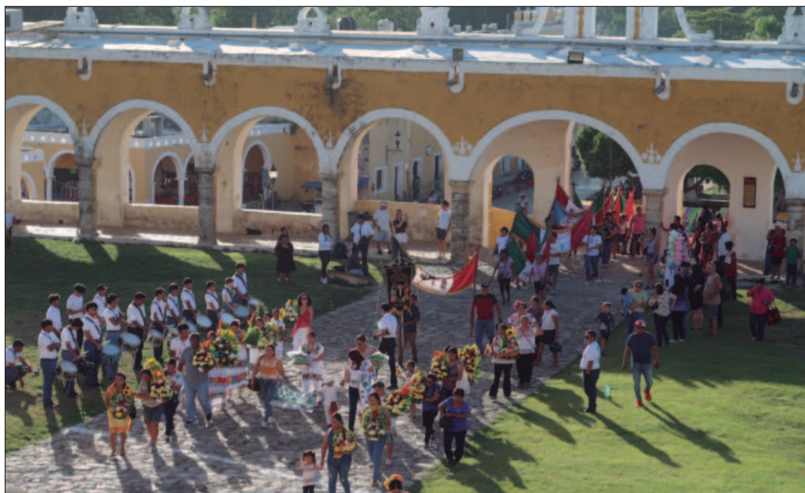
▲ “La actual Virgen de Izamal destaca por la fineza de su manufactura y por la profunda devoción que despierta. Cada 8 de diciembre, su festividad convoca a miles de peregrinos provenientes de toda la región”.

LA ACTUAL VIRGEN de Izamal destaca por la fineza de su manufactura y por la profunda devoción que despierta. Cada 8 de diciembre, su festividad convoca a miles de peregrinos provenientes de toda la región. En este sentido, Izamal puede entenderse