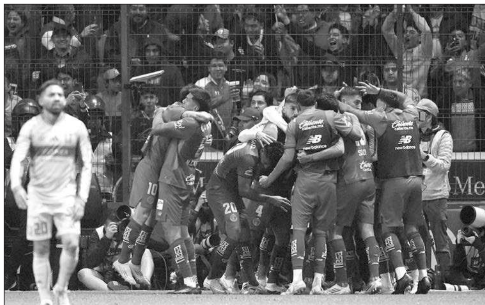
▲ Tenacidad y profundidad fueron claves para el Toluca bicampeón de Mohamed.

Como hace seis meses, cuando vencieron al América, los Diablos Rojos abordaron un autobús de dos pisos descapotable en el que recorrieron las principales calles de la capital del Estado de México para ofrecer el trofeo de