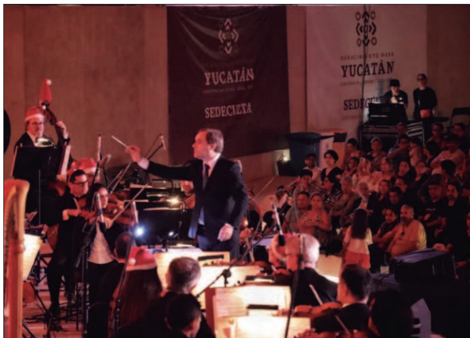
▲ La OSY presentó un repertorio versátil, integrado no solo por conocidas melodías de corte navideño, sino también por otras piezas festivas o evocadoras.