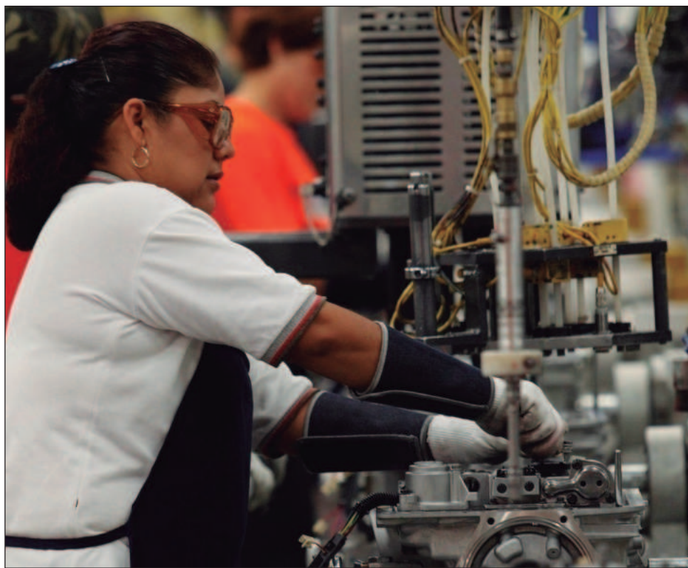
▲ El secretario de Economía, Marcelo Ebrard, detalló que el aumento de aranceles busca crear condiciones más equitativas para los productores mexicanos.

Industrias textil, de calzado, acero y automotriz registran aumentos de demanda