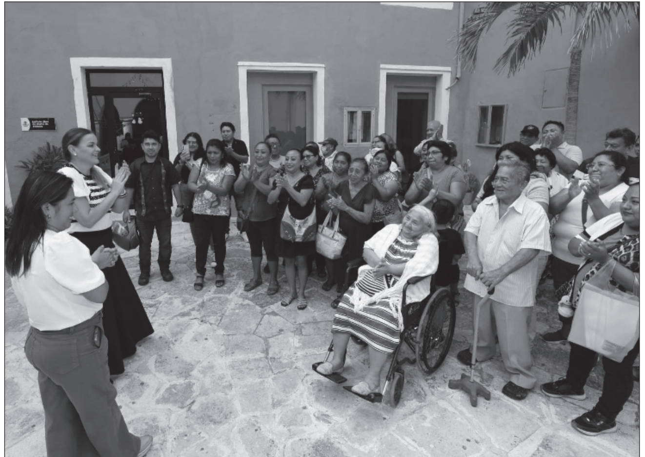
▲ La alcaldesa destacó que “entendemos que una ciudad que transita hacia el desarrollo sostenible requiere mecanismos inclusivos y una gobernanza estratégica que priorice el bienestar humano”.

“En el Ayuntamiento, nuestro compromiso es responder a la ciudadanía con seguridad, donde an-