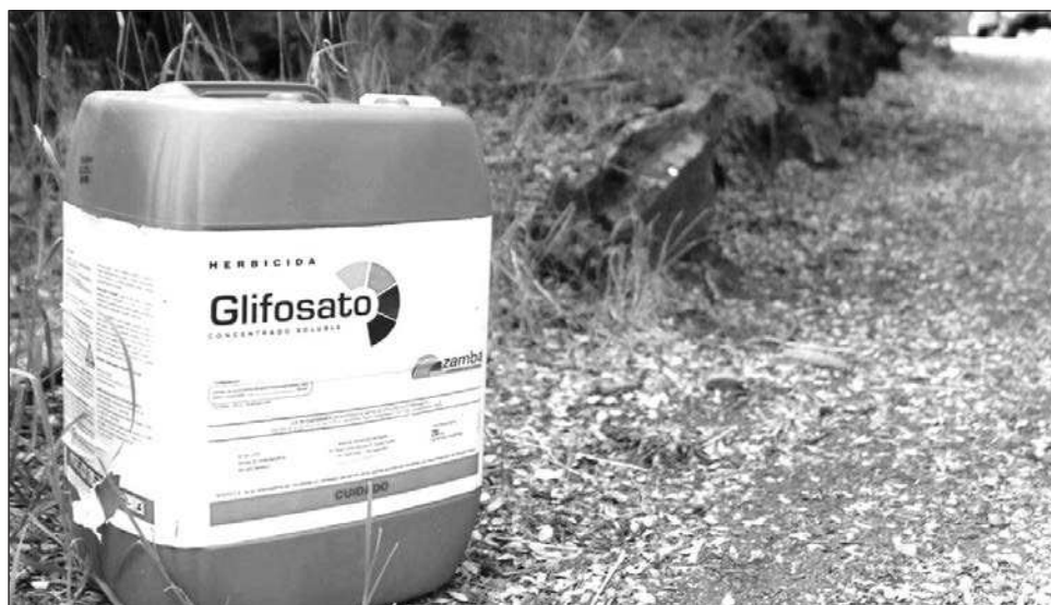
▲ Expertos en el tema consultados por La Jornada destacan que, tras la retractación del artículo, los gobiernos del mundo deben reevaluar de inmediato el uso de este herbicida.

Expertos en el tema consultados por La Jornada destacan que, tras la retractación del artículo, los gobiernos del mundo deben reevaluar de inmediato el uso de este herbicida que, si bien es eficaz