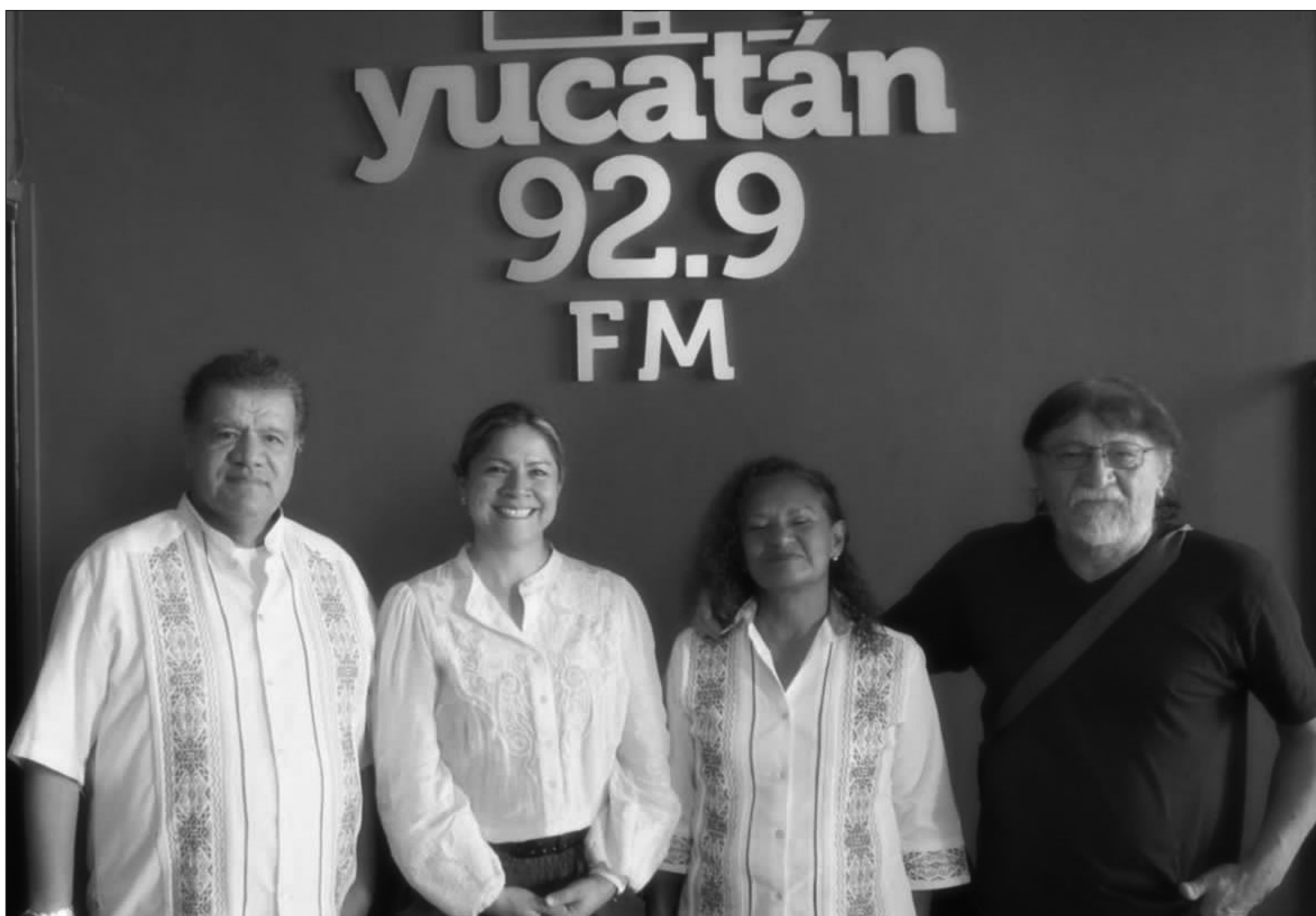
▲ "Hoy me encuentro de nuevo en la radio, y me vuelvo a topa con una directora con talento y una calidez humana que se siente de inmediato".

*Miembro del Sistema Nacional de las Artes. (2017-2019 / 2023-2025).