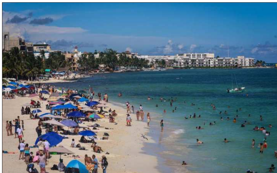
▲ El periodo vacacional de fin de año comprenderá del 20 de diciembre de 2025 al 11 de enero de 2026, es uno de los más relevantes para la actividad turística.

La funcionaria federal dio a conocer que, para el periodo vacacional de fin de año, se estima la llegada de 4.96 millones de turistas nacionales y extranjeros a cuartos de hotel, lo que representa un incre-