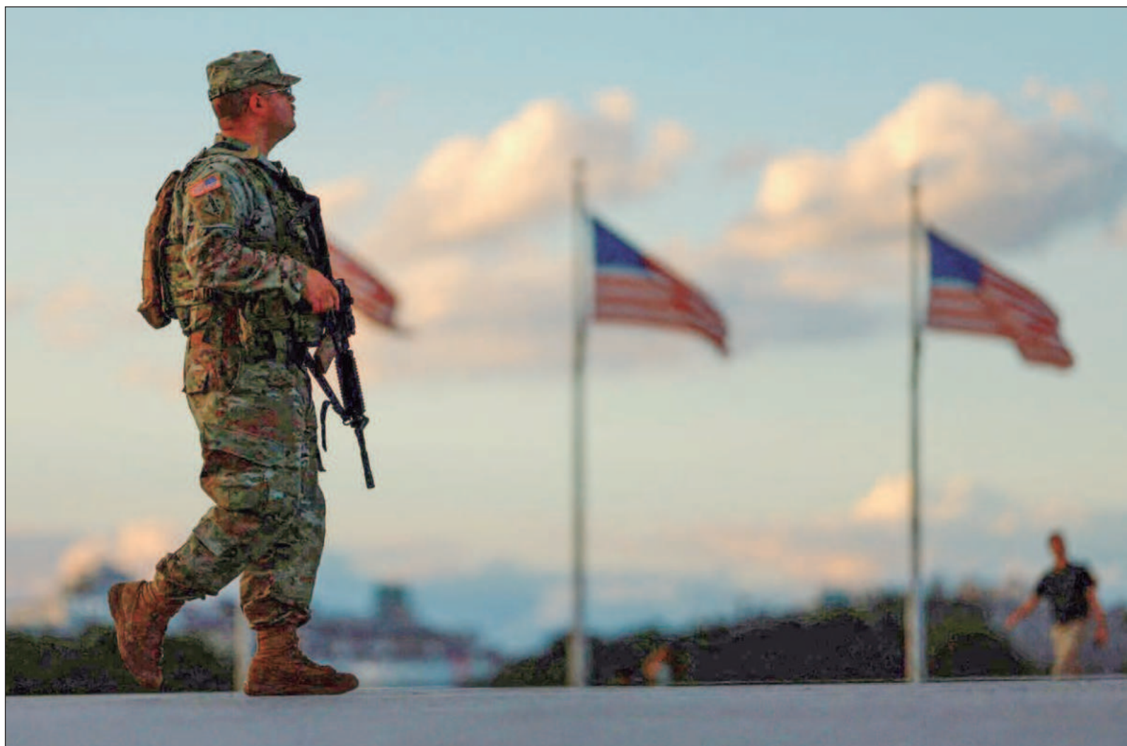
▲ "Estados Unidos se ganó la fama de ser el policía del mundo, no había región o país donde no se sintiera su presencia".