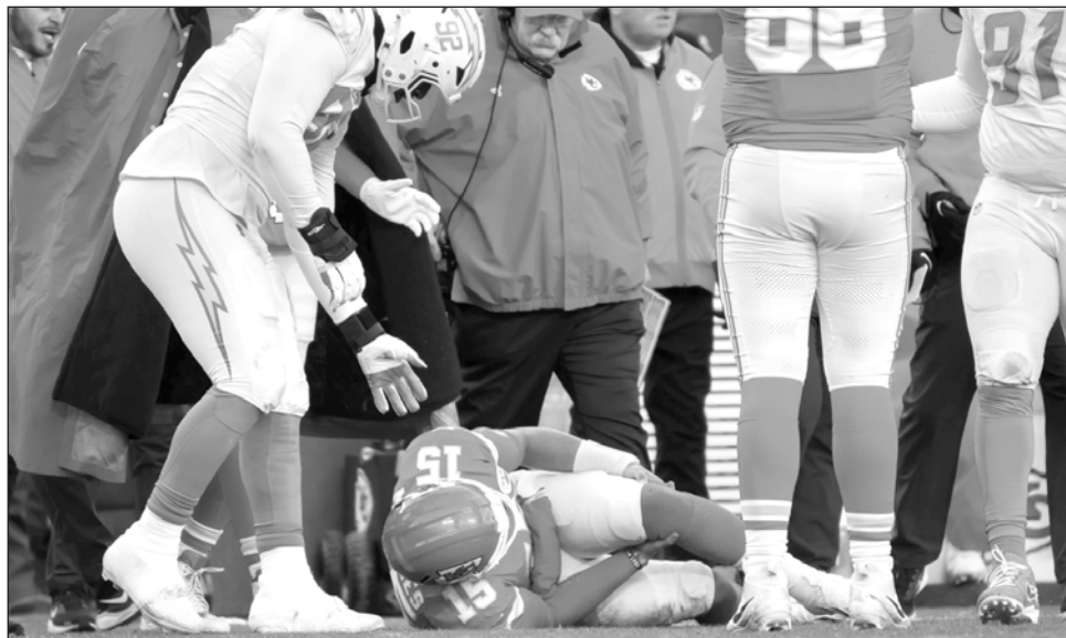
▲ El jefe Patrick Mahomes sufrió una grave lesión durante la derrota ante los Cargadores.