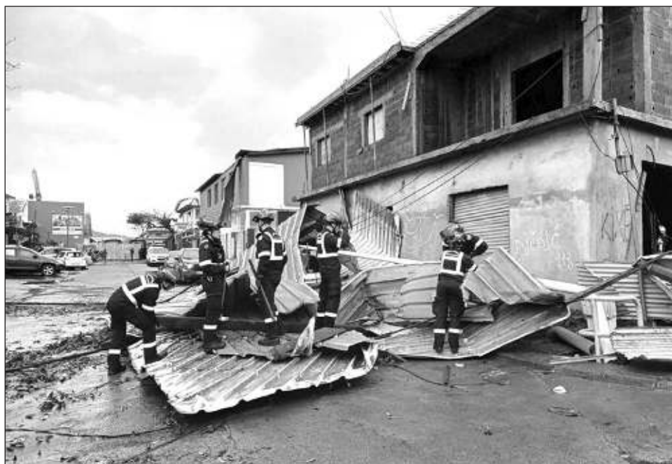
▲ Vientos de una violencia extrema azotaron el archipiélago e hicieron caer postes eléctricos, en un territorio donde un tercio de la población vive en alojamientos precarios.

Más de 15 mil hogares quedaron sin servicio