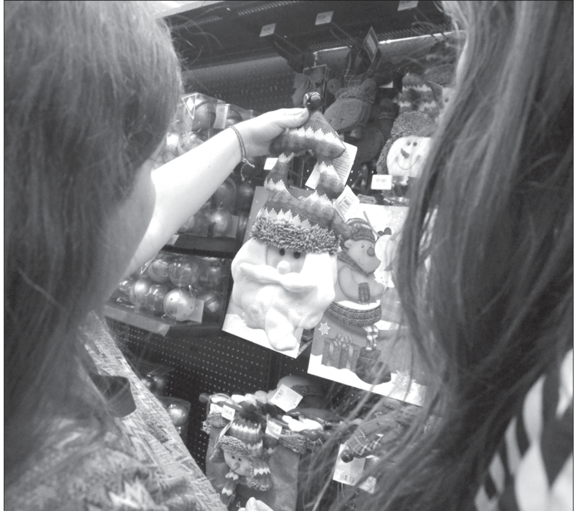
▲ “La prisa se transformó en la forma de vivir diciembre, el estrés, el espíritu; el árbol tomó el lugar del pesebre; el gordito colorado se fue adueñando de todo promoviendo el consumo”.

Un juego que teníamos como familia, consistía en ir por calles oscuras donde mi papá nos hacía creer que nos habíamos perdido, cosa que nos llenaba de miedo y de seguridad de que el sabría cómo salvarnos. Y el 24, en espera de la llegada del Niño, mi mamá preparaba macarrones, ensalada de papa, pollo asado y una bolsa de dulce y la “perdida” se transformaba en elegir cual era