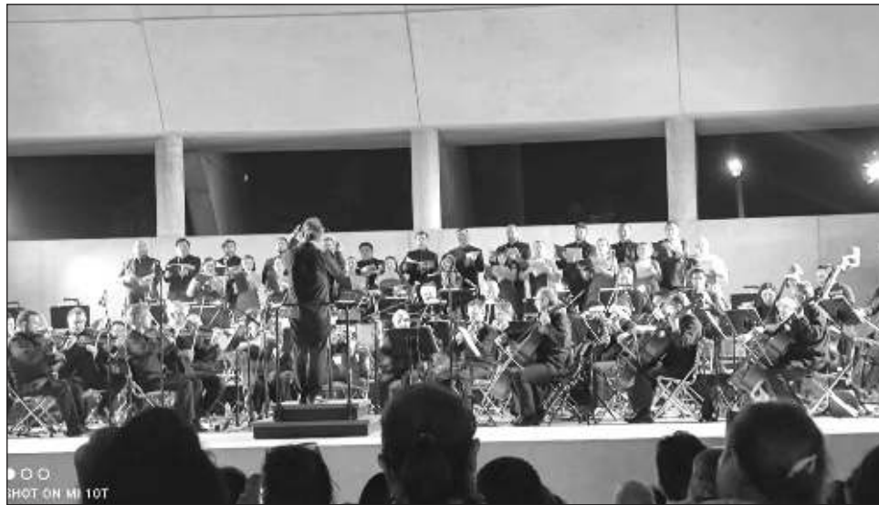
▲ Miles de personas no pudieron ingresar al anfiteatro, por lo que ocuparon los andadores y puentes de los alrededores para formar parte de esta experiencia de vida.

El ansia, el anhelo de retomar los valores de la con-