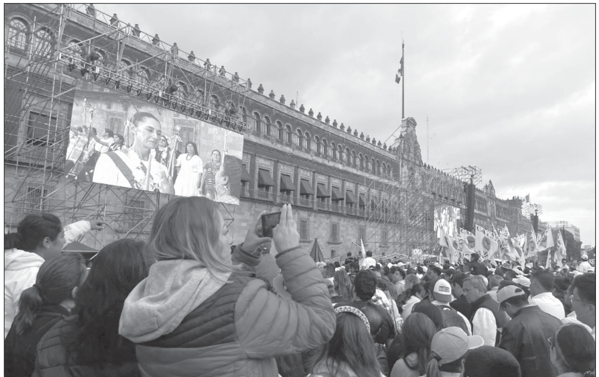
▲ "La experiencia enseña que la llegada de mujeres a posiciones de liderazgo no garantiza un impacto directo sobre los derechos de las demás. Alcanzar el poder no significa que todas logremos los mismos beneficios".

LA GOBERNANZA PARTICIPATIVA supone la incorporación real, transversal y progresiva de la ciudadanía en la toma de decisiones para resolver problemas locales y nacionales. Es un ejercicio de democracia abierta, con