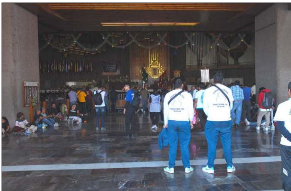
▲ Durante la misa dominical, donde asistió Ken Salazar, embajador de EU en México, se pidió “por la unión, para que todos los mexicanos, sin distinción, permanezcamos firmes sobre la esperanza”.

Sobre el tema, el editorial de Desde la Fe señaló que la iglesia mantendrá la