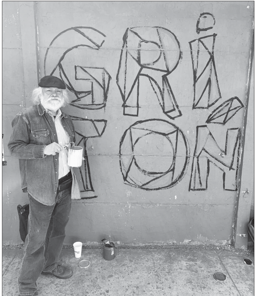
▲ "Cada artista aportó su lenguaje y discurso. Esto no es sólo un homenaje individual, es un reconocimiento gremial", afirmó Monroy, cuya contribución consistió en un plóter con una fotografía de su colega acompañado de la frase: "Gracias, Gritón ".

Por separado, Macotela destacó la labor comunitaria de Gritón , a quien describió como "un hombre querido y comprometido". En su sección del mural, pintó una de las características