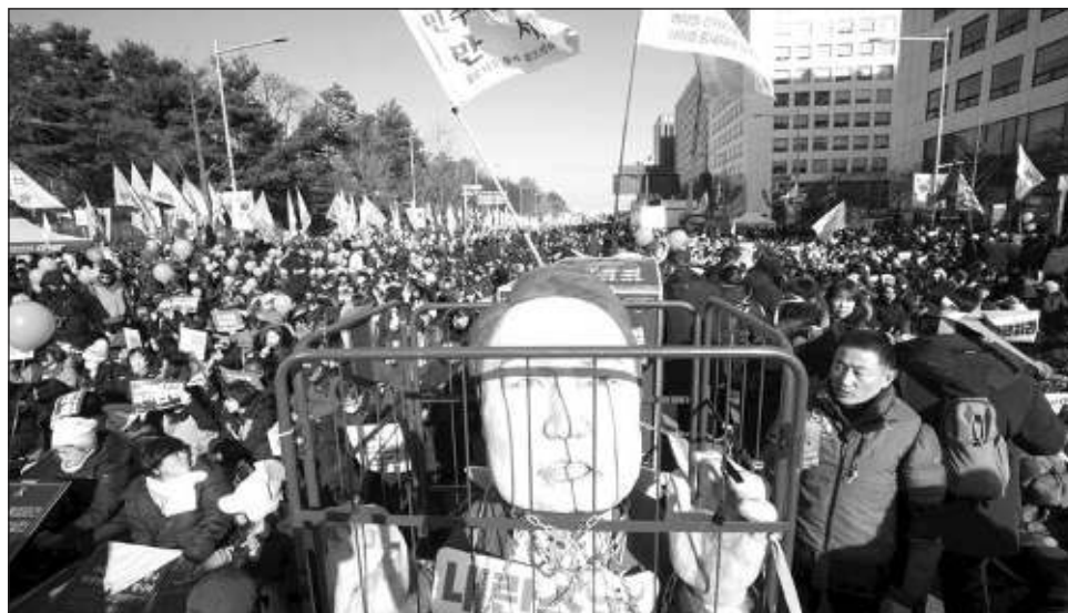
▲ Al menos 200 mil manifestantes, según la policía local, se congregaron ante el Parlamento, pese las temperaturas bajo cero, a la espera del resultado, y estallaron de júbilo al conocerlo.

“Es la única forma de minimizar la agitación nacional y aliviar el sufrimiento de la población”, agregó.