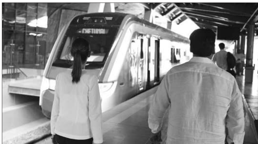
▲ Este domingo 15, la presidenta Claudia Sheinbaum Pardo inauguró los tramos 6 y 7 del ferrocarril, que ahora circunvala los tres estados de la península de Yucatán y los une con Tabasco y Chiapas.

Ahí está la oportunidad: unir Salina Cruz con el puerto de Progreso implica un viraje en el comercio mundial, que ojalá la iniciativa privada mexicana esté pendiente. Ese es un tren al que seguramente sí querrá subirse.