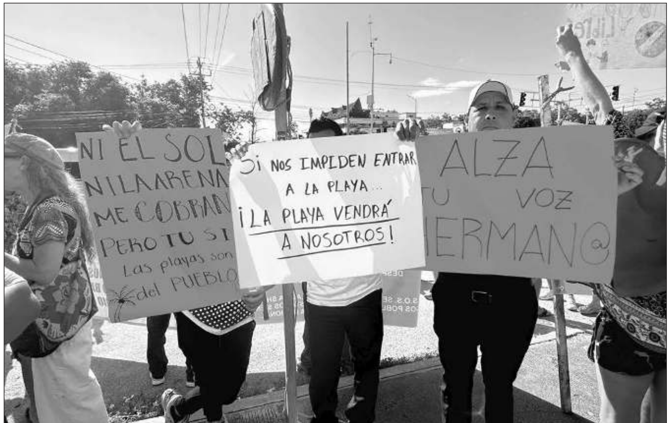
▲ Los manifestantes señalaron que los cobros son inconstitucionales y un duro golpe a la economía de mucha gente.

"Es un plantón de protesta para lograr el libre acceso a las playas públicas del Parque del Jaguar, estos cobros son inconstitucionales y es un duro golpe a la economía de mucha gente. Las playas son patrimonio de México y de los mexicanos y no se debe pagar para acceder a ellas", declaró.