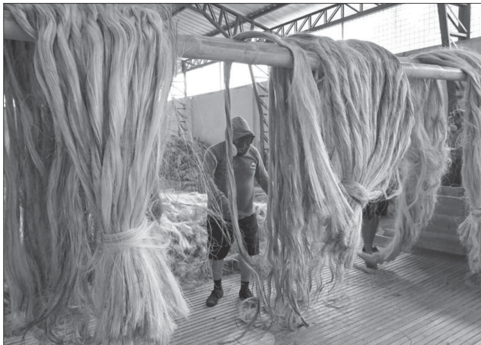
▲ "La empresa siempre es respetuosa de la institucionalidad", indicó el gerente de Furukawa. Y agregó que se tendrá "que cumplir la sentencia en la medida en la que sea posible".

"La empresa siempre es respetuosa de la institucionalidad", indicó el gerente de Furukawa. "Tendremos que cumplir la sentencia