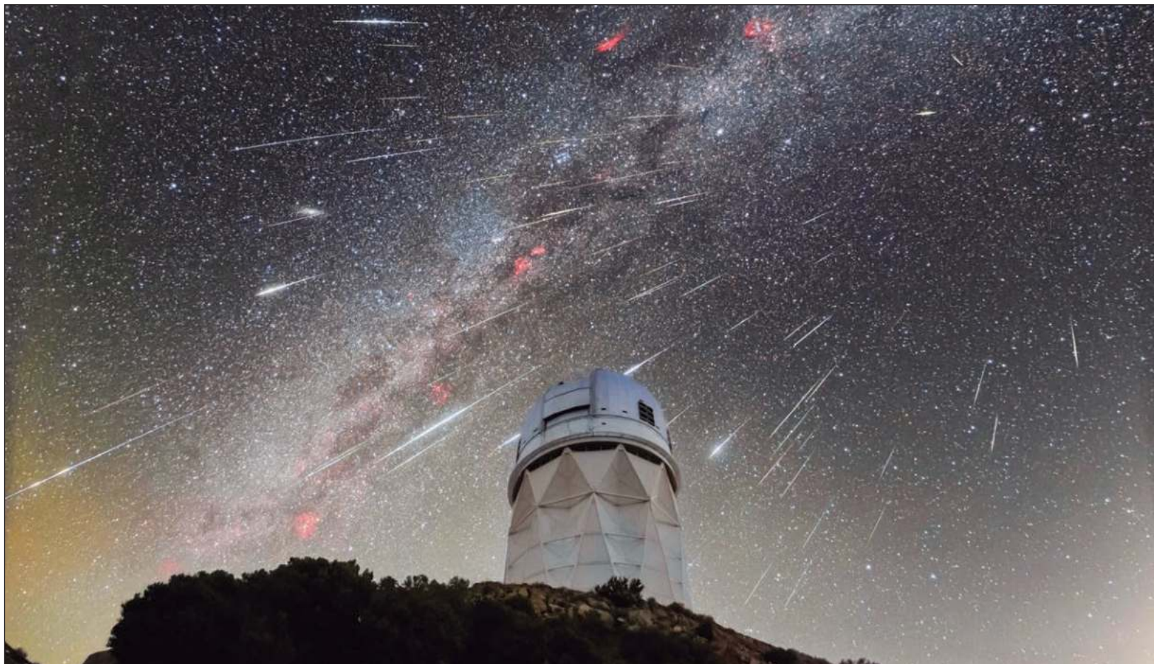
▲ "La naturaleza rocosa de los desechos de asteroides hace que las gemínidas sean propensas a producir bolas de fuego", indicó William Cooke de la NASA.

Es más fácil ver estrellas fugaces bajo cielos oscuros, lejos de las luces de la ciudad. Las lluvias de meteoros también aparecen más brillantes en noches sin nubes cuando la Luna está en su fase más menguante. La próxima lluvia de meteoros, las úrsidas, alcanzará su punto máximo el 22 de diciembre.