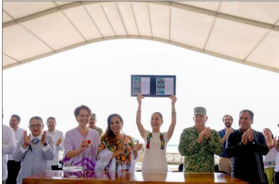
▲ Sheinbaum Pardo también canceló el timbre postal conmemorativo al primer aniversario del Tren Maya, emitido por el Servicio Postal Mexicano.

Reconoció que el Tren Maya es uno de los grandes legados del ex presidente Andrés Manuel López Obrador, que reivindica a la cultura maya y muestra el orgullo que debemos sentir por nuestro pasado y presente: “Significa