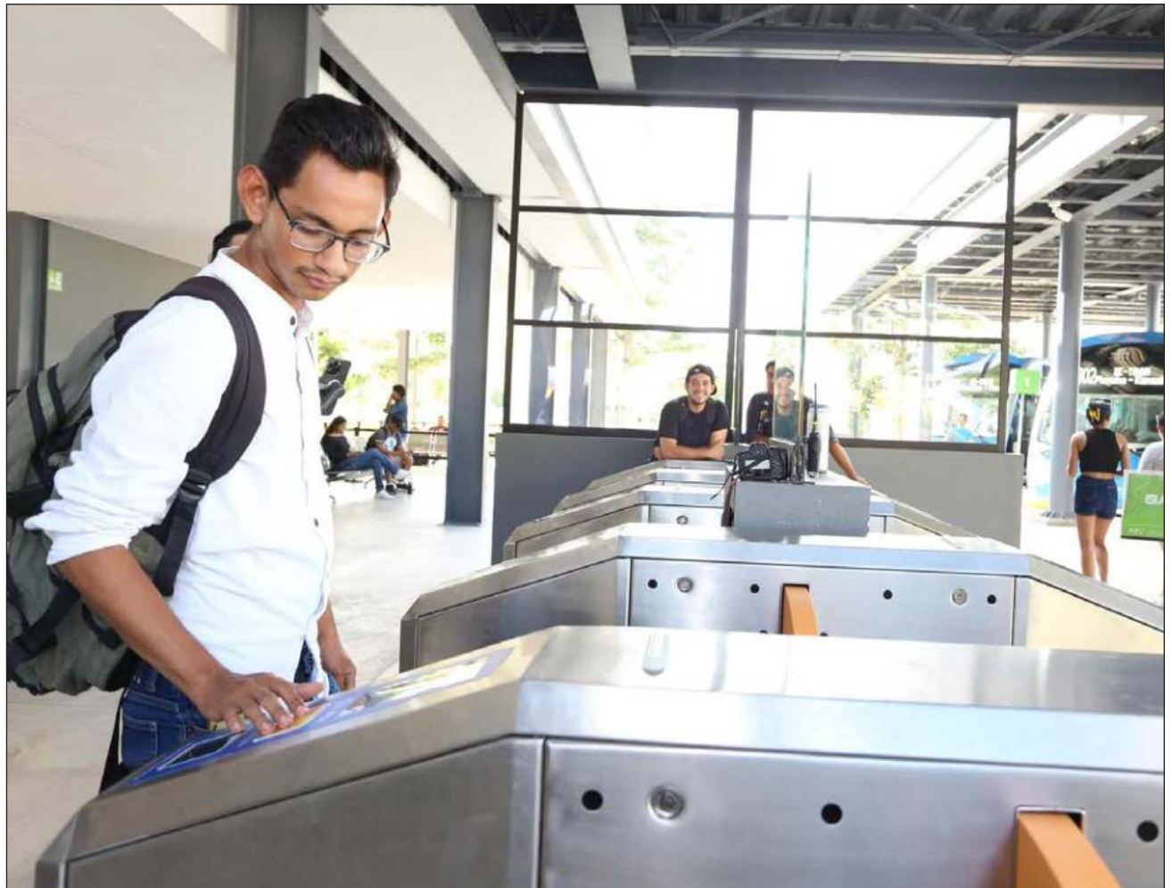
▲ Las nuevas tarjetas son de color verde y tendrá más beneficios; el canjeo es sin ningún costo.

Las tarjetas de tarifa social seguirán funcionando con normalidad.