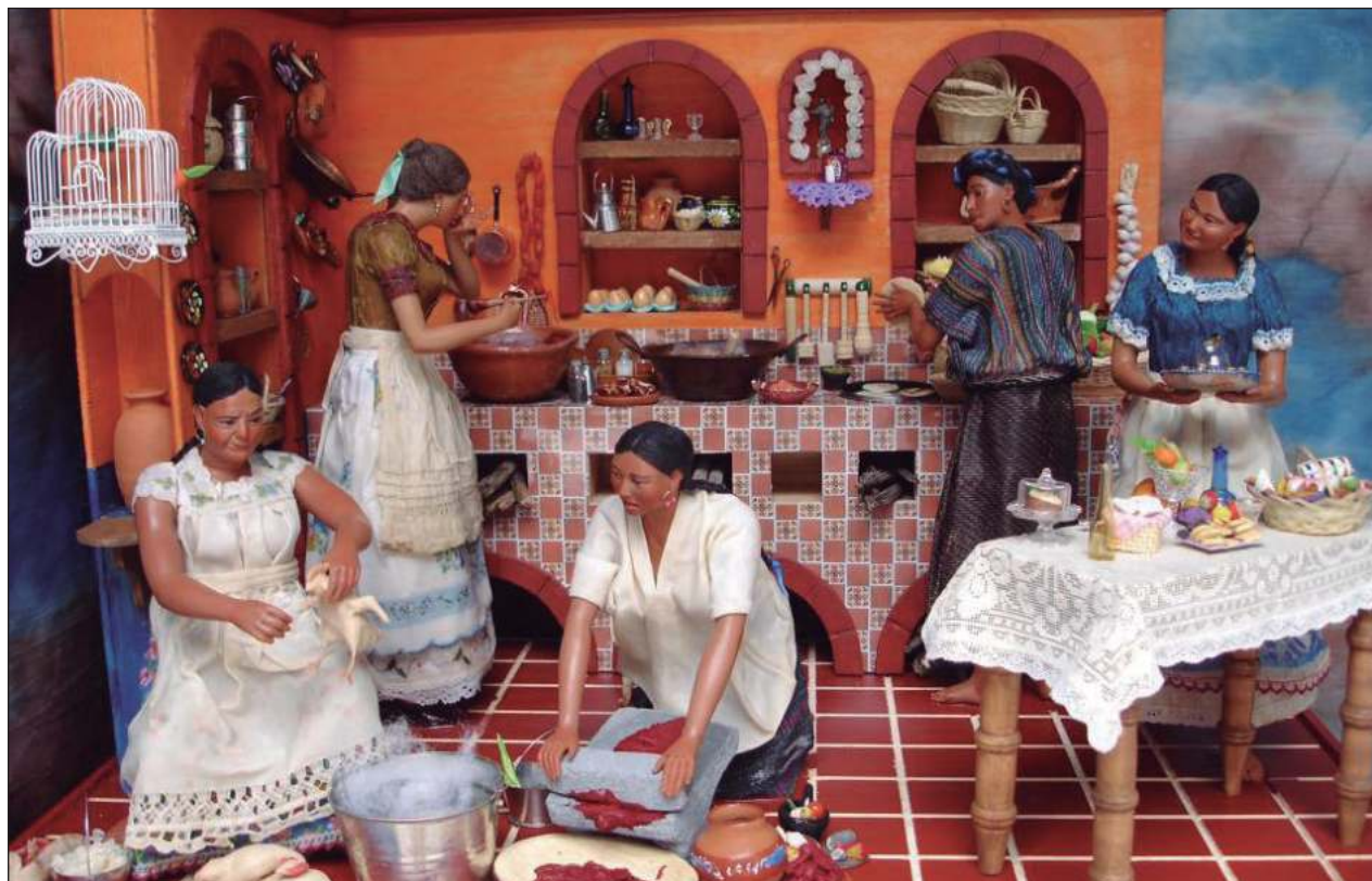
▲ "El trabajo de la cerería tiene muchas vertientes: las muñecas de cera; las velas escamadas, que ha de conocer; la imaginería religiosa, como figuras para los nacimientos".

-El trabajo de la cerería tiene muchas vertientes: las muñecas de cera; las velas escamadas, que ha de conocer; la imaginería religiosa, como figuras para los nacimientos, imágenes de santos para las iglesias; tiene una vertiente que es anatomía. En el Museo de Medicina, en Santo Domingo, las piezas médicas para los estudiantes antes estaban elaboradas en cera. En la botánica, se hacían réplicas de cera para que las plantas mantuvieran su aspecto, sobre todo cuando los viajeros venían a América y querían llevar a los reyes de Europa los especímenes que no conocían, y los elaboraban en cera; hay una gran colección, por ejemplo, en Florencia, en el Museo de Historia Natural. Esa misma vertiente, durante el Siglo de la Ilustración, se extendió hacia el ámbito de lo decorativo de las residencias inglesas y alemanas, con los fruteros de cera que quizás usted también conoció. Madame Calderón de la Barca las mencionaba cuando visitaba México. En la pintura encáustica también interviene la cerería. Todo lo que esté trabajado con cera, sea juguete, sea científico, sea artesanal, todo eso abarca la ceroplástica. Las coronas