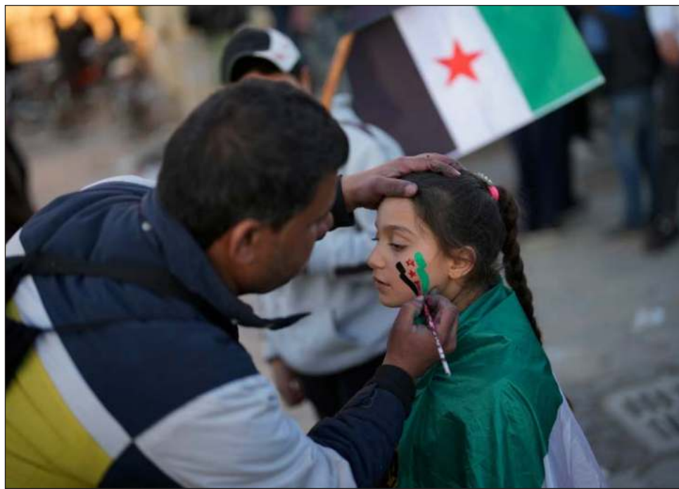
▲ El enviado de la ONU para Siria, Geir Pedersen, pidió que la transición sea “inclusiva” para evitar una “nueva guerra civil” en un país multiétnico y multiconfesional.

El ministro británico de Relaciones exteriores David Lammy afirmó el domingo que Reino Unido tiene “contactos diplomáticos” con el grupo islamista sirio HTS, que encabezó la rebelión que derrocó al presidente Bachar al Assad.