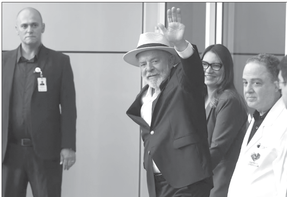
▲ El líder brasileño, conocido por su ritmo frenético de trabajo, irrumpió sin aviso en la rueda de prensa y se acercó a los micrófonos, caminando sin asistencia junto a su esposa.

Aunque se lamentó de dolores en la cabeza por la cirugía, el casi octogenario, en la mitad de su tercer mandato, dijo tener «la energía de un treintañero y la fuerza de un veintañero», un lema repetido en su campaña.