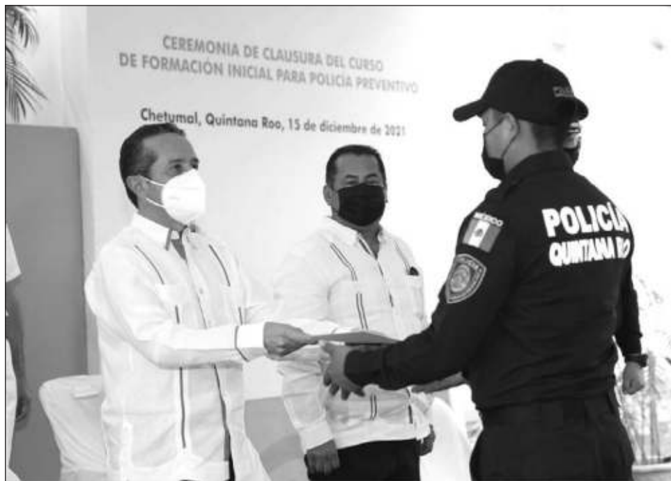
▲ Carlos Joaquín encabezó la ceremonia de clausura del Curso de Formación Inicial para Policía Preventivo.

En el evento, el gobernador Carlos Joaquín enfatizó