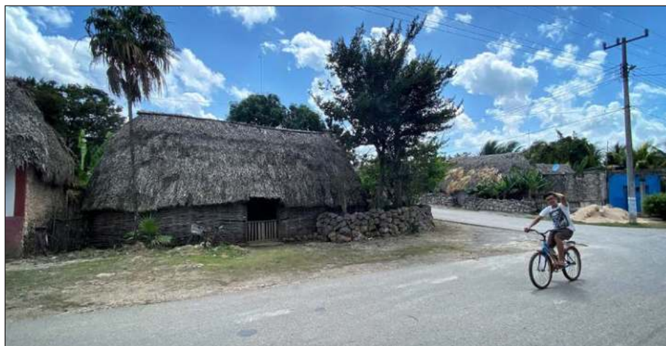
▲ Para mayo la humedad se mantuvo hasta la primera semana, y luego de ello una pequeña sequía.

El 12 de febrero de este año se dieron a conocer los resultados de las cabañuelas que transcurrieron en los primeros días de enero de 2021. En ello se arrojó la prevalencia de un clima húmedo desde mediados de enero y durante febrero, marzo y abril, cuando en efecto hubo lluvias en gran parte del territorio.