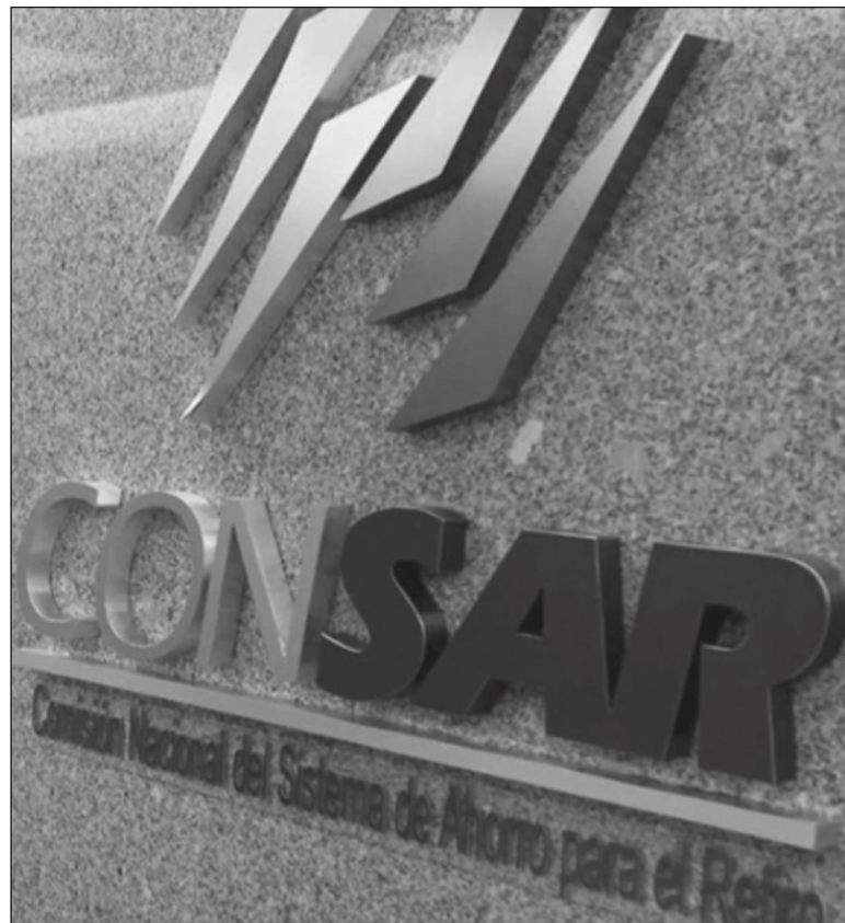
▲ Los mayores frenos para la 4T se encuentran en el Poder Judicial y el gobierno paralelo compuesto por organismos autónomos.