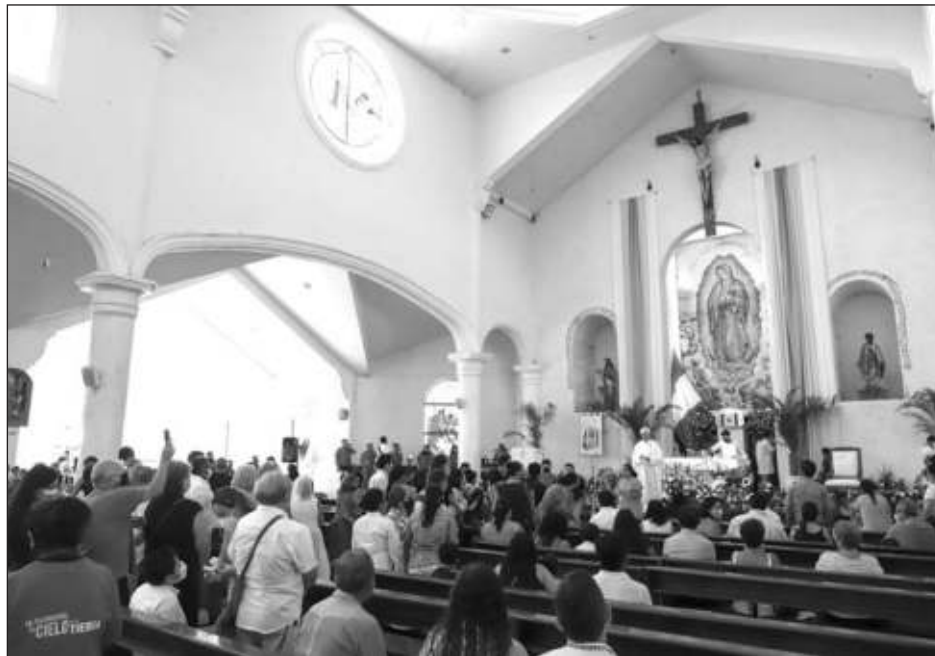
▲ En la entidad prevalece el semáforo verde, el cual contempla los servicios religiosos al 80 por ciento de su capacidad.

Lo anterior en virtud de que se prevé que prevalezca el semáforo en verde, aún en primera etapa, el cual contempla los servicios re-