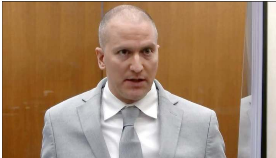
▲ Bajo las leyes penitenciarias de Minnesota, si Derek Chauvin mantiene buena conducta, cumpliría cerca de 15 años de su condena tras las rejas.

Los cargos federales incluyen que Chauvin privó a Floyd de sus derechos al presionar su cuello cuando estaba esposado sin resistirse al arresto y al no