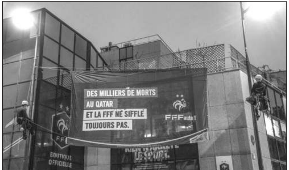
▲ Activistas de Amnistía Internacional colocan un cartel en las oficinas de la Federación de Fútbol de Francia pidiendo que atiendan las violaciones a derechos de los trabajadores migrantes que laboran en Qatar en la preparación a la Copa Mundial.

Los trabajadores no tienen permitido formar sindicatos para pelear de manera colectiva por sus derechos, además de que no hay justicia para ellos y la compensación por abusos sigue siendo escasa, permitiendo que los patrones exploten a sus empleados con impunidad, aseguró Amnistía en su