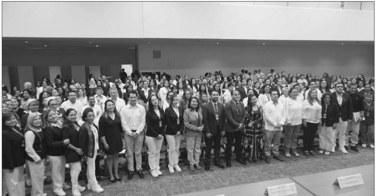
▲ Con la presencia de 286 participantes, el IMSS en Campeche inauguró el VIII Congreso Nacional de Trabajo Social.

El foro reúne al personal de trabajo social del IMSS de todo México, pero también a destacados servidores públi-