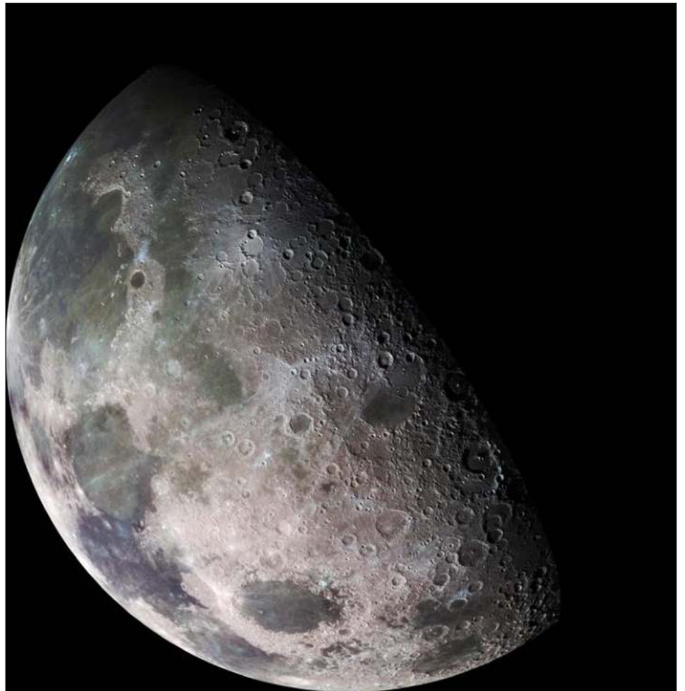
▲ “U k'a'ananil u kaxta'al le ba'alo'oba' ti' yaan tumen m'ín je'el u béeytal k-k'a'abéetkunsik le mejen mikrobiosos' ti'al u yúuchul paak'al ti' le nuxi' eek'a' tu paachil k'iin”, tu ya'alaj jxak'al xook Yitong Xia, ti' u noj najil xook Universidad Agrícola China de Pekín.

Ichil ba'ax a'alab tumen ajxak'al xooko'obe', bakteriyase' tu beeta'aj u p'áatal maas aasidóo le lu'umo'. Le beetike', le beyka'aj p'it yanik u bak'pachil pHe' tu beeta'aj jáawal minerales insolubles u ts'u'uts'majo'ob fosfato yéetel tu cha'ajo'ob fosfooróo yaan ti'ob, ts'o'oke' beey úuchik u nonojkiinsiko'ob mineeral yaan ti'al xiiwo'ob.