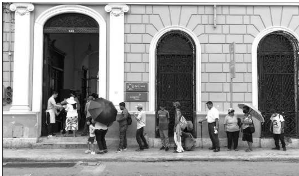
▲ El centro de operaciones es una casona del centro de Mérida, donde más de 200 mil personas con alguna discapacidad, sin hogar o con cierta vulnerabilidad han encontrado un plato nutritivo.

De poco vale presumir al mundo el nivel de la gastronomía que se posee, cuando al mismo tiempo se tiene una institución que ha rescatado toneladas de alimentos, destinados al desperdicio. Nada, después de tanto esfuerzo invertido, debiera desperdiciarse. El trabajo de cientos de personas dedicadas a preparar comida es visible en este momento en Acapulco, donde una comida caliente brinda esperanza a miles que perdieron el modo de subsistencia tras el azote del huracán Otis, y un alimento recuperado indica que también los seres humanos podemos reponernos a la adversidad; falta también que reconozcamos que en la mesa caben todos.