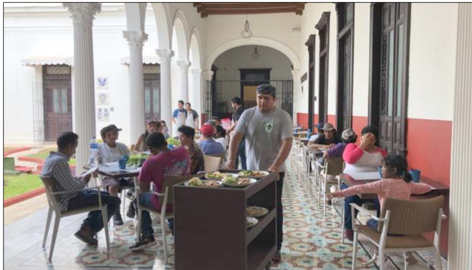
▲ Además de todas las actividades altruistas, Refettorio Mérida consentirá a sus comensales habituales con la visita de los chefs aliados el viernes 24 de noviembre.

Además, Refettorio ha contribuido al rescate de 91 mil 76 kilos de alimentos que estaban destinados al desperdicio a pesar de que todavía contaban con nutrientes.