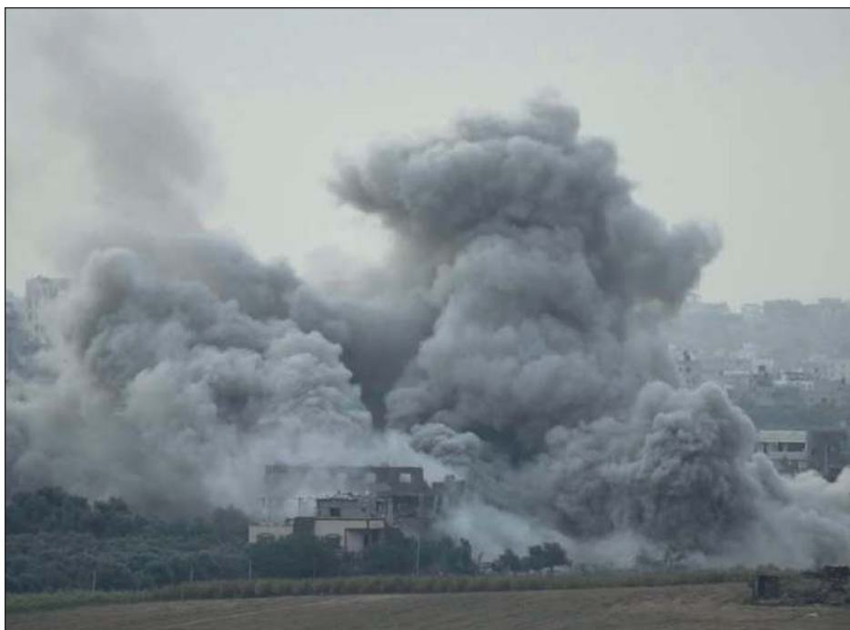
▲ “Esto no puede continuar. Las partes en conflicto deben respetar el Derecho Internacional Humanitario, acordar un alto el fuego humanitario y detener los combates”: Martin Griffiths.

Durante semanas el Ejército insistió en que iba a destruir toda la “infraestructura terrorista” de Hamas en el norte del Franja, bombardeando por tierra, mar y aire, e instó a la población a trasladarse a la zona sur “más segura”, aunque allí también se han registrado ataques.