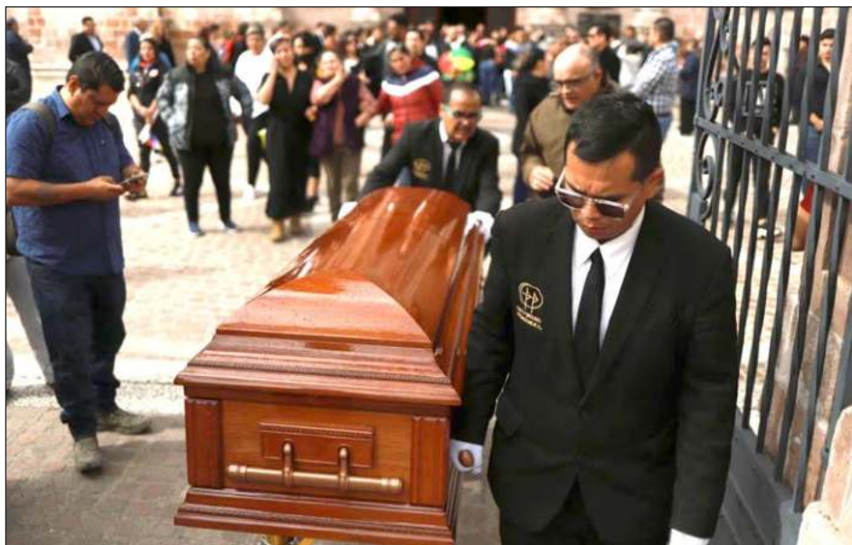
▲ Familiares de la magistrada Jesús Ociel Baena —asesinado el lunes presuntamente por su pareja, quien luego habría cometido suicidio— no creen la versión de la Fiscalía Aguascalientes y aseguran contar con pruebas que le darán un giro a la investigación.