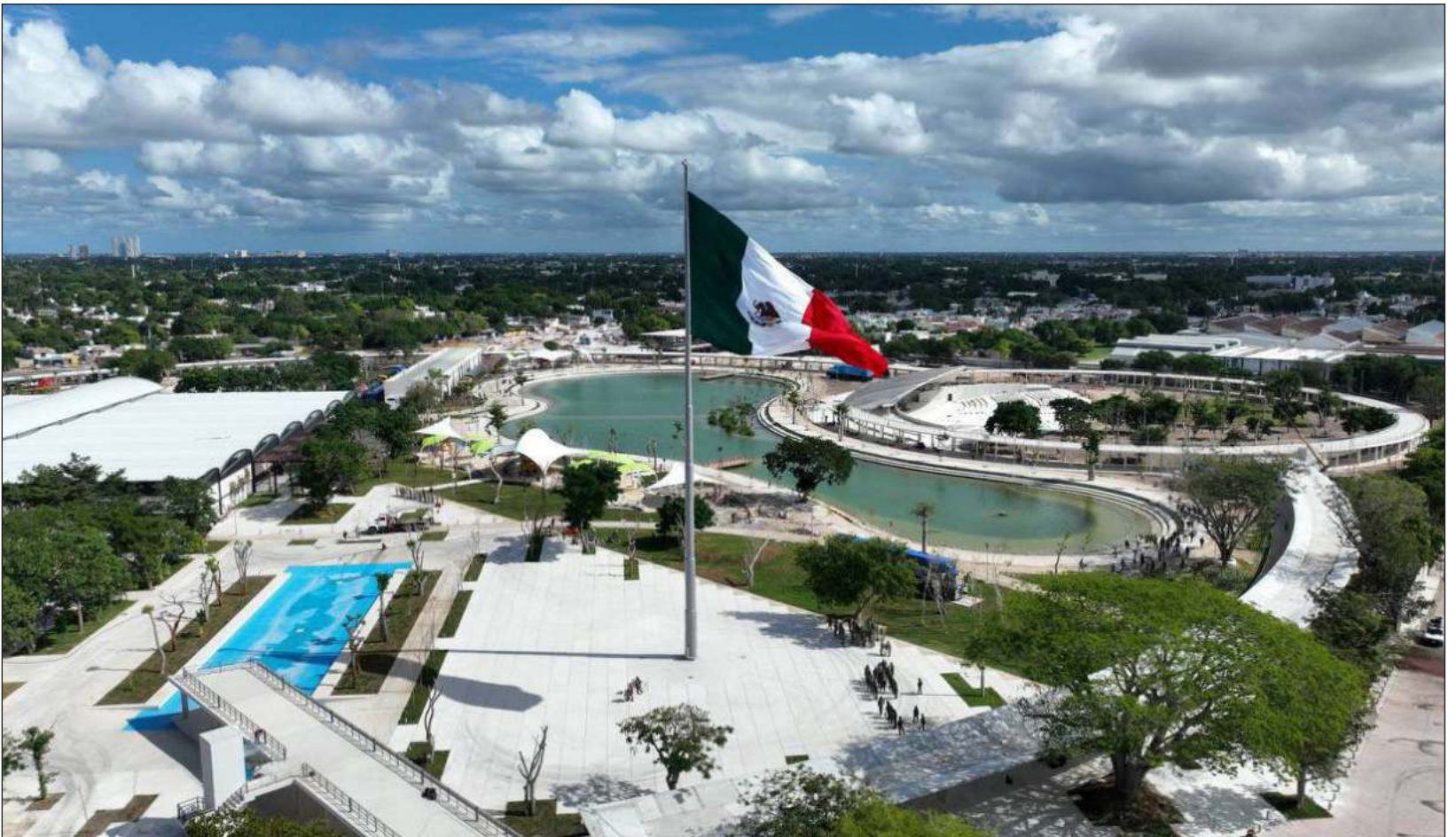
▲ Este proyecto, con 22 hectáreas de superficie, se realiza mediante una inversión de más de mil 300 millones de pesos.