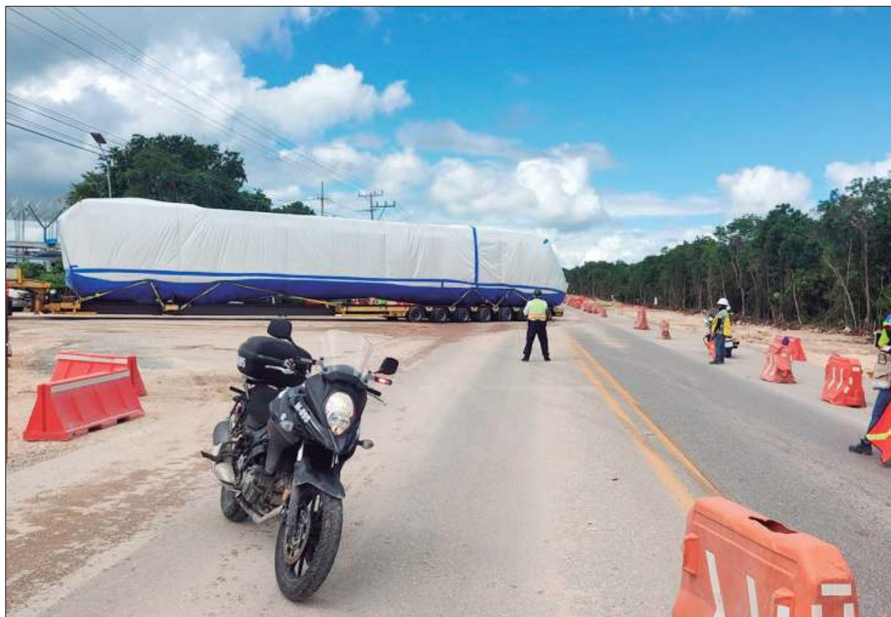
▲ El convoy arribó a la estación Cancún Aeropuerto por el libramiento carretero a Mérida.

Se espera que López Obrador llegue a la ciudad para un nuevo recorrido de supervisión