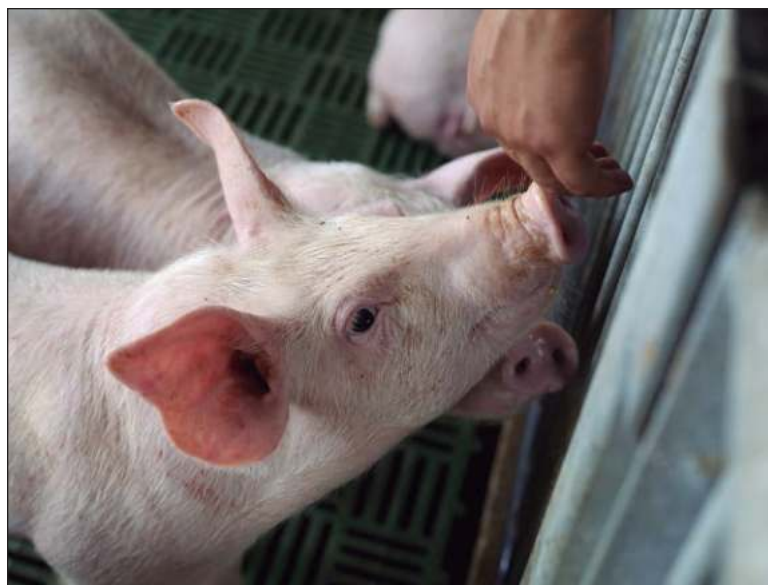
▲ Las instalaciones y procesos de Kekén cuentan con estrictos controles sanitarios dirigidos a evitar las enfermedades en el hato porcino.

Cloverleaf Animal Welfare Systems a través de su certificación internacional en bienestar animal “Certified Care”, se alinea con las directrices y recomendaciones de la Organización Mundial de Salud Animal (WOAH por sus siglas en inglés) en materia de bienestar animal.