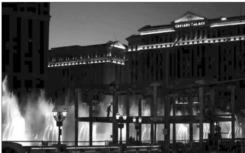
▲ Trabajadores construyen una tribuna frente a las fuentes de un hotel-casino, en Las Vegas.

El Gran Premio de la "Ciudad del juego" no tendrá lugar el domingo como es habitual, sino el