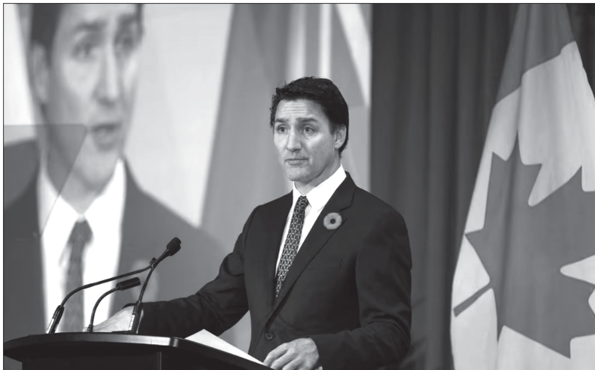
▲ “Many voters will rather stay at home rather than cast a vote for Trudeau come election day. And as we have learned from other campaigns in other jurisdictions, staying at home is a vote for the opposition”.

HOWEVER, THEY ARE also very tired of Trudeau. Apart from his successes are many scandals in-