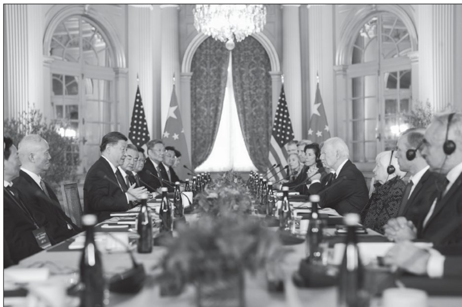
▲ "Esta es una relación compleja, competitiva, que podría fácilmente derivar en un conflicto o confrontación si no se maneja de forma adecuada", señaló Jake Sullivan, asesor de Seguridad Nacional de la Casa Blanca.

Un acercamiento entre Pekín y Washington po-