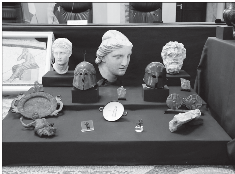
▲ El tráfico de bienes culturales es una actividad de bajo riesgo y alta rentabilidad para los malhechores asociados con la delincuencia organizada.

Los primeros 600 artículos que se exhibirán son obras de arte de la lista de Interpol, cuya base de datos acumula más de 52 mil piezas culturales robadas de museos, colec-