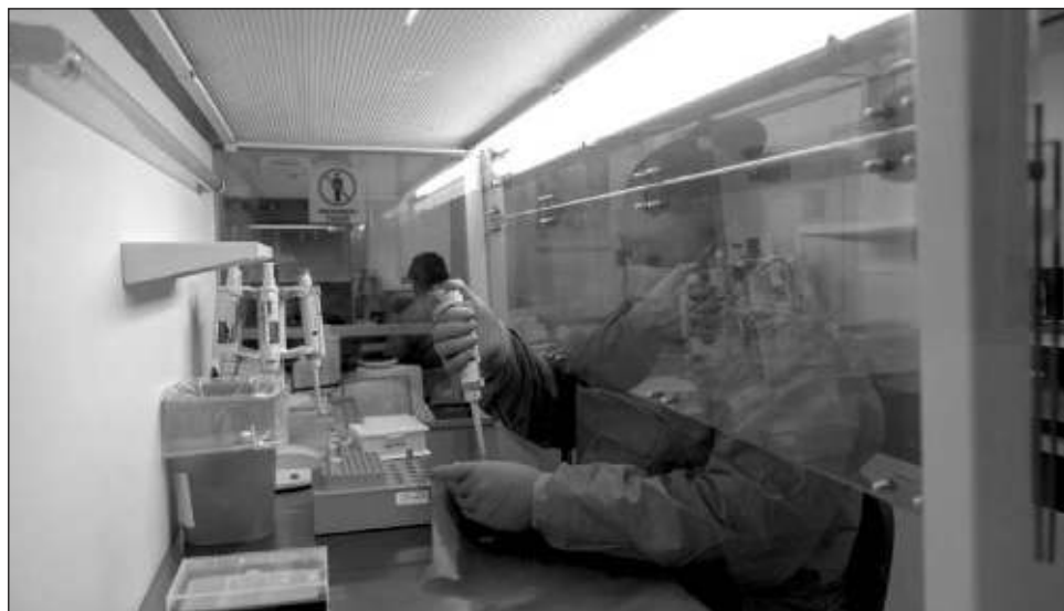
▲ Actualmente se trabaja el proceso de basificación con personal médico y de enfermería de hospitales y centros de salud de Chetumal, Playa del Carmen y Cancún.

En el marco de los trabajos que se realizan para la transferencia de los Servicios Estatales de Salud de Quintana Roo al modelo IMSS Bienestar inició esta primera fase de basificación del personal médico y para-