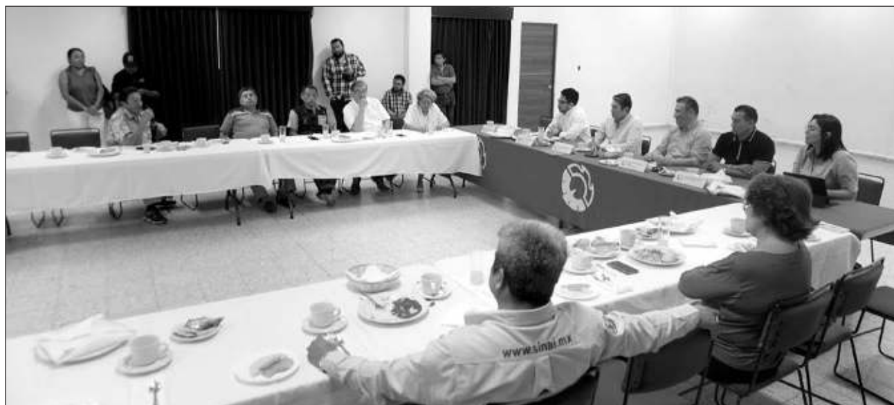
▲ Los empresarios señalaron que luego de la presión social, el ayuntamiento capitalino tuvo que hacer un acuerdo para cobrar mínimos con el fin de que comerciantes pudieran pagar impuestos y así actualizar las licencias de funcionamiento.

Específicamente, reclamaron la situación a principios de año sobre el incremento en diversos trámites tributarios, como la basura, agua, predial y protección civil, esto en el caso del ayuntamiento de Campeche, en el que por supuestos ajustes de ordenamiento federal, aumentaron los costos pues pasaron a Unidades de Medida y Actualización (UMA) para calcular algunos impuestos.